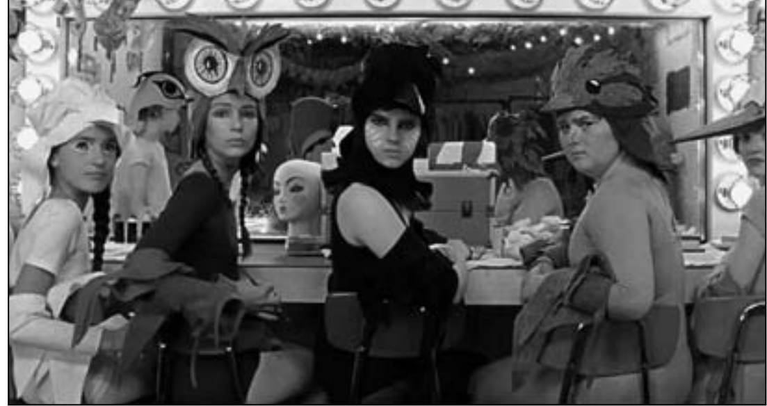
لقطة من فيلم «مون رايز كينجدم»