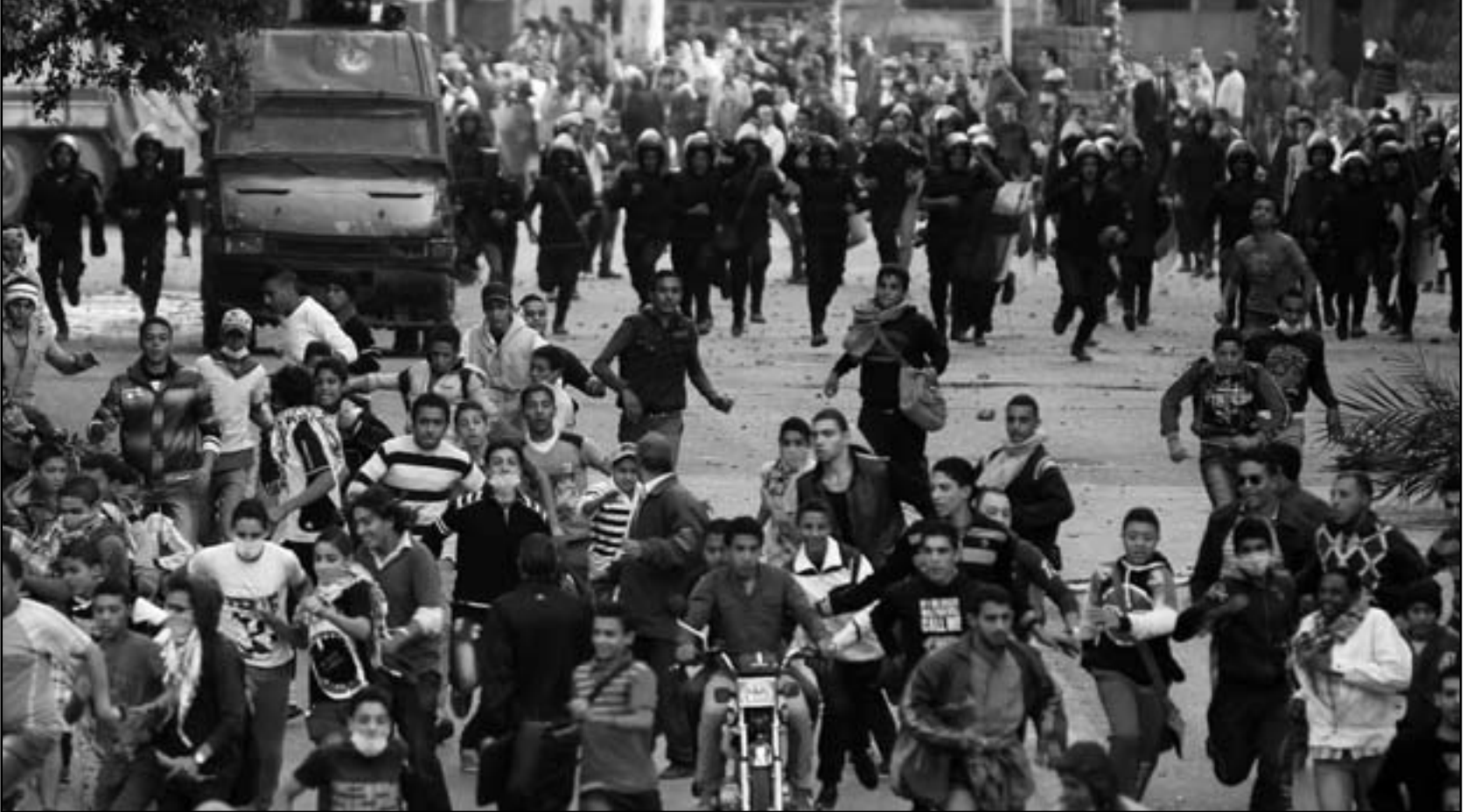
جانب من المواجهات بين المتظاهرين وقوات الامن في القاهرة أمس