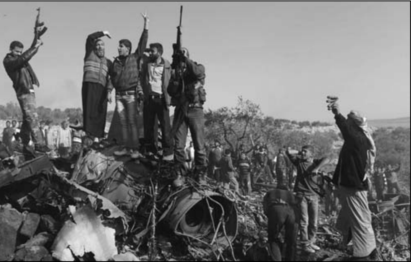
سوريون يحتفلون على حطام الطائرة العسكرية التي سقطت في ريف حلب

الاسبوع الى تركيا بهدف القيام بجولة تفقدية على المواقع التي قد تنتشر فيها بطاريات باتريوت المضادة للصواريخ التي طلبت الحكومة التركية نشرها قرب الحدود مع سورية.