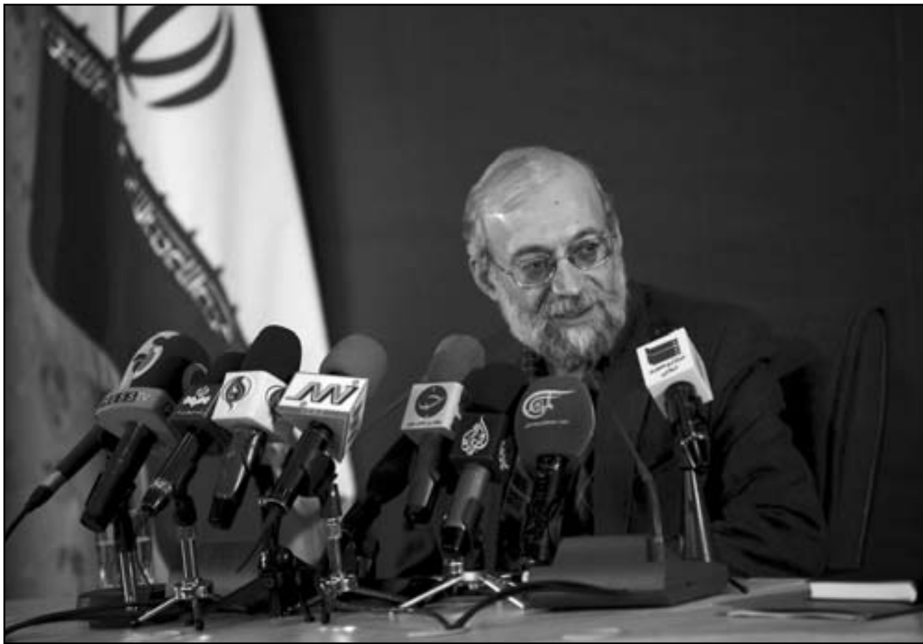
المسؤول عن حقوق الإنسان في طهران محمد لارجاني خلال مؤتمر صحفي

لاغراض سياسية ودينية، والعمالة القسرية وفرض قيود على حرية التعبير والتحرك. وقال القرار إن وضع الحقوق في كوريا الشمالية يتدهور بالرغم من تغيير النظام قبل عام. واتهم كوريا الشمالية بارتكاب انتهاكات تضمنت التعذيب والإعتقالات التعسفية واستخدام معسكرات الاعتقال وقوية الإعدام