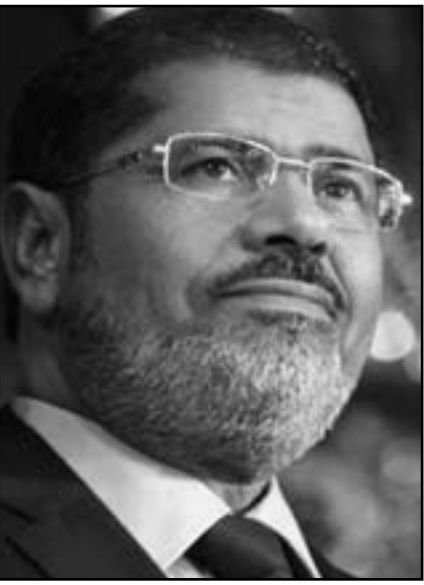
الرئيس المصري محمد مرسي

الصفقة مع مرسي، لكن الصفقة قد تكون مؤلمة، بناء على التجربة العراقية وأمثلة أخرى كثيرة تشير إلى أن أمريكا تفضل مصالحها على مبادئها الراقية، على حد تعبيره.