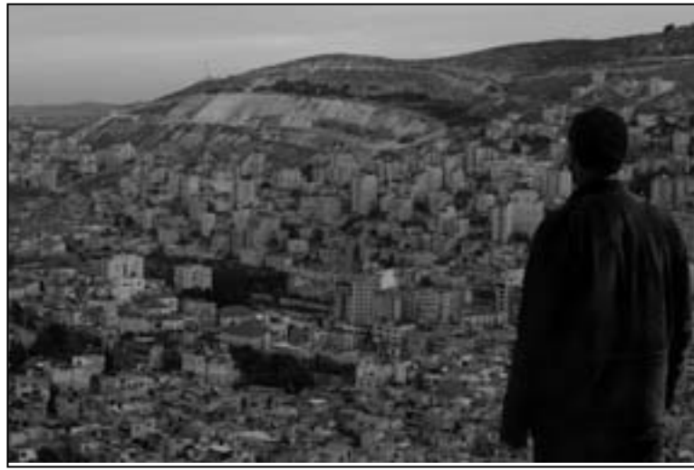
لقطة من فيلم «الصدمة»