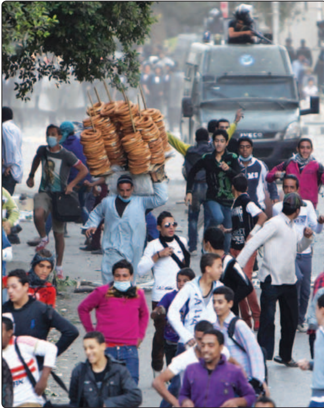
سيارة للشرطة تطلق قنابل الغاز المسيل للدموع على المتظاهرين قرب ميدان التحرير امس

بمختلف اطرافه، وقد تؤدي الى انقسام البلاد. وقالت وكالة انباء الشرق الاوسط الرسمية ان الجمعية التأسيسية «ستبدأ صباح الخميس التصويت على المسودة النهائية للدستور»، ونقلت عن رئيسها حسام الغرياني قوله ان «غدا سيكون يوما رائعا في تاريخ الجمعية». وبهذا التصعيد المتبادل يتواصل اختبار القوة الذي تشهده البلاد منذ اصدار الاعلان الدستوري الخميس الماضي بين الاسلاميين ومعارضيه الذين نظموا الثلاثاء في القاهرة والعديد من المحافظات تظاهرات حاشدة شارك فيها بضع مئات الالاف من المصريين.