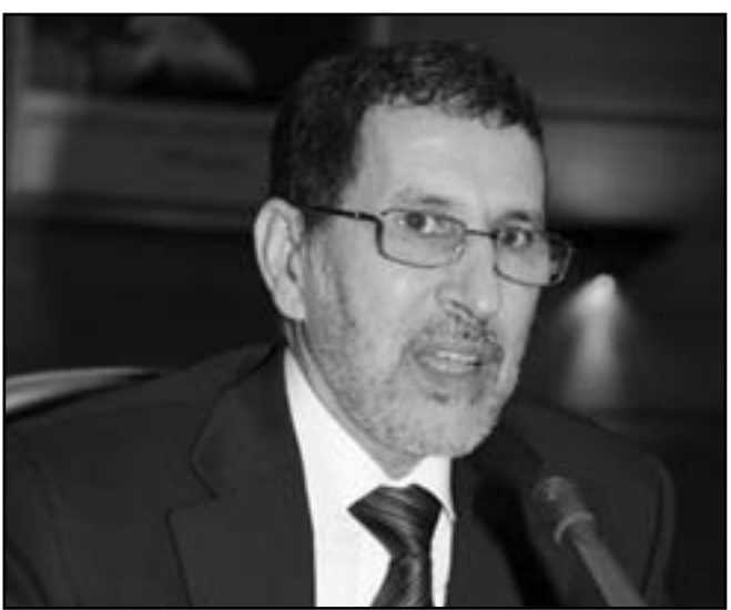
وزير الخارجية المغربي سعد الدين العثماني

ولم يصدر أي رد فعل عن الدبلوماسية المغربية التي تلتزم الصمت تجاه هذه الخطوة التي تعتبر الأولى من نوعها التي يقدم عليها برلمان دولة أوروبية.