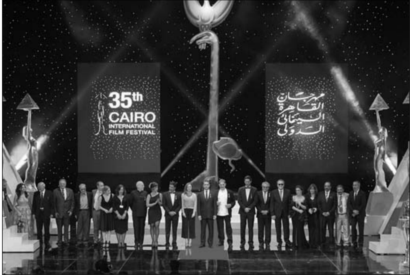
من حفل الافتتاح

الأزمة للتغطية، وحيث أن الغالبية العظمى من رواد المهرجان تعودوا على الطريقة التقليدية المتبعة طوال السنوات الماضية فلم يتعامل أحد مع النظام الجديد، فضلاً عن عجز فريق العمل بالمركز الإعلامي «الحديث» عن توفير الخدمة اللائقة، لذا فقد تراجع النظام المتطور في الوقت الضائع قبيل انطلاق الدورة بأيام قليلة وعادت الإدارة المختصة لنظامها القديم ففسر المهرجان جزءاً كبيراً من جمهوره وأضيف هذا العائق التنظيمي إلى حزمة العوائق الجوهريّة الأخرى المتمثلة في التوقيت السياسي غير