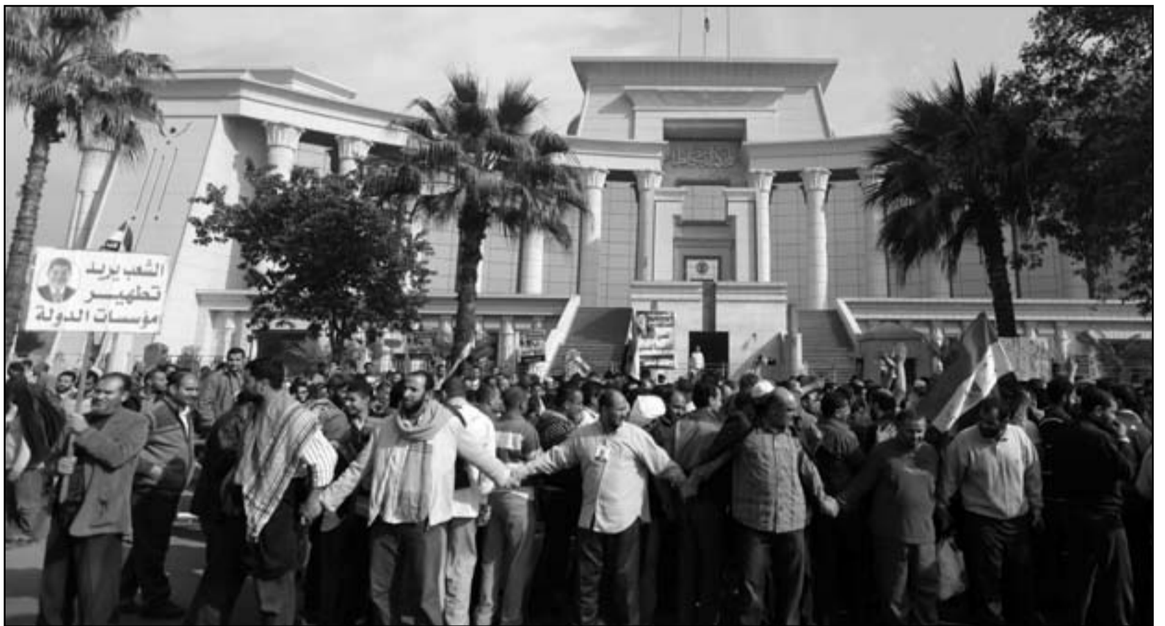
اللاف المتظاهرين المؤيدين للرئيس مرسى يحاصرون مقر المحكمة الدستورية في القاهرة امس

وفي وقت سابق قالت مصادر قضائية إن المحكمة أرجأت جلساتها لأجل لم تحده بسبب المحتجين الذين قالوا إنهم لن يسمحو بإصدار حكم يطال انتخاب مجلس الشورى.