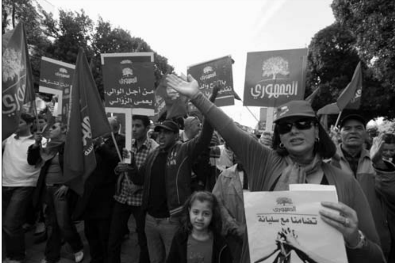
تونس: يتظاهرون تضامنا مع مدينة سليانة

■ تونس - وكالات: حذر الاتحاد العام التونسي للشغل (أكبر مركزية نقابية في تونس) السبت «مسؤولين سياسيين من الفريق الحاكم» في تونس من «التداول» على الاتحاد، على خلفية مساندته لاحتجاجات سكان ولاية سليانة (شمال غرب) الذين يطالبون بعزل الوالي المسبب عن حركة النهضة الإسلامية الحاكمة وبالتمنية الاقتصادية والإفراج عن معتقلين.