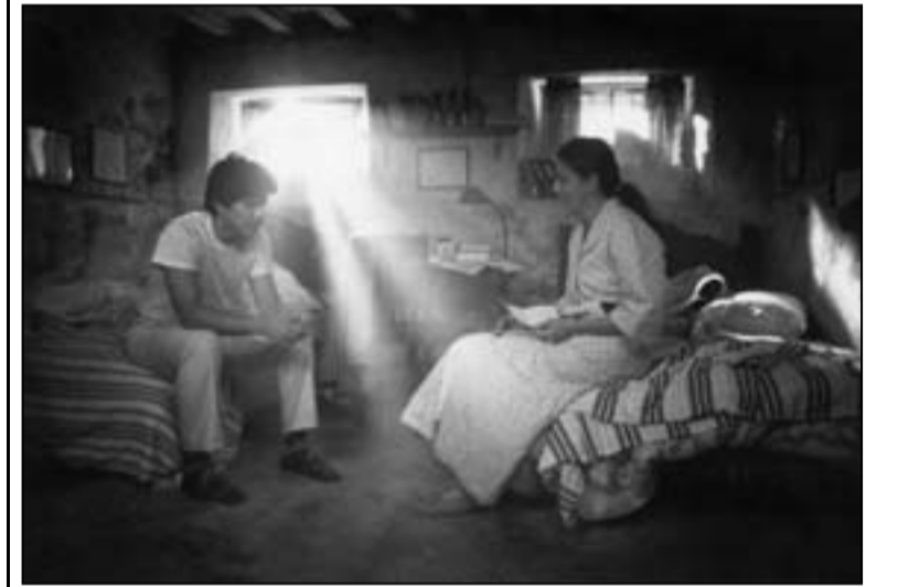
لقطة من فيلم «لثة نور»

وتفتتح صداقة سبابة من زهور بين «سيانغ» و«جي» وترتد كصخرة عذبة حصة الذوق في كل تفاصيل الفيلم ووقع أحداثه، وتضع «جي» يدها على مجموعة من أشرطة كاسيت كان «سيانغ» استخدمها لتسجيل الأصوات منذ الطفولة ما يرفع من عزيمتها ويتركز إلهامها قبل الامتثال أمام اختبار رقص هام، من جانبها، تنقو