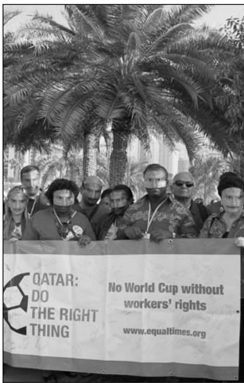
مظاهرون في الدوحة وراء بافطة كتب عليها: «قطر... اعلمي الشيء الصحيح.. لامباريات كأس العالم دون حقوق العمال»

على السوق الأميركية لما تملكه من استثمارات واحتياطيات في السندات والعملية الأميركية تزيد على تريليوني دولار. وأشار إلى أن «مسألة معالجة العجز الأميركي سيحدث عاجلاً أم آجلاً، وكل المستثمرين الدوليين شرعوا في التحوط من هذا المخاض الصعب»، موضحاً أن الصين عملت أخيراً على خفض محفظتها من السندات الأميركية بواقع 29%، وطرحته اليونان كعملة تداول في مناطق خارج الصين. وشرح المرشد ماهية «الهاوية المالية» التي قال إنها «خضف تلقائي نقصات الدولة للسنة المالية 2013 التي بدأت في الأول من تشرين الأول/أكتوبر بمقدار 109 مليارات دولار، وفي المقابل، زيادة تلقائية في الضرائب على جميع شرائح المواطنين بواقع 20%، ما سيستدعي في تعققات إضافية بقيمة ثلثي دولار في السنة ذاتها إلى 9.1% مقارنة بـ7.9% في تشرين الثاني/نوفمبر».