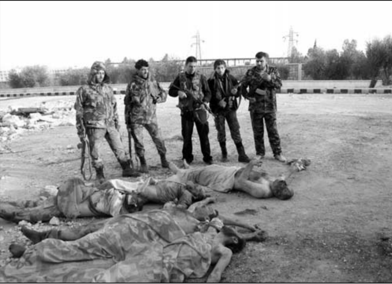
عنصر من الجيش السوري النظامي يقفون بالقرب من جثث معارضين قتلوا بالقصف على حلب

الحقه التفجير بالمكان. ويظهر في احد هذه الاشرطة دمار كبير جزئيا جثة امرأة، بينما تشتعل بالقرب منها سيارتان تلقان على طرفي الشارع. وفي ختام الشريط ينادي احد الاشخاص «شيلوا (ارفعوا) الجثث معنا يا شباب»، بينما يحاول اإقناض لزالة جثة غطاها الركام في شكل شبه كامل. وفي شريط آخر تظهر سيارة محترقة وشبه مدمرة وقد انقلبت رأسا على عقب الى جانب رصيف شارع يملاء الحطام. ويتنقل الصوور وسط جمع من الشبان الذين يعاينون الاضرار، حيث تبدو اوجه مبنى ملاصق للرصيف، وقد اصابها دمار كبير واحترقت اجزاء واسعة منها. وتأتي هذه الاحداث غدا يوم دام سقط فيه 182 شخصا بحسب المرصد السوري لحقوق الانسان، بينهم 60 شخصا تصفهم من المدنيين في دمشق وريفها، حيث تدور معارك في الاعنف في النزاع المستمر منذ 20 شهرا، وعلوات للمرة الاولى محيط مطار دمشق الدولي منتصف ليل الخميس الجمعة، بحسب ما افاد ناشطون.