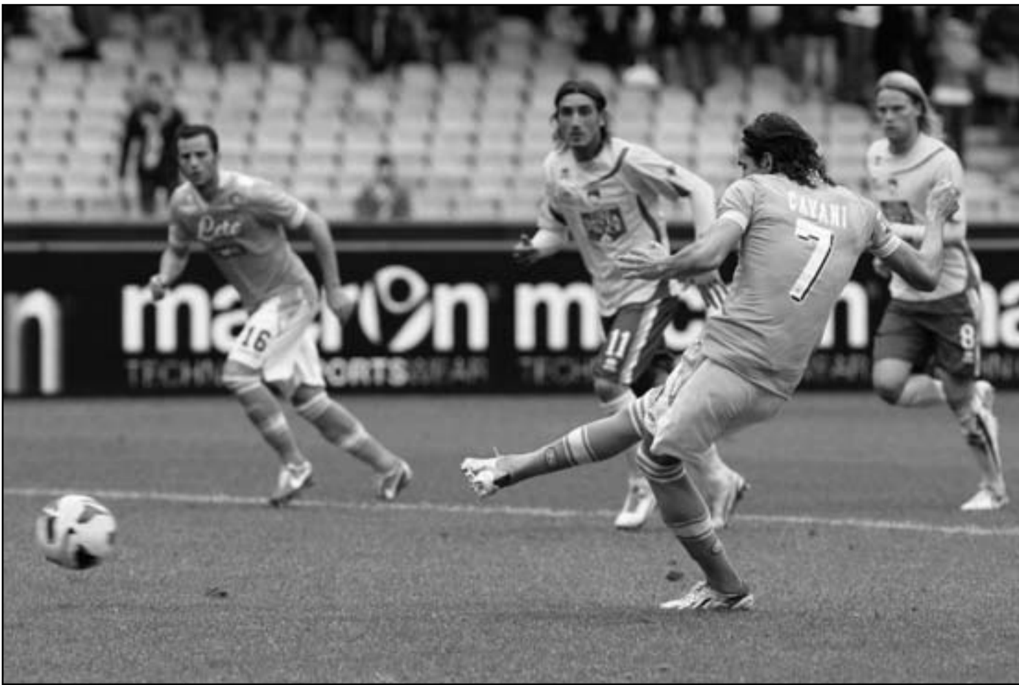
اديسون كافاني نجم نابولي يسدد هدفا في مرمرى بيسكارا من ضربة جزاء