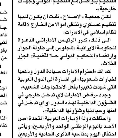
الشيخ خليفة بن زايد آل نهيان

واحتفلت دولة الإمارات العربية المتحدة امس احتفال اليوم بمناسبة الذكرى الحادية والاربعين لاجتماع قيام دولة الإمارات العربية المتحدة عام 1971 بعد انتهاء الحماية البريطانية عن الإمارات السبع والتوقيع على معاهدة صداقة بين هذه الإمارات والحكومة البريطانية، واجتمع في هذا اليوم حكام الإمارات وقاموا بتوقيع الدستور المؤقت لإيجاد الإمارات العربية ما بعد امة رأس الخيمة حيث طلب لاحقا الانضمام إلى الاتحاد في شباط/فبراير من عام 1972.