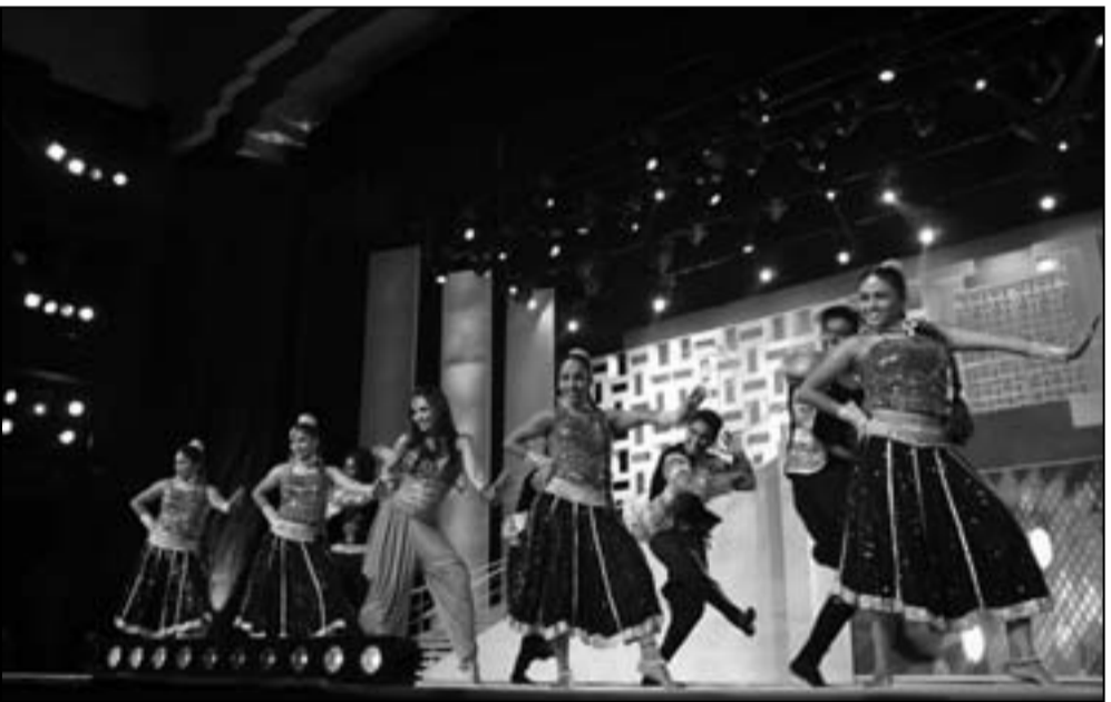
من حفل الافتتاح

■ لقد بدأ معرض الاهوار بفترة زمنية قياسية معرض اخر حمل قضية اخرى لا تقل اهمية عن النهرين اضافة جديدة بعد سياسي لقضية البيئة ؟