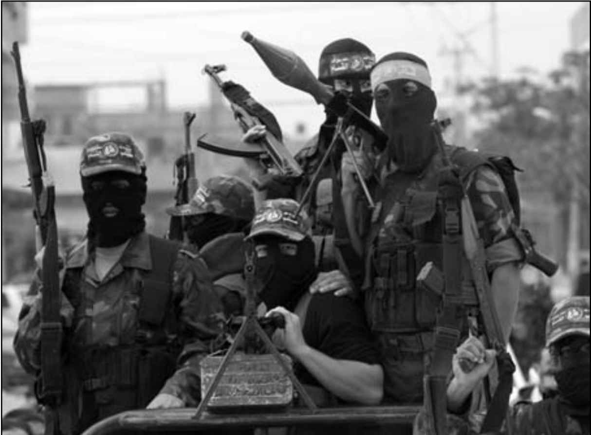
حماس تستيطر على الضفة في حال اجراء انتخابات

بخروج الجيش الاسرائيلي من يهودا والسامرة، وسيكون من الصعب على حكم ابو مازن ورجاله.