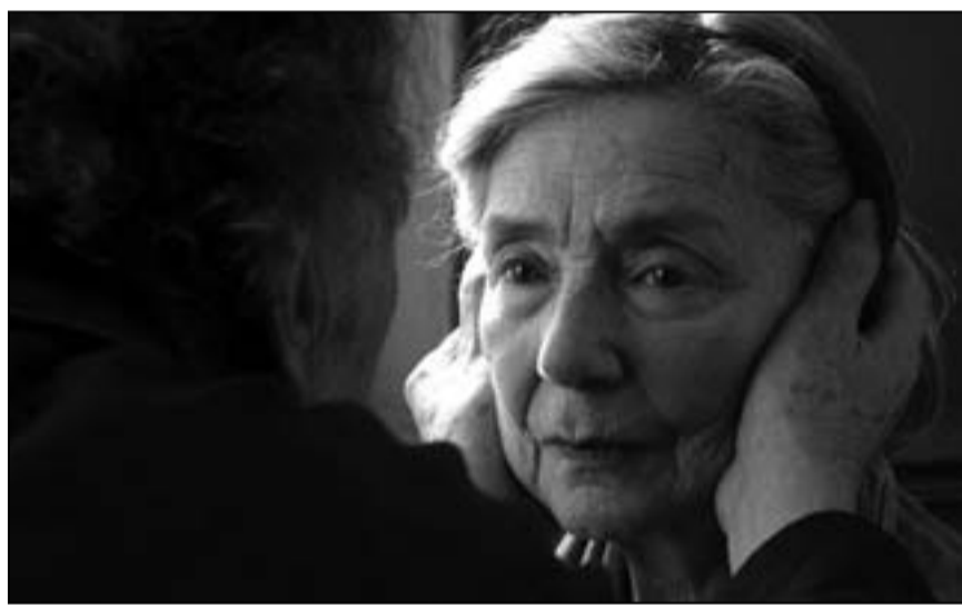
لقطة من فيلم «حب»