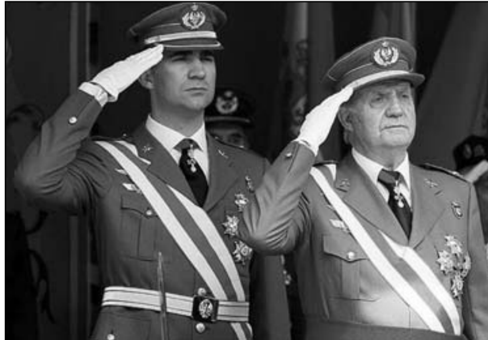
الملك خوان كارلوس باللباس العسكري وعلى يساره ولي العهد الأمير فيليبي

في البرلمان الأوروبي قد وجهوا رسالة إلى المفوضية الأوروبية لمنع أي تدخل عسكري مستقبلا في حالة قرار كتالونيا الانفصال عبر استفتاء تقرير المصير.