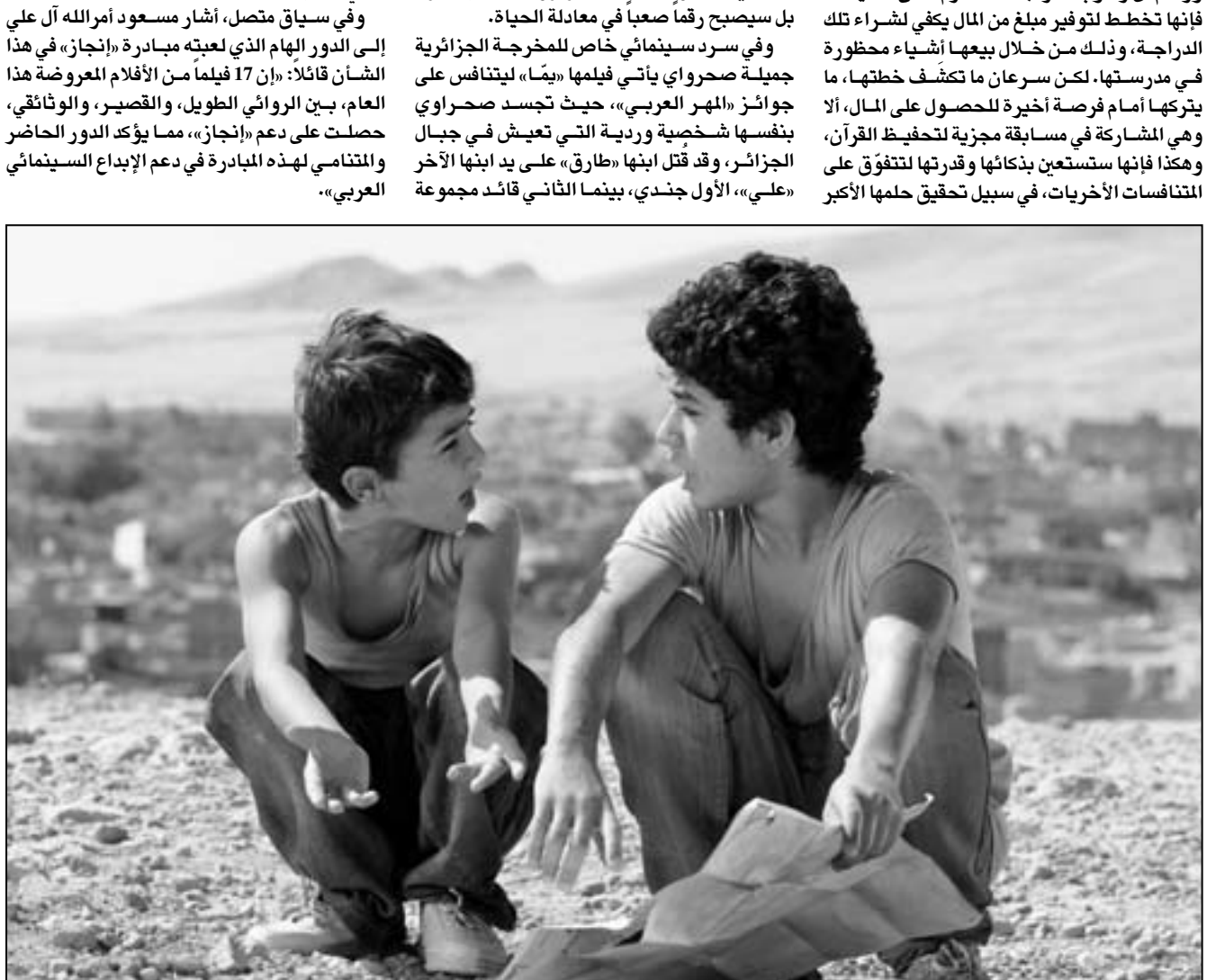
لقطة من فيلم «خويا»

أما فيلم الافتتاح الثاني، «وجدة» للمخرجة السعودية هيلاء المنصور، فقد حقق نجاحات كبيرة أثناء عرضه في الدورة الأخيرة من مهرجان فينيسيا السينمائي، إذ يتناول الفيلم واقع المرأة السعودية من خلال الفكرة «وجدة» التي تصادف يومياً دراجة خضراء معروضة في متجر ألعاب، ورغم أن ركوب الدراجات محرم على الفتيات، فإنها تخطط لتوفير مبلغ من المال يكفي لشراء تلك الدراجة، وذلك من خلال بيعها أشياء معظورة في مدرستها. لكن سرعان ما تكشف خطتها، ما يتركها أمام فرصة أخيرة للحصول على المال، إلا وهي المشاركة في مسابقة مجزية لتحفيظ القرآن، وهكذا فإنها تستعين بذكائها وقدرتها لتتفوق على المتنافسات الأخريات، في سبيل تحقيق حلمها الأكبر