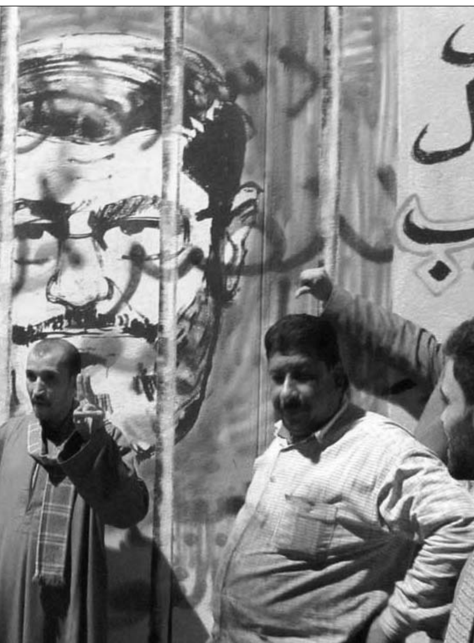
معارضون لمرسي امام رسم له يظهر وراء القضبان

القاهرة - يو بي بي: أعلنت جماعة تطلق على نفسها اسم «مستقلون من أجل البناء» أنها ستحمل السلاح في وجه أي إرهابي يعتدي على الثوار، مطالبة بإعتقال الرئيس المصري محمد مرسي ومحاكمته بتهمة الخيانة العظمى. وقالت الجماعة، في بيان أصدرته عبر شبكة الإنترنت ومواقع التواصل الاجتماعي «ستحمل السلاح في وجه أي إرهابي يعتدي على الثوار، بعد الاعتداء الغاشم على المعتصمين العزل في محيط قصر الاتحادية. واستطردت «ستحمل السلاح في وجه أي كائن يحاول