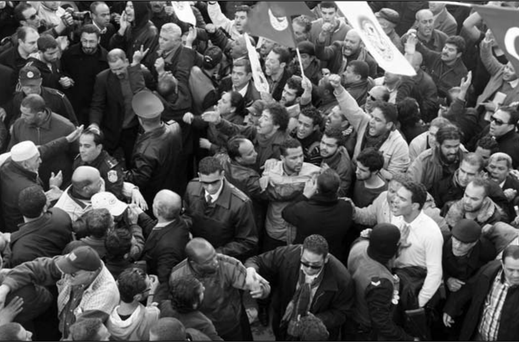
الشرطة التونسية تحاول أن تفريق بين المتظاهرين بعد الاعتداءات الأخيرة من الإسلاميين على بعض أعضاء الإتحاد العام التونسي للشغل

ذلك على السياسة الأمنية، وعلى ذلك على تونس مع وكالة «فرونكس» تعاون تونس مع وكالة «فرونكس» في مراقبة الحدود والسيطرة على حقوق المهاجرين.