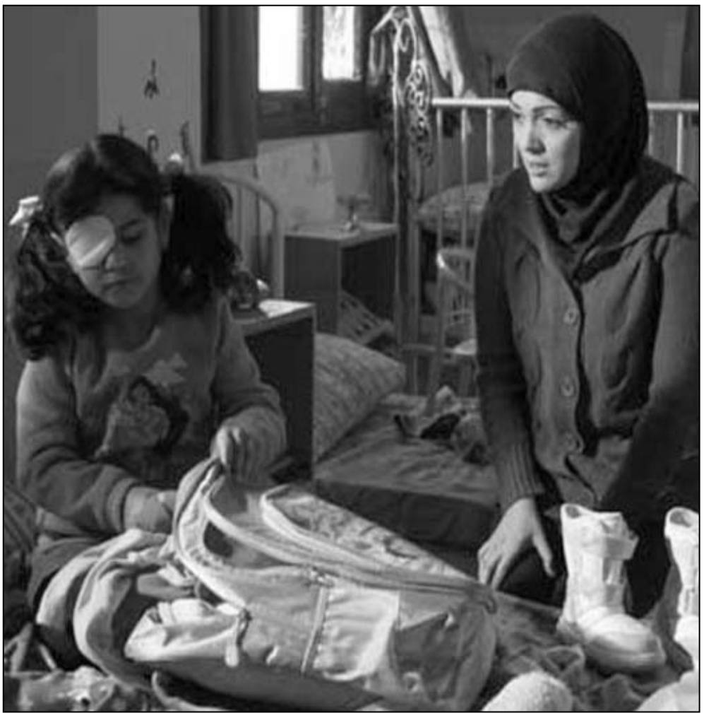
لقطة من فيلم «طريق النجاة»

يذكر أن مهرجان الفيلم العربي في روتردام يعد اليوم النشاط الفني والثقافي العربي الأروع في القارة الأوروبية، وقد أعلن مؤسسه ورئيسه الدكتور خالد شوكات خلال حفل افتتاح الدورة الثانية عشرة عن استقالته ومغادرته لوقعه ك مسؤول أول من المهرجان، ليترك مكانه لجيل جديد شاب من المثمنين.