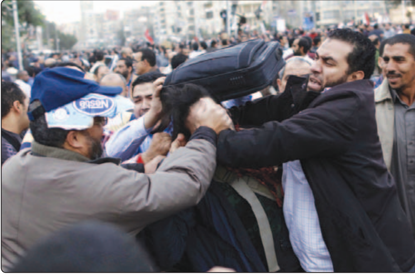
جانب من الصدامات بين انصار الرئيس مرسي ومعارضيه امام قصر الرئاسة بالقاهرة