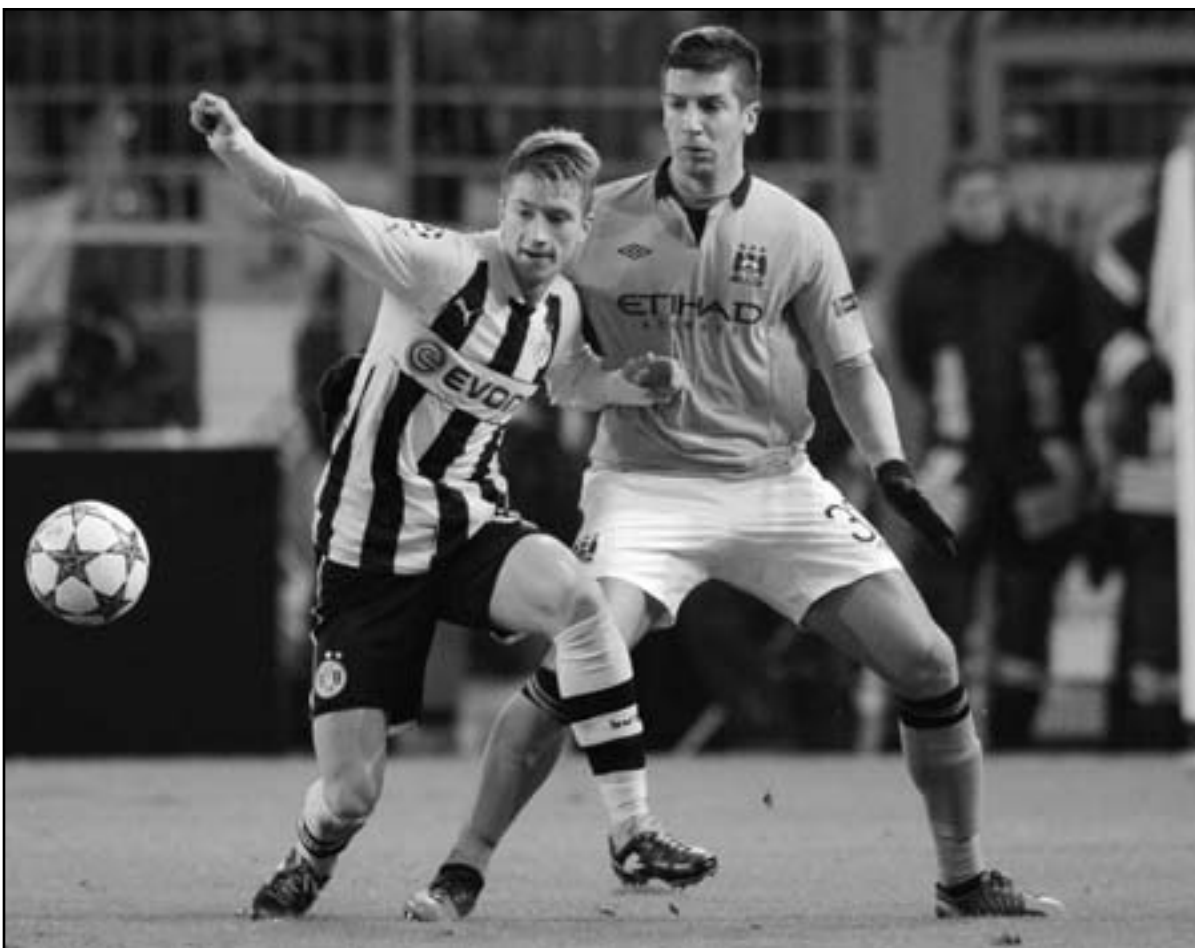
ماركو ريوس نجم دورتموند (يسار) وماتيجنا ناستاسي نجم مانشستر سيتي في منافسة على الكرة

■ دورتموند (ألمانيا) - د ب أ: وجه بوروسيا دورتموند الألماني صفعه جديدة إلى صيفه مانشستر سيتي الإنجليزي وحرمه من حفظ ماء الوجه حيث تغلب عليه 1/صفر في الجولة السادسة الأخيرة من مباريات المجموعة الرابعة بالدور الأول لدوري أبطال أوروبا.