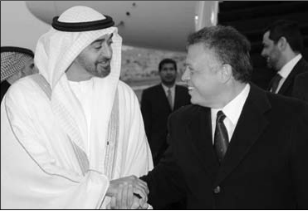
العامل الاردني الملك عبد الله الثاني لدى استقباله ولي عهد ابوظبي الشيخ محمد بن زايد لنيهان

ويتوقع أن تصدر مناقشات للقصر الملكي تطالب بالبحث عن صيغة تؤدي الى تأجيل الانتخابات خصوصاً في ظل اجماع شخصيات رسمية ووزارية سابقة من بينها سمير الحياشنة وعباد الله ابو رمان وغيرهما على توفير ارضية للخشية من أن تؤدي الانتخابات بدون توافق وطني وفي ظل المقاطعة للمزيد من التازيم وهي خضيفة لا بد من تجاهل اسقاطها من الحسابات وفقاً للقيادات في الحركة الاسلامية الدكتور نبيل الكوفي.