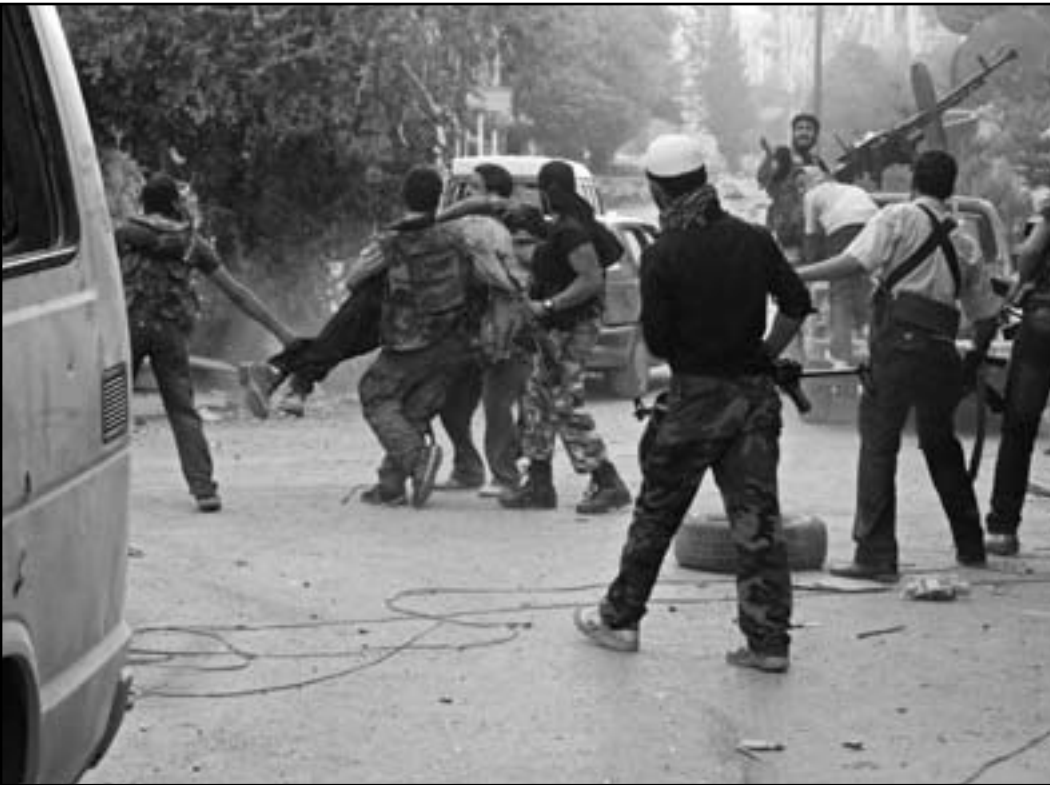
الغرب يخشى من سيطرة المتمردين على السلاح الكيماوي

تملك كما يبدو مخزونا من السلاح البيولوجي يشتمل على مواد سامة ومواد تحدث امراضا تلوثية وربما أوبئة، وكذلك يوجد احتمال معقول لأن