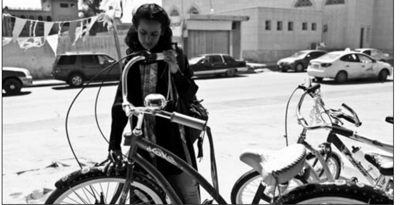
لقطة من فيلم «وجدة»