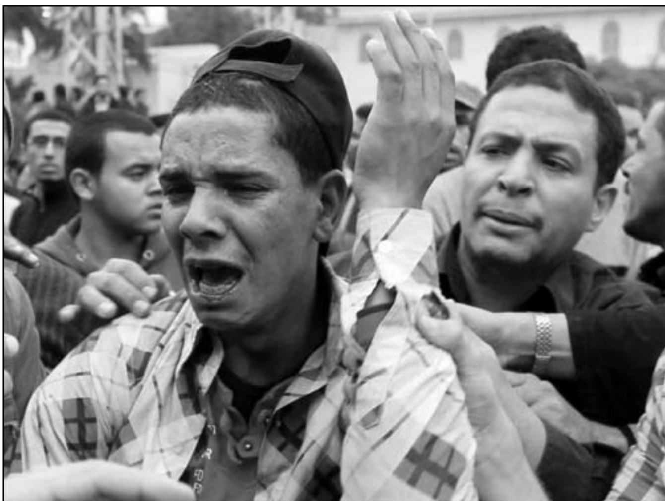
عناصر من جماعة «الاخوان» يهاجمون مخيمات المعتصمين امام مقر الرئاسة الى اليسار احد ضحايا المواجهات (رويترز)