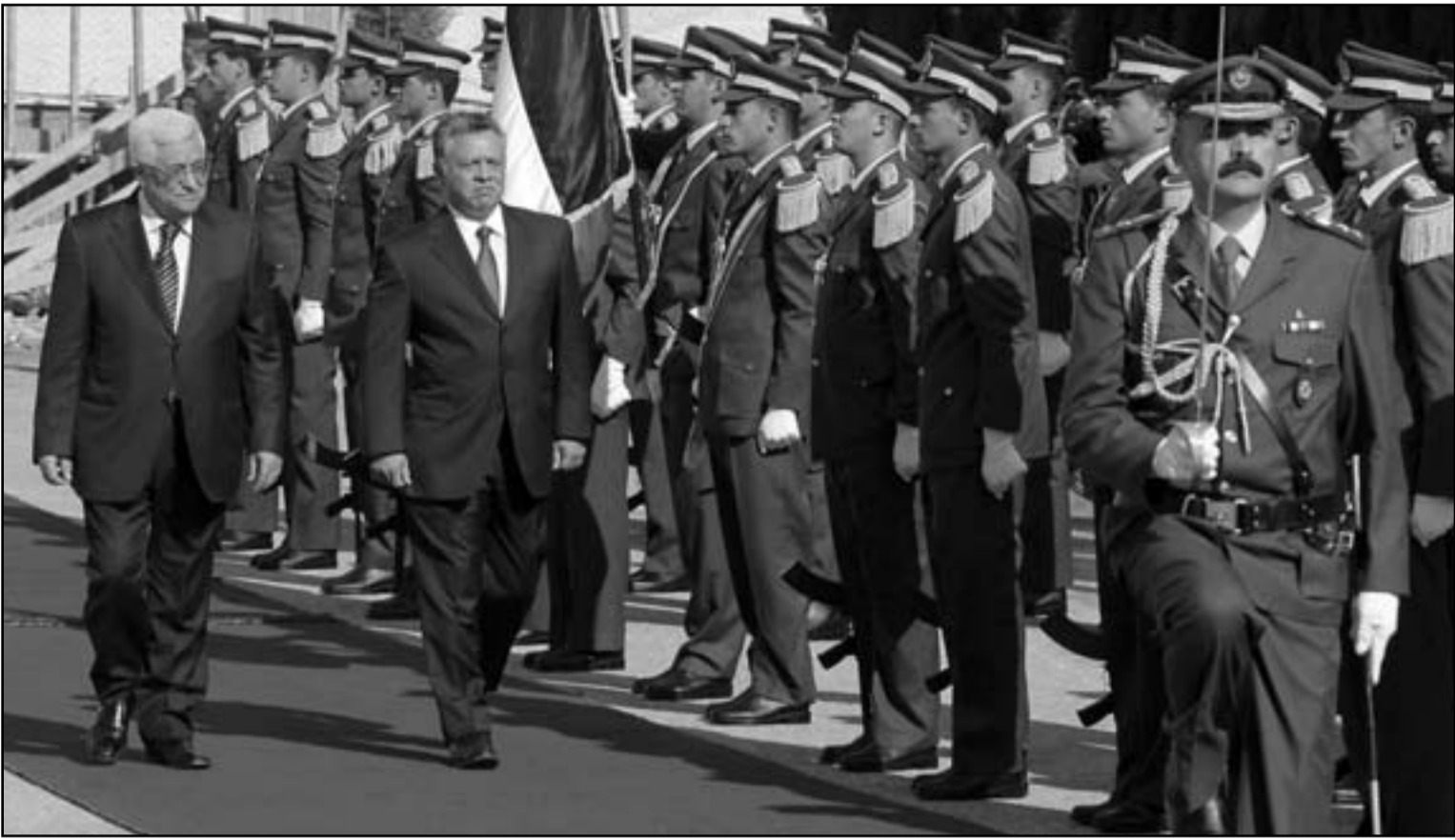
الرئيس الفلسطيني محمود عباس والعهال الاردني عبد الله الثاني خلال استعراض حرس الشرف الوطني في رام الله

وكانت بداية المفاوضات المباشرة مع اسرائيل عقب انتهاء انتخاباتها المرتقبة نهاية الشهر المقبل وتولي الادارة الامريكى الجديدة لها مهامها في كانون الثاني (يناير) المقبل. واوضحت مصادر فلسطينية بان عبد الله الثاني شدد على اهمية استئناف المفاوضات الفلسطينية - الاسرائيلية على اساس ما توصلت اليه في آخر لقاءات عقدت بين الطرفين، وذلك في اشارة الى المفاوضات الاستكشافية التي رعتها عمان بين الجانبين العام الماضي وانتهت مطلع العام الجاري دون تحقيق نتائج ملموسة.