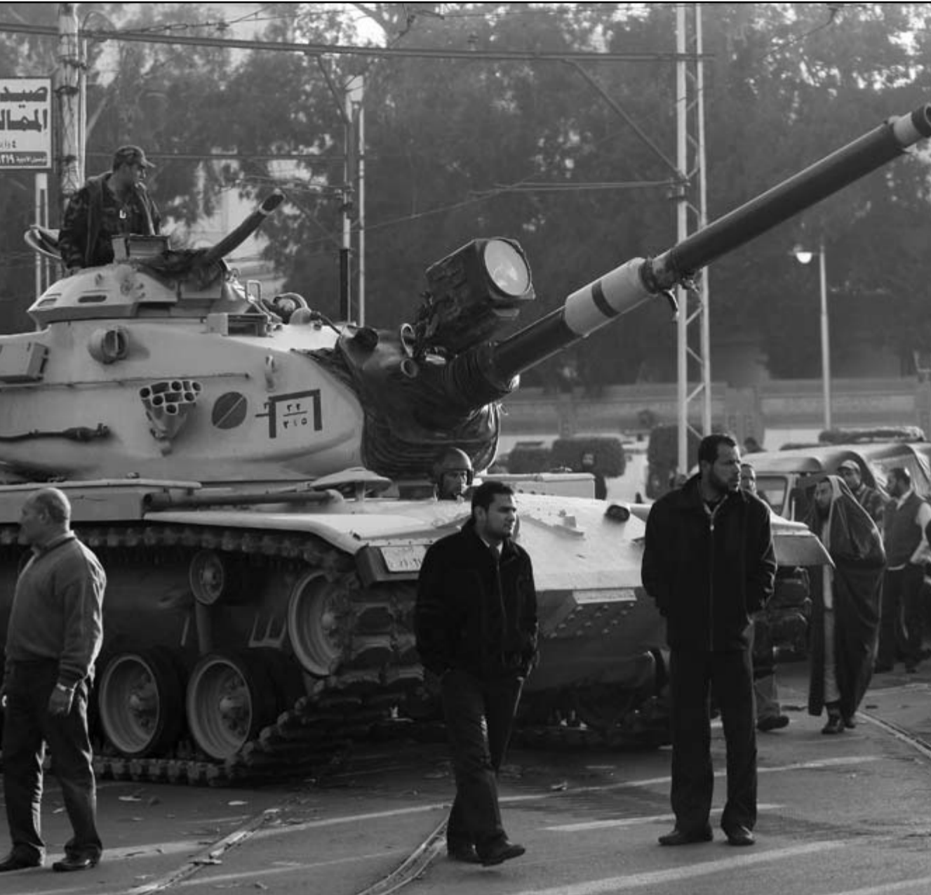
جانب من المواجهات أمام قصر الاتحادية ليلة أمس... والى اليسار إحدى دبابات الحرس الجمهوري