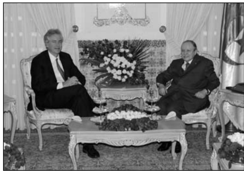
الرئيس الجزائري عبد العزيز بوتفليقة خلال لقائه مساعد وزيرة الخارجية الامريكية وليام بيرنز خلال زيارة للجزائر

المالي. وشدد على أن «الرد الدولي يجب ان يكون متعدد الاشكال ومعدا بشكل جيد، لمواجهة هذه الأزمة، التي تلك اجري الوزير الجزائري المكلف بالشؤون المغاربية والإفريقية، عبد القادر مساهل، امس الخميس، مباحثات مع المبعوث الخاص للرئيس، الوزراء البريطاني الى منطقة الساحل، ستيفن أوبراين.