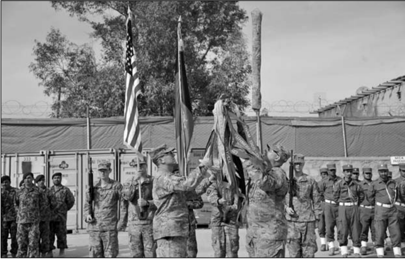
مراسم تسليم القيادة من قوات الناتو الى القوات الافغانية في جلال اباد

بيقوا ولا مكان تواجههم إلى أن يحدد عدد الجنود الباقين بعد العام 2014، وقال مسؤولون أنه بحسب الخطط الأولية فإن القوة التي ستخلف قوة المساعدة الدولية في أفغانستان