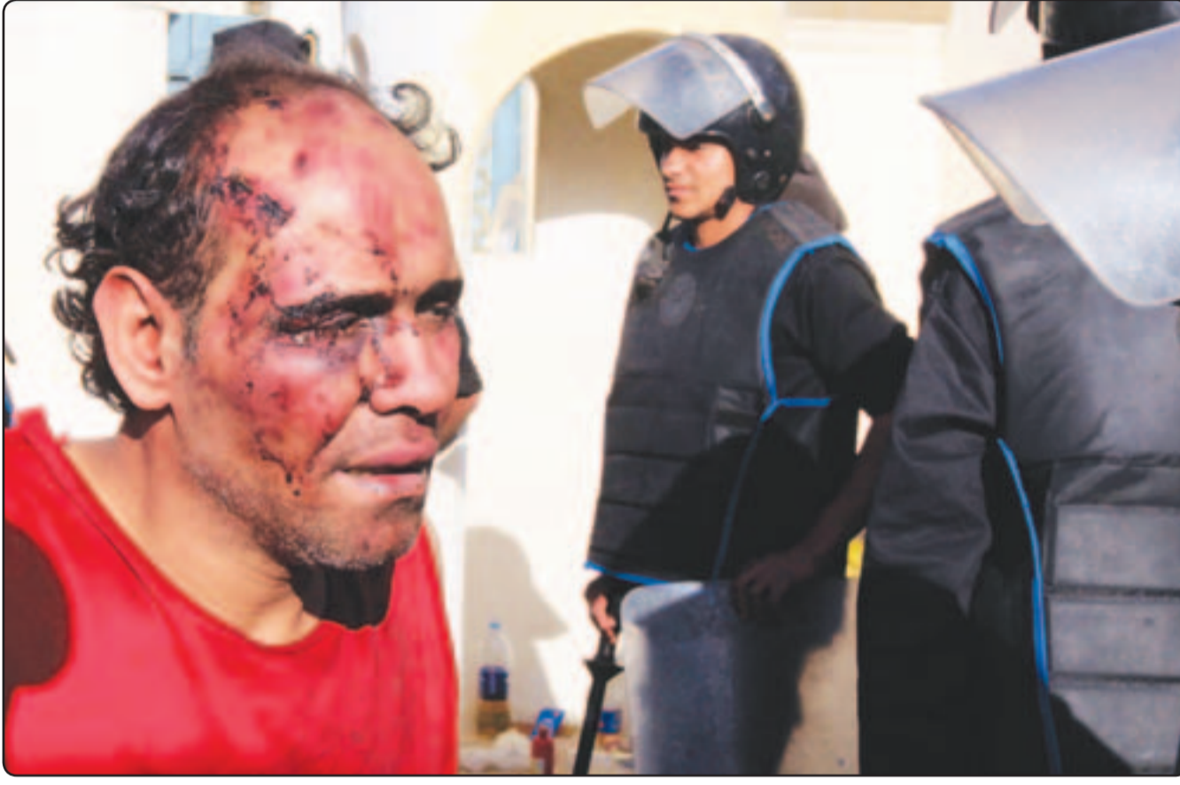
أحد المصابين بالاشتباكات بين مؤيدي مرسي ومعارضيه في القاهرة أمس

وتقدم مئات من المتظاهرين، مساء الخميس، حازما من الاسلاك الشائكة بالقرب من مقر رئاسة الجمهورية المصرية شمالي القاهرة. وسحق حجاز من الاسلاك الشائكة بشعار المرعي القريب من قصر الاتحادية (مقر رئاسة الجمهورية المصرية) بضاحية مصر الجديدة شمالي القاهرة، بفعل تزامم وتدافع مئات المتظاهرين المعارضين للرئيس المصري محمد مرسي أمام الحازم. وردت المظاهرات متفاوتة «صحي» با مرسي صعد النوم، وكرة عيجون آخر يوم، و«الشعب يريد إسقاط النظام» (تفاصيل ص 3)