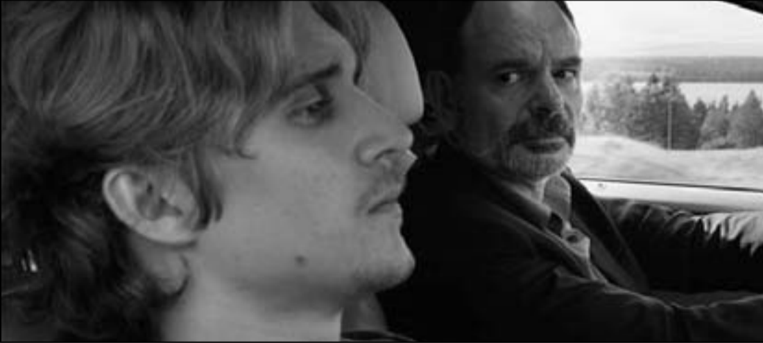
لقطة من فيلم «موعد في كيرونا»

القاهرة (د ب أ) - أعلن عزت أبو عوف رئيس مهرجان القاهرة السينمائي الدولي فوز الفيلم الفرنسي «موعد في كيرونا» بإخراج أنا توفيون بجائزة الهرم الذهبي أكبر جوائز المهرجان في المسابقة الدولية للأفلام الروائية الطويلة. وكشف أبو عوف، في مؤتمر صحفي اليوم الخميس في المسرح الكبير مساء الأوبرا المصرية، عن جوائز الدورة رقم 35 للمهرجان الذي تقرب من عامه الخمسين الذي ساهم في إخراج أن ماري جاسر. له مساء اليوم الخميس نظرا لاحتدام الخلاف السياسي في البلاد، وقاز الفيلم الإيطالي «رجل الصناعة» إخراج جوليانو موندانو بجائزة الهرم الفضي في المسابقة الدولية بينما منحت جائزة أفضل ممثل للوندي ماريانو دازكي بل فيلم «موسم السنة الخامسة» إخراج جرجيز دومارانديكي ومنحت جائزة أفضل ممثلة لباتينسا دي غوارو بطة الفيلم الفنزويلي «كاسر الصمت» إخراج لويس الخاندرو وأندرس دوارود وودريجز التي نال أيضا جائزة «شادي عبد السلام» لأفضل فيلم أول وجائزة لجنة الاتحاد الدولي للنقاد «فيبريس» وفي مسابقة الأفلام العربية نضبت الجائزة الذهبية للفيلم المغربي «المغضوب عليهم» إخراج محسن بصري وحاز الممثل الكويتي سعد