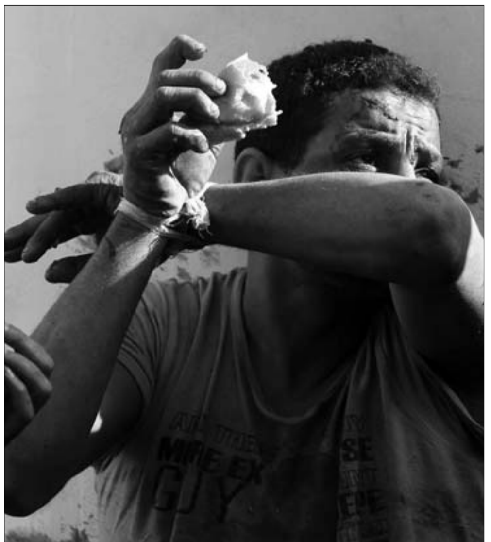
أحد المتظاهرين بعد أن قبض عليه عناصر من «الخوان»

واحتسبت الجماعة في ختام بيانها خمسة قتلى وصدقتهم بأنهم خيرة شبابهم وأنهم شهداء عند الله اغتالهم يد الغدر والبلطجة والإرهاب قاتلة: «نعزي أنفسنا وأهالي شهدائنا المؤامرة تتمثل في محاولة اقتحام القصر الرئاسي واحتلاله ونهزم يرزقون، كما ندعو للمصابين بالشفاء العاجل والعافية التامة».