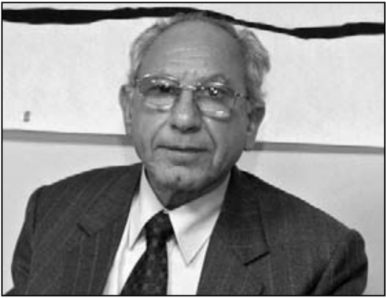
المعارض السوري رياض الترك

لم ندخل في حرب اهلية ولكننا ندفع اليها دفعاً، وباعتقادي ان نعي ان خدمة اهداف النظام، وهي جميع المواطنين عربا واكرادا من اسر النظام، وسوف تلبى المطالب السورية لاجلوة الاكراد ضمن وحدة سورية أرضاً ونفساً. وقدم طوره من الزلوقا في هياوي الطائفية، ان تكون غايية في البيضة والحذر من عيوننا في عطبات الطائفية، مهما قسا النظام وتكثر بالوطنيين، ومهما خرج الناس العاديون عن طوره من الزلوقا في هياوي الطائفية، لذلك ليس علينا سوى التفاوض والتعاون تجاه الفئات الأخرى التي لم تتخرط بعد، ولما اعتقد ان النظام سينجح في مصادرة الطائفة العلوية، وهي مستحقة عن النظام لأن مصالحها الأساسية هي في العيش بسلام مع باقي الطوائف، وخاصة بعد سلوك السلطة المتوحش. ويسير الغفلة عن أبناء الطائفة، لإيجاد مخرج من شأنها ان تمنح النظام من مصادرة طائفتهم.