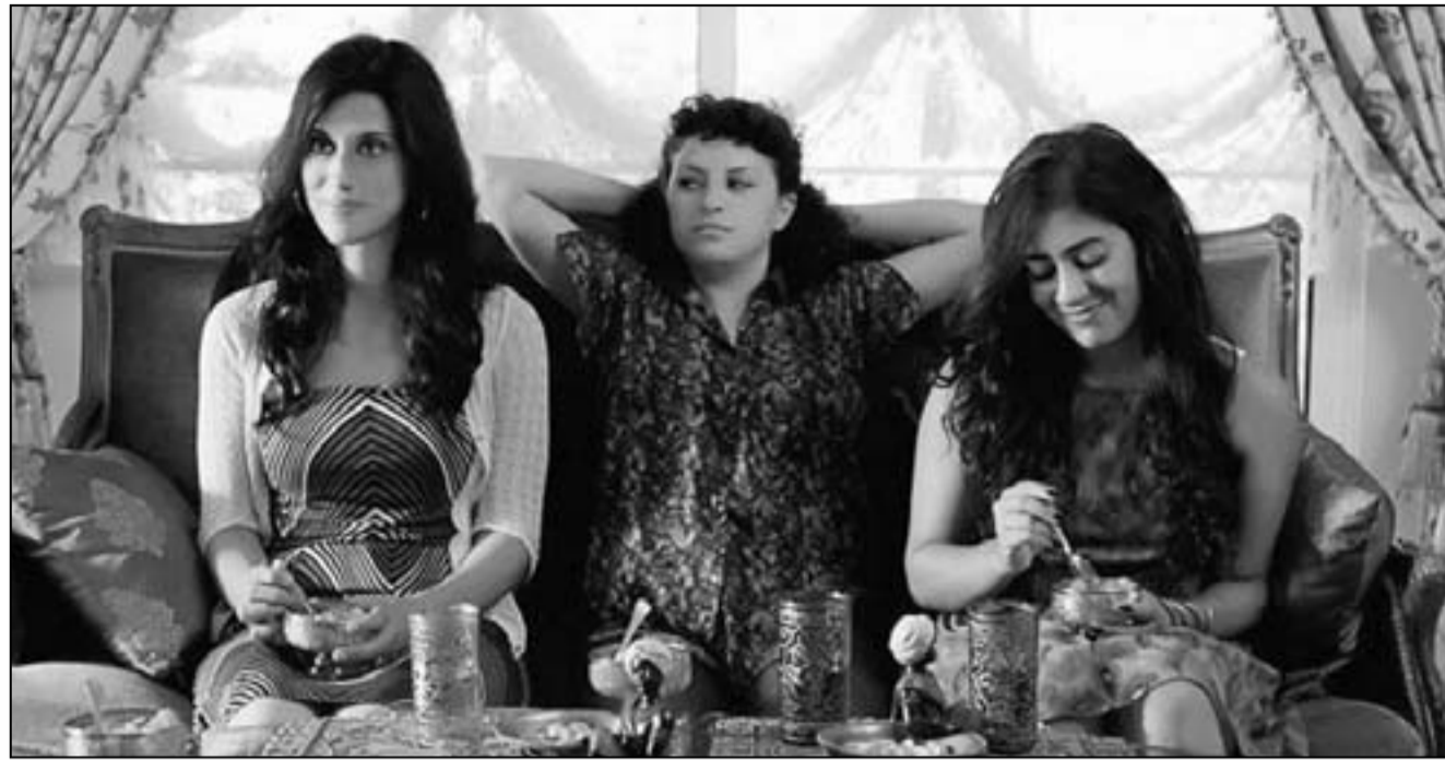
لقطة من فيلم «ماي في الصيف»

ويتنافس 14 فيلماً في مسابقة الأفلام الطويلة على «الوهر الذهبي» هي الجزائر بفيلمين «عطور الجزائر» لرشيد بن حاج و«بما» لجميلة صحراوي، مصر بفيلمين هما «الشتوق» لخالد الحجر و«الخروج إلى النهار» لهالة لطفي والفنان البيروني مهران قرطاج، لبنان بفيلمين هما «ثورة ماسي» لجو بويع و«33 يوما» لجمال شورجي، تونس بفيلم «الأستاذ» لمحمد بن محمود، الأردن بفيلم «الجمعة الأخيرة»، المغرب بفيلم «الوتر الخامس» لسلمى براقش، سوريا بفيلمين هما «الشراع والعاصفة» لغسان شميظ و«صديقي الأخير» لجود سعيد، الكويت بفيلم