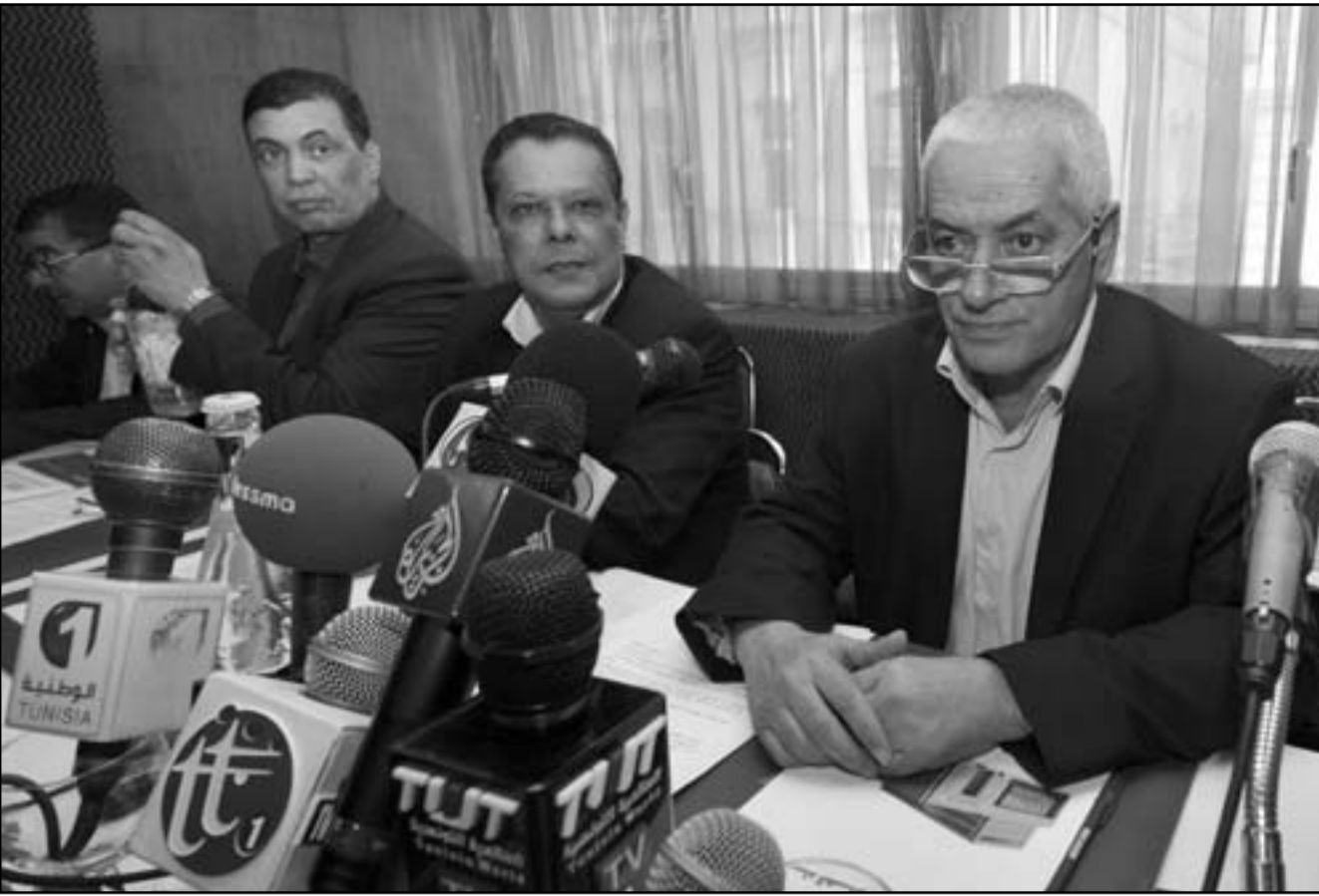
حسين العباسي الأمين العام للإتحاد العام التونسي للشغل (يمين) و أعضاء من الإتحاد خلال مؤتمر صحافي لإعلان عن ميعاد الاضراب العام

الرئيس الراحل الحبيب بورقيبة، وقد تخللتهما أعمال عنف دامية، وحملة اعتقالات واسعة شملت العديد من القيادات النقابية.