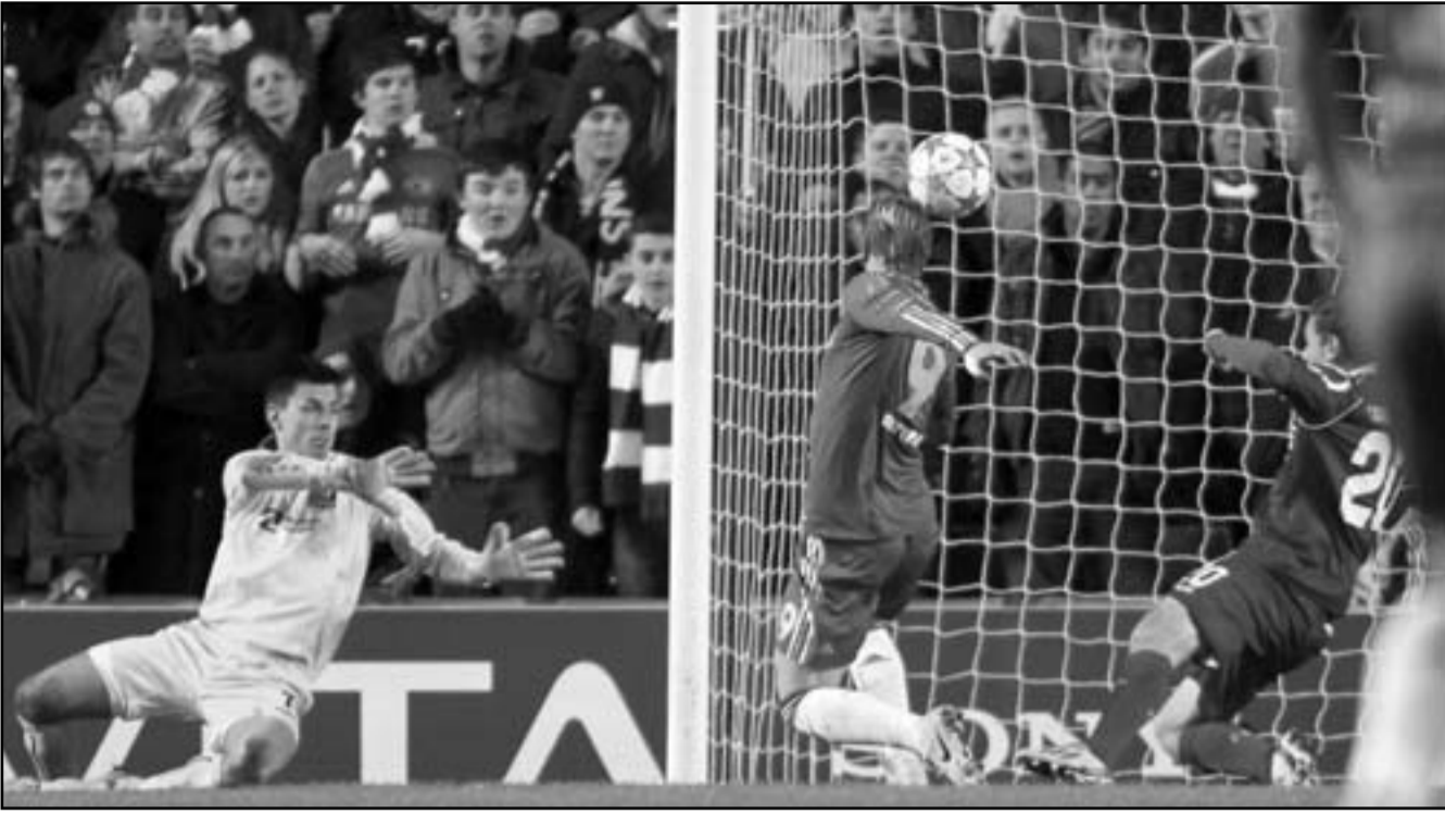
هداف تشيلسي فرناندو توريس يسدد هدفه الثاني خلال بطولة دوري الأبطال الأوروبي في مرمى نورديجلاند

وفي برشلونة سقط ميسي أرضا يعاني من إصابة في الركبة اليسرى وقال مدرب تيتو فيلانوفلا للتلفزيون الإسباني «لأنها انتكاسة (أن تكون الإصابة في الركبة). الأبطال يفحصون الإصابة وستعزز المزيد بعد انتهاء الفحوصات، لا يتدو إصابة خطيرة لكن سيكون علينا أن ننظر ونرى.»