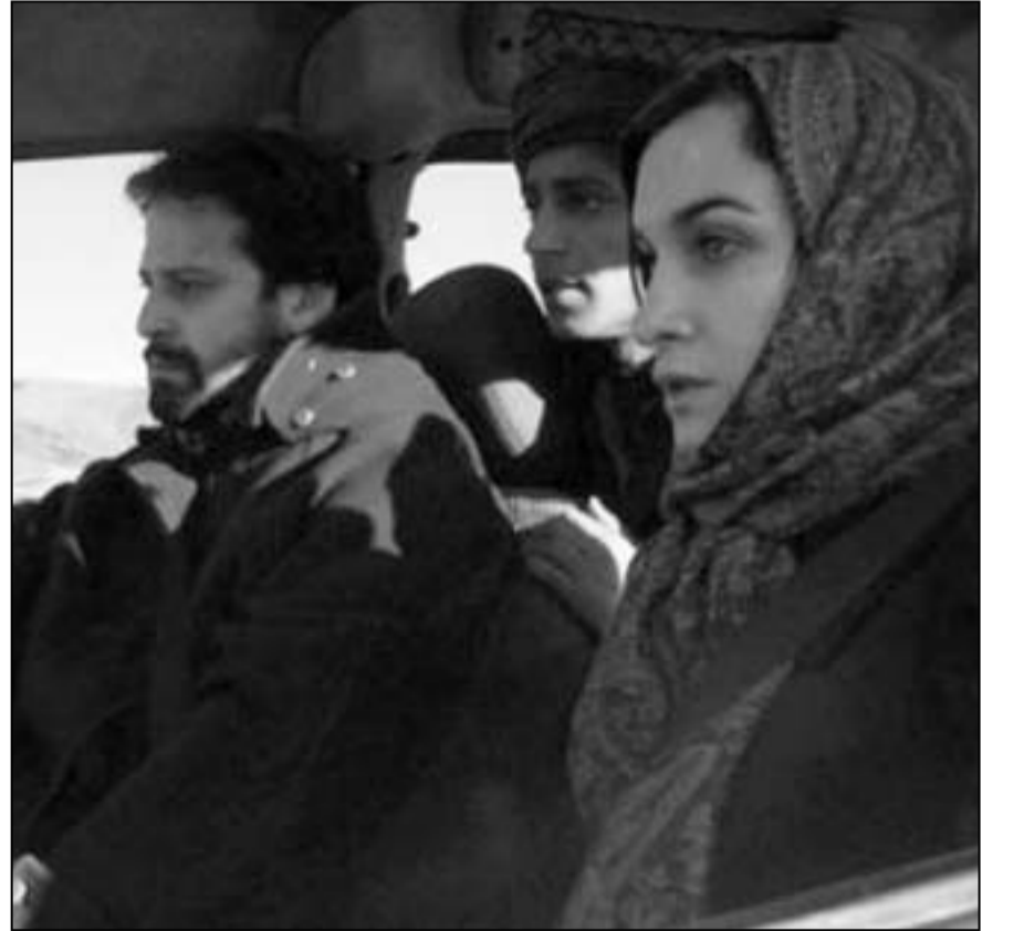
لقطة من فيلم «عطور الجزائر»