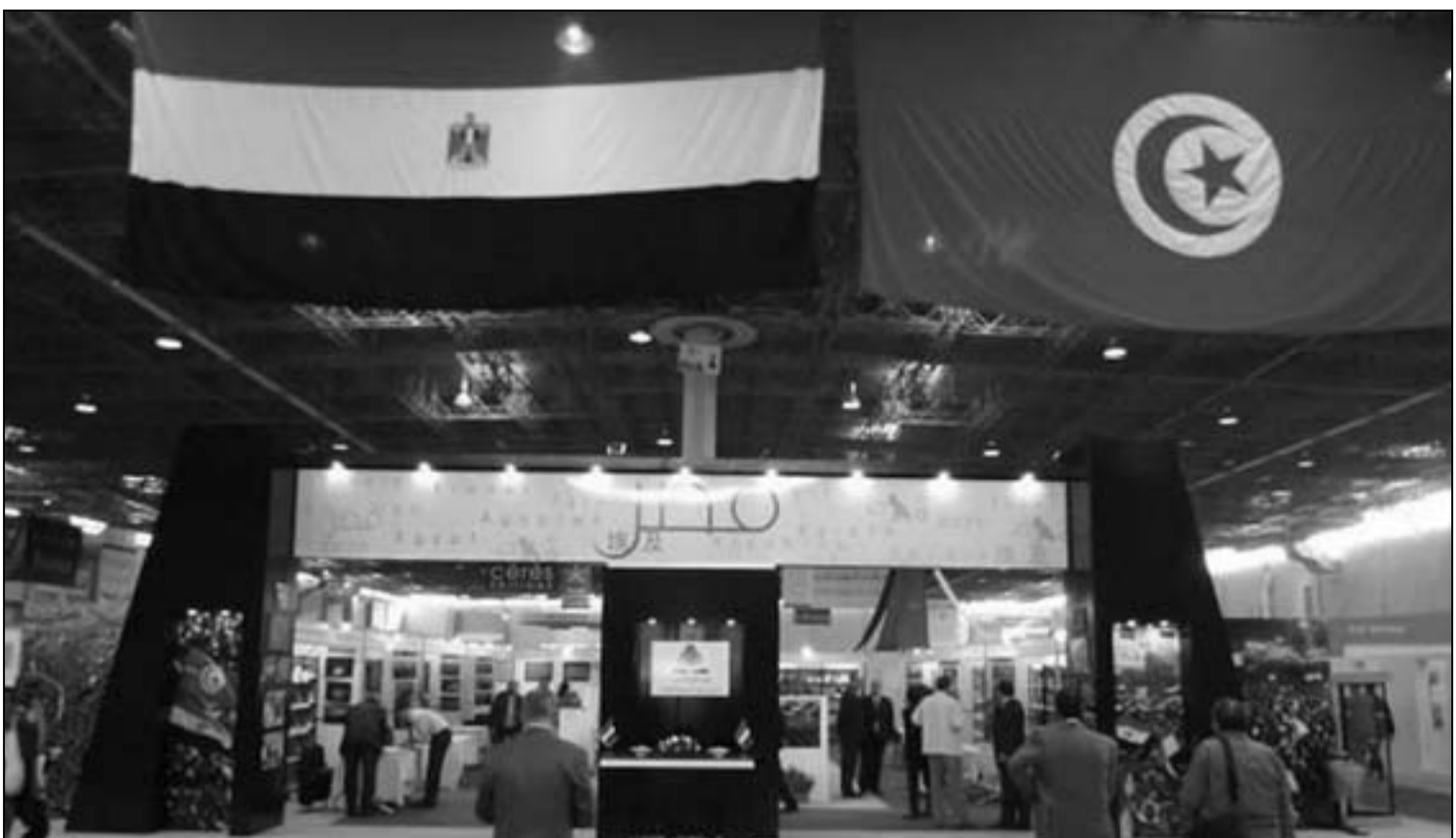
جناح مصر في معرض تونس الدولي للكتاب

وقال نبيل عبد الفتح: يحاول البعض شطب الدور الذي لعبته الطبقة الوسطى في الانتفاضة الثورية التي حدثت، وهناك صراعات سياسية حول من هم الذين قاموا بهذه الثورة، وان ما تم في مصر مبارك هو ازاحة الطبقة الوسطى والوسطى العليا وتمهيش الباقى وتمت استبعادات منهجية لاي قوة شبابية ظاهرة، انى ان لعبت الطبقة الوسطى دورها في استعادة الوسطى والخطر ان احتمالات المستقبل تنذر بصدام بين الطبقة الوسطى، فهذه الطبقة نظرا لبعدها عن السياسة لفترة طويلة تصورت ان السياسة هي معركة الثورة الواحدة ولكن السياسة هي معركة متواصلة وعلى الطبقة الوسطى ان تعلم ان السياسة تحتاج للنفس الطويل وليس اى احد من اعادة تشكيل التحالفات بشكل قبيلى، وأضاف مرص ان استمرار الحال بمجرد تغيير الأفراد لا يصلح ولا يغير النظام واي نظام لا يستوعب الطبقة الوسطى وتتحوّل الثورة البريقة الى ثورة خشنة وسيقوم بها العمال بالعلمى الصريح للثورة.