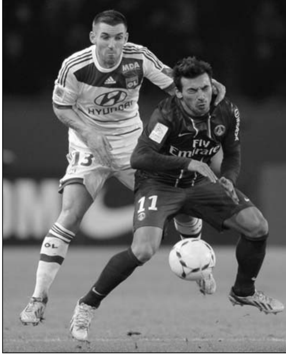
ايزقوبل لافيزي نجم باريس سان جيرمان (يمين) يتغرد بالكرة ويتفاسه عليها نجم ليون أنتوني ريغلا

لتسديتين قويتين في نهاية المباراة بعدما تخلى سلتا فيجو عن اتكامله الدفاعي. وحافظ ديورتيغو لكاررونا على موقعه في قاع جدول المسابقة بسقوطه في فخ التعادل السلبي مع ضيفه بلد الوليد.