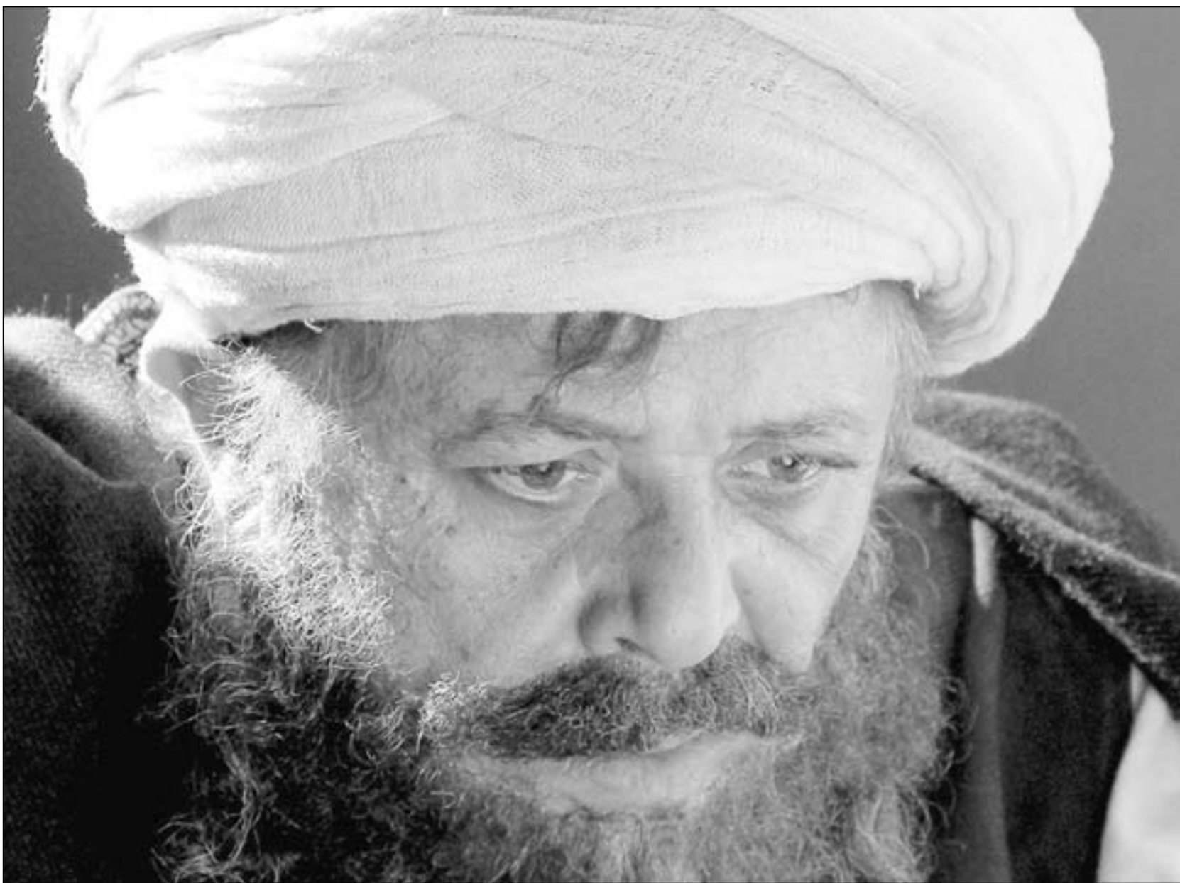
محمود عبد العزيز في مسلسل باب الخلق

فقد اخفقت مؤسسات الفن الرئي في تحاول نصب اي من الجسور اللغوية بين جناحي الأمة العربية، وبهذا الصدد ينبغي على وزارات الثقافة والأعلام ومؤسسات الفن ال الى هذا العربية الالتفات وبزاوية الطويلة لتحقيق الوحدة العربية يوما ما.