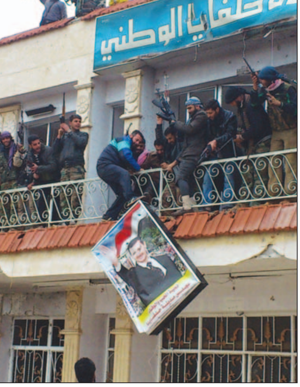
مقاتلون يحطمون صورة لبشار الأسد اثر استيلائهم على مستشفى في بلدة حلفايا امس