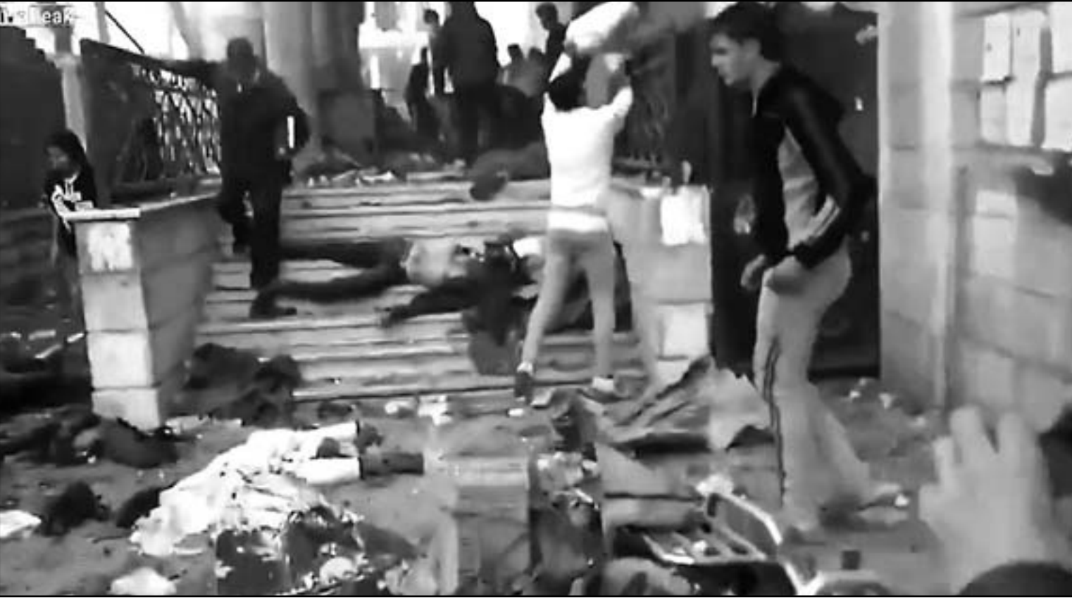
جثث ملقاة على باب المسجد في مخيم اليرموك

الاحد -بدء عمليات تحرير مدينة حماة وريفها من عصابات الاسد وشبيحته... وقتل في اعمال عنف في مناطق مختلفة من سورية الاثنى عشر 191 شخصا هم 98 مقاتلا معارضا و53 عنصرا من قوات النظام و40 مدنيا، بحسب المرصد الذي يقول انه يعتمد، للحصول على معلوماته على شبكة من المراسلين والناشطين في كل انحاء سورية وعلى مصادر طبية.