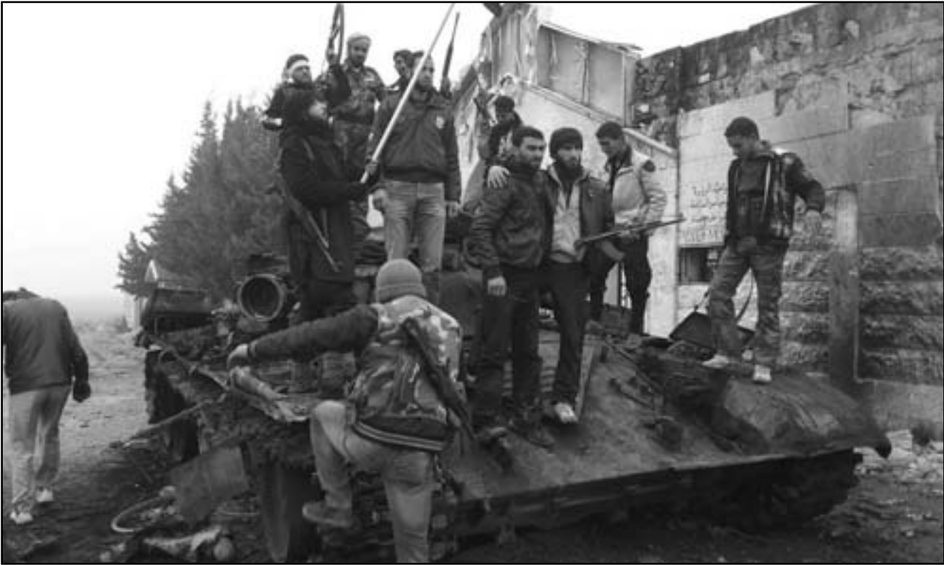
مقاتلو الجيش الحر يحتفلون فوق دبابة مدمرة للجيش النظامي قرب حمص

اخذوا السيارات، داهموا بيوتنا، وبعدها شعر السكان ان حياتهم في خطر فهربوا للاذقية»، ويضيف ان المقاتلين جاؤوا قبل ثلاثة اشهر واعتقلوا ابنه الذي لم يبلغ شينطا. ويضيف ان رجلا منهم جاء وطلب 1.5 مليون ليرة سورية مقابل اطلاق سراجه واعطوه مهلة ثلاثة ايام لتجهيزها وان لم يفعل فسيفقتلون ابنه، وعندما عاد واخذ المال ولتكنهم لم يلقفوا سراجه ابنه.