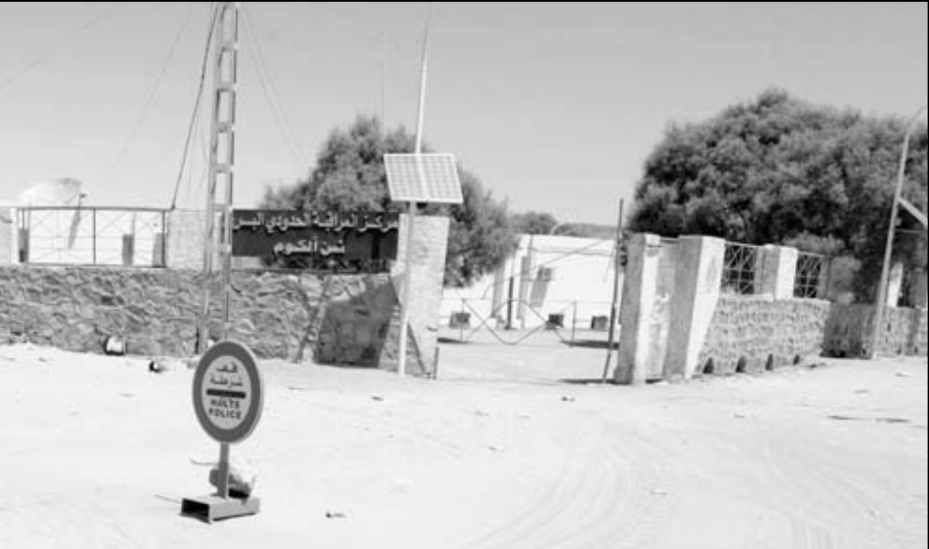
الحدود الجنوبية الليبية التي قررت الحكومة اغلاقها

انسانية سوف تنشأ». وتصدر النيجر الى ليبيا الموشى والخضار وخصوصا البصل وتستورد منها الفصح خصوصا وبعض المنتجات الصناعية. من ناحية، قال رئيس الحكومة الليبية على زيدان بعد جولة اقليمية ان اتفاقا رباعيا سوف يوقع من اجل تأمين الامن على الحدود مع هذه الدول ضد «الارهابيين».