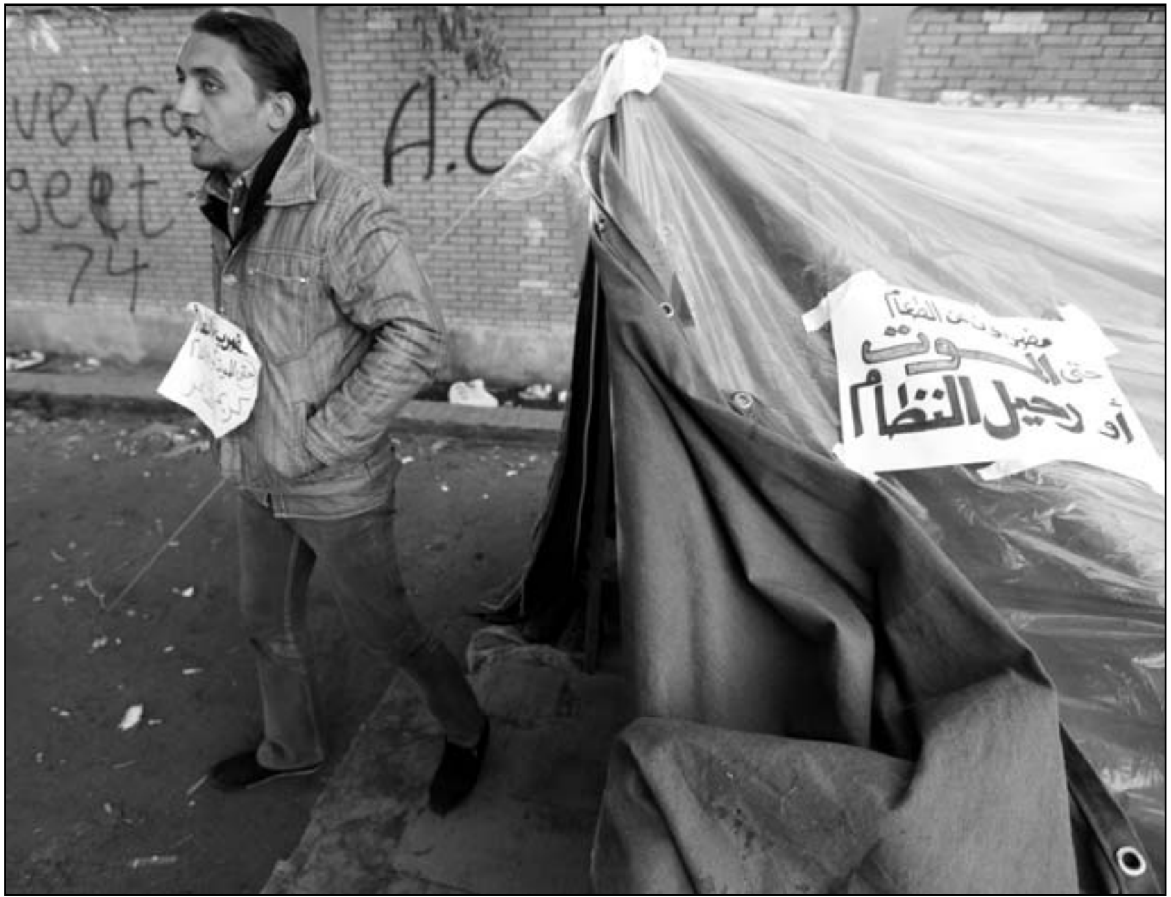
أحد المتعصين أمام خيمته في القاهرة أمس

وبعدما ركز في ولايته الأولى على التهديد مع جارتى العراق