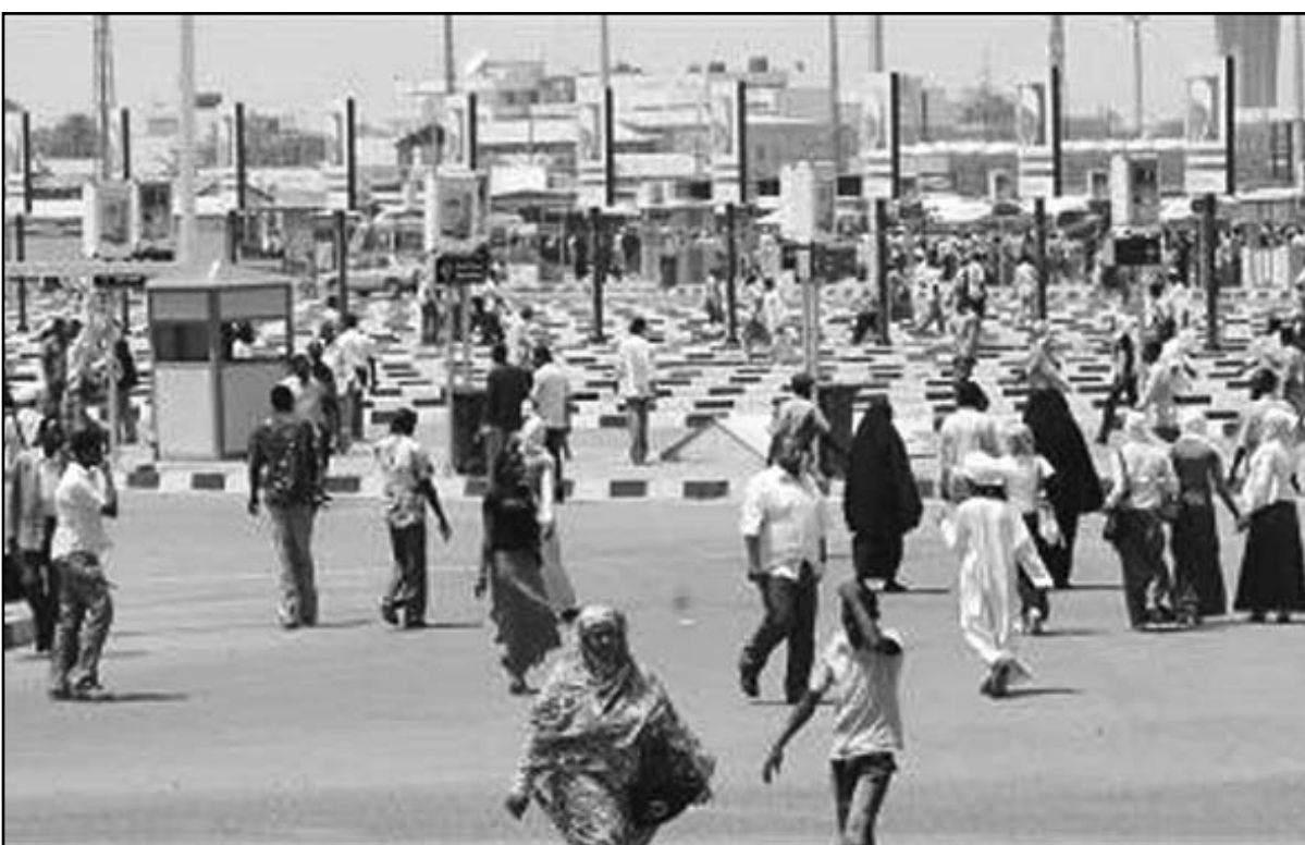
سودانيون في شوارع الخرطوم التي تشهد أزمة حادة في المواصلات

تحت الضغط ما يهدد بدوره «الاحتياطي الكليل جدا» من العملات الصعبة في البلاد، وكانت مجموعة الازمات الدولية التي يوجد مقرها في بروكسل حذرت في تقرير نشرته مؤخرا في تشرين الثاني/نوفمبر من ان «الاقتصاد على حافة الانهيار»، ورفضت الحكومة مطالب اتحاد العمال السودانيين لزيادة الحد الأدنى للاجور إلى 450 جنيه شهريا. وارتفعت اسعار اللحوم بما يعادل الضعف منذ العام الماضي فبلغ سعر كيلو اللحم 40 جنيه سوداني مقارنة مع 22 جنيه العام الماضي. وقالت صحفية (سودان فيجن) الصادرة بدون اعطاء تفاصيل حولها.