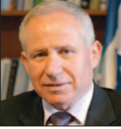
الناصرة - «القدس العربي»