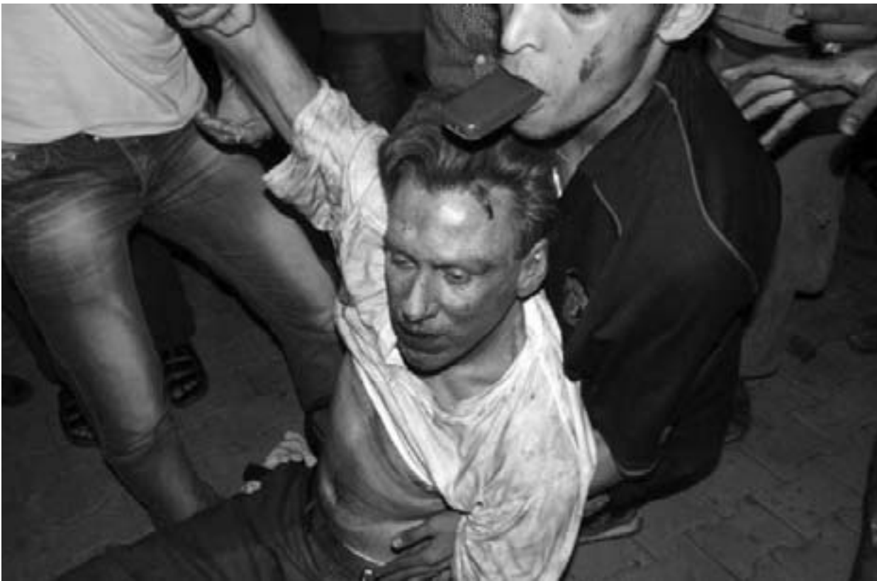
صورة من الأرشيف لحظة مقتل السفير الأمريكي في بنغازي

ولاداء بالشهادة عن حادث أثار جدلا سياسيا وتساؤلات عن أمن البعثات الدبلوماسية الأمريكية في الخارج. وقالت الخارجية الأمريكية ان كلينتون التي تتعافى من ارتجاج أصيبت به الأسبوع الماضي تسلمت التقرير الاثنين من لجنة مراجعة المسؤولية التي تشكلت للتحقيق في الهجوم الذي أدى إلى مقتل السفير الأمريكي في ليبيا كريستوفر ستيفنز وثلاثة أمريكيين آخرين. وقالت فيكتوريا تولاند التحديث باسم اللجنة الأمريكية الاثنين «استكملت لجنة