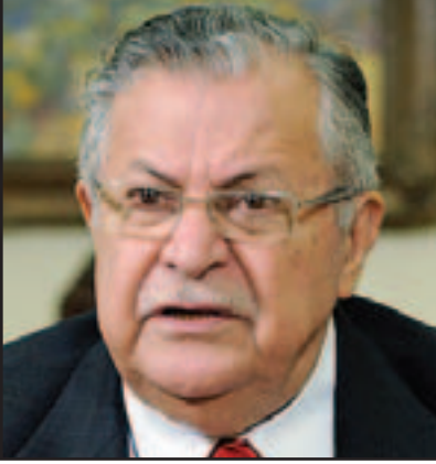
بغداد - لندن - «القدس العربي»:

عقد الفريق الطبي المشرف على صحة رئيس الجمهورية جلال الطالبا في بغداد مساء أمس الثلاثاء مؤتمر صحافيا أكد خلاله استقرار الحالة الصحية للطالبا، معلنين عن استدعاء فريق طبي بريطاني غدا لمزيد من الفحوصات، وقال أحد أعضاء الفريق «فنا بتشكيل فريق طبي من كل الاختصاصات، وأجريت جميع الفحوصات اللازمة أظهرت أن الوضع الصحي الطارئ للرئيس ناجم عن تصلب في الشرايين وأن وظائف الجسم اعتيادية». وأضاف أن فريقا طبييا من بريطانيا سيصل إلى العراق اليوم للإشراف على صحة رئيس الجمهورية، كما أكد طبيب آخر أن صحة الرئيس مستقرة الآن وأن كادرا طبيا مختصا ينصرف على صحته «نحن بانتظار تحسن صحته بشكل أفضل في الساعات القادمة». من جانبه أكد مدير عام دائرة مدينة الطب ببغداد أن نتائج التحليلات والفحوصات التي أجريت للرئيس كانت مطمئنة، وفي بداية المؤتمر الصحافي وصف رئيس ديوان رئاسة الجمهورية نصير العائني صحة رئيس الجمهورية بـ«المستقرة». وقال «واجه الرئيس أزمة صحية مساء أمس الاثنين، ما أوجب إدخاله إلى مستشفى مدينة الطب في بغداد، وهو الآن بصحة مستقرة». وكان السائل نفي في وقت الأنباء التي تناقلتها بعض وسائل الإعلام عن وفاة الطالبا، في وتضاربت الأنباء حول الحالة الصحية للطالبا، حيث أعلنت بعض المراكز الإعلامية المحلية والعربية نبأ وفاته، فيما نفت الرئاسة ذلك، من جهة أخرى دعت منظمة العفو الدولية