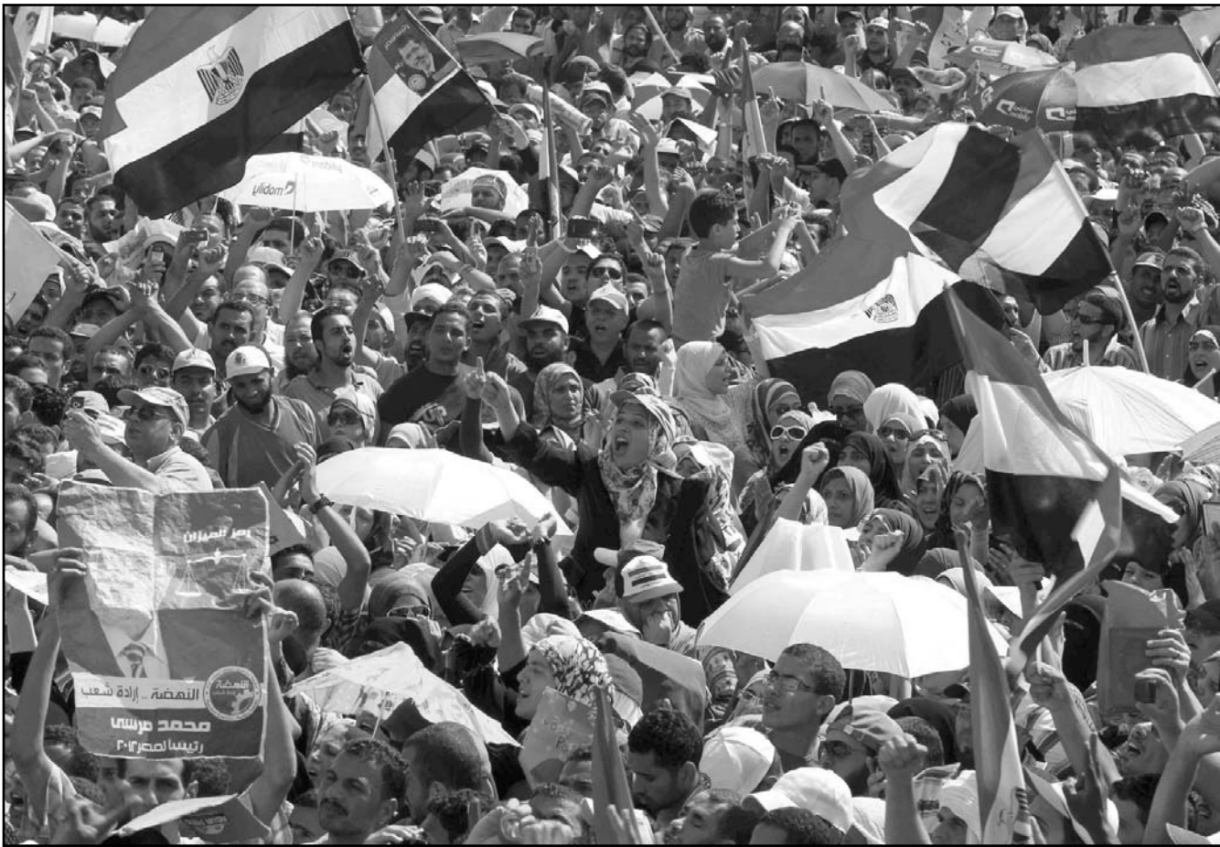
السعودية تحاول تجاوز آثار الربيع العربي

«حقوق وواجبات اعضاء المجلس بقررها مرسوم ملكي، المرأة العضو في المجلس ملزمة بالحرص على مبادئ الاسلام، ان تعتمر حجابا، ويقرر مكان خاص لجلوس المرأة وكذا باب دخول وخروج خاص للنساء في مدخل القاعة العامة، اضافة الى ذلك، يضمن لها كل الخدمات دون أن تضطر الى معونة الرجال. وسكون للنساء مكاتب خاصة تعمل فيها نساء لمساعدين»، وبالتالي فإن الفصل سيكون شبه تام، المرسوم الملكي وإن كان نال الثناء ولكن فضلا عن الرمزية، التي هي هامة بعد ذاتها، مشكوك أن يكون دخول النساء الى المجلس سيعبر التمييز العميق ضد النساء.