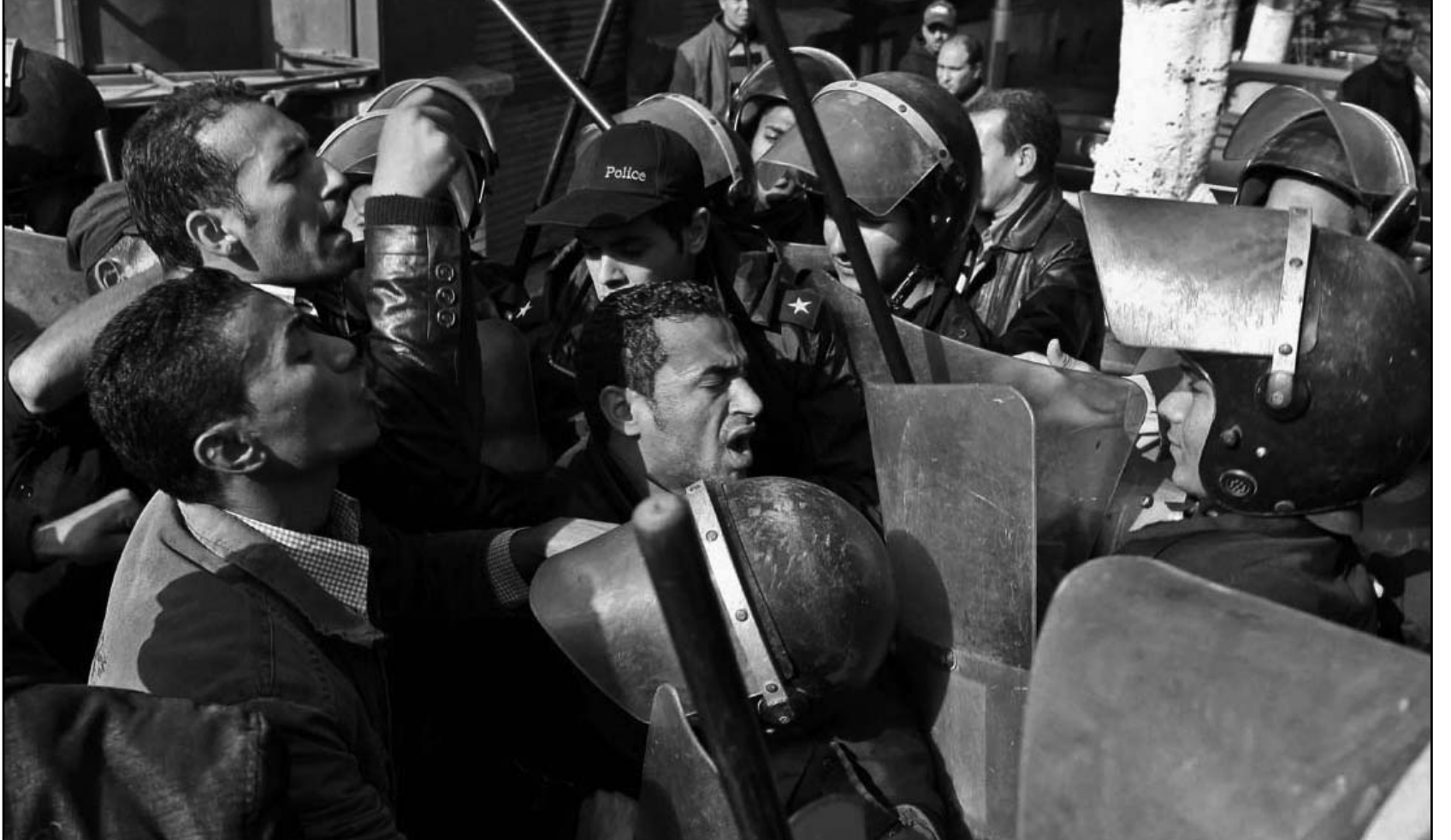
مواجهات بين متظاهرين من حملة الماجستير والدكتوراه العاطلين عن العمل ورجال الامن امام منزل رئيس الوزراء في القاهرة

دعت جبهة الانقاذ المعارضة في مصر، الاثني الى التظاهر في ميدان التحرير ومختلف المدن المصرية في الذكرى الثانية للثورة للتأكيد على احياء الثورة والاعتراض على «تركبات اخطاء النظام الاخواني». واعتبرت الجبهة التي تتكون من احزاب ليبرالية ويسارية في بيان الاثني انصارها الى «الاحتشاد في ميادين التحرير في جميع ارجاء الوطن يوم الجمعة، بمناسبة الذكرى الثانية لثورة يناير التي اسقطت نظام الرئيس المصري السابق حسني مبارك.