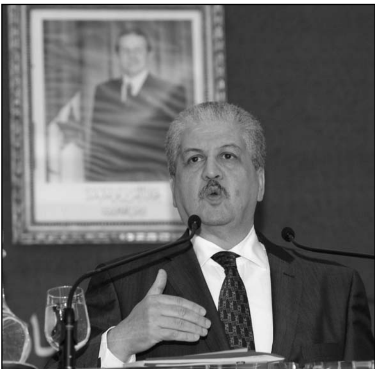
رئيس الوزراء الجزائري عبد المالك سلال خلال مؤتمر صحفي