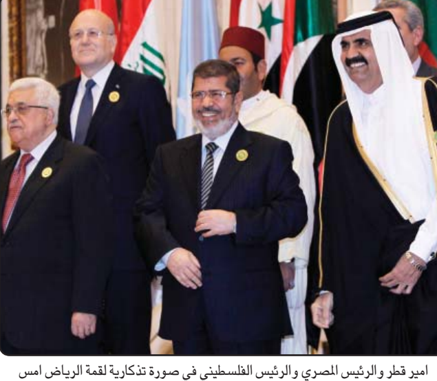
امير قطر والرئيس المصري والرئيس الفلسطيني في صورة تذكارية لقمة الرياض أمس

جراحية في الظهر، مؤخرًا، قيل أنها تكللت بالنجاح وأنه تعافى من آثارها. وكان مصدر سعودي مطع قال في تصريح، في وقت سابق أمس إن الملك عبدالله بن عبد العزيز سيغيب عن افتتاح القمة الاقتصادية الثالثة، «نتيجة وضعه الصحي الذي يتطلب منه الركوع إلى الراحة والابتعاد عن بذل أي مجهود بدني». من جهة دعا الرئيس محمد مرسي مساء الاثنين في كلمته في افتتاح أعمال الدورة الثالثة للقمة الاقتصادية إلى إنشاء نظام اقتصادي عربي جديد، مؤكداً أنه توجد حاجة كبيرة لوجوده، وكان مرسي بدأ زيارته للسعودية بزيارة قبر الرسول الكريم في المدينة، ومن المقرر أن يؤدي العمرة وهي الثالثة من نوعها بعد توليه الرئاسة بعد انتهاء القمة اليوم. واعتبر مراقبون أن أجواء الذكرى الثانية لانطلاق الربيع العربي كانت حاضرة بقوة في كواليس القمة الاقتصادية خاصة بعد المظاهرات التي شهدتها الكويت وتواصل في البحرين والعراق وسورية ومصر وتونس وحقيقة حالته الصحية في أعقاب خضوعه لعملية