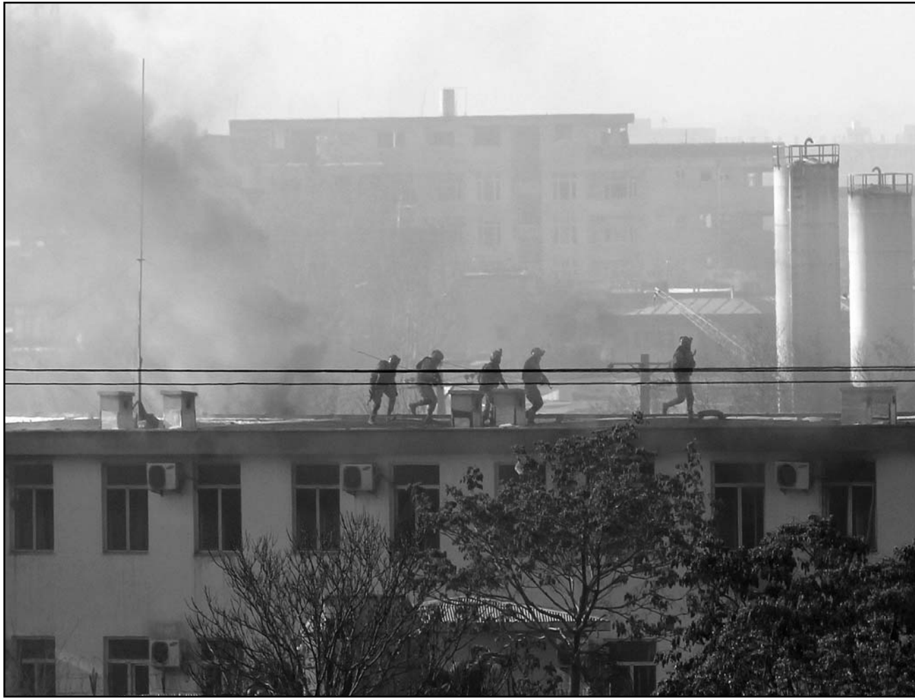
الشرطة الافغانية اعلى المبنى التابع لها بعد الهجوم الذي شنته عناصر من طالبان