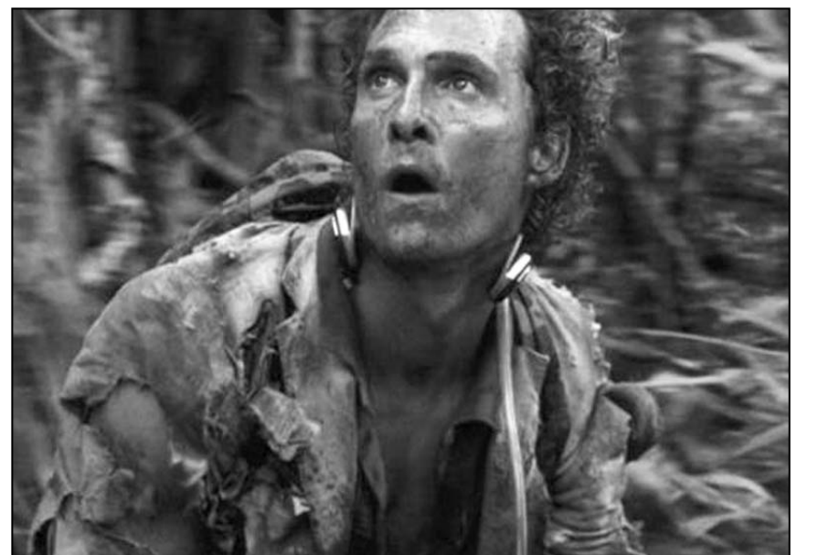
ماثيو ماكونهي في أحد ادواره السينمائية

على عكس النجم الأميركي بن أفليك، الذي هو والد ثلاثة أطفال، والذي أصبح وراء عدسة الكاميرا ليأخذ على عاتقه مؤخرا إخراج وإنتاج عدة أعمال سينمائية، أكد ماكونهي أنه «عرض عليّ أن أنتج بعض الأعمال غير أنني رفضت لأنني استمتع كثيرا بقضاء الوقت وأنا أتخضر لأدوار، وشخصياتي، وقيامي بكل ما في وسعي