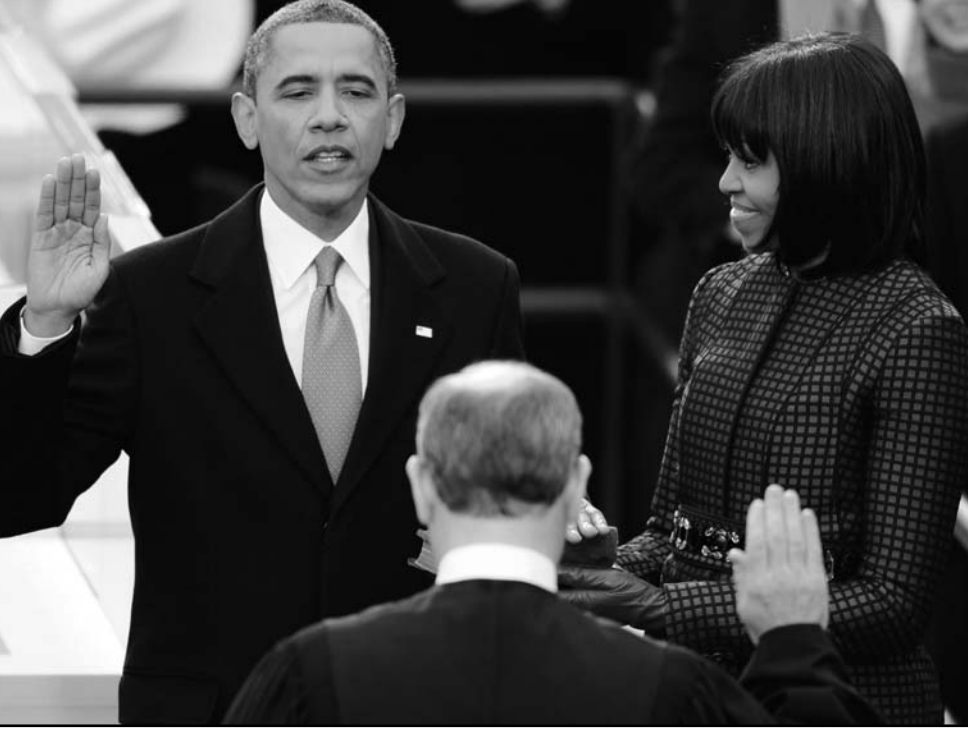
الرئيس اوباما يحلف اليمين ويحانته زوجته ميشيل مع بداية ولايته الثانية كرئيس للولايات المتحدة

طهران - د ب ا: انطلقت فعاليات الاجتماع الأول لكبار خبراء دول مجموعة الثماني الإسلامية المنامية «دي 8» امس الاثنين بمقر وزارة الاقتصاد والمالية في العاصمة الإيرانية طهران. وتعدرت وكالة أنباء الجمهورية الإسلامية (ارنا) ان كبار الخبراء بالمنظمة سيدرسون خلال الاجتماع سبل تعزيز التعاون الاقتصادي بين دول المجموعة في مجال توظيف الاستثمارات وإنشاء صندوق مشترك للاستثمار. وتعدر التقرير ان المجموعة انتخبت في اجتمع قمته الذي عقد في تشرين ثان/نوفمبر الماضي في العاصمة الباكستانية اسلام آباد محمد موسوي الذي تولى سابقا منصب ممثل إيران في منظمة التعاون الاقتصادي (اتو)، أمينا عاما جديدا لها. وشكلت الأمانة العامة للمجموعة في تموز/يوليو 2008 من قبل المجلس الوزاري الذي يعتبر أعلى سلطة تنفيذية بالمنظمة. وتهدف المجموعة إلى تحسين موقف الدول النامية في الاقتصاد العالمي، وتنوع وإثراء فرص جديدة في العلاقات التجارية، وتعزيز المشاركة في صنع القرار على الصعيد الدولي، وتوفير أفضل مستويات المعيشة، وتشمل المجالات الرئيسية للتعاون المجالات المالية، والخدمات المصرفية، والتنمية الريفية والعلوم والتكنولوجيا، والتنمية الإنسانية، والزراعة، والطاقة، والبيئة، والصحة.