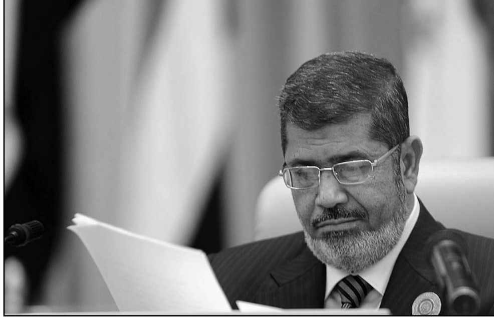
الرئيس المصري محمد مرسي

على رجال الأعمال السعوديين مجموعة من الفرص الاستثمارية منها إقامة خط سكة حديد جديد من الإسكندرية إلى أسوان كمرحلة أولى، ويربط بعد ذلك وسط أفريقيا بشمالها، والاستثمار في مشروعات الحديد والصلب والشروعات الزراعية».