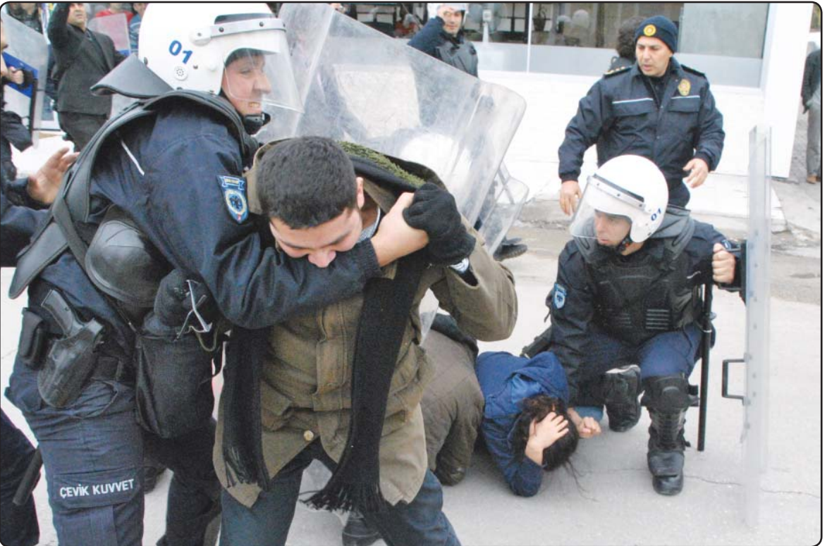
أتراك يشبكون مع الشرطة أثناء مظاهرات احتجاجاً على نشر صواريخ باتريوت في الأراضي التركية

سوري مطع في دمشق «إن السلطات السورية تتجه لإنشاء ما يمكن تسميته بجيش الدفاع الوطني كديف للقوات النظامية التي تتفرغ للعمليات القتالية». وقال المصدر إن هذا الجيش سيضم قرابة عشرة آلاف عنصر في مختلف أنحاء البلاد، على الأرض، سبع مساء أمس دوي انفجار في حي دمر في دمشق كما قتل عشرات الأشخاص وقال مدير المرصد رامي عبد الرحمن في اتصال هاتفى مع فرانس برس «إن الجيش لا سيما في منطقة دمشق وفي محافظات الرقة وحلب (شمال) والحسكة (شمال شرق) وحمص (وسط)، في وقت سجلت مواجهات مسلحة بين مقاتلين إرهابيين والقوات النظامية في إحدى مناطق الحسكة وأخرى بين المقاتلين الإرهابيين ومجموعات مسلحة معارضة في منطقة أخرى من المحافظة نفسها. (تفاصيل ص 5)