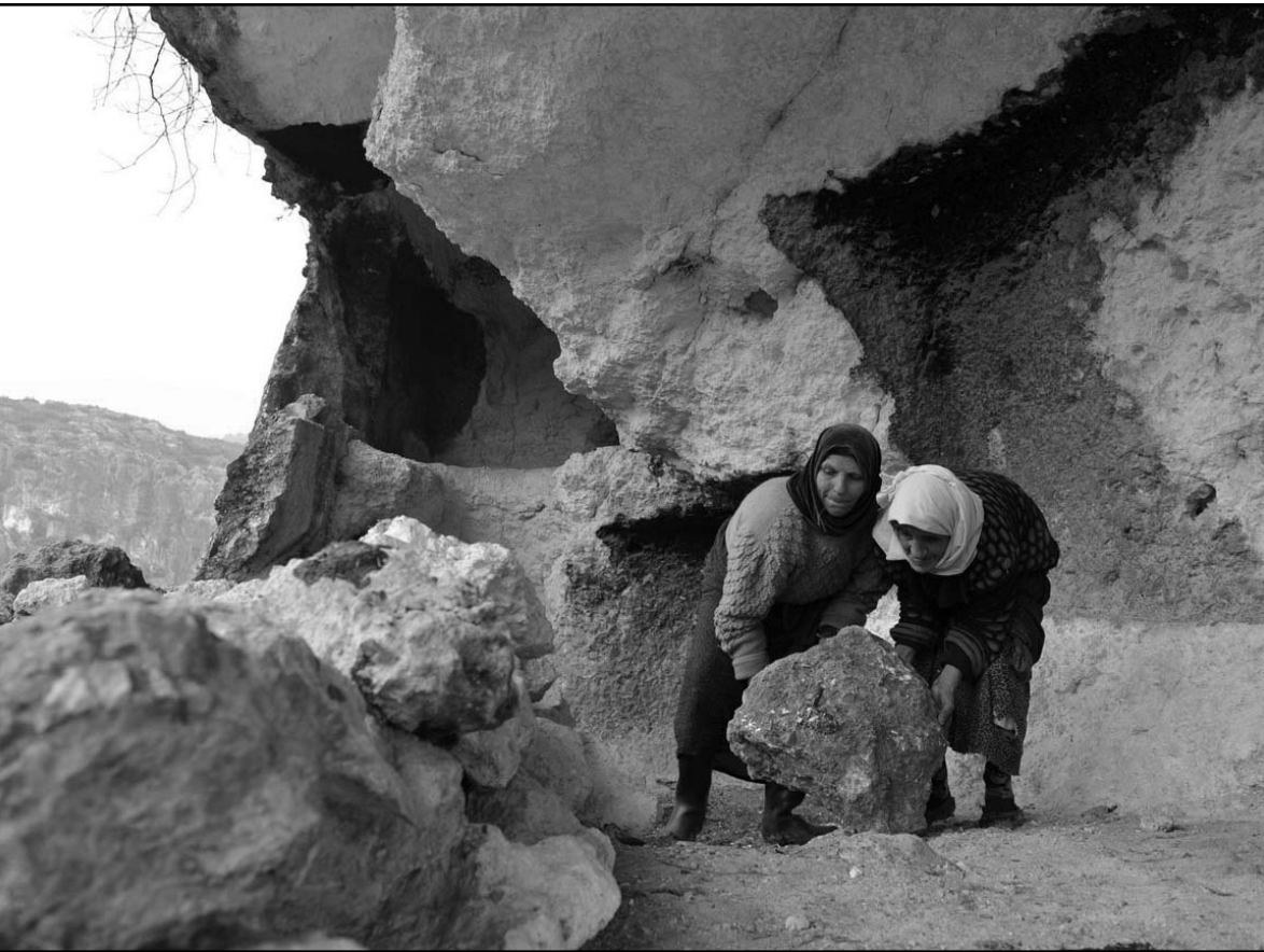
سوريان تدفعان بصخرة كبيرة لاستخدامها لإغلاق الكهف الذي يعيشون فيه بعد نزوحهم من منزلهم في منطقة عين الزرقا شمال سورية

في جيش الدفاع الوطني هم من أعضاء حزب البعث أو مؤيديه، وهم «رجال ونساء من كل الطوائف». وكانت قنادة «روسيا اليوم» ذكرت على موقعها الإلكتروني باللغة العربية الجمعة نقلاً عن مصدر سوري مطلع في دمشق «أن السلطات السورية تتجه لإنشاء ما يمكن تسميته بـ«جيش الدفاع الوطني» كدراف للوقوف النظامية التي تتفرغ للمهام القتالية». وقال المصدر أن هذا الجيش سيتشكل من عناصر مدنية أدت الخدمة العسكرية إلى جانب أفراد اللجان الشعبية التي تشكلت تلقائياً مع تطور النزاع القائم في سورية». وأشار المصدر إلى أن أفراد «جيش الدفاع الوطني» سيتقاضون رواتب شهرية، وسيكون لهم زي موحد، متوقفاً أن يبلغ عددهم حوالي مئتين مسلحين لساعدة قوات النظام على خوض حرب تزداد صعوبة على الأرض مع المجموعات المقاتلة المعارضة، بحسب ما ذكر المرصد السوري لحقوق الإنسان. وقال مدير المرصد رامي عبد الرحمن في اتصال هاتفي مع وكالة فرانس برس «أن الجيش السوري غير مدرب على خوض حرب عصابات، لذلك قرر النظام إنشاء جيش الدفاع الوطني». وأضاف أن جيش الدفاع الوطني سيضم اللجان الشعبية الموالية للنظام والمؤلفة من مدنيين والتي نشأت مع تطور النزاع إلى العسكرة بهدف حماية الأحياء من هجمات المقاتلين المعارضين، إنما مع توسيعها وفي ظل هيكلة جديدة وتدريب أفضل. وأشار عبد الرحمن إلى أن معظم المقاتلين