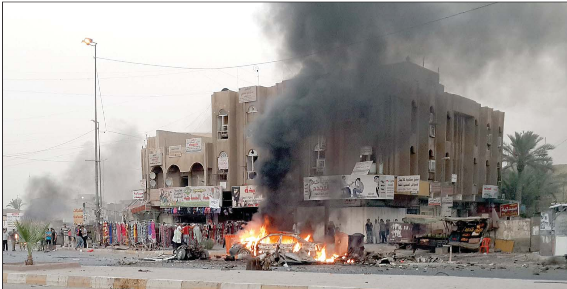
سيارة مشتعلة في موقع احد الانفجارات في بغداد امس

مفخخة في منطقة بغداد الجديدة في شرق العاصمة العراقية. وفي انفجار سيارة عند منطقة الدورة في جنوب بغداد، قتل شخص واصيب اربعة آخرون على الأقل بجروح، وفقا لمصادر أمنية. وقال ضابط برتبة عقيد في وزارة الداخلية ان «مسلحين مجهولين اغتالوا في ساعة مبكرة زوجة أحد عناصر الصلحة وابتداء الثلاثة وهم ولد وابنتان»، موضحا ان «مسلحين اغتالوا الضحايا داخل منزلهم في منطقة عرب جوبر»، في جنوب غرب بغداد. واكد مصدر طبي في مستشفى اليرموك تلقي جثث الضحايا. وقتل شخصان في هجوم مسلح صباحا امام منزلها