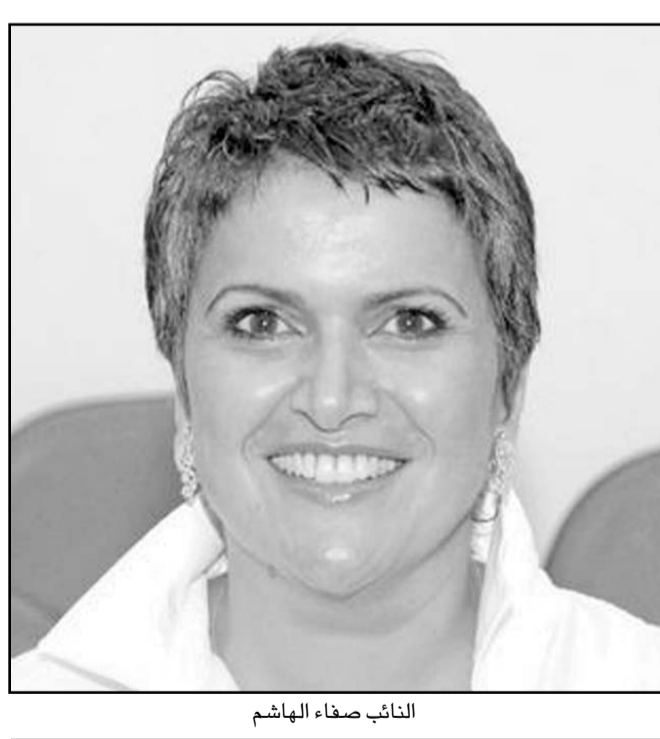
النائب صفاء الهاشم