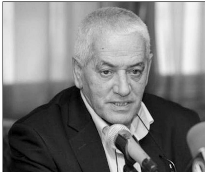
رئيس الاتحاد التونسي للشغل يتوسط بين الائتلاف الحاكم والمعارضة

الانتخابات المقررة بمدينتها نهاية العام الجاري أو بداية 2014. وتمثل التعيينات الحزبية في الإدارة التونسية إحدى أبرز النقاط الخلافية بين المعارضة والسلطة المحترزين في أجهزة الدولة بمختلف أنحاء البلاد.