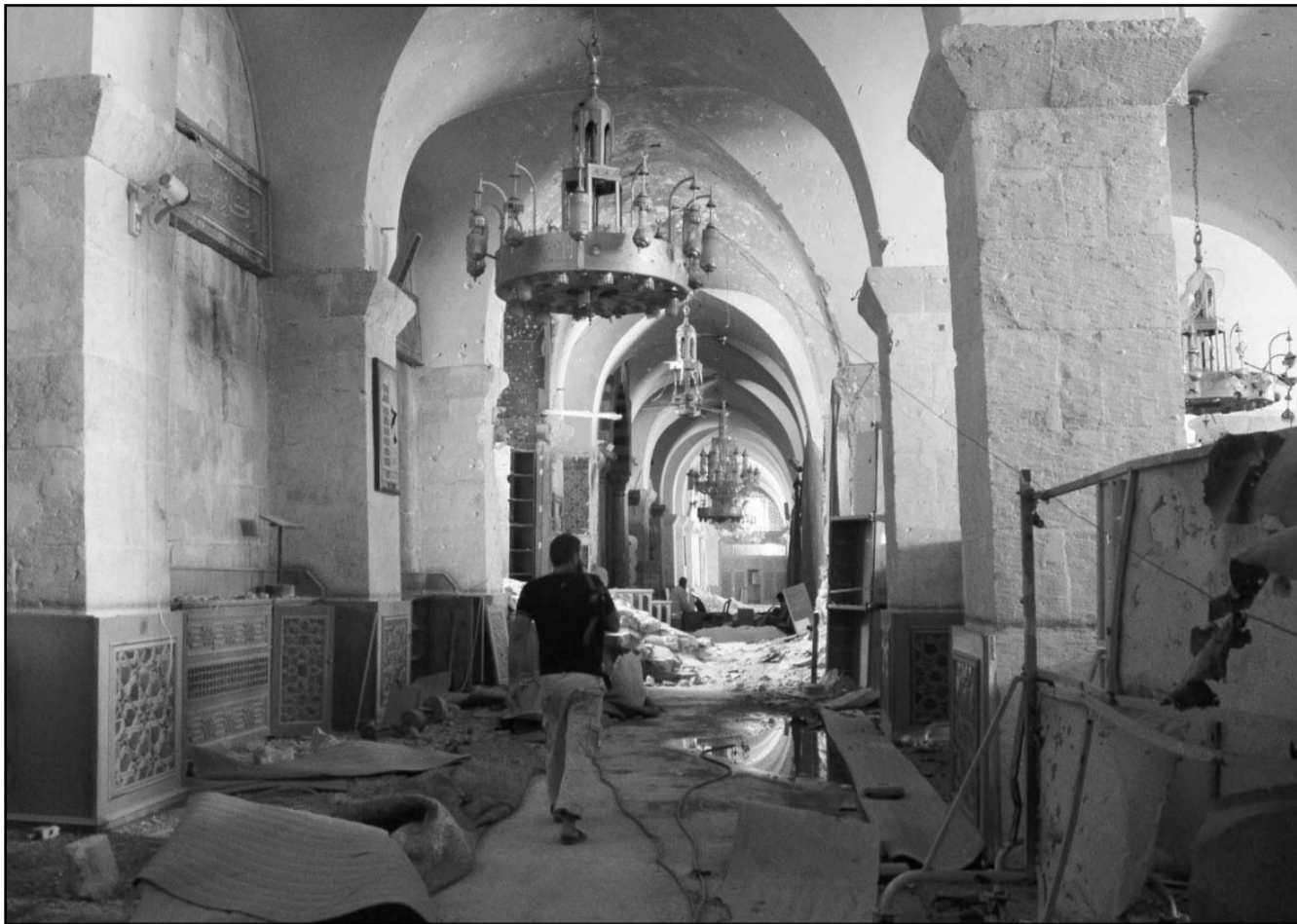
منظر من داخل جامع رام عباد في حلب

والفرنسيين والبريطانيين لا يمكنون دليلاً واحداً على امتلاك سوريا للكيماوي ولا لاكتناؤه منذ اليوم الأول». وأضاف «من يوجه الاتهام عليه ان يقدم ادلة، لقد تحدينا الولايات المتحدة وفرنسا بان تقدموا دليلاً واحداً، وأوباما، وأولادنا كانوا عاجزين، حتى أمام شعبنا». والتقى وزير الدفاع الروسي أبلغ الرئيس الروسي نيكولاي بولدينين في موسكو، في إطار سلسلة من اللقاءات الثنائية مع مسؤولين أمريكيين. وقال بولدينين إن العلاقات بين روسيا وأمريكا تتدهور، وحث على تحسينها. وقال الأسد إن «الشرق الأوسط برميل بارود والنفط اقتربت منه جدا ولكن بالنسبة لجميع المنطقة في الوضع حين ينفجر وخطر اندلاع حرب إقليمية وارد». فيما تحاول واشنطن وباريس إقناع الزعيم السوري بضرورة توجيه ضربة عسكرية إلى النظام السوري.