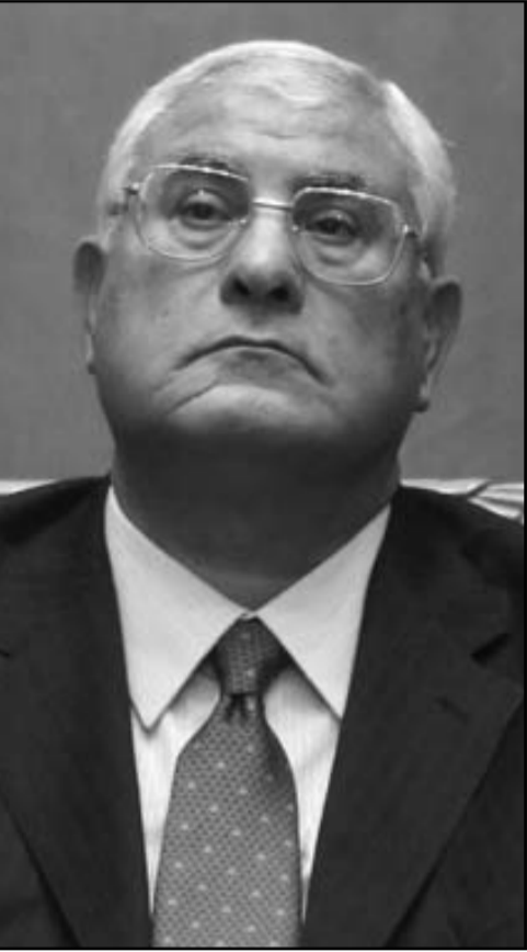
الرئيس المؤقت عدلي منصور

وقال منصور إنه لا يريد من وجود حلول سريعة من الحكومة الحالية لحل هذه المشكلات التي تواجه المواطن المصري. وأكد منصور أن المؤشرات لحل الأمن في مصر بصورة عامة في تحسن كبير ولكن لم تصل حتى الآن إلى أعلى الدرجات المطلوبة. وأضاف منصور أنه لا تراجع عن خارطة الطريق للمرحلة الانتقالية تحت أي بند من البنود، مشيراً إلى أنه لا إقصاء لأي فصيل سياسي قاتلاً؛ «المصالحة لا تعارض مع محاسب المواطنين في العنف». وحول مسألة حل جماعة الإخوان المسلمين قال إن الأمر متروك للخيار المصري وأن كلمته ستقذف في كل الأحوال. وأعلن منصور أن أولوية الحكومة خلال الفترة المقبلة ستصب على الملف الاقتصادي حتى يشعر المواطن بتحسين في معيشته كما أعلن عن إحصائيات تكشف حقيقة الأزمة الاقتصادية التي تعاني منها مصر. وحول الموقف الأوروبي مما يحدث في مصر قال إن المؤشرات والرسائل الصادرة منه بدأت تتحسن، أما الموقف الأمريكي فقال إنه يحتاج إلى إيضاح. وأضافوا أن أصوات انفجارات سمعت في القرى في تلك المنطقة، مؤكداً أنه لم تحدث أي إصابات خلال القصف الذي وقع صباح أمس الثلاثاء. وصرح مصدر أمني مصري مسؤول بان القرى التي تم قصفها اليوم يوجد فيها تجمعات للعناصر الجهادية وأنه تم قصف أهداف معينة في تلك القرى لعناصر مطوية.