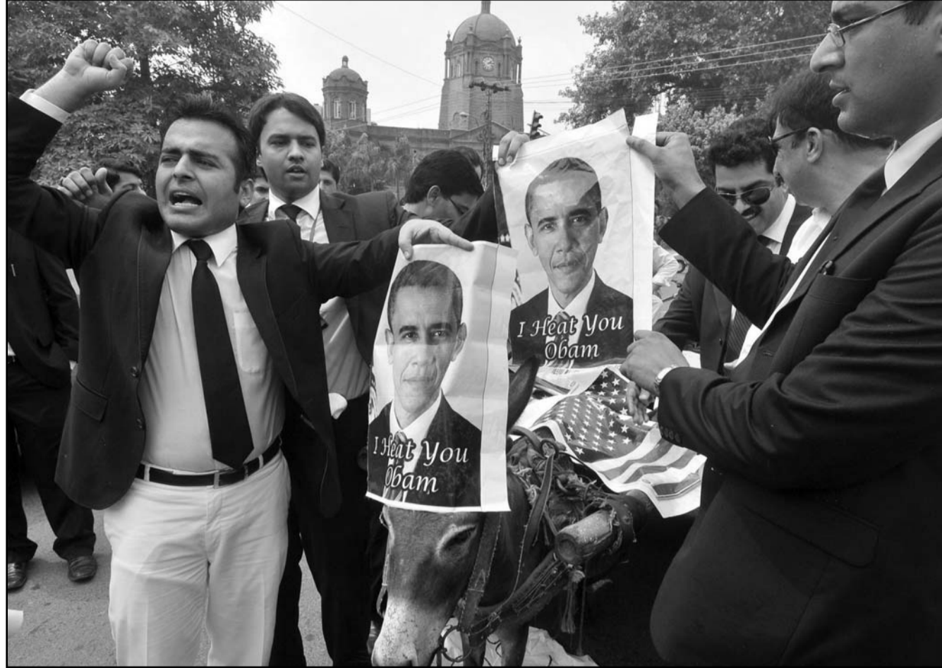
باكستانيون يضعون صور أوباما وعلم الولايات المتحدة على ظهر حمار اثناء مظاهرات ضد سياسة أمريكا الخارجية

■ عواصم - وكالات: تنفق وكالات الاستخبارات الأمريكية المليارات لمراقبة حليفها باكستان تماما كما تنفق لمراقبة اعداء كالقاعدة وايران، على ما نقلت صحيفة «واشنطن بوست» الثلاثاء. وكثفت الولايات المتحدة مراقبة اسلحة باكستان النووية وهي تركز خصوصا على مواقع للأسلحة البيولوجية والكيميائية فيها وتحاول تقييم مدى ولاء عناصر مكافحة الارهاب الباكستانيين الذين تجندهم وكالة الاستخبارات المركزية «سي آي ايه» بحسب الصحيفة. ونقلت الصحيفة عن ملخص من 178 صفحة للعمليات السرية للاستخبارات الأمريكية باسم «الميزانية السوداء» حصلت عليها من إدوارد سنودن، خبير الاتصالات الذي كشف البرامج الأمريكية لمراقبة الاتصالات في العالم. واكدت الصحيفة ان الوثائق تكشف الى اي مدى يصل انعدام الثقة في اطار الشراكة الامنية الهزوزة اصلا بين الجانبين، وان الجانب الأمريكي يقوم بعمليات جمع معلومات استخباراتية عن باكستان اكثر اتساعا مما تحدث عنه مسؤولون أمريكيون سابقا. وتابعت ان الولايات المتحدة قدمت مساعدات بقيمة 26 مليون دولار الى باكستان في السنوات الـ12 الاخيرة بهدف تحسين استقرار البلاد وضمان تعاونها في جهود مكافحة الارهاب، لكن الان بعد قتل اسامة بن لادن واضعاف القاعدة بدت وكالات التجسس الأمريكية وكأنها تركز على رصد مخاطر برزت خارج مناطق باكستانية ترافقها طائرات أمريكية بلا طيار. وصرح حسين حقاني الذي كان سفير باكستان في الولايات المتحدة حتى 2011 «ان كان الأمريكيون يوسعون قدرات مراقبتهم فذلك يعني شيئا واحدا (... ان العلاقة يسودها