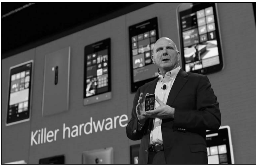
مدير شركة مايكروسوفت يعرض هاتف نوكيا الجديد

4700 شخص في فنلندا. وستحتفظ نوكيا بقرها في إسبانيا وفنلندا، وسيؤول رئيس مجلس إدارة نوكيا ريسيتو سبيلاسا منصب القائم بأعمال المدير التنفيذي، ووصف سبيلاسا الصفقة بأنها «أفضل