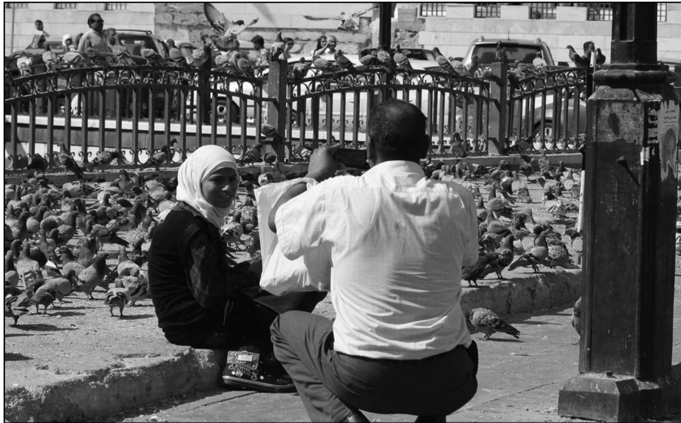
عائلة سورية تجلس في حديقة في دمشق

وكاتب مقاتلة عدة في 24/ آب (أغسطس) (شمال) واللاذقية (غرب)، ومشيرا إلى ان النظام تمكن من استعادة السيطرة على المدينة خلال عشرة أيام.