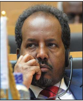
الرئيس الصومالي حسن شيخ محمود

مقديشو - ف.ب: نجح الرئيس الصومالي حسن شيخ محمود أمس الثلاثاء من هجوم على موكبته قامت حركة الشباب المرتبطة بتنظيم القاعدة أنها نفذته، في أحدث هجوم يستهدف الرئيس الصومالي في دول العالم. وزعمت الحركة الإسلامية أنها نصبت كميناً للموكب أثناء توجهه إلى ميناء مركبة جنوب العاصمة، وقالت أنها دمرت عربات في الموكب بقذائف صاروخية. الآن مسؤولين قالوا إن الهجوم فشل وأن الرئيس وجميع مرافقيه بخير. وقال محمد قوري المسؤول في الجيش الصومالي عبر الهاتف من مركبة «حاول مسلحون عرقلة زيارة الرئيس.. ولكنني استطعت أن أؤكد أن الرئيس والوفد الراقق له بخير ووصلوا إلى وجهتهم النهائية مرة لعقد اجتماعات مع المسؤولين المحليين». وكان الرئيس ينتقل في موكب من العربات المصفحة التابعة لقوات حفظ السلام الأفريقية المنتشرة في البلاد (17700 عسكري) والتي تحارب إلى جانب القوات الصومالية ضد حركة الشباب. وقعت الهجوم قرب منطقة بافو الصغيرة المأهولة قرب ميناء مركبة التي كانت مغلقة للشباب قبل عام وتبعد حوالي 100 كلم جنوبي العاصمة. وصرح إبراهيم ابن أحد سكان بافو أن «الموكب الرئاسي تعرض لهجوم، إلا أنه واصل السير بعد نحو 15 دقيقة من إطلاق النار الكثيف».