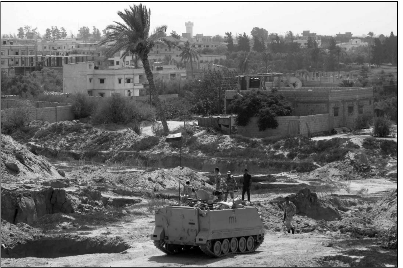
دبابة للجيش المصري في موقع بشمال سيناء

وقال المتحدث الرسمي باسم القوات المسلحة المصرية العقيد أركان حرب أحمد محمد علي، عبر صفحته على موقع التواصل الاجتماعي (فيسبوك) مساء الثلاثاء إن القوات المسلحة نفذت، في ساعة مبكرة من صباح أمس، عدة ضربات أمنية استهدفت الأوكار والبور الإرهابية بقرية «التومة» و«المطاعة»، بشمال سيناء أسفرت عن مقتل وإصابة 23 من العناصر الإرهابية المسلحة المتورطة في إستهداف عناصر التامين التابعة للقوات المسلحة والشرطة المدنية بشمال سيناء. وأضاف أن ذلك تدمير عدد من المباني التي