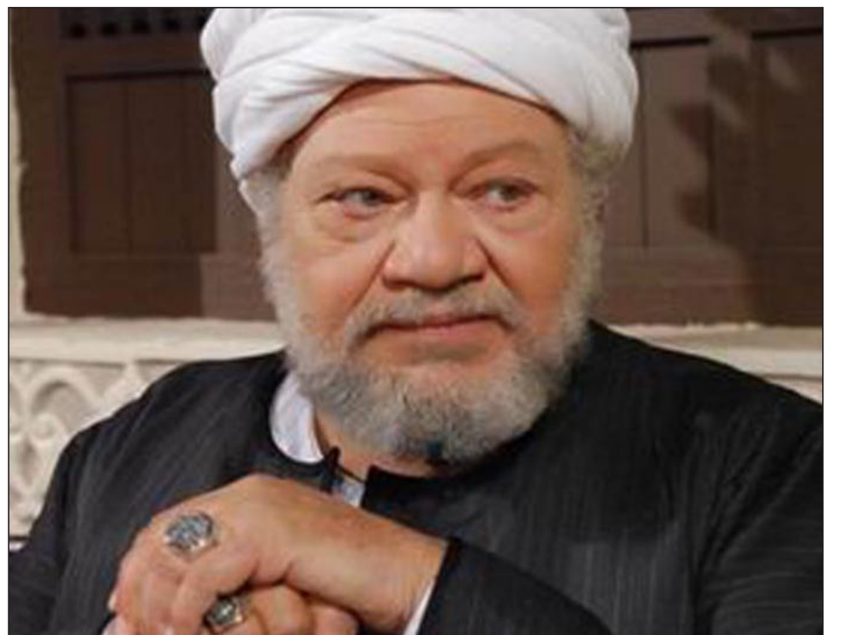
يحيى الفخراني في لقطة من مسلسل «شيخ العرب همام»

ومن المقرر أن يصور الفخراني أيضا المشاهد الخارجية من المسلسل نهاية الشهر المقبل بمناطق متفرقة بالقاهرة وخارجها