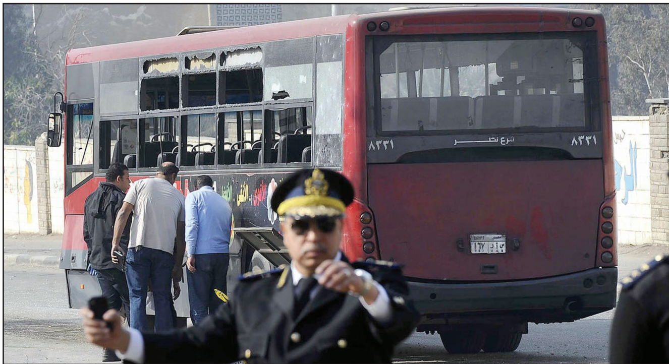
عصر في الشرطة المصرية بعد المارة بعد القاء قنبلة على حافلة رسمية في مدينة نصر بالقاهرة أمس