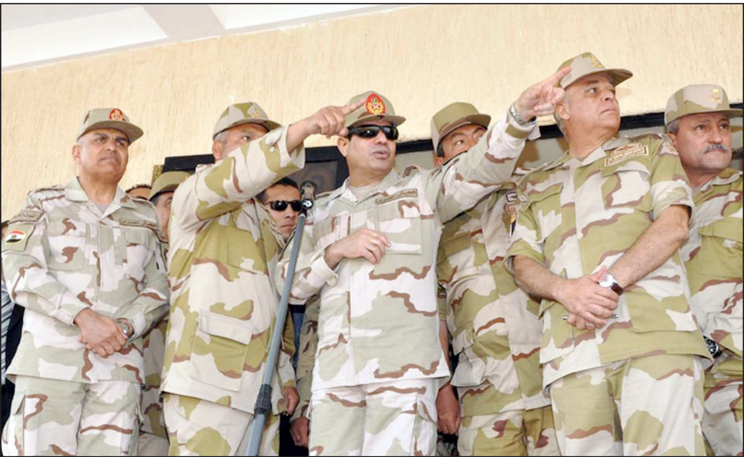
وزير الدفاع المصري الفريق أول عبد الفتاح السيسي بين عدد من قيادات القوات المسلحة المصرية أثناء حضوره حفل تخرج دفعة من الضباط

وقال الناشط الليبرالي خالد داود إن موجة هجمات المتشددين سقطت صدى النساءات الداعية للصالحية، وظل داود يدعو للصالحية السياسية حتى بعد أن نعتجه مؤيدون لمرسي في تشرين الأول/أكتوبر الماضي.