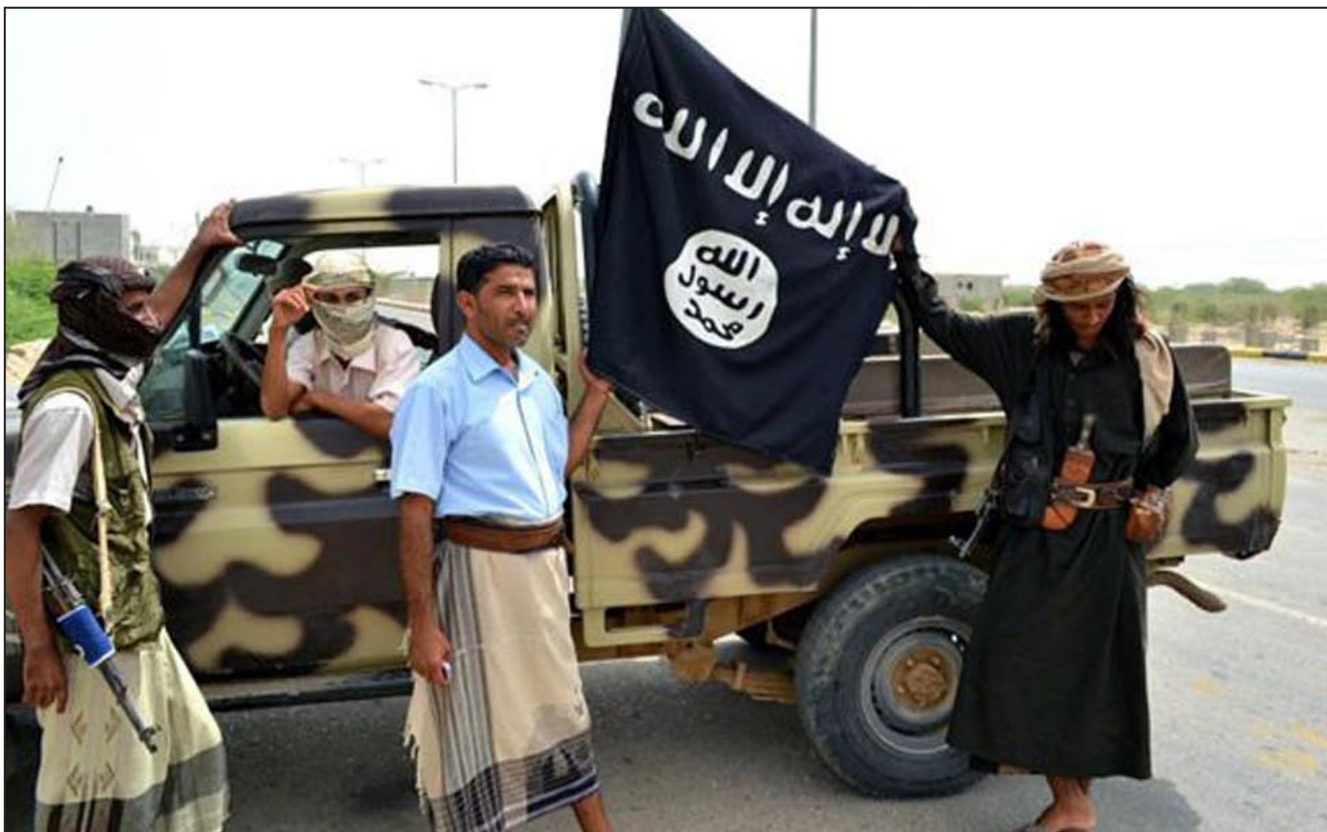
الحكومة الليبية تعمل على جمع الأسلحة واستلامها واعادتها