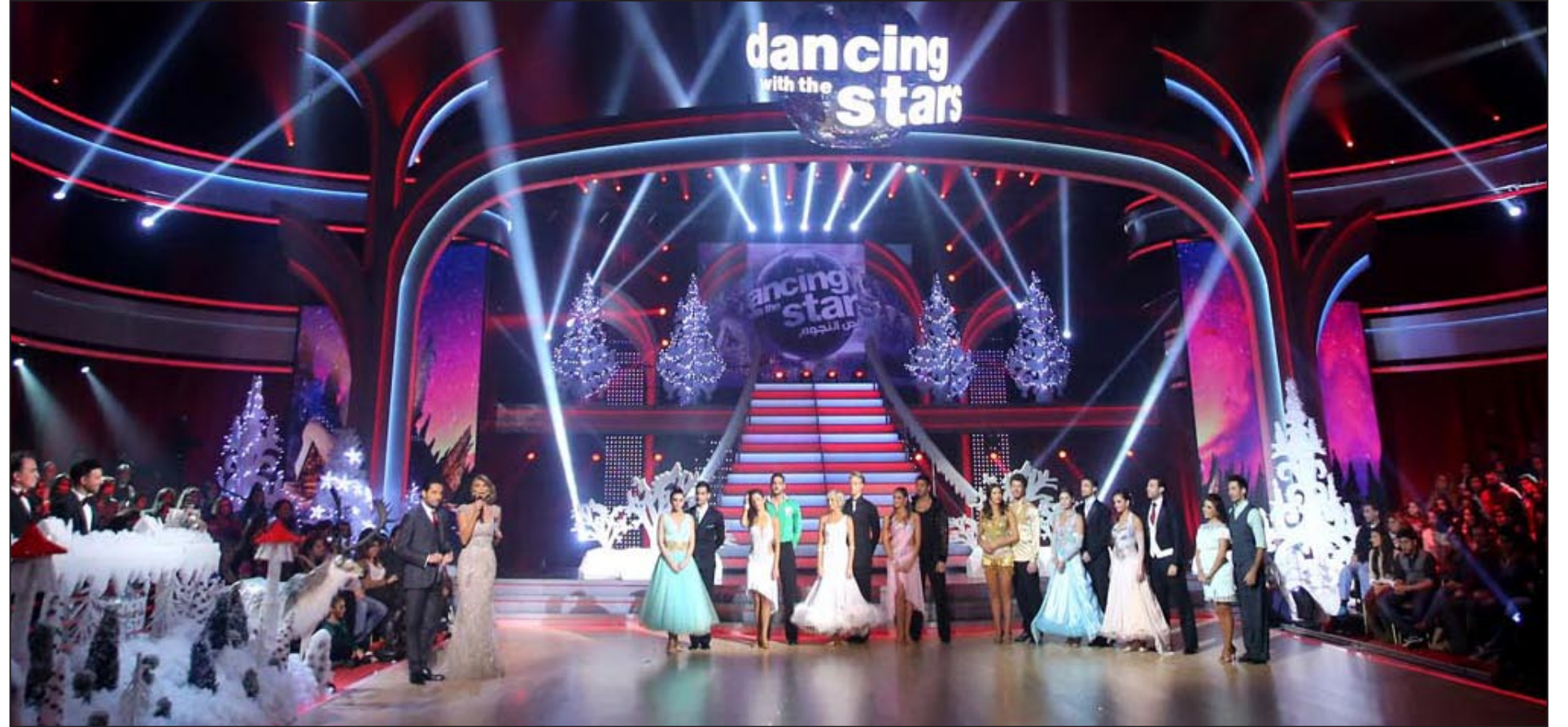
الرقص مع النجوم