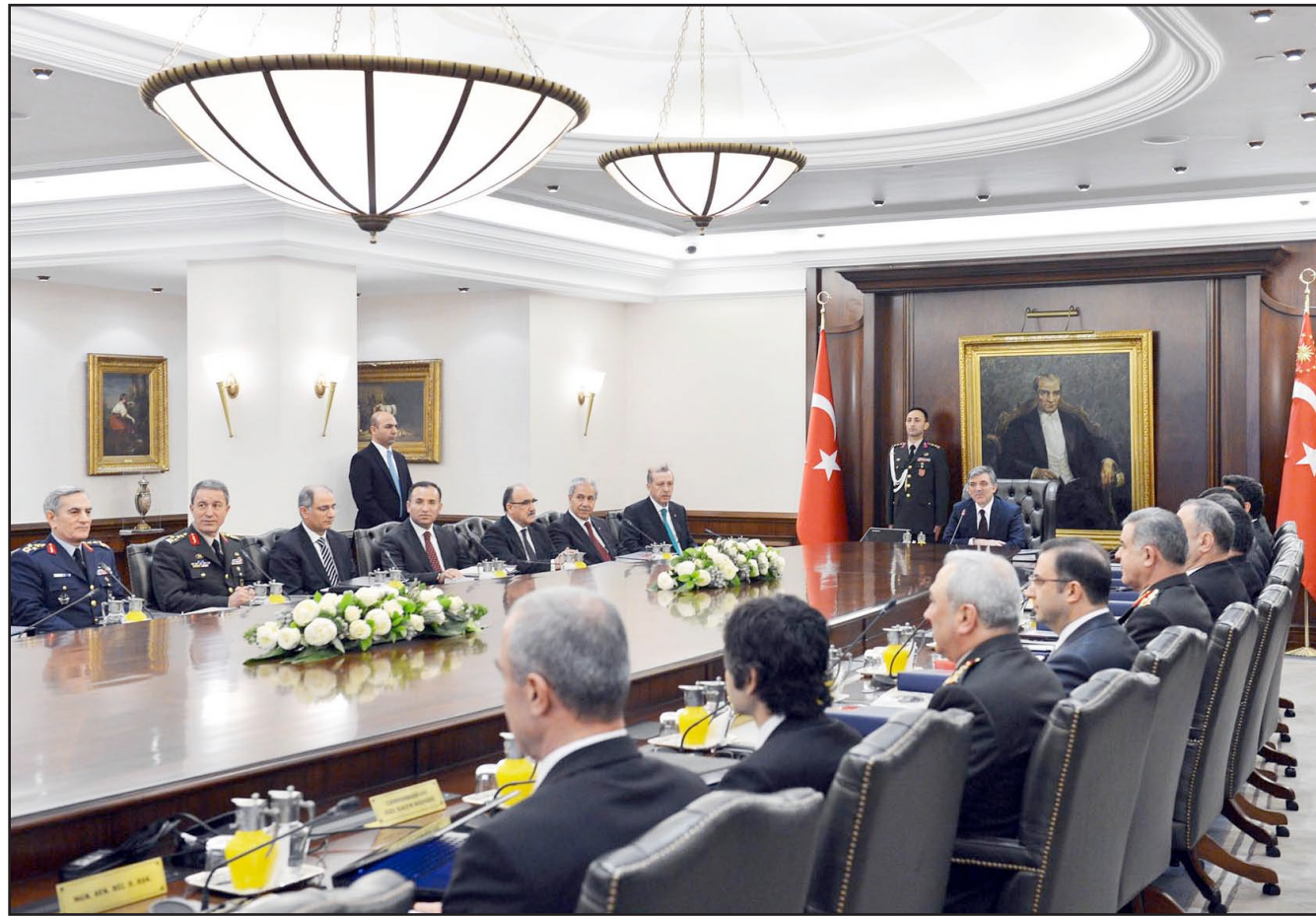
الرئيس التركي عبد الله غول مجتمعا باعضاء مجلس الامن القومي في انقرة

■ استنبول - رويترز: اتهمت المعارضة التركية أمس رئيس الوزراء رجب طيب أردوغان الذي استقال ثلاثة من وزرائه وسط فضيحة فساد بأنه يحاول أن يحكم من خلال «دولة عميقة» تعمل في الخفاء. وجاء اتهام المعارضة بعد أن أجرى أردوغان الليلة الماضية تعديلا وزاريا يشدد قبضته على الشرطة بعد أن اقتصد حكومته عددا من قادتها بالفعل. ومن بين عشرة وزراء جدد يتكون اللواء لرئيس الوزراء في التعديل الحكومي سيسيفل أفكان أعلى الحاكم السابق لاقليم ديار بكر المضطرب مناصب وزير الداخلية وسيشرف على الامن الداخلي لتركي. ويخلف أعلى وزير الداخلية السابق معمر جولر الذي كان من بين ثلاثة وزراء استقالوا لهم أبناء بين أولئك الذين القي القبض عليهم في تحقيق الفساد. وما زال اثنين من ابناء الوزراء محتجزين الى جانب 22 شخصا آخرين. وبدأت الازمة في منتصف عام 2013. لكن فضيحة الفساد دفعت الاتحاد الاوروبي الى الدعوة الى تامين القضاء التركي المستقل وهزت العملة وانخفضت الليرة التركية الى مستوى قياسي وسجلت 2.1025 ليرة دولار. ويبدو الصراع قويا وشخصيا في أن واحد بالنسبة لاردوغان. وكشفت احداث فضيحة عن التناقص بين اردوغان ورجل الدين التركي القوي الذي تزعم الحركة فتح الله كون الذي تزعمه «خدمة» أن عدد اتباعها يصل الى مليون شخص وبينهم شخصيات كبيرة في الشرطة والقضاء وتدير مدارس وجمعيات خيرية في انحاء تركيا وفي الخارج. ونفى كون اي دور له في المسألة. وقال اردوغان لاردوغان في اشارة الى كون فيما يبدو «أن نسحق لمنظمات معينة تعمل تحت حجب الدين لكن تستخدم كنادات لدول معينة بتنفيذ عملية ضد بلدا». وأبدى الأتراك في شوارع استنبول