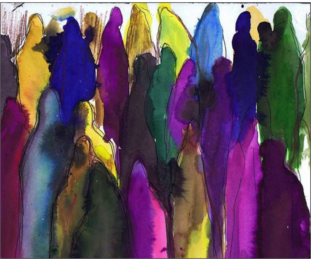
لوحة تعكس اهتمام ابو راوي بموضوع المهاجرين

منها مع الفنان النمساوي مارتن هوشتل فينا بالنمسا، معرض جماعي بالمؤسسة العربية الأوربية بالتعاون مع جامعة غرناطة ومعرض السلفيوم بمدينة بنغازي ومشاركة جماعية في العمل التركيبي (عند بداية الفجر) في الدار البيضاء بالمغرب.