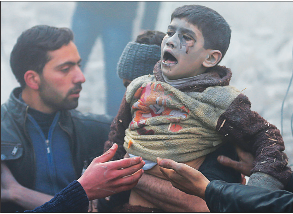
أحد ضحايا قصف قوات النظام السوري لمدينة دوما أمس

وقال ضابط بالقوات الخاصة العراقية لرويترز «ناشد زعماء العشائر رئيس الوزراء وقف الهجوم والكف عن قصف الفلوجة.. نفذنا الجزء الخاص بنا من الاتفاق وعليهم الآن أن يتفخوا الجزء الخاص بهم وإذا لم يحدث ذلك فسنبكون هناك هجوم سريع».