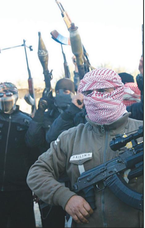
مسلمون من محافظة الأنبار

وأضاف البيان أن «الهيئة العامة للائتلاف في دورتها الحالية لم تبحث بعد موضوع مؤتمر جنيف»، ولم تقرر بعد مشاركتها في جنيف 2 حتى الآن. وقال عضو الائتلاف الوطني لقوى الثورة والمعارضة السورية عن الحركة التركمانية زياد حسن أن 40 عضواً على الأقل في الائتلاف، وهو من بينهم، قد قدموا استقالاتهم بشكل خطي من عضوية الائتلاف، وذلك لعدة أسباب، فيما قال رئيس الهيئة العسكرية في الجبهة الإسلامية زهران عبدالله علوش إن هناك توجهاً لإدراج المشاركين