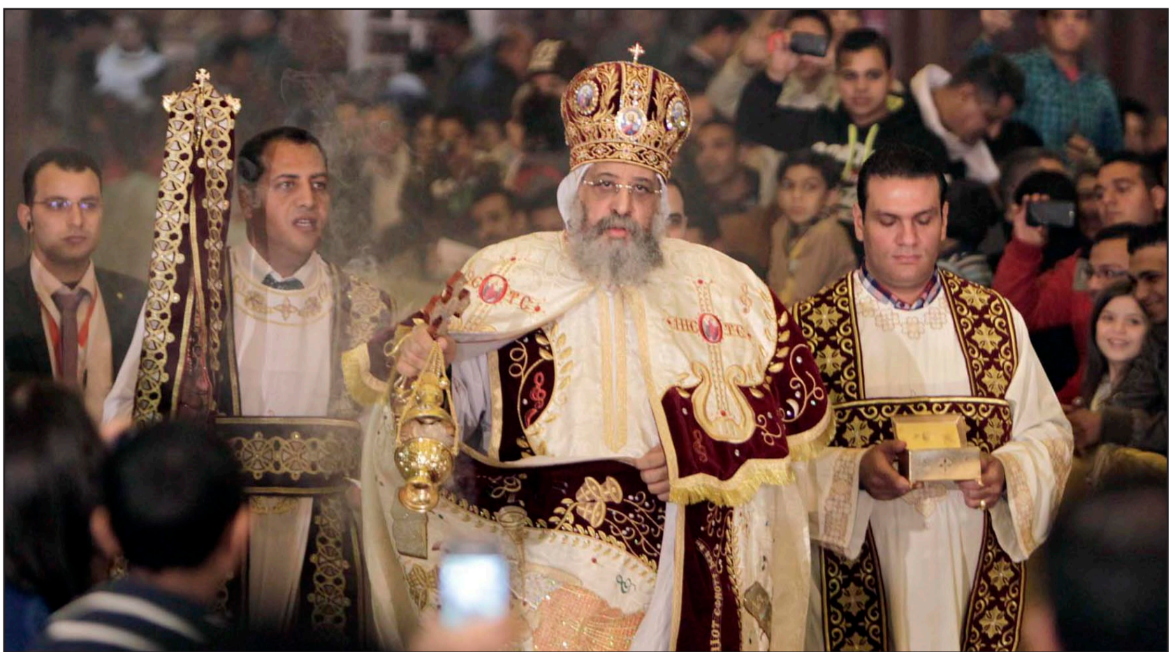
قداسة البابا تواضروس الثاني اثناء قداس عيد الميلاد المجيد في القاهرة مساء الاثنين

برلين - د ب أ: أكد الخبير الألماني بشؤون الشرق الأوسط جينو شتاينبرغ أن تعاطف أمير الإرهابيين في العراق مرة أخرى هو نتيجة للسياسة الخاطئة التي ينتهجها رئيس الوزراء العراقي نوري المالكي. وقال خبير مؤسسة العلوم والسياسة في تصريح لإذاعة «دويتشلاند راديو كولتور» الألمانية أمس الثلاثاء إن المالكي والأحزاب الشيعة التي تدعمه يحاولون منذ عام 2010 إبعاد جميع السنين والقوى العلمانية من الحكومة العراقية وذلك لأن أحد أسباب حصول تنظيم