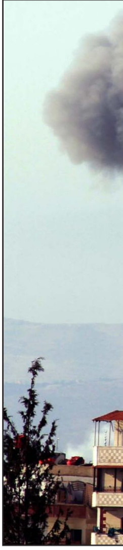
مروحيات تابعة للجيش النظامي السوري قصفت بنايات في منطقة درايا

وترى الصحيفة أن الولايات المتحدة وإيران تتفان الآن على خط مواجهة أحد في المنطقة، ففي الوقت الذي يتواصل فيه التفاوض حول الملف الإيراني النووي إلا أنها تعانوا في السلطة تمتد إلى العراق أخري مثل سوريا حيث يلعب الحرس الثوري فيما دورا مهما عبر لواء القدس الذي يقدم أسلحة لحزب الله الذي يقابل إلى جانبه الأسد.