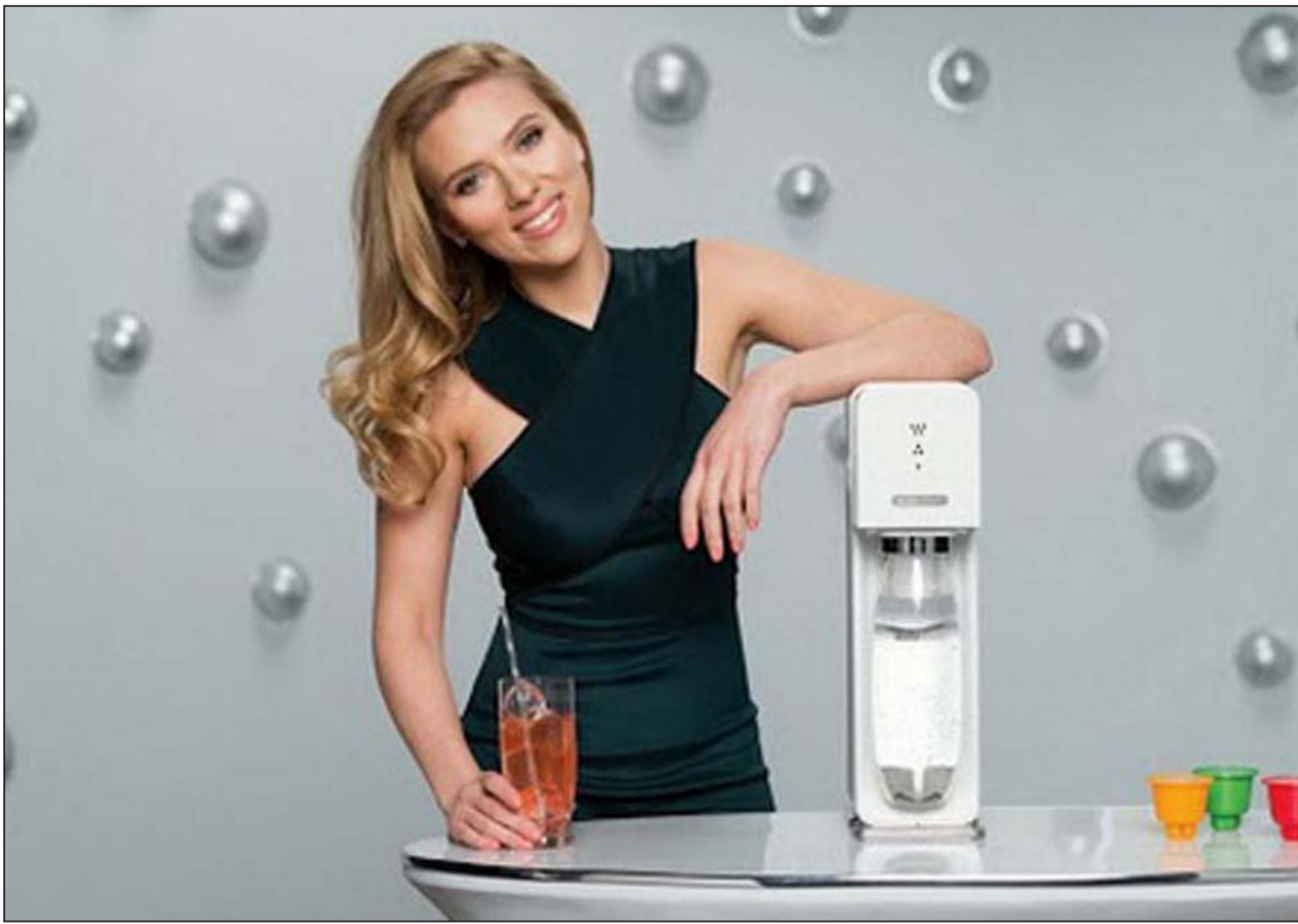
سكارليت جوهانسون كما ظهرت في الإعلان