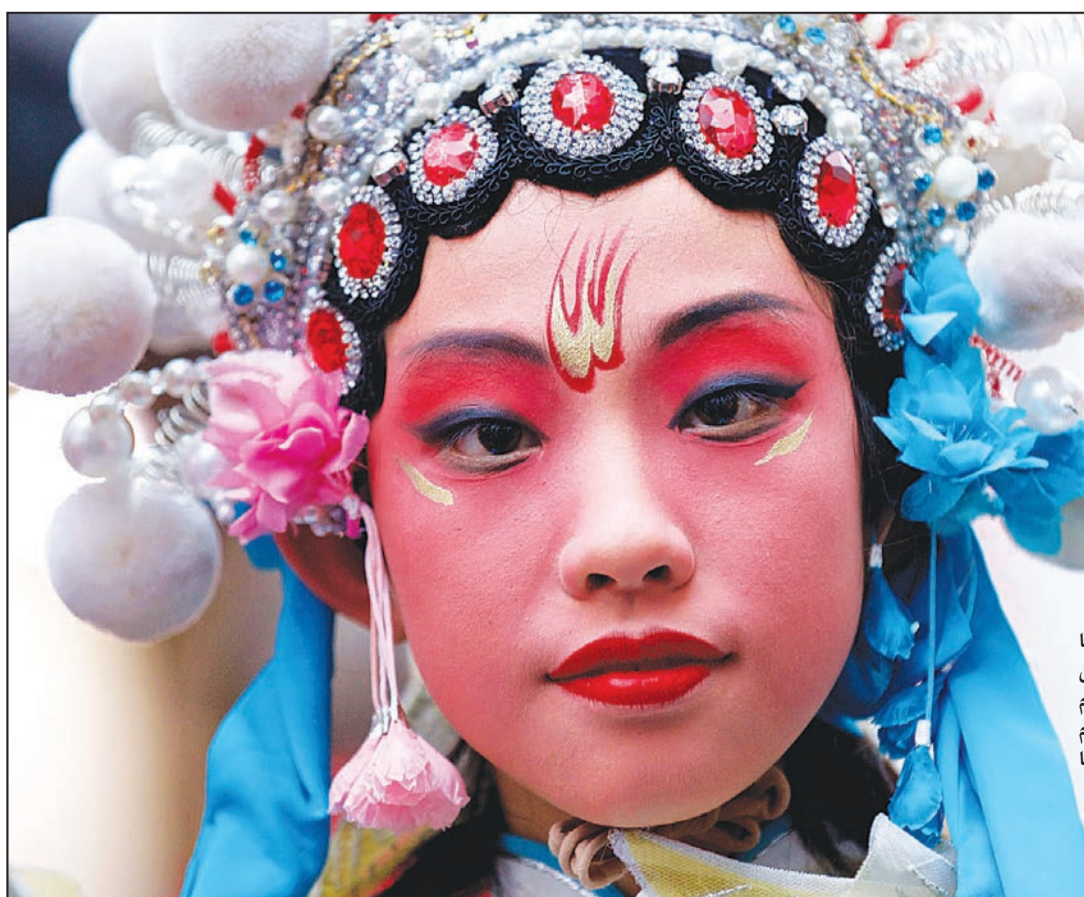
الصينيون في بريطانيا احتفلوا أمس في العاصمة لندن بالعام الصيني الجديد «عام الحسان» بارتداء ملابسهم التقليدية في حي الصين «شانجا تاون».

● النجم المصري يحيى الفخراني يتعرض لتجارة السلاح ومافيا المخدرات ضمن أحداث مسلسله الجديد «هشة» الذي يصور حالياً عددا من مشاهده الخاصة بالمطارات في الصحراء مع تجار السلاح في منطقة أورو راوش، والمسلسل