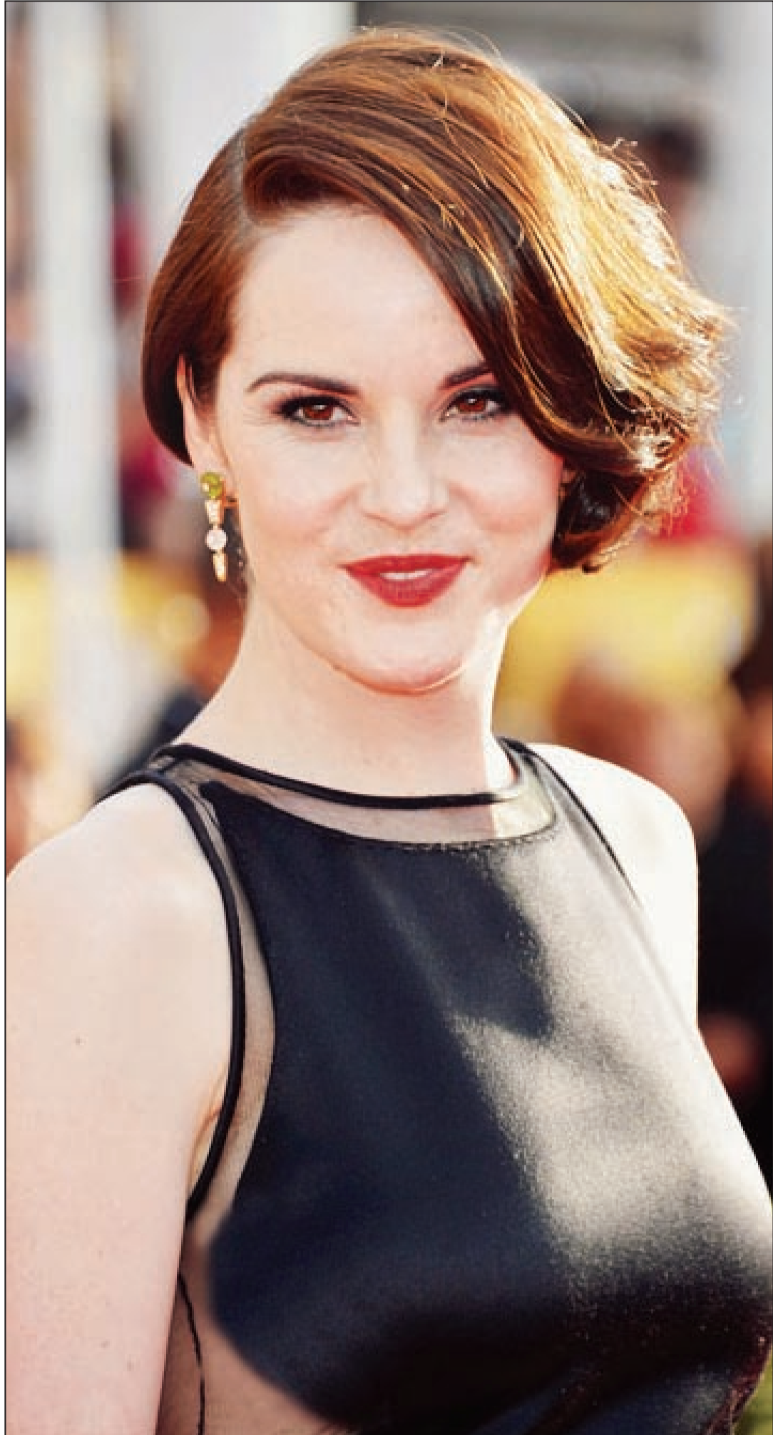
النجمة السينمائية «ميشيل دوكرى» حضرت حفل الترويج لفيلم «بلا توفق» في العاصمة البريطانية لندن أمس بصحبة النجمة «جوليان مور».

■ غريفيل - يو بي اي: قتل 9 أفراد من أسرة واحدة بحريق شب الخميس، في إحدى المنازل السكنية بغرب ولاية كنتاكي الأمريكية. ونقلت شبكة (سي إن إن) الأمريكية عن الطبيب الشرعي في مقاطعة موهنبرغ، توني أرمور، قوله إنه تم انتشال 9 جثث حتى الساعة من المنزل الريفى الذي شُيّد فيه الحريق في غريفيل، في حين تم إنقاذ ثنائي و9 أطفال تتراوح أعمارهم بين الرابعة والخامسة عشرة من العمر. ورجح أرمور مقتل 4 أفراد آخرين من الأسرة، مشيراً إلى أن والد الأطفال وأحدهم نقل إلى مستشفى ناشفيل بولاية تينيسي، وهما يعانين من حروق بليغة.