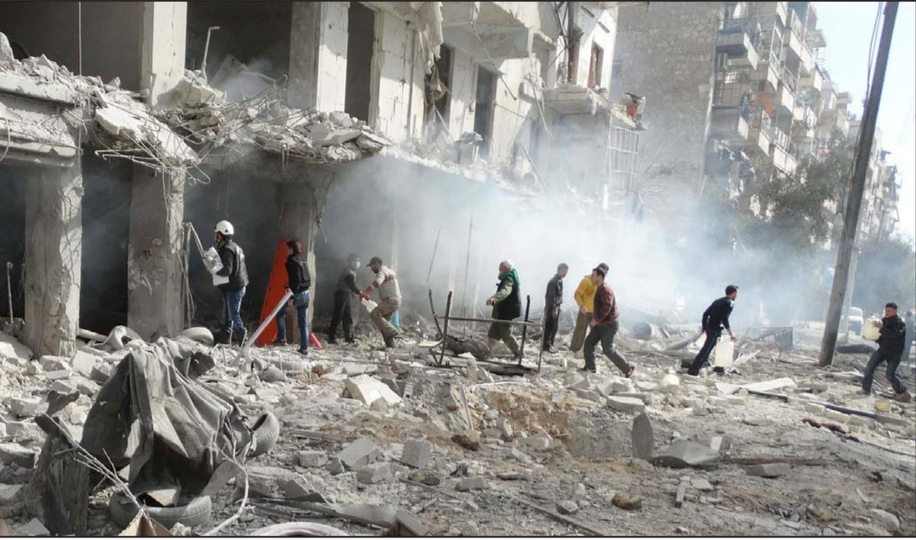
سوريون يتفقدون آثار الدمار في حماة

سوريا، لافتاً إلى وجود خلاف مع النظام السوري حول «جنيف 1» وبنوده، وقال صافي للصحافيين في جنيف بعد انتهاء الجلسة الصباحية من المفاوضات الجارية بين المعارضة السورية والنظام، «هناك خلاف كبير بيننا وبين النظام حول جنيف 1 وبنوده»، مشدداً على أنه «لا يمكن المضي في النقاط الأمنية باتفاق جنيف 1 قبل إنهاء موضوع الهيئة الانتقالية». وأضاف أن الائتلاف يتجنب أي موضوع في الحوار «مخالف لهيئة الحكم الانتقالي»، وقال إن «النظام يتجنب أي حوار حول الجرائم ضد الإنسانية»، واتهمه بتصعيد القتل في سوريا، وقال صافي إن الحكومة السورية «لا تريد أن توقف العنف وتريد أن تبقى على رأس النظام». ولم تعقد امس جلسات سائبة للمفاوضين، وتنتهي المرحلة الأولى من المفاوضات في جنيف اليوم الجمعة، وقال الإبراهيمي إنها لم تحرز تقدماً ملموساً تستأنف هذه المفاوضات بعد أسبوع، إلى ذلك أقال المرصد السوري لحقوق الإنسان بيان الطيران المروحي قصف بالبرميل المتفجرة منطقة واقعة بين حمص وحماة وعسكراً والقاطري في منطقة حرم الصباغ بحمص الجبسي في مدينة حلب شمال سورية، وذكر المرصد، في بيان امس الخميس أن الطيران الحربي شن غارة جوية على