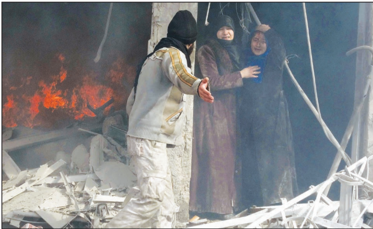
رجل يشير لسيدتين سوريين الى الطريق لمغادرة المبنى بعد هجوم لقوات النظام السوري في حلب امس