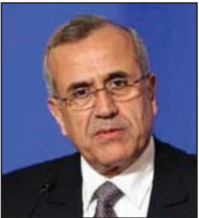
رئيس الجمهورية العماد ميشال سليمان

الإسرائيلية «خرقة فاضحاً للقرار 1701 على المستوى السياسي والدولي، وانتهكاً صارخاً للمبادئ الإنسانية وحقوق الإنسان في العيش بطمأنينة وأمان وفقاً للإعلان العالمي لحقوق الإنسان»، وأنها «موقف إسرائيلي يرسّم المجتمع الدولي والأمم المتحدة من زاوية بث الشعور بعدم الاستقرار للمواطنين اللبنانيين الأمر الذي يريده العدو المغتبط من الإضطراب القائم على الساحة العربية»، وجاء موقف الرئيس اللبناني غداة اجتماعه بوزير الدفاع الوطني في حكومة تصريف الأعمال فايز عصفور حيث جرى عرض للاوضاع المرهقة وبرامج الحاجات الأولية للجنش تنفيذاً للمساعدة الإستثنائية السعودية للجنش للترؤة بأسلحة فرنسية.