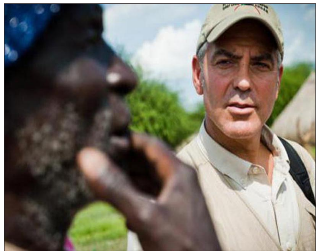
جورج كلوني في السودان