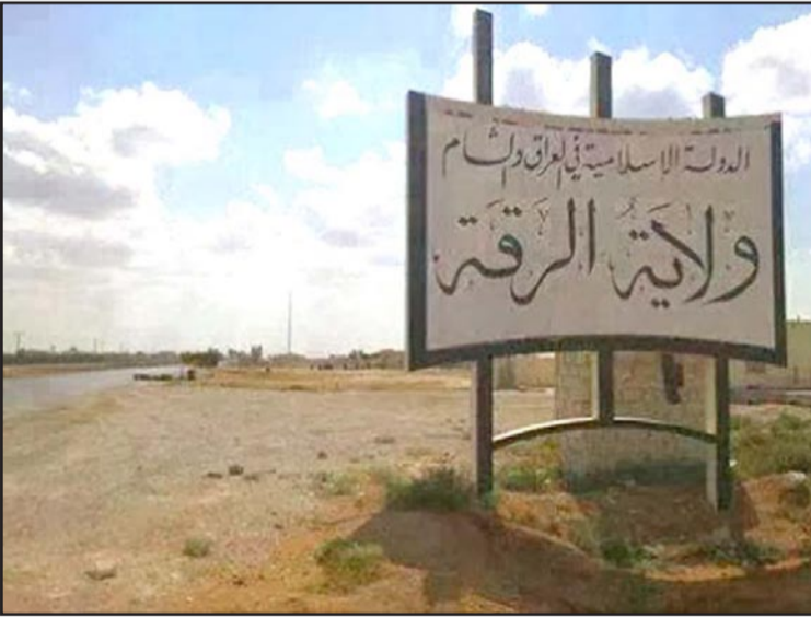
مدخل مدينة الرقة بعد استيلاء «داعش» عليها

الجزء الأول: «قصة الصراع بين النصرة والدولة الإسلامية» القدس العربي: تروي أسباب سقوط الرقة بشكل مفاجئ بيد الدولة الإسلامية العلاقة بين جبهة النصرة و«داعش» في المدينة... من حلف متين إلى حرب لا تين