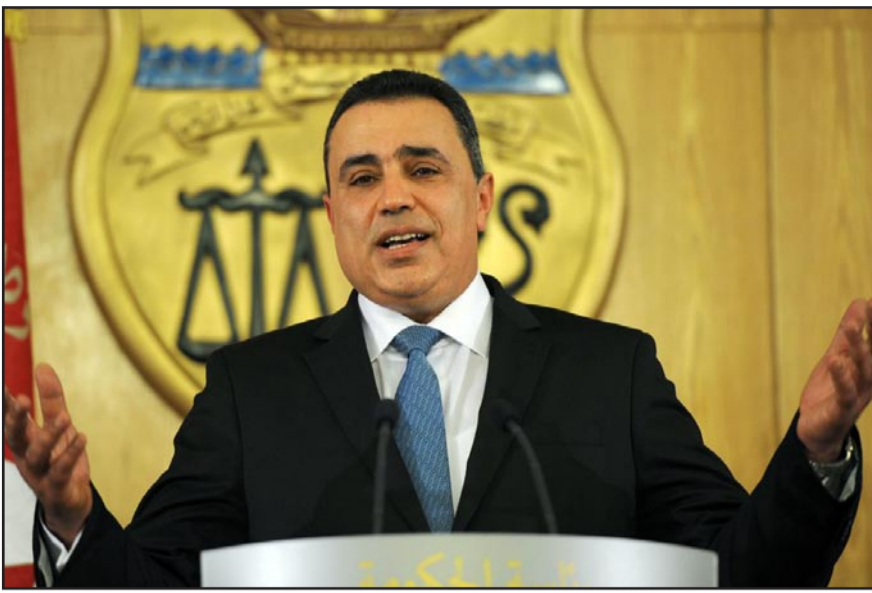
حكومة مهدي جمعة تواجه تحديات كبيرة

بعد يومين من تهنئته لتونس بمناسبة المصادقة على دستور الجمهورية الثانية، فيما أعلن صندوق النقد الدولي انه وافق على منح تونس القسم الثاني (506 ملايين دولار) لمساعدة تونس على تمويل عدد من مشاريع التنمية الاقتصادية في البلاد.