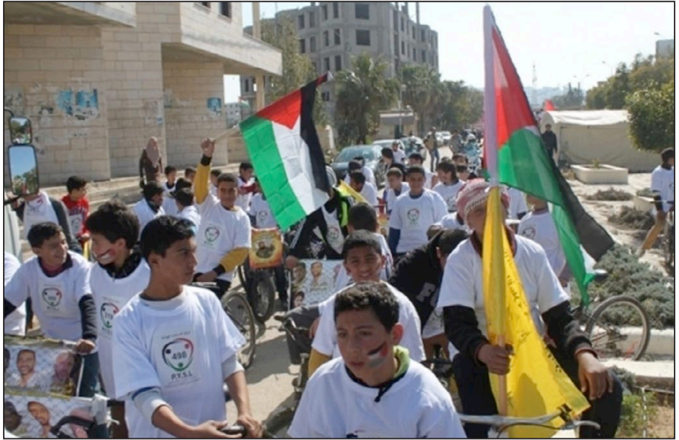
جانب من ماراتون سابق في جنين

رام الله - يو بي آي: فضت قوات الجيش والشرطة الإسرائيلية، الجمعة، ماراتونا فلسطينيا في القدس، فيما فرضت قيودا على وصول المصلين إلى المسجد الأقصى في المدينة. وقالت وسائل إعلام محلية، إن قوات إسرائيلية تدخلت وفضت بالقوة الماراتون الفلسطيني، الذي شارك فيه عشرات المقدسيين بينهم أطفال من قرية العيسوية بالقدس، واعتقلت أربعة من المشاركين واعتدت على آخرين بالضرب. وكان عشرات الفلسطينيين تجمعوا في العيسوية ورفعوا العلم الفلسطيني وارتدوا قمصانا كتب عليها ماراتون القدس الثالث من أجل عروبة القدس، في خطوة موازية لماراثون رياضي إسرائيلي بالقدس. وكانت القوات الإسرائيلية أغلقت كافة مداخل البلدة القديمة من القدس، ضمن إجراءاتها لتأمين «الماراثون» الإسرائيلي الذي انطلق عند الساعة من صباح الجمعة ويستمر حتى الواحدة والنصف ظهرا، بمشاركة حوالي 20 ألف عداء من 54 دولة حول العالم. في غضون ذلك، فرض الجيش الإسرائيلي العيسوية ورفعوا العلم الفلسطيني وارتدوا قمصانا كتب عليها ماراتون القدس الثالث من أجل عروبة القدس، في خطوة موازية لماراثون رياضي إسرائيلي بالقدس. وكانت القوات الإسرائيلية أغلقت كافة مداخل البلدة القديمة من القدس، ضمن إجراءاتها لتأمين «الماراثون» الإسرائيلي الذي انطلق عند الساعة من صباح الجمعة ويستمر حتى الواحدة والنصف ظهرا، بمشاركة حوالي 20 ألف عداء من 54 دولة حول العالم. في غضون ذلك، فرض الجيش الإسرائيلي