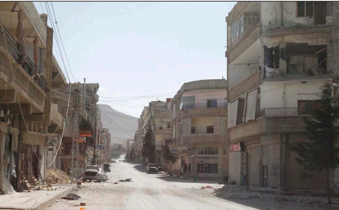
أحد شوارع منطقة بيروود في ريف دمشق وقد خلا من سكانه

وأضافت الوكالة أن ياسين وكازالي كانا يعبران طريقاً وعره غير شرعية من الأراضي اللبنانية إلى الداخل السوري فوقعا في أحد الكمان حيث أطلقت النار عليهما وقتلا على الفور.