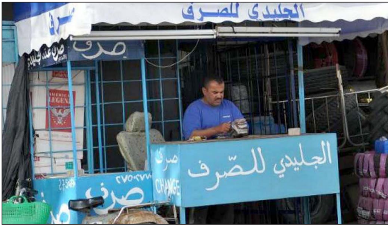
محل صرافة في شارع الصرف في بن قردان

وحول التأثير السلبي لحجم المبادلات في هذه السوق على الدولة، قال رفيق جراي إن لهذه السوق تأثير سلبي من حيث أن الدولة تكون محرومة من الأداءات التي قد تدخل إلى حساب الميزانية التونسية من وراء هذه المعاملات، والتي تكون التجارة الخارجية أهم العوامل المحركة فيها. وأضاف أن أغلب التجار عندما يستوردون بضاعة من الخارج مثل الصين أو تركيا، يكونون مجبرين على كشف حساباتهم عند الهياكل الدوائية في البلاد، ولكن أغلبهم لا يقوم بعملية الكشف إلا عن نسبة 20 بالمئة من الأموال، ويقومون بتصريف الباشة من العملة البنكية في الأسواق الموازية ومنها سوق بن قردان.