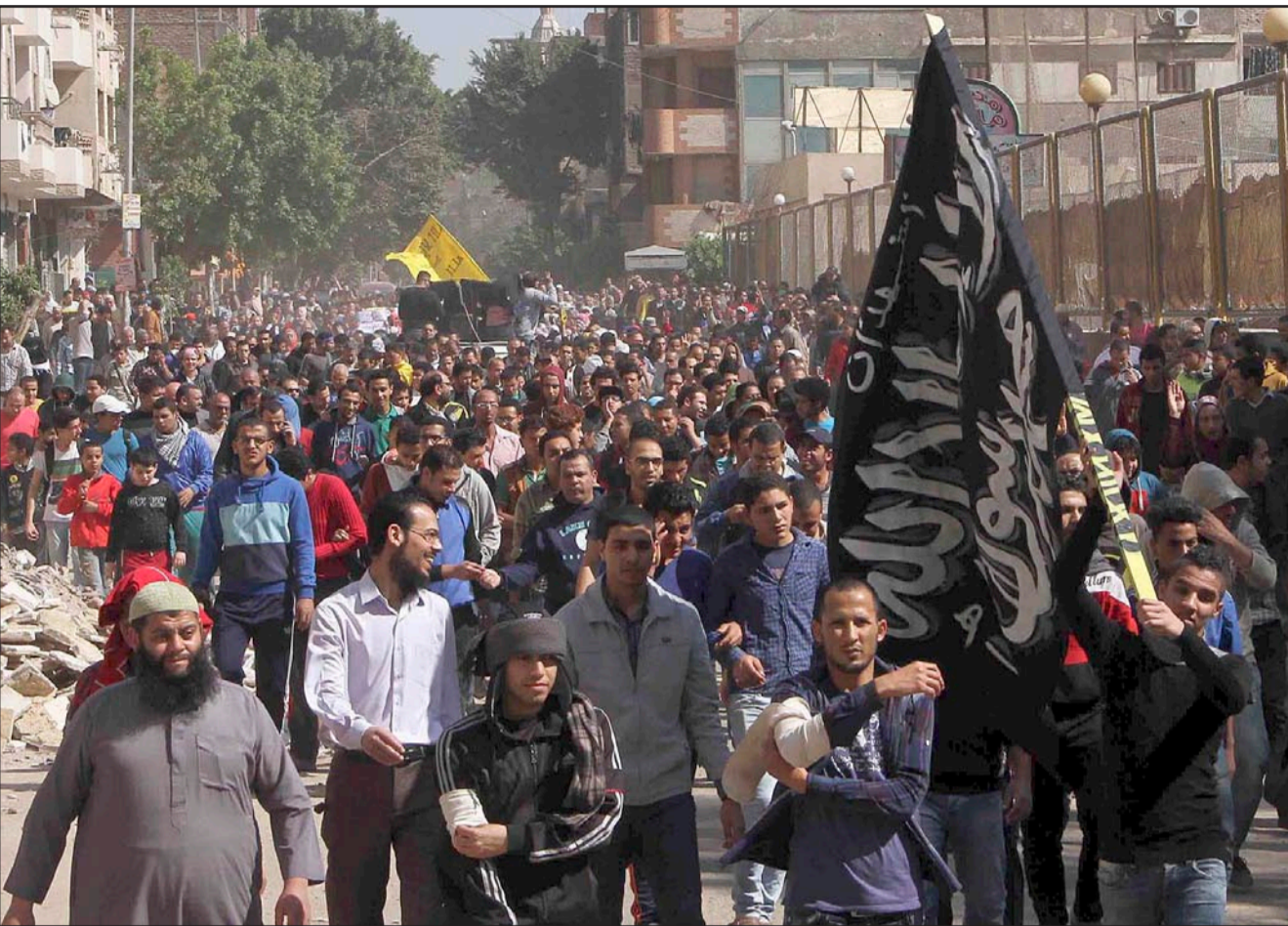
مظاهرة لأنصار الاخوان في القاهرة الجمعة

فيما أضرم مجهولون النار في سيارة تابعة للشرطة بمنطقة الهرم بالجيزة، المناهضة للحفاظة الأثرية، خلال مسيرة لأنصار مرسي. وقال شهود عيان إن الطريق يسارع الهرم ولم يكن بها أحد من قوات الأمن.