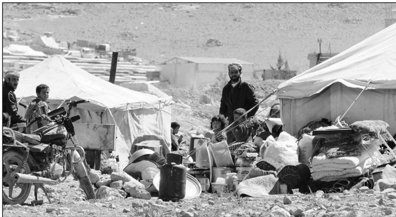
لاجئون سوريون فروا من القتال في بيروود ولجأوا إلى منطقة عرسال اللبنانية

استهدفت مبانٍ يتركز فيها عناصر الشبيحة داخل مدينة كسب. وقال قائد المعارضة على مدينة كسب، إن عمليات لـ«القدس العربي» فضل عدم ذكر اسمه، إن عمليات لـ«القدس العربي» التي بدأت صباح الجمعة «مستمرة ولا عودة فيها حتى تحرير مدينة كسب بأكملها». وسيطر المعارضة على مخفر نبع المر دون مقاومة ومخفر الصخرة بالتزامن مع اشتباكات على مرصد 45 وقسطل معاف وهما يشرفان بشكل مباشر على كسب المدينة والطريق الواصل إليها، وفي حال سيطرت المعارضة على مدينة كسب تكون امتلكت شريطاً ساحلياً بطول 10 كم. وفي حال أحكمت المعارضة سيطرتها على معبر كسب ستصلح كل المعابر الحدودية بين سوريا وتركيا خارج سيطرة دمشق. وسيطر مقاتلو المعارضة السورية على نحو 40 دبابة، والكتائب التي شاركت في معركة «الأنفال»، هي كتائب أنصار الشام من الجبهة الإسلامية وحركة شام الإسلام وجبهة النصرة وقوات الجيش الحر «حرار جبلة، نصرة المظلوم» وكتائب أخرى. ويقول شاهد عيان من مدينة اللاذقية لـ«القدس العربي»، إن المناطق السننية في مدينة اللاذقية تشهد