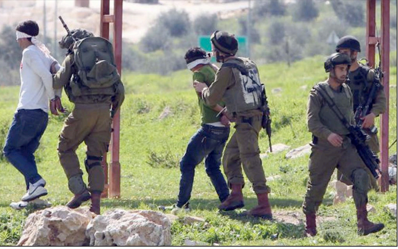
جنود إسرائيليون يعقلون أطفالاً فلسطينيين في الضفة