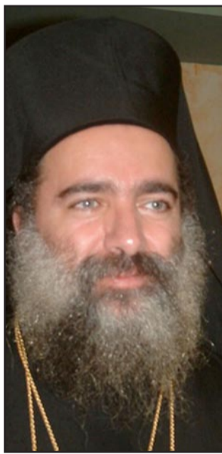
المطران عطا الله حنا

رام الله - «القدس العربي» من وليد عوض: لم تكن «مراده» التي تقطن في إحدى القرى شرق بيت لحم جنوب الضفة الغربية، مرتدة ما يجري حولها بعد الساعة الثامنة والنصف ليلا، حيث العديد من الآليات العسكرية الإسرائيلية تصل إلى المنطقة والعشرات من جنود الاحتلال الإسرائيلي ينتشرون بين منازل المواطنين وتعالى أصواتهم. وفي حين كانت ترتجف خوفا وهي في فراشها، دوى صوت انفجار، فإذا باب منزلها يسقط إلى الداخل والعديد من الجنود يقتحمون منزلها ولم يبق وقت سوى دقائق معدودة حتى اقتحموا منزلها. وسلطت حالة من الخوف والذهول مما يجري، وما إن تماثلت نفسها ونهضت من الفراش وهي ترتعد خوفا، وإذا بضابط من جيش الاحتلال وبرفقته العديد من الجنود المدججين بالسلاح، يسألها عن أبنائها مراد البالغ من العمر 15 عاما، وهناك شعرت بأنها بدأت تستعيد توازنها كون الخيط القادم من الخارج يستهدف ابنها النائم في الغرفة برفقة أشقائه الأصغر منه سنا، وسالت «شو بدك فيه؟» -«لماذا تريد» فرد الضابط زويد اعتقاله، وهنا حاولت أن تمنع جنود الاحتلال من الوصول إليها إلا أن محاولاتها باءت بالفشل بعد أن دفعها أحد جنود الاحتلال وأوقعها على الأرض في ظل استيلاء الأطفال وشروعهم بالصراخ والبكاء خوفا من الجنود الذين كان معظمهم يموهون وجوههم بمادة سوداء اللون. وفي حين انقضت ثلاثون دقيقة على الطفل مراد وسط صراخ أشقائه الأربعة جلست أم مراد على الأرض منهارة من الخوف على ابنها في حين يتعالى صراخ الأطفال على وقع أصوات الجنود الذين بدأوا بالانسحاب من المنزل الذي فجروا بابه الرئيسي فلسطينيين..