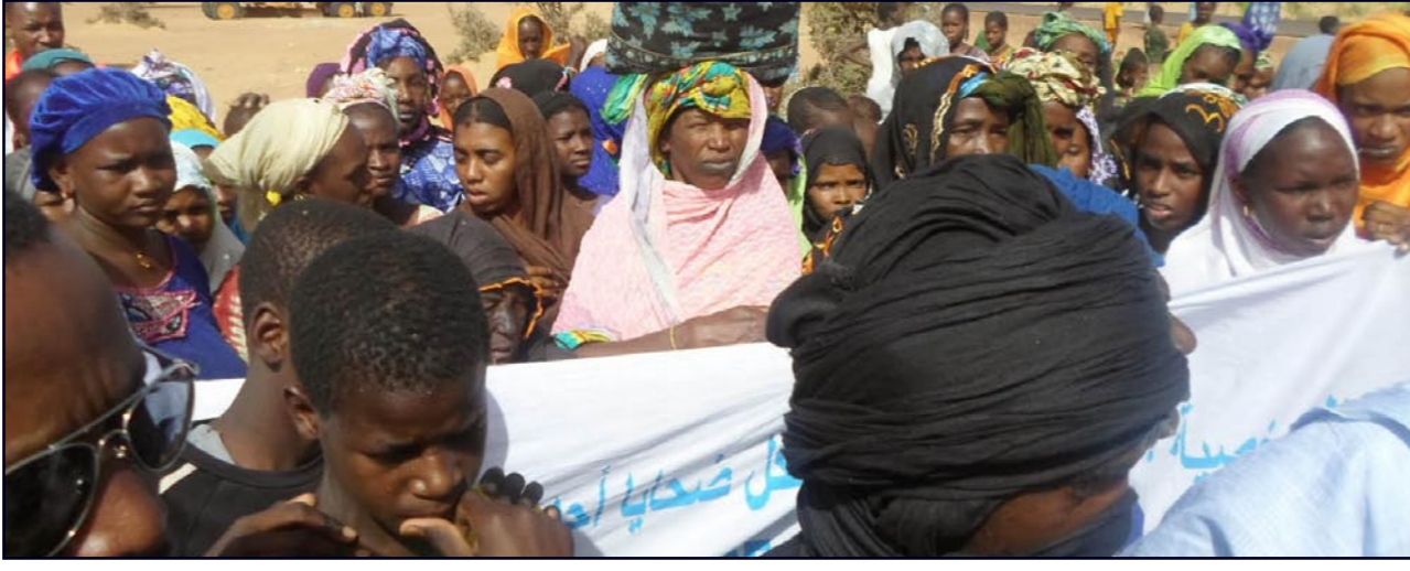
جانب من تظاهرة الزوجين المرحلين

نواكشوط - «القدس العربي» من عبدالله مولود: استنكرت أحزاب سياسية موريتانية أمس في بيانات وتصريحات ما سمته «التعامل القاسي لقوات مسلحة مشاركين في مسيرة راجلة تضفي زواج عاقدون من اللجوء في السغال للمطالبة بحقوق».