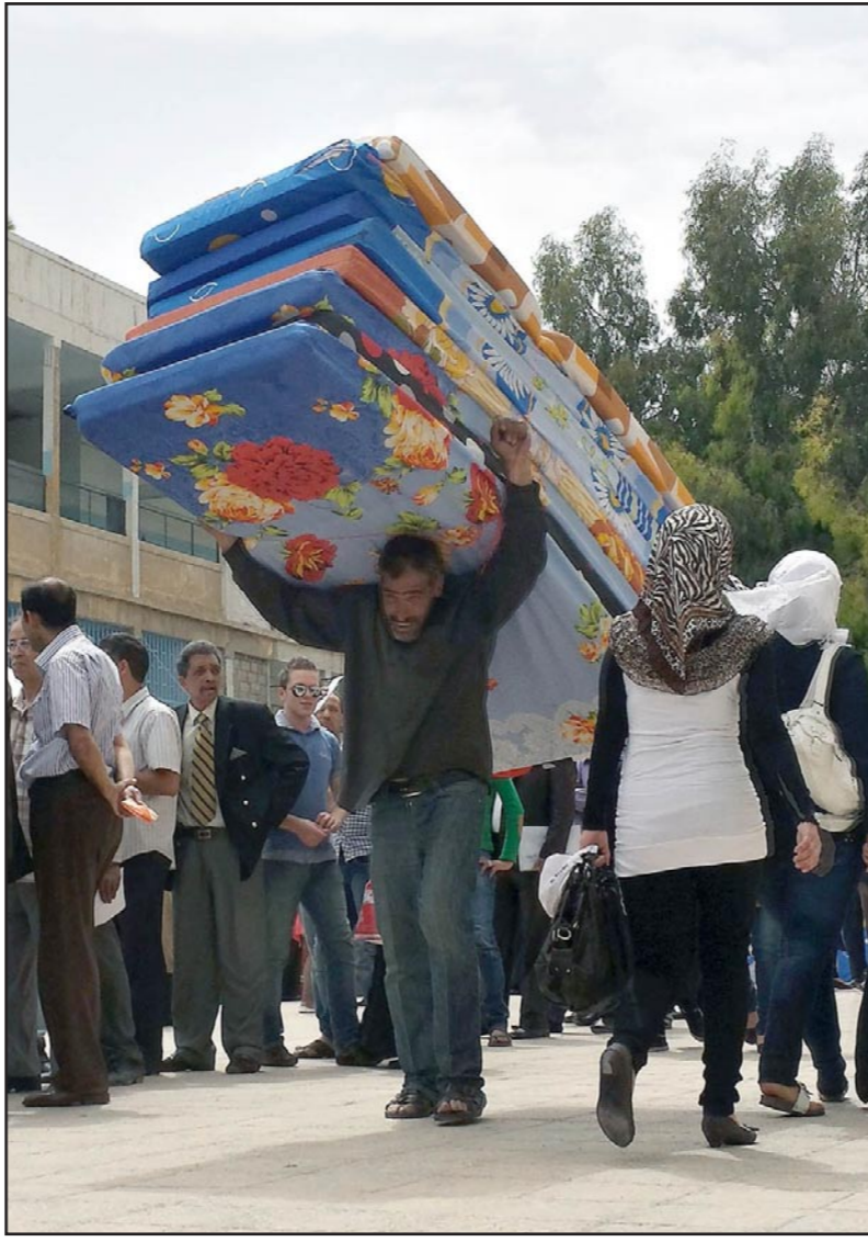
لاجئ فلسطيني بعد استلامه لمساعدات «الأونروا»

وناقش هاس المفهوم الذي ساد الإدارة الأمريكية الحالية وهو إعادة تشكيل السياسة الخارجية الأمريكية بتركيز أقل على الشرق الأوسط والتوجه نحو آسيا خاصة أن الولايات المتحدة لديها مصالح كبيرة في منطقة آسيا ومنطقة المحيط الهادي. ويرى الكاتب إن منطقة الشرق الأوسط لن تؤثر كثيرا على مستقبل العالم إن أخذنا بعين الاعتبار غياب القوى الكبرى فيه، لكن أدوات السياسة الأمريكية عادة ما تكون غير ناجحة عندما تحاول إعادة تشكيل السياسة العالمية، أي أن أمريكا في وضع جيد لتشكيل سياسات الحكومات خارج حدود بلادها أكثر من تصرفاتها ضمن حدودها الجغرافية، وإذا كانت تسيطر على منطقة الشرق الأوسط فستسيطر على العالم.