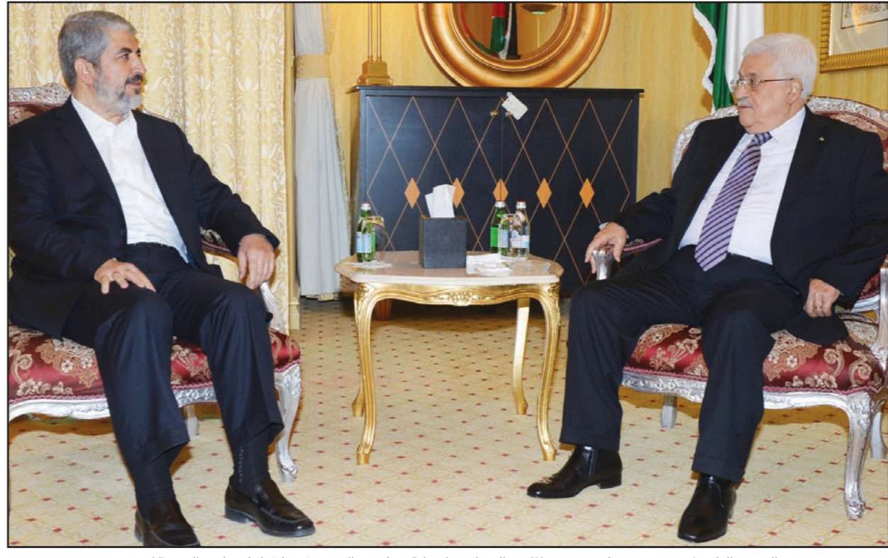
الرئيس الفلسطيني محمود عباس ورئيس المكتب السياسي لحركة حماس خالد مشعل خلال لقائهما في الدوحة أمس

الدوحة - «القدس العربي» من سليمان حاج إبراهيم: