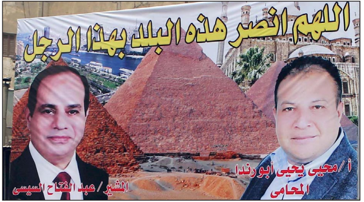
لاقعة انتخابية مؤيدة للمشير السيسي في القاهرة