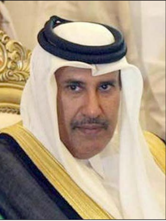
الشيخ حمد بن جاسم

دريم بإرتفاع نسبتته 0.4% مقارنة بالفصل الأول من 2013، فيما بلغ رقم الأعمال نهاية 2013 حوالي 2.5 مليار يورو، منخفضا بنسبة 4.3% بسبب إنخفاض تسعيرة مكالمات المحمول. وحققت فروع شركة إتصالات المغرب الدولية (موريتانيا-الغابون-مالي-بوركينافاسو) التي أعلن مديرها عبد السلام أحيوزون عن رغبة المجموعة في تطويرها، نموا جيدا في رقم أعمالها بنهاية 2013، بنسبة بلغت 9.5%، أي ما يفوق 700 مليون يورو.