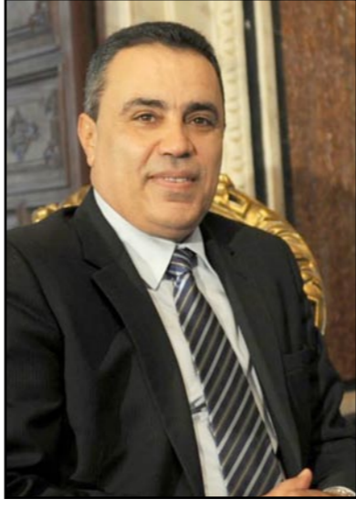
جمعة تصدو المرشحين في استطلاعات الرأي

تونس - د ب أ: أعلنت وزارة الدفاع التونسية أمس الاثنين مقتل شخصين وفرار آخر برصاص الجيش في المنطقة العسكرية المغلقة بجبل الشعائبي غرب البلاد.