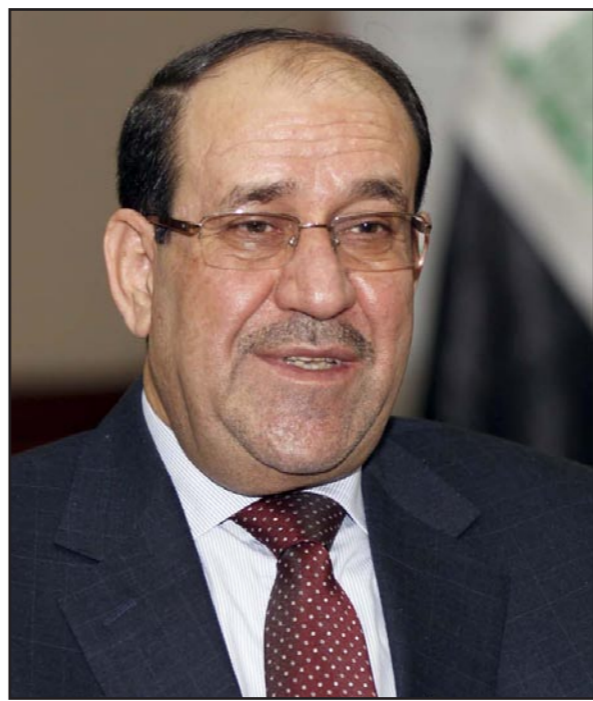
رئيس الوزراء العراقي نوري المالكي