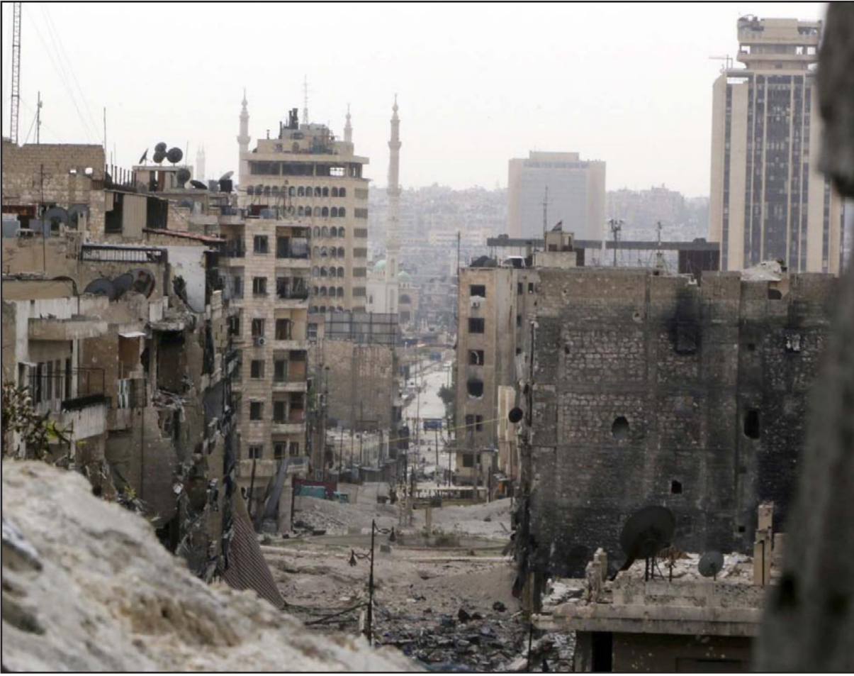
بتايات مدمرة في شارع السبع بحرات في حلب القديمة