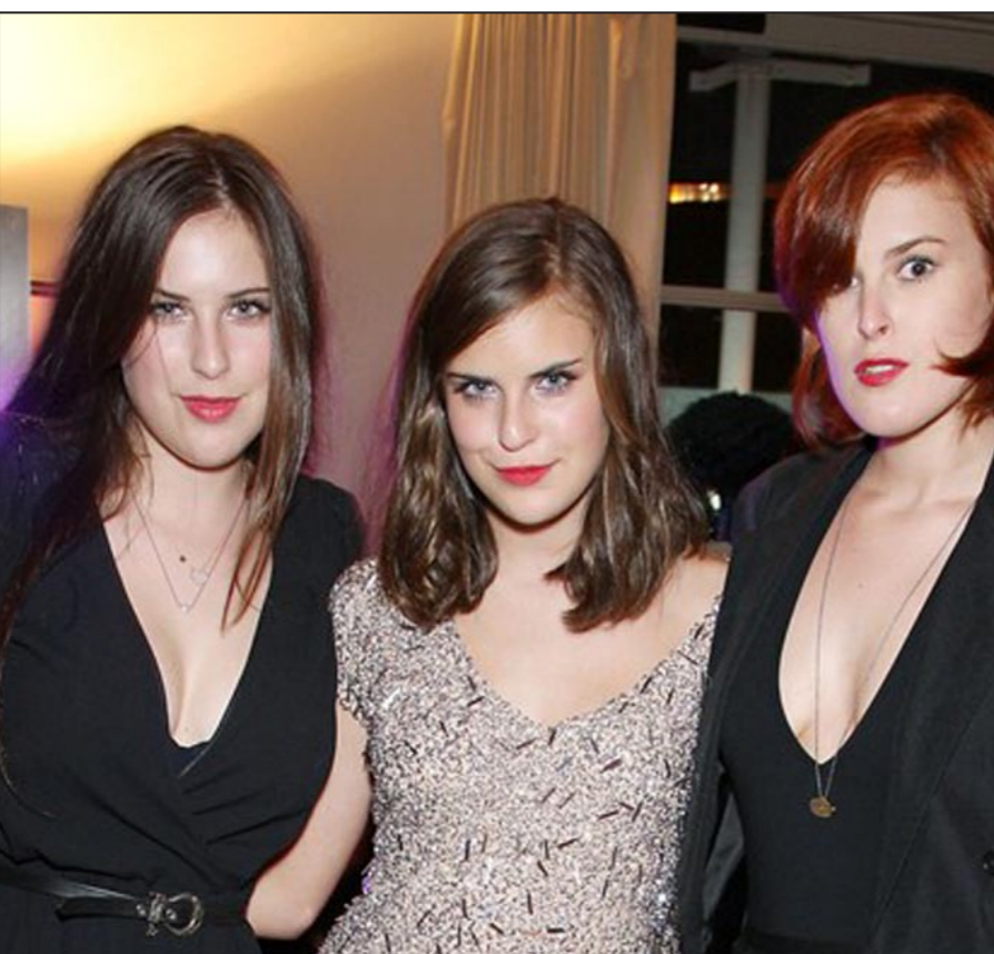
بنات بروس ويلز

لوس أنجليس - د ب أ: أمر النجم الأمريكي بروس ويلز بناتِه بالاحتشام وارتداء المزيد من الملابس، وذلك بعد رؤيتهن مؤخرًا في حفل فني وهن يرتدين ملابس كاشفة لأجزاء كبيرة من أجسادهن.