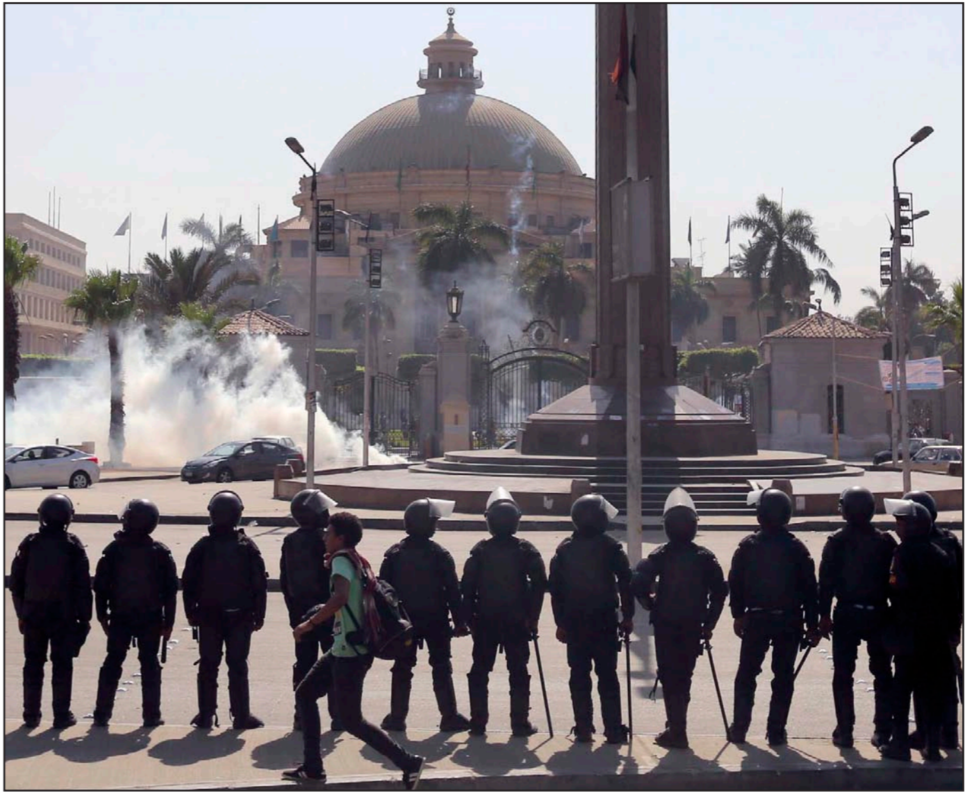
عناصر من الشرطة المصرية أمام جامعة القاهرة خلال تظاهرة قام بها الطلاب المؤيدين لجماعة الإخوان المسلمين

وأكدت حملة صباحي أنها تتعرض لسياسيين من المشائعات كان آخرها «ما قاله أحد مقدمي البرامج الذي اتخذ من برنامجها، منصة لإطلاق الأكاذيب حول مرشحنا، وزعم أن والد صباحي أقام دعوى قضائية تطالبه بتفكك، والأمر المثير للسخرية، أن من زعم ذلك تحدث عن أن تاريخ الدعوى جاء بعد وفاة والد الصباحي بـعشر سنوات». ووصفت الحملة، بأن ترويج قيام صباحي يمثل هذه الزيارة إنما يأتي ضمن سلسلة شائعات يشتنها عدد من معارضيه، ولا علاقة لها بالواقع، وهي تهدف للتأثير على صورة المرشح الرئاسي في عيون الجماهير. وأضافت أن ما يحدث من حملات ممنهجة لتشويه صباحي يعد تدبيراً أخلاقياً، خاصة أنها أخبار ليست لها علاقة بالواقع.