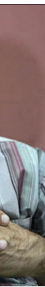
علي جعفر العلاق

أما اللقطة الثالثة التي تستغل في تواز ثلاثي مع اللقطتين السابقتين فإن كاميرا التصوير الشعري تتجه نحو الزمن في فصل طبيعي من مفاصله، لئلا تلتقط عدسة الكاميرا زاوية تصويرية حادة في لحظة خاضة لا تتكرر كثيراً: يتكسر في الليل أرق جريح بعد هذا التصوير البانورامي للمحيط الشعريّ تشرع كاميرا المصورّ الشعريّ باتوجّه نحو البؤرة الشعرية، وتتسلط كاميرا التصوير على الموضوع بتجلياته الطبيعية والتاريخية والروؤية: شاعر يتقدّم أو جاعل، وضوء عكازه مهرة، وذراعاه ليلى فسيح.. تتجه عدسة الكاميرا مباشرة إلى الصفة (شاعر) وهي تحيل على شاعر يعينه هو (رشدّي العامل) بدلالة عتبة الإهداء، ثم تتحرّف الكاميرا باتجاه تصوير حالة شعرية فضاءية يكون هذا الشاعر فيها قائداً لرهط الشعراء في أوجاعهم، وتنتهي كاميرا التصوير إلى السؤال الشعريّ الاختتامي: من سيجمع شمل أشعته: جسد ياسين، أم ضريح؟