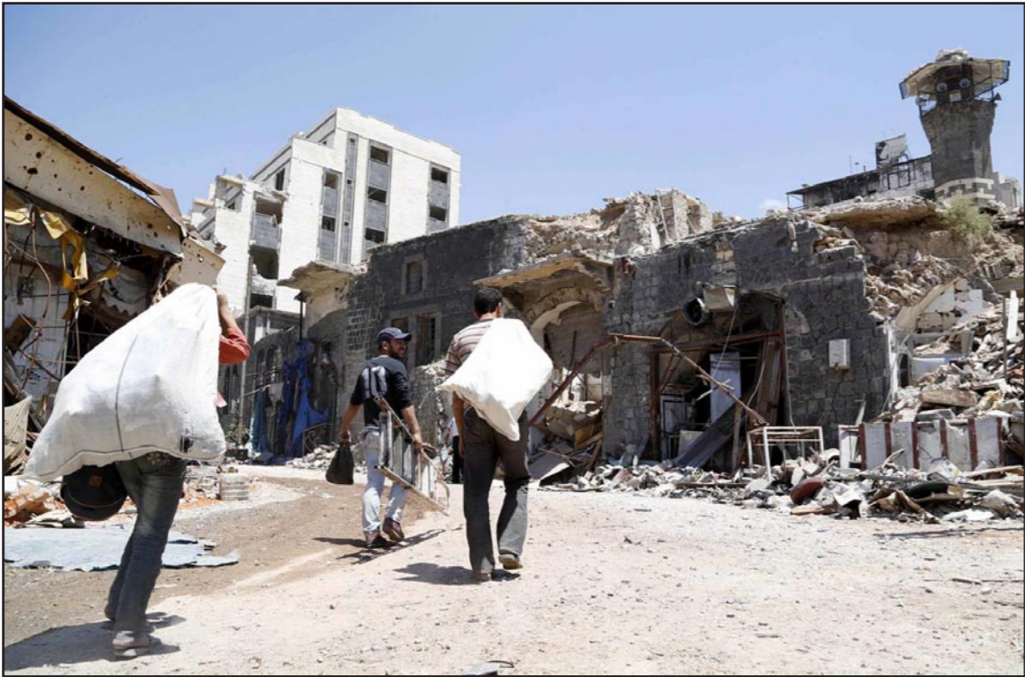
سوريون يسيرون في احد شوارع حمص المدمرة

على مراحل، مقابل الإفراج عن 1500 معتقل لدى الجهات الرسمية. وأوضح أن تنفيذ الاتفاق بالكامل قد يأخذ وقتاً لأن أسماء الموقوفين الذين من المقرر الإفراج عنهم «تحتاج إلى دراسة من الجهات المختصة». ولقت رئيس اللجنة إلى أنه بعد الانتهاء من اتفاق الهدنة في عدا العمالية سيتم إنجاز اتفاق مماثل في مدينة دوما بريف دمشق، مشيراً إلى أن الاتفاق ينص على الإفراج عن 3 ضباط أسرى من الجيش النظامي في المدينة التي تسيطر عليها قوات المعارضة مقابل الإفراج عن معتقلين من سكانها، لم يحدد عددهم. من جهة أخرى، قال عيسى إنه تم، أمس الأول، إطلاق سراح 20 ألفاً من المدنيين في «مخطفين» لدى قوات المعارضة في محافظة القنيطرة جنوبي سوريا مقابل الإفراج عن 12 موقوفاً لدى النظام.