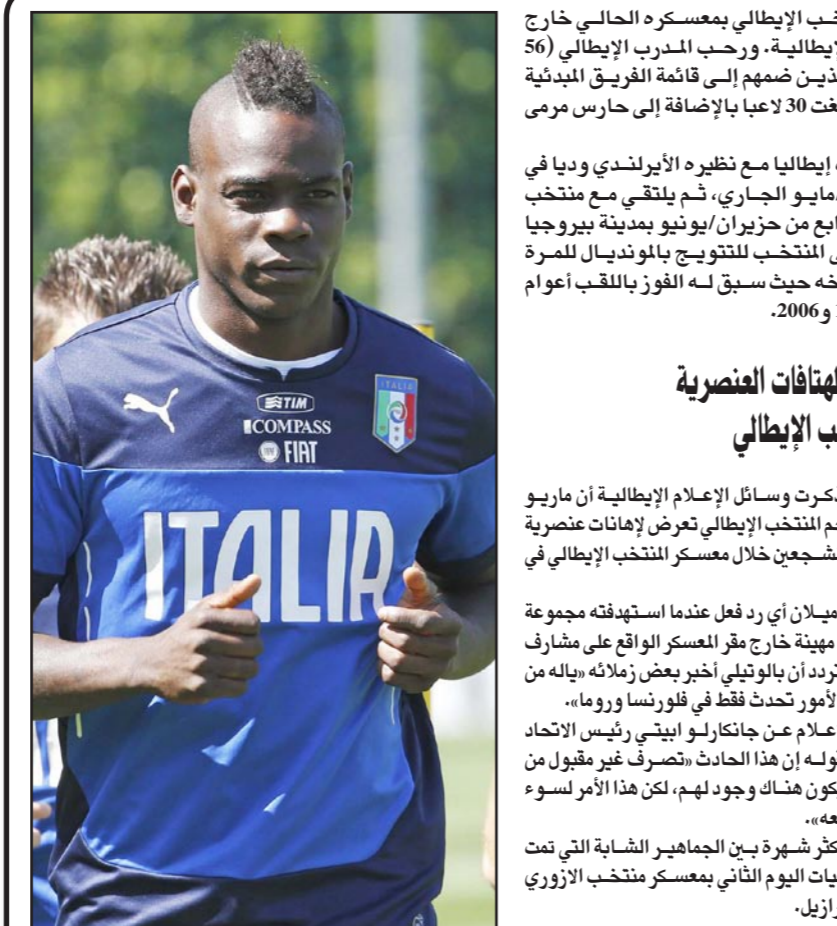
التي أجراها المنتخب الإيطالي بمسكره الحالي خارج مدينة فلورنسا الإيطالية. ورحب المدرب الإيطالي (56 عاماً) باللاعبين الذين ضمهم إلى قائمة الفريق المبدئية للمونديال والتي بلغت 30 لاعباً بالإضافة إلى حارس رمى احتياطي.

■ مانشستر - الأناضول: ذكرت صحيفة «إسبورث» الإسبانية أن إنريكي في غض ضمن أولوياته التعاقده مع 6 جدد بداية من الموسم المقبل. وأضافت الصحيفة، أن البرازيليين ماركينوس وديفيد لويغ والكولومبي خوان كواردادو والشيفر أرتورو فيدال والمهاجم الإسباني فيرناندو يورينتس بالإضافة إلى الحارس الأرحنتيني وبلي كاباييرو بيرزون على لائحة إنريكي للثلاثاء. وأعلن نادي برشلونة أمس الإثنين، عن تعاقده مع إنريكي لتدريب الفريق لمدة موسمين أي حتى يونيو/حزيران 2016. ■ الأناضول: ذكرت صحيفة «دايلي ميل» البريطانية أن الهولندي لويس فان غال المدرب الجديد لمانشستر يونايتد وضع قائمة من اللاعبين ضمن أولوياته استعداداً للموسم الجديد. وأضافت الصحيفة، أن القائمة ضمت 7 لاعبين في مقدمتهم الإسباني سيسك فابريغاس (برشلونة) والهولندي آرين روبين والالمني توني كروس (بايرن ميونيخ) اللعب بداية من الموسم الجديد. وأوضح، أنه بخلاف اللاعبين الثلاثة فإن القائمة ضمت الألماني ماتس هامل (بروسيا دورتموند) وهولغر بادستوبر والكرواتي ماريو ماندزوكيتش (بايرن ميونيخ)، والإنكليزي لوك شو (ساوثهامبتون). وبحثت الصحيفة، فإن إدارة النادي سترصد مبلغ 200 مليون جنيه استرليني لدعم صفوف فريقه هذا الصيف، لحالولة التتويج بلقب الدوري الموسم المقبل، وكذلك مختلف البطولات التي سيشترك فيها. وتم التعاقد مع فان غال لمدة 3 مواسم، أي حتى يونيو/حزيران 2017. ■ من جهة أخرى اعترف نجم الوسط الإفريقي بايا توريه بأنه لا يعرف بالتحديد وجهة المقبلة، بعد أن صرح وكيل أعماله بأن اللاعب في طريقه