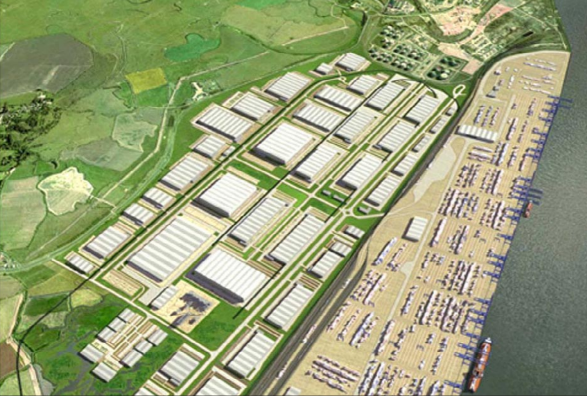
رسم تخطيطي لجانب من ميناء «لندن غيتواي»