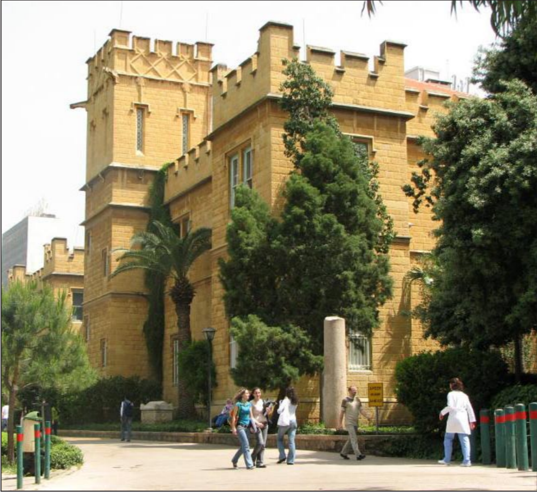
جانبا من الجامعة الأمريكية ببيروت