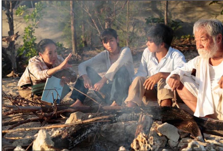
لقطة من فيلم «مياه راكدة»

وظهرت بطلته الممثلة الإيطالية الكبيرة صوفيا لورين التي تحل هذا العام كضيفة شرف بالمهرجان. وتعد صوفيا لورين من النجمات اللاتي دللن المهرجان بنيلها جائزة الأداء سنة 1961، ورئاستها لجنة التحكيم لسنة 1966، كما كانت بطلة ثمانية أفلام عرضت في مختلف المناسبات منذ 1955 الذي شهد أول ظهور لها بالمهرجان. (الأناضول)