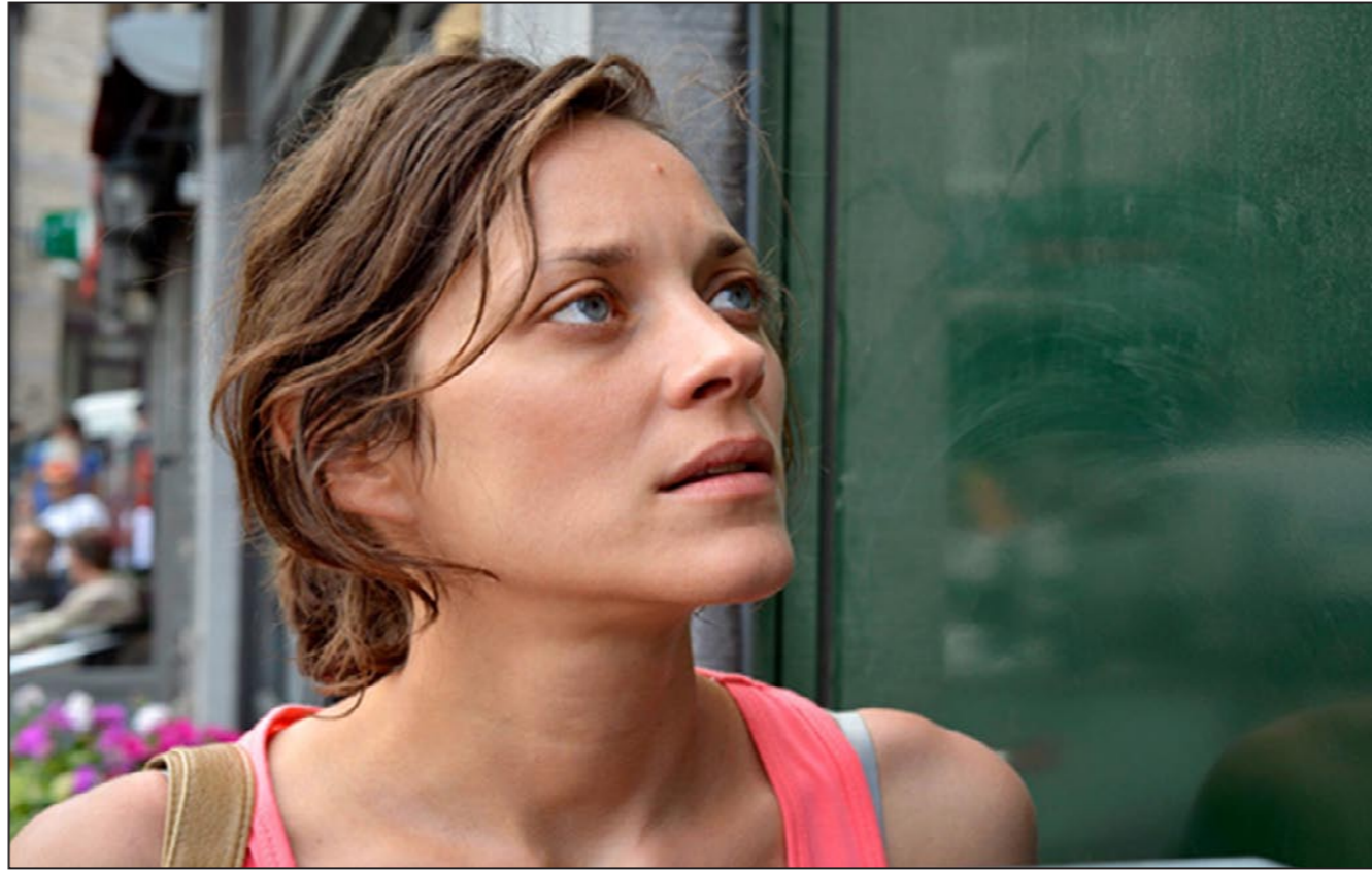
لقطة من فيلم «يومان وليلة»

كما شهد سابع أيام المهرجان مشاركة المخرج الصيني، «زانج يمو»، للمرة السادسة بالمسابقة الرسمية، لكن خارج المنافسة هذه المرة في فيلم «coming home» أو «العودة للوطن» والذي يعالج من خلاله الأثر النفسي للثورة الثقافية. واشتهر يمو، بأنه زعيم «الجيل الخامس» وهي مجموعة المخرجين الصينيين الذين ظهرت أعمالهم بعد الثورة الثقافية في بلادهم، وقد تأثروا بالموجة الجديدة في السينما.