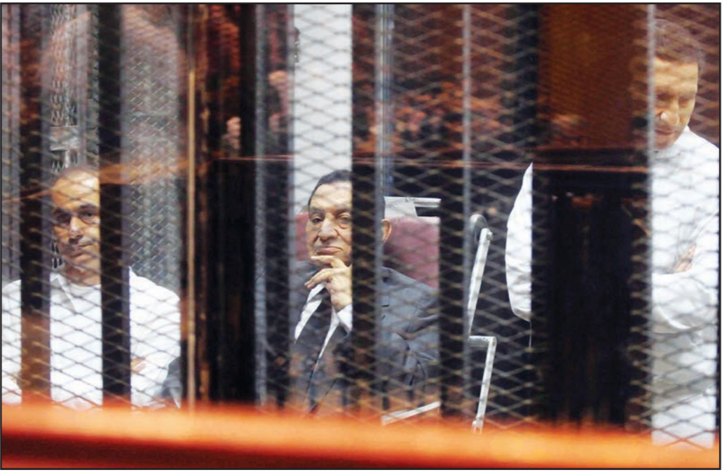
الرئيس المصري الخلووع حسني مبارك جالسا بين ولديه جمال وعلاء داخل القفص في اكااديمية الشرطة في القاهرة أمس

القاهرة - «القدس العربي» من علا سعدي: قضت محكمة جنايات القاهرة المتعددة باكاديمية الشرطة الأربعا بمعايقه الرئيس الخلووع محمد حسني مبارك بالسجن 3 سنوات مشددة، ومعايقه نجليه جمال وعلاء بالسجن المشد 4 سنوات، والزامهم برد مبلغ 21 مليوناً 125 مليون، وذلك في القضية المعروفة إعلامياً بـ«قصور الرئاسة» والمتهمين فيها بتسبيل الاستيلاء على مبلغ 125 مليون جنيه من ميزانية رئاسة الجمهورية، والتزوير في محركات رسمية كما نسب إليهم الإضرار بالعد بالمال العام.