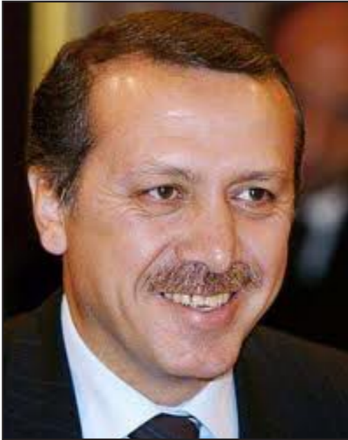
رئيس الوزراء التركي رجب طيب اردوغان

هل يهدد 300 عامل منجم ميت في سوما في تركيا احتمالات أن ينتخب رئيس وزراء تركيا رجب طيب اردوغان رئيسا، وأن يعمل بعد ذلك على توسيع صلاحياته كي يحول الرئاسة الى منصب الحكم الاعم في بلاده؟ قد يفعل مئات عمال مناجم الفحم الذين دفعوا حياتهم لقاء ظروف عمل المناجم غير المحتملة ما لم يفعله ضعف المعجزة الاقتصادية وما لم تفعله المظاهرات الضخمة. قبل اسبوعين فقط أثير مطلب اقامة لجنة فحص عن الوضع الامني المضعف لعمال المناجم في سوما، وكان الحزب الحاكم المغرور لاردوغان هو الذي ازاح هذا المطلب بسهولة بحجة ان كل شيء على ما يرام وأن الحديث عن مطلب كه سياسي وتحرشي. بسبب اكرتيه البرلمانية الساذجة، وأخرج هذا الرض في الايام الاخيرة الناس الى الشوارع مع الدعوى المتوقعة أن الكتابة كانت على الحائط وان الحكومة اعضبت عينيها عن الاخطار التي يشتمل عليها استمرار اعمال المناجم في اماكن خطيرة، وأن رئيس الوزراء الذي هو ورئيس الحزب ايضا مسؤول عن اعمال المناجم غير المسؤولة وعن تجاهل طلب الفحص والاصلاح.