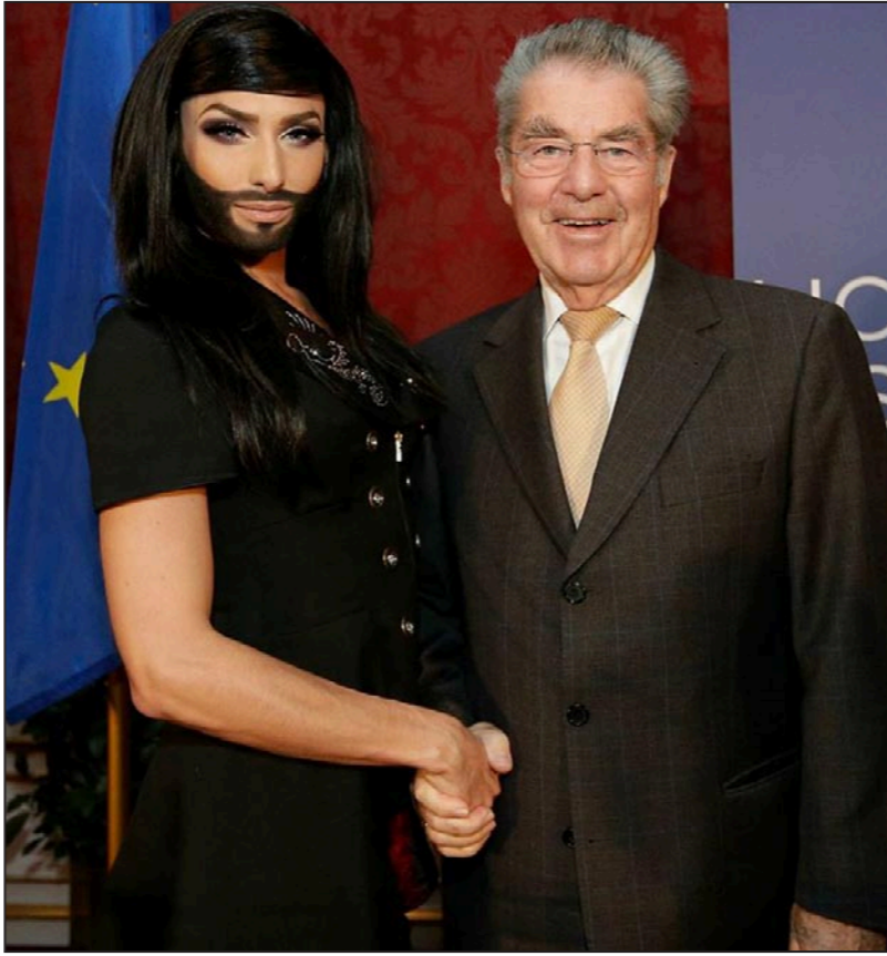
كونشيتا فورست مع الرئيس النمساوي هاينز فيشر

لقد اختلفت الراء كثيراً حول فوز الفنانة المتلحية، ولكنها قطعاً صارت نجمة عالمية حتى أن البعض لقبها بملكة النمسا، نعم إنها المرأة المتلحية حالياً والرجل المتلحي سابقاً. وهذا يظهر أن المثليين والمخنثين مكانتهم لدى حكوماتهم في الغرب أكبر بكثير من مكانة الادباء والفنانين المبدعين في الشرق لدى حكوماتهم، وكونشيتا فورست نموذجاً!!