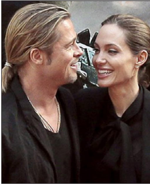
أنجلينا جولي وبراد بيت

لوس أنجلوس - د ب أ: يعتزم نجما هوليوود الشهيران براد بيت وأنجلينا جولي الظهور مجدداً في فيلم جديد مشترك. وقالت جولي في تصريحات لجلة «إكسترا» الأمريكية: «إنه ليس فيلماً كبيراً أو فيلماً حركياً. إنه من أنواع الأفلام التي نحبها لكن لا نتاح لنا فرص المشاركة فيها في الغالب، إنه فيلم مستقل تجريبي إلى حد ما يمكننا أن نجرب فيه كممثلين أشياءً مختلفة وصريحة».