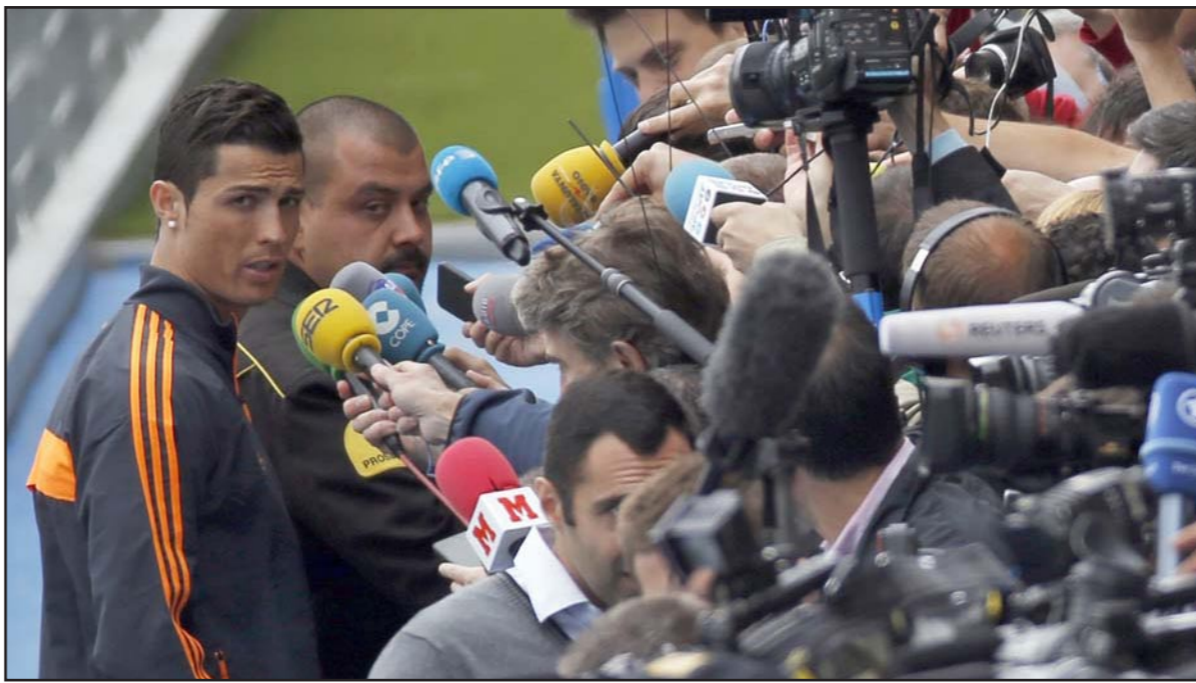
رونالدو نجم الريال يتحدث لجمع غير من الصحفيين بعد حصّة تدريبية

■ نشيونة - «القدس العربي»: د ب أ؛ لا يمكن حقا التغاضي عن النجم البرتغالي كريستيانو رونالدو في أي من جوانب استعدادات ريال مدريد الأسباني لنهائي دوري أبطال أوروبا السبت المقبل. فقد ظهر أفضل لاعب في العالم لهذا العام عاريا مع صديقته الحميمية الروسية إرينا شايك في أحدث إصدار للنسخة الأسبانية من مجلة «فوغ» الشهيرة، وهو يسعى للتخلص من مخاوف الإصابة العضلية في الفخذ ليقود ريال السبت إلى إحراز لقبه العاشر في دوري الأبطال، والذي يطارده النادي الملكي منذ 12 عاما منذ إحراز لقبه السابق عام 2002، عندما يلتقي فريقه مع غريميه وجاره الأسباني أتلتيكو مدريد في بلده البرتغال. وقال رونالدو: «لعب دوري الأبطال العاشر (ديسيما) هو اللقب الذي يسعى كل فرد في الريال للفوز به. لقد انضمت لهذا النادي من أجل الفوز باللقب كهدية».