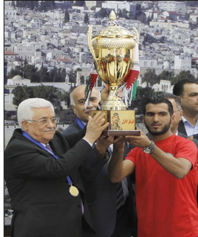
الرئيس عباس يرفع كأس البطولة مع قائد المنتخب الفلسطيني

■ رام الله - الأناضول: استقبل الرئيس الفلسطيني، محمود عباس المنتخب الفلسطيني، في أعقاب فوزه بأول لقب في تاريخه، وهو كأس التحدي الآسيوي، وتاهله، للمرة الأولى إلى نهائيات أمم آسيا في أستراليا العام المقبل. وقال عباس لاعبي المنتخب، في مقر الرئاسة بمدينة رام الله وسط الضفة الغربية: «أن الألوان للشعب الفلسطيني أن يتجه بهذا النصر العظيم الذي جتّم به لشعبكم، النصر المعجزة، حققتم معجزة، نحن مشتمون لكم لأنكم رفعتم رؤوسنا، وحققت المنتخب الفلسطيني، اللقب به-الفاتح»، هذه البطولة غير المسبوقة في تاريخه بفوزه بهدف من دون رد على نظيره اللبناني في نهائي كأس التحدي الآسيوي، التي استضافتها جزر المالديف يوم الجمعة الماضي. ومضى عباس قائلاً: «صورنا أننا على مدى عقود طويلة لم يكن لدينا فرص للعب، واخفت الكرة من يهوتنا وحرارتنا وعلامتنا، ولم يكن لدينا ملاعب بسبب الاحتلال (الإسرائيلي)، وكلنا نعرف أن آخر عهدنا بالمباريات الدولية كان عام 1934... لم يكن أحد منا مولوداً، كانت فلسطين في ذلك الحين تنافس مصر في تصفيات التأهيل إلى كأس العالم». وختم الرئيس الفلسطيني بقوله: «قبل خمس سنوات بدأت النهضة الرياضية الحقيقية في هذا البلد، قادها جبريل الرجوب (رئيس الاتحاد الفلسطيني لكرة القدم) بإصرار ويعزيمة المناضل المكافح الذي أراد خلق شيء من لا شيء، وعمل المستحيل... باختصار رفعتم رؤوسنا عالياً».