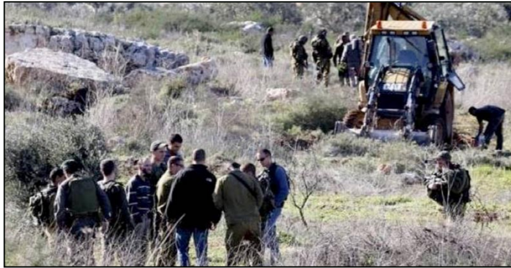
جرافات الاحتلال تهدم غزفا زراعية في رام الله