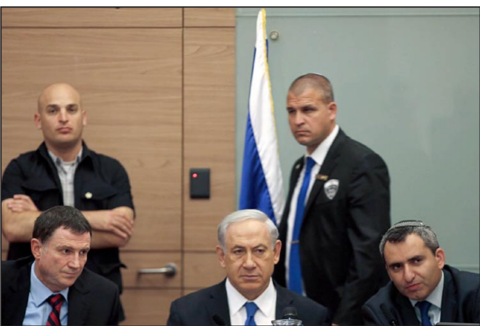
اللجنة الزارية لشؤون الامن القومي رفضت التعامل مع حكومة تضم حماس

وردت المقاومة الفلسطينية التي تصدت للتوغل بإطلاق قذائف هاون تجاه القوة المتوغلة، وكثيرا ما تقوم قوات الاحتلال بتنفيذ عمليات توغل برية على الحدود الشرقية والشمالية لقطاع غزة التي تقيم في عمقها منطقة أمنية عازلة، تمتد لمسافة 300 متر تمنع السكان من الاقتراب منها. وتخالف هذه الهجمات الإسرائيلية اتفاق التهدئة المبرمة بين الفصائل المسلحة وإسرائيل برعاية مصرية، الموقع في شهر تشرين الثاني/ نوفمبر من العام 2012.