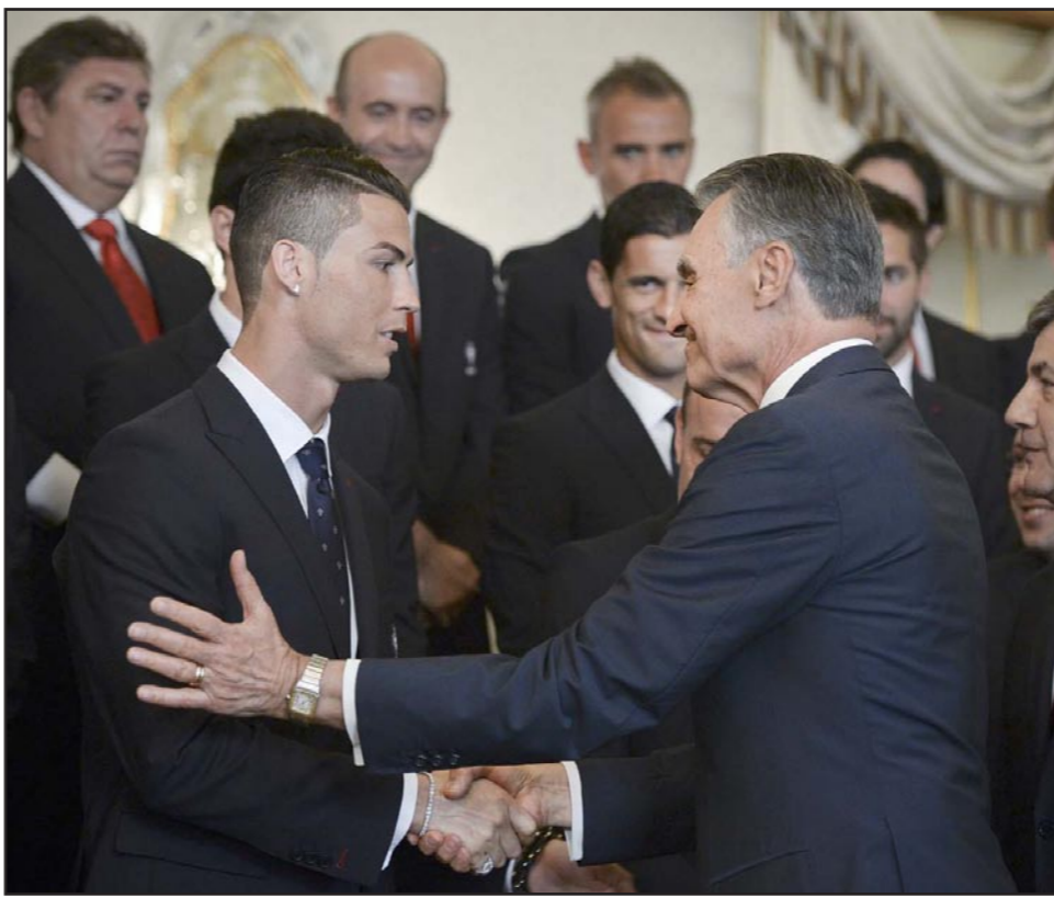
الرئيس البرتغالي يصافح النجم رونالدو في حفل توقيع المنتخب قبل سفره الى البرازيل

تعادل المنتخب الألماني مع نظيره الكاميروني بهدفين لكل منهما في إطار الاستعدادات لكأس العالم، وسجل هدف ألمانيا توماس مولر، وأندريه شورله في الدقيقتين 66 و71، بينما أحرز هدف الكاميرون، صامويل إينو وإيريك ماكسيم تشويو مونتيج في الدقيقتين 62 و78 على ملعب بوروسيا بارك بألمانيا، ويلعب المنتخب الألماني في المجموعة السابعة لتوئيدال البرازيل بجوار ألمانيا والبرتغال، بينما يلعب المنتخب الكاميروني في المجموعة الأولى التي تضم معه البرازيل، وكرواتيا، والمكسيك.