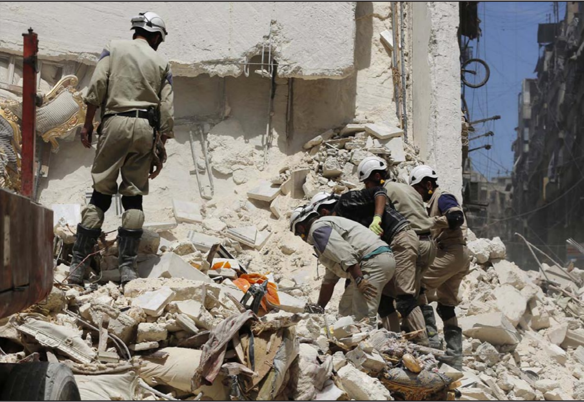
قوات انقاذ يتفقدون ركام بنفايات دهمت بالكامل جراء القصف المتواصل في منطقة الشعار في حلب

كثفت قوات الدفاع الوطني، الموالية للنظام، وواضح ان القرية تغطيها غالبية من الطائفة العلوية. وأفاد المرصد بأن تنظيم الدولة الإسلامية في العراق والشام (داعش) يسيطر على بلدة البصيرة وجدها، بريف الشرقي لدير الزور. وقال في بيان امس إن ذلك جاء عقب اشتباكات عنيفة مع مقاتلي جبهة النصرة (تنظيم القاعدة في بلاد الشام) والكتائب الإسلامية، وذلك بعد منتصف ليل أمس الاحد صباح أمس الاثنين، حيث استمرت الاشتباكات بين الطرفين لعدة أيام، واستخدمت فيها جميع أنواع الأسلحة الخفيفة والمتوسطة والثقيلة. وأشار إلى أن الاشتباكات أدت إلى حرق مساحات واسعة من الأراضي الزراعية في مساحة 10 مواتين، إضافة إلى حدوث حالة زواج واسعة من بلدة البصيرة ومحيطها في المناطق الجاورة، منذ مطلع شهر أيار/ مايو الماضي. وتكثفت جبهة النصرة والكتائب الإسلامية من استعادة السيطرة على قرى الحسينية والجنيحة وشقرا والسفيرة ومحميدة وحواييج وموصعة وحواييج ندياب وزعير جزيرة والصنوع وحمار العلي وحمار الكسرة في الريف الغربي لحمافة دير الزور (خط الجزيرة)، واستطاعت جبهة النصرة والفصائل الإسلامية السيطرة على قرى