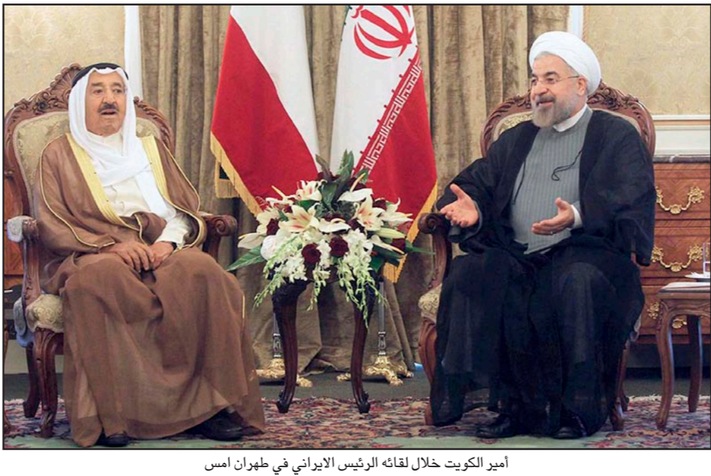
أمير الكويت خلال لقائه الرئيس الإيراني في طهران أمس

بالنفع واستقبال الأمن للدول المطلة على الخليج مشيراً إلى أن التقارب بين دول المنطقة مفيد وأن التقاعد سيكون بصلحة العدو وتطرق إلى أن تعزيز العلاقات بين الكويت والعراق سيكون من صالح المنطقة ومستنكرًا أن إيران دائما دعمت الكويت والحكومة التي تتخذها الكويت تجاه القضايا المشتركة.