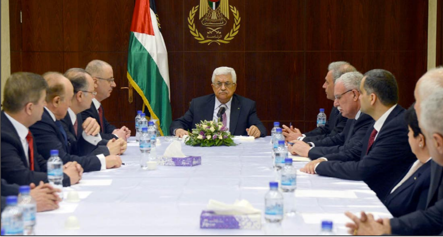
عباس يتراس أول اجتماع للحكومة الجديدة

المصطلح الذي يطلق على تلك القوات الموجودة في الضفة، بعد أن كانت توصف بـ«قوات الأمن التابعة لحكومة حماس».