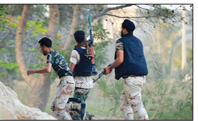
قوات موالية لخليفة حفتر أثناء اشتباكات مع ميليشيات سلفية في بنغازي أمس

وقال الثني في بيان له، الأحد، إن نواباً بالمؤتمر الوطني العام («البرلمان المؤقت») تقدموا بدعوة أمام الدائرة الدستورية بالحكمة قائلين حكومة تصريف الأعمال أحمد معيتيق رئيساً للوزراء ومنح الثقة له، ووثقت تصديراً للنزوح والاحتجاز، الذي مصره على قرارها بعدم تسليم السلطة إلى الحكومة الجديدة التي يرأسها أحمد معيتيق.