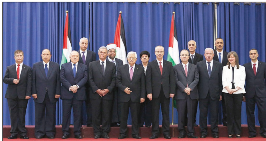
الرئيس الفلسطيني محمود عباس مع أعضاء حكومة التوافق الوطني الفلسطينية الجديدة في رام الله أمس

نايف أبو خلف وزيراً للحكم المحلي، يوسف دعيس وزيراً للاوقاف، كما جرى تعيين علي محمود عبد الله أبو دياك بدرجة وزير. وألقى الرئيس الفلسطيني محمود عباس خطاباً ملتزمًا عقب انتهاء مراسم القسم الدستوري، أعلن فيه استعادة وحدة الوطن وإنهاء الانقسام الذي ألحق بقضيتنا الوطنية أضراراً كارثية طوال السنوات السبع الماضية، وأضاف أنه وبشخصه حكومة التوافق الوطني، نعلن إنهاء ونهاية الانقسام الذي ألحق بقضيتنا الوطنية أضراراً كارثية طوال السنوات السبع الماضية. وأكد الرئيس عباس بأن الحكومة التي بدأت عملها في حكومة انتقالية الطابع، ومهمتها الإعداد للانتخابات قريباً، إلى جانب رعاية أمور وتوفير حاجات أبناء شعبنا، مضدداً على التزامها مسبقاً بالتزامات السلطة الوطنية والاتفاقات الموقعة وبالبرنامج السياسي الذي أقرته مؤسسات منظمة التحرير الفلسطينية.