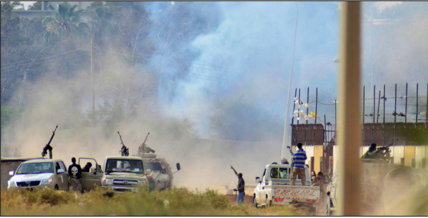
تصاعد الدخان في مدينة بنغازي بعد اشتباكات بين قوات حفتر والمليشيات الاسلامية

تولت تلك المشاهد منذ الأيام الأولى والأسابيع الأولى والأشهر الأولى ، لتشكل ملامح «الكيان الليبي الجديد» استعرت حروب الهمم لكل مظاهر النظام السابق ، معاول داخلية ومعاول خارجية ، و انهار من دم في كل مكان ، لم تشهد لها ليبيا مثيلا عبر تاريخها، قوى عظمى شاركت في دك ترسانات الجيش الليبي السابق بمعدل يعادل أكثر من 22 ألف طلعة جوية ، بينها 6000 حالة اشتباك بحسب تصريحات حلف الناتو.