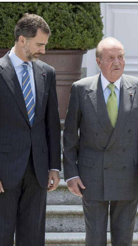
الملك خوان كارلوس والأمير فيليبي

ويقتنى الملك على ابنه وريث العرش «يمتلك النضج والتأهيل وحس المسؤولية لتولي، بكل صفاتنا قيادة البلاد وفتح مرحلة جديدة من الأمل حيث تمنح التجربة المكتسبة وقوة الدفق لجيل