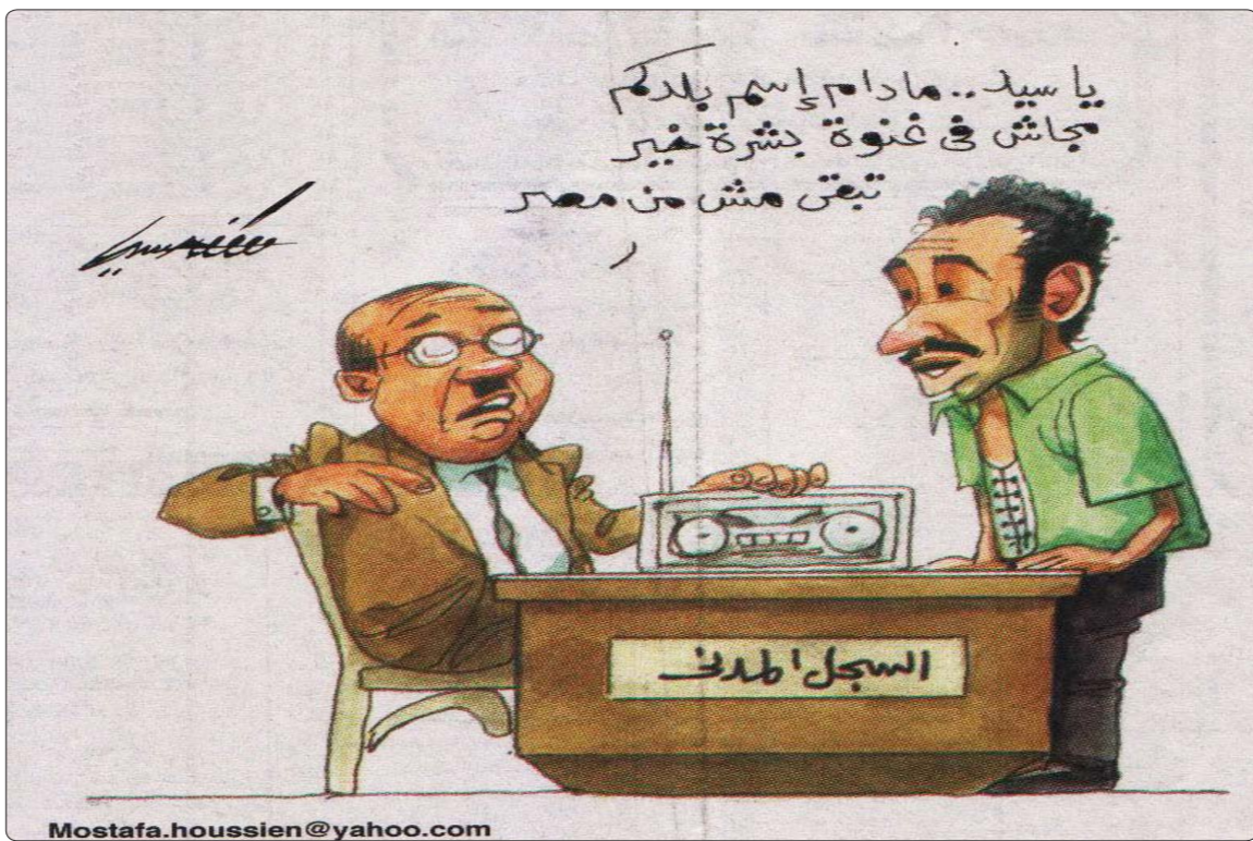
رجال الأعمال، ومع ذلك لم تتخيل أنا و ملايين المصريين أن تصل الخسة والنذالة إلى طعن شعب مصر كله في ظهره بالمقاطعة الانتخابية..

ومما ورد في الصحف استمرار محكمة الجنايات النظر في قضية اتهام الرئيس الأسبق محمد حسني مبارك ووزير الداخلية اللواء حبيب العادلي وستة