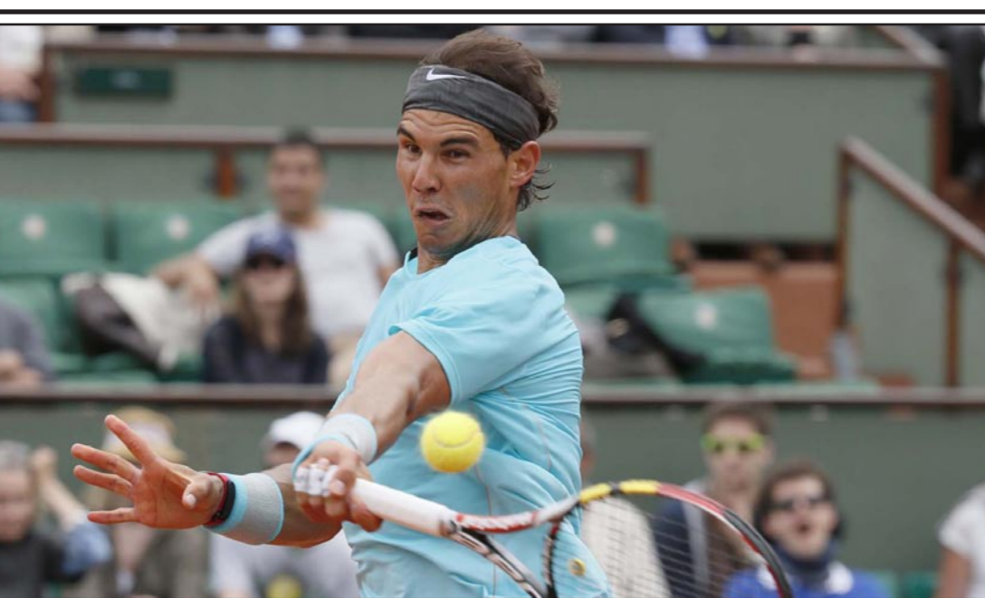
نادال تلقى بشكل لافت اسم في «رولان غاروس»