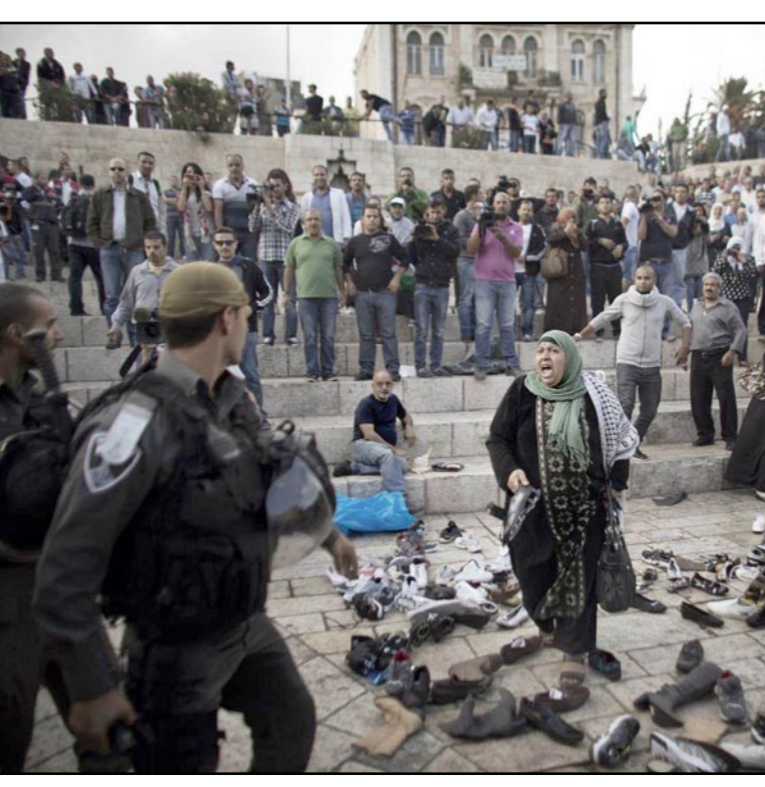
فلسطينية تصرخ في وجه قوات الاحتلال أثناء محاولة جماعات يهودية اقتحام المسجد الأقصى