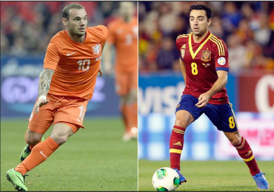
النجم الاسباني تشافي (يمين) يواجه الهولندي شنابر اللية