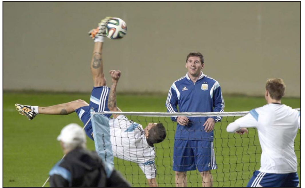
ميسي يشاهد بانهباز زميله دي ماريا يركل كرة بصورة اكروباتية

■ بيلو هوريزونتي (البرازيل) - د ب أ: تابع آلاف البرازيليين تدريبات المنتخب الأرجنتيني في بيلو هوريزونتي وقدموا تحية حارة لنجم الفريق ليونيل ميسي. واهتف جزء كبير من الجماهير التي يبلغ عددها ستة آلاف متفرج في استاد «إنديينديسيا» غاليتهيم من البرازيليين: «الأرجنتيين... والأرجنتيين». ولطالما جمعت ندية شديدة بين الجارتين البرازيل والأرجنتين على مستوى كرة القدم. واهتفت الجماهير بصوت عالية تحية ميسي عدة مرات خلال المران الخفيف للمنتخب الأرجنتيني والذي انتهى فجأة عندما قام العديد من المشجعين بغزو أرض الملعب وانطلق اثنان من هؤلاء المشجعين باتجاه ميسي، حيث ادعى أحدهما أنه يلعب حذاء قائد منتخب الأرجنتين فيما احتضنه الآخر. واصطحب أفراد الأمن الجماهير التي أبدت تحمسها المفرط إلى خارج الملعب.