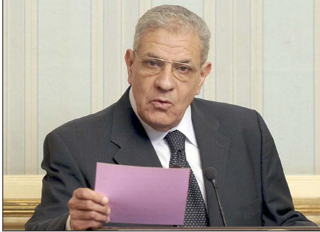
رئيس الوزراء المصري المهندس ابراهيم محلب

القاهرة - الأناضول: قررت محكمة مصرية، أمس الخميس، تجديد حبس 6 متهمين تم ضبطهم في أربع وقائع تحرش لفتيات بميدان التحرير، أثناء احتفالهم بتصيب الرئيس المصري الجديد عبد الفتاح السيسي، يوم الأحد الماضي، لمدة 15 يوما على ذمة التحقيق.