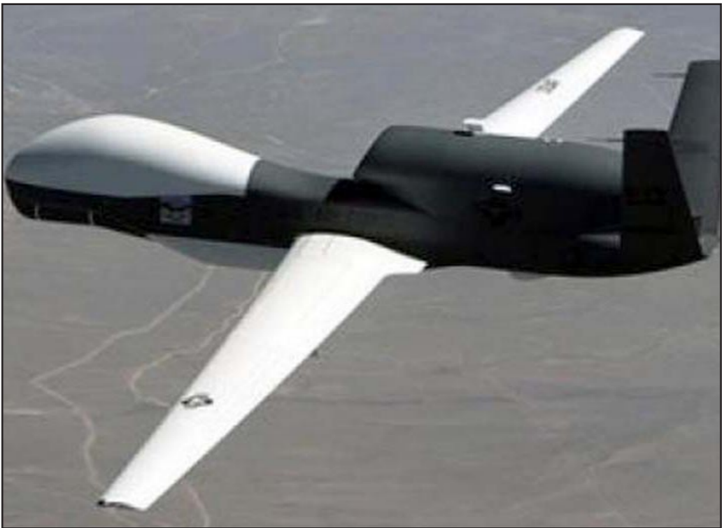
صورة أرشيفية لطائرة بدون طيار استخدمت في شن هجمات على المتشددين في باكستان

الركة ونتاجها من النفط اما الحركات الأكثر اعتدالا مثل جبهة «الضربة» فهي تتناضل ضد هذا التنظيم ولكن دون نجاح يذكر، ومن المتوقع قريباً مشاهدة هجمات الطائرات بدون طيار في الأراضي السورية لقب المعادلة، وفي العراق، تم تزويد قوات الامن بكافة الوسائل العسكرية لهزيمة «القاعدة» التي لها وجود قوي يمتد الى الهمية في الفلوجة واجزاء أخرى من محافظة الانبار ذات الاغلبية السنية ولكن بدلا من التحالف مع الجماعات السنية المعتدلة شن المائكي حملة طائفية قوية لينجح في الانتخابات التي جرت الشهر الماضي وهو يسعى لتشكيل حكومة ائتبرية مع فتحمل سني لا يذكر.