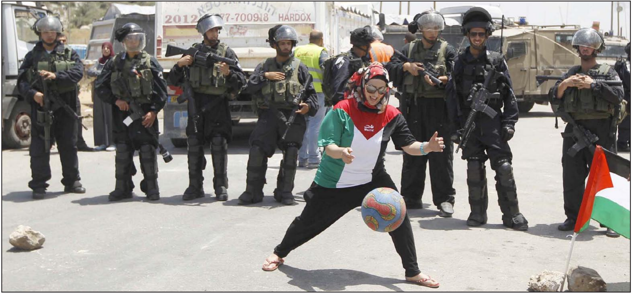
فتاة فلسطينية تحتج بمرمسة كرة القدم أمام سجن عوفر الاسرائيلي

■ أيبيدجان (كوت ديفوار) - الأناضول: وصل مدرب تشلسي الإنجليزي، البرتغالي جوزيه مورينيو إلى العاصمة الإيفوارية أيبيدجان، في إطار برنامج مكافحة الجوع الذي تنظمه منظمة الأغذية العالمي. وستتم زيارة المغرب البرتغالي ثلاثة أيام، ومن المنتظر أن يقوم بزيارة مدينة ياموسوكرو وسط البلاد، لمعالجة الطامع الدراسية التابعة لمنظمة المساعدات الغذائية الأممية. وتأتي زيارة مورينيو، في إطار البرنامج السنوي لتوزيع وجبات مدرسية على نحو 22 مليون طفل في 60 بلداً تم إقرارها في البرنامج. وتقدّم هذه الوجبات المدرسية بالتوازي مع عمليات تهدف إلى التخلص من الديون، وتعزيز الغذاء المقدم بالجزء الدقيق، بهدف توفير الدعم الغذائي اللازم للطلاب والسماحة، بالتالي، في كسر حلقة الفقر الجوع، وفقاً لبيان صادر عن برنامج الأغذية العالمي.