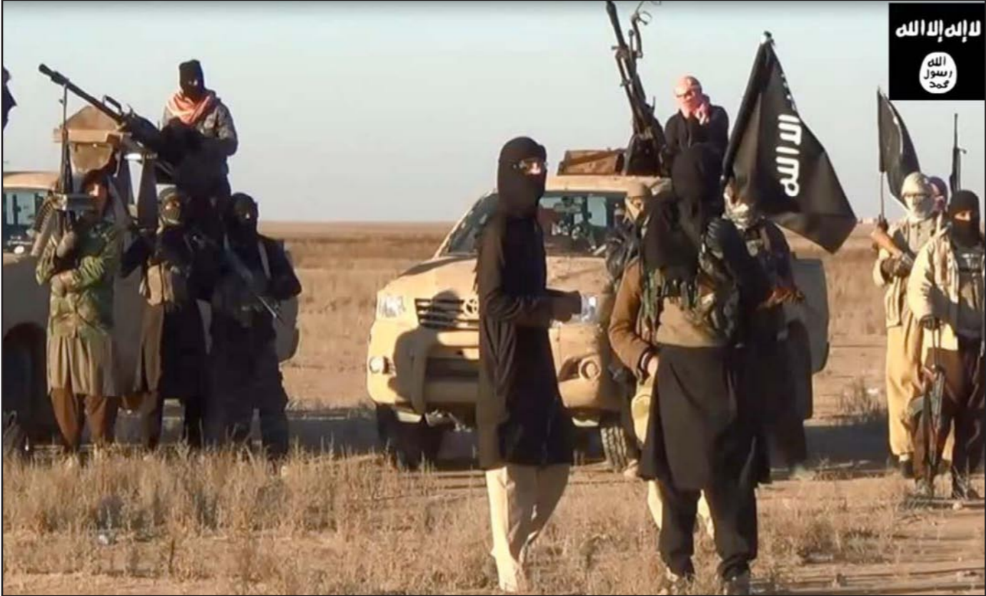
مقاتلون من «داعش» يتجمعون في أحد مناطق العراق بالقرب من كركوك