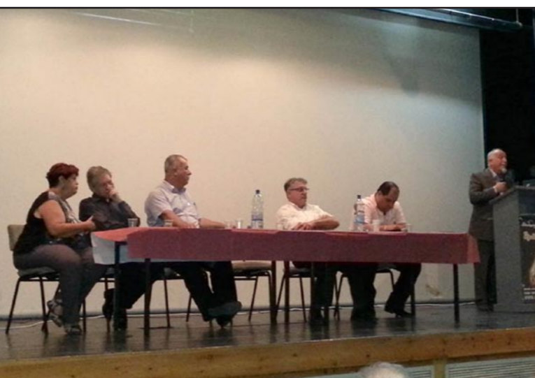
جانب من الندوة التي نظمتها الجبهة الديموقراطية للسلام والمساواة في الناصرة