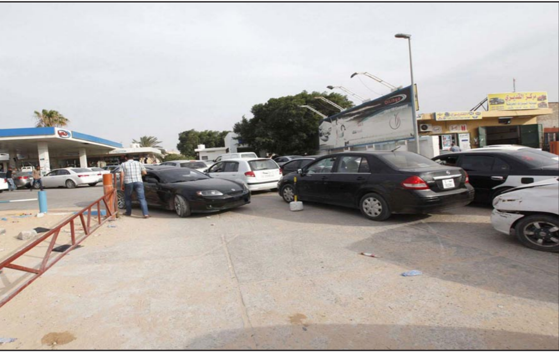
سيارات في ساحة محطة بنزين في طرابلس تنتظر الدور لتعبئة خزاناتها

■ طرابلس - رويترز: شهدت العاصمة الليبية طرابلس أمس الخميس اصطفافا لأصحاب السيارات أمام محطات البنزين للترزود بالوقود وهم في حالة من الغضب، إذ قضى بعضهم ليالي في سياراتهم مع انتظار محطات البنزين لإمدادات تعهدت بها شركة نفط حكومية. وقال أحد السائقين الذين ينتظرون في طابور طويل أمام محطة وقود في وسط طرابلس "انتظر في الطابور أمام محطة البنزين هذه منذ يومين". وأضاف "هنا أمر محزن. فأبناي انتهبوا من اختياراتهم وأريد الخروج معهم لكننا لا نستطيع للأسف". وتشهد ليبيا اضطرابات في وقت تكافح فيه الحكومة للسيطرة على المسلحين الذين سماهوا في الإطاحة بمعمر القذافي عام 2011، لكنهم يتحدون الآن سلطات الدولة ويسيطرون على مرافئ النفط كبقية ما يرون. ووجدت ليبيا صعوبة في الحفاظ على تشغيل مصفاة الزاوية التي تنتج 120 ألف برميل يوميا وتوفر الإمدادات اللازمة لغرب البلاد بعد أن أغلق محتجون حقل الشراة المتصل بها. وقالت شركة البريقة لتسويق النفط المسؤولة عن إمداد محطات البنزين بالوقود إن غياب الأمان في بعض المحطات التي تصطف أمامها السيارات