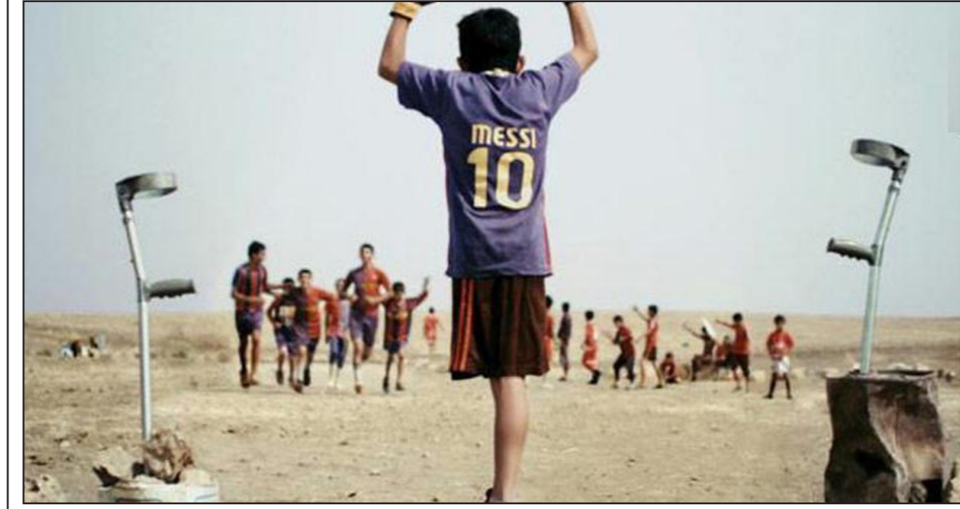
لقطة من فيلم «ميسي» بغداد