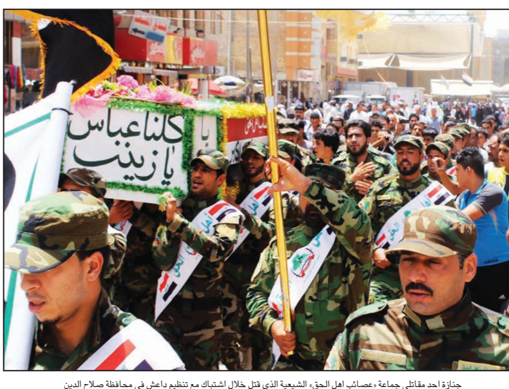
جنازة احد مقاتلي جماعة «مصائب اهل الحق» الشيعية التي قتل خلال اشتباك مع تنظيم داعش في محافظة صلاح الدين

وقال انه ستكون هناك تحركات عسكرية قسيرة المدى وفورية ينبغي عملها في العراق، مشيرا إلى أن فريقه للامن القومي يبحث كل الخيارات، وتابع ان الولايات المتحدة مستعدة لاتخاذ اجراء عسكري عند تهديد مصالحها الاستراتيجية الامم القومية. وسيطر الأكراد العراقيون على مدينة كركوك الغطية بشمالي البلاد الخميس بعد ان انسحبت القوات الحكومية من مواقعها أمام متشددين موحدة، مما يهدد مستقبل العراق كمولة.