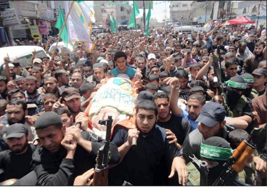
تشجيع جيشان الشهيد العاوري تحول الى مظاهرة ضد الاحتلال

الوضع، خاصة بعد عملية اغتيال الناشط العاوري. وكانت إسرائيل أعلنت صباح أمس الأول عن إطلاق نسطاء من قطاع غزة صاروخا سقط في منطقة خلاء في النقب الغربي دون أن يسفر عن وقوع إصابات أو أضرار. وسبق وأن قال نتنياهو أن الرئيس الفلسطيني محمود عباس سيكون عقب اتفاق المصالحة وتشكيل حكومة فلسطينية بالاتفاق مع حماس، مسؤولاً عن الهجمات التي تستهدف إسرائيل من قطاع غزة.