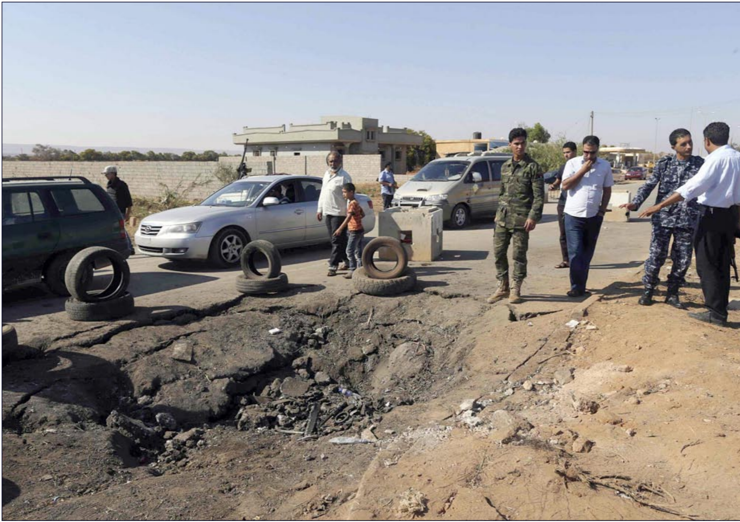
التفجير الانتحاري خلف ضحايا في بنغازي

■ ليبيا - وكالات : قال مسؤول بالجيش ان شخصين على الأقل قتلوا واصيب ستة في انفجار ضخم عند نقطة تفتيش للجيش خارج مدينة بنغازي بشرق ليبيا عندما فجر انتحاري نفسه ليل الأربعاء في البوابة الأمنية لمنطقة برسس التي تبعد حوالي 50 كلم شرق مدينة بنغازي الليبية، فيما أعلنت قوات حفتر انها ألقت القبض على المتهم الرئيسي بمحاولة اغتياله، بينما عقد رئيس حكومة تصريف الأعمال عبد الله الثني اجتماعا موسعا للجيش الليبي للبحث الموقف الأمني والعسكري في البلاد، في وقت قال فيه مسؤول في تنظيم انصار الشريعة ان التنظيم مستعد لتسليم سلاحه إذا نص الدستور الجاري كتابته على تطبيق الشريعة الإسلامية.