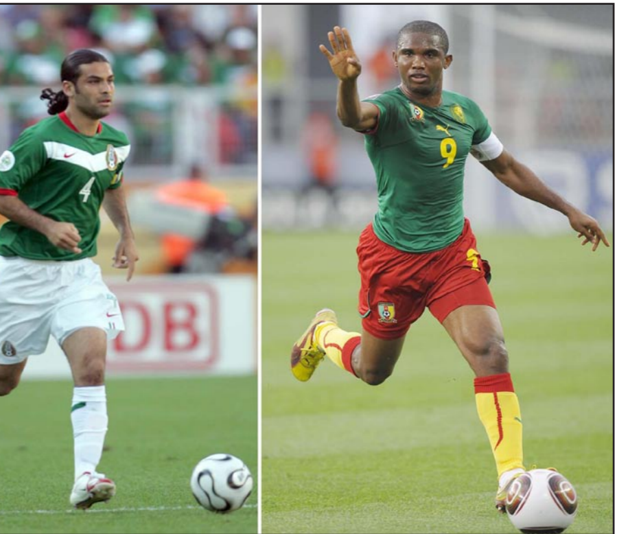
نجم المنتخب الكامبيروني صامويل ايتو (يمين) والمكسيكي رافايل ماركيز

ويوجد لدى فان غال فريق كامل العدد ليختار تشكيلة المفضل، فقد استأنف روبن فان بيرسي وداريل غامات تدريباتهما مع الفريق بشكل طبيعي بعد الحادث الذي أصابهما بالرعب يوم الاثنين الماضي عندما اصطدم بهما شخص أثناء ممارسته رياضة ركوب الأمواج بالظلة الشراعية على شاطئ إيبانيميا بمدينة ريو دي جانيرو. كما تعافى جوناشان دي جوزمان من إصابته بشد في أربطة الساق وسينافس بالتاكيد على مكان بظط الوسط الهولندي إلى جانب نايجل دي يونج ووييلسي شنايدر.