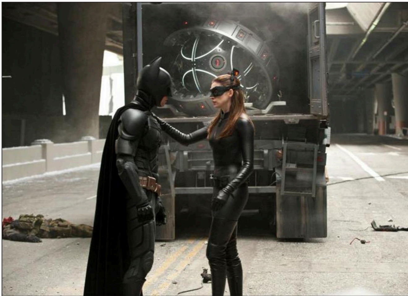
لقطة من فيلم «باتمان»

وإذا فسجدنا أن هذه الصناعة تهدف إلى إعادة تقديم التاريخ بصورة أبسط وأكثر إلهاما لتكون خطابا للمجتمع يشعره بالطمأنينة ويحمو هواجسه، ويعيد سرد الأحداث والحقائق في قالب نمطي، وبهنا هنا أن نقف على اسقاطات هذا التوجه على الواقع السياسي ونقارن بينه وبين السبروباغاندا، التي تمارسها الأنظمة في مواجهة الربيع العربي.