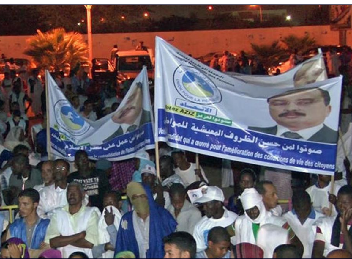
توقعات تزج فوز الرئيس الموريتاني محمد ولد عبد العزيز من جديد

نمو راغ الموارد الهائلة التي توفرت لها ورغم الاستقطاعات الكبيرة التي حصلت عليها». وتحدث ولد أحمد الوقف عن «وجود ضغط جبائي كبير خلال الفترة الماضية وهو أمر مهم لميزانية الدولة، لكنه مضر بأصحاب الدخل المتوسط». واستغرب ولد الوقف «لوجود فائض مالي في الموازنة العامة، بلغ سنة 2013 أكثر من 100 مليار أوقية، في وقت توجد فيه حاجة ماسة للخدمات ماء الشرب وخدمات الصحة وفيما الخزينة العامة مطالبة بتسديد سندات تأخرت 80 مليار أوقية». وفي تدخل آخر خلال ندوة المعارضة، انتقد القيادي الإسلامي المعارض محمد جميل ولد منصور سياسات الحكومة في المجال الاجتماعي، موضحاً أن قرابة 50 بالمائة من الشباب يعانون من البطالة ويعاني النساء منها ومخلفاتها، هذا وتتمس الحملة السياسية الممهدة للانتخابات الرئاسية بالهدوء مقارنة مع حملات الاستحقاقات الماضية. ويستحوذ الرئيس المنصرف محمد ولد عبد العزيز على الواجهة الإعلامية والدعائية لحملة الحالية حيث تكسو صورته واجهات المنازل والمحلل التجارية وتصح القنوتات باناشيد متجدد وتدعو لانتخابه. ولا يسمع أي صوت ولا ترى صورة لمنافسيه الأربعة الذين يقتصر حضورهم الإعلامي على الحصص المخصصة لهم في الإعلام العمومي.