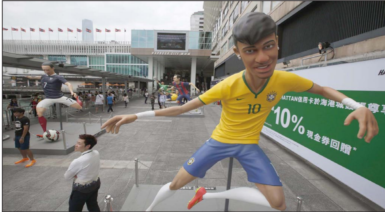
مجسم ضخم لنجم المنتخب البرازيلي نيمار في هونغ كونغ

■ ساو باولو - د ب أ: أكد النجم البرازيلي نيمار أن أكثر ما يهيمه في بطولة كأس العالم هو أن يتوج منتخب بلاده في إحراز اللقب، معتبراً أن هذا الأمر أهم من أي إنجاز آخر على المستوى الشخصي قد يحققه بالبطولة.