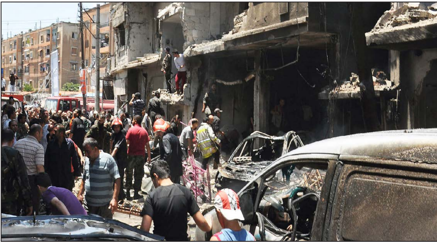
اثر انفجار سيارة مفخخة في حي وادي الذهب في مدينة حمص

عاصم- وكالات: افاد المرصد السوري لحقوق الانسان بان جبهة النصرة (تنظيم القاعدة في بلاد الشام) والكاتب الإسلامية قد سيطرت على قرية بريف حمص. وقال المرصد في بيان صحفي امس الخميس: «سيطرت جبهة النصرة والكاتب الإسلامية على قرية ام شرشوش بريف حمص الشمالي، عقب تفجير سيارة مفخخة فجر امس، تلاها اشتباكات عنيفة أدت لاستشهاد 16 مقاتلا من الكاتب الإسلامية، إضافة لقتل مقاتلين اثنين على الأقل أحدهما سعودي الجنسية، من مقاتلي جبهة النصرة، خلال هذه الاشتباكات». الى ذلك لقي 68 شخصا من بينهم 8 اطفال و3 سيدات مصرعهم، في عمليات عسكرية شنتها قوات النظام السوري باستخدام الأسلحة الثقيلة، والبراميل المتفجرة، أمس الأول، على المناطق التي تسيطر عليها قوات المعارضة في مختلف المدن السورية. وذكر بيان صادر عن الشبكة السورية لحقوق الإنسان، التي تتخذ لندن مركزا لها، ان عمليات جيش النظام، أسفرت عن مقتل 23 شخصا في حمص، و12 في حلب، و10 في ادلب، و9 في ريف وضواحي العاصمة دمشق، و4 في كل من درعا واللاذقية وحماة، وشخصا واحدا في كل من القنيطرة ودير الزور. وأشارت لجان التنسيق المحلية السورية، في بيان لها، أن قوات تابعة للجيش السوري الحر، أوقعت خسائر كبيرة في صفوف جيش النظام، في مدينة ادلب، وأن وحدات تابعة للجيش الحر والجبهة الإسلامية، أوقعت خسائر فادحة في صفوف جيش الأسد في المناطق القريبة من مدن حلب وحماة وحمص.