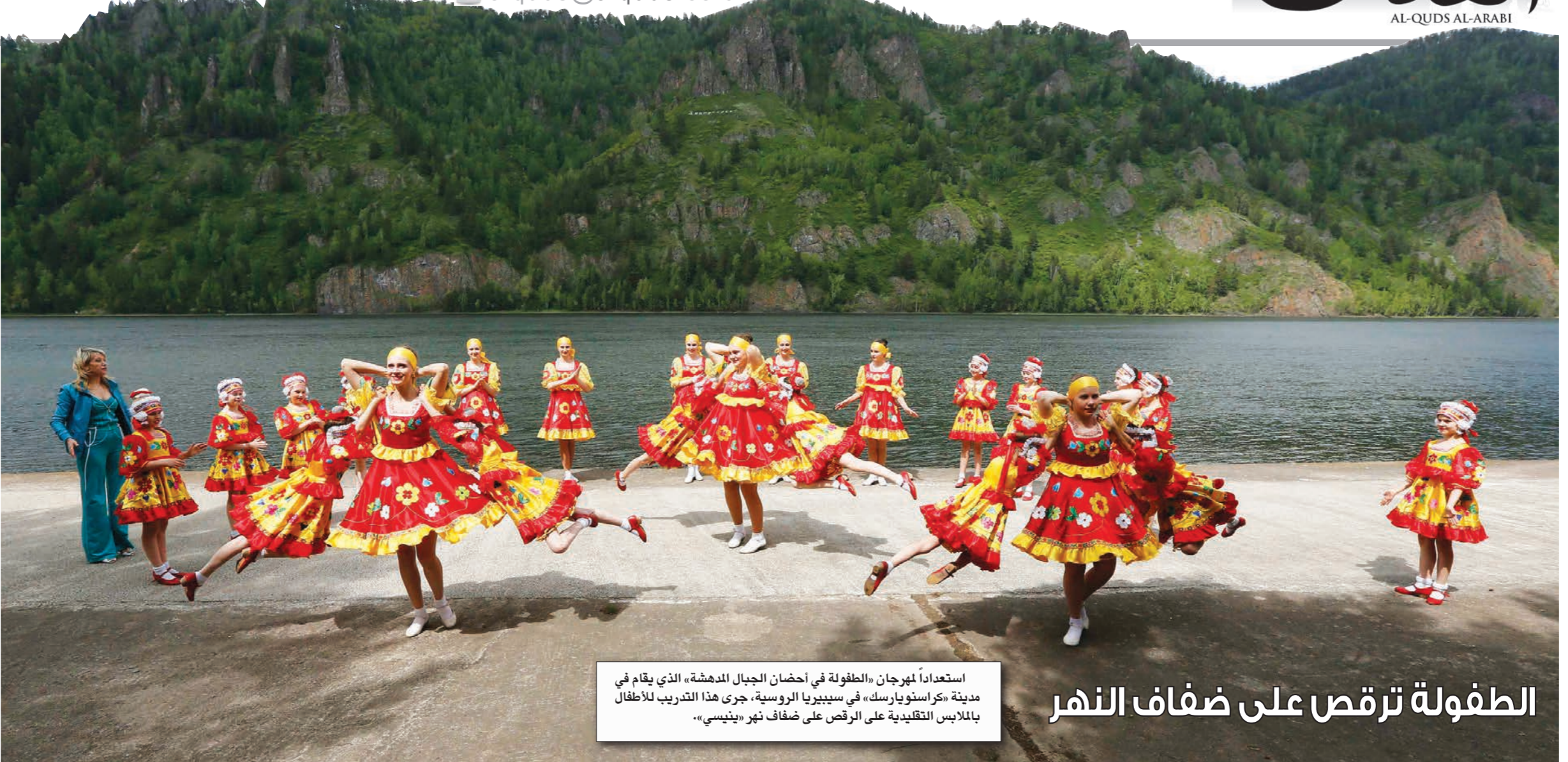
استعداداً لمرحان الطفولة في أحضان الجبال المدهشة» الذي يقام في مدينة «كراسنويارسك»، في سيبيريا الروسية، جرى هذا التدريب للأطفال بالملابس التقليدية على الرقص على ضفاف نهر «ينيسي».