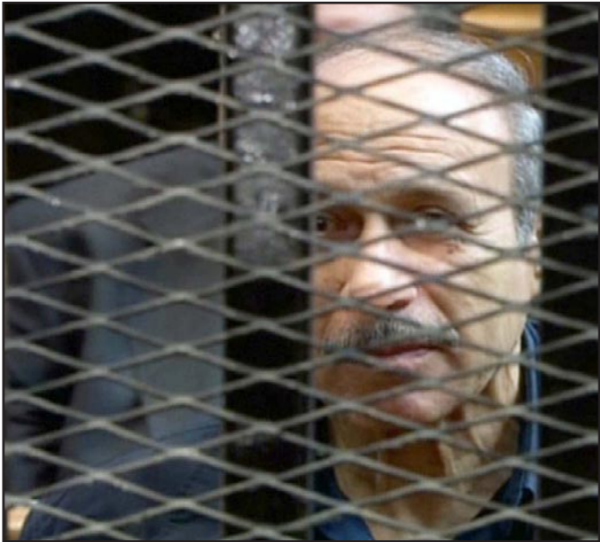
وزير الداخلية السابق حبيب العادلي أثناء محاكمته

القاهرة - رويترز: قالت مصادر قضائية إن محكمة مصرية قضت أمس الخميس ببراءة حبيب العادلي وزير الداخلية الأسبق -بعد إعادة محاكمته- من تهمة التزج وغسل الأموال خلال توليه المنصب.