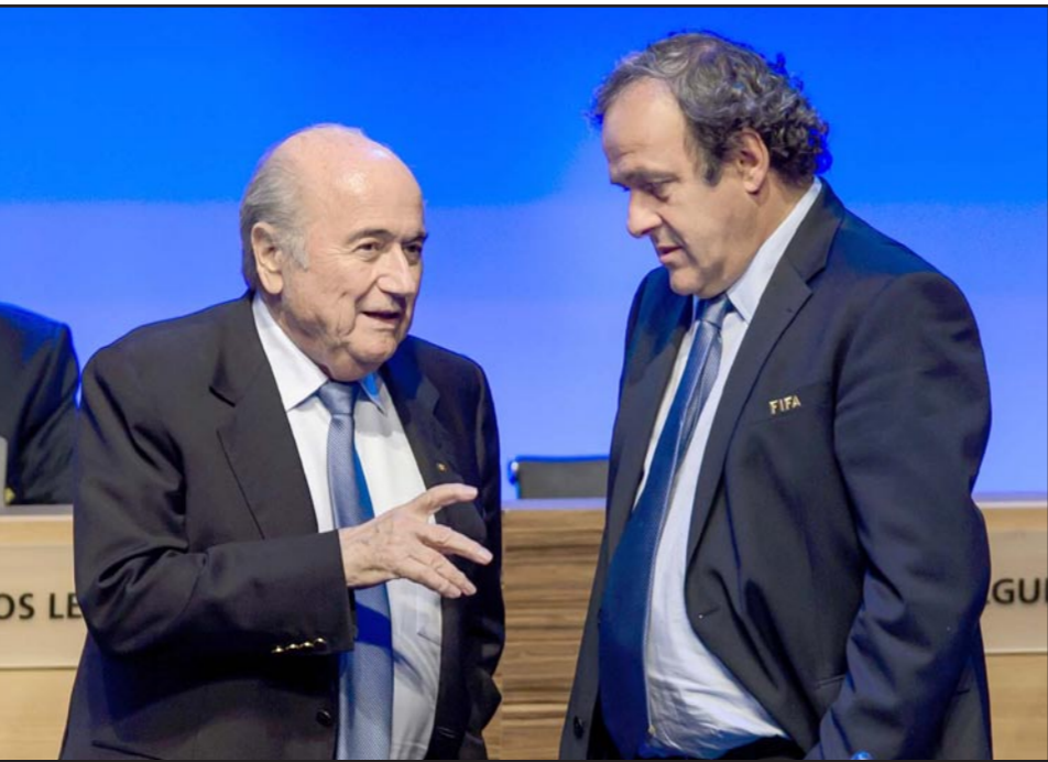
بلاتر (يسار) وبلاتيني اصدقاء الأمس... أعداء اليوم

فان براغ وغريغ دايك على الترتيب بإخبار الاجتماع السويسري خلال حضوره اجتماع للوفد الكروي عن منصبه بمجرد انتهاء فترته الرئاسية الحالية للفيفا في 2015، تنفيذاً لما وعد به سابقاً، معتبرين أنه بصفتهم الرئيس فإنه يتحمل المسؤولية الكاملة لتشويه صورة الفيغا في السنوات القليلة الماضية. لكن بلاتر غير رايه بعد هذا الودع السابق وأعلن أمام الجمعية العمومية للفيغا أنه ينوي ترشيح نفسه لفترة رئاسية خامسة العام المقبل، وقال في ختام الجمعية العمومية: «مهمتي لم تنته بعد، وأخبركم برغبتي في بناء فيفا جديد، الجمعية العمومية في 2015 مستحده من سيقود هذه المؤسسة إلى المستقبل. أنا مستعد للتقدم بها إلى الأمام».