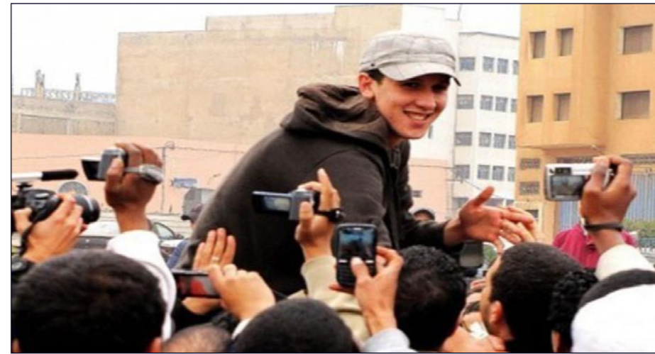
مغني الراب «الحاقد» ينشد في مظاهرة حركة 20 فبراير

وغرامة مالية قدرها 5000 درهم (حوالي 600 دولار)، وذلك بعد تدخل وصف به «العنيف»، للأجهزة الأمنية بالسيطرة المنظمة من طرف المراكز النقابية الثلاث بالبلاد يوم 6 من نيسان/أبريل الماضي تلاثة اعتقال النشطاء، ومتابعهم بتهم إهانة موظفين عوميين (عناصر الأمن).