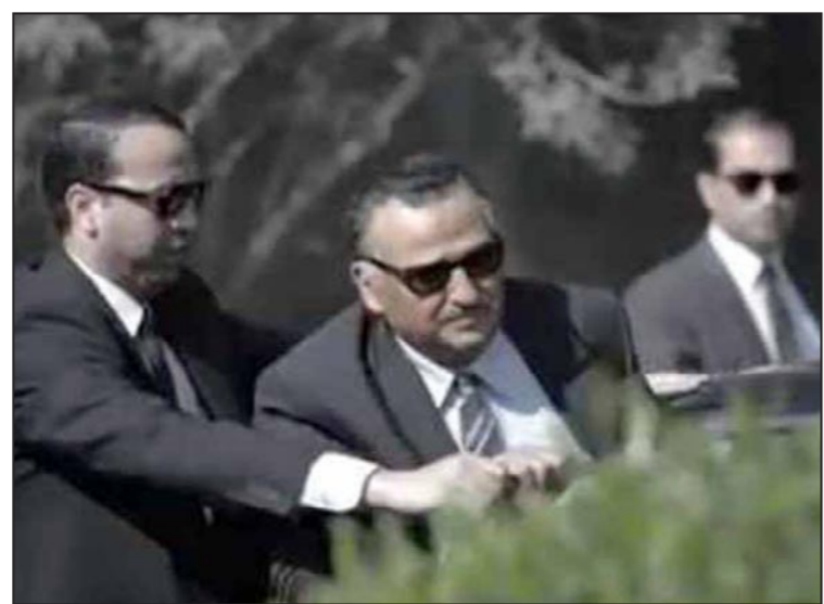
لقطة من مسلسل «صديق العمر»