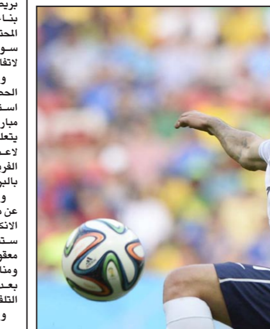
غريزمان نجم المنتخب الفرنسي غير المتوقع

ريو دي جانيرو (البرازيل) - د ب أ: بعد إيقافه لمدة عام على المستوى الدولي، أصبح اللاعب أنطوان غريزمان رجل الساعة في المنتخب الفرنسي...»