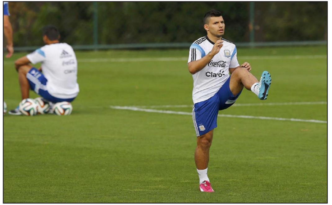
ساو باولو - د ب أ؛ عاد المهاجم الأرجنتيني سيرخيو أغويرو للمشاركة في تدريبات منتخب بلاده بعدما أبعده الإصابة في الفخذ عن مباراة فريقه الأخيرة ببطولة كأس العالم، وأجرى نجم مانشستر