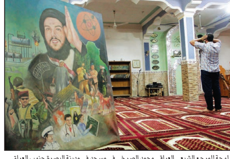
لوحة للمرجع الشيعي العراقي محمد الصرخي في مسجد في مدينة البصرة جنوب العراق

الفاتيكان يعترف بـ«الرابطة الدولية لطاردى الأرواح» الفاتيكان - د ب أ: اعترف الفاتيكان بـ«الرابطة الدولية لطاردى الأرواح»، حسبما أفادت الصحيفة الرسمية للرابطة أمس الخميس. يذكر أن طاردى الأرواح هم كهنة معينون يؤدون طقوسا دينية خاصة لمطاردة الشياطين أو الأرواح التي يعتقد الأشخاص أنها بداخلهم. واتخذ قرار الاعتراف بالرابطة في 13 حزيران/يونيو الماضي، وأعلن في عدد أمس الخميس من صحيفة الفاتيكان «لوسيرفاتوري رومانو». وقال الأب فرانيسيسكو باموتي رئيس الرابطة للصحيفة إن «طرد الأرواح هو أحد أشكال الأعمال الخيرية، حيث يفيد الأشخاص الذين يعانون، إنه بلا شك ممارسة للرحمة الجسدية والروحية». أسست الرابطة، التي عرفت في البداية باسم الرابطة الإيطالية لطاردى الأرواح، عام 1991 على يد الأب غابرييل أمورت المعروف بمطاردة الشياطين. وتضم الرابطة حاليا نحو 250 كاهنا في 30 دولة.