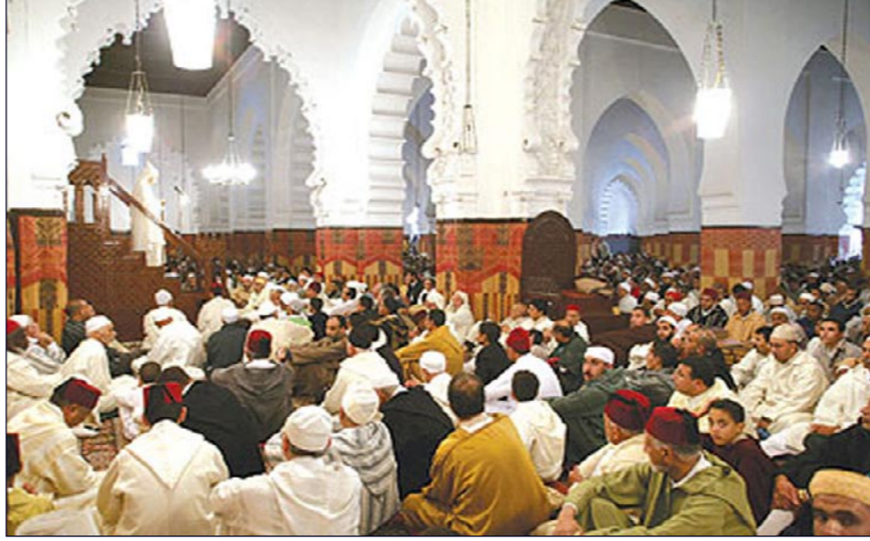
المرسوم الملكي يحظر ممارسة اي نشاط سياسي في المساجد

حظر العاهل المغربي الملك محمد السادس على رجال الدين المغربية مزاوله أي نشاط سياسي أو اتحاد أو موقف سياسي أو نقابي وعدم اقحام انفسهم في قضايا ترتبط بالأمر بالمعروف والنهي عن المنكر.