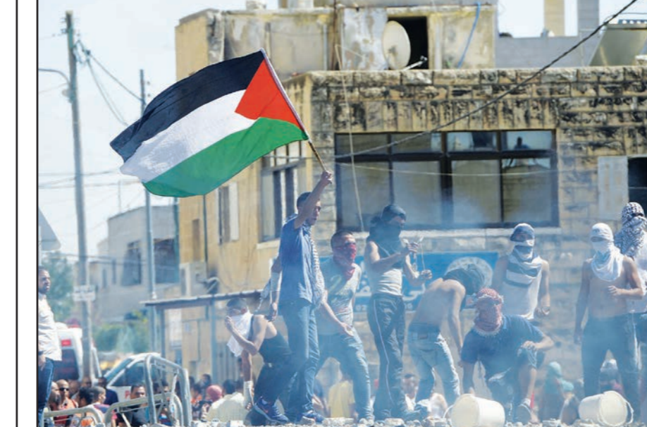
فلسطينيون يرفشون قوات الاحتلال الاسرائيلي بالحجارة أمس

غزة - رام الله - الجزائر: من أشرف الهور وقادي أبو سعدي وكمال زابيت: حشدت إسرائيل أمس مزيدا من قواتها البرية حول قطاع غزة في خطوة تندرج باجتياح بري وشيكة للقطاع مع تواصل الغارات الجوية على القطاع وتواصل إطلاق الصواريخ من غزة التي زاد عددها عن 40 صاروخا أصاب أحدا منزلا في بلدة سيدروت. وتوعدت إسرائيل باستمرار الهجمات، فيما اندثرت حركة حماس في قطاع غزة الاحتلال الاسرائيلي بهدفع النضن غالبا، اذا أقدم على عمل عسكري ضد قطاع غزة، وتوعدت المستوطنين في الضفة الغربية. ورغم أن انه لم تنسرب اي معلومات عن القرارات التي اتخذها مجلس الوزراء الاسرائيلي المصغر خلال اجتماعاته المتواصلة وأخرها الليلة