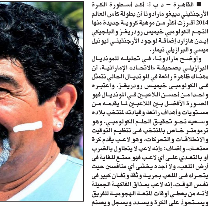
شبيه مارادونا اكتسب شعبية كبيرة في شواطئ كوبا كابانا البرازيلية