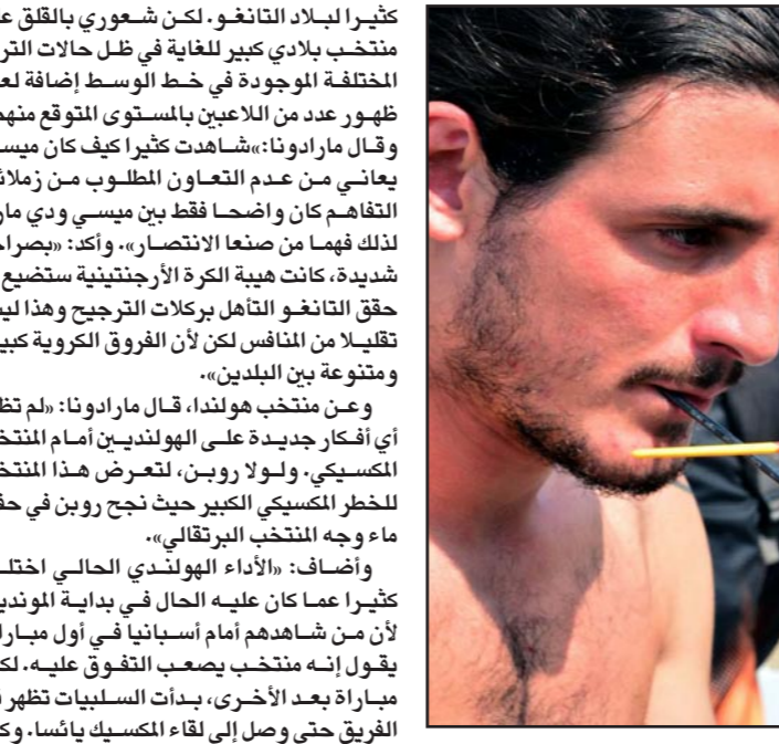
شبيه مارادونا اكتسب شعبية كبيرة في شواطئ كوبا كابانا البرازيلية