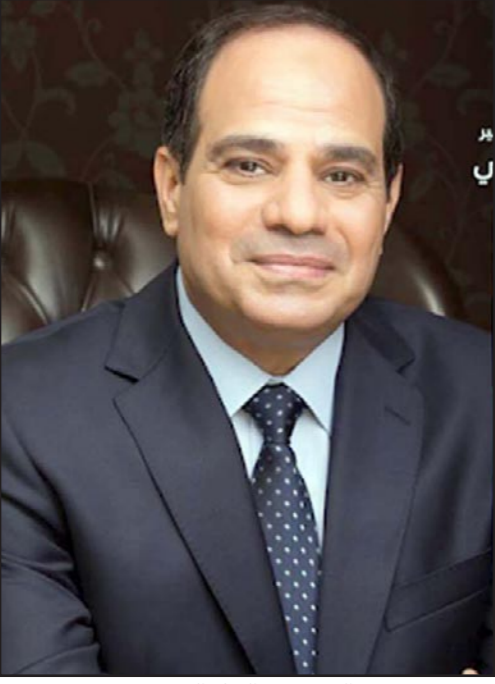
الرئيس عبد الفتاح السيسي

الأسر المصرية مثقلة بالأحمال المادية والنفاقات. وأكد على أن تلك القرارات كانت لها تأثير سلبي على شعبية السيسي وخصمت من رصيده عند الفقراء كثير جدا، ولكن النخب لم تتأثر لأنها تفهم تبعات القرارات وأهميتها لإنقاذ البلاد.