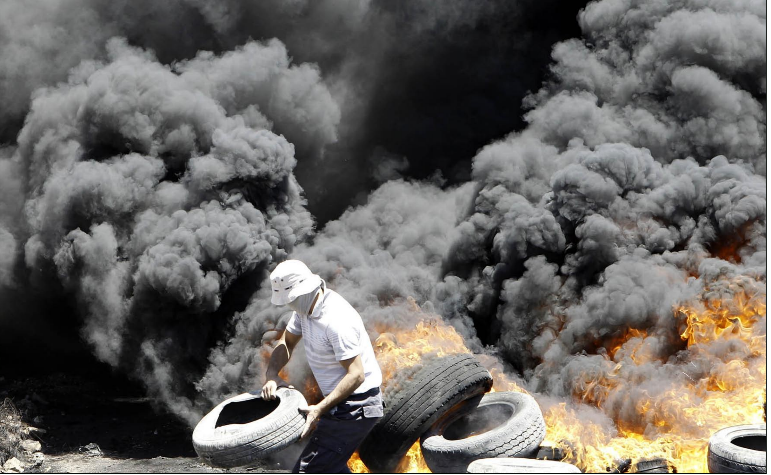
تفجيرات قوات الاحتلال الاسرائيلي في قرية «كفر قديم»

الاحتلال يغير على القطاع مرة كل 4.5 دقيقة.. والقسام يقصف مطار «بن غوريون» ويطالب الشركات الأجنبية بوقف رحلاتها لتل أبيب