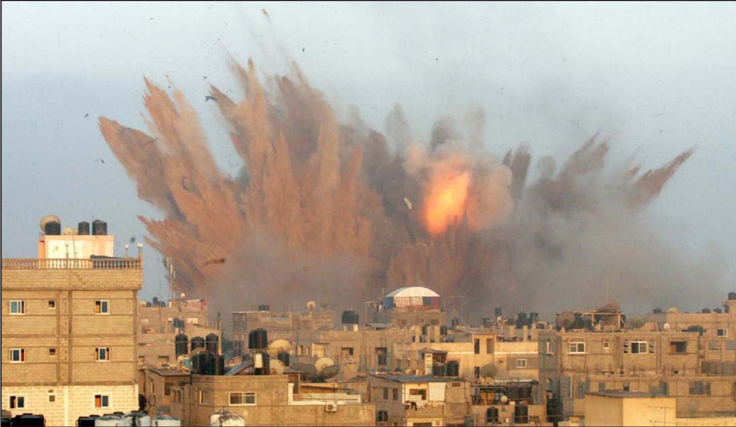
اصعدت الهبب تتصاعد بعد القصف الاسرائيلي على رفح

بعشرات الأمتار، فالنفق والمعادن غير موجودة على نحو عام قريبة جدا تحت الأرض ولهذا يهتمون، والترح أحد المدنيين جهازا ذا حساسية عالية بكل تغيير اهتزازي، فتبين إن الجهاز يتحرك في كل مرة تسير فيها دبابة على طريق ترابي فتخلوا في الجيش الإسرائيلي عن خدمات.