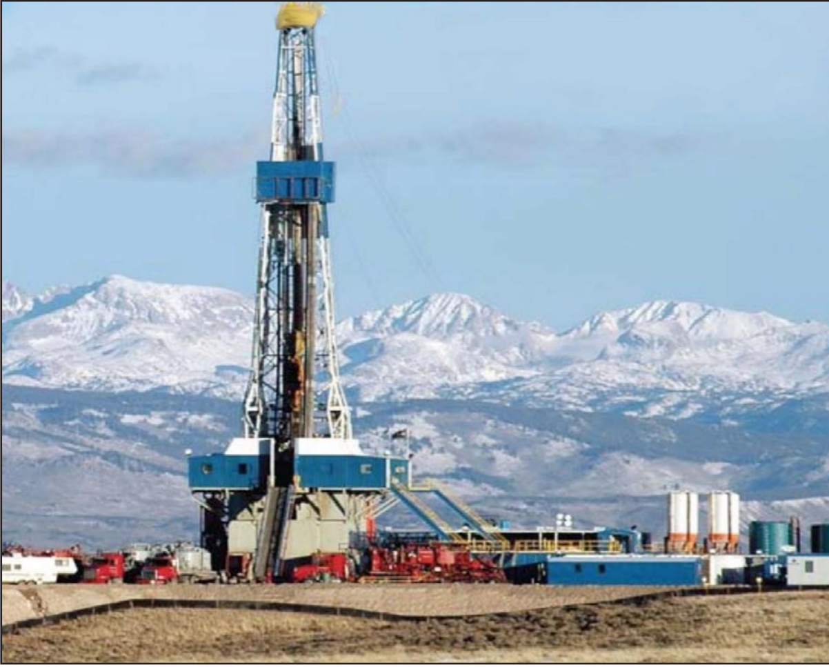
موقع لإستخراج النفط الصخري من أمريكا

نقص إمدادات النفط من العراق قد انحسرت بعض الشيء مع عدم تأثر الصادرات من مرفأ جنوب البلاد بالقتال الدائر بين المسلحين من العرب السنة والقوات الحكومية. وتوقع البنك أن يبلغ الطلب العالمي 92.478 مليون برميل يوميا في 2014 بما يزيد 425 ألف برميل يوميا عن مستوى الإنتاج. وبالنسبة لعام 2015 توقع أن يبلغ الطلب العالمي 93.426 مليون برميل يوميا، بزيادة حوالي 464 ألف برميل يوميا عن الإنتاج. وتوقع البنك أن يبلغ سعر برنت 120 دولارا للبرميل في 2016 والخام الأمريكي 113 دولارا.