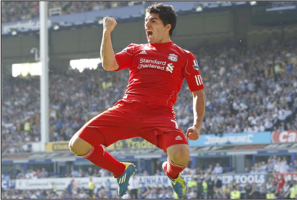
سواريز تالق مع ليفربول الموسم الماضي ويأمل بتكرار التالق في اسبانيا