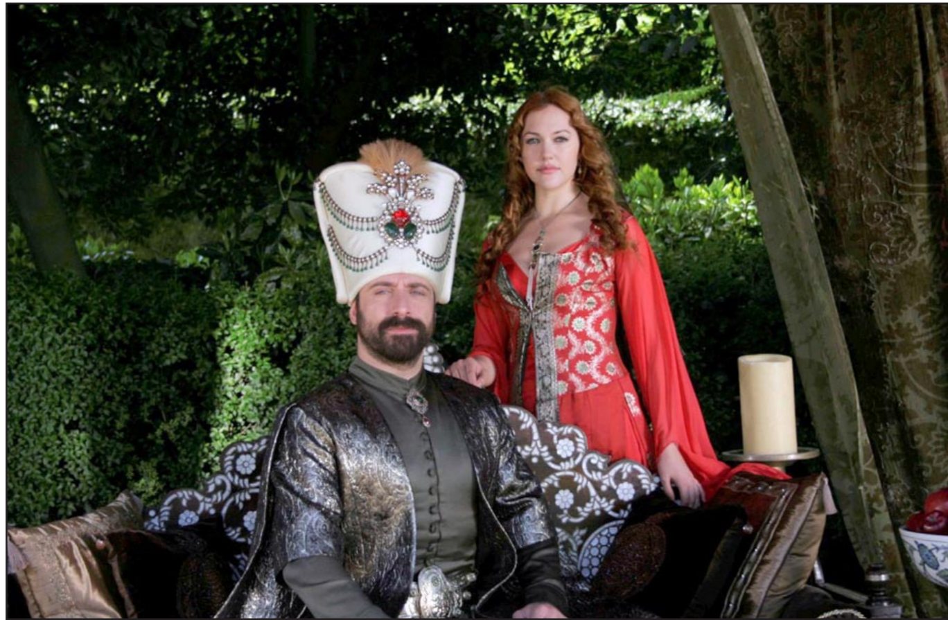
لقطة من مسلسل «حريم السلطان»

الذي يعتره به المسلمون جميعاً» وهو ما استغله جيداً رئيس الوزراء فقام بهاجمة العمل في معرض دفاعه عن التقاليد التركية والقيم والمبادئ التي يُسوّق بها سياسته ولحزبه التي لاقت قبولا كبيراً لدى المجتمع التركي. لم يقتصر الجدل على السياسيين فقط، بل شمل أطرافاً عدة، فاستاذة التاريخ الإسلامي انقسموا أيضاً بين رأي يؤكد هذا الجانب في شخصية السلطان سليمان القانوني مع اعترافهم بإنجازاته السياسية والحربية والتوسعية، وبين آخر مُنكر للأمر تماماً، واصفاً أحداث المسلسل بالمبالغة وعدم المنطقية، أما على مستوى الأوساط الشعبية التركية خاصة بين طلاب مدارس الأئمة والخطباء ووكليات الإلهيات، فتمتدح إجماع على رفض ما جاء في المسلسل جملة وتفصيلاً، بل يصفون أحداثه بالكذب والافتراء على سلطان يصفون عصره بأنه عصر العظيمة، وفي أحايث كثيرة تصل حالة الرفض إلى الغضب الشديد بمجرد ذكر اسم المسلسل، وهو ما قاد انتصار الفريق في وقت سابق إلى رشق القناة التركية (Show TV) التي كانت تعرضه بالببيض، وفي ذات الوقت تم تقديم أكثر من 750 ألف عرضة ضد المسلسل، بحجة تجزئته التاريخي، وتحت الضغط الشعبي وقبيلته الرسمي أصدر المجلس الأعلى للإذاعة والتلفزيون التركي (RTÜK) بياناً جاء فيه «أن المحطة التي تعرض المسلسل بؤت حقائق مغلوطة عن حياة السلطان الشخصية، وبالتالي لا بد من تقديم اعتذار للشعب التركي»، وهو ما جعل أصحاب العمل يخرجون عن صمتهم بالدفاع عن المسلسل.