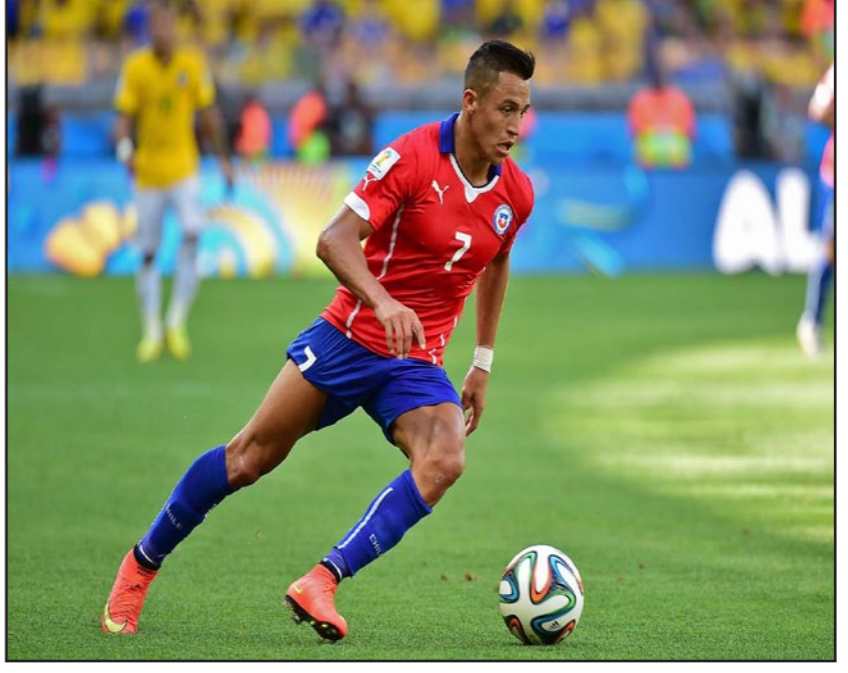
سانثيز تالق مع تشيلي في المونديال قبل انتقاله إلى شمال لندن

لندن - رويترز: قال نادي أرسنال الإنجليزي إنه أكمل إجراءات ضم أليكسيس سانثيز مهاجم تشيلي من برشلونة الإسباني. ولم يتكفف النادي عن المقابلات المالية للتعاقد مع اللاعب البالغ من العمر 25 عاماً لكن وسائل إعلام قدرت الصفقة بنحو 35 مليون جنيه استرليني. وكان سانثيز انضم إلى برشلونة من أودينيزي الإيطالي في 2011. وقال أرسين فينغر مدرب أرسنال: «كما شاهدتم في كأس العالم الحالية يعد أليكسيس من اللاعبين الرائعين ونحن سعداء بانضمامه إلى أرسنال». وأضاف: «سيعضف أليكسيس القوة والإبداع والمهارات إلى التشكيلية وتتطلع للعمل معه في غضون أسابيع قليلة». وقال النادي في بيان: «نحن سعداء بانضمامه إلى أرسنال». وأضاف: «أعني لقاء زملائي الجدد واللاعب مع أرسنال في الدوري الممتاز ودوري أبطال أوروبا... سأعطي أقصى ما في وسعي لأرسنال، أريد أن أسعد جماهيره». وكان سانثيز يلعب بقميص تشيلي التي تالقت في البرازيل وبلغت دور الستة عشر قبل الخسارة أمام أصحاب ألقاب بركات والترجيح، وسجل هدفين في أربع مباريات. والقي اللوم على افتقار أرسنال للاعبين الهجومية في خروجهم من سباق المنافسة على لقب الدوري الإنجليزي منذ رحيل روبن فان بيرسي إلى مانشستر يونايتد في 2012. وسجل أرسنال 68 هدفاً في 38 مباراة وهو أقل عدد من الأهداف يسجله فريق من الأربعة الأوائل الموسم الماضي. وتصدر الفرنسي أوليفييه جيرو قائمة هدافي أرسنال برصيد 16 هدفاً. وبالقوة والسرعة سيسمح سانثيز المدرب فينغر خيارات هجومية أكبر. وقال فينغر: «قدم موهبة أعلى مستوى على مدار عدة مواسم ونحن جميعاً سعداء بالتعاقد على اللاعب». ويتوقع أن يبدأ سانثيز مهمته مع أرسنال في بطولة كأس استاد الثالث من أغسطس/ آب.