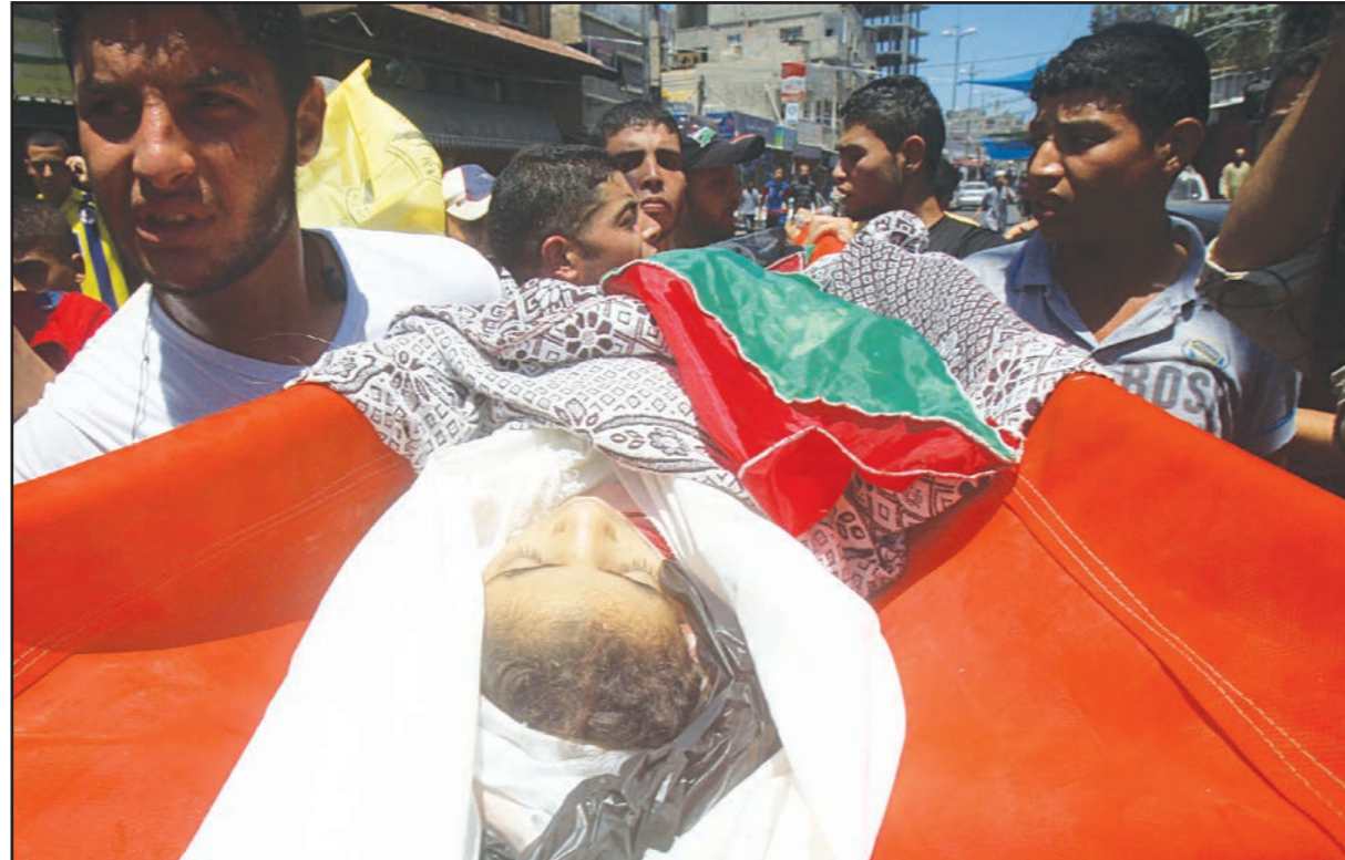
شهيدة سقطت جراء القصف الجوي الإسرائيلي على غزة امس

الناصرة - غزة - «القدس العربي» من أشرف الهور وفادي ابو سعدي: في اتصال هاتفي هو الاول منذ بدء العدوان الإسرائيلي على قطاع غزة قبل 5 ايام، عرض الرئيس الامريكى باراك اوباما على رئيس الوزراء الاسرائيلي بنيامين نتنياهو، المساعدة في التوصل الى تهدئة بين إسرائيل وقطاع غزة كالتى كانت قائمة منذ تشرين الثاني/نوفمبر 2012. وجاءت مكالمة أوباما مع نتنياهو بعدما قال الأخير في ختام جلسة المجلس الوزاري المصغر