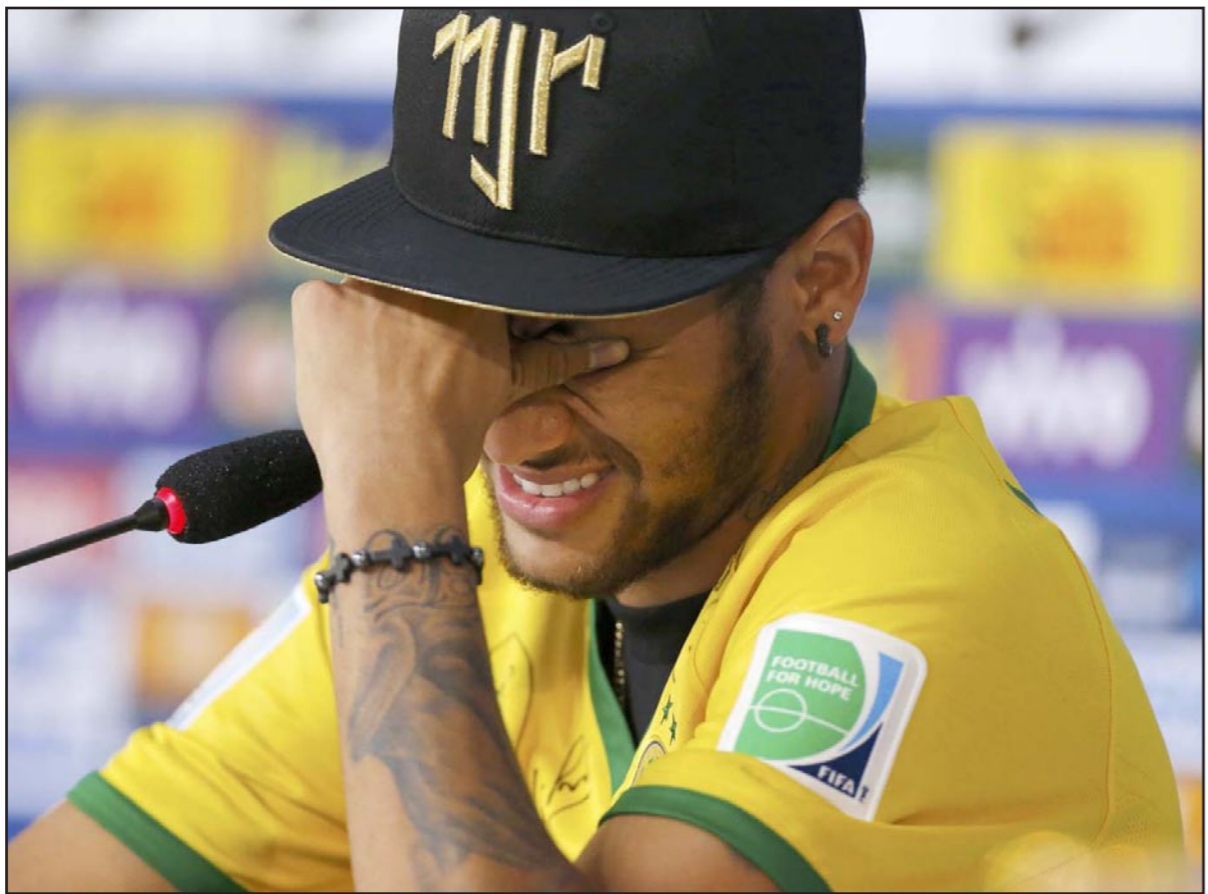
نيمار باكيا خلال المؤتمر الصحافي قبل لقاء تحديد المركز الثالث

وسبق لنيمار أن زار معسكر الفريق التدريبي يوم السبت الماضي محمولا على الحفة (النقالة) الطبية قبل أن يرحل عن المعسكر بالطائرة مروحية. كما نال اللاعب ترحيبا باللاعب زملائه ومن المدرب لويز فيليب سكواري لدى زيارته إلى المعسكر مساء أمس الأول. وقال نيمار إنه سيسعى لمساعدة زملائه رغم عدم مشاركته في المباراة مشيرا إلى أن الفريق يجب أن يتعامل مع مباراة المركز الثالث كما لو كانت المباراة النهائية وذلك حتى ينهي الفريق مسيرته في الموندیال مبتمسا.