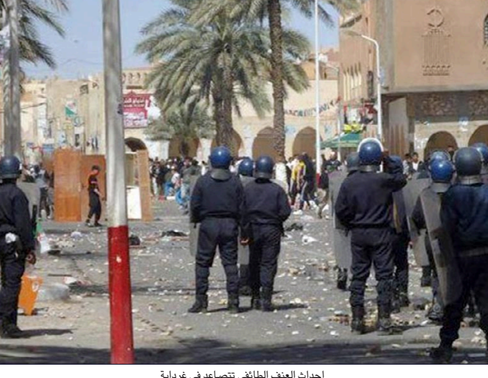
احداث العنف الطائفي تتصاعد في غرداية

شهدت مدينة غرداية 600 كلم جنوبي العاصمة الجزائرية، موجة جديدة من العنف الطائفي بين العرب السنة والأمازيغ الإباضيين، اضطرت معها أكثر من 18 أسرة لمغادرة بيوتها التي تم حرقها وتخريبها خلال أعمال العنف التي تواصلت دون انقطاع منذ صباح يوم الخميس.