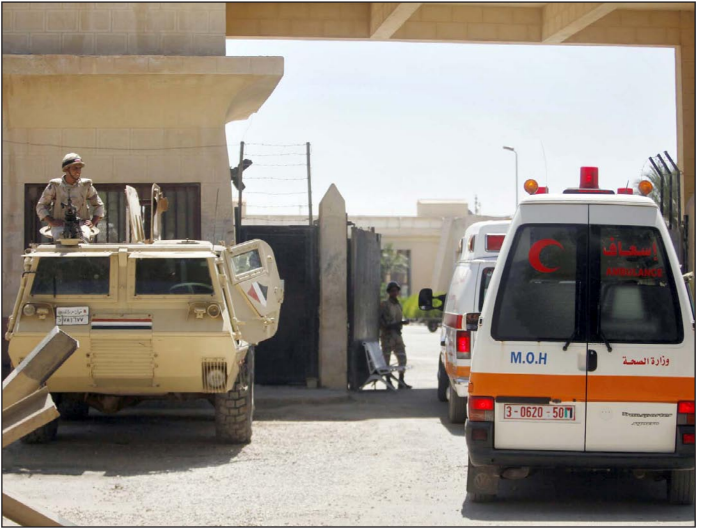
سيارات اسعاف تنقل مصابين فلسطينيين جراء القصف الاسرائيلي على غزة الى المستشفيات المصرية

و لكن تحفظ على توقيت صدورها فهو توقيت غير موفق وغير مناسب بالرة لأنها جاءت في شهر رمضان والذي تكون فيه