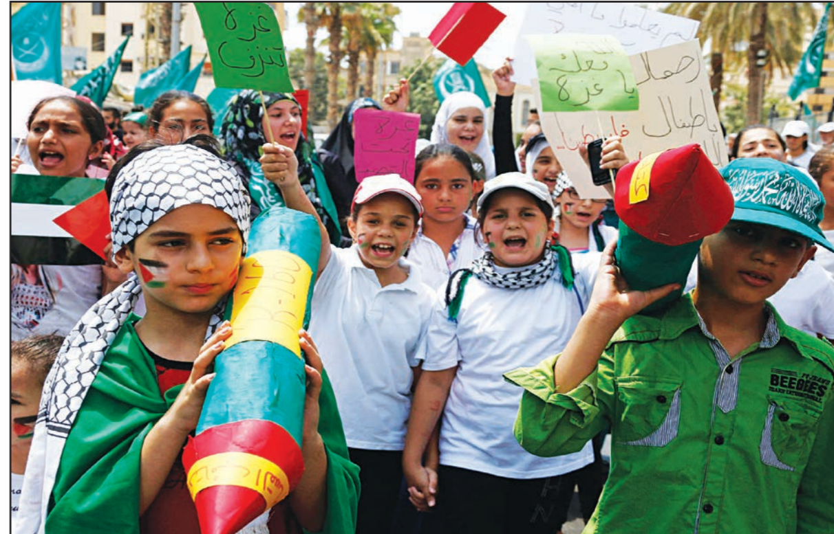
اطفال يشندون ويحملون صواريخ كرتونية خلال مظاهرة في لبنان امس للاحتجاج على العدوان الاسرائيلي على غزة

طالبان تحت المسلمين على عدم «الغلو في الدين» وجاء فيها «حري بأن يتشكل مجلس شورى من قادة جميع الفصائل الجهادية والعلما والخبرة الأفضل في الشام كي يتمكنا من حل نزاعاتهم في ضوء الآراء والمشورات المشتركة». وأضافت «على المسلمين أيضا أن يجتنبوا الغلو في الدين والحكم على الآخرين بدون بينة ولا يسيئوا الظن فيما بينهم ولا يستمعوا للاثهات والتهجمات الجوفاء فان بعض الظن أثم».