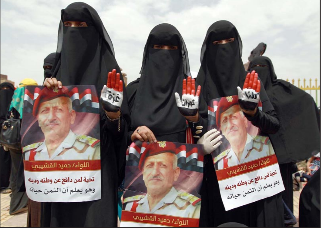
يمينات يرفعن صورة قائد عسكري قتلته الحوثيون في صنعاء أمس