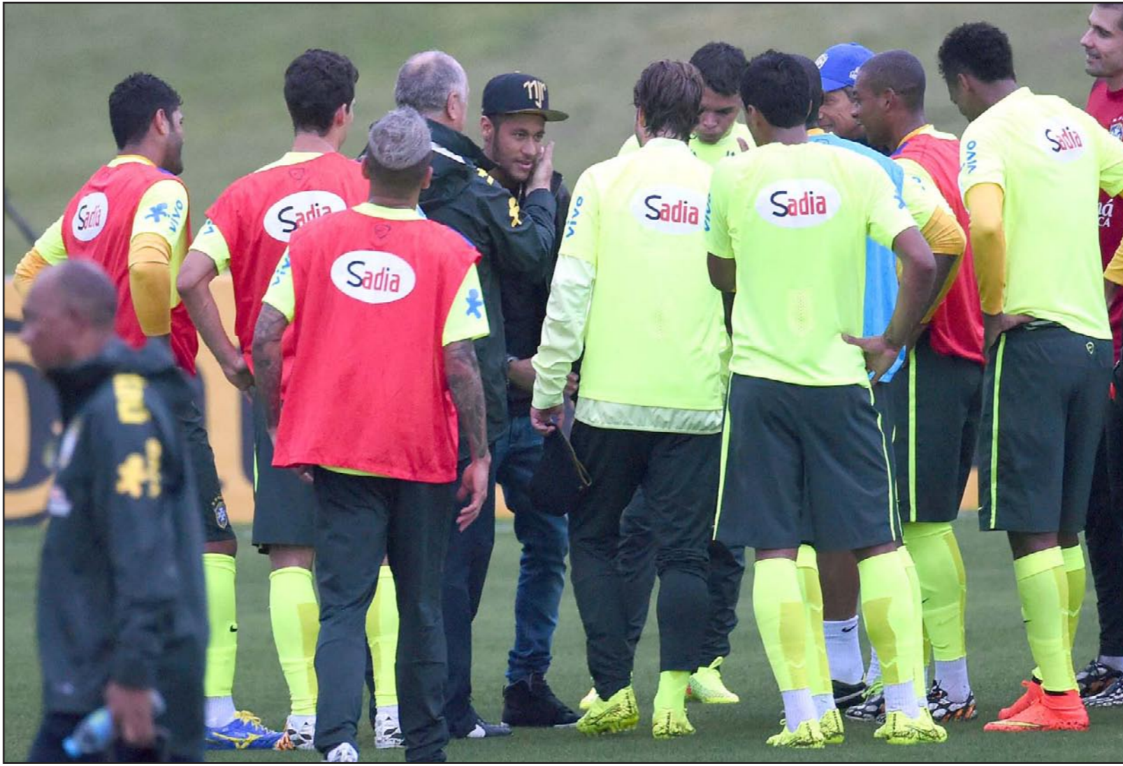
لاعبو المنتخب البرازيلي يرحبون بزيارة نيمار عقب أصابته

ويتحدد مستقبل سكواري مع الفريق بعد انتهاء مسيرته في الموندیال الحالي وينتظر أن تكون المباراة في العاصمة البرازيلية هي الأخيرة له مع الفريق. علما أنه قاد المنتخب البرازيلي في فترة أخرى قبل سنوات وأحرز