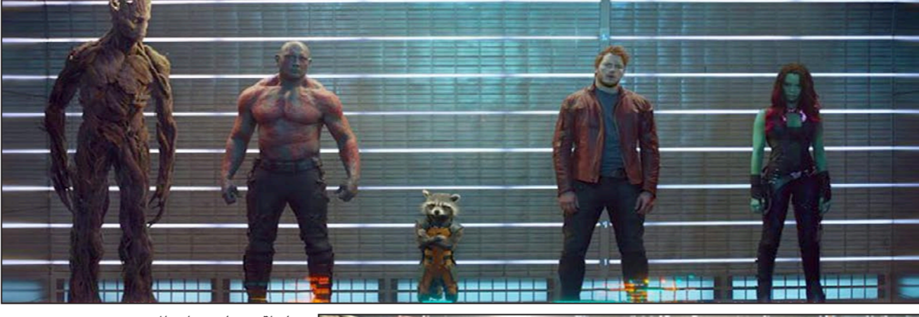
لقطة من فيلم 'حراس المجرة'

رغم أنه لم يكن هناك عدد كبير من الأفلام الفاضلة في شباك التذاكر هذا الصيف، إلا ان إيرادات أفلام هوليوود في أمريكا هبطت بنسبة 15% عن العام الماضي، حيث حققت ما يوازي 4.1 مليار دولار، وهو أدنى الإيرادات منذ 2006 حيث كانت حصيلتها 3.62 مليار دولار. كما انخفض عدد التذاكر إلى 500 مليون وهذا أقل الأعداد منذ 1992 حيث زار دور السينما ما يعايد 400 مليون شخص. وللمرة الأولى منذ 2001 لم يحقق أي فيلم أكثر من 300 مليون دولار في شباك التذاكر الأمريكي.