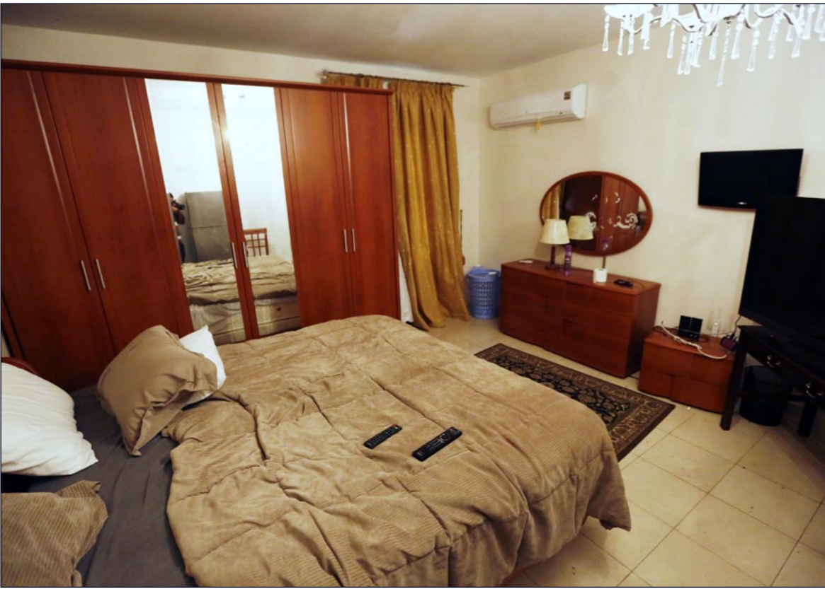
صورة لغرفة نوم في فيلا داخل مجمع السفارة الأمريكية في طرابلس الذي اقتحمه نشطاء يتبعون لـ«فجر ليبيا»

التعرض لأي من أعضاء المجلس أو ما يعرقل عملهم حال انعقاد المجلس في طرابلس، أو أي مدينة يتواجد بها ثوار فجر ليبيا». وأدانت عملية «فجر ليبيا» في البيان ما وصفته بـ«الهجوم الجبان» الذي وقع على مخيم النازحين من مدينة تاورغاء وأدى إلى سقوط قتيل وإصابة ثلاثة من المدنيين، متعددة بالتعاون مع الجهات الأمنية لتعقب الجناة وتقديمهم للعدالة. في سياق متصل قالت مصادر طبية وعسكرية ليبية إن اشتباكات عنيفة اندلعت بين قوات اللواء السابق خليفة حفتر ومعسكرات إسلاميين في مدينة بنغازي بشرق ليبيا السبت مما أدى إلى مقتل ما لا يقل عن عشرة أشخاص وقصف المطار بصواريخ. وتشهد ليبيا أعمال عنف فئوية مع اندلاع قتال بين الجماعات المسلحة التي ساعدت