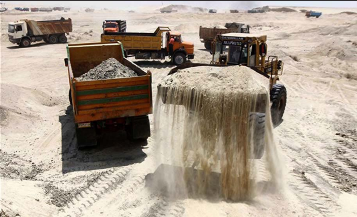
تواصل اعمال حفر القناة الجديدة

لغاية الآن أكثر من 22 مليون متر مكعب، بنسبة تصل إلى 4.3% من حجم أعمال الحفر، وأن أعداد شركات المقاولات العاملة بالمشروع وصل إلى 56 شركة منها 53 شركة تواصل عملها، و3 شركات أخرى بدأت أعمال المساحة تهيئاً للبدء في أعمال الحفر. وبحسب تصريح سابق للوزير فإن حجم أعمال الحفر بالمشروع سيصل إلى نحو 510 ملايين متر مكعب من الرمال، منها 250 مليون متر مكعب نواتج أعمال الحفر الجاف، و260 مليون متر مكعب نواتج أعمال التكريك (تجريف رمال من المجرى المائي للقناة). وأضاف الوزير في تصريحات صحافية أمس أن 70 معدة جديدة وصلت إلى موقع الحفر، تم توزيعها على الشركات العاملة في الموقع، مشيراً إلى أن 14 موقعا في المشروع، ظهرت فيها مياه جوفية، بعد أعمال حفر لا تتجاوز العشر أمتار تقريبا. وقال مسئول هندسي في هيئة قناة السويس، فضل عدم ذكر اسمه، ان ظهور المياه في مواقع في المشروع يعني ضرورة بدء عمل كراكات (جرافات يمكنها ان تعمل في الماء ايضا) هيئة القناة ميكرا في هذه المناطق، لأن معدات الحفر الجاف من لواند وغيرها، يصعب أن تعمل في أماكن تتواجد بها مياه. وأعمال التكريك هي أعمال تعميق