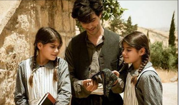
لقطة من الفيلم

يشار إلى أن ذاكت يناقش ضمن 20 فيلما على أكبر جوائز مهرجان البندقية في دورته الحادية والسبعين. ويعرض المهرجان أيضا الفيلم الفرنسي «لوان ديزوم» أو (يعيدا عن الرجال) للمخرج الفرنسي دافيد أولهوفن والذي يدور حول الثورة الجزائرية، وفيلم «هانجري هارتس» للمخرج الإيطالي سافيريو كوستانتسو. كما ينتظر الإيطاليون مشاهدة فيلم «بيلوسكوني» أو «نا ستوريا سبيليانا» الوثائقي الذي يدور حول برلسكوني، ويربط الفيلم بين مدينة صقلية والمافي بها وبين برلسكوني.