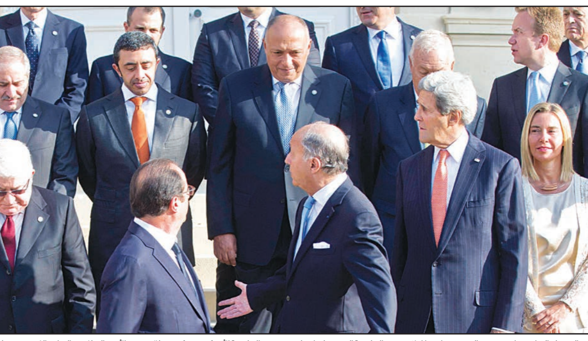
الرئيسان العراقي فؤاد معصوم والفرنسي فرانسوا أولاند ووزير الخارجية الفرنسي لوران فابيوس ووزير الخارجية الأمريكي جون كيري خلال مؤتمر «الامن والسلام في العراق» الذي عقد في باريس أمس

جنيف- رويترز: قالت منظمة الهجرة الدولية أمس الاثنين ان أكثر من 500 شخص هربوا من أفريقيا والشرق الأوسط ربما غرقوا في أحدث تحطم لسفينة في البحر المتوسط ليصل عدد القتلى هذا العام إلى قرابة ثلاثة آلاف. وفي الحادث الأسوأ يعتقد أن زهاء 500 مهاجر لقوا حتفهم بعد أن صدم مهربون قاربهم قبالة ساحل مالطا الأسبوع الماضي في واقعة لم تعرف إلا بعد شهادة اثنين من تسعة ناجين. وقالت كريستيان بيرثاوم المتحدث باسم المنظمة لرويتزر في جنيف إن الناجين قالوا إن المهربين طلبوا من المهاجرين أن يركبوا قارباً آخر في وسط البحر، ورفض المهاجرون مما أدى إلى اندلاع مواجهة انتهت بان صدم المهربون السفينة التي كان يستقلها المهاجرون. وقالت «كان على متي القارب 500- سورويون.. فلسطينيون.. مصريون.. سودانيون، كانوا يحاولون الوصول إلى أوروبا». وأضافت بيرثاوم «في الملجأ، نجنا تسعة أشخاص وجرى انتشالهم بقوارب، وتابعت أن مسؤولين من منظمة الهجرة الدولية أجروا مقابلات مع ناجين فلسطينيين نقلوا إلى صقلية بإيطاليا بينما نقل الناجون الآخرون إلى مالطا وكريت. وبعداً بأربعة أيام قال متحدث باسم البحرية الليبية في سوسة متأخرة أمس الأول إن سفينة أخرى مليئة بالمهاجرين الأفارقة وعددهم 250 غرقت قبالة السواحل الليبية ويخشى من أن معظمهم قد توفى، ونجا 26 منهم.