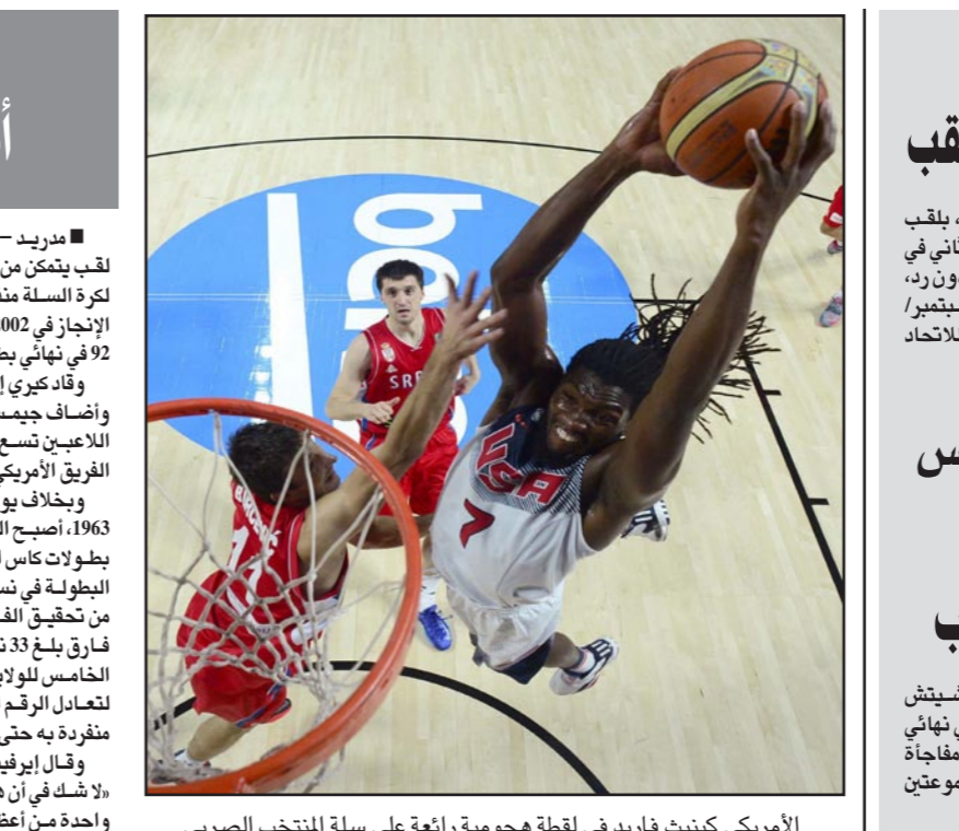
الأمريكي كينيث فاريد في لحظة هجومية رائعة على سلة المنتخب الصربي

■ مدريد - د ب أ: أصبحت الولايات المتحدة أول حامل لقب يتمكن من المحافظة على لقبه في بطولة كأس العالم لكرة السلة منذ أن حققت بولة فيوغوسلافيا السابقة هذا الإنجاز في 2002. وذلك بفوزها الساحق على صربيا لقب 92 في نهائي بطولة كأس العالم للسلة في أسبانيا. وأضاد كيري إيرفينغ الهجوم الأمريكي مسجلاً 26 نقطة، وأضاف جيمس هاردين 23 نقطة أخرى حيث سجل كلا اللاعبين تسع ميات ثلاثية من أصل 15 ثلاثية سجلها الفريق الأمريكي. وبخلاف فيوغوسلافيا في 2002 ومن قبلها البرازيل في 1963، أصبح الفريق الأمريكي هو الثالث فقط في تاريخ بطولات كأس العالم للسلة الذي تمكن من إحراز لقب البطولة في نسختين متتاليتين. وتمكن الفريق الأمريكي من تحقيق الفوز بجميع مبارياته في أسبانيا بمتوسط فارق بلغ 33 نقطة بالمباراة الواحدة. كما كان هذا اللقب الخامس للولايات المتحدة ببطولات كأس العالم للسلة لتعادل الرقم القياسي العالمي الذي كانت فيوغوسلافيا منفردة به حتى نهائي هذه البطولة. وقال إيرفينغ الذي فاز بلقب أفضل لاعب في البطولة: «أشك في أن هذا هو أكبر إنجاز في حياتي حتى الآن. إنها واحدة من أعظم اللحظات في حياتي. حققنا هذا الإنجاز