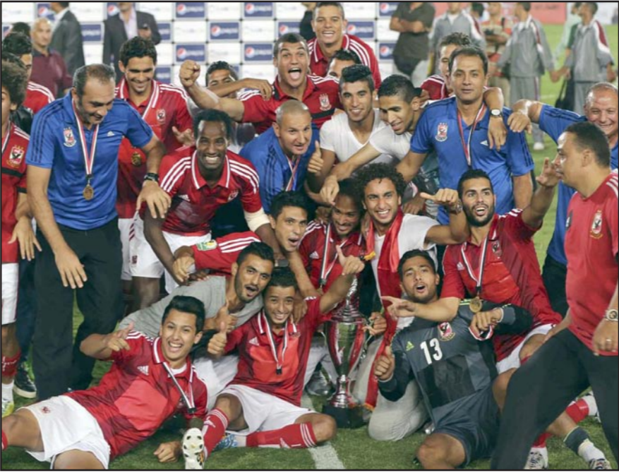
نجوم ومسؤولو الأهلي يحتفلون بلقبهم الثامن