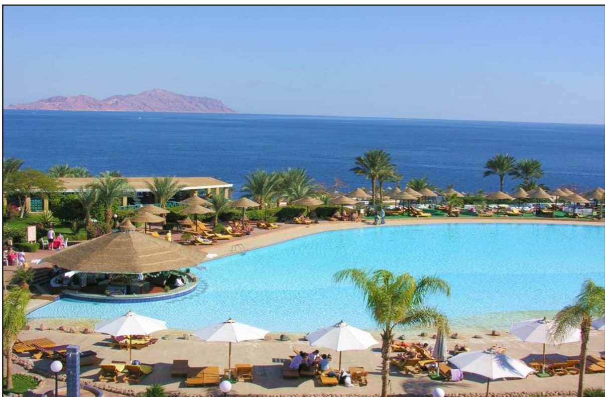
متمتع سياحي في شرم الشيخ

■ القاهرة - رويترز: توقع وزير السياحة المصري زيادة أعداد السائحين والإيرادات بين خمسة وعشرة في المئة في العام الحالي وبين 15 و20 في المئة في 2015، معولا على زيادة الاستقرار بعد الانتخابات البرلمانية المزمعة. وقال الوزير هشام زعزوع في مقابلة «في 2015 سيكون الاستحقاق الثالث والأخير قد تم، مشيرًا إلى الانتخابات البرلمانية. وأضاف «أتمنى دخول 2015 بقوة وأن يكون الاستقرار متوفرًا بشكل أكبر لنستعيد الأرقام الحقيقية كما كنا عليه في 2010». وقال وزير مصر في 2013 نحو 9.5 مليون سائح، وبلغت الإيرادات 5.9 مليار دولار. وبالمقارنة بلغت أعداد السياح 14.8 مليون في 2010. وقال زعزوع «أركز حاليا على استعادة الطلب مصر، وعندما أستعيد الطلب ستترك الأسعار بشكل إيجابي .. لدينا نحو 225 ألف غرفة وعندما تكون نسب الإشغال بين 80 و90 في المئة ستتحسن الأسعار وتزداد نسب إنفاق السائح». وأضاف «مصر ما زالت في مرحلة التعافي .. علمت من البنك المركزي أن هناك تحسنا نسبيا في متوسط الإنفاق السياحي ... في 2010 كان متوسط 85 دولارا للسائح في الليلة، وانخفض في الثلاث سنوات الماضية واقترب من 62 دولارا في بداية العام، واليوم علمت أنه حدث تحسن في الربع الأخير ووصلنا إلى 74 دولارا».