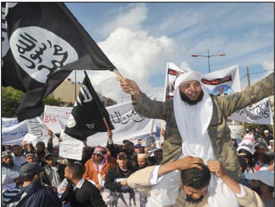
تظاهرة لسلفيين في المغرب يرفعون راية داعش

استهداف ثكنة عسكرية بالقرصين متحفظا عن ذكر تفاصيل أخرى حول هذه العملية، و من جهة أكد الناطق الرسمي باسم وزارة الداخلية محمد علي العروي استقرار الحالة الأمنية لولاية القصرين وصفها بالعادية والمستقرة حسب تعبيره... من جهة أخرى ما زالت الفرق الأمنية تتابع العناصر التي يشتبه في علاقتها بالإرهاب كما تقع ملاحقة العناصر المختصة بالفرار، وقد نقلت مصادر إعلامية (موقع حقائق أون لاين)، نقلا عن مصادر أمنية أن الوحدات الأمنية بولاية الكاف تمكنت السبت 13 أيلول/سبتمبر في الحي الشعبي «حي أحمد الشريفي»، من اللقاء القبض على عنصر مصنف بالخطير جدا من العناصر المتشددة دينيا وأضاف أن هذا العنصر كانت قد صدرت في شأنه عدة برقيات تفتيش في قضايا مختلفة منها ابواء عناصر إرهابية والمشاركة في أحداث الشغب ومحاولة حرق مقرات أمنية بالكاف.