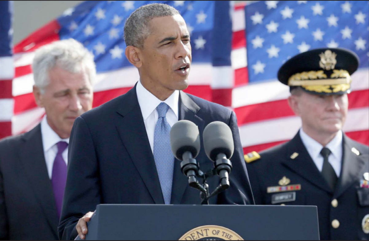
الرئيس الأمريكي باراك أوباما وخلفه وزير الدفاع يلقي كلمة في ذكرى 11 أيلول

أن آثار ضربات الطائرات الأمريكية بدون طيار ضد تنظيم القاعدة في شبه جزيرة العرب في اليمن كانت محدودة للغاية بسبب ضعف الحكومة وقواتها الأمنية في حين تحركت حركة «الشباب» الصومالية إلى عدة دول في شرق أفريقيا مما جعل الضربات الجوية أقل فعالية في تدمير المنظمة كما برزت صعوبات في تحديد الأهداف لعدم وجود قوات على الأرض. واقترح الجمهوريون بأن الضربات الجوية لوحدها لن تستطيع هزيمة «داعش» بما في ذلك رئيس مجلس النواب جون بوينر الذي قال بأن طائرات اف 16 ليست استراتيجية وأن الضربات الجوية لن تنجز ما تريد الولايات المتحدة انجازه. وقال الجنرال هايدن بأن التدخل المحدود سيرسل رسالة خاطئة إلى الحلفاء في المنطقة فضلا عن الإغداء الذين يشككون في عزيمة الولايات المتحدة في حين قالت الإدارة الأمريكية بأن الاستراتيجية الحالية حققت نتائج جيدة، ولغاية الآن، شنت المقاتلات الأمريكية وقاذفات القنابل والطائرات بدون طيار حوالي 160 غارة جوية في العراق، معظمها صواريخ «هيليغار» على أكثر من 200 هدفاً من بينها مركبات عسكرية ولسعة ومرافق.