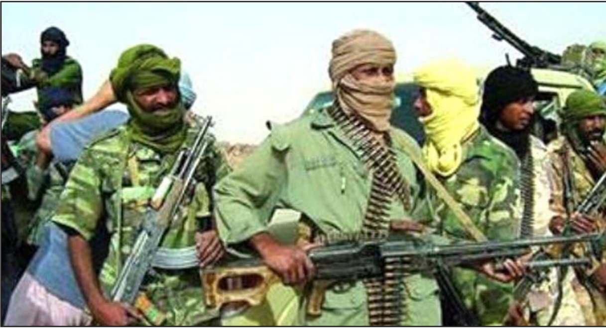
عناصر من حركة تحرير ازواد

الاساسية، في إشارة واضحة إلى قضية الوحدة الترابية لمالي، مبدياً تفاؤله بتحقيق الحوار لتقدم خلال الأيام القادمة.