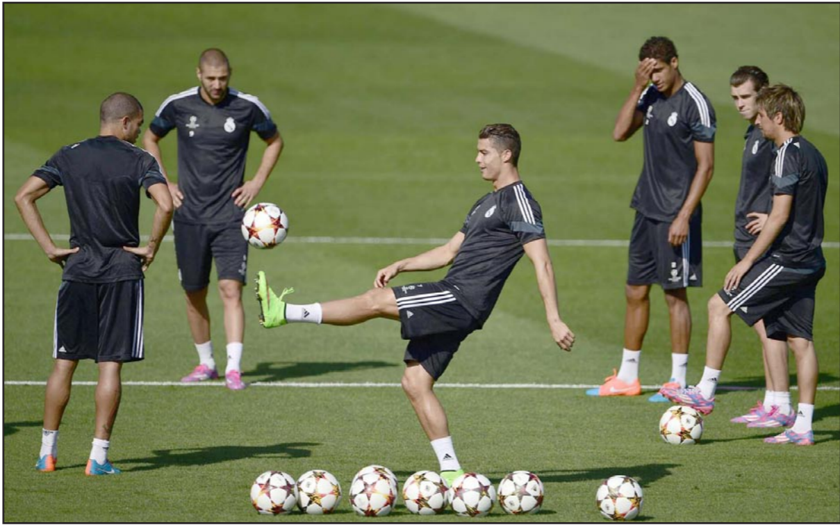
رونالدو يتوسط حصة تدريبات الريال قبل مواجهة بازل السويسري

لنقول إننا هنا نفهذ بجمعة المجموعة، حتى لو لم نغز في هذه المباراة، فإننا لا نريد أن نخسرها... وكان ليفربول، بطل أوروبا في 2005، خسر مباراته الأخيرة في الدوري الإنكليزي صفر/1 على ملعبه أمام أستون فيلا، لكنه سيمسي لتحقيق نتيجة أفضل اليوم أمام لودوغوريتس الذي سيغيب عن صفوفه حارس مرماه فريدريكسلاف ستويانوف لودوغوريتس وأنذر كلكتي جزءاً من الرومانيين