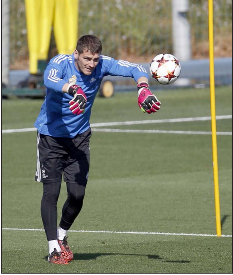
كاسياس يعيش فترة عصبية في مسيرته مع الريال

■ لندن - رويترز: أصبح ريو فيردناند مدافع مانشستر يونايتد السابق أول لاعب كبير ينتقد بشكل علني ديفيد مويز الذي تولى قيادة الفريق لعشرة أشهر خلال الموسم الماضي. وعين موز خلفاً لأليكس فيرغسون قبل انطلاق موسم الماضي لكن مدرب إيفرتون السابق خسر ثلاث مرات في أول ست مباريات واحتل في النهاية المركز السابع في أسوأ مركز له منذ 1990. واتهم فيردناند في سيرته الذاتية التي نشرها صحيفة «ذا صن» أنها «صنعت» حلقاته، مدربة السابق بأنه يملك «عقلية تناسب فريقاً أصغر» وأنه لم يتمكن من استيعاب التقاليد الهجومية للنادي. وكتب قائد يونايتد السابق: «تدخلات موز أسفرت في معظم الأحيان عن السلبية والارتباك... كان يحاول إعداد الفريق على ألا يخسر بينما على اللعب من أجل الفوز. نحن لسنا إيفرتون بل مانشستر يونايتد.»