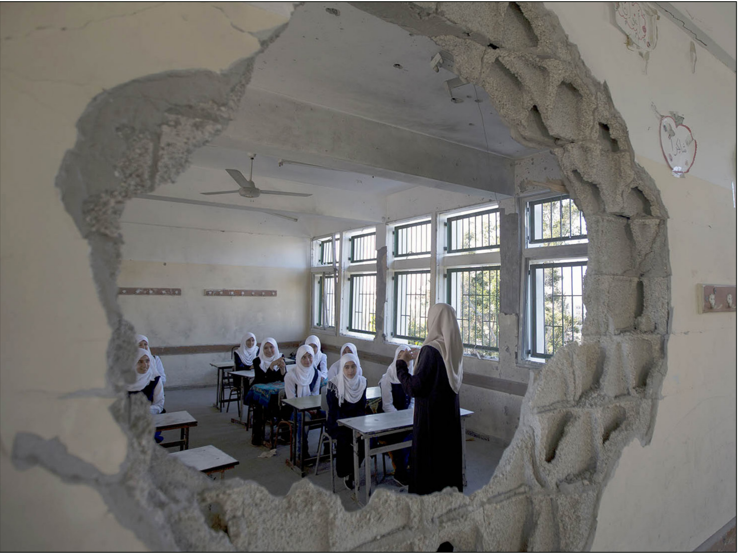
والخاصة ومدارس الأوزار، وسط توقعات بأن تشهد المدارس خلال الفترة المقبلة ازدياداً كبيراً بسبب تدمير 24 مدرسة بشكل كامل، وتضرر المئات منها.