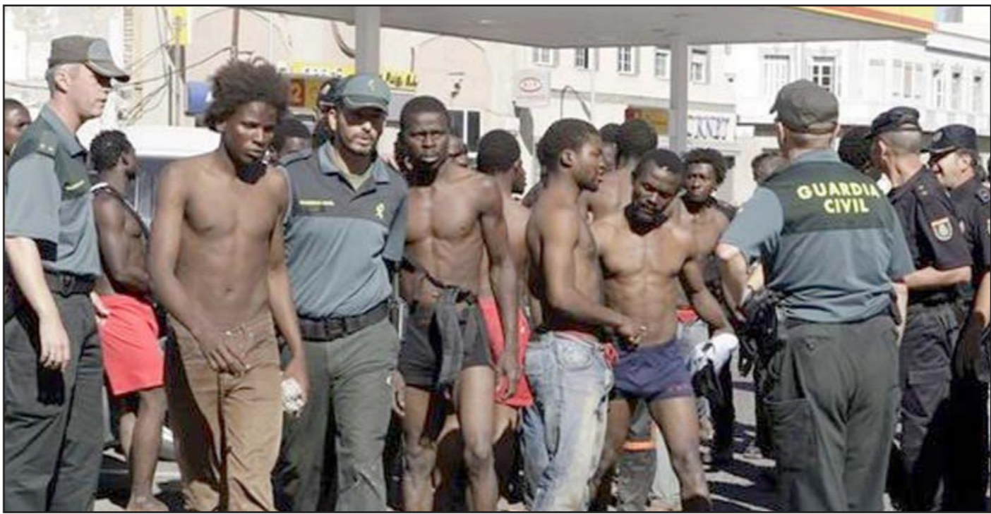
عناصر الحرس المدني الإسباني تحتجز مهاجرين أفارقة

وكان القضاء الإسباني قد أعلن التحقيق في الملف