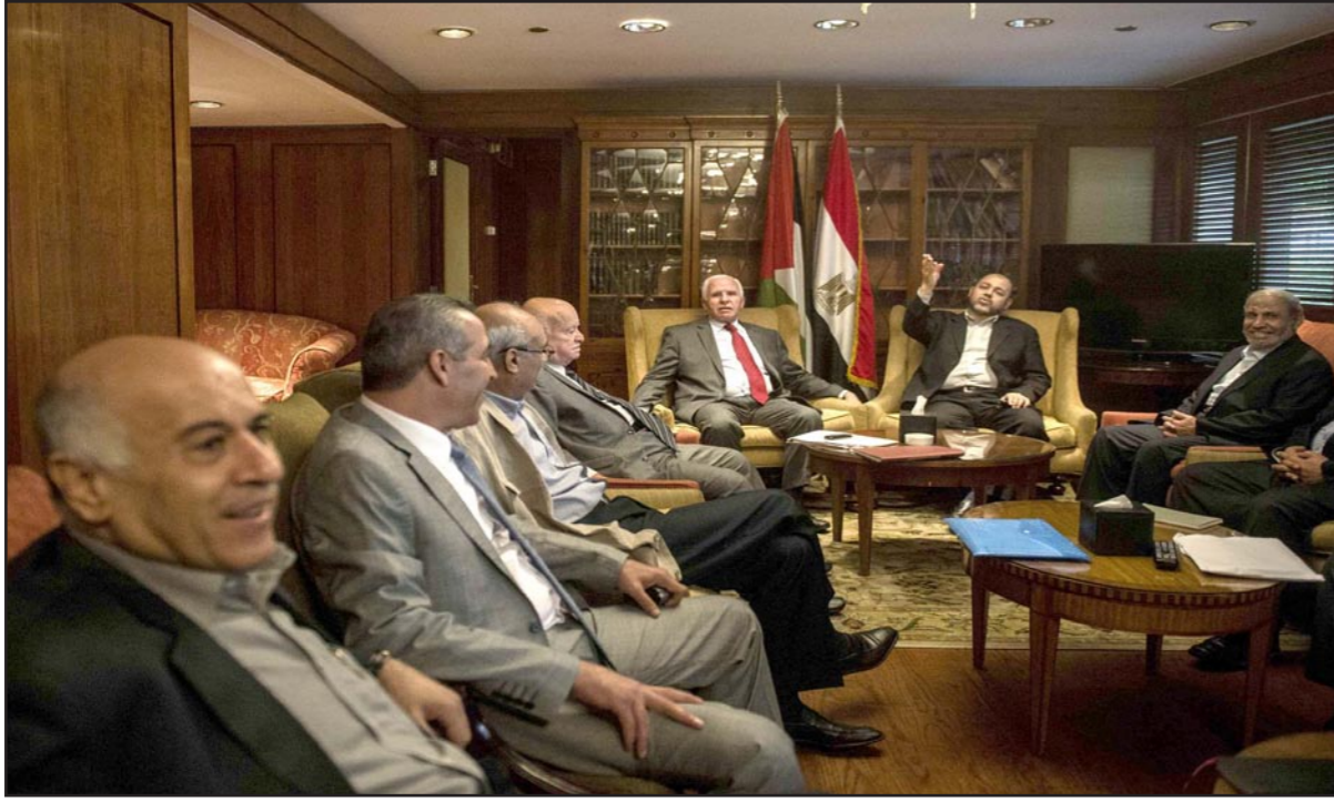
قطر والسعودية قدمتا أكبر المساعدات لحكومة التوافق الفلسطينية منذ بداية العام - (أ ف ب)

رام الله - محمد خبيصة: كشفت البيانات الشهرية الصادرة عن وزارة المالية في حكومة التوافق الفلسطينية، أن إجمالي المساعدات والمنح المالية التي تلقتها الحكومة منذ مطلع العام الحالي وحتى نهاية آب/ أغسطس الماضي بلغت 752.2 مليون دولار أمريكي، حيث تصدرت قطر الدول الداعمة بمساعدات بلغت 145 مليون دولار.