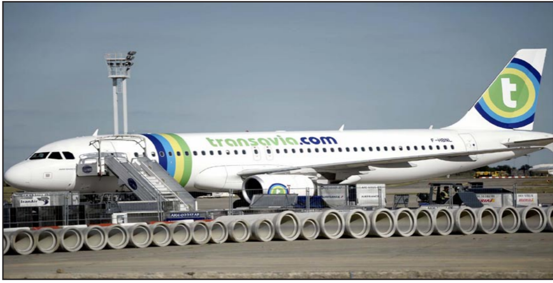
شركة ترانسافيا هي موضوع الخلاف بين الطيارين وإدارة «اير فرانس»