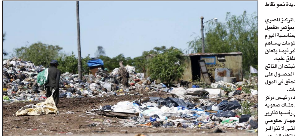
الدول الفقيرة تزداد فقراً على فقرها. الصورة لأحد العشوائيات في البرازيل حيث يسكن ملايين الفقراء