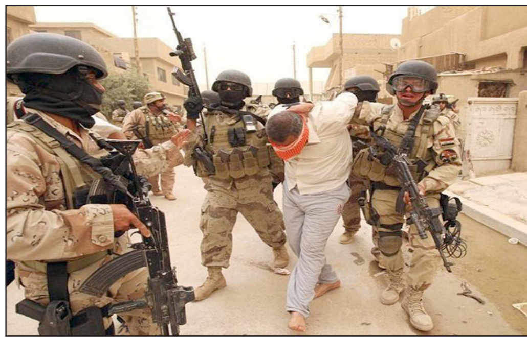
صورة أرشيفية للجيش المصري أثناء القاء القبض على أحد المطلوبين أمينا شمال سيناء

القاهرة - الأناضول: قال الجيش المصري، إنه قتل «26 من العناصر الإرهابية، نتيجة تبادل إطلاق النيران»، في الوقت الذي ألقى القبض على 84 آخرين من العناصر الإجرامية والمطرفة والمشتبه بهم». وأوضح العميد محمد سمير، المتحدث باسم الجيش المصري، في بيان نشره أمس الأحد، عبر صفحته بموقع التواصل الاجتماعي (فيسبوك)، أن «عناصر القوات المسلحة نجحت خلال الفترة بين 20-27 سبتمبر/أيلول الجاري، في قتل 26 من العناصر الإرهابية، نتيجة تبادل إطلاق النيران معهم، من بينهم 15 فرداً من العناصر الإرهابية والإجرامية بمحافظات شمال سيناء والإسماعيلية وبورسعيد والدقهلية». وأشار إلى أن «قوات من الجيش نجحت في تدمير 18 فتحة نفق بمدينة رفح بشمال سيناء».