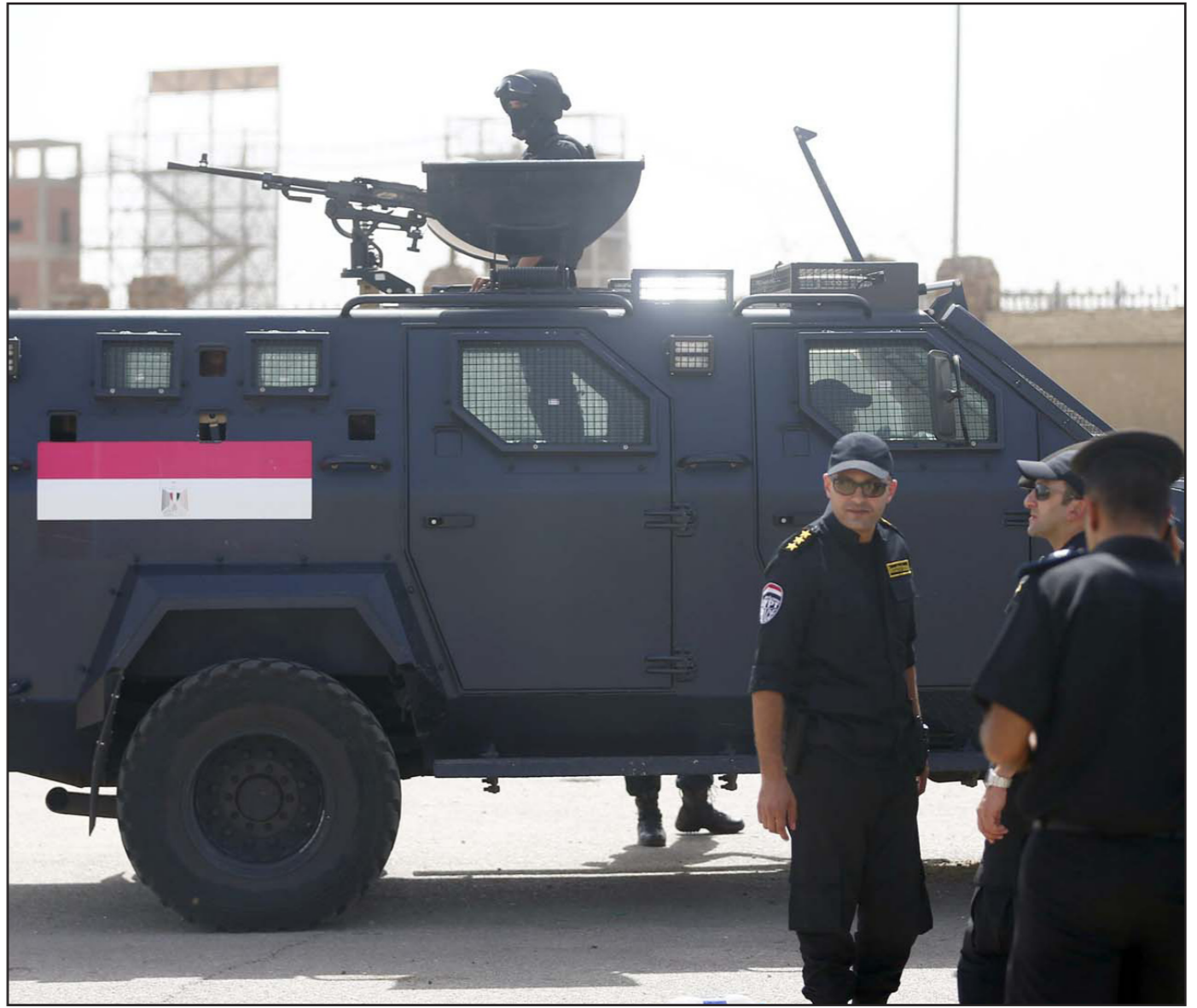
قوات من الحرس الخاص امام ااكاديمية الشرطة التي يحاكم فيها الرئيس السابق حسني مبارك في القاهرة

وقال الصحافيين أمس الأول السبت بعد كلمة كير «من الواضح بشكل كاف أنه منذ أن بدأت هذه الأزمة لم نستطع الاستمرار في مهمتنا الأصلية المتعلقة ببناء الدولة، يجب علينا أن نركز على تخفيف النتائج الرئيسية المترتبة على