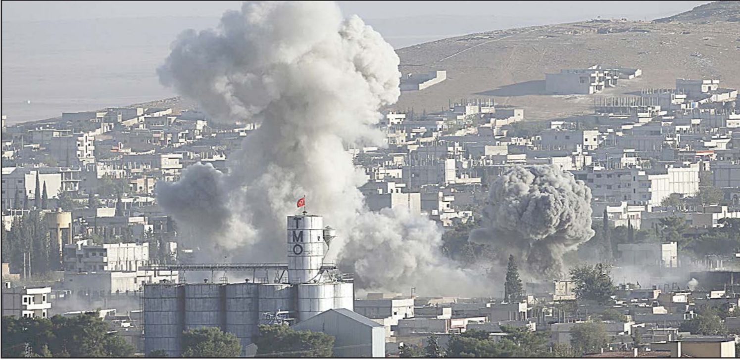
الدخان يتصاعد عقب غارات لقوات التحالف الدولي على مدينة عين العرب التي يسيطر عليها تنظيم «داعش»

وأضاف أن القصف بمدافع الهاون يستهدف منذ الساعات