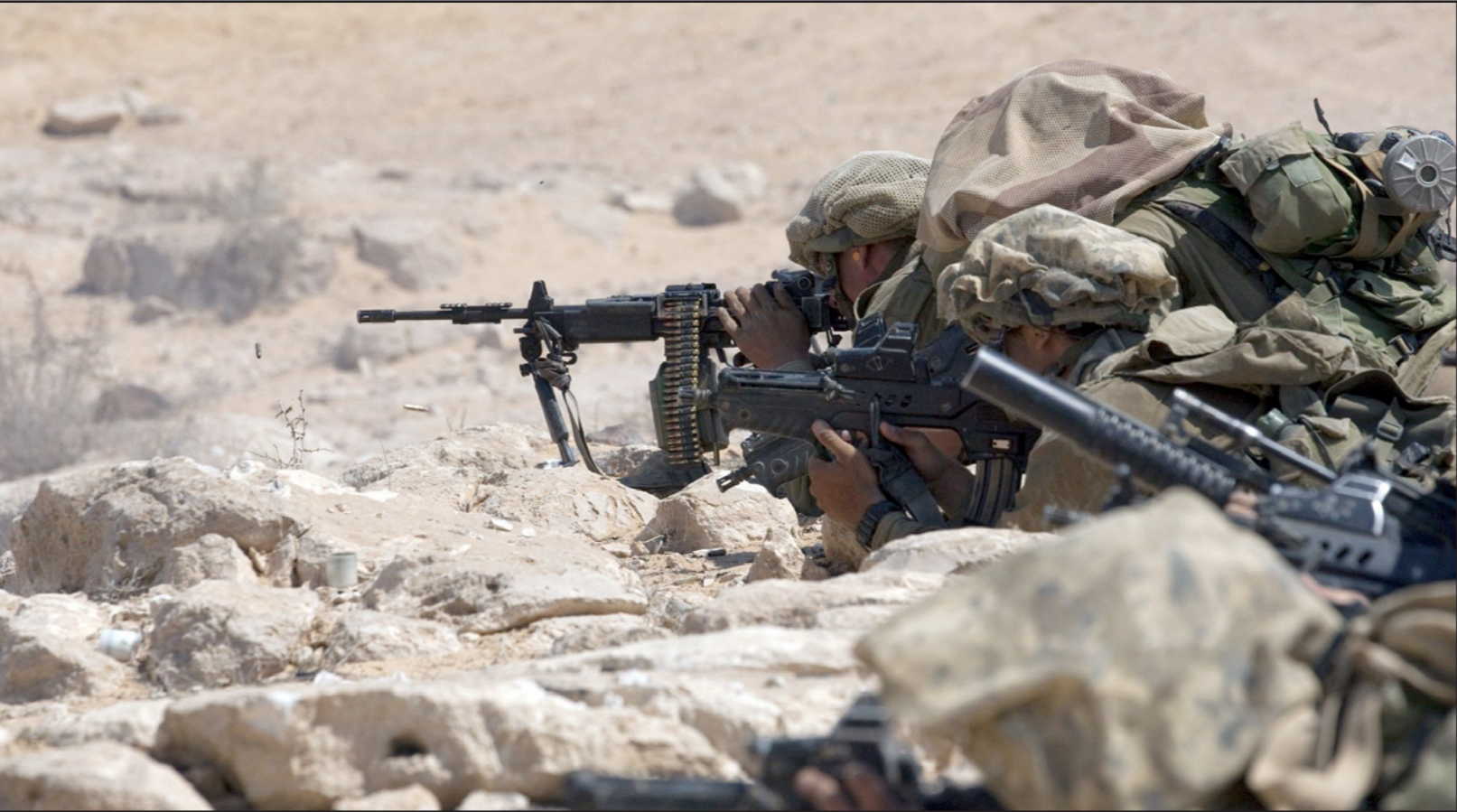
عناصر من الجيش الاسرائيلي على الحدود مع قطاع غزة

والى أن ينتخب رئيس اركان جديد، فان مهمة هيئة الاركان الحالية هي عدم الانجرار الى الحرب مثلما انجررنا الى