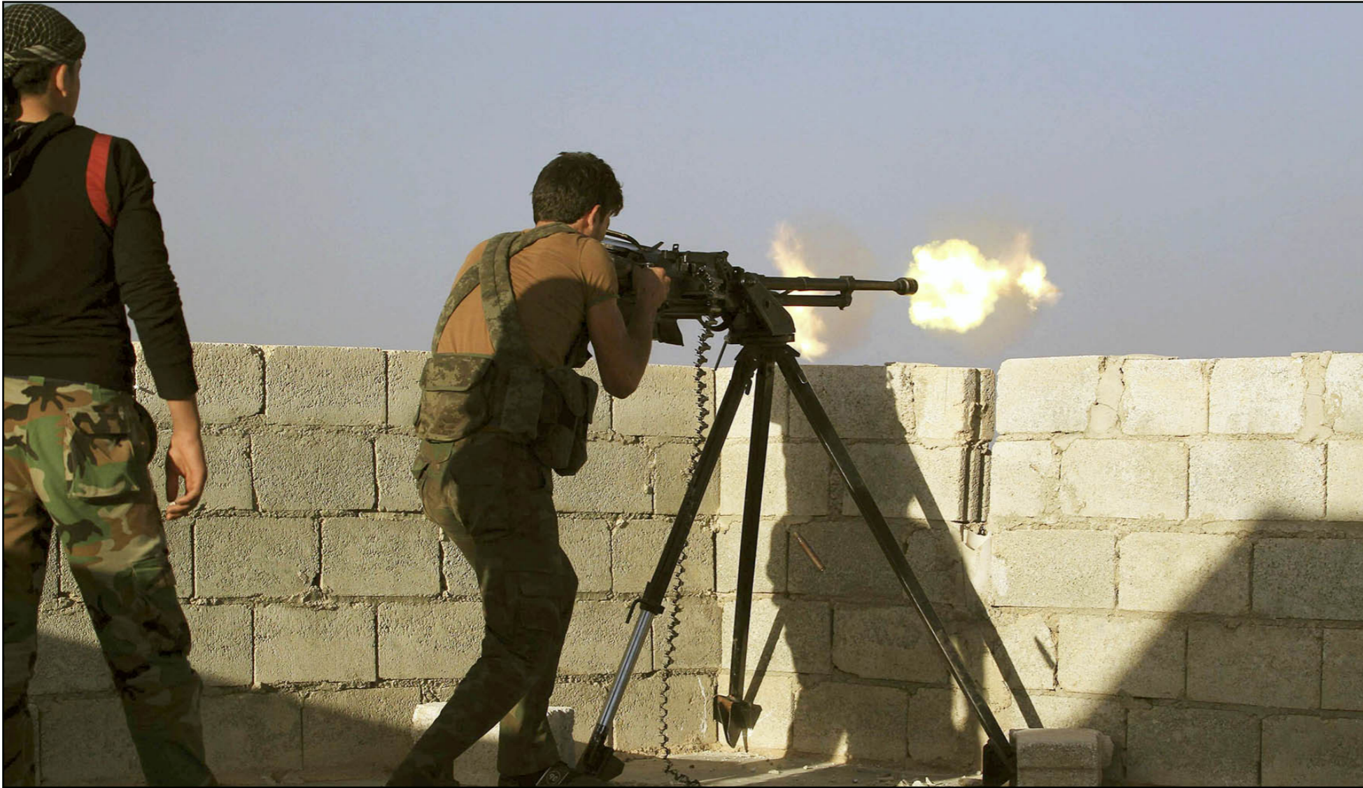
أحد مقاتلي الجيش السوري الحر في اشتباكات مع قوات «داعش» على مشارف مدينة حلب

الراحة والوقت لإستطلاع الأجواء بحثاً عن فرصة، ويشكو قادة المعارضة السورية من غياب التنسيق مع القوات الأمريكية حيث قالوا «عناصرنا قد تكون عين وبصر التحالف على الأرض»، مضيفاً «كانت الغارات الأمريكية غير فعالة وضربت مبانٍ فارغة وقتلت مدنيين، ولهذا السبب نشأ جو معاد للغارات في داخل سوريا، فالناس لا يصدقون الإهتمام بـ «داعش» وهم يعتبرون أن عودهم هو الأسبق، وحذر ناشطون من كارثة إنسانية بسبب ضرب مخازن الحبوب في منبج ومحطات الغاز في دير الزور، في الوقت الذي شجبت فيه حركة «حزب» التي تلقت أسلحة مضادة للدبابات من الولايات المتحدة الغارات لكن الأمريكيين طلبوا منها الصمت. كما أن الغارات على «جبهة النصرة» لا يجنّب جدد، ويقول مصطفى أحمد من منطقة إدلب أيضاً «اعتقد أن تدخل التحالف يعمل في مصلحة النظام، وخلق التدخل لاجئين جدد، ويقول تشارلس ليستر من معهد بروكينغز الدوحة أن المسألة لا تتعلق باستعادة النظام من الغارات ولكن قواته كانت قادرة على مواصلة الغارات على المدنيين رغم احتلال طائرات التحالف الأجواء السورية، ولا يتكر أحد استعادة النظام من الغارات بآثر من طريقة كما يقول هوكايم فلم يعد هناك اهتمام كبير بغاراته ومذابحه، كما أن أنه عن تعاونه مع التحالف الدولي ويستفيد من التشتت والإحباط داخل المعارضة السورية، كما أن انضمام بعض جماعات المعارضة لـ «داعش» يساعد على تصويرهم كمتطرفين».