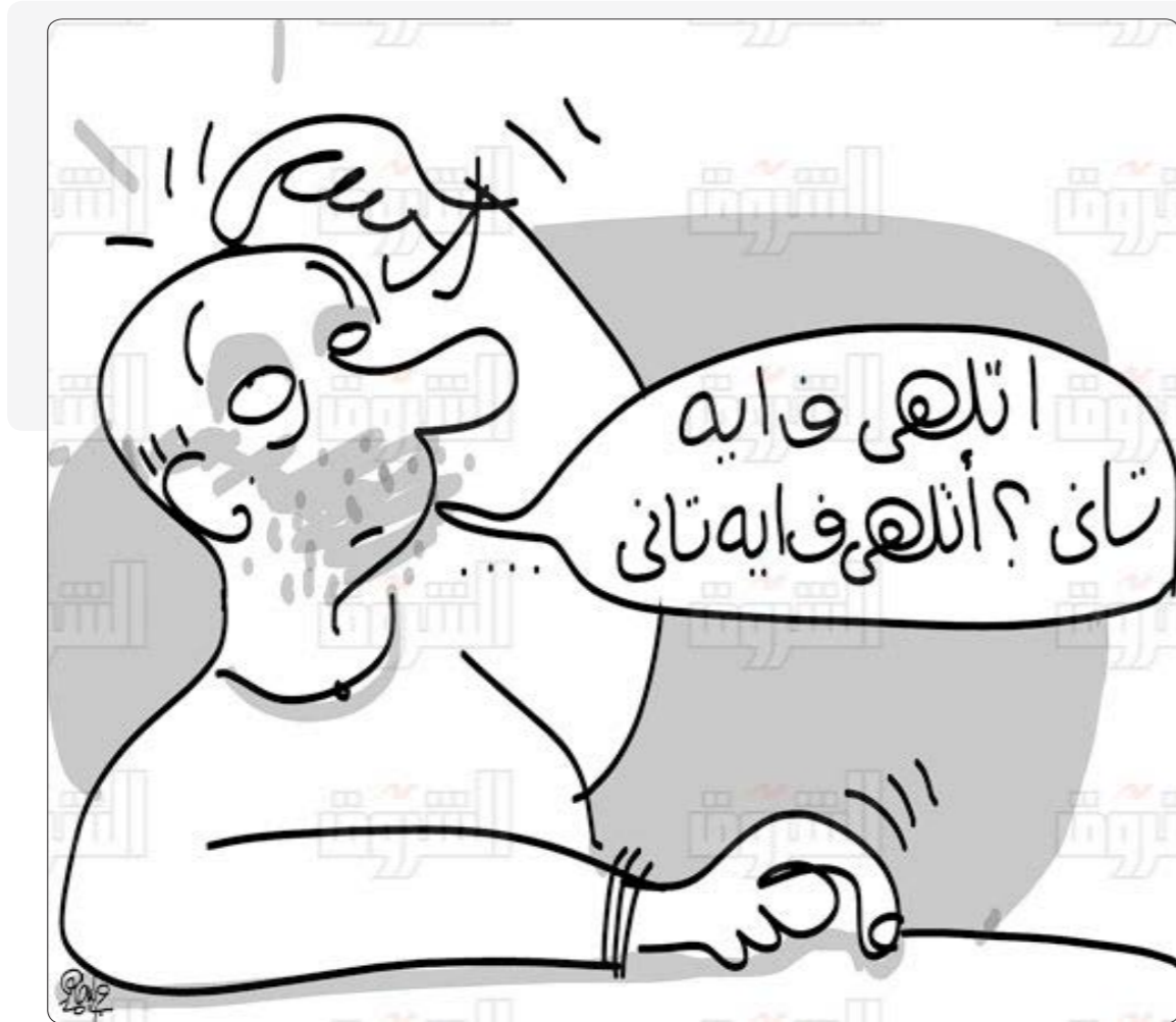
الأوان ان يعلن هؤلاء المسيئون توتيتهم وان يطلبوا العفو من الشعب والجيش بعد ان اكتشفت الخعة واتضح الحقائق للجميع.