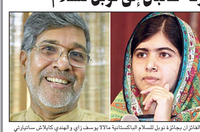
المغازان بجائزة نوبل للسلام الباكستانية مالا يوسف زاي والهندي كايلاش ساتيارثي ولكن لكل الباكستانيين، وذكر التلفزيون الحكومي ان رئيس الوزراء نواز شريف هانها أيضا لانها أصبحت أول باكستانية تفوز بجائزة نوبل للسلام.