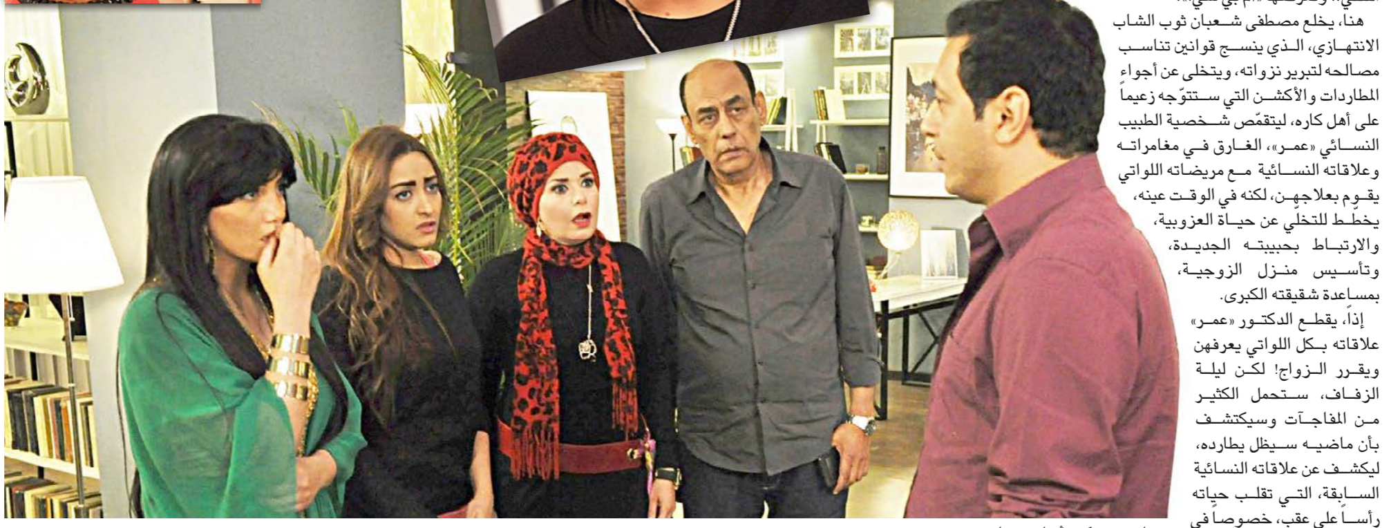
مشاهد من «دكتور أمراض نسا»