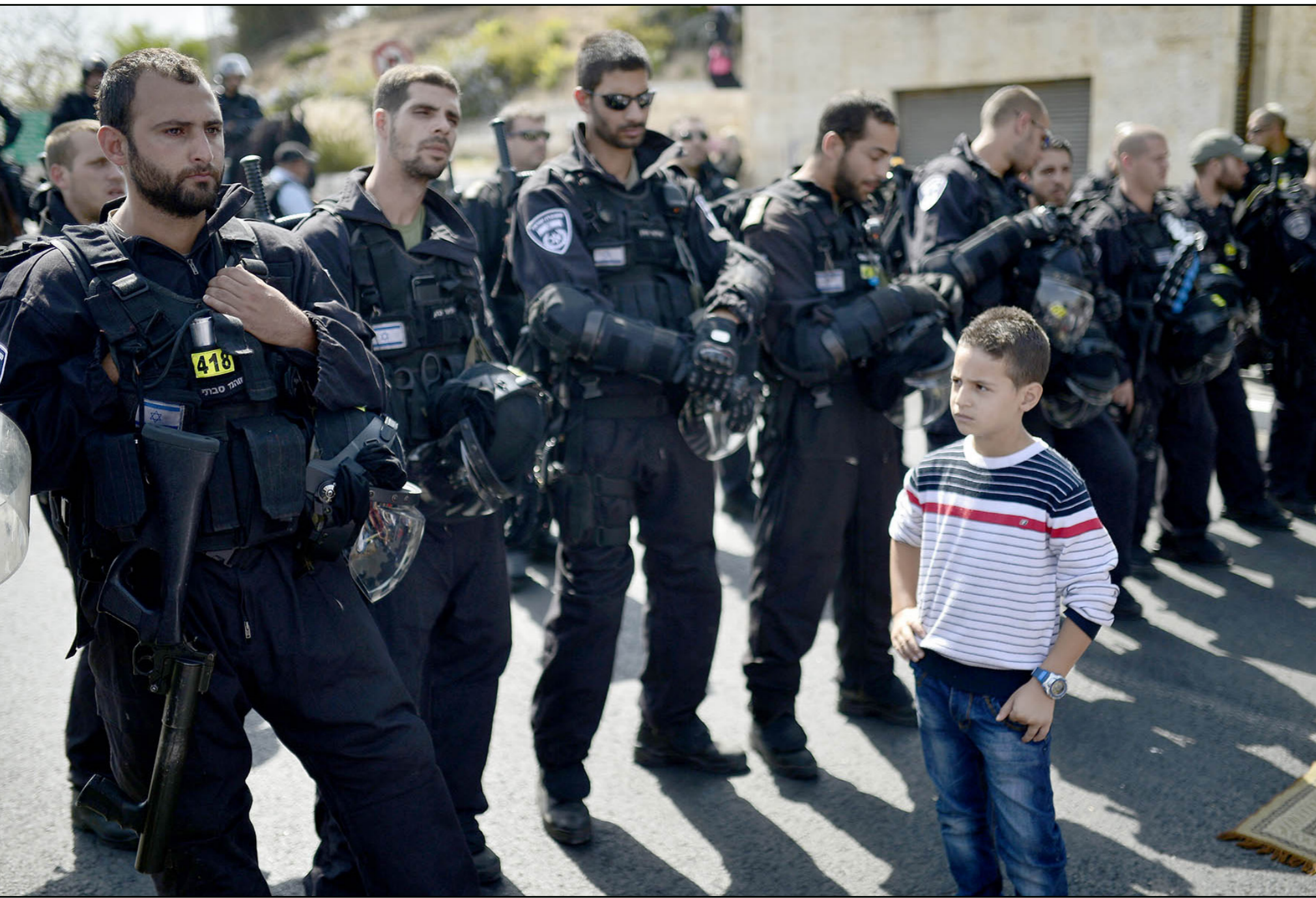
مظلم فلسطيني وجهها لوجه مع شرطة الاحتلال في القدس المحتلة أمس (الاناضول)

واستنكر الجبور هذه الإجراءات والأعمال التي تقوم بها سلطات الاحتلال والمستوطنون تجاه السكان وممتلكاتهم، وناشد الجهات الإنسانية والوطنية والدولية، التدخل لوقف هذه الأعمال اللا إنسانية ضد مواطنين عزل.