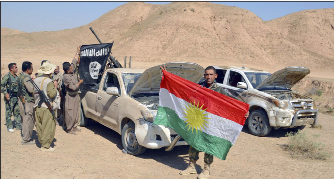
عناصر من البيشمركة يرفعون العلم الكردستاني بعد فرار عناصر من داعش خلال معارك في الزرقا بالقرب تكريت

تصدت لهجوم شنه تنظيم «داعش» على مدينة سامراء (125 كلم شمالي بغداد)، ما أدى لوقوع مواجهات واشتباكات عنيفة بين الطرفين، أسفرت عن مقتل 19 عنصراً من التنظيم وتدمير عربة تابعة له وهروب باقي المهاجمين، فيما لم يبين فيما إذا سقط قتلى من القوات الحكومية.