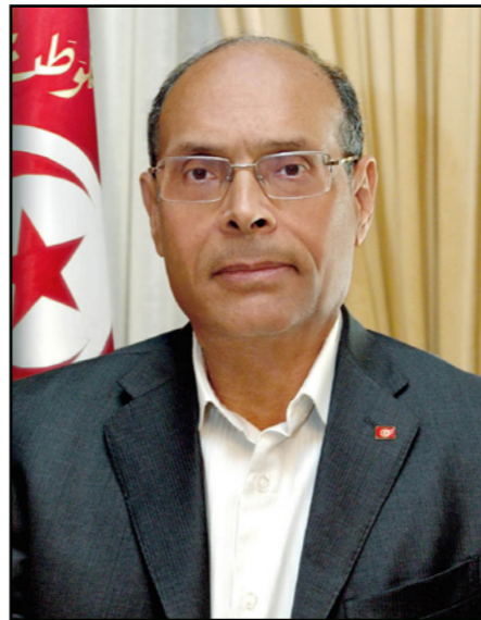
الرئيس محمد المنصف المرزوقي

وأكد بيان صحفي صادر عن رئاسة الجمهورية، أن الجانبين قد اكدا في خصوص الملف الليبي على أهمية مساندة جهود الحوار الوطني في ليبيا، والعمل المشترك لحث كافة الأطراف السياسية على التوصل لحل سياسي يحفظ أمن ليبيا واستقرارها ووحدتها... والجدير بالذكر أن الفرقاء الليبيين رحبوا مرارا بالوساطة التونسية سواء الرسمية او المدنية. وقالت مصادر لـ «القدس العربي» ان الامم المتحدة وبعض الدول قد اقتنعت عمليا ان تونس والجزائر خاصة ودول الجوار عموما هي الوحيدة القادرة على حل الملف الليبي.