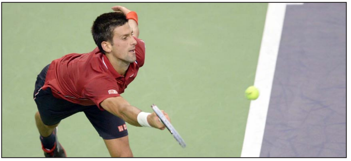
ديوكوفيتش مستمر في تألقه في الصين

بيدور الثمانية والتي تجمع بين السويسري روجيه فيدرر والفرنسي جوليان بينيتو، ويحاول فيدرر التتويج بلقب البطولة للمرة الأولى منذ تحولت لبطولة أساتذة فئة 1000 نقطة في 2009، بعدما استضافت البطولة الختامية للموسم بين عامي 2005 و2008. ويتفوق فيدرر على بينيتو بخمسة انتصارات مقابل هزيمتين. وحقق الإسباني لوبيز فوزه السابع والثلاثين مقابل 22 هزيمة في الموسم الحالي، بعد ان حقق فوزه الخامس خلال ثماني مباريات أمام يوجيني.