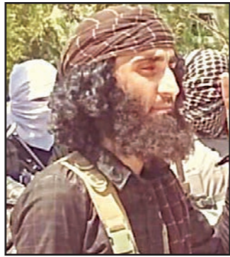
أبو خطاب «يفضل القتال مع العرب الإسلاميين على القتال مع الكرد اليساريين». ثم أضاف «انا منتم لشعب الكرد وممثل التحو ابن عمي».

بحضور عباس والسيسي و30 وزير خارجية بينهم كيري ومؤتمر إعادة إعمار غزة يلتئم غدا وحكومة التوافق تتسلم السلطة على المعابر غزة - لندن - القدس العربي من أشرف الهور: برئاسة النرويج ومصر وحضور الرئيسين الفلسطيني محمود عباس والمصري عبد الفتاح السيسي، وحوالي 30 وزير خارجية بينهم الأمريكي جون كيري، وكاترين أشتون ممثلة الاتحاد الأوروبي، يلتئم في القاهرة غدا مؤتمر المانحين لإعادة إعمار قطاع غزة، في مسعى لتوفير حوالي 6 مليارات دولار لإعادة بناء ما دمّرتة أسرائيل، في عدوانها الأخير. ويشارك في المؤتمر أيضا إضافة إلى الأمين العام للأمم المتحدة بان كي مون