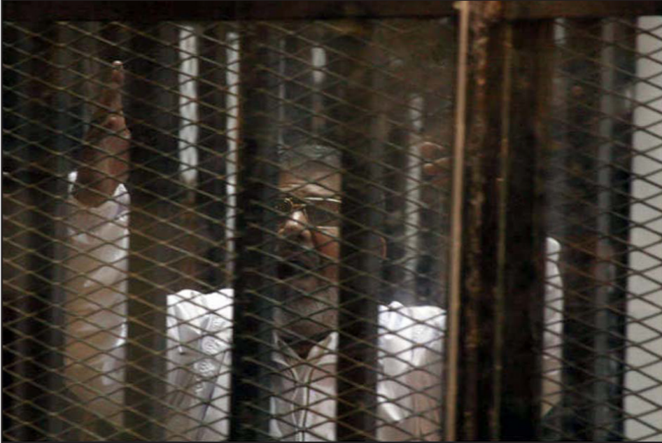
الرئيس المصري الأسبق محمد مرسي أثناء محاكمته

التحالف، وقال إن «أبرزها هو اختيار التحالف للمسار الثوري حتى النصر، واعتبر خيار المعارضة تقنياً للانقلاب». أما الموقف الثاني، «فالتحالف موقفه صريح بتحميل السلطات وحدها المسؤولية عن خروج أي أمور عن السيطرة، مع تأكيد التحالف على منهجه السلمي». وأضاف: «ثالث هذه الأسباب هو مهاجمة الحلف الصهيوني الأمريكي والدعم الأوروبي للسلطات الحالية، وظهور التحالف كداعم قوي لكل انتفاضات استكمال ثورات الربيع العربي، وهو ما تحفظ عليه البعض». أما السبب الرابع «فكان التمسك بشرعية الرئيس مرسي باعتباره رمزاً للمشروع الإسلامي، ومهاجمة الجيش ككل دون الاقتصاد على (الرئيس الحالي عبد الفتاح السيسي فقط، بحسب فياض. واختتم فياض أسياهاه قائلاً: «كانت التهديدات الصريحة بفسل الأحزاب، واعتقال قيادتها هو المحفز مع هذه الاختلافات لقرار البعض، وتفكير البعض بالانسحاب من التحالف». فياض أوضح أيضاً أن «التحالف انطلق في توسعة تتناسب مع طبيعة المرحلة المقبلة من الحراك السلمي، بحيث يتم إعطاء أولوية للشباب، كرموز هذه المرحلة ليكون أعضاء فاعلين في صناعة واتخاذ القرار داخل التحالف».