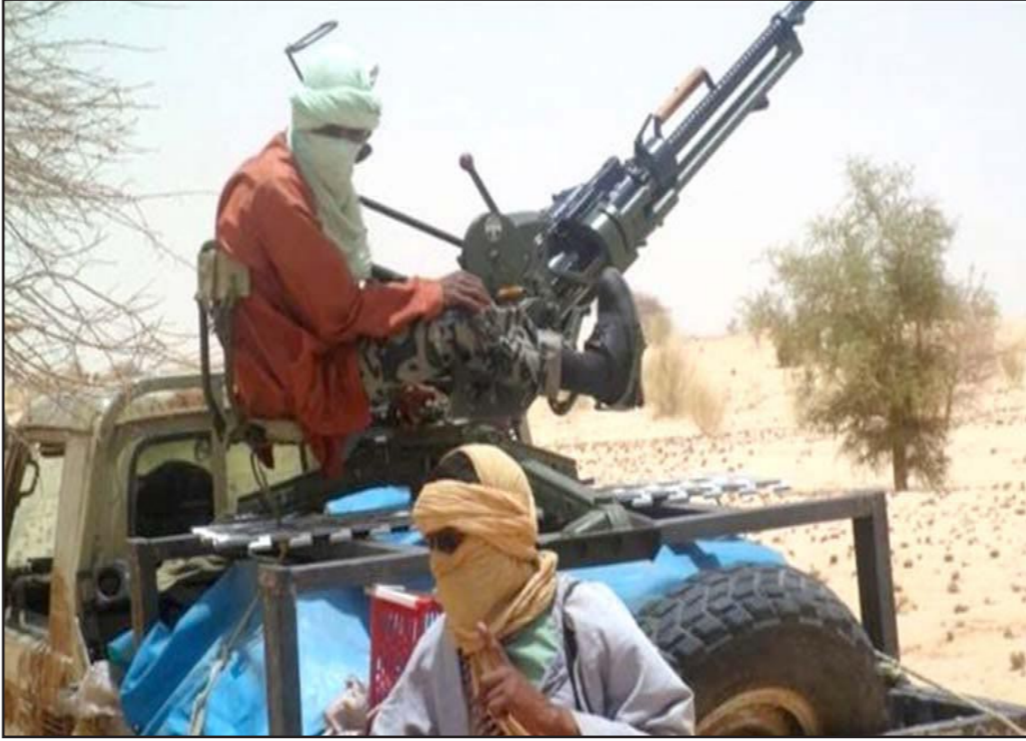
مقاتلون في شمال مالي

بحسب «كلامبري»، في قطع الممرات الصحراوية الممتدة على طول شريط الساحل الصحراوي وسد المنافذ أمام تجارة السلاح التي تنطلق من «براك»