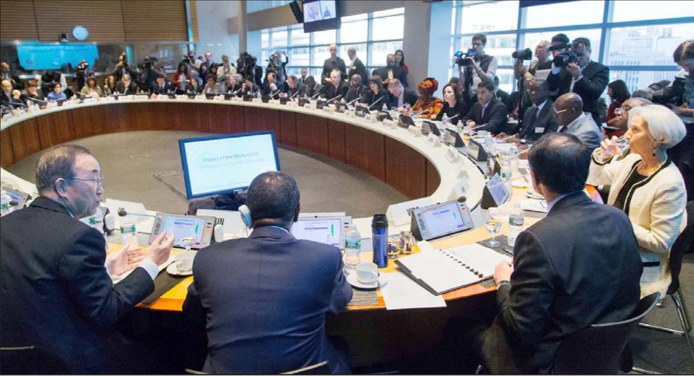
الأمين العام للأمم المتحدة بان كي مون (يسار) يتكلم في مؤتمر صحفي على هامش اجتماعات الخريف في واشنطن

الخاصة بالمالية العامة والشؤون النقدية وأسعار الصرف)، وتقييم مدى سلامة النظام المالي، وفحص قضايا السياسات الصناعية والاجتماعية، وتلك الخاصة بالعمالة، وسلامة الحكم، والإدارة، وغيرها، مما يمكن أن يؤثر على سياسات وأداء الاقتصاد. وتلك المشاورات في حال إتاحتها ستكون الأولى لصندوق النقد مع مصر، بعد توقف دام 4 سنوات، حيث كانت آخر مراجعة للاقتصاد المصري في 24 مارس/آذار 2010. وأشارت لاغارد إلى أن صندوق النقد سيواصل العمل في المنطقة العربية، مشددة على أن هذا الجزء من العالم بحاجة إلى الاهتمام والمساندة والدعم المالي، وذلك من قبل المجتمع الدولي.