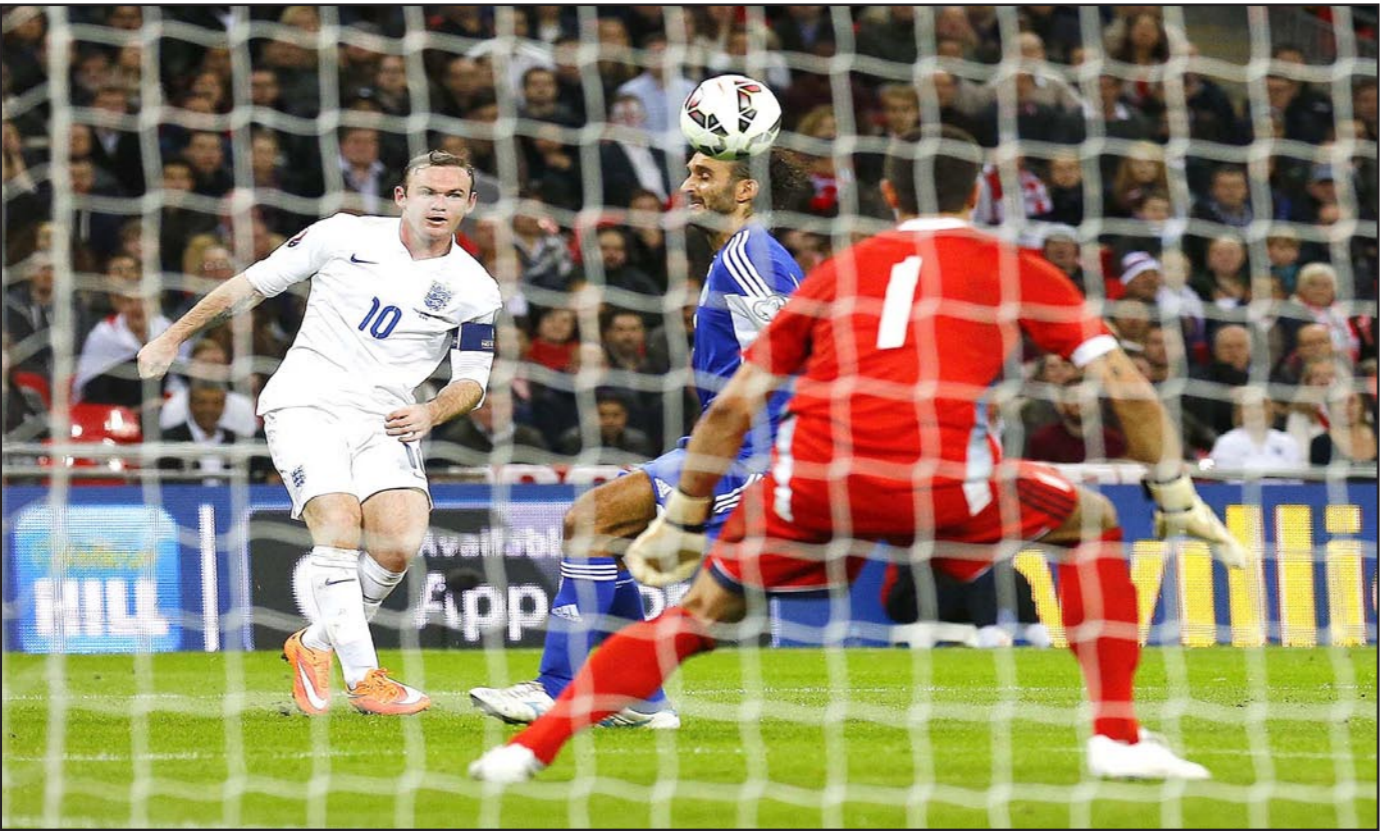
روني تائق مع المنتخب الانكليزي واقترب أكثر من لقب الهداف التاريخي

الجبل الأسود ليحصد صاحب الأرض أول نقطة له في التصفيات بينما اقتسم منتخب الجبل الأسود الصدارة مع روسيا والنمسا برصيد أربع نقاط لكل منها.