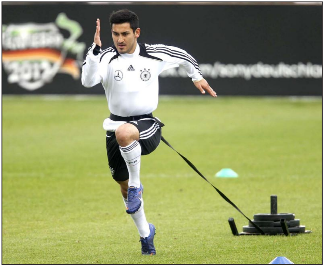
غندوغان عاد إلى الملاعب بعد غياب أكثر من سنة

إصابة موعجة في الظهر. وشهد اللقاء أيضا مشاركة صانع ألعاب الفريق ماركو رويس بعد شفاؤه من الإصابة التي تعرض لها في الكاثل خلال لقاء المنتخب الألماني مع نظيره الاسكتلندي في تصفيات اليورو الشهر الماضي. وأعرب مايكل زورك المدير الرياضي لدورتموند عن سعادته بعودة رويس وغندوغان اللذين شاركا في الشوط الأول للمباراة حيث قال: «كل منهما يبدو في حالة جيدة بالفعل». وتعتبر عودة رويس وغندوغان للشبكة لدورتموند بمثابة طوق النجاة للفريق الذي يعاني من أسوأ بداية له في الدوري الألماني منذ خمس سنوات، حيث لم يحقق أي فوز خلال مبارياته الأربع الأخيرة، ويحتل حاليا المركز الثالث عشر، متأخرا بفارق تسع نقاط عن المتصدر بايرن ميونخ.