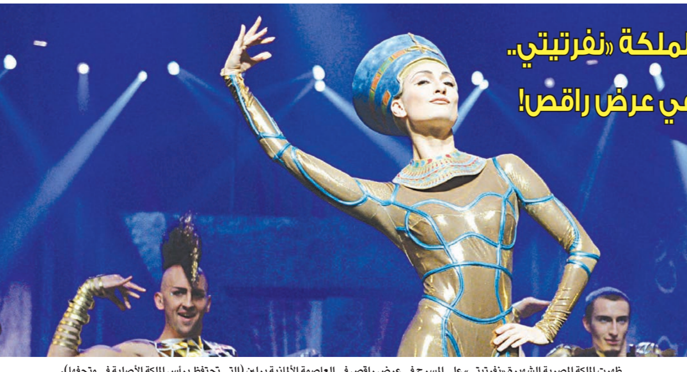
ظهرت الملكة المصرية الشهيرة «نفرتيتي» على المسرح في عرض راقص في العاصمة الألمانية برلين (التي تحتفظ برأس الملكة الأصلية في متحفها).

■ جنوة (إيطاليا) -رويترز: اجتاحت السيول مدينة جنوة الواقعة في شمال غرب إيطاليا اللبلة قبل الماضية فتسببت في وفاة شخص وحطمت نوافذ محلات وحرقت سيارات وغمرت شوارع كثيرة بالوحل والمياه. وارتفع منسوب مياه نهر بيزانو أحد أكبر الأنهار في جنوة قبيل منتصف الليل بعد أيام من الأمطار الغزيرة. وكانت سيول قد تسببت في وفاة سبعة أشخاص على الأقل قبل ثلاث سنوات في المدينة الساحلية الإيطالية. وقالت أجهزة الطوارئ إنها انتشلت جثة رجل يبلغ من العمر 57 عاماً جرفته المياه فيما يبدو. وعثرت طواقم تزيل الحطام من الشوارع في وقت مبكر اليوم الجمعة على سيارات تكومت فوق بعضها وغرقت في حفرة ضحلة بالشوارع. وشكل الوحل طبقات سمكية على جدران المحلات.