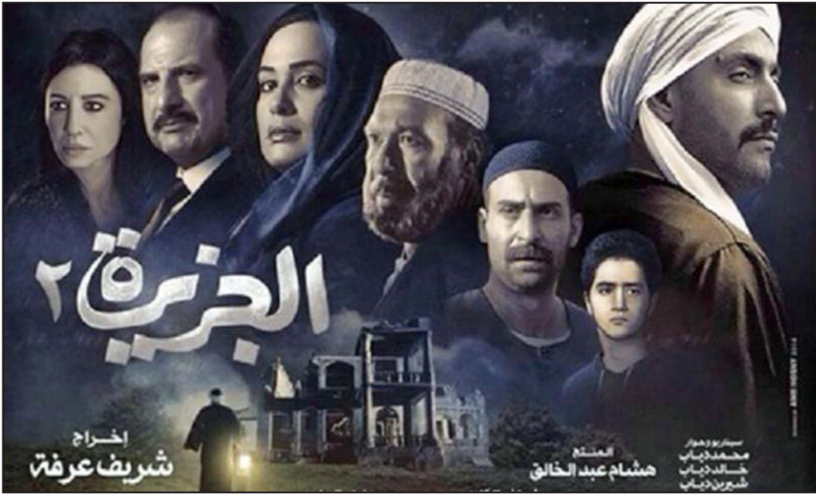
بوستر فيلم «الجزيرة 2»

وتابعت «الفيلم يضيف على ذلك تحذيراً من أن مصر ستتحول إلى سوريا أو عراق جديد إذا لم يتم محاربة هذا الإرهاب». ولفت الناقدة الفنية إلى أن الفيلم في سبيل ترسيخ هذا المفهوم «مزم رسائل ضمنية مفادها أن نهج وزارة الداخلية اختلف وضباطها أصبحوا نموذجاً للمثالي والافتخار، في مفارقة مع الواقع الذي نعيشه ويعاني فيه البعض من نفس الممارسات الانسانية التي كانت ترتكبهها وزارة الداخلية قبيل الثورة». كما لفتت إلى أن «مؤلف الفيلم خلق في الجزء الثاني منه محاور صراع جديد بنى عليها الأحداث، فبعد أن كانت وزارة الداخلية في الجزء الأول هي من تصنع الإرهاب، أصبحت في الجزء الثاني ضحية لهذا الإرهاب الذي تقوده جماعات إسلامية متطرفة». في الجزء الثاني للفيلم، حسب خير الله، «تربص جماعة متطرفة