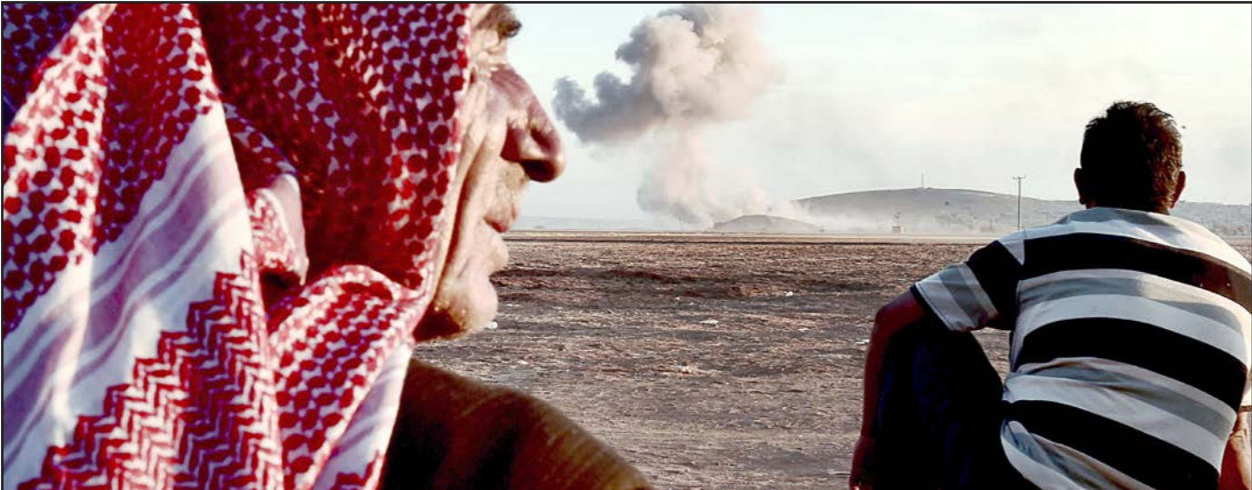
لاجئون سوريون يراقبون المعارك في مدينة كوبياني عبر الحدود مع تركيا

وبانت الأسواق الشعبية ومناطق تجمع المدنيين في غوطة دمشق الشرقية هي نقطة هدف أساسية للطائرات في المناطق المحاصرة التي لا تخضع لسيطرة النظام عبر طيرانه وقذائفه وغاراته الجوية. يشار إلى أن عربين مدينة سورية كان فيها الكثير من أسواق الصناعات واشتهرت بصناعتها للكوسترو، ويعد سوق عربين للزيات الأكبر في سوريا، وهي مدينة مشهورة بلوزها الشهير بالعقابي، وكانت المدينة تسمى حتى بداية الستينيات من القرن الماضي ببلدة عربي، وعربين تحريف عربيال السريانية السورية القديمة، بمعنى غريبال أو من عرابة السريانية بمعنى الصفصاف وفق ما ذكر المؤرخون، وصفها أحد الشعراء بأنها ذات القرغلن..