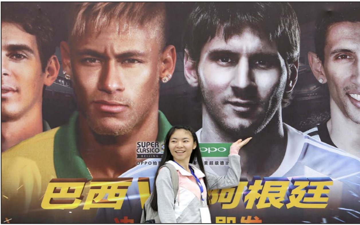
سيدة صينية تغف امام ملصق ضخّم للنجمين ميسي ونيمار للترويج لمباراة الأرجنتين والبرازيل

بكين - د ب أ، رويترز: أعرب المهاجم البرازيلي نيمار عن أمله في الفوز على زميله في برشلونة الإسباني ليونيل ميسي عندما يلتقي المنتخبان البرازيلي والأرجنتيني وديا اليوم في بكين. وأكد نيمار أنه يشعر بالفخر للعب بجوار ميسي في برشلونة، لكن ذلك لا يمنع من السعي لتحقيق الفوز عليه اليوم، وشدد نيمار على أنه في الوقت الذي يتشعر فيه بسعادة شديدة للعب في الفريق ذاته الذي يضم اللاعب الفائز بالهدايا الذهبية لأفضل لاعب في العالم أربع مرات، فإنه يتعمد أن يلحق الهزيمة بميسي. وقال نيمار: «اللاعب جوار ميسي شرف كبير، إنه أفضل لاعب في العالم». وتابع: «أعني ألا يحظى ميسي بيوم جيد ولا يحظى بفرصة لس الكرة». من جهة أخرى، قد تتأثر خطة سنغافورة لتعزيز صورتها على الساحة الدولية باستضافة مباراة ودية شهيرة بين البرازيل واليابان بسبب الترتيب الأجنبي للعبة في الاستاد الرئيسي بالجمع الرياضي الذي تكلف إنشاؤه مليار دولار، ويتوقع أن يمثل الاستاد الوطني ذو السقف المتحرك البالغ سعته 55 ألف مقعد من أجل مشاهدة البرازيل بطل العالم خمس مرات في مواجهة اليابان حامل لقب كأس آسيا يوم الثلاثاء المقبل. ويتلهم سنغافورة لمشاهدة لاعبين من أرضية الملعب.