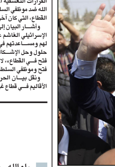
رامي الحمد لله

رام الله - «القدس العربي» من فادي أبو سعدي: بعد الزيارة الناجحة، وإن كانت قصيرة زمنياً، لرئيس الوزراء الفلسطيني رامي الحمد لله وفريقه الوزاري إلى قطاع غزة أمس، تتوجه الأنظار إلى العاصمة المصرية القاهرة، التي تستضيف غداً مؤتمر إعادة الإعمار الخاص بقطاع غزة، حيث عاد الحمد لله وعدد من الوزراء من غزة إلى الضفة الغربية، استعداداً لمرافقة الرئيس محمود عباس في رحلته إلى عمان التي ينطلق منها اليوم إلى القاهرة.