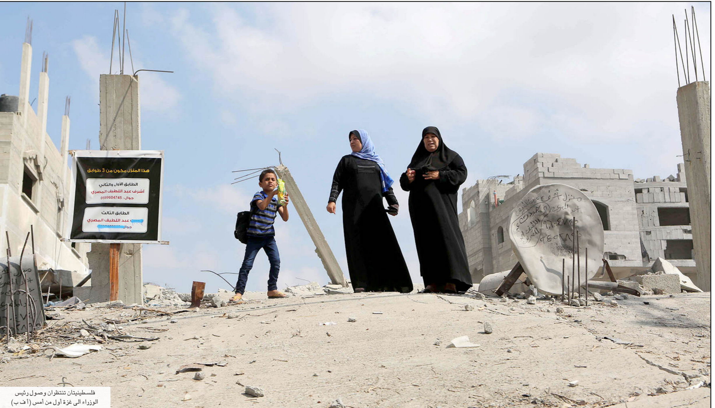
فلسطينيتان تنتظران وصول رئيس الوزراء الى غزة أول من أمس

150 مليون دولار لتشجيع الاستثمار، بتكلفة اجمالية بلغت 1235 مليون دولار. وتم تخصيص مبلغ 7 ملايين دولار لسيادة القانون وحقوق الإنسان، و32 مليون للتنفيذ والتنسيق. وبذلك يصبح إجمالي التكلفة المالية لخطة الإنعاش وإعادة الإعمار الحكومية 4 مليارات 30 مليون دولار. وكشفت وكالة «الأونروا» أنها تعتزم طلب مساعدة بقيمة 1.6 مليار دولار من الجهات المانحة، بغرض إعادة إعمار مسا دمره الاحتلال الإسرائيلي، ليصل الاجمالي الى حوالي 6 مليارات دولار. ونقل عن المتحدث باسم «الأونروا» كريستوفر غانيس، القول ستتقدم الأونروا بأكبر طلب لها منذ 64 عاماً من وجودها والسّذي يصل الى 1.6 مليار دولار، في ما سنخصص نصف المبلغ لإعادة إعمار المنازل. وسبق أن قدرت «الأونروا» عدد منازل اللاجئين فقط التي دمرت وتضررت في الحرب بـ 80 ألف وحدة سكنية.