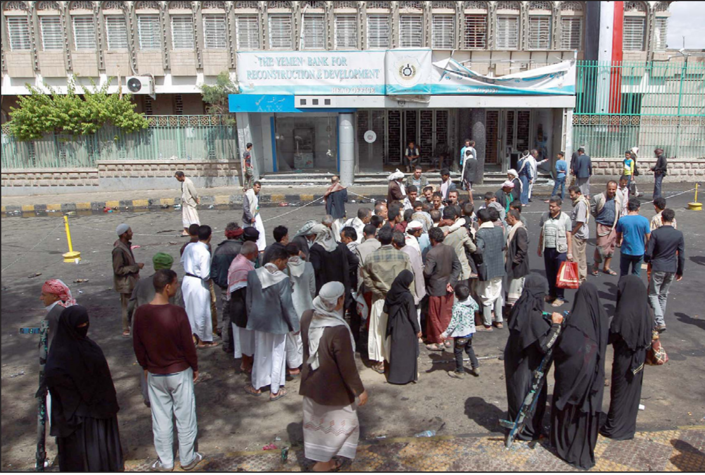
يمنيون يتجمعون أمام مكان الانفجار في صنعاء

سيبسي، سوف يتم الدفع بنجل المخلوع (علي صالح) ليبلغ هذا الدور وليوقف المد الإيراني في اليمن، في إشارة إلى إعادة النظام السابق للكم ولو بوجود جديدة، كما حصل في مصر، وتدمير كل مكتسبات الثورة الشعبية التي اندلعت في 2011 ضد نظام صالح.