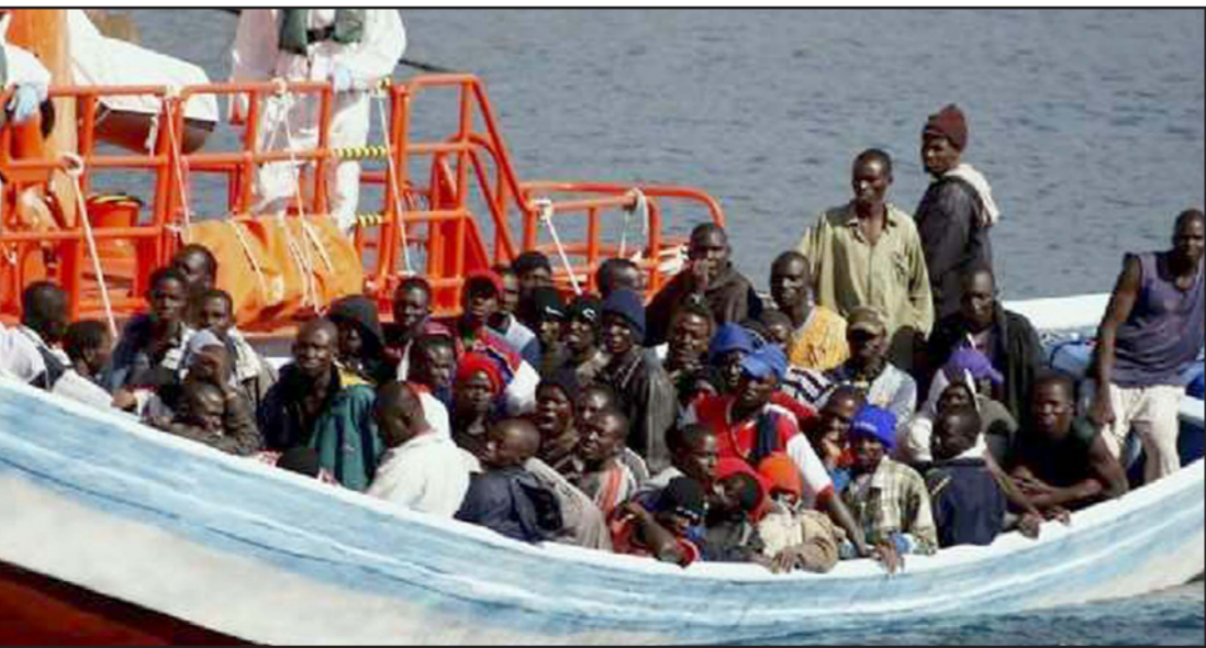
مهاجرين غير شرعيين يحملون بالهجرة إلى أوروبا

الحدود السودانية من القبض على آلاف المهاجرين غير الشرعيين والعصابات سواء في البحر الأحمر أو الصحراء وتقديمهم للمحاكمة حيث تم تجريم الإتجار بالبشر في قانون العقوبات السوداني. يشار إلى أن مؤتمر الأطراف في معاهدة الأمم المتحدة لمكافحة الجريمة المنظمة عبر الوطنية الذي تشارك فيه 181 دولة طرف في المعاهدة، ناقش على مدى خمسة أيام منذ الاثنين الماضي كيفية تفعيل الاتفاقيات والبروتوكولات الثلاثة الملحقة بها وهي مكافحة الاتجار بالبشر وخاصة النساء والأطفال ومنع تهريب المهاجرين ومنع تهريب والإتجار في الأسلحة والذخيرة.