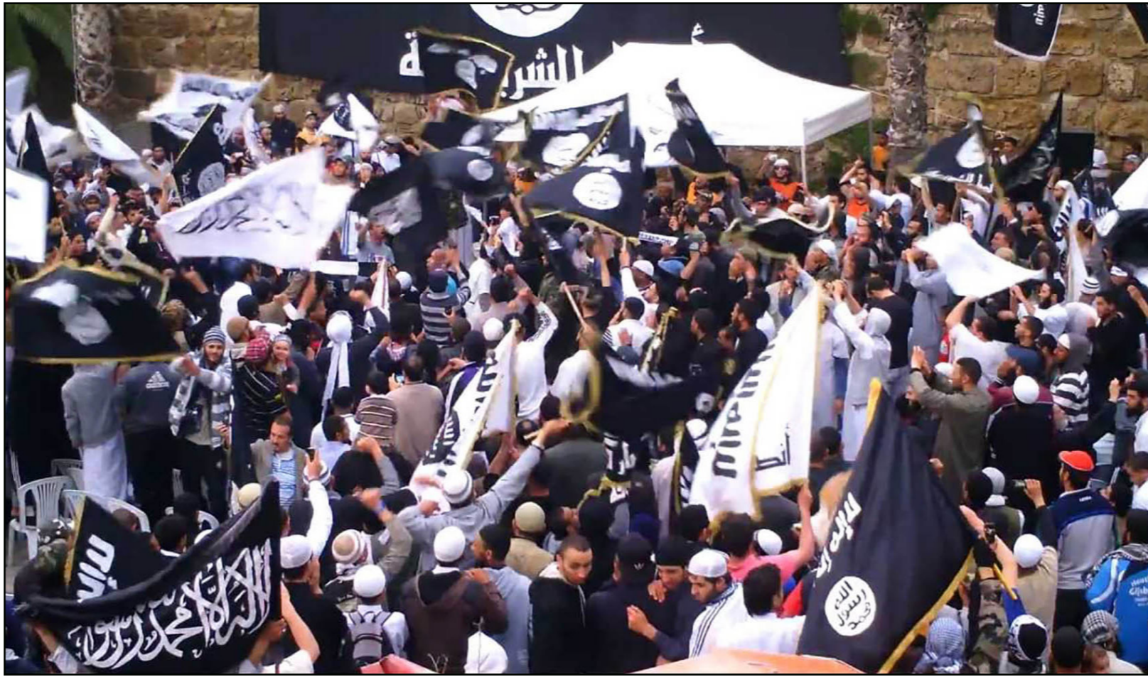
لقطة من فيديو للملقى أنصار الشريعة في تونس

■ تونس - أف ب: أعلن وزير العدل التونسي حافظ بن صالح أن بلاده ستشروع قبل نهاية الشهر الحالي في محاكمة مئات من المتهمين بـ «الإرهاب» وذلك للمرة الأولى منذ الثورة التي أطاحت مطلع 2011 بنظام الرئيس المخلوع زين العابدين بن علي.