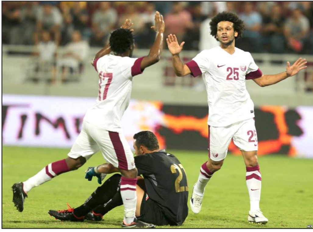
فرحة لاعبي المنتخب القطري خلال الفوز الكبير