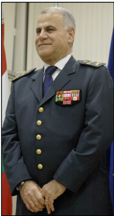
العماد جان قهوجي

عاد الهدوء إلى لسود منطقة طرابلس حيث عادت القوات البحرية إلى طبيعتها، بعدما أقدم مجهولون ملثمون بتسليح دراجات نارية على إطلاق النار فجر أمس الجمعة على مراكز الجيش في طلحة العمري وفي حارة السيدة. وقد رد الجيش على المصير إطلاق النار، وسيرد دوريات، ونفذ انتشارا واسعا في المنطقة. وقبما ألقى مجهولون ليلاً قبلة في نهر ابو علي، وأشارت معلومات أمنية إلى أن عناصر من جماعة أسامة منصور نفذت ليلاً لهجمات على مواقع للجيش في العمري ومخمر الموز والزاهرية في طرابلس. وأعلنت قيادة الجيش في بيان أنه بتاريخه الساعة 4:30 فجراً، أقدم عدد من الأشخاص في محلة باب التبانة – طرابلس على رمي قنبلتين يدويتين باتجاه شارع سنوري، كما أقدم آخرون على إطلاق النار باتجاه حاجز الجيش في محلة طلحة العمري، من دون تسجيل إصابات في صفوف العسكريين. وقد ردت وحدات الجيش على مصادر إطلاق النار بالمثل، وتعمل على ملاحقة المعتدين لتوقيفهم وإحالتهم على القضاء المختص. وربطت أوساط معينة سبب تكثيف الهجمات على الجيش وقبيلها على حزب الله في بريال في الفترة الأخيرة، بحراجة الوضع الحالي بالنسبة إلى المجموعات المسلحة، العسكري والناخي، ولغقت إلى أن هذا الامر هو الذي يدفعهم إلى محاولة التحرك خارج مناطقهم وتغيير قواعد اللعبة، إضافة إلى محاولة تحريك مجموعات حليفة لهم في