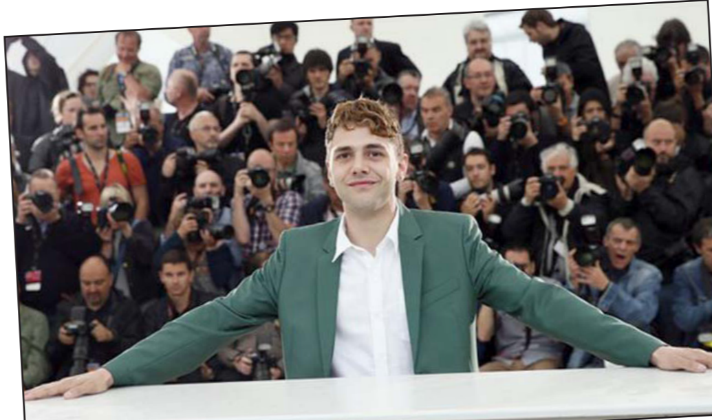
المخرج إكزافيير دولان

ومن اللقطات الأولى، من الحادث، ستكون فكرة عن شخصية الأم ديان، ستستلّز الفكرة مع تقدّم الفيلم، امرأة في الخمسينيات من عمرها، توفى زوجها حديثاً، امرأة، صريحة لدرجة تصل الوقاحة أحياناً، ساخرة، شخصيتها قوية بما يكفي لتصمد مع ابنها. لباسها لافت، جينز مرمق بنقوش والوان، ومقصان أقرب لما ترتديه المراققات. جذابة، عفوية، مستقلة، هي فوق كل ذلك (أو رغمه) أم، والمعنى الذي يجعلها تتواصل لتغير في ابنها، أو تعالجه مما هو فيه. يعتمد المخرج على صورة مرعبة، الكادر «مقطوش» من طرفه الجانبين، يبدأ الفيلم وينتهي كذلك في حالة نادرة سينمائية، باستثناء بضع دقائق في الربع الأخير منه، حيث نرى لقطات متلاحقة ميلودرامية لستيف وقد خرجت من الجامعة، ثم تزوّج، يشاغب أمًا