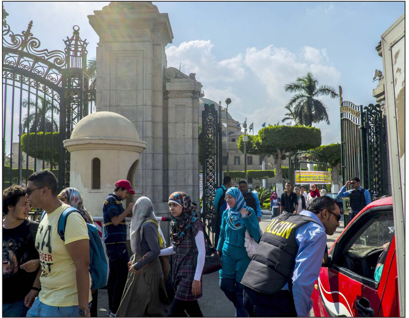
أمن الجامعة يوقف سيارة على البوابة الرئيسية لجامعة القاهرة

وأكّد الحزب الشيوعي السوداني على موقفه بعدم المشاركة في انتخابات في ظل الوضع السياسي القائم، وقال الأستاذ