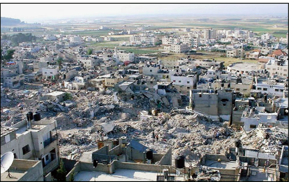
صورة لمخيم جنين خلال العدوان الإسرائيلي عام 2002