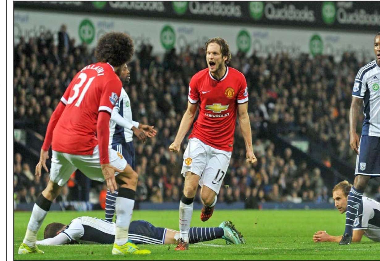
بليند يحتفل بهدف التعادل ليونايثد في الوقت القاتل

■ روما - د ب: أ، أهدر جنوى فوزا في متناول الأيدي واكتفى بالتعادل 1/1 مع ضيفه إيمبولي في المرحلة السابعة من الدوري الإيطالي. وظل جنوى متقدما بهدف حتى قبل 13 دقيقة من نهاية المباراة عندما نجح إيمبولي في خطف نقطة التعادل. وتقدم اندريا بيرتولاتشي بهدف لجنوى في الدقيقة 14 بمساعدة زميله اليساندرو ماتري. وأدرك لورينزو تونيلي التعادل لإيمبولي في الدقيقة 77 مستغلا تمريرة زميله ماسيمو مكاروني. ورفع جنوى رصيده إلى تسع نقاط في المركز العاشر مقابل سبع نقاط لإيمبولي في المركز الثالث عشر.