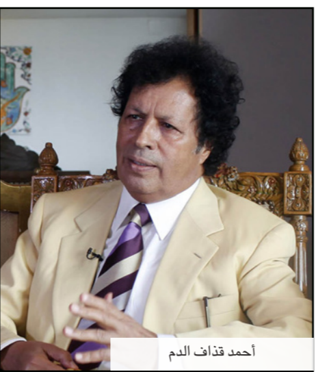
أحمد قذاف الدم

وكان قذاف الدم يتحدث من قاعة الاستقبال في شقته الفاخرة في القاهرة والتي تحمل جدرانها صوراً له وللقذافي والبطال الشعبي عمر المختار الذي قاوم الاستعمار الإيطالي. وقال قذاف الدم إنه لا يتوهم أن تعود ليبيا إلى الماضي لكن هناك عناصر من النظام السابق تستحق أن يتم الاستماع إليها وإهمال لا يريدون العودة إلى النظام القديم.