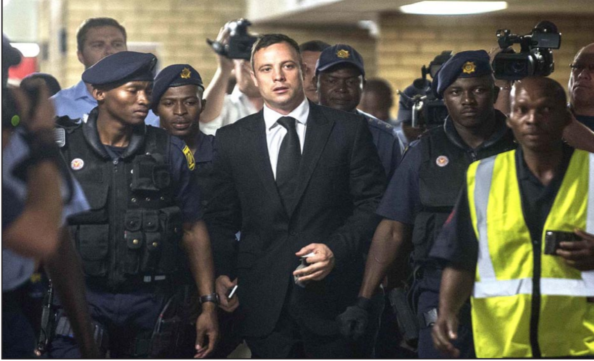
رجال الأمن يقتادون بيستوريوس إلى خارج قاعة المحكمة عقب الحكم

«أمل أن يشكل الحكم نوعاً من انتهاء الامر لأسرة ستيككامب وان يتيح لهم المضي قدماً في حياتهم»، وكانت أسرة الضحية أعربت عن صدمتها لادانة بيستوريوس بتهمة القتل غير العمد في ايلول/سبتمبر. وانتقد عدد من الخبراء الحكم إذ كانوا يتوقعون ادانته بالقتل العمد. وتابعت القاضية في حيثيات الحكم انها اصدرت حكماً بعد أخذ خطورة الاتهام في الاعتبار وايضا شخصية المتهم واعاقته. وقالت: «اصدار حكم دون السجن سيعطي رسالة خاطئة الى المجتمع كما ان الحكم عليه بالسجن لفترة طويلة ليس مناسباً أيضاً».