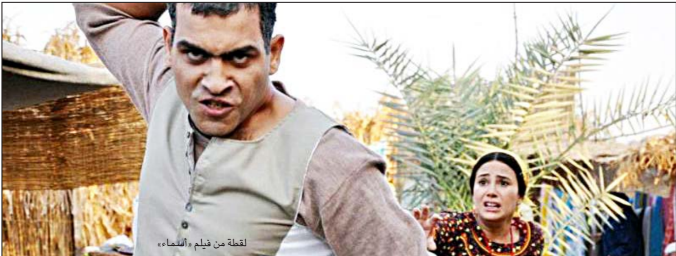
لقطة من فيلم «أسماء»