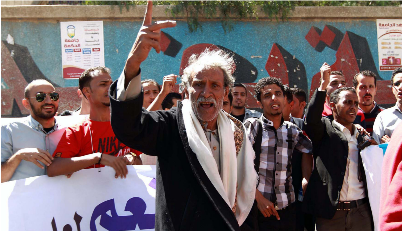
جانب من مسيرة خرجت أمس تطالب برحيل الميليشيات الحوثيين من العاصمة صنعاء

وهدد تكتل أحزاب اللقاء المشترك بمقاطعة الحكومة الجديدة في حال تم رفض طلبه الرامي إلى