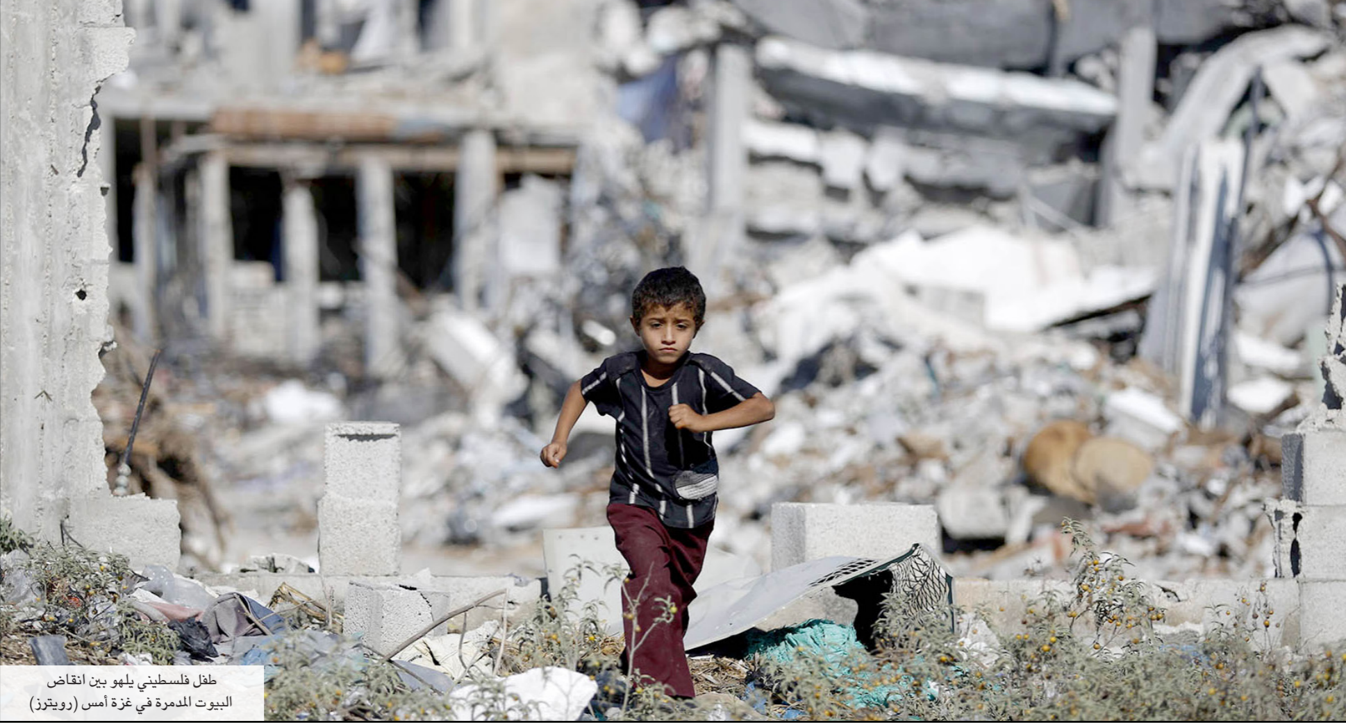
طفل فلسطيني يلهو بين انقاض البيوت المدمرة في غزة أمس