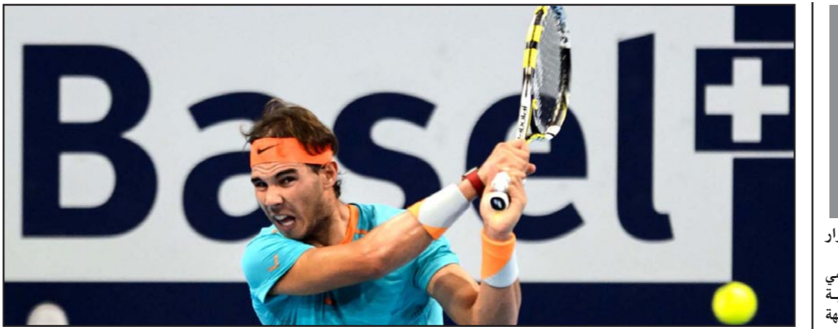
نادال فاز بسهولة لكن مستقبله ما زال مبهما

بعض الشيء لكن الهدوء والسكينة أكثر متعة لي». وأشار سابيلا إلى أن العمل مديراً «مضن» ويحمل في طياته الكثير من المسؤوليات الجسيمة، وتطرق إلى الحديث عن مواطنه خيرا رود مارتينو الذي تولى السؤولية الفنية للمنتخب الأرجنتيني خلفا له، كما أكد أنه أصبح حالياً واحداً من مشجعي المنتخب. وبالرضا لتقولني تاتا المهمة الفنية للفريق لأنه مدرب كبير... أشعر أننا أصبحنا في أيد أمينة... الاتحاد الأرجنتيني لكرة القدم أصاب في الاختيار».