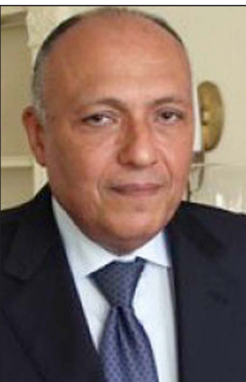
وزير الخارجية المصري سامح شكري

القاهرة - د ب أ: أكد وزير الخارجية المصري سامح شكري أن مصر ستظل تدعم الحكومة الليبية المدعومة من مجلس النواب، كما شدد على أن مصر لن تشارك عسكرياً في التحالف الدولي ضد تنظيم «الدولة الإسلامية»، المعروف إعلامياً باسم داعش.