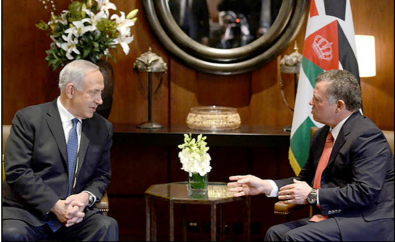
الملك عبد الله الثاني في لقاء مع رئيس الوزراء الإسرائيلي بنيامين نتانياهو

عراقي، بالإضافة إلى الفلسطينيين». ويؤكد المسؤول الإسرائيلي أن الأردن يمنع تنفيذ عمليات على الحدود مع إسرائيل ولذلك فإن قوته الأمنية والاستخباراتية تشكل قاعدة لتغيير جدول أعمال الحكومة الإسرائيلية بشأن إنشاء سياج حدودي على امتداد الحدود الشرقية. ويعدو لعدم الاستهتار بقوة الأردنيين