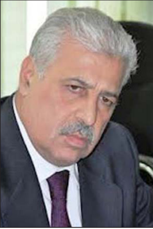
محافظ نينوى أثيل النجفي

وأكد أن الخطأ الجوي من قبل طائرات التحالف سيكون مستمر حتى الانتهاء مما أسماه «تحرير الموصل من داعش»، مبيّناً «وجود كمية كبيرة من المعلومات الموثقة لمقاتلي داعش داخل الموصل وكافة تحركاتهم ومقاتهم والمتعاونين