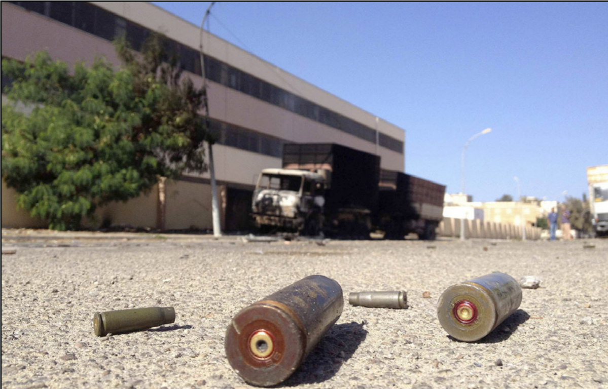
من الأرشيف: فوارغ طلقات استخدمت في اشتباكات بين قوات حكومية وميليشيات في بنغازي

فيما تلقت مستشفيات أخرى الجثث التسع الباقية حسب المصادر الطبية. وتعتبر بنغازي الأكثر اضطرابا في بلد تعمه الفوضى وتسيطر عليه الميليشيات منذ الإطاحة بنظام معمر القذافي الذي تمر الذكرى السنوية الثالثة على مقتله يوم الإثنين الماضي بعد النزاع الذي دام ثمانية أشهر في 2011 لإسقاطه.