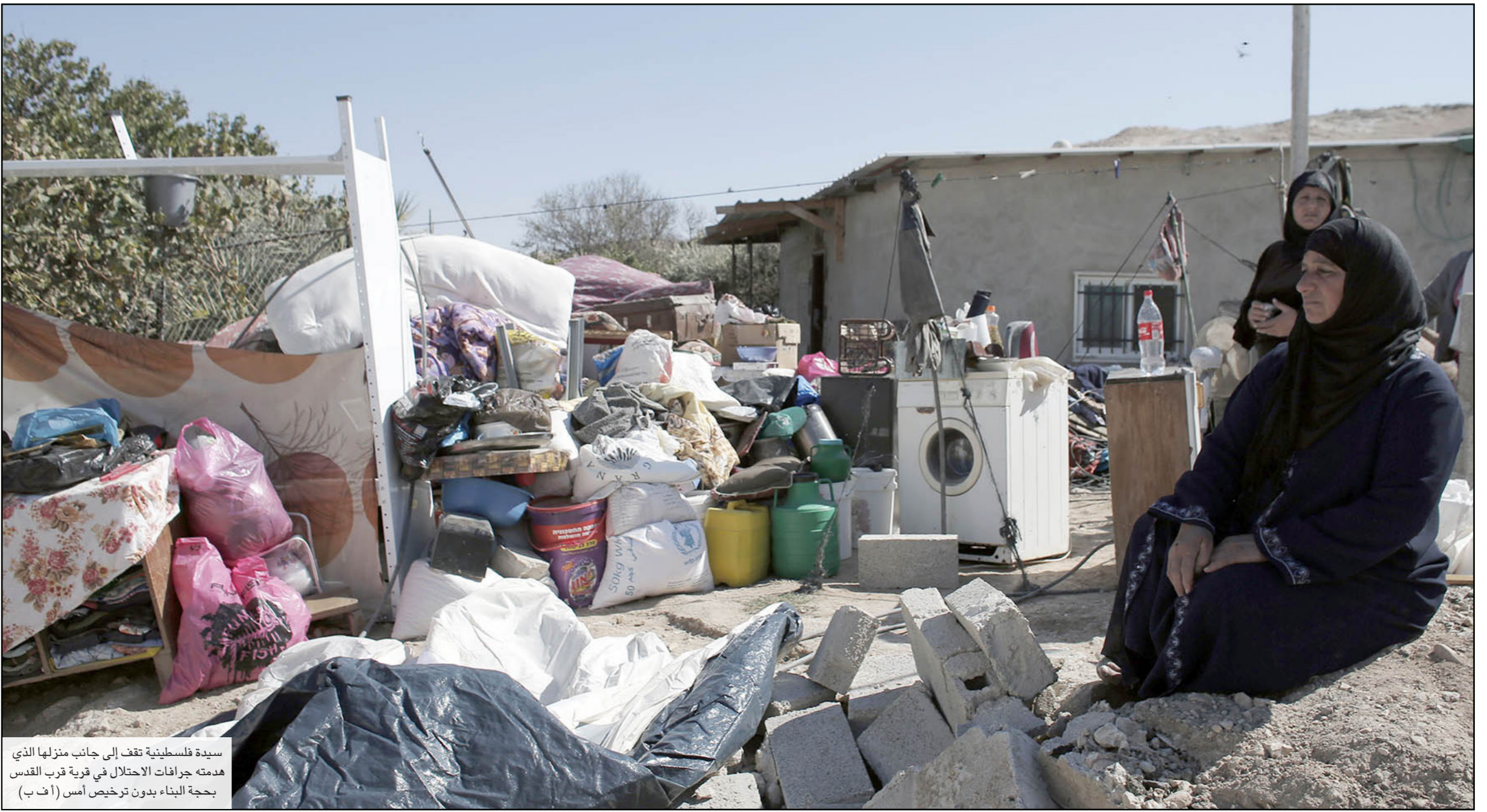
سيدة فلسطينية تقف إلى جانب منزلها الذي هدمته جرافات الاحتلال في قرية قرب القدس بحجة البناء بدون ترخيص أمس