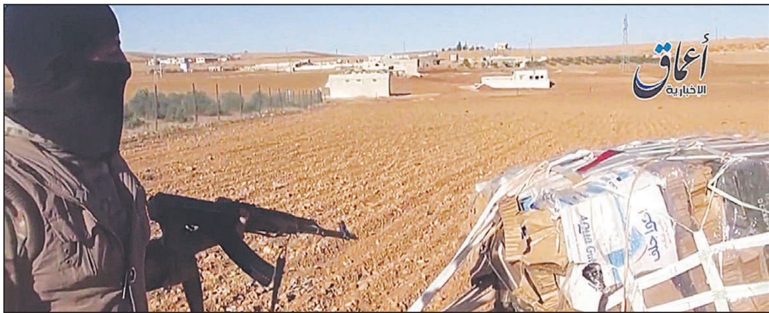
صورة مأخوذة من شريط بث على الإنترنت يظهر مقاتل من «الدولة الإسلامية» يظهر أسلحة ونخائر أمريكية وقعت في أيدي التنظيم