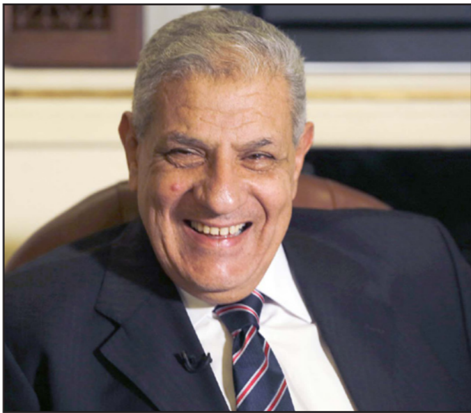
رئيس الوزراء المصري إبراهيم محلب

الجوي ووجود الجيش العراقي على الأرض بلا شك سيكون له تأثير إيجابي في محاصرة الإرهاب. طبعاً الموقف صعب جداً وصناعة متقدمة».