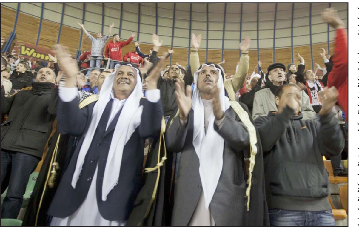
مشجعو نادي سخنين العرب يؤازرون الفريق بحماس

النادي انتهك اثنتين من قواعد الاتحاد وتصرف «بطريقة غير لائقة» واتخذ في الملعب مواقف من قضايا سياسية وعامة مختلف عليها. وقال الاتحاد الاسرائيلي بسبب تكريمه عضو الكنيست السابق عزمي بشارة.