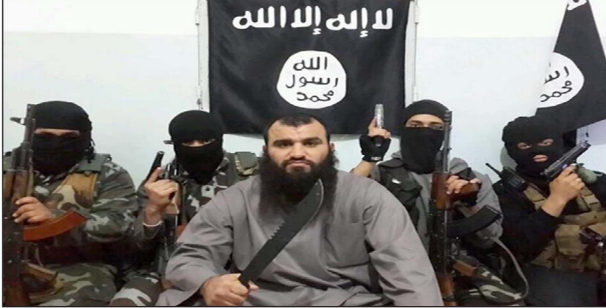
الدولة الإسلامية في الئاراق والشام «داعش»