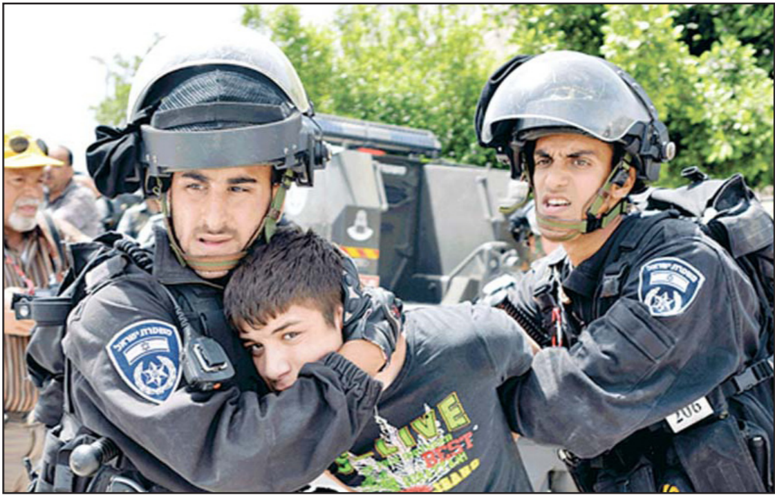
الشرطة الاسرائيلية تعتقل احد الاطفال الفلسطينيين

من أجل الفهم كيف يحرك نحو ألف طفل قتل اليوم انتفاضة الأطفال لا حاجة إلا الى الاطلاع على وسائل الاعلام فإذا به طفل آخر يترشق الحجارة نحو القطار الخفيف. ثلاثة أطفال انبأه 11، 13 و 14 اعتقلوا في العيساوية، ويزعم الشرطة، فقد اسكوا متلبسين في أثناء رشق الحجارة.