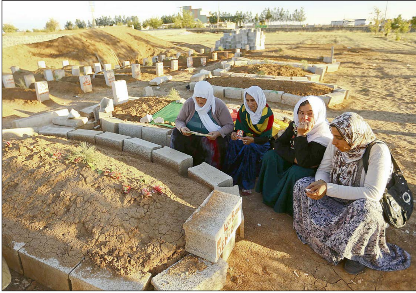
كرديات تركيبات امام قبور مقاتلين اكراد سقطوا في معارك مع «داعش» في كوباني

بان الأكراد جزء أساسي من الشعب السوري وأهالي عين العرب ساهموا في الثورة السورية ضد النظام إلا أن بعض الأحزاب الكردية مثل حزب الاتحاد الديمقراطي السوري الذي يملك الذراع العسكري (وحشدات حماية الشعب) الذي يقاتل في كوباني وأيضا حزب العمال الكردستاني لهم مواقف مؤالية للنظام السوري، ودعمها يعني دعم النظام بشكل أو بآخر.