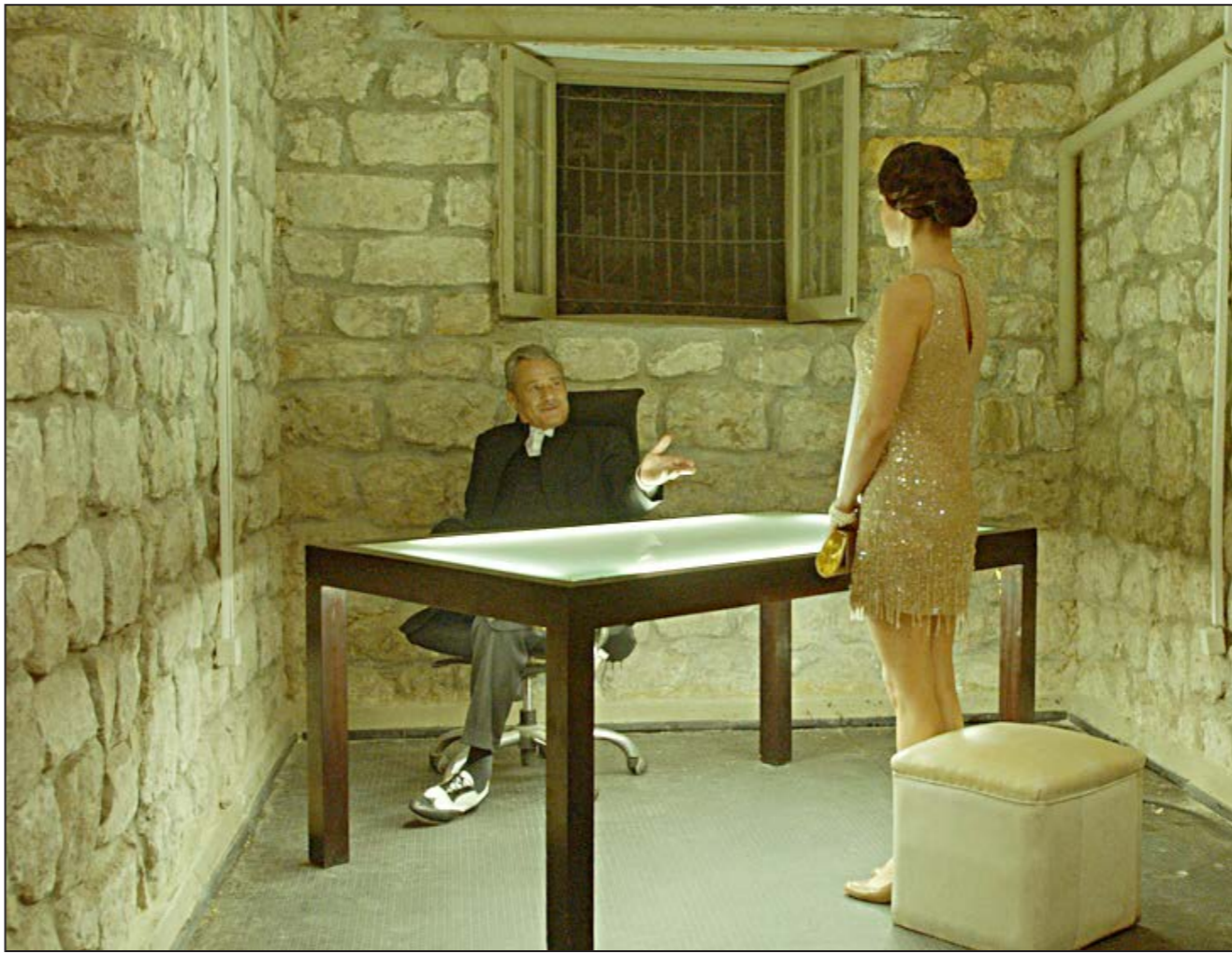
من الأفلام المشاركة في أبو ظبي السينمائي