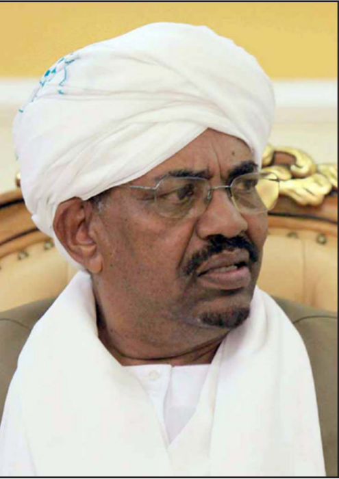
الرئيس السوداني عمر البشير

صديق يوسف عضو المكتب السياسي في تصريحات سابقة إن إعلان قيام الانتخابات في نيسان/أبريل المقبل يعني عملياً نهاية وموت الحوار بين المؤتمر الوطني وبعض القوى التي ارتضت وصدقت مناورة الحزب الحاكم. وأضاف أن المؤتمر الوطني كان في وقت سابق قد خيّر تلك القوى بالقبول بالحوار وفق تصوراتها أو الانتخابات، منوهاً لوقوف الحزب الشيوعي الرفض أصلاً للحوار في ظل الوضع القائم وعدم استعداد النظام للوفاء بمتطلباته. وكان الرئيس السوداني أعلن في نيسان/أبريل الماضي ما عرف بمبادرة الحوار الوطني وأردفها في شهر آب/أغسطس بمبادرة الحوار المجتمعي مؤكداً على أهمية مشاركة الجميع في الحوار الشامل الذي أحرز تقدماً كبيراً في كافة مساراته الذي وصفه بالشامل مجدداً الدعوة لكافة الحركات المسلحة والمتقدمة بالمشاركة في الحوار التي تشمل السلام والاقتصاد والحكم والإدارة والعلاقات الخارجية.