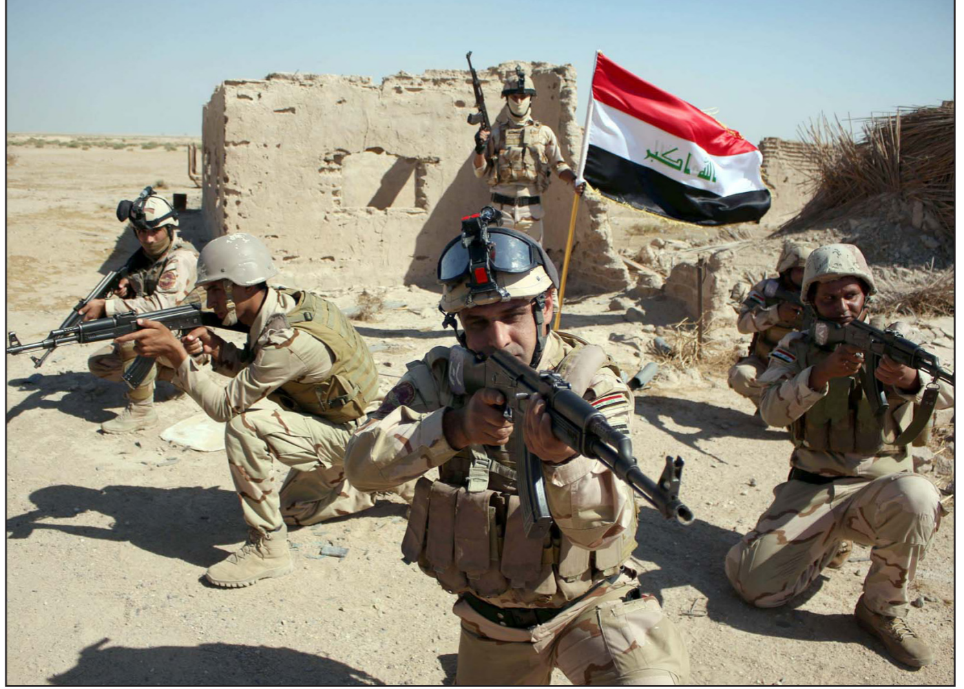
عناصر من الجيش العراقي خلال عملية تدريبية في البصرة

فالفتر شتاينماير امس الثلاثاء في برلين: «الأوضاع الإنسانية للعديد من النازحين في العراق مأسوية، عندما نفكر في الشتاء المقبل يتضح لنا أنه يتعين علينا توسيع جهودنا بصورة كبيرة». وستولى توزيع تلك المساعدات الفوضية العليا لشؤون اللاجئين