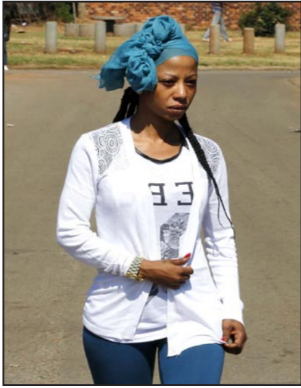
صديقة ميوا التي دافع عنها حتى الموت