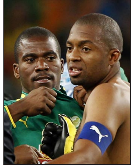
قائد منتخب جنوب أفريقيا القتيل