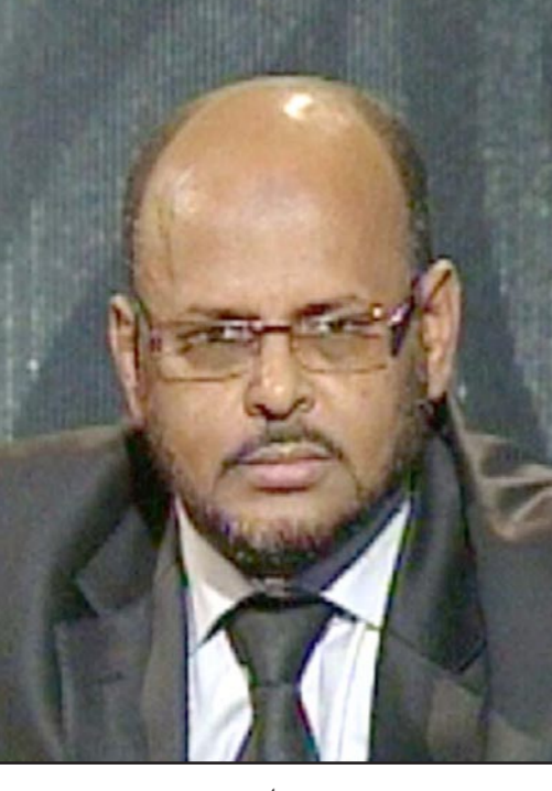
محمد جميل منصور

لقد سبق لدولة الإمارات أن كذبت هذه الإدعاءات فضلا عن سحب مثل هذه الإدعاءات من أطراف أخرى، أريد أن أؤكد أن التأثير السلبي على الشأن الليبي يأتي من بعض دول عربية وإسلامية ونحن نسعى جاهدين إلى التأكيد على أن يكون أولا وقبل كل شيء ليبيا بعيدا عن التأثيرات الخارجية ومن هنا يأتي دعونا المتزايد إلى مسار غدامس والتفاوض. ■ ما هو مخطكم الراجي للانتقال إلى طرابلس وتمثيل الشعب الليبي منها؟ ■ تمثيل الشعب الليبي يأتي من خلال مجلس النواب الذي يسعى برنادينو ليون إلى جمع صفوفه والتحاق النواب للقائمين له في طبرق حاليا بالمشاركة في أعمالها وعودة اللحمة في صفوف مجلس النواب سيكفنا من ممارسة مهامنا حكومة شرعية من العاصمة طرابلس حيث أن هناك حزمة من التدابير التي من شأنها تدعيم هذه المشاركة بعد وقف إطلاق النار ائنا في الحكومة نأمل أن تكلل هذه المساعي للمبعوث الأممي بالنجاح بحيث أن يتمكن مجلس النواب في هيئته الكاملة من تسهيل الحكومة لوضع اللبئات الأولى لدولة القانون والمؤسسات، بما فيها إعادة بناء الجيش والشرطة. ■ أخيرا أود أن أشهد على أن كل ما ذكرته سلفاً واقع حيث أنه يتركز على إرادة سياسية صلبة وتسعى إلى تجاوز تحديات الوضع الحالي والمضي قدما في راب الصدع ولم الشمل بين أبناء البلد الواحد، أريد هنا أن أضيف أن هناك إرادة دولية تقف وراء هذا المسعى، وهو أمر يدعو إلى الارتياح.