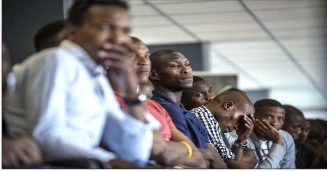
زملاء ميوا بيكونه