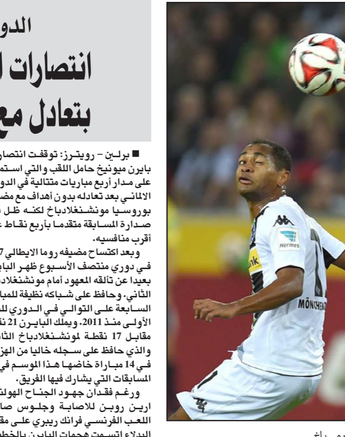
غوته سدده كرة رأسية للبايرن لم تهدد مرمى باخ

برلين - رويترز: توقفت انتصارات بايرن ميونخ حامل اللقب والتي استمرت على مدار أربع مباريات متتالية في الدوري الألماني بعد تعادله بدون أهداف مع ضيفه بوروسيا مونشنغلاذباخ لكنه ظل في صدارة المسابقة متقدما بأربع نقاط على أقرب منافسيه. وبعد اكتساح ضيفه روما الإيطالي 7-1 في دوري منتصف الأسبوع ظهر البايرن في مباراة من تألقه المعهود أمام مونشنغلاذباخ الثاني. وحافظ على شبابه نظيفة للمباراة السابعة على التوالي في الدوري للمرة الأولى منذ 2011. ويملك البايرن 21 نقطة مقابل 17 نقطة لمونشنغلاذباخ الثاني والذي حافظ على سجله خاليا من الهزيمة في 14 مباراة خاضها هذا الموسم في كل المسابقات التي يشارك فيها الفريق. ورغم فقدان جهود الجناح الهولندي اربين روبن للاصابة وجلس صانع اللعب الفرنسي فرانك ريبيري على مقاعد البدلاء اتسمت هجمات البايرن بالخطورة