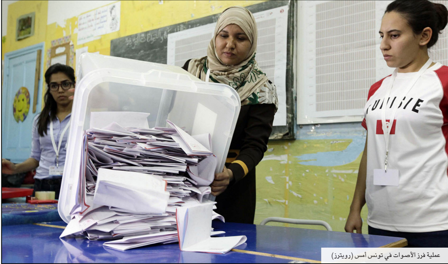
عملية فرز الأصوات في تونس أمس

فيما أشارت استطلاعات «حزبية» إلى فوز «نداء تونس» بعدد مقاعد يتراوح بين 80 و83، فيما حصلت «النهضة» حوالي 68 مقعداً، في حين حصص «الإتحاد الوطني الحر» 17 مقعداً متفوقاً على «الجبهة الشعبية»، التي اكتفت بـ2 مقعداً، و«حصد» «أفاق تونس» 9 مقاعد. وانتقدت هيئة الانتخابات محاولة بعض الأحزاب ومؤسسات سير الأراء تشتيت الرأي العام، حيث أشار