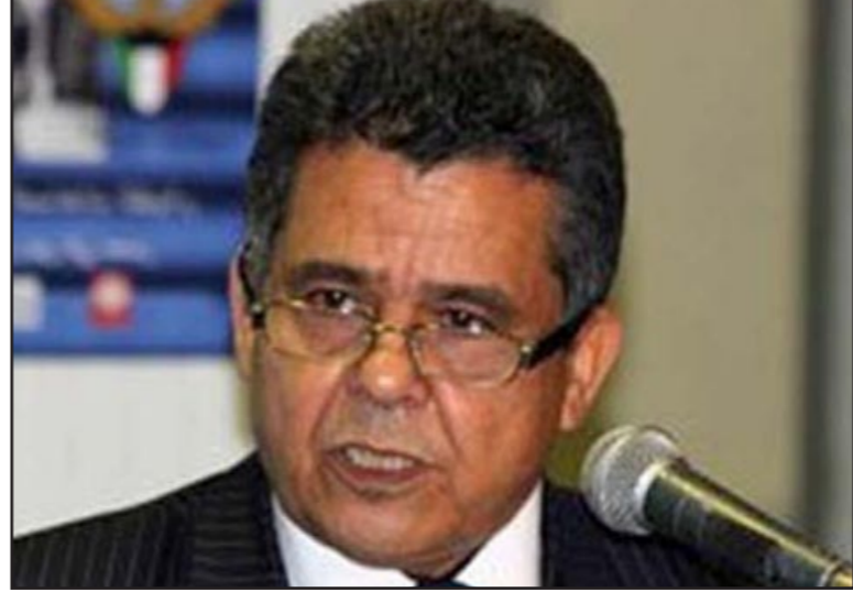
محمد الهادي الدايري

القاهرة - «القدس العربي»: التقت «القدس العربي» محمد الهادي الدايري، وزير خارجية الحكومة الليبية المنتقاة من البرلمان الجديد المنتخب والمقيمة في طبرق بشرق ليبيا، خلال زيارة له إلى القاهرة، واعتبر الدايري في حديثه أن ميليشيات اللواء المتقاعد خليفة حفتر تابعة هيكلية للرئاسة أركان الجيش الليبي الجديدة، رغم أن المعلوم هو العكس، فهي تعتبر قوات منشقة عن الحكومة المركزية، كما بزز عدم تنفيذ حكومة طبرق بهجوم الطائرات الإماراتية على ليبيا بالقول أن الإمارات كذبت اشتراكها في هذا الهجوم. ما هنا الحوار: ■ كيف تقوم حكومتكم بتنظيم العلاقات العسكرية والسياسية مع اللواء المتقاعد خليفة حفتر؟ ■ غداة تعيين اللواء عبد الرزاق الناظوري رئيساً لأركان الجيش الليبي، أعلن اللواء خليفة بلقاسم حفتر انطوائه تحت قيادة رئيس الأركان الجديد تحت قيادة اللواء الناظوري، علما بأن القوات التابعة اللواء خليفة حفتر هي أصلا قوات تابعة للجيش كانت قد أوبت حملتها للمشاركة في عملية الكرامة ومن ثم فتح كل عمليات العسكرية في شرق ليبيا تنت تحت قيادة رئاسة أركان الجيش المنتخبة من قبل مجلس النواب. ■ ما هي الضمانات التي تمنح تبعية حكومتكم