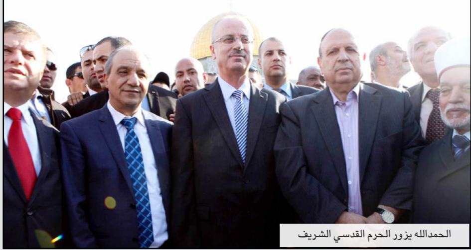
الحمد لله يزور الحرم القدسي الشريف

والاستماع الحمد لله من المسؤولين في الأوقات الإسلامية التابعة لوزارة الأوقاف الأردنية، عن تطورات الأوضاع في المسجد الأقصى.