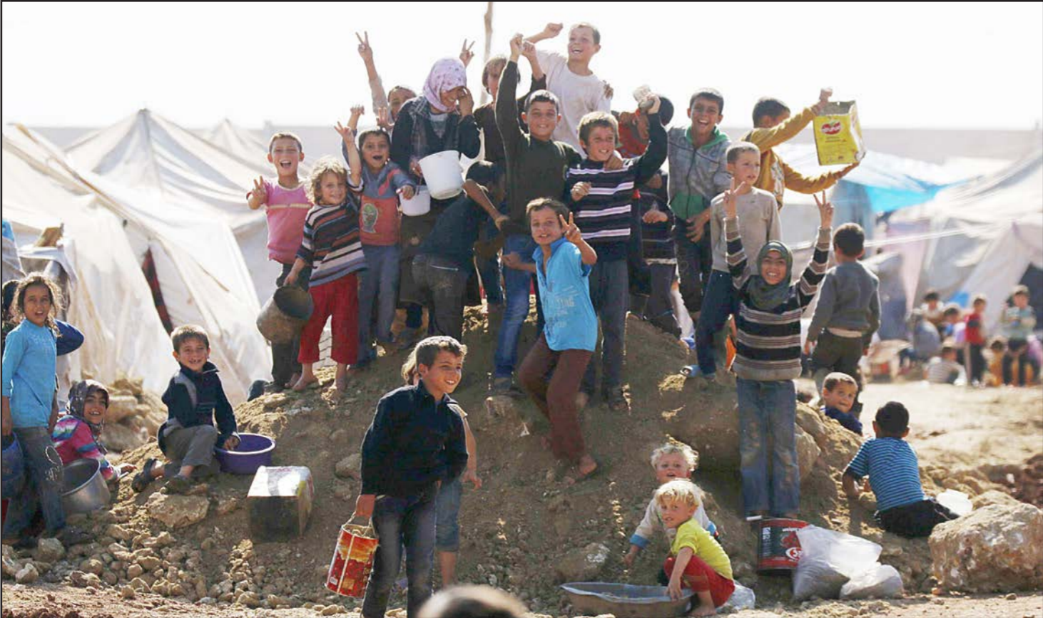
أطفال نازحون سوريون يرفعون إشارات النصر في مخيم باب السلام للاجئين في مدينة اعزاز على الحدود السورية التركية