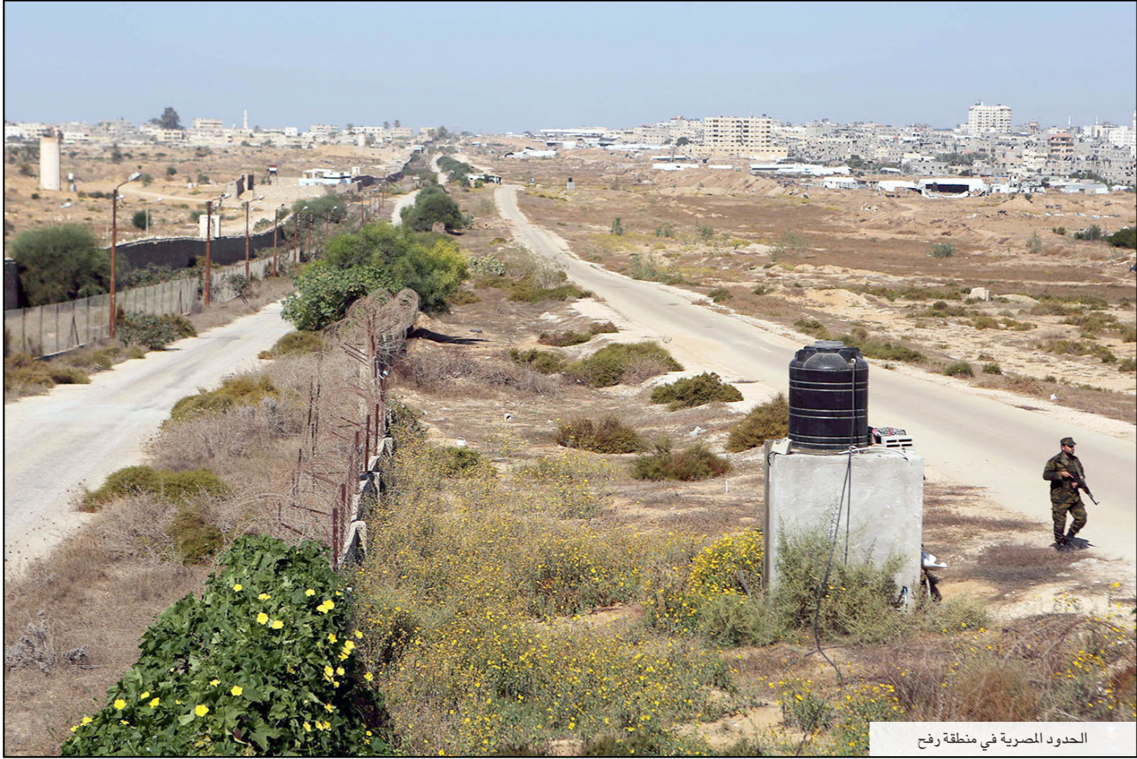
الحدود المصرية في منطقة رفح

ويستمد المنطقة الأمنية على الأغلب لعمق يصل إلى 500 متر، وفي بعض الأحيان أقل من ذلك أو أكثر، داخل الأراضي المصرية، ما يعني هدم كل المنازل القريبة من الحدود، التي تعترض إقامة هذه المنطقة.