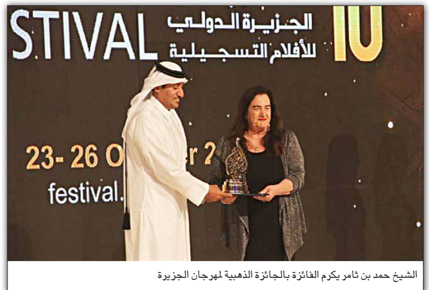
الشيخ حمد بن ثامر يكرم الفائز بالجائزة الذهبية لمهرجان الجزيرة

إشادة المشرفين على الحدث في دورته العاشرة. ويحكي الفيلم رحلة عبر الحياة اليومية لمواطني فرنسيين عاشوا في فلسطين التاريخية عامي 1930 و1952. وقال رئيس مجلس إدارة شبكة الجزيرة الإعلامية الشيخ حمد بن ثامر آل ثاني في تصريح لـ «القدس العربي» إن مستوى الأفلام المشاركة كان مرتفعاً وهناك جهود طيبة بذلت من قبل القائمين على المهرجان، منوها بالتصوير الذي يحققه المهرجان في كل دورة من دوراته.