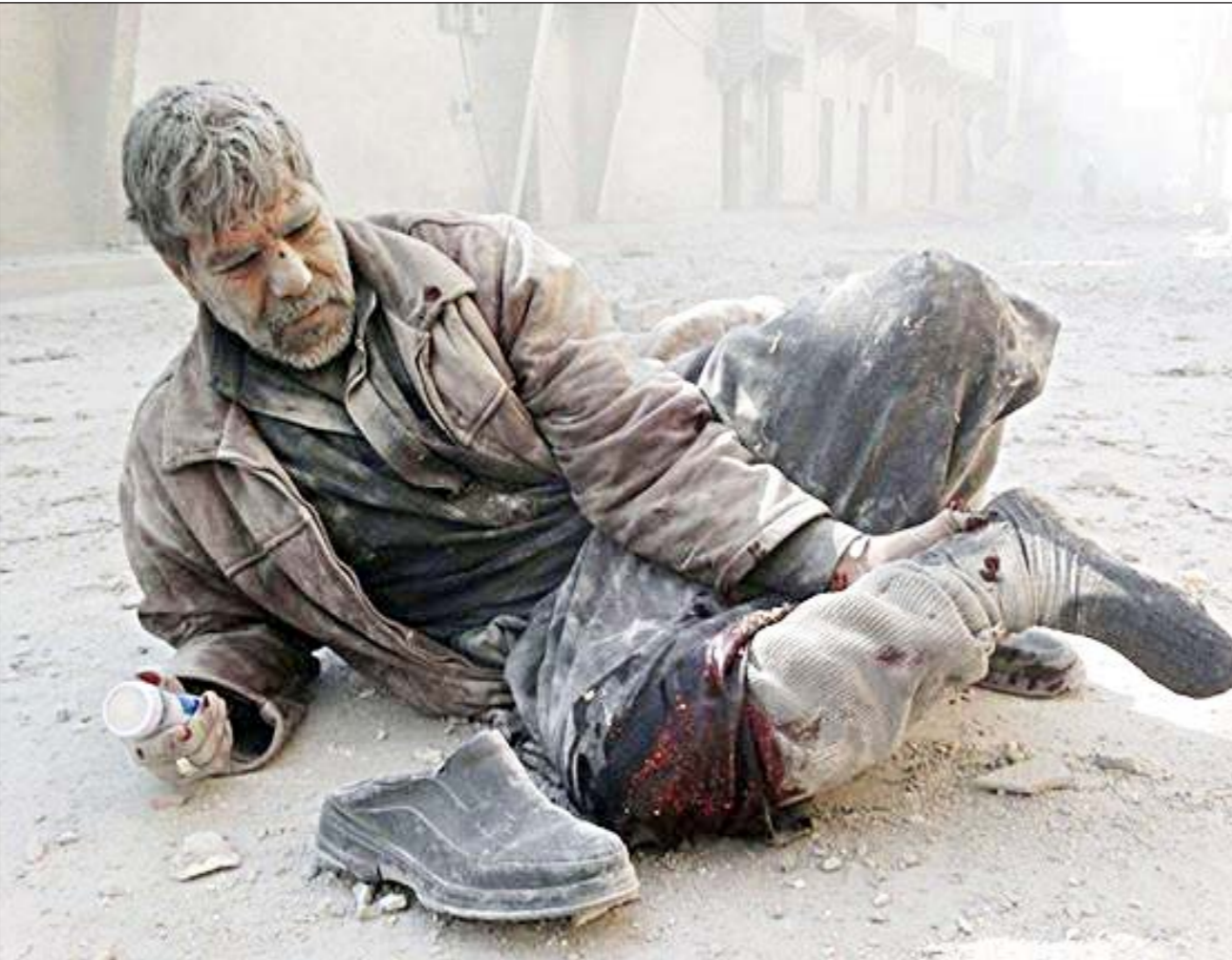
لقطة من فيلم «مياه فضة» سوريا، صورة ذاتية»

وستشهد الدورة 36 للمهرجان عرض 6 أفلام من مصر، و2 من كل من الإمارات وفلسطين، وفيلم واحد من الأردن ولبنان والكويت وتونس والمغرب وموريتانيا، إلى جانب أعمال لخريجين السوريين.