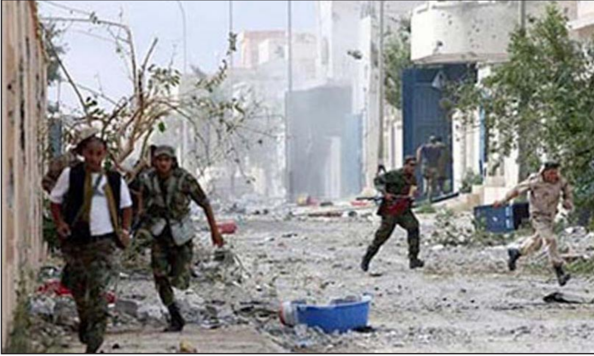
اشتباكات في بنغازي