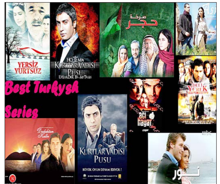
مجموعة من المسلسلات التركية مدبلجة بالعربية

اسطنبول - د ب أ: ذكر رئيس مجلس الصادرات في تركيا محمد بيوتكشي إن بلاده تحقق أرباحاً بما يزيد على 200 مليون دولار سنوياً من وراء تصدير المسلسلات التلفزيونية إلى أكثر من 100 دولة حول العالم، مشيراً إلى أن تركيا أصبحت ثاني أكبر مصدر للمسلسلات في العالم بعد الولايات المتحدة.