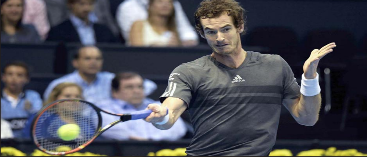
موراي يختم بطولة بلنسية بالتأهل للقب