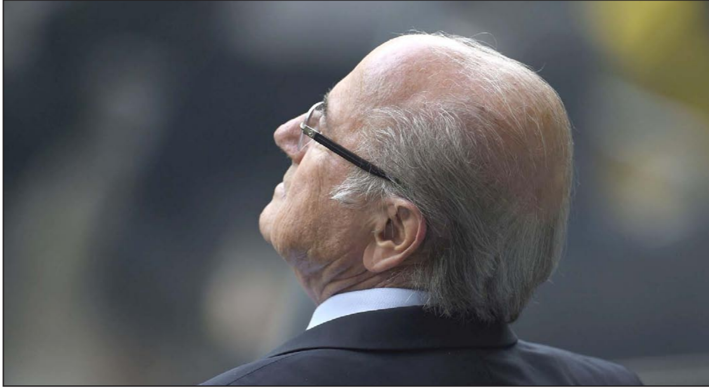
بلاتر يتعرض لاتهامات وضغوط كبيرة في الآونة الأخيرة

يونيو وتموز/ يوليو اللذين ينظم خلالها تحديدًا المونديال. وقال: «هناك حلال... الأول هو إقامة المونديال في فصل الشتاء وهذا سيعارض مع مواعيد الدوريات الأوروبية والثاني هو إقامته خلال شهري مايو/ أيار ويونيو على أن تكون مواعيد المباريات بين السابعة والتاسعة والنصف أو في منتصف الليل أو ربما في وقت متأخر عن ذلك». وأوضح: «إذا تم تعديل مواعيد الدوريات الأوروبية فإن هذا سيكون الحل الرياضي العامة. وختتم قائلًا: «يقولون أن الملاعب ستكون مكيفة لأن التدريب سيكون غير ممكن بأي طريقة أخرى... ماذا لو تعطل جهاز التكييف أثناء تدريب أحد المنتخبات؟ لن يتمكن اللاعبون حينها من التدريب... سيتعرضون إلى مشاكل صحية».