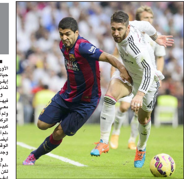
سواريز خاض مباراته الرسمية الأولى مع برشلونة ضد الغريم ريال مدريد

مدريد - د ب أ: أفادت صحيفة «ماركا» الإسبانية أن المهاجم الأوروغواي لويس سواريز تحدث في كتابه «اجتياز الخط، قصة حياتي» عن الموقف العنصري الذي جعله باللاعب الفرنسي باتريس إيفرا والذي كلفه عقوبة الحرمان من المشاركة مع فريقه القديم ليفربول ثنائي مباريات. وقال: «أنا لست عنصريا... أشعر بالحزن والغضب في كل مرة أفكر فيها أن وصمة العار تلك ستلازمي لأبد». وأضاف: «هو يبدأ النقاش معي باللغة الأسبانية وأذكر أنه حينها قال لي إنها العلامة الرجولية ولم أستطع فهم ما قاله لي... إيفرا جاء لي يتحدث معي عند علامة الركلة الرجولية وسألني لماذا اعتديت عليه بالضرب وهو الأمر الذي اعتبره نقاشا كبيرا من جانب مدافعي لا يتوقف عن الضرب طوال المباراة». وأوضح: «لم أستخدم كلمة أسود بالمعنى الفهم بالغة الانكليزية... لم أكن أقصد أيضا أن أكون مهذبا ورفيقا مع إيفرا عندما وجهت له هذه الكلمة لكن في الوقت نفسه لم يكن هجوما عنصريا... زوجتي تعتني بالأسود أحيانا وجدتني كنت تقول الشيء ذاته لجدتي».