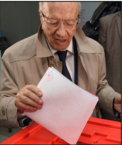
الباجي قائد السبسي يذلي بصوته

على مواجهة استحقاقات وتحديات البلاد الكبيرة خاصة في السنوات القادمة التي ستكون صعبة على المالية العمومية وعلى الميزانية وعلى أوضاع البلاد»، ومساء الأحد، قال راشد الغنوشي رئيس حركة النهضة لقيادة «حنجبل» التونسية الخاصة «سواء كانت النهضة الأولى أو الثانية تونس محتاجاً إلى حكم وفاق وطني». وأضاف أن «سياسة التوافق (بين حزبه والمعارضة) أنقذت بلادنا مما تتردى فيه دول الربيع العربي ومعتبرا «من المهم أن نرسخ قضية الديمقراطية، والنقطة في المؤسسات».