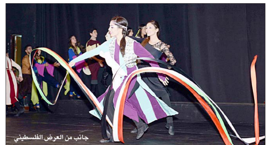
جانب من العرض الفلسطيني

انطلقت في الكويت فعاليات «الأيام الثقافية الفلسطينية في دولة الكويت»، التي ينظمها المجلس