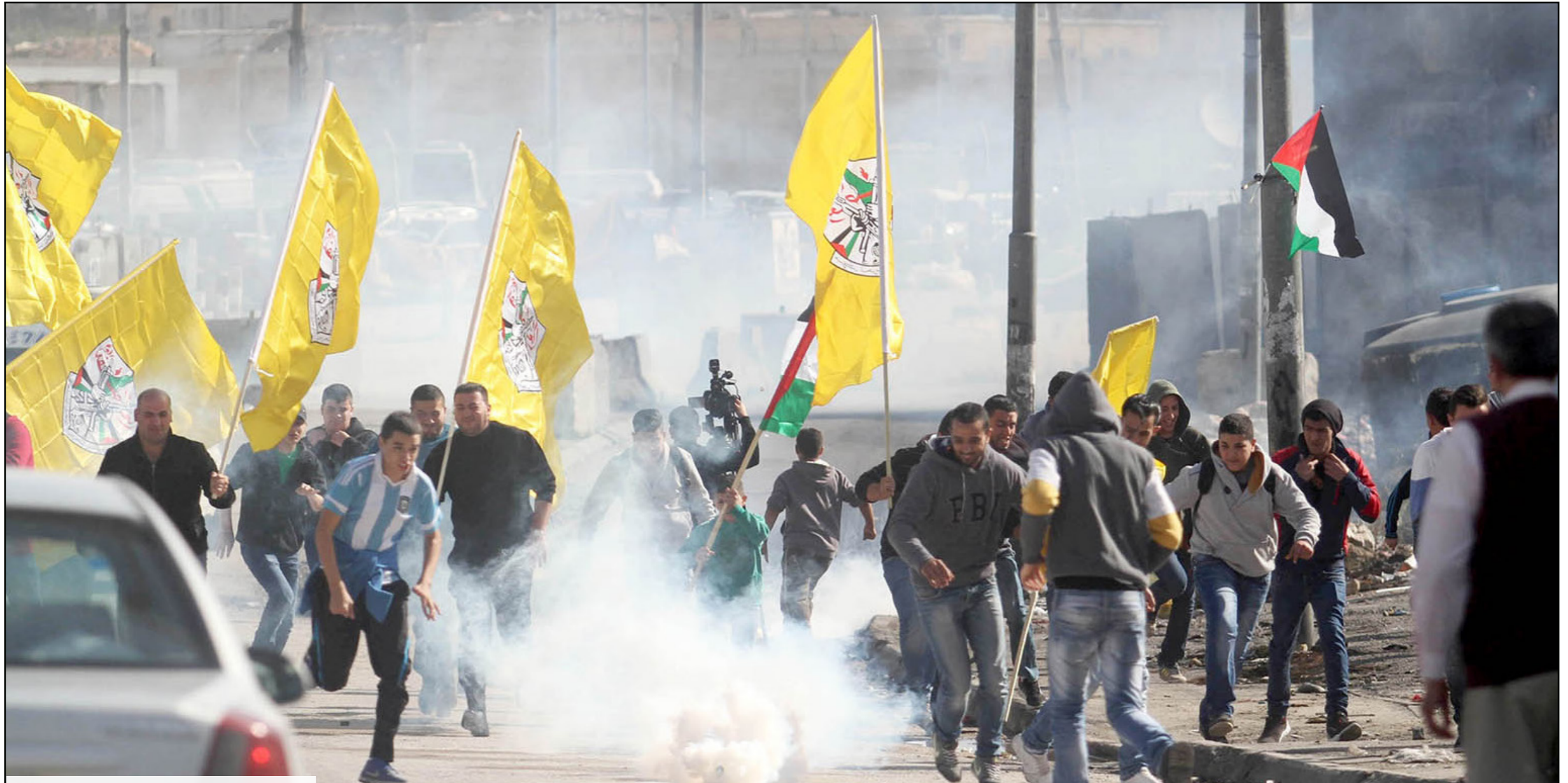
مواجهات بين فلسطينيين وجنود الاحتلال عند حاجز قلنديا شمال القدس المحتلة أمس