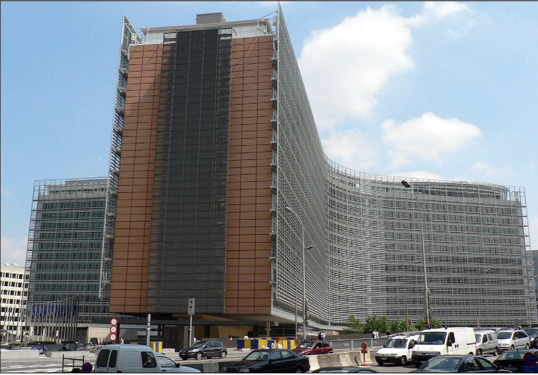
مقر المفوضية الأوروبية في بروكسل

ونبه يونكر إلى أن الإتحاد الأوروبي سيبقى محدودا بتمانيه وعشرين دولة خلال السنوات الخمس المقبلة. فمفاوضات التوسيع ستتواصل لكن ليس بمقدور أي بلد إنجاز عملية الانضمام بما فيها صربيا ومونتينيغرو.