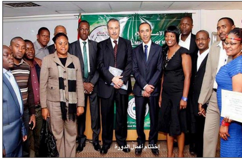
القاهرة - «القدس العربي»