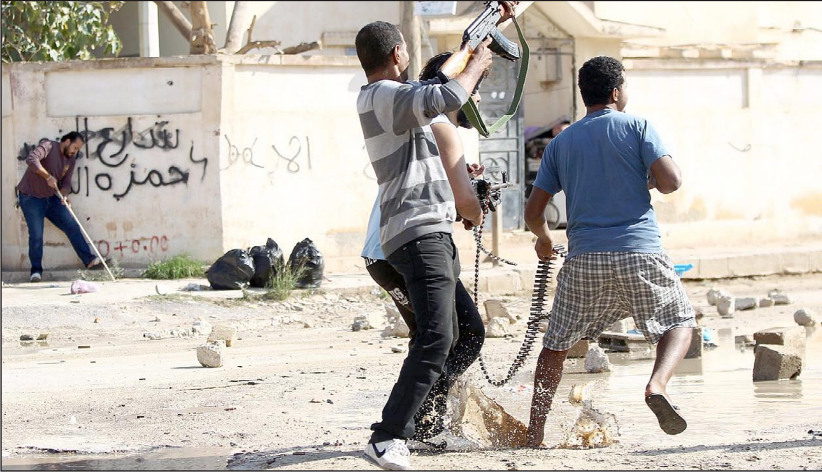
جانب من اشتباكات بنغازي