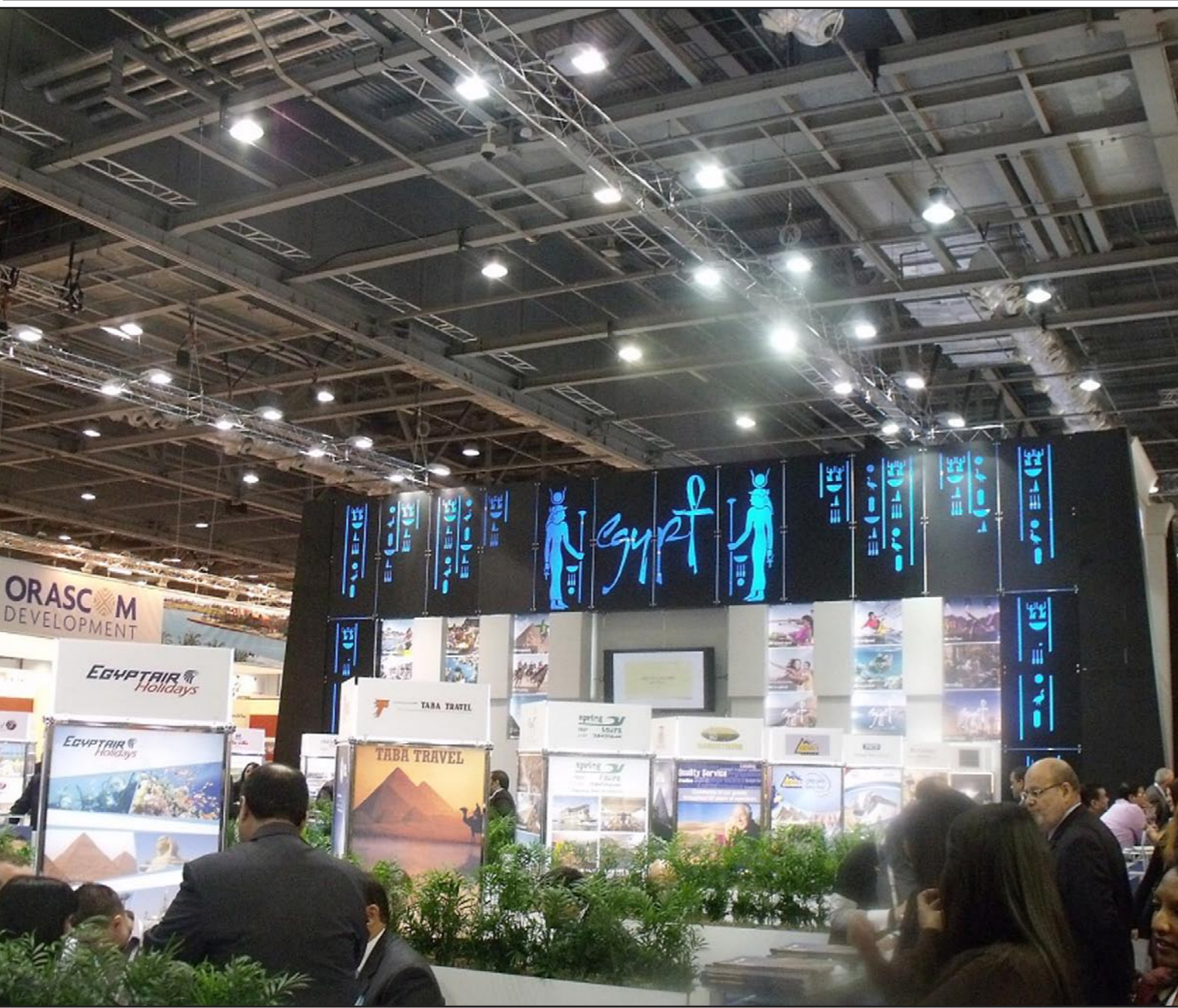
الجناح المصري في سوق السفر العالمي في لندن

كما انتقدت المحكمة العليا أيضا الحكومة، وكلفت فرقا خاصا للتحقيق في المسألة.