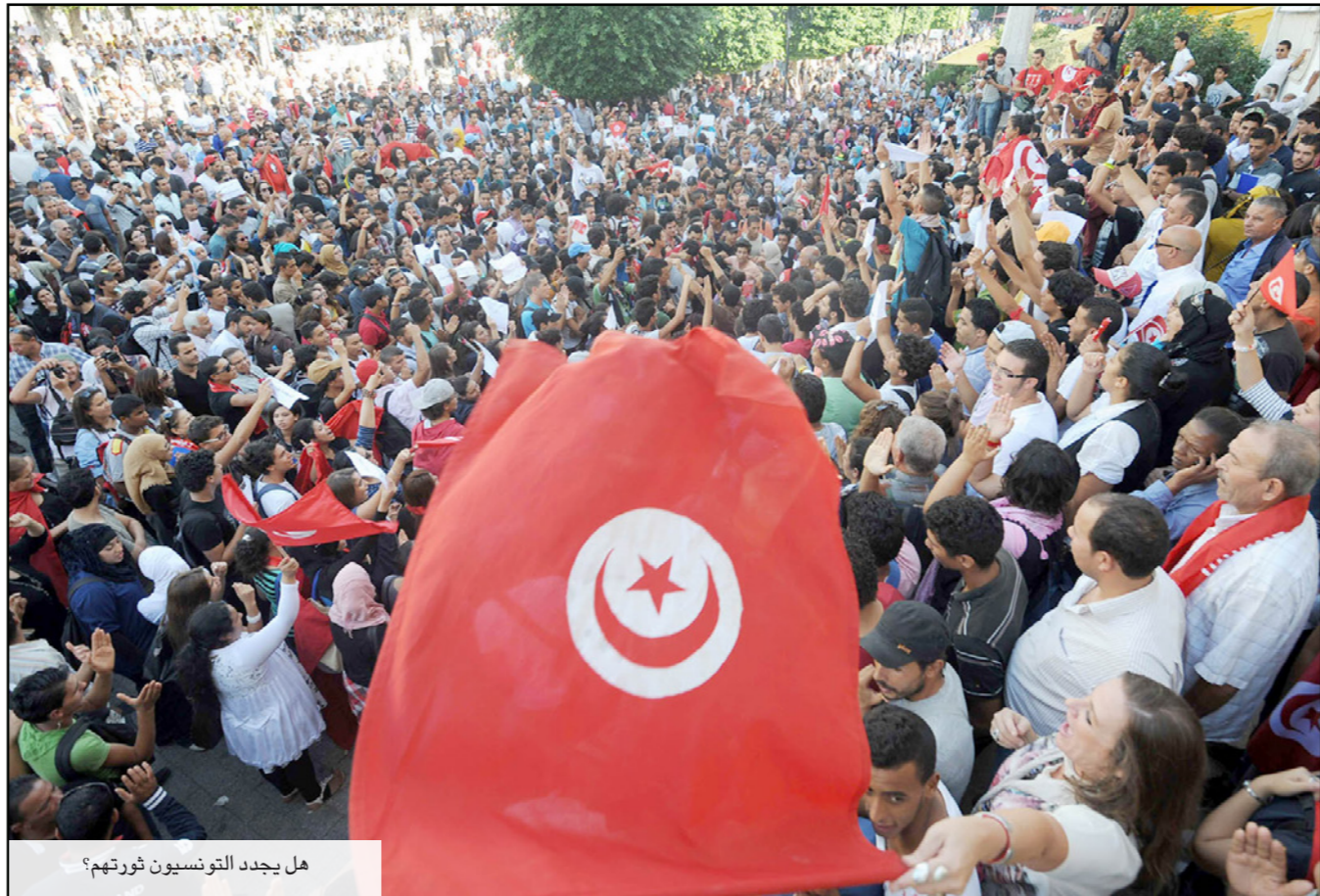
هل يجدد التونسيون ثورتهم؟

في هذا السياق يرى القيادي اليساري أن تردي الوضع الاجتماعي يتجلى من خلال: غلاء المعيشة