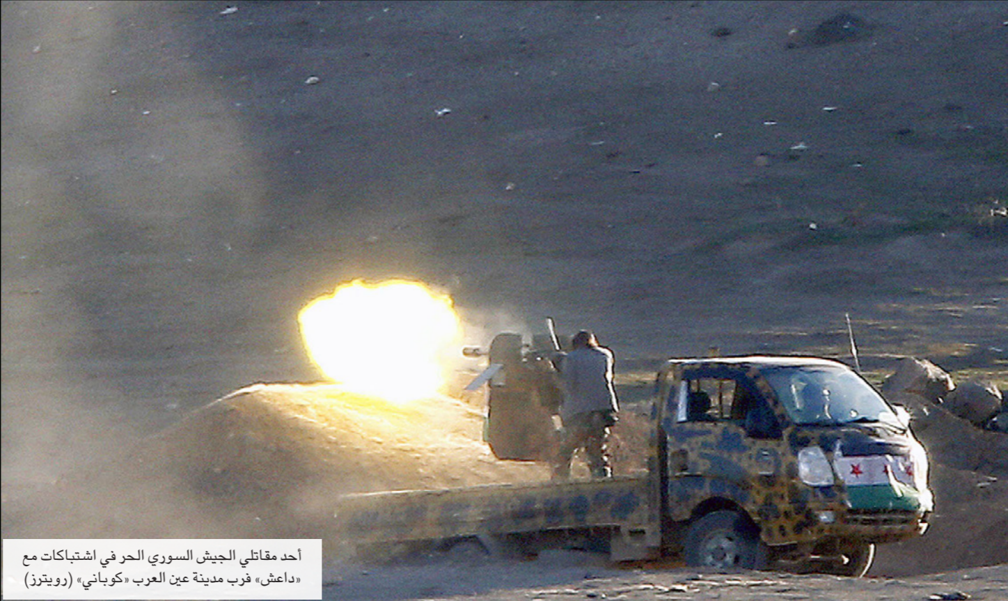
أحد مقاتلي الجيش السوري الحر في اشتباكات مع «داعش» قرب مدينة عين العرب «كوباني»