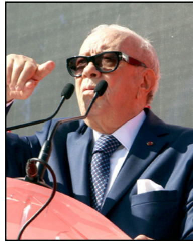
الباجي قائد السبسي

مرشح المنظومة السابقة (رئيس نداء تونس الباجي قائد السبسي) ومنع تغول حزب واحد في البلاد، مشيرا إلى أن «أكبر ضمانة للحريات والديمقراطية في تونس هي بقاء المرزوقي في رئاسة الجمهورية».