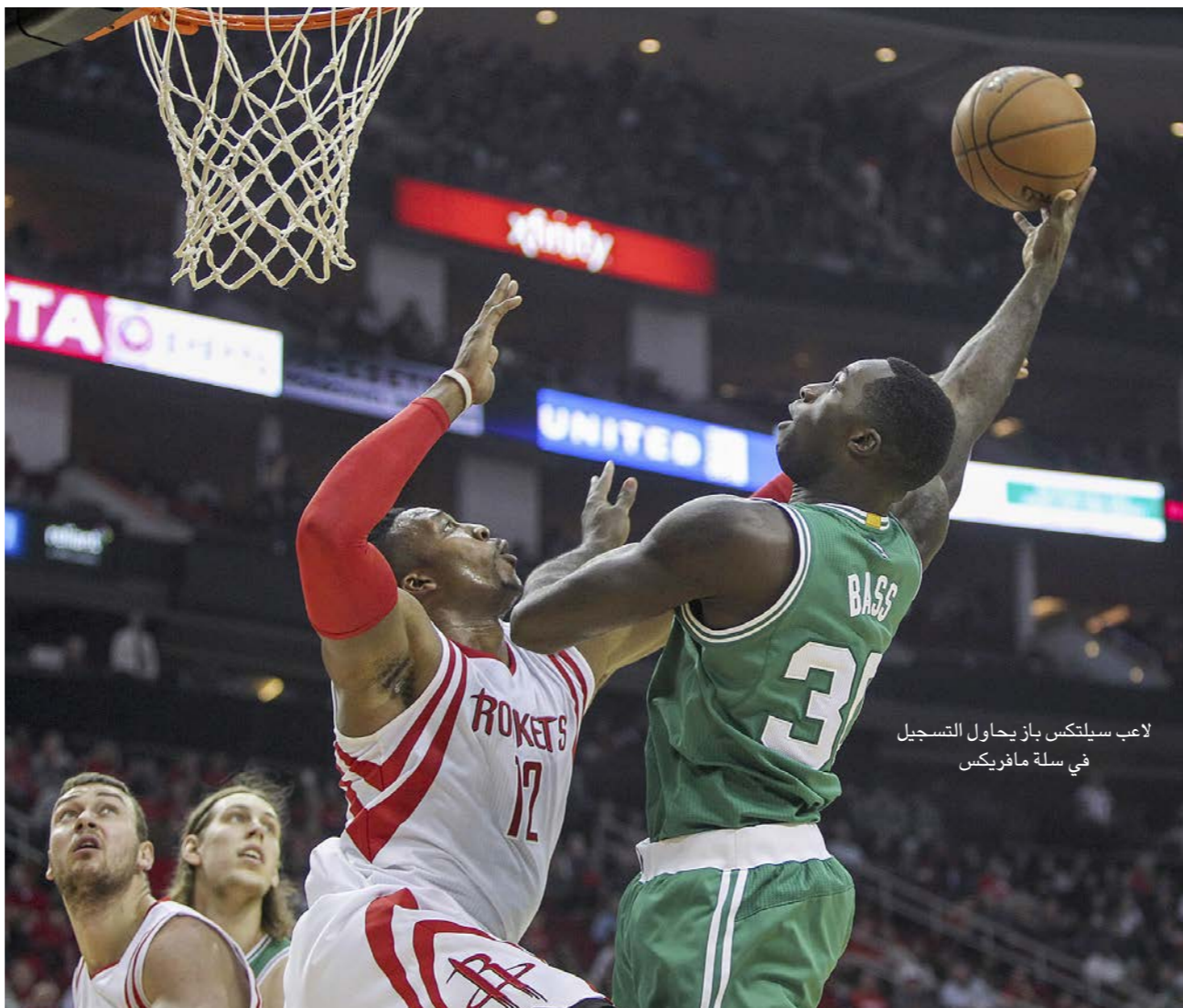
لاعب سيلتكس باز يحاول التسجيل في سلة مافريكس