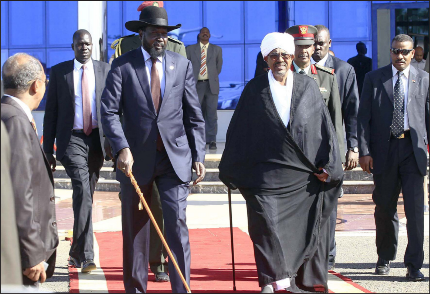
الرئيس السوداني عمر البشير لدى استقباله نظيره سلفاكير ميارديت في الخرطوم امس

وتعددت الاتهامات لجماعة محمد مصطفى شردي، مفسرا صدور بعض القوانين التي يراها البعض عقيدة للحريات، مثل