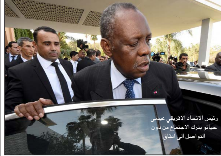
رئيس الاتحاد الأفريقي عيسى حياتو يتكلم مع رؤساء الاتحاد الإفريقي عيسى حياتو في اجتماع في تونس...