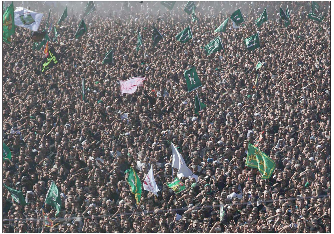
حشود من العراقيين اثناء الاحتفالات بذكرى عاشوراء في كربلاء امس