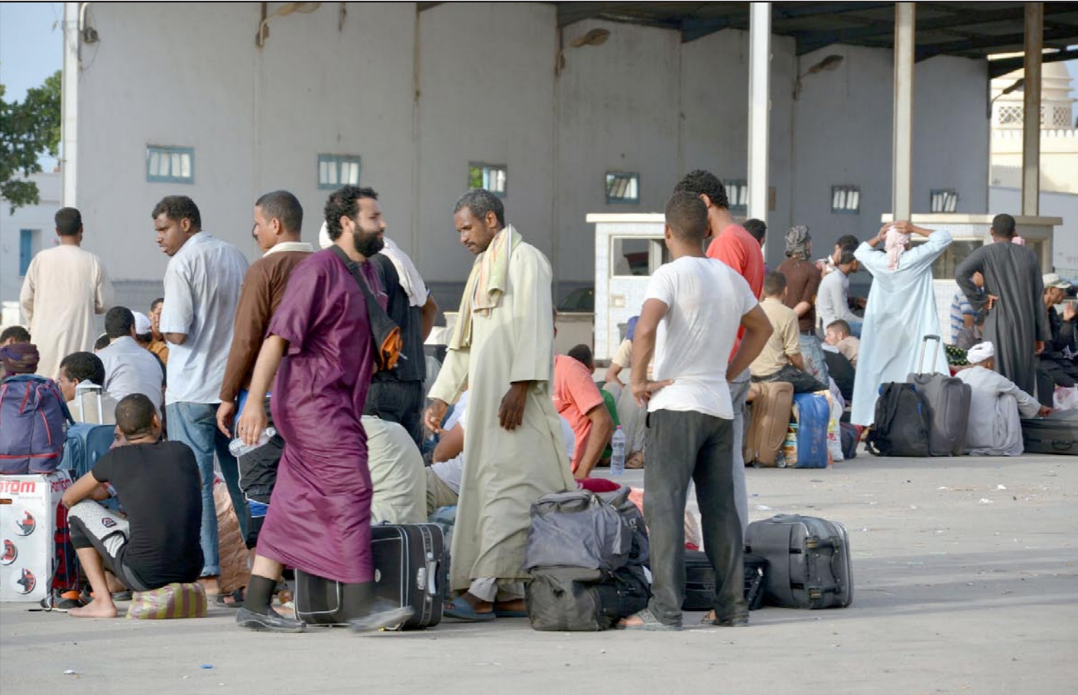
عدد من النازحين الليبيين الغارين من وطاة الحرب

■ بنغازي- الأناضول: قُتل 13 شخصاً في اشتباكات بين قوات تابعة لرئاسة الأركان الليبية التابعة لحكومة عبدالله الثني المعينة من قبل برلمان طبرق، ومسلحين من الدروع (كتائب الثوار) وتنظيم أنصار الشريعة بمناطق مختلفة من مدينة بنغازي (شرق)، بحسب مصدر طبي. وقال مصدر طبي، مفضلاً عدم ذكر اسمه، إن مستشفى بنغازي الطبي استقبل، الإثنين، 13 جثة من المدنيين والعسكريين. ولم يحدد المصدر من أين أحضرت تلك الجثث بالتحديد لكنه أكد أن أصحابها «قتلوا جراء اشتباكات مسلحة وأعمال عنف تشهدها عدة أحياء بالمدينة». فيما قال شهود عيان إن «اشتباكات عنيفة وقعت بالقرب من الميناء البحري بمخطف سوق الحوت وسط المدينة بين قوات تابعة لرئاسة الأركان الليبية (التابعة لحكومة الثني) ومسلحين من الدروع وتنظيم أنصار الشريعة»، وبحسب الصفحة الرسمية للقوات البحرية الليبية على موقع التواصل الاجتماعي «فيسبوك»، فإن «رقاطة (قطعة بحرية حربية) أصيبت بمدفع 106 جراء الاشتباكات التي وقعت في محيط الميناء والقاعدة البحرية». وفي حين لم تبن البحرية الليبية مصير تلك السفينة إلا أنها أضافت أن تلك «الرقاطة قديمة وترسو منذ سنوات داخل مقر قوات البحرية الملائق للميناء البحري وهي عاطلة عن العمل.. إلى ذلك نزح سكان المنطقة والمناطق القريبة من الاشتباكات من مساكنهم هرباً من القذائف التي تتناثر في المكان وتلطيبة لتلطيحات العقيد إبراهيم السماري، المتحدث باسم رئاسة أركان الجيش المعينة من قبل البرلمان المجتمع في طبرق (شرق). وفي وقت سابق طالب السماري، في تصريحات تلفزيونية، لما قال إنه «القضاء على المجموعات المسلحة وتأمين المناطق، في إشارة لمنطقة الصابري وسوق الحوت الذي تحصن بها كتائب إسلامية وتنظيم