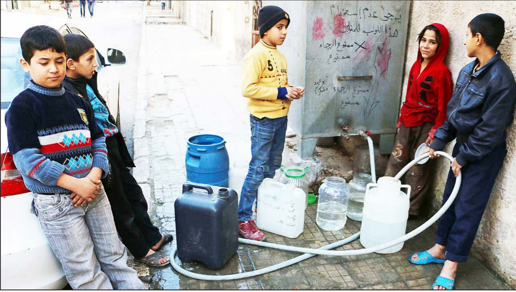
أطفال سوريون يملؤون الماء في أحد أحياء مدينة حلب