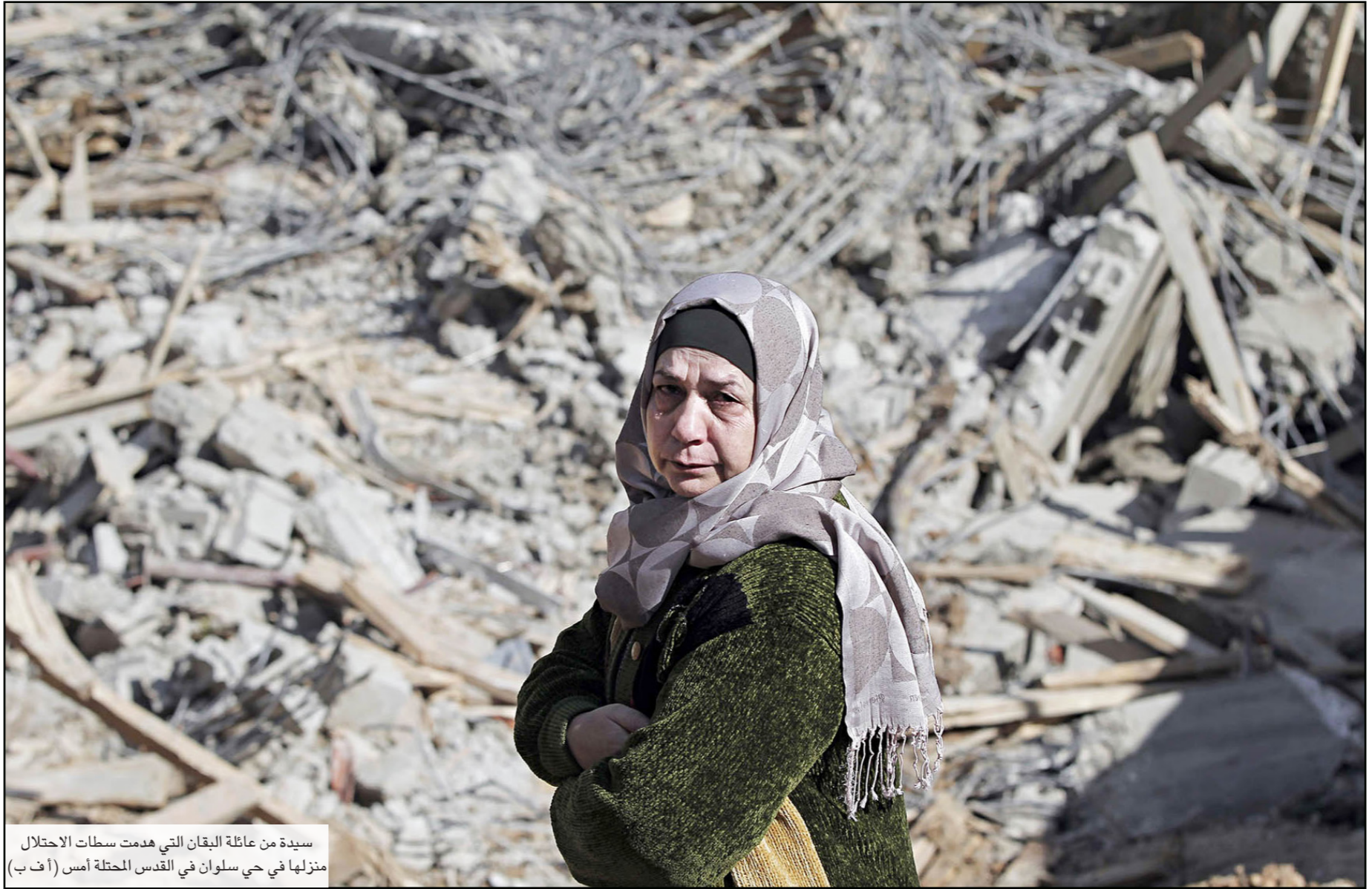
سيدة من عائلة البقان التي هدمت سطات الإحتلال منزلها في حي سلوان في القدس المحتلة أمس