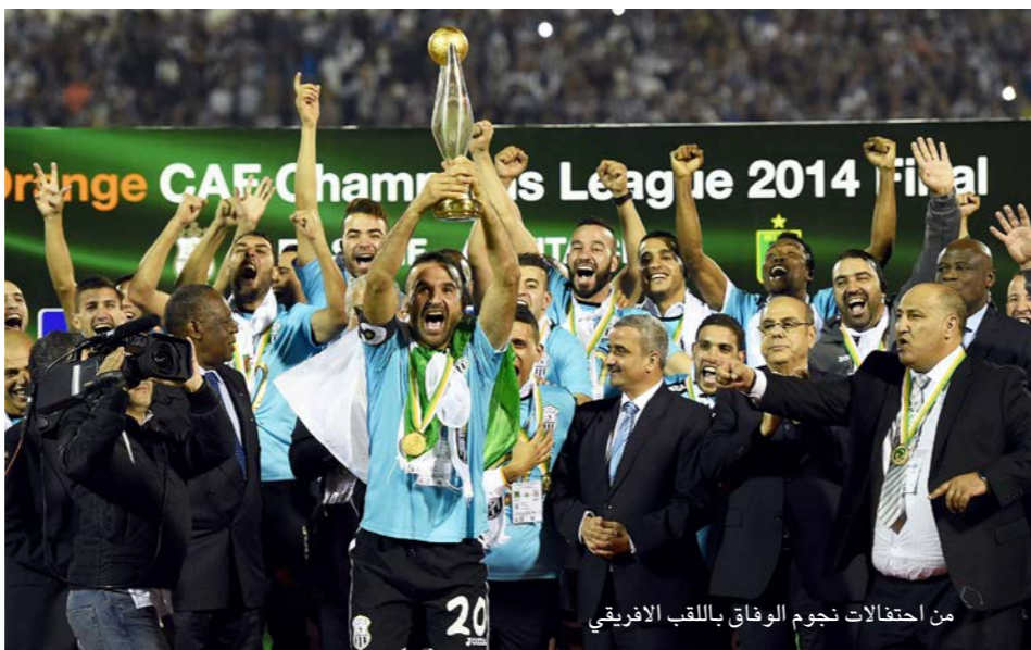
من احتفالات نجوم وفاق بلقب الأفريقي