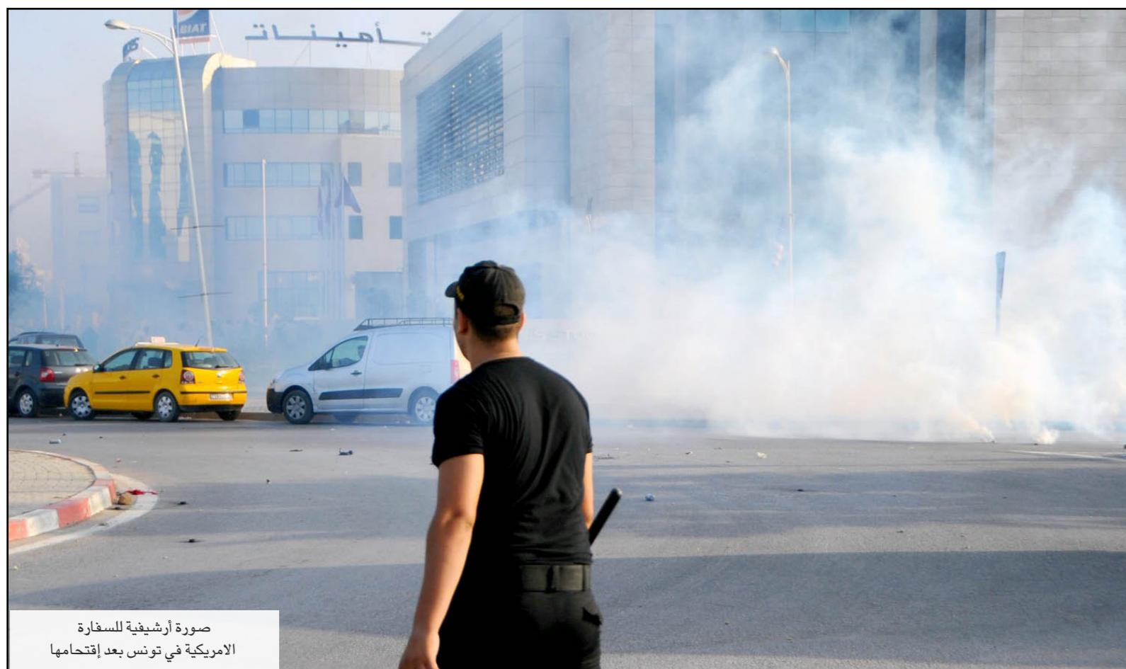
صورة أرشيفية للسفارة الأمريكية في تونس بعد إقتحامها