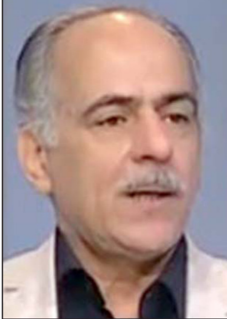
اللواء محمود زاهر