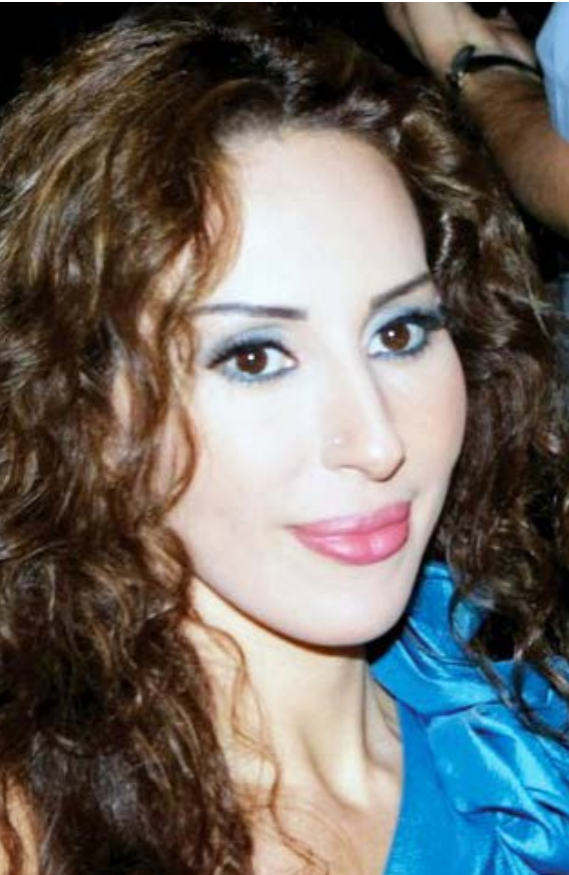
ورد الخال ومنى طابع