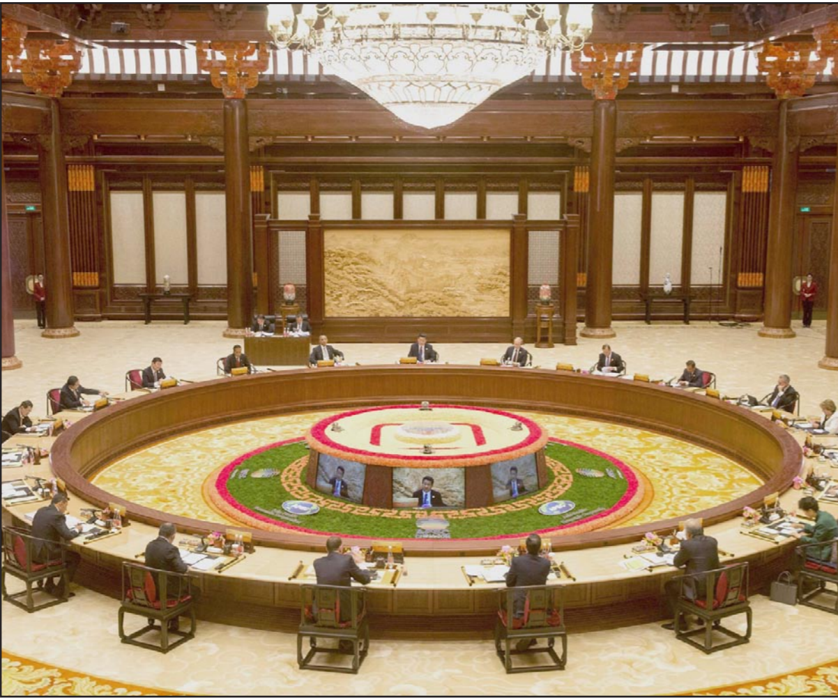
قادة دول «إيبك» في الجلسة الختامية لقمته

■ بكين - وكالات الأنباء: صدق أمس الثلاثاء 12 من زعماء العالم على مقترح للمضي قدماً في إبرام إتفاقية التجارة الحرة بين الصين واقتصادات دول المحيط الهادئ. ووصف الرئيس الصيني، شي جين بينغ، الإجراء لدى لقائه خطابته الختامية في قمة منتدى التعاون الاقتصادي لدول آسيا والمحيط الهادئ «إيبك» التي استضافتها بكين هذا التحرك بأنه أول خطوة تاريخية. وقال شي لقادة المنتدى الآخرين، وبينهم الرئيس الروسي فلاديمير بوتين والأمريكي باراك أوباما «اعتقد أن مباحثاتنا اليوم لها دلالة كبيرة.. يمكننا أن نقول بكل فخر أننا فعلنا الشيء الصحيح».