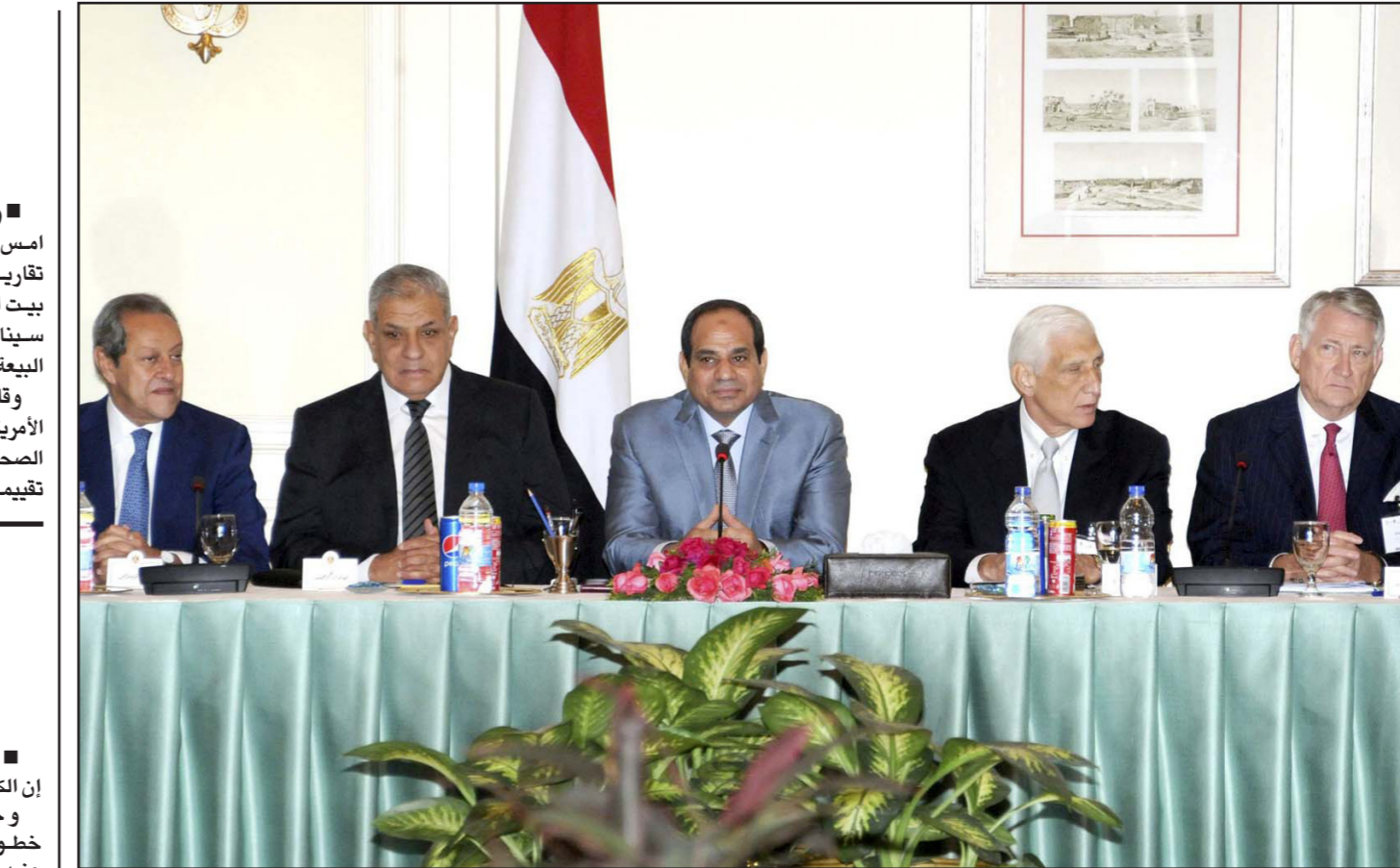
الرئيس عبد الفتاح السيسي ورئيس الوزراء ابراهيم محلب اثناء اجتماع مع وفد من رجال الأعمال الأمريكيين في القاهرة

وقالت المتحدث باسم الخارجية الأمريكية، جنيفر ساكي، خلال الوجد الصحافي للوزارة من واشنطن: «لا نملك تقييما في هذه المرحلة من الزمن» لتلك