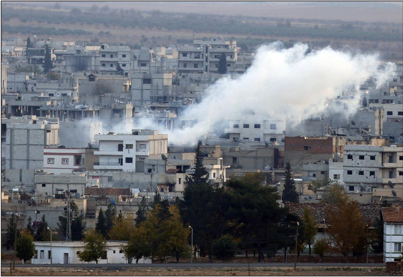
آثار الدمار التي خلفتها ضربات القوات الكردية ضد قوات تنظيم الدولة الإسلامية في عين العرب

الجبهة الجنوبية لحماية الأردن وتهديد نظام الأسد..