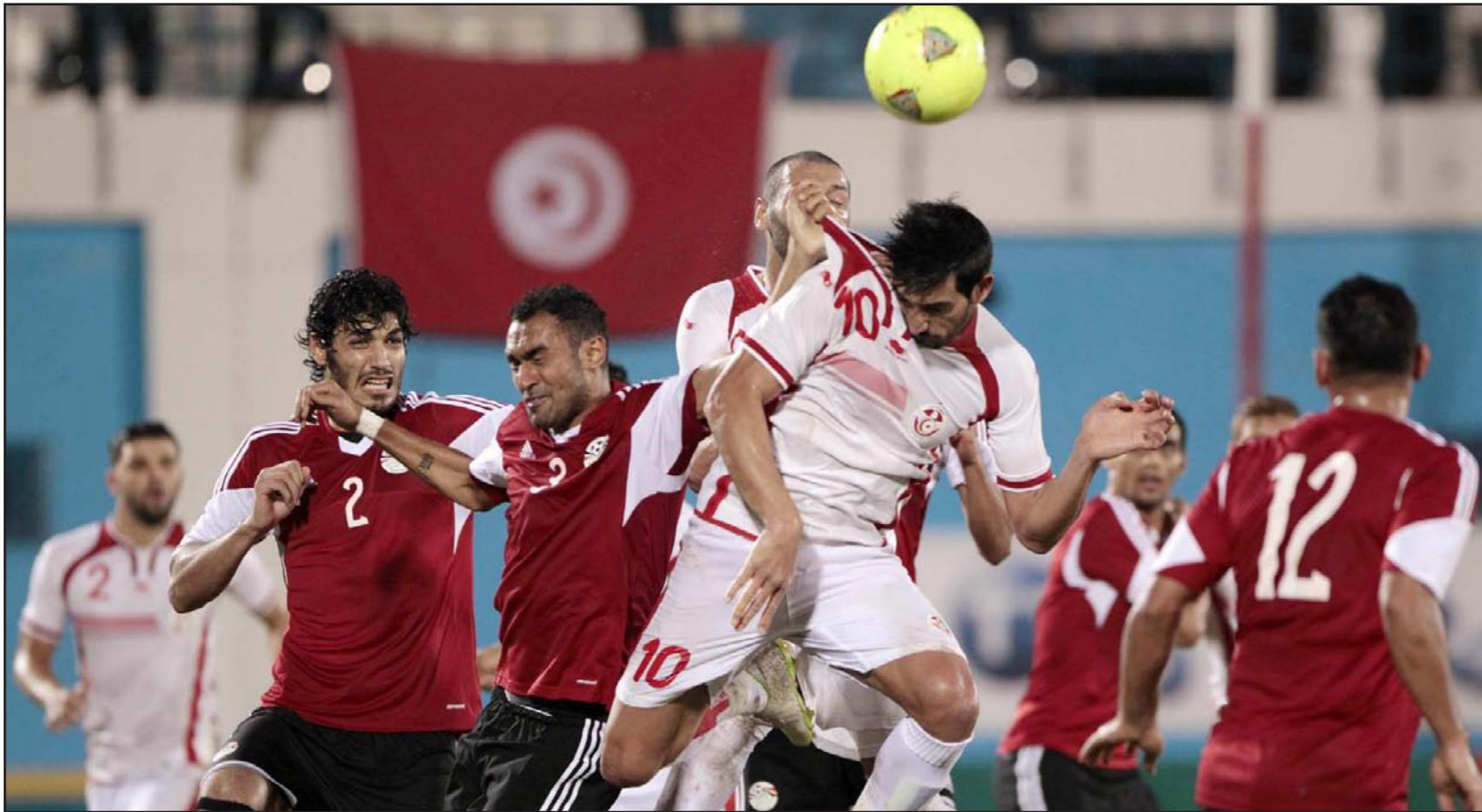
صراع حاد على الكرة بين لاعبي المنتخبين التونسي والمصري