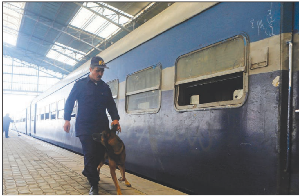
عصر أمن مصري مع كلب مزرب على اكتشاف القنابل بعثش رصيف قطار بعد تفجير في محطة قطارات رمسيس في القاهرة أمس

وفي 12 تشرين الثاني/نوفمبر الجاري، أصدر السيسي، قانونا يمنح رئيس البلاد الحق في تسليم المتهمين الأجانب إلى دولهم قبل صدور حكم نهائي في قضاياهم، وأثار القانون جدلا حول المتهمين الذين يمكن أن يتسلمهم أستراليا وأحزاب من اليمين المتطرف عن الأسترالي بيتر غريستي والكندي المصري محمد فهسي، المتهمين في قضية تحريض «الجزيرة» الانتكزية على مصر، المعروفة إعلاميا بـ«الخليفة الماروني». يذكر أن محكمة مصرية، قضت في شهر حزيران/يونيو الماضي، في حكم أولي، بسجن 18 من المدانين في هذه القضية، لمدة تتراوح بين 3 إلى 10 سنوات، إلى جانب سجن 11 مدانا غيبيا (بينهم 3 مراسلين أجانب) لمدة 10 سنوات، وقالت مصادر مطلعة لـ«القدس العربي» إن