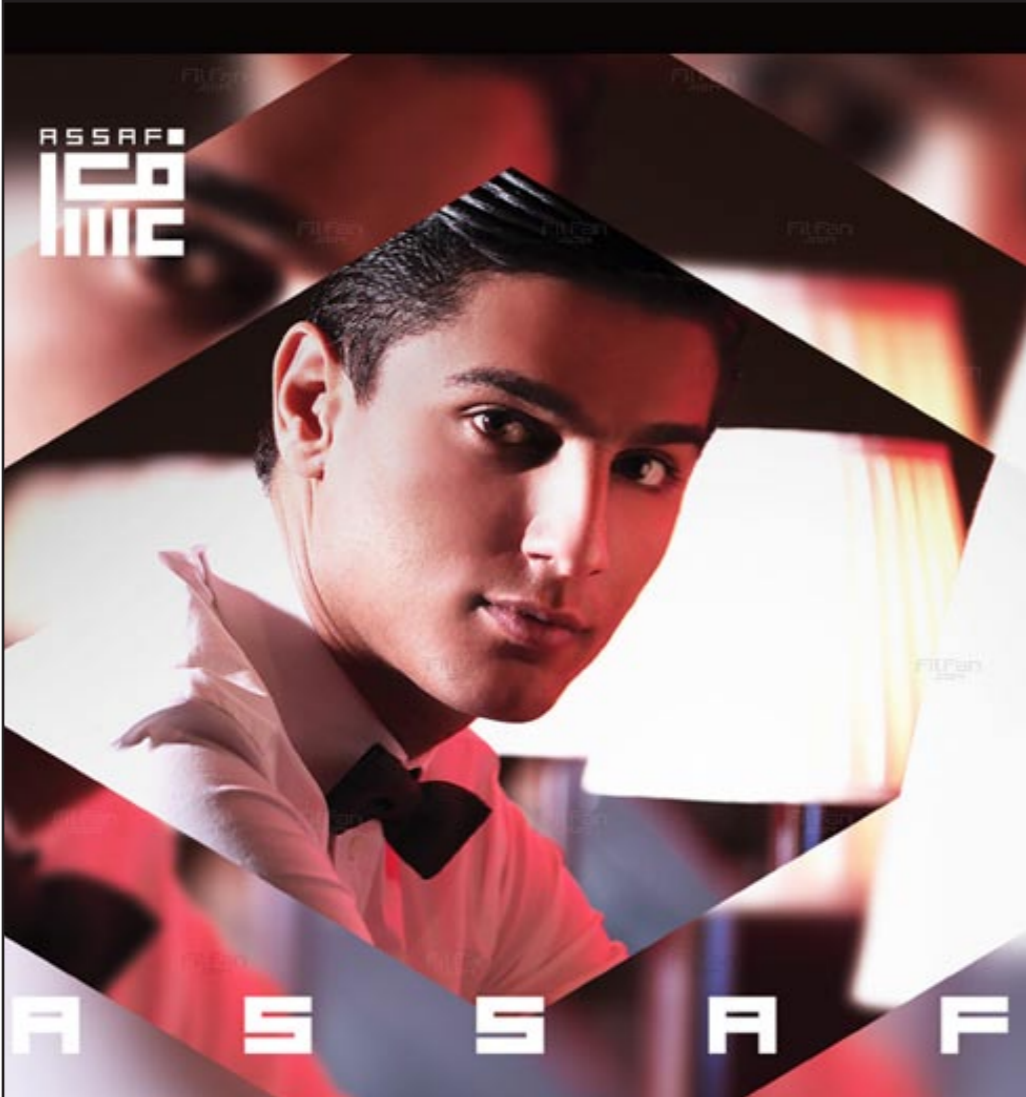
المطرب محمد عساف