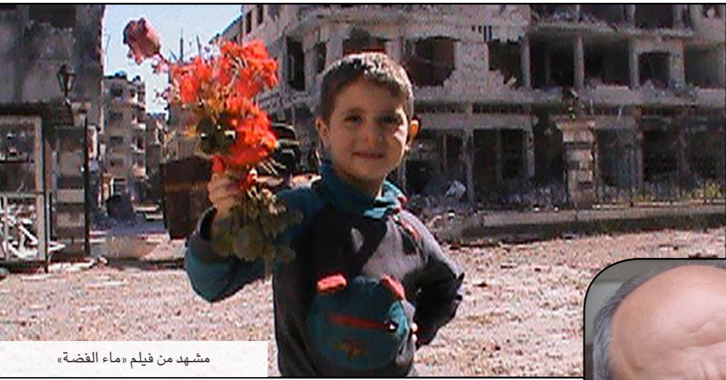
مشهد من فيلم «ماء الفضة»

معرفة وتمكن مهني وحرفي، نحن أمام شباب لا بد أنهم سيجدون المستوى الأمثل للمسيما عبر تجربتهم الشخصية من فيلم إلى آخر، هنا دائما نتلاقى مع جمالية العفوية والتعبير عن الداخل، أحيانا يكون في ظل حوار حرفي مهني ثقافي كان يمكن لهذه الأفلام أن تكون أفضل، لم نستطع أن تصل إلى نورتها بسبب فقدان التجربة والحوار المهني، ولكن اعتقد أن موجة جديدة تنتشر مستطور نفسها بنفسها، هناك أفلام سورية بها مساحات مدهشة من السينما يسعدني أنني شاهدتها».