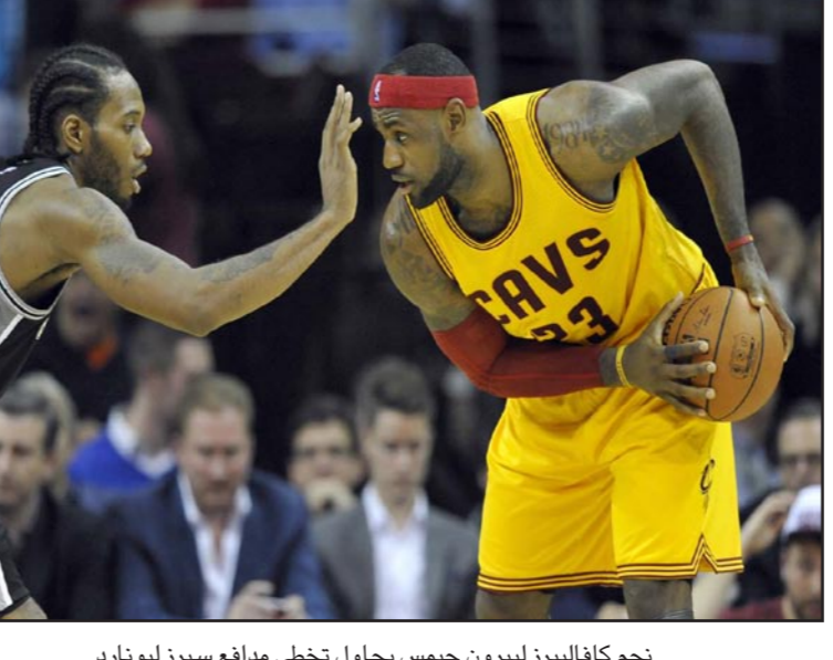
نجم كافاليرز ليبرون جيمس يحاول تخطي مدافع سبرز ليونارد

لوس أنجلوس - د ب أ: تغلب سان أنتونيو سبرز على مصيفه كليفلاند كافاليرز 90-99 في مسابقة دوري كرة السلة الأمريكي المحترفين. عندما تلغمت الكرة في يد صاحب الأرض ليبرون جيمس في آخر هجمة بالمباراة، وسجل تيم دنكان 19 نقطة لسبرز وأضاف الفرنسي برونيس دياو 19 نقطة أخرى للفريق، بينما سجل البرازيلي أندرسون فارغاو 23 نقطة لكافاليرز وأضاف كايرون إيرفينغ 20 نقطة أخرى لأصحاب الأرض، بينما اكتفى ليبرون جيمس بتسجيل 15 نقطة للفريق. وكان الأرجنتيني مانو جينوبيلي تقدم 91-88 لسبرز قبل ثمانية على نهاية المباراة، ورد إيرفينغ بتسجيل رميتين حرتين لكافاليرز. وأضاف جينوبيلي نقطة أخرى لسبرز من رمية حرة قبل أن تصل الكرة إلى جيمس في الطرف الآخر من اللب، بينما كان جيمس يريث الكرة ويحاول تعمرها من وراء ظهره سقطت من بين يديه ليضيع الفرصة الأخيرة لصالح الأرض. وفي باقي المباريات، فاز تونتو رابرتوزور على مفيس غريزيلز 96-92 ولس أنجلوس ليكرز على هيوستن روكتس 98-92 والاس مارفيس على واشنطن ويزاردز 105-102. كما فاز ميلويكي باكس على بروكليك نكس 122-118 ولوس أنجلوس كليز على اورلاندو ماجيك 114-90 ومينيسوتا تمبرولز على نيويورك نيكس 115-99 وفينكس سنز على ديترويت بيستونز 88-86. بينما فاز دنفر ناغتس على أوكلاهوما سيتي ثاندر 107-100 وإنديانا پيسرز على تشارلوت هورنتس 86-88 ويوسطن سيلتكس على فيلادلفيا سفيتس سيكسرز 90-101.