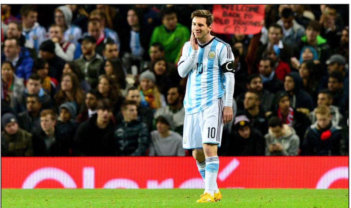
هل اقترب ميسي من الرحيل عن برشلونة؟

الثلاثاء عن مغزي تصريحات اللاعب الكبير. وإن كان ميسي وبارتوميو قد أثارا الصمت وعدم التحدث عن هذه الموضوع الشائك، فقد كان وفي حقيقة الأمر لا تختلف تصريحات ميسي شكلا ومضمونا عن تلك التي أطلقها في أيار/ مايو الماضي، عندما قال: «أحب هذا النادي كثيرا ولكن إذا كان هناك أناس لا تحبني وتشكك في وتفضل أحد سيارات الأجرة وأغلق بابها في هدوء. ومن منذ ذلك الحين، تركزت العناوين الرئيسية ومواقع الصحف الكتالونية على شيء واحد وهو «مستقبل ميسي»، واختار جوزيب ماري بارتوميو رئيس نادي برشلونة الاختيار ذاته الذي أقدم عليه نجم فريقه وهو «الصمت» عندما سئل خلال إحدى الحفلات التي حضرها مساء