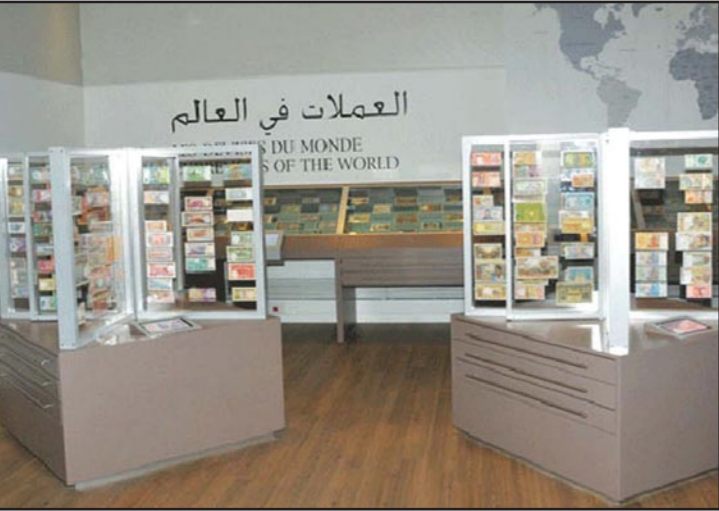
جانب من متحف المركزي للبناني

تدريجي، مضيفاً أن وجود الفرص الاستثمارية مرتبط بشكل عام بوجود صفقات جيدة تتماشى مع جهاز قطر للاستثمار في بناء علاقات تجارية طويلة الأمد. وأوضح أن الجهاز يعتمد استراتيجية عالمية تقوم على توزيع أصوله في مناطق ذات عوائد عالية، وأضاف «ننمو كل عام ونسعى لتوزيع الاستثمارات في مختلف القطاعات من عام لآخر حسب الفرص الاستثمارية المتاحة». وحول نصيب الدول العربية من استثمارات الجهاز، قال أحمد بن محمد السيد إن هناك بالفعل استثمارات في الدول العربية وأن الشركات التي يمتلكها الجهاز تستثمر في العديد من الدول العربية مثل شركة «الديار القطرية» و«كتارا للضيافة». وحول استثمارات الجهاز في الصين كشف عن استثمارات موجودة بالفعل هناك، مع توقيع اتفاقية مع مجموعة «سيتيك» الصينية خلال الزيارة التي قام بها الشيخ تميم بن حمد آل ثاني في وقت سابق من هذا الشهر إلى بكين، وأضاف أن الجهاز لديه خطط لزيادة حجم استثمارات في الصين خاصة وأسيا بشكل عام. ويشأن ماهية القطاعات التي يعتزم جهاز قطر للاستثمار القيام باستثمارات بها في آسيا، أوضح الرئيس التنفيذي لجهاز قطر للاستثمار أن الجهاز يسعى للاستثمار في العديد من القطاعات أبرزها قطاع الرعاية الصحية والبنية التحتية والعقارات وقطاع التجزئة. وحول القطاعات التي يتجنب الجهاز الاستثمار فيها على المدى القصير أوضح السيد أنه ليس هناك قطاع يعنيه يتجنب الجهاز الاستثمار فيه، إلا إذا كان ذلك يضر على المجتمع على الجهاز هذا الأمر، مضيفاً أن طبيعة الجهاز تختلف نوعاً ما، ففي بعض الأحيان وجود مشاكل في الأسواق تأتي بغرض استثمارية مناسبة.