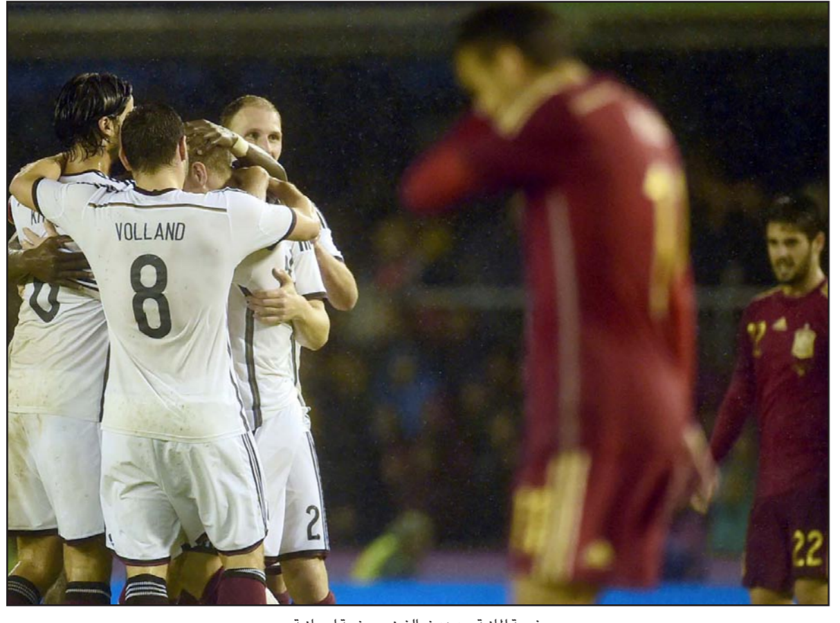
فرحة المانية بعد هدف الفوز... وخيبة اسبانية

الثلاثاء عن مغزي تصريحات اللاعب الكبير. وإن كان ميسي وبارتوميو قد أثارا الصمت وعدم التحدث عن هذه الموضوع الشائك، فقد كان وفي حقيقة الأمر لا تختلف تصريحات ميسي شكلا ومضمونا عن تلك التي أطلقها في أيار/ مايو الماضي، عندما قال: «أحب هذا النادي كثيرا ولكن إذا كان هناك أناس لا تحبني وتشكك في وتفضل أحد سيارات الأجرة وأغلق بابها في هدوء. ومن منذ ذلك الحين، تركزت العناوين الرئيسية ومواقع الصحف الكتالونية على شيء واحد وهو «مستقبل ميسي»، واختار جوزيب ماري بارتوميو رئيس نادي برشلونة الاختيار ذاته الذي أقدم عليه نجم فريقه وهو «الصمت» عندما سئل خلال إحدى الحفلات التي حضرها مساء