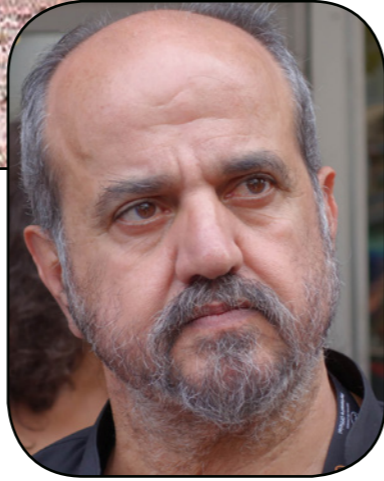
المخرج السوري أسامة محمد

أخطو نحو صناعة فيلم أشعر بأن ملامح لغة سينمائية جديدة تدعوني لأبدأ عمل ما، أنجزت 3 أفلام خلال 35 عاماً وهذا قليل، لكن الوقت الذي قد يبدو مهدوراً كان يقضي في أعمال سورويين آخرين أو في وضع كل ما أستطيع من قوة، خاصة بعد أن نالت أفلامي بعض الاعتراف وأصبحت أستطيع أن أمتح بعض القوة للآخرين، كنت أفعل كل ما أستطيع ليصنع الآخرون أفلامهم، لم يكن لدي أي شك في أن السينما ستطور بصانع لها وجهة الإنسان للوجود، نتعرف على ثقافته وجمالياته التي عكسته سيفاف في صورها، وعن قلة أعماله السينمائية قال: «لا أريد أن اصنع فيلماً لأضيف رقماً من الأفلام ولا أريد أن أكره شيئاً، ولكن أطلب من نفسي الكثير عندما