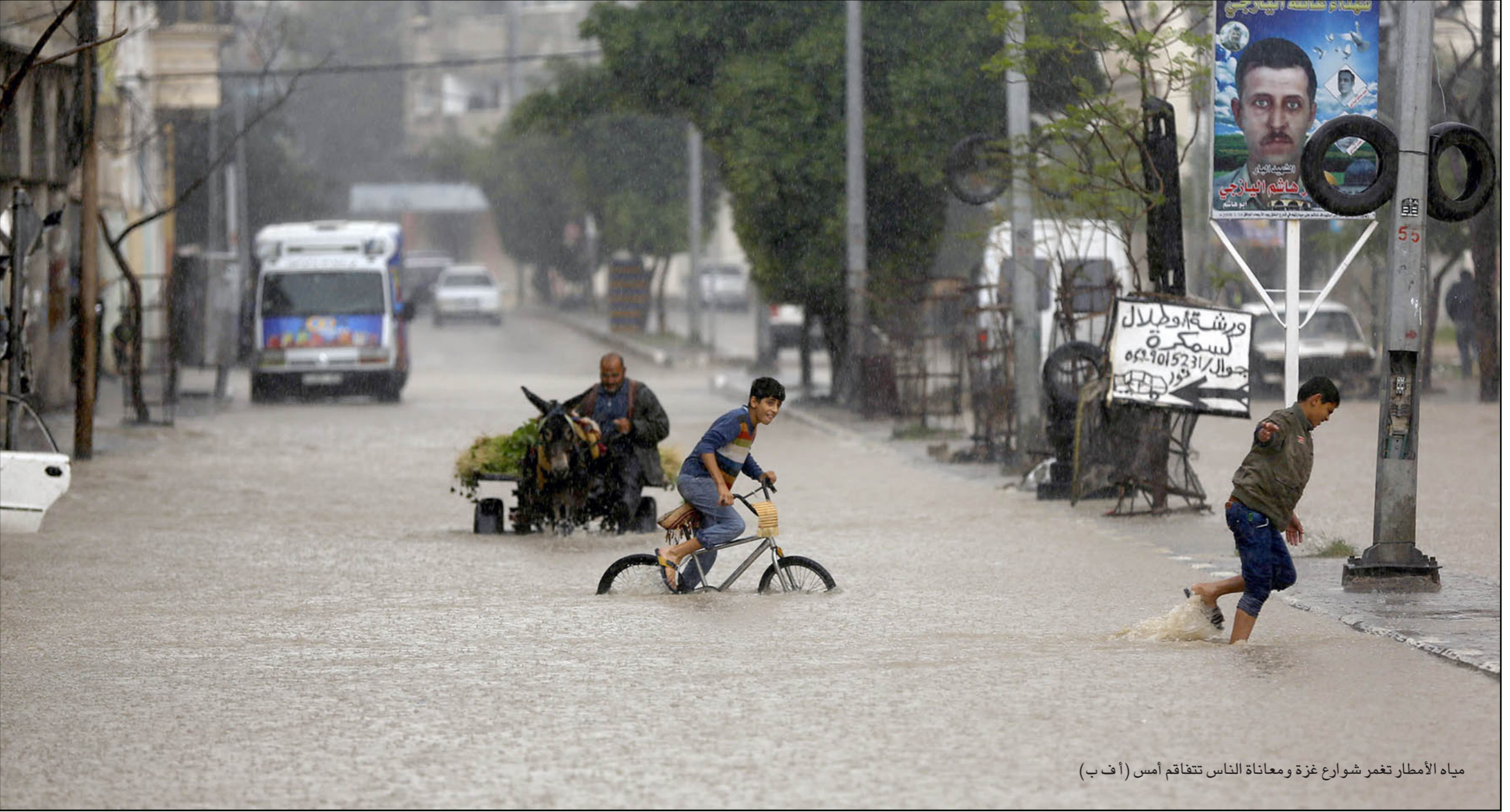
مياه الأمطار تغمر شوارع غزة ومعاناة الناس تتفاقم أمس