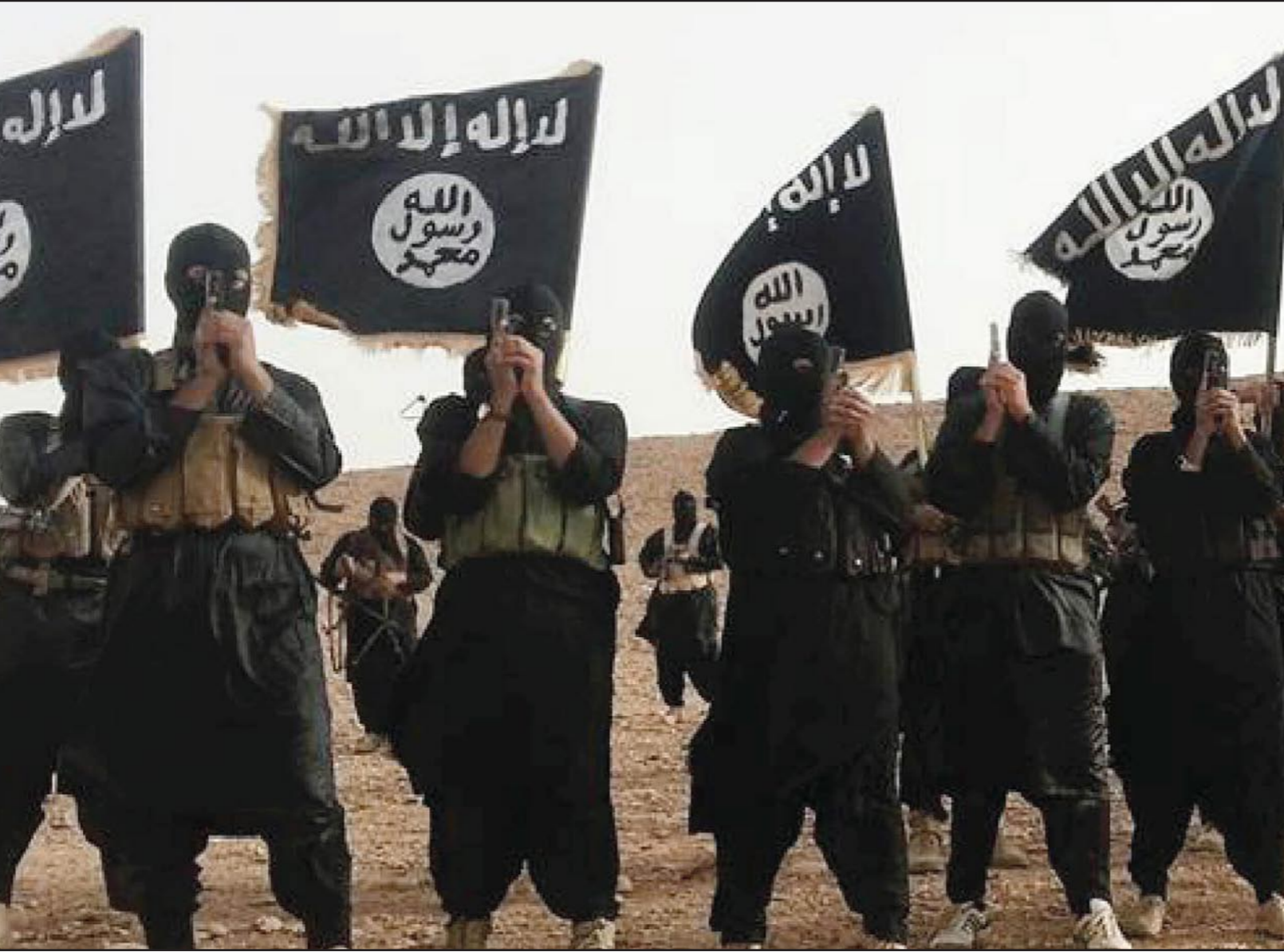
عرض عسكري لعدد من مقاتلي تنظيم الدولة الإسلامية داعش

أخطر التنظيمات الجهادية منذ ظهور تنظيم القاعدة. وأشارت الصحيفة لزيارة وزير الخارجية السوري وليد المعلم واجتماعه مع الرئيس الروسي فلاديمير بوتين في سوتشي يوم الأربعاء. وتعتقد الصحيفة أن مفتاح حل الأزمة السورية في موسكو، فبوتين الذي ظل يؤكد على أهمية الاستقرار في المنطقة تعامى عن واقع أصبح فيه الأسد عدو الاستقرار الأول في الشرق الأوسط. وعليه وفي حالة غير بوتين من موقفه ومارس ضغوطه وأكد على التزام الأسد بالمبادرة الدولية الجديدة التي تقدم بها معونات الأمم المتحدة يستيفان دي ميستورا إلى سوريا والتي اقترح فيها «تجميد» الحرب واعد اتفاقيات وقف إطلاق النار محلية تبدأ من مدينة حلب فيسفيخر مسار الأزمة. وترى الصحيفة أن تغيراً في موقف روسيا سيوجه ضربة قوية لتنظيم داعش. لكن المشكلة تظل في فهم «داعش» والقضاء على فكره، فهو كما يقول ديفيد كيلكن، المستشار السابق لوزير الخارجية الأمريكي في الجنرال المتقاعد ديفيد بترايوس «يجب أن تظهر لداعش كمشروع ببناء دولة»، وقال إن «هؤلاء الأشخاص يحاولون بناء دولة»، حسبما نقل عنه موقع «ديفيس وان». وأشار الموقع لآزمة واشنطن مع المعارضة وكيف أنها تخسر المعارضة هناك وفي هذا أضاف كيلكن: «سوريا مشكلة سياسية لا تملك إجابة عنها».