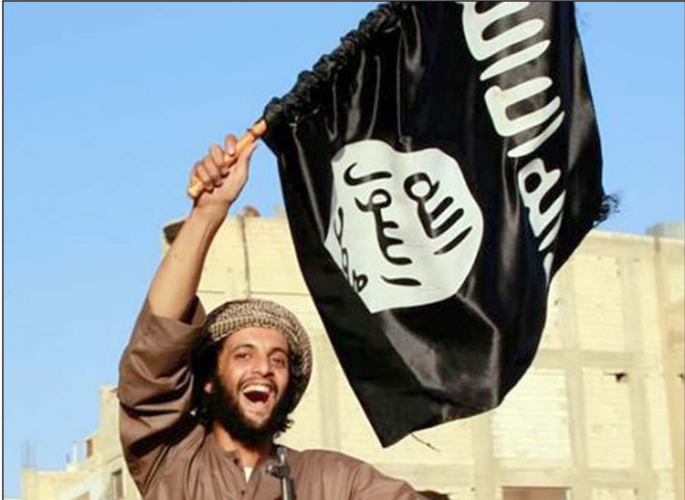
أحد مقاتلي «داعش» يرفع الراية السوداء

وقد اعتبر الإماراتي في اللقاء أن خطر الإرهاب الذي يواجهه العراق ودول المنطقة يتطلب تعاون الدول الشقيقة وتضافر كل الجهود