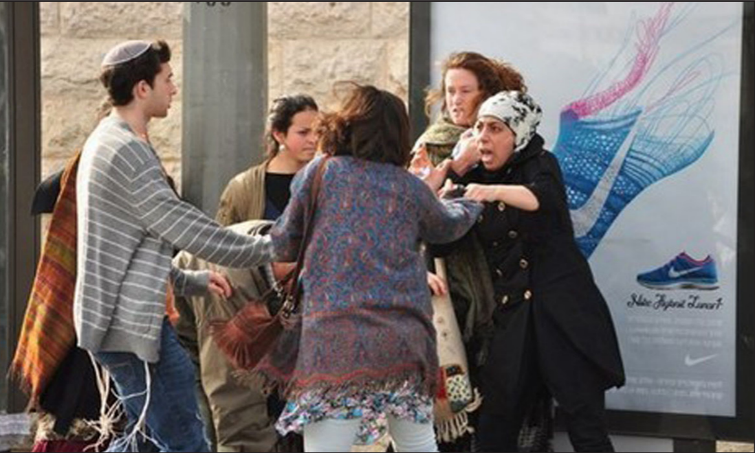
اسرائيليون يتحدثون على امرأة فلسطينية في القدس

العنصري، ومن يدعي أنه على عكس جنوب افريقيا فإنه لا توجد هنا قوانين عنصرية أو قومية. قانون القومية سيشكل طابع الدولة الواحدة ملما بريد، بروح التمييز العنصري، وسيضمن هذا القانون ما قاله الميمن القومي دائما وهو أنه في هذه البلاد يوجد مكان لشعبين، أحدهما سامي والآخر نسط. أحدهما له جميع الحقوق والآخر ليست له حقوق، ومن الآن سيكون ذلك في ظل القانون. كانت اسرائيل في السابق سيادية ومحتلة وقريبا ستكون الكولونيالية ايضا.