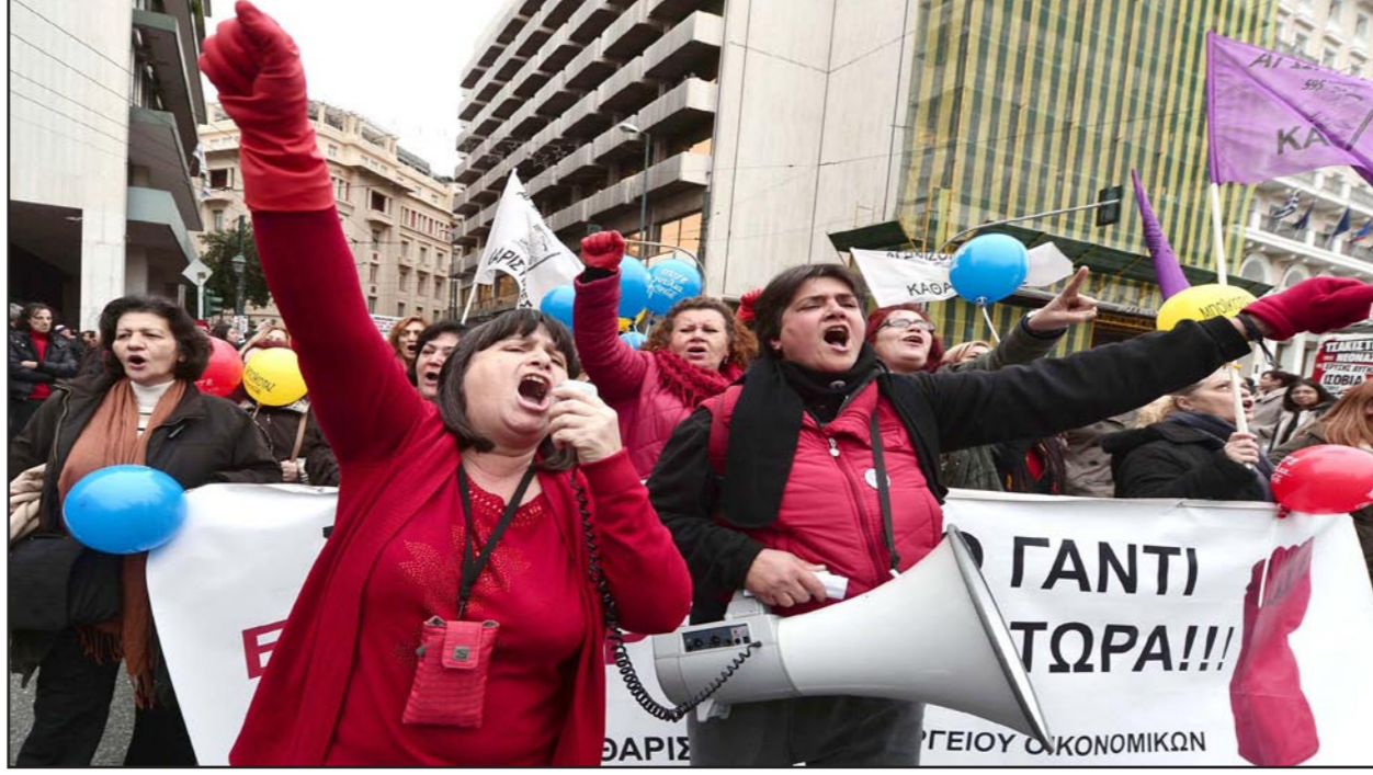
مظاهرات في اثينا ضد السياسات الاقتصادية للحكومة اليونانية

أثينا - دب: أكد نائب رئيس الحكومة اليونانية احتمال مد أجل المفاوضات بين بلاده والاطراف الثلاثة الدائنة لها، بشأن المساعي اليونانية لترشيد النفقات إلى العام المقبل. وأوضح أيفانجيلوس فينيزيولوس في تصريح للصحافيين أمس الخميس في أثينا أنه على الرغم من أن حكومتها تهدف إلى التوصل إلى اتفاق مع الجهات الدائنة لليونان بحلول نهاية العام الجاري «لأنه في حالة تعذر الاتفاق بشأن بعض الملفات، لأسباب فنية فمن الممكن مد أجل المفاوضات». يشار إلى أن توفيل اليونان إلى اتفاق مع ترويكا الدائنين (صندوق النقد الدولي والاتحاد الأوروبي والبنك المركزي الأوروبي) شرط لدخول أثينا في محادثات جديدة مع هذه الأطراف للحصول على ديون جديدة في مواجهة أزمة المالية. ويتهيئ برنامج الدعم المالي الحالي أواخر عام 2014.