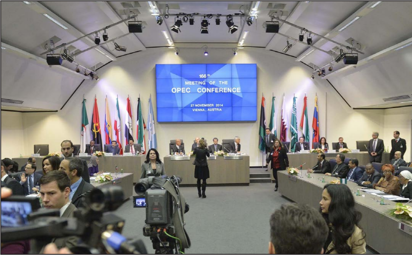
عبد الله البديري أمين عام «أوبك» يعقد مؤتمراً صحافياً بعد انتهاء اجتماع المنظمة

بقي أعضاء أوبك، وهي قادرة على مواجهة الضغوطات من أجل خفض إنتاجها، وأضافت أنه «على المدى الطويل، تريد السعودية أن يصب انخفاض الأسعار في مصلحتها» من خلال تخفيف الطلب. وخلصت الدراسة إلى القول أن «السعوديين سيكونون من جهة أخرى مسرورين أيضاً بأن يبرز منتجون غير أصدقاء لهم في الشرق الأوسط، لاسيما إيران، تحت الضغط».