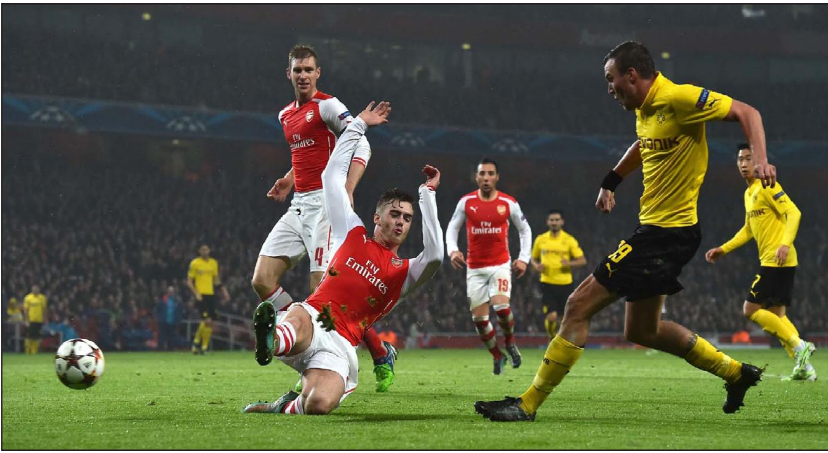
مباراة أرسنال ودورتموند الألماني انتهت بصعود الفريق الإنجليزي الى دور الـ16

يخضع النظر عن نتيجة المباراة الأخرى بين أولمبيكوس وضيعة مالمو. وأنتخب فريق زينيت سان بطرسبرج الروسي أماله في التأهل إلى الدور الثاني بعدما اقتنص فوزاً صعباً 1/1 صفر من ضيفه بنفيكا البرتغالي في المجموعة الثالثة.