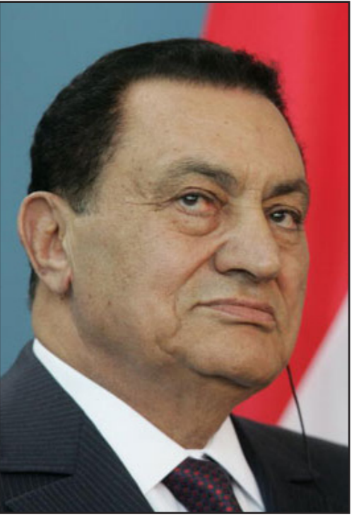
الرئيس الأسبق محمد حسني مبارك

القاهرة - «الأناضول»: تصدر محكمة جنايات القاهرة، صباح غد السبت، حكمها بحق الرئيس المصري الأسبق، محمد حسني مبارك، ونجليه علاء وجمال، ووزير داخلية، حبيب العادلي، و6 من كبار مساعديه، بعد محاكمة طويلة في 3 قضايا متعلقة بقتل متظاهرين إبان ثورة يناير/كانون الثاني 2011، والفساد المالي والرتيح.