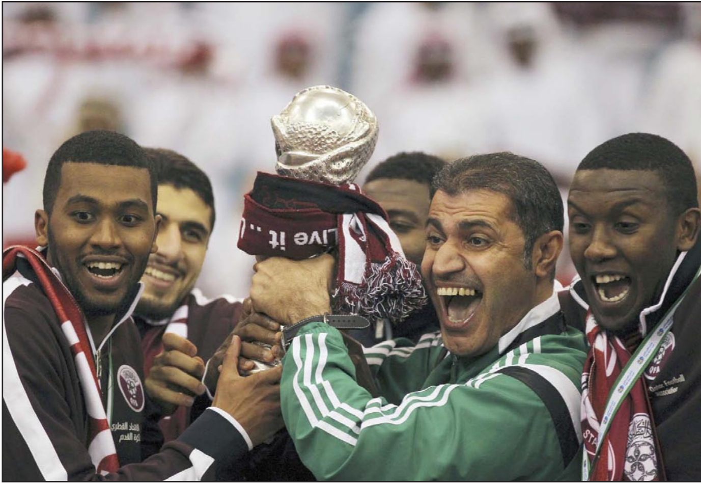
منتخب قطر استحوذ على كأس الخليج وسط فرحة عارمة

■ الرياض - وكالات: أحرزت قطر لقب كأس الخليج لكرة القدم للمرة الثالثة في تاريخها بعدما قدمت عرضاً قوياً لتفوز 2-1 على السعودية صاحبة الأرض في النهائي مساء أول أمس الأربعاء، فيما عمت الاحتفالات مدينة الدوحة والعديد من مدن الخليج الأخرى، كما وصلت إلى وسط العاصمة البريطانية لندن التي شهدت احتفالات هي الأخرى بغزو المنتخب القطري على منافسه السعودي. وكان التقدم من نصيب السعودية بضرية رأس من القائد سعود كوريري في الدقيقة 16 لكن المدافع المهدي علي أدرك التعادل للقطريين بعد دقيقتين فقط. وقبل مرور ربع ساعة من الشوط الثاني سجل خوخى بوعلام هدف الفوز لقطر أمام نحو 60 ألف متفرج في استاد الملك فهد الدولي بالرياض. وأمتلأت المدرجات تقريباً لأول مرة في مباراة لأصحاب الأرض بالبطولة لكن ذلك لم يكن كافياً ليمنح السعودية لقبها الخليجي الرابع. وقال الشيخ حمد بن خليفة بن أحمد آل ثاني رئيس الاتحاد القطري: «قدمنا مستوى جيداً واستحقاقنا البطولة خاصة أن البطولة في الرياض أمام المنتخب السعودي الكبير وحضر أكبر عدد من الجماهير له». وأضاف: «نتمنى أن يعطينا هذا الفوز الدافع والإصرار لتقديم أداء أفضل في كأس آسيا. أول ناس نبارك لهم الجماهير التي حضرت وأزرت اللاعبين في الملعب». وأشارت قطر كذلك لخسارتها على الملعب ذاته في مواجهة الحاسمة بخليجي 15 عام 2002 بعدما كانت في حاجة للتعادل مع السعودية للتتويج