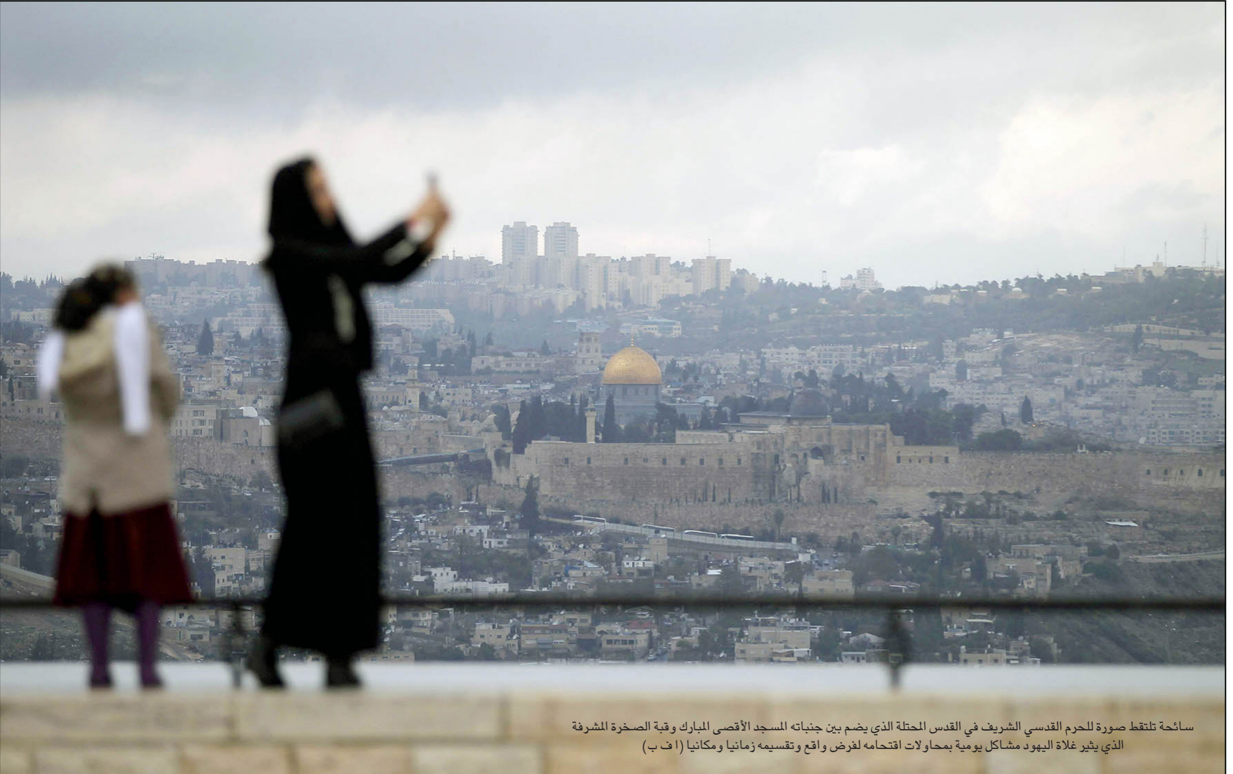
سائحة لتلقظ صورة للحرم القدسي الشريف في القدس المحتلة الذي يضم بين جنباته المسجد الأقصى المبارك وقبة الصخرة المشرفة الذي يثير غلاة اليهود مشاكل يومية بمحاولات اقتحامه لغرض واقع وتقسيمه زمانيا ومكانيا

وجوهية، إلا أنه لم يكتب لها النجاح. وذكر الموقع أن اسحق مولوخو مبعوث رئيس الوزراء الإسرائيلي الخاص، هو من تولى المفاوضات عن الجانب الإسرائيلي ومقرب من الرئيس الفلسطيني محمود عباس دون تسميتهم، حيث كانت المفاوضات سرية وجرت في عاصمة أوروبية، حيث كان هناك اجتماع شبه أسبوعي بين الجانبين برعاية ومعرفة أمريكية، فيما تولى مهمة الوساطة بين الطرفين ديفيد روس المبعوث الأمريكي الخاص لعملية السلام لسنوات ماضية.