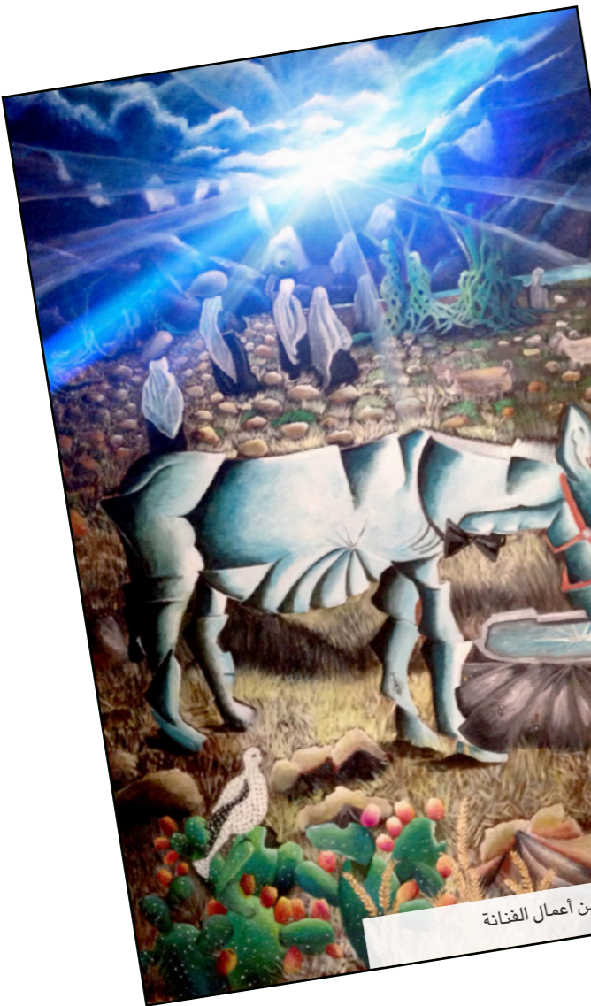
من أعمال الفنانة