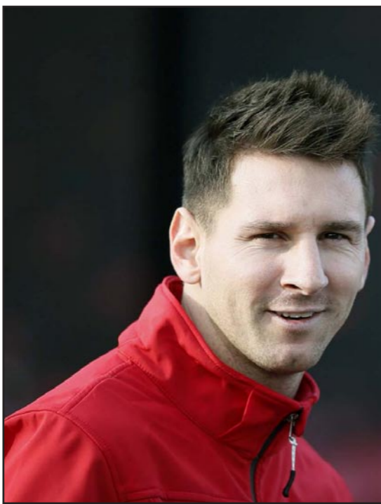
الأمل معقود على ميسي.. وجماهير برشلونة بالانتظار

وفي حقيقة الأمر، فإن برشلونة تالق بشكل ملفت في الأسبوع الأخير بفضل الأداء الرائع لنجمه الكبير الذي عرف كيف يزيد من سخونة الأجواء بالإضافة إلى التناغم الهجومي بين لاعبي الفريق ليونيل ميسي ولويس سواريز