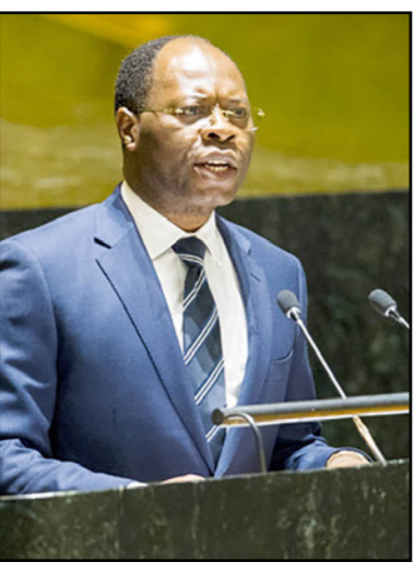
بودليل دونوغ إيلا

تونس...ب: أ. سيسيطر الغموض على منصب رئيس مجلس نواب الشعب المنتخب في تونس حتى أمس الخميس قبل أيام من انعقاد جلسته الافتتاحية. ولم يعلن حزب حركة نداء تونس الفائز بالأغلبية في الانتخابات التشريعية بـ 86 مقعدا من بين 217 مقعدا بالبرلمان، بشكل رسمي من موقع من منصب رئاسة المجلس. ويصاحبه 59 من الاستسور التونسيي -ينتخب مجلس نواب الشعب في أولى جلسته له رئيسا من بين أعضائه». لكن، عمليا يتوقع أن تسبق الجلسة مشاورات بين الأحزاب الرئيسية للتوافق حول الرئيس المقبل للمجلس قبل التصويت عليه. وقال الناطق الرسمي باسم نداء تونس لزمهر العكري إن الهيئة