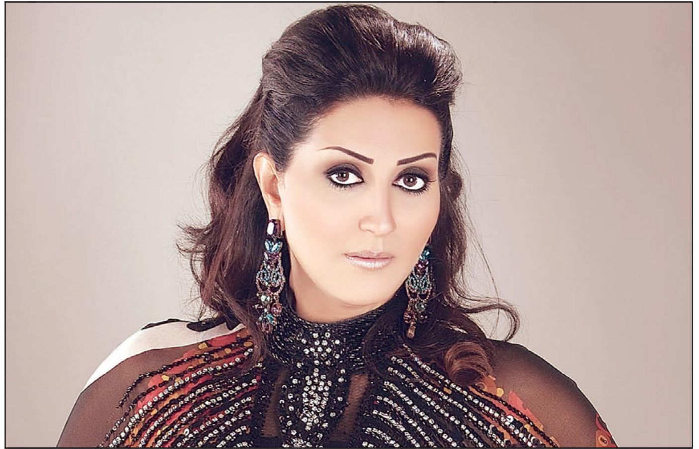
القاهرة - «القدس العربي»