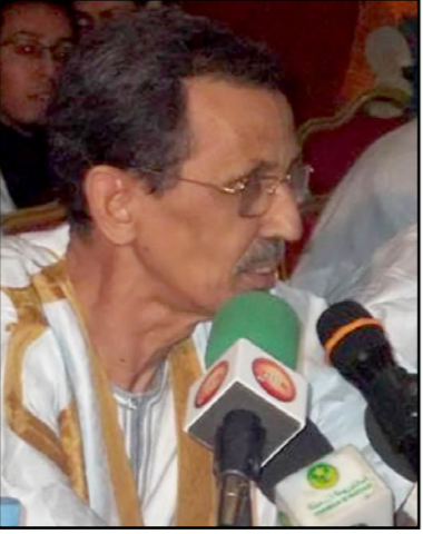
وزير الخارجية الأسبق محمد فال ولد بلال

بها الأرقاء السابوقون والتي تعرف بليل باسم «أدوابه» وتوفير الحضانات المدرسية فيها لتتولى إعاشة الأطفال وتحصل نفقات تعليمهم، إضافة إلى تقديم مساعدات مالية لآباء الأطفال مقابل السماح لأبنائهم بالالتحاق بمقاعد الدراسة، وأضاف ولد القاسم أنه «حين يتكلم هؤلاء الإمكانات الاقتصادية والقدرات المعرفية يكون بإمكانهم الاستفادة من الضمانات القانونية التي يوفرها التشريع لحمايةهم، ومن هنا كان حرص الخريطة على إعطاء الأولوية للبعدين الاقتصادي والتعليمي».