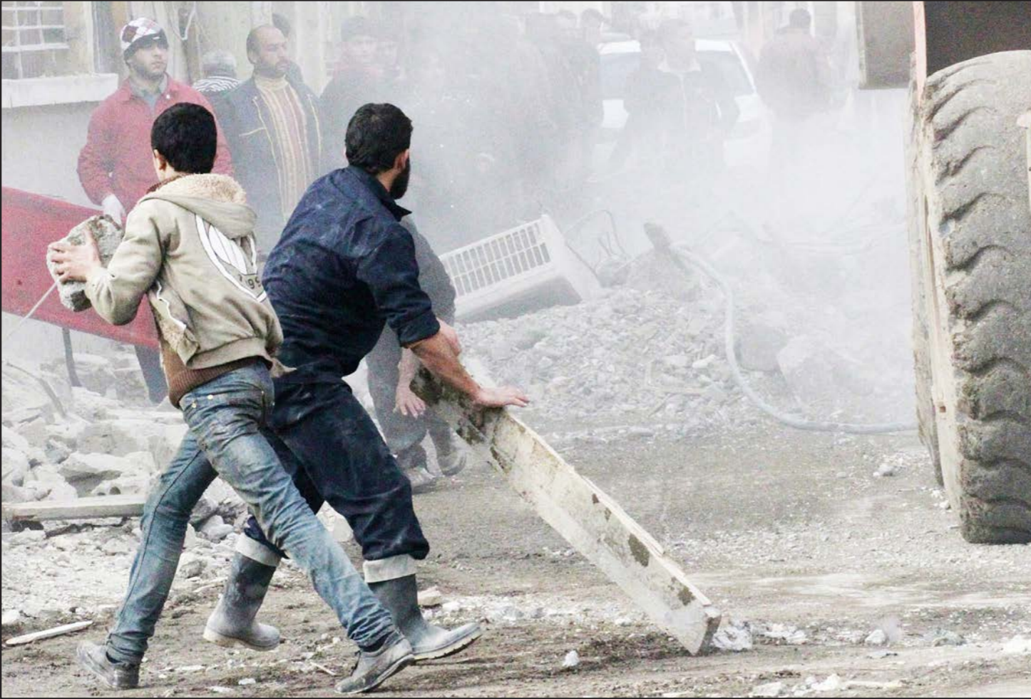
نشطاء سوريون يقومون بتفقد أماكن قصفها طيران النظام في مدينة الرقة

■ عواصم - وكالات: قال عضو الائتلاف الوطني لقوى الثورة والمعارضة السورية، قاسم الخطيب «لا أتوقع أن الروس جادون في العمل على إيجاد حل سياسي في سوريا، كونهم وقفوا مع النظام السوري طيلة أكثر من ثلاث سنوات من الأزمة، بوصفهم حليفاً استراتيجياً للنظام». واعتبر أن موسكو تلعب في الوقت الضائع، نظراً لانشغال الولايات المتحدة بقيادة التحالف الدولي والعربي في الحرب على «داعش».