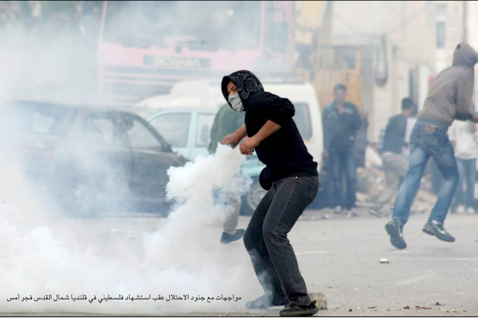
مواجهات مع جنود الاحتلال عقب استشهاد فلسطيني في قلنديا شمال القدس فجر أمس

«يديعوت أحرونوت» العبرية، أن وزير الداخلية الإسرائيلي غلعاد أردان، قدم طلباً إلى المستشار القضائي للحكومة، يهودا فاينشتاين، بالسماح له بسحب تورطهم في ما سماه «الإرهاب». وكان أردان قد قرر قبل شهر، سحب الإقامة الدائمة من المواطن الفلسطيني محمد نادي، الذي دين بنقل الغدائي الذي فجر نفسه على مدخل «الدوفيتاريوم» في تل أبيب في حزيران/ يونيو 2001، كما قرر أردان سحب الإقامة من نادية أبو جمل، زوجة منفذ عملية الدس في القدس، التي كانت قد حصلت على الإقامة في إطار شمل العائلة، وقال أردان أنه «يحتجم على كل من يتورط في الإرهاب المعرفة أنه سيكون لذلك تأثير على عائلته». وتسرى الصحيفة أن أردان يسعى هذه المرة إلى إلغاء مواطنة ثلاثة مواطنين فلسطينيين من فلسطين المحتلة عام 1948، هم محمد مفارطة وضراح محاجة وعرسان أسعد، ولأنه يمكن للمحكمة الإدارية في المحكمة المركزية فقط، إلغاء المواطنة، فقد توجه أردان إلى المستشار القضائي طالباً مصادقته على الطلب.