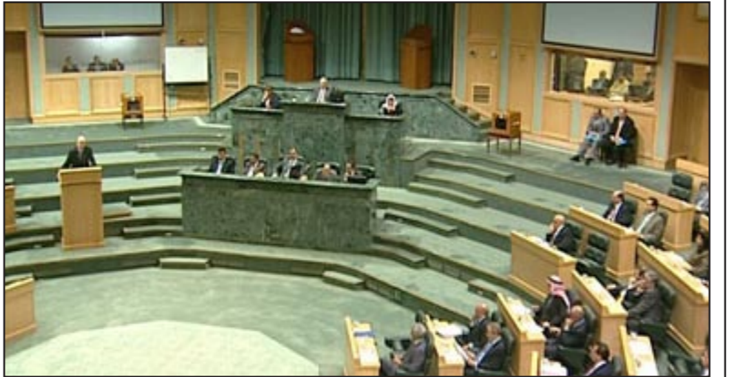
جانب من البرلمان الأردني

عمليا تسيطر كتل الائتلاف الضخم الجديد على اهم لجان البرلمان وعلى المناصب القيادية بما في ذلك الرئيس ونائب