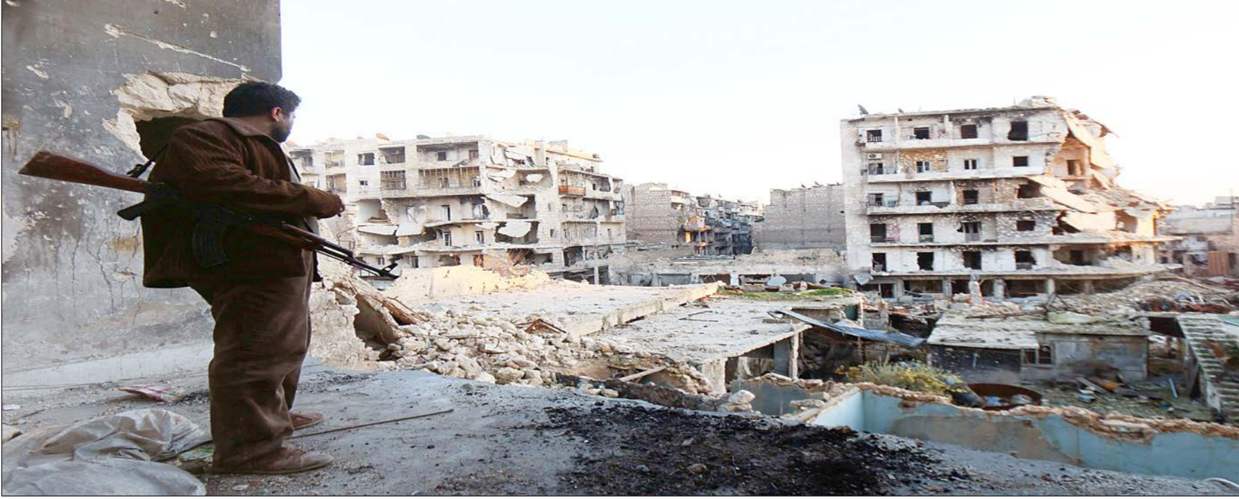
مقاتل من المعارضة السورية المسلحة ينظر إلى انقاض المنازل المدمرة في مدينة حلب

عواصم - وكالات - أفاد المرصد السوري لحقوق الإنسان أمس الثلاثاء بأن نحو مئتي قتيل سقطوا في المعارك التي انتهت بسيطرة مسلحين إسلاميين أمس على معسكري وادي الضيف والحامدية بمحافظة إدلب شمال غرب سورية.