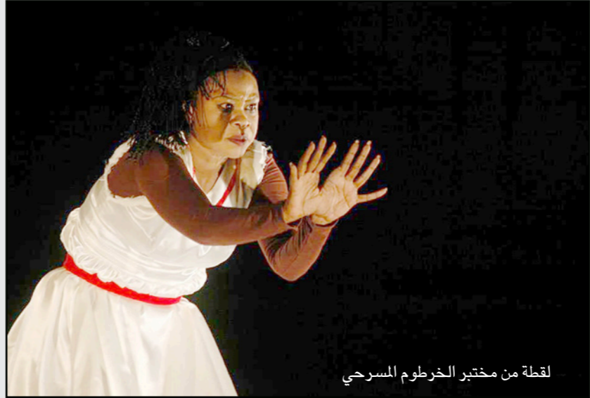
لقطة من مختبر الخرطوم المسرحي

مهيماً... ويرى أن أولى المسائل اللافتة للنظر في العرض هي الإدارة لفضاء التمثيل والتلقي. إن عمل المخرج على جمع الفضائين في مكان واحد، هو خشية المسرح، حيث اجلس الجمهور على يمين ويسار وأعلى خشبة المسرح وترك مقدمة المسرح ومنصفه فضاء للتمثيل. ويقول إن هذه الطريقة ضمنت للعرض، منذ الوهلة الأولى، حميمية بانئة ما بين طرفيه، الجمع في رطة وتنجه ومتلقيه، ثم دخلتاً جميعاً في مقاربة سؤال المسرح، وبالتالي قلت من حدية التورط السلبي للمشاهد تجاه ما يشاهد، بل على العكس جعلته يظن أن لم أقل متورطاً بسبب توريطه في فعل واضح أنه جزء منه.