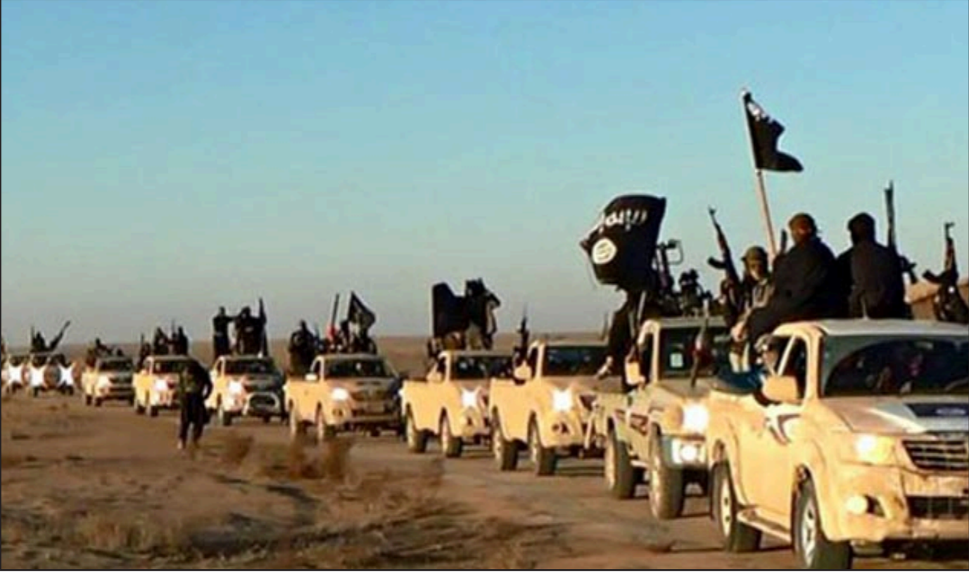
عدد من مسلحي داعش خلال استعدادهم لمعركة الكراكر قرب كوباني

من العالم أو ذاك هو علاقته بالمصالح القومية. ولهاذا السبب تقول المجلة إن الولايات المتحدة فعلت الكثير من أجل وقف تقدم داعش في سوريا والعراق أكثر مما فعلته الإدارة مثلاً لوقف الحرب الطائفية في جمهورية أفريقيا الوسطى. وتبدو أولويات السياسة الخارجية الأمريكية على شكل خريطة تعلم تلك التي تتعرض فيها المصالح الأمريكية للخطر باللون الأحمر، أي أولوية. ويرمز للأماكن التي تتعرض فيها المصالح الأمريكية لتهديدات متوسطة باللون البرتقالي، واستخدم اللون الأصفر للمناطق التي تعتبر فيها الأخطار متدنية. وبحسب المشرف على الدراسة المسحية بول ستيرنز فاللون يعبر عن مستوى الاهتمام والصادر للون أكثر من العام الماضي من إمكانية اندلاع انتفاضة ثالثة. كذلك مخاوف من إمكانية فشل المحادثات النووية مع إيران. ولم يبد المشاركون اهتماما بدول مثل الصومال أو جنوب السودان أو مالي، ولا يعني ذلك أن النزاعات في هذه البلدان قد انتهت بل انها لم تعد أولوية. وتوصل ستيرنز الذي يعمل أيضا مديرا لـ «مركز الفعل الاستباقي» والفريق العامل معه إلى هذه النتائج من خلال سؤال 2.200 مسؤول حكومي، أكاديمي وخبير.