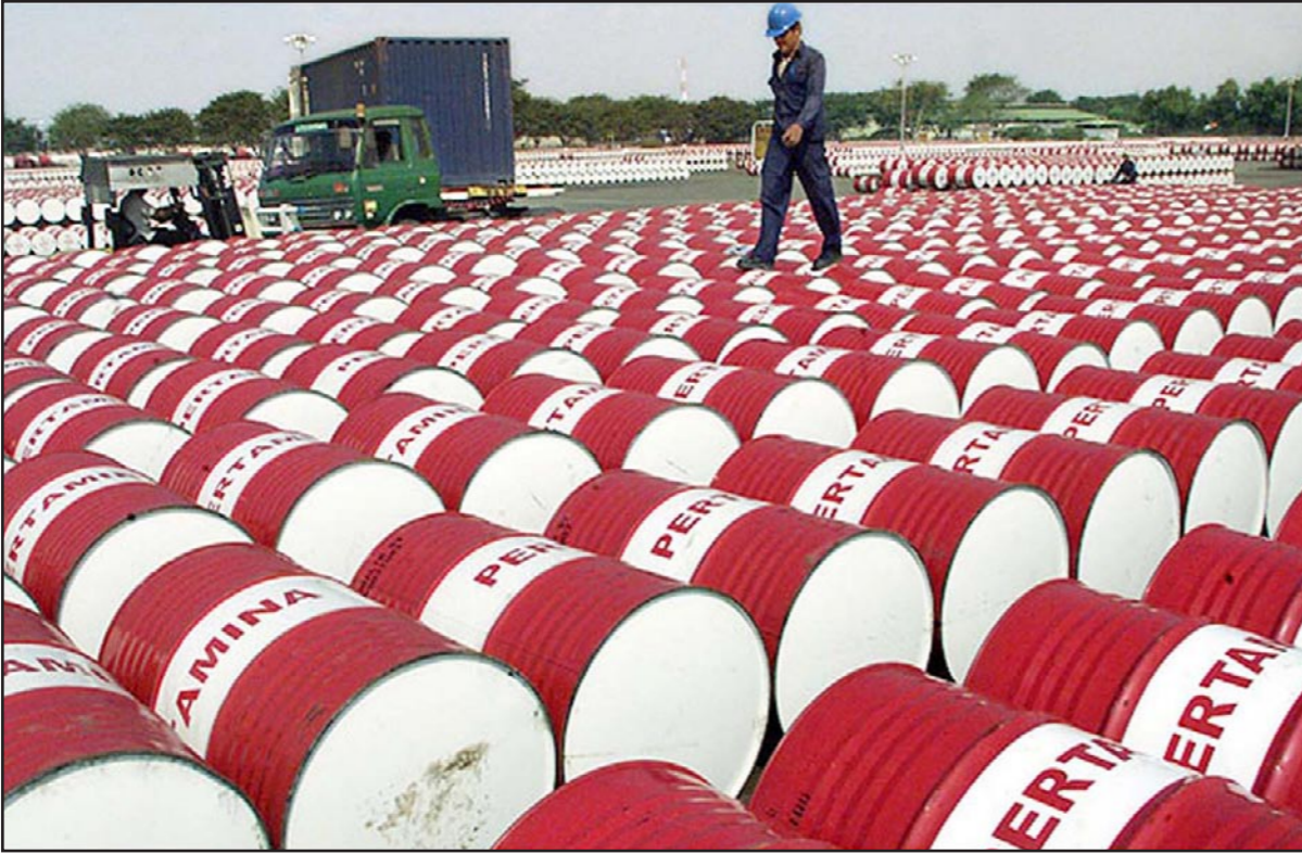
براميل نفط تنتظر التحميل خارج مصفاة في اندونيسيا

الرسمية بغية حماية حصصها في الأسواق. وفي مطلع كانون الأول/ديسمبر خضعت السعودية بشكل كبير الأسعار