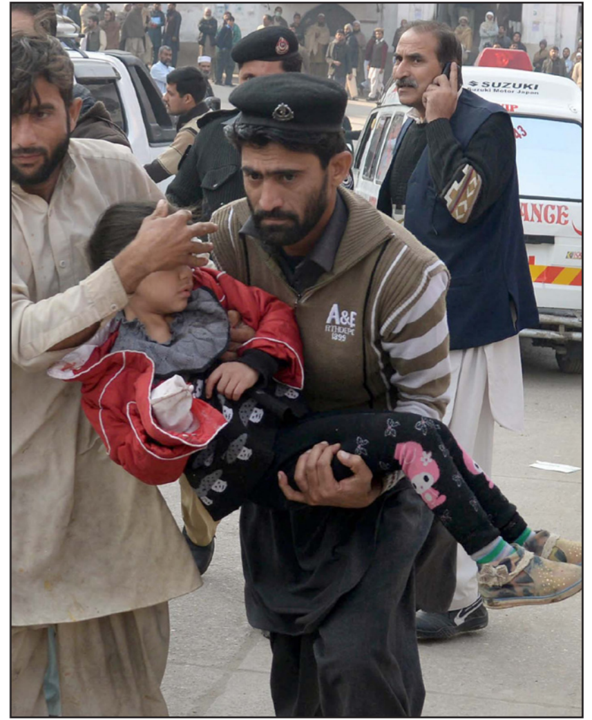
رجل اسعاف يحمل أحد الناجين من المذبحة

الهجوم، ووصف رئيس الوزراء الهندي ناريندرا مودي الهجوم في بيشاور وشمال غرب باكستان بأنه «عمل متهور لا يمكن وصف وحشيته». وعبر رئيس الوزراء البريطاني ديفيد كامرون عن «صدمته وذهوله لرؤية أطفال يقتلون مجرد أنهم ذهبوا إلى المدرسة». كما وصف الرئيس الفرنسي فرانسوا أولاند الهجوم بأنه «خسيس». وقال طلعت مسعود الجنرال المتقاعد في الجيش والمحلل الأمني أن الهجوم هدفه «أضعاف عزيمته الجيش». وأضاف «أنه تكتيكي واستراتيجي. ان المتطرفين يعملون أنهم غير قادرين على ضرب عصب الجيش وليس لديهم القدرة لان الجيش في كامل جهوزيته». وتابع «لذلك اختاروا هذا آخر بترك اثرًا نفسيًا كبيرًا». والمناطق القبلية الخاضعة لحكم شبه ذاتي كانت لسنوات تشكل ملاذًا للمتطرفين الإسلاميين من مختلف الجماعات بينها تنظيم القاعدة وحركة طالبان وكذلك مقاتلين اجانب من اوزبكستان ومن الاوغيور.