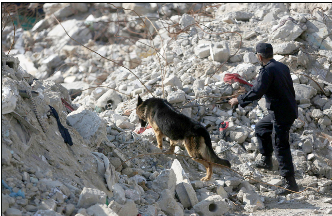
كلب بوليسي لكشف المخدرات في غزة أمس

ودعا المؤسسات الإغاثية كافة إلى المبادرة بكل جهودها لـ «حماية منظومة العمل الصحي وإنهاء أزمتها الملحة». وأوضح أن القطاع يعاني من غياب 30% من الأدوية المتخصصة الأساسية، و55% من المستلزمات الطبية، معززا من قرب انتهاء عقود الطبية والنظافة والأغذية و مواد الغسيل وخدمات صيانة المصاعد، والأقمشة وقطع الغيار والزيوت، خلال الأيام القادمة. وبسبب الأزمة وعدم تلقي وزارة الصحة الميزانيات اللازمة قال القدرة أن ذلك أدى إلى حرمان نحو 42 ألف