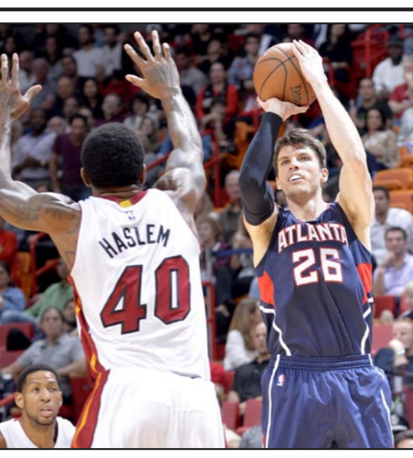
كوزمين سيترك الأهلي الإماراتي فقط خلال نهائيات كأس أمم آسيا

■ كوالالمبور - رويترز: يشعر الاتحاد الآسيوي لكرة القدم بالقلق على سلامة المشاركين في كأس آسيا التي تستضيفها استراليا الشهر المقبل بعدما قتل ثلاثة أشخاص في عملية تخريب رهائن في سيدني. وقال الاتحاد الآسيوي في بيان إنه طلب من اللجنة المنظمة للنهايات التي ستستطلق في التاسع من يناير/كانون الثاني في خمس مدن استراليا بينها سيدني تعزيز الإجراءات الأمنية حول البطولة. وانتهت الشرطة الأسترالية عملية الاحتجاز التي استمرت 16 ساعة باقتحام مقر في سيدني احتجز فيه شخص واحد عشرات الرهائن. وقتل ثلاثة أشخاص في العملية بينهم المهاجم الذي لم تكشف السلطات عن هويته. وقال الاتحاد الآسيوي: «مع الاتحاد عن قلقه البالغ بشأن سلامة وأمن الفرق والإعلام والشجعين أثناء كأس آسيا بعد الحادث وطلب اللجنة المنظمة المحلية بتعزيز الإجراءات الأمنية حول البطولة. سيسافر الآلاف من المشجعين إلى استراليا لحضور البطولة هذا غير 16 فريقاً وتعتبر أمنهم أولوية لنا». وقال رئيس الوزراء الأسترالي توني ابوت إن هناك ما يشير إلى وجود دوافع سياسية وراء احتجاج الرهائن في مقر لويت، وكان ابوت حذر من تخطيط متشددين لهجوم أهداف استرالية، وأضاف بيان الاتحاد الآسيوي: «لقد طالبا اللجنة المنظمة بتوفير المزيد من الأمن في الفنادق المخصصة للفرق ولوفود الاتحاد الآسيوي لكرة القدم». وهذه أول مرة تستضيف فيها استراليا النهائيات الآسيوية وهي التي انطلقت لكرة القدم الآسيوية في 2006.