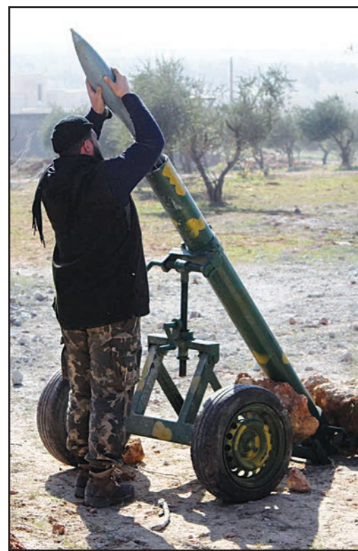
مقاتل سوري يعد صاروخا لإطلاقه ضد قوات النظام

عمان - القدس العربي: حصل الأردن سياسيا ودبلوماسيا على «ضوء أخضر» من الإدارة الأمريكية يسمح باختبار سيناريو جديد للتعامل مع تداعيات الملف السوري تحديدا على أساس خطة انتقالية للسلطة في دمشق تجمع الأصوات المؤثرة دوليا وإقليميا لدعمها القيادة الروسية تحديدا. الأردن، وعلى هامش زيارة الملك عبدالله الثاني الأخيرة لواشنطن، تمكن حسب مصدر مطلع تحدث لـ «القدس العربي» من «إقناع» الإدارة الأمريكية مؤخرا بالعمل على «تقريب وجهات النظر» بين الأمريكيين وروسيا في ما يتعلق بالملف السوري تخلصا من الأزمة الدولية الحالية، وكانت وزارة الخارجية الروسية قد بحثت هذا الخيار مرات عدة مؤخرا مع أطراف عربية وأخرى في المعارضة السورية فيما تؤثر الاتصالات الأردنية المكثفة خلال الأسبوع الماضي على أن الاقتراح الخاص بخطة انتقالية لتسهيل سيناريو إسقاط نظام بشار الأسد «ينمو» بنضج وبخطوات ملموسة حتى على مستوى المجموعة العربية، وقد استضافت عمان لقاءات معمقة في هذا السياق طوال الأيام السبعة الأخيرة فيما تساندت دولة الإمارات هذا الاتجاه بدعم أيضا من القيادة المصرية، حيث زار عمان الرئيس عبدالفتاح السيسي ثم نفذ المعاهل الأردني زيارة مياغمة مساء الاثنين للمملكة العربية السعودية التي سالت متحفظة على فكرة التعامل مع بشار الأسد من أساسها. وجهة نظر الأردن في الكواليس كانت تتحدث عن ضرورة الحفاظ على النظام السوري نفسه وأجهزة الدولة مع مرحلة انتقالية تنتهي بمغادرة الرئيس بشار الأسد شخصيا وحتى عائلته على أساس عدم التورط مجددا بسيناريو «حل حزب البعث» في نسخته العراقية.