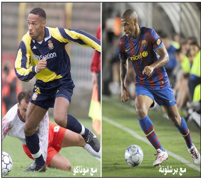
أسطورة الكرة الفرنسية تألق خلال مسيرته مع أرسنال الإنجليزي

■ لندن - «القدس العربي» - د ب أ: أعلن نجم المنتخب الفرنسي لكرة القدم السابق والفايز بلقب كأس العالم تييري هنري اعتزاله اللعب بعد مشوار حافل استمر نحو 20 عاماً، وبدا العمل في مجال الإعلام. وكتب هنري (37 عاماً) في صفحته على موقع «فيسبوك» للتواصل الاجتماعي: «بعد قضاء عشرين عاماً في اللعبة، قررت اعتزال كرة القدم الاحترافية». وشارك هنري في 123 مباراة مع منتخب فرنسا وسجل 51 هدفاً وساعد بلاده على الفوز بكأس العالم 1998 وببطولة أمم أوروبا 2000 كما فاز بألقاب مهمة مع فريقه أرسنال وبرشلونة، وقال هنري في بيان: «مخت رحلة مثله وأود التقدم بالشكر لكل المشجعين والزلاء والأشخاص الذين قابلتهم في موناكو وليفربول وأرسنال وبرشلونة ونيويورك رد بولز وبالطبع في المنتخب الوطني الفرنسي لأنهم جميعاً ساعدوني على قضاء أوقات رائعة في اللعبة». وأضاف: «حان الوقت لشوار مختلف في حياتي». وترك هنري رد بولز في وقت سابق من الشهر الجاري بعد انتهاء عقده الممتد أربع سنوات وقال إنه في حاجة إلى وقت لتحديد وجهته المقبلة. وأعلن هنري أنه سيعمل محلاً تلفزيونياً في قناة «سكاي سبورتس» في بريطانيا بداية من العام المقبل. وصنع هنري شهرته في إنجلترا وأصبح من أبرز مهاجمي أوروبا بعدما غير أرسنال فينر مدرب أرسنال مركزه من لاعب جناح إلى مهاجم بعد انضمامه للفريق قادماً من ليفربول. وسجل هنري 228 هدفاً مع أرسنال في فترتين وقاد بلقب الدوري الإنجليزي مرتين قبل أن ينتقل إلى برشلونة وينجح بالدوري الإسباني ودوري أبطال أوروبا في 2009.