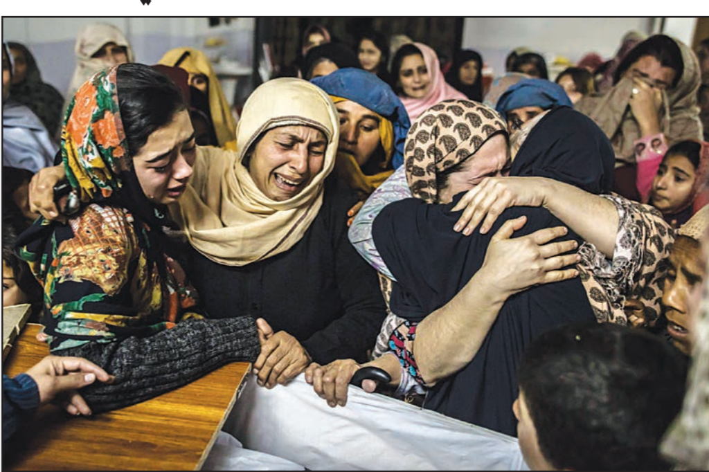
باكستانيات يبكين أطفالهن ضحايا التفجير أمس

مسؤوليتها عن الهجوم، قائلة إنه جاء انتقاما لهجوم عسكري ضد المسلحين في المنطقة القبلية الواقعة شمال غربي البلاد، ودان رئيس الوزراء الهندي نارندرا مودي «الهجوم الإرهابي الجبان»، ودان الرئيس الأمريكي باراك أوباما بأشد الحوثين، أدت إلى سقوط عشرات القتلى الجرحى، أغلبهم طالبات في مدرسة ابتدائية. وكان الموقع الإخباري التابع لوزارة الدفاع اليمينية نسب إلى مصدر أممي في مدينة رداق بمحافظة البيضاء قوله «إن العناصر الإرهابية التابعة لتنظيم القاعدة نفذت اليوم -أسس- هجوما إرهابيا غادرا وجباناً استهدف حافلة للطالبات وأسفر عن مقتل 15 طالبة و10 مواطنين وإصابة آخرين في رداق بمحافظة البيضاء». وقال رئيس الكتلة البرلمانية لحزب المؤتمر الشعبي العام في اليمن عبدالله صالح من تعطيل مسبق للثقة الحكومية خلال جناح أسس، على خلفية الخلافات الحزبية المتصاعدة بين الرئيس عبدربه منصور هادي وسلفه على صالح ومحاوله كل منهما السيطرة على الحزب عبر استخدام نفوذه السياسي. وقال رئيس الكتلة البرلمانية لحزب المؤتمر الشعبي العام في اليمن عبدالله صالح من تعطيل مسبق للثقة الحكومية خلال جناح أسس، على خلفية الخلافات الحزبية المتصاعدة بين الرئيس عبدربه منصور هادي وسلفه على صالح ومحاوله كل منهما السيطرة على الحزب عبر استخدام نفوذه السياسي. وعلمت «القدس العربي» من مصدر محلي في رداق إن انفجارين متزامنين بواسطة «سيارتين مفخختين انفجرت