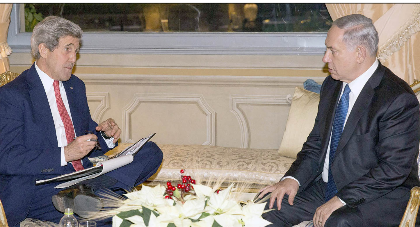
كيري ونتانياهو خلال لقائهما أول من أمس في روما

ويعتبر ليرسمان عن قلق إسرائيل من الدبلوماسية الفلسطينية باستنكاره أن مشروع القرار في مجلس الأمن ليس الإجراء الفلسطيني الوحيد المناهض لإسرائيل مشيرا إلى استعداد البرلمان الأوروبي للتصويت اليوم الأربعاء