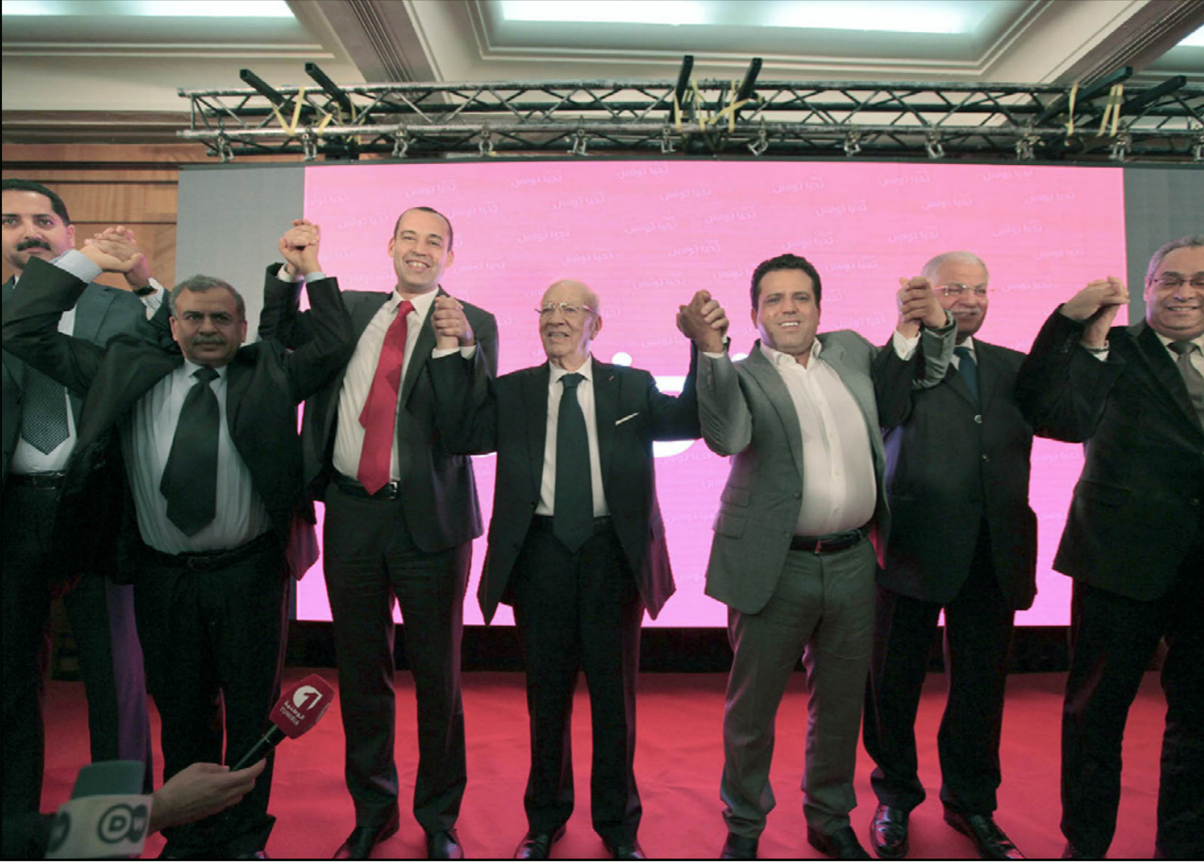
الباجي قايد السبسي ومجموعة من قادة الأحزاب التونسية الأخرى أثناء إحدى حملاته الانتخابية في العاصمة (أ ف ب)

ونقلت عن مصادر أمنية أن أحد مواطني مدينة «بن قردان» الحدودية انتبه لوجود أحد قيادات «فجر ليبيا» فرع الغربية» ويدعى رمضان لسود، فقام بإبلاغ قوات الأمن التي اعتقلته حيث اعترف بالتسلسل خلفه عبر مبرر رأس جدير. وأشارت الصحيفة إلى أن الموقف تمكن من الاتصال بقوة السرح داخل المعبر والتي احتجزت عشرات التونسيين مطالبة باطلاق سراح لسود مقابل الإفراج عن المحتجزين، وهو ما تم لاحقا. ولم تؤكد وزارة الداخلية هذا الخبر، فيما دعا الوزير لطفي بن جدو التونسيين إلى الإقبال بكثافة على المشاركة في الانتخابات الرئاسية، مشيرًا إلى أن الوزارة جندت 60 ألف عنصر أمن لتأمين العملية الانتخابية برمتها بالتنسيق مع قوات الجيش التونسي. وأقر الوزير بوجود تحركات مريبة لعناصر إرهابية في الجبال المحاذية للحدود مع الجزائر، محذرا من وجود بعض التهديدات في الولايات الحدودية كالقصرين وجندوبة والكاف، وأشار بالمقابل إلى وجود شريط عسكري عازل على الحدود التونسية - الليبية، مؤكدا أن القتال داخل الأراضي الليبية لا يمثل تهديدا بالنسبة لبلادنا. وتستعد تونس لتنظيم الدورة الثانية من الانتخابات الرئاسية في الحادي والعشرين من الشهر الجاري، ويتنافس فيها الباجي قائد السبسي ونصيف المرزوقي، وتعد هذه الانتخابات محطة هامة لتشكيل مؤسسات دائمة في البلاد وطي صفحة المسار الانتقالي التي استمرت لأربع سنوات.