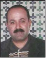
كاتب وصحافي من تونس

يقترض اننا ندير دولة بمؤسساتها ونواميسها وليس مزرعة عائلية، ولكن منطلق المزرعة العائلية العائد اليها من الماضي الكريه يروق لكثير من الناس على ما يبدو . لم تضمن الدولة ميذا بسياساتها بغض النظر عن الأشخاص، فقبل نرتاح بعد ذلك للوعود الواسعة من أنها سوف تضمن الحريات وتحرص على حمايتها من أي انتهاك؟ بوجود الدستور لا بد من بقعة المجتمع المدني، يبرد الجميع بمن فيهم المتربصون بتلك الحريات، لأن ذلك المجتمع ما يزال هشاً وضعيفاً رغم ما يقال في الخارج من أنه نقطة قوة في مسار تونس، فباستثناء النقابات التي يسيطر عليها متشددون من اليسار، لا سلطة تبدو قادرة على الوقوف بوجه العودة للاستبداد، بما فيها الإعلام الذي لم يستطع خلال السنوات الأخيرة أن ينتج إعلاميين أحراراً من قيود المال والسياسة. المعركة الانتخابية والسياسية قد تحسم لصالح الثنائي الذي اختاره أصحاب المزرعة العائلية ليكون كبيرهم، لكن معركة الدفاع عن حرية الناس الذين يزورون ليحصد غيرهم وينهبهم مثل أسلافه داخل المزرعة نفسها ما تزال مفتوحة وإلى ابد بعيد، وقد لا تجدي تطمينات الجولات وغيرهم من الخفيف من وطأتها أو قطع الطريق أمامها، فهي ستكون بالتأكيد أطول عمراً حتى من حياة الثنائيين للعمر الذي قد تتسعغه الظروف ويدخل الأحد المقبل قصر قرطاج ظافراً.