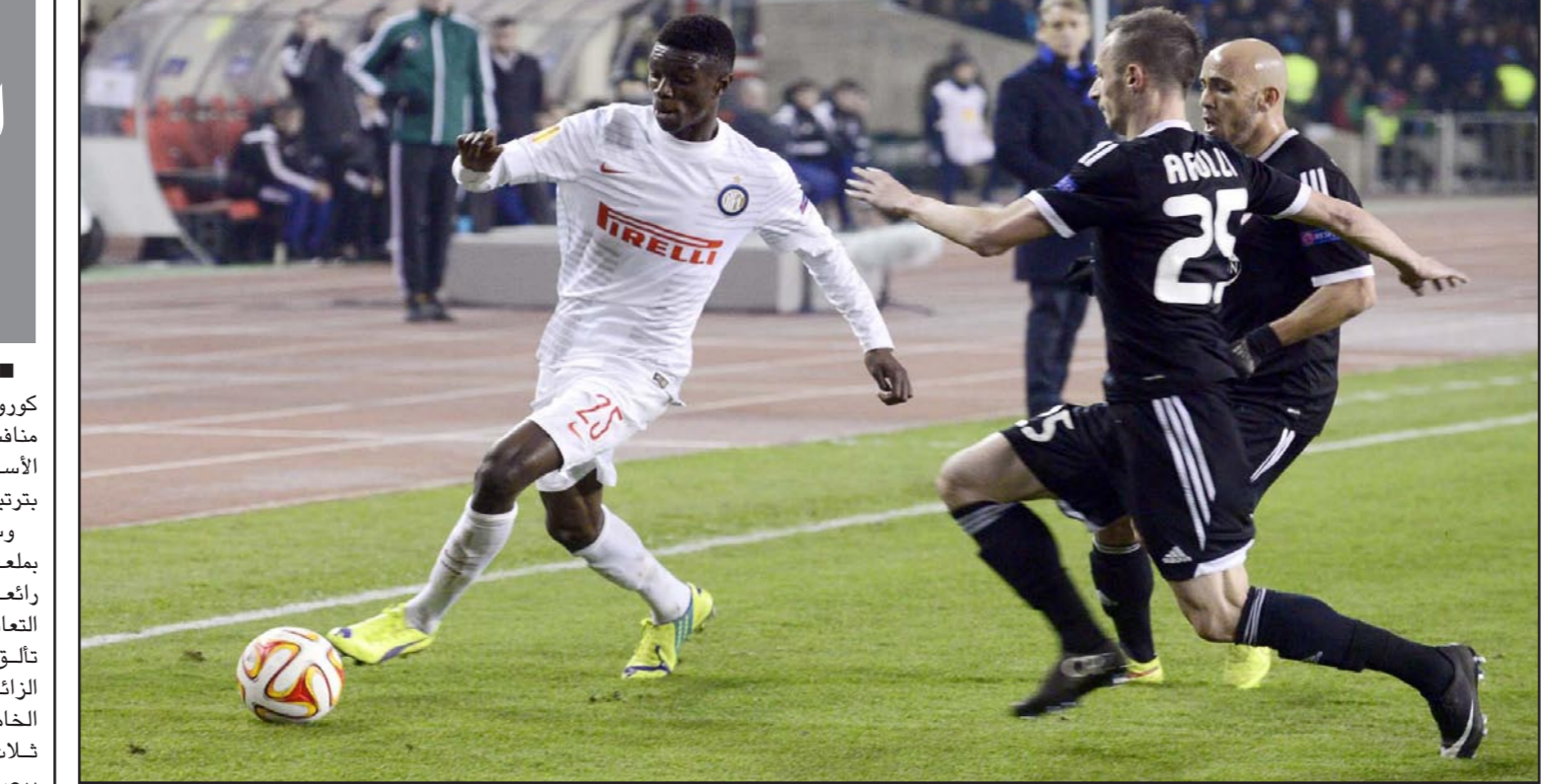
جناح الانتر ميبايي يحاول تخطي مدافعي كيبفو

■ مدريد - د ب أ: تغلب ديبورتيفو لا كورونيا على صيفيه التشي 1/صفر في ختام منافسات الأسبوع الـ15 من مسابقة الدوري الإسباني، ليتراجع التشي إلى المركز الأخير بترتيب البطولة. وسجل لويس فارينا هدف المباراة الوحيد بملعب «ريازور» في الدقيقة 21 من تسديدة رائعة بعيدة المدى. وحاول التشي بعدها إدراك التعادل ولكن حراس مرعى ديبورتيفو فابريسيو تاللق ليصدى لخمس هجمات خطيرة من الفريق الزائر. وبهذا الفوز تقدم ديبورتيفو إلى المركز الخامس من اللقاع برصيد 13 نقطة متقدماً بفارق ثلاث نقاط أمام التشي صاحب المركز الأخير برصيد عشر نقاط، ما يهدد مستقبل المدرب فران إسكريبيا مع الفريق.