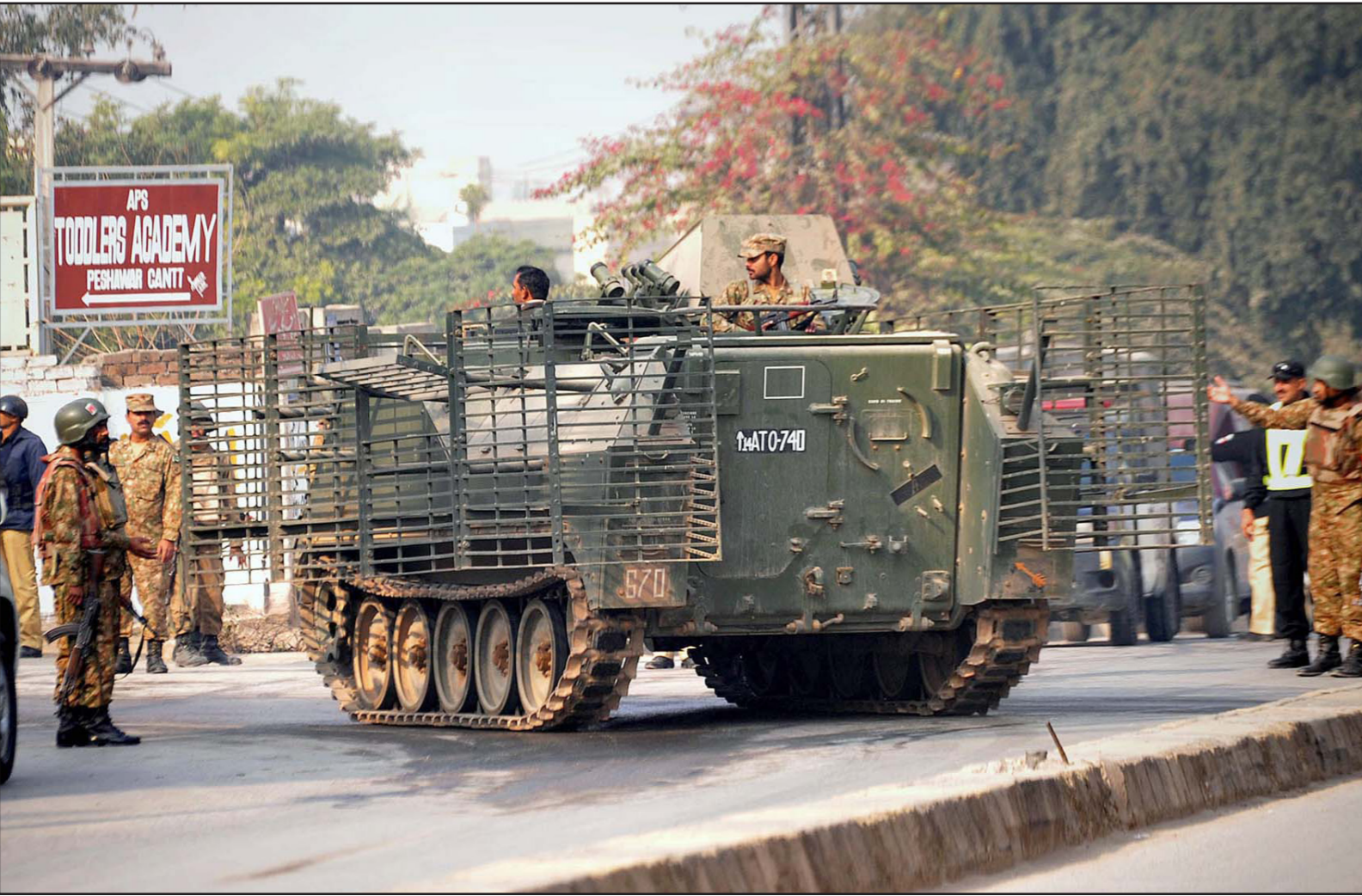
قوات من الجيش الباكستاني قبالة المدرسة التي استهدفت بهجوم طالبان أمس في بيشاور