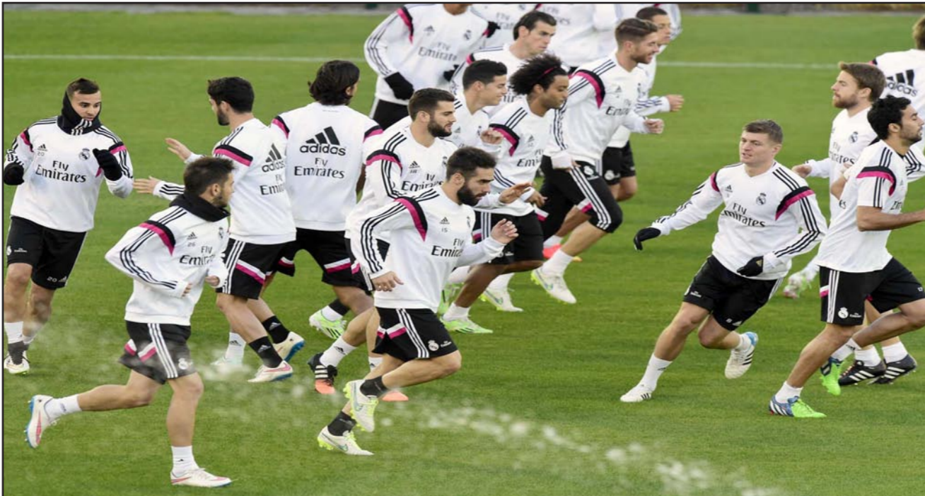
نجوم ريال مدريد في الحصص التدريبية الأخيرة التي أقيمت في وقت متأخر أمس