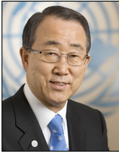
بان كي مون

إلى ذلك قال نائب عريقات، رئيس دائرة المفاوضات في منظمة التحرير الفلسطينية، «في حالة انتظار، وإنما في وضع يتحتم فيه العمل، ولكن إذا قامت في إسرائيل قيادة مستعدة للمفاوضات على أسس واضحة، وفي جوهرها حدود 1967 وإنهاء الاحتلال من خلال جدول زمني محدد، فنحن سنكون دائما على استعداد لذلك». وبدأ عريقات واضحا في رسم الصورة الحقيقية على الأرض خلال حديثه لراديو القدس في فلسطين المحتلة عام 1948، حين قال «الصورة الآن هي أن المستوطنات تواصل النمو والبناء على أراضي الدولة الفلسطينية، وذلك يتحتم على المجتمع الدولي العمل إذا أراد إنقاذ