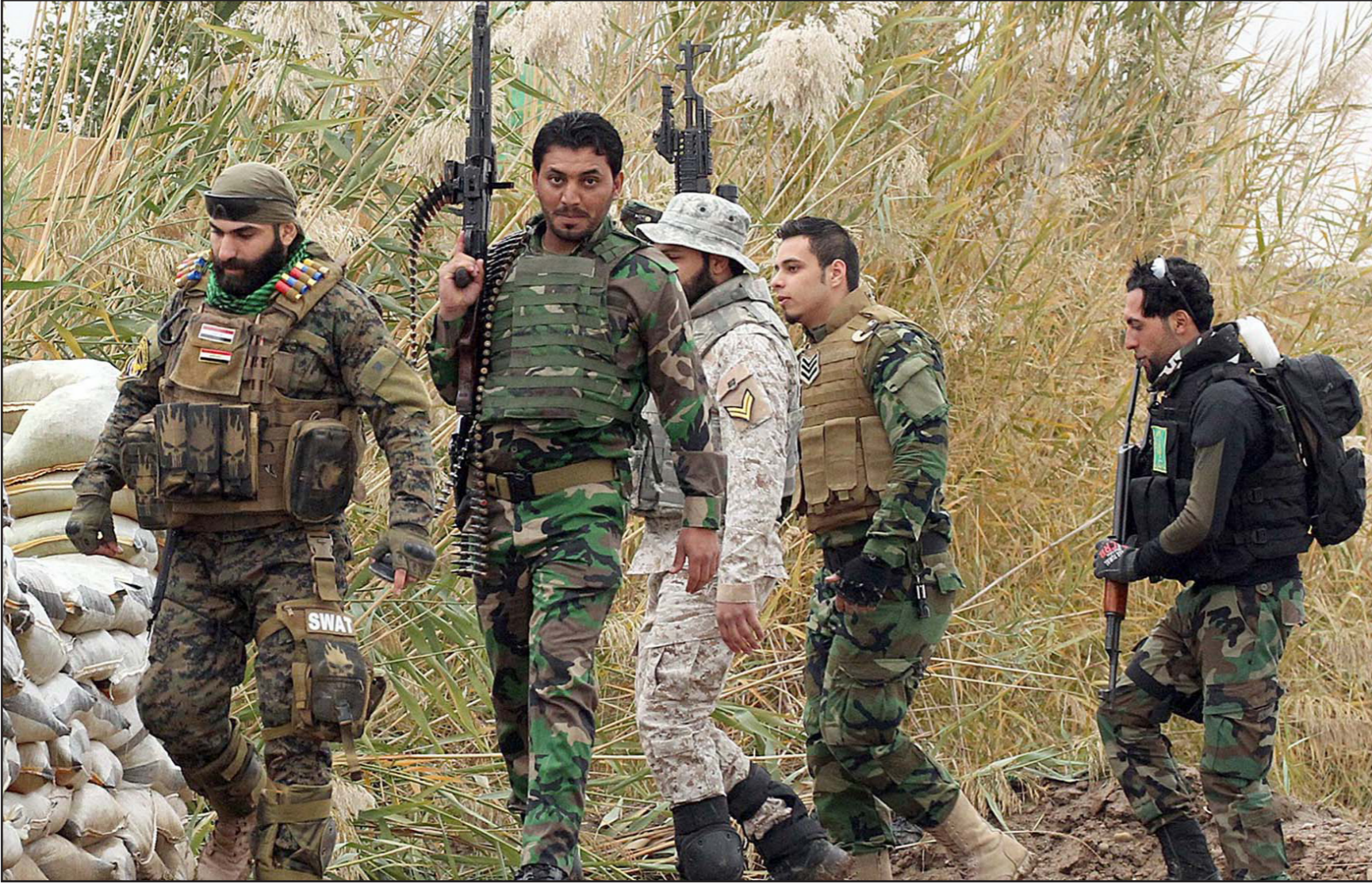
عناصر من الجيش العراقي قرب تكريت أمس

منطقة الكفاح وسط العاصمة، كما قتل شخص وأصيب سبعة آخرون بجروح مختلفة في انفجار عبوة ممانلة في مدينة الصدر شرق بغداد. وتشهد مدن العراق انهياراً أمنياً نتيجة تواصل المعارك بين القوات الحكومية وتنظيم «داعش» إضافة إلى عمليات الخطف والاعتقالات التي تقوم بها المنظمات المسلحة المتنوعة.