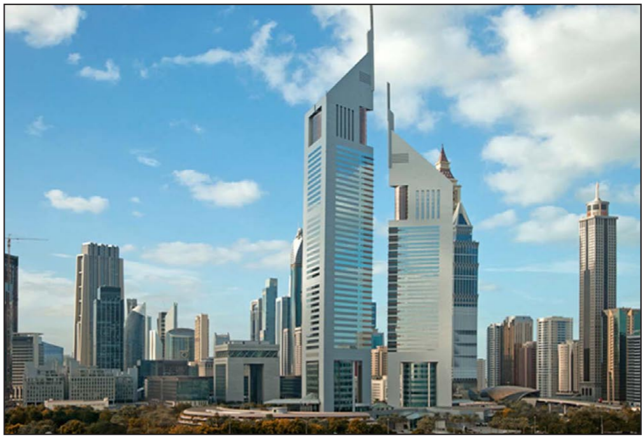
مشروعات عقارية مكتملة في دبي

■ دبي - رويترز: قالت شركة «سي.بي.آر.» إي» للاستشارات العقارية أمس الثلاثاء إن الزيادات في أسعار العقارات في دبي تباطأت في النصف الثاني من عام 2014، ولكن الأسعار ستستقر العام المقبل مع طرح معروض وفير من الوحدات الجديدة.