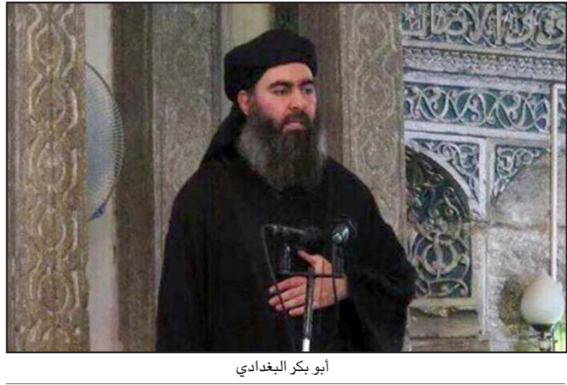
أبو بكر البغدادي