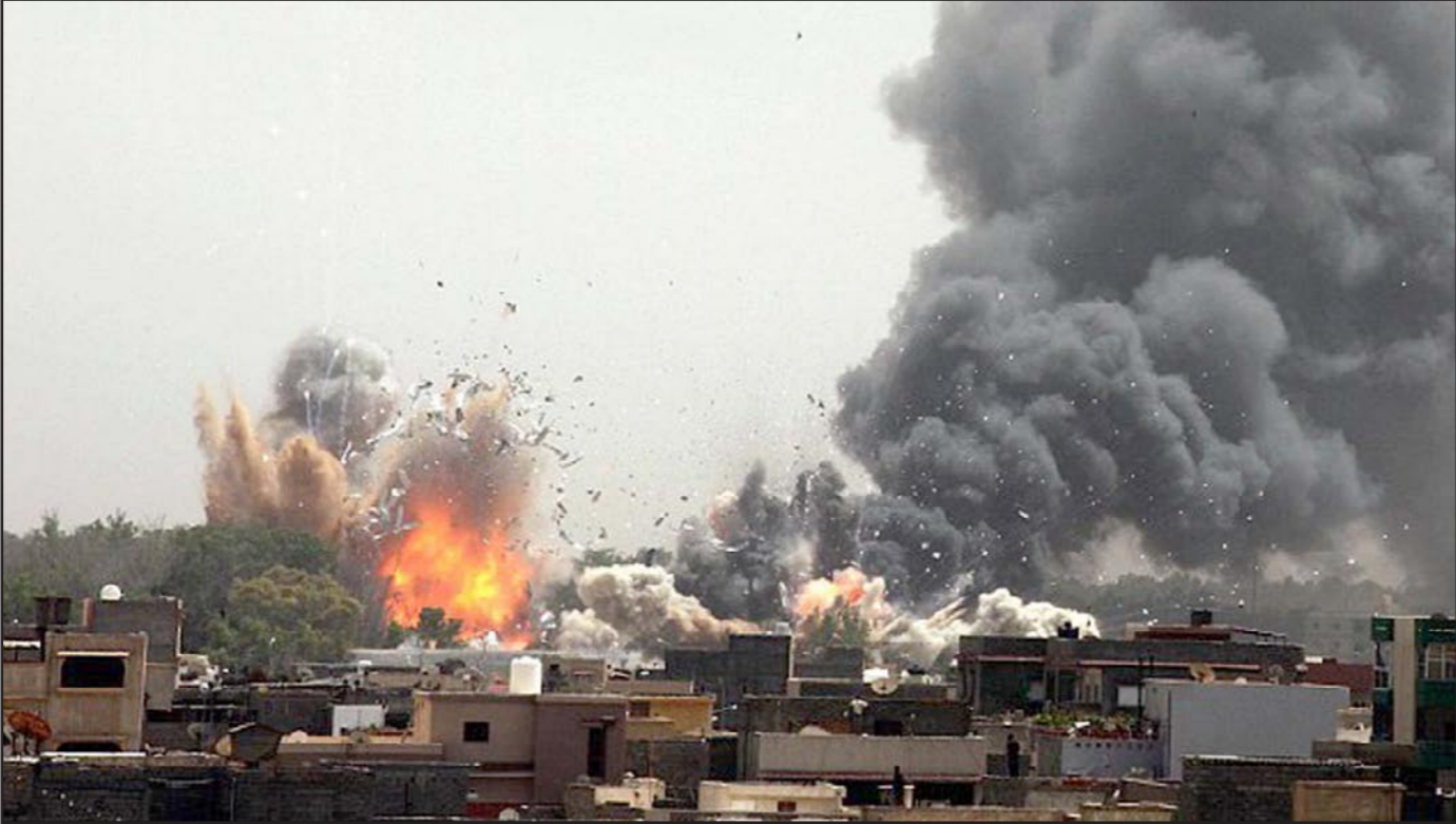
قصف جوي على العاصمة الليبية طرابلس

وقال صقر الجروشي قائد القوات الجوية الليبية إن قوة مولية للثني شنت غارات جوية على قوات الحكومة المنافسة على بعد 40 كيلومترا من ميناء السدرة النفطي. وقالت الحكومة المتمركزة في طرابلس إن قواتها سيطرت على كل الطرق المؤدية إلى أكبر ميناء للنفط في البلاد. وعلى بعد نحو 800 كيلومتر إلى الغرب قال شهود إن الضربات الجوية استهدفت أيضا مدينة زوارة قرب حدود ليبيا مع تونس. لكن الحكومة المنافسة واصلت السيطرة على معبر رأس جدير الحدودي بوابة العبور الرئيسية إلى تونس. وشاهد فريق من رويترز يزور رأس جدير قوات متحالفة مع جماعة فجر ليبيا تعمل على حراسة المعبر الذي أغلق لفترة وجيزة يوم الأحد بعد غارة جوية على بعد نحو ستة كيلومترات. وقالت حكومة الإنقاذ التي تسيطر على المعبر وهو شريان حياة مهم للبلاد. وقال مسؤولون أمس ظهر الثلاثاء سيارة مفخخة بالقرب من مديرية أمن العاصمة الليبية طرابلس دون تسجيل خسائر في الأرواح كما أفاد مسؤول أمني. وقال المسؤول طلب عدم ذكر اسمه في تصريح وكالة فرانس برس إن «سيارة كانت مركونة بالقرب من مبنى مديرية أمن طرابلس تم تفجيرها عن بعد ما أدى إلى إحداث أضرار مادية كبيرة في المكان». وأضاف أن الحادث لم يسفر عن وقوع خسائر في الأرواح بينما تضررت بشكل كبير السيارات المتوقفة في المكان إضافة إلى أضرار بالبنية والمباني المجاورة.