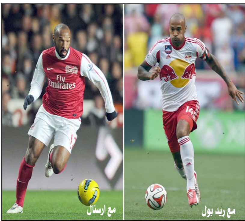
الديين زيدان، واعتزل هنري اللعب دولياً عام 2010 بعد أن توج مع منتخب فرنسا ببطولة كأس العالم 1998 وكأس الأمم الأوروبية لعام 2000 وكأس القارات عام 2003.

وجعلت منه النجم الكروي الاسطوري. وفي 2007 انتقل إلى برشلونة الذي استمر معه حتى 2010. لكنه لم يحقق معه نفس النجاح الذي حققه مع أرسنال، لكنه كان ضمن الفريق