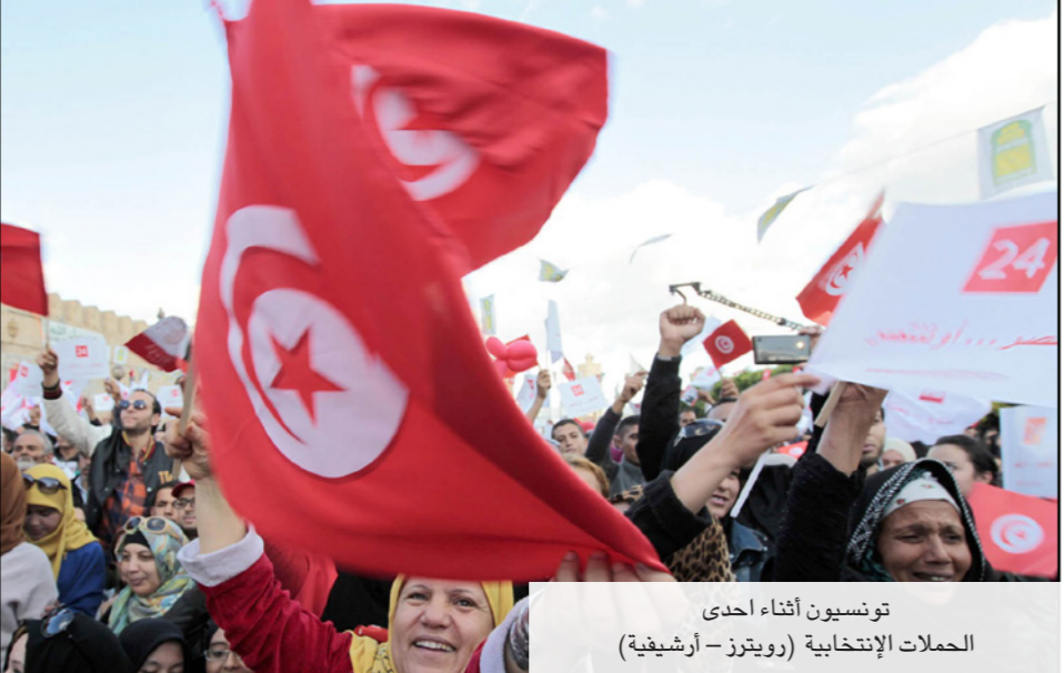
تونسيون أثناء إحدى الحملات الانتخابية

ازداد واقع أقصى اليسار التونسي غموضا في الأيام الماضية، إذ تركز الشثت داخله خصوصا بعد إعلان عدد من مناضليه وخاصة المستقلين وبعض أحزابه وتنظيماته وائتلافاته، موقفهم النهائي من دعم أي من المرشحين (السبسي - المرزوقي)، وهو ما حدا بالمتابعين إلى التساؤل حول ترتيبات ذلك على مستقبل مكونات أقصى اليسار. وهل يُمكن لها تجاوز حالة التشرذم والانقسام التي تركزت منذ أسابيع، وهل يمكن اعتماد إستراتيجية مستقبلية تتسم بواقعية وفاعلية في التفكير، وهل يمكن لأحزاب اليسارية توخي أساليب جديدة لتجديدها بُنيتها خلال الخمس السنوات القادمة أو ستعتمد للمسقوط في سيناريو 1988. الاتحاد من أجل تونس: التحالف انتهى والمكونات تدعم السبسي وهو التحالف اليساري الذي قارب على نهايته أو بالأحرى قبر فعلياً منذ خوض النداء للانتخابات التشريعية بقوامه الحزبية، ويتشكل الاتحاد حاليا من حزب العمل الوطني الديمقراطي و«حزب المسار» وبعض اليساريين المستقلين وبعض المستقلين من نداء تونس في الصائفة الماضية، ولم يحصل أي مقعد نيابي، وتساند قياداته السبسي وتتسابق لرضائه وتطلع لتشريكها بصيغ مختلفة في الحكومة القادمة، وقد علمت «القدس العربي» أن حزب المسار قدم مقترحات عملية لتشريكه في الحكومة القادمة كما عقد عبد الرزاق الهامي جلسة خاصة وسط الأسبوع الماضي مع الباجي للغرض نفسه. الجبهة الشعبية: ارتباك وتردد وغموض مستقبلي تعتبر الجبهة عمليا أكبر التحالفات اليسارية في الساحة السياسية سواء من حيث عدد المكونات أو من حيث حضورها الإعلامي والسياسي أو من خلال علاقاتها