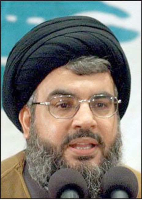
عضو جبهة الإسلام

رغم المكاسب العسكرية والتنظيمية التي حظي بها حزب الله في سوريا، كان من الصعب على مبادرة المنظمة اقتناع الجمهور في لبنان أن هذه المشاركة ضرورية لأمن الدولة اللبنانية، ولكن مساعدة غير متوقعة وصلت على شكل الإسلام السلفي السني في سوريا مباشرة، التي بدأ فيها المتمرد المدني باتخاذ أشكال جهادية سلفية والابتعاد عن التيار المعتدل. وظهر في لبنان مؤيدون كثيرون لمنظمات الإرهاب السنية التي تعمل في سوريا. وبرزت الظاهرة أكثر في مخيمات اللاجئين في الشمال والجنوب - وهي الولاية المتوترة وصاحبة تاريخ من العنف، وهي طرابلس، وسجلت في لبنان على هذه الخلفية مجموعة من الاحداث الأمنية الخطيرة من بينها عمليات السيارات المفخخة التي أدت إلى مخاوف كبيرة في بيروت وازدادت الظاهرة تطرفا مع انتشار وتوسع الدولة الإسلامية في العراق وسوريا في صيف 2014، حيث بدأت الدولة الجهادية الإسلامية بكسب التأييد الكثير من السكان السنيين في لبنان إضافة إلى التأييد المتنامي منظمة جبهة النصرة، وهي فرع من القاعدة في سوريا. قضية خطف رجال الأمن اللبنانيين في منطقة الحدود عرسال في آب 2014 لم تنته بعد، هذا بالإضافة إلى المواجهات التي اندلعت في طرابلس في تشرين الاول والتي اكتت بشكل واضح التحدي والخطر على الأمن العام، وجاء ذلك في ظل الشلل الذي تشهده الساحة السياسية بسبب عدم وجود