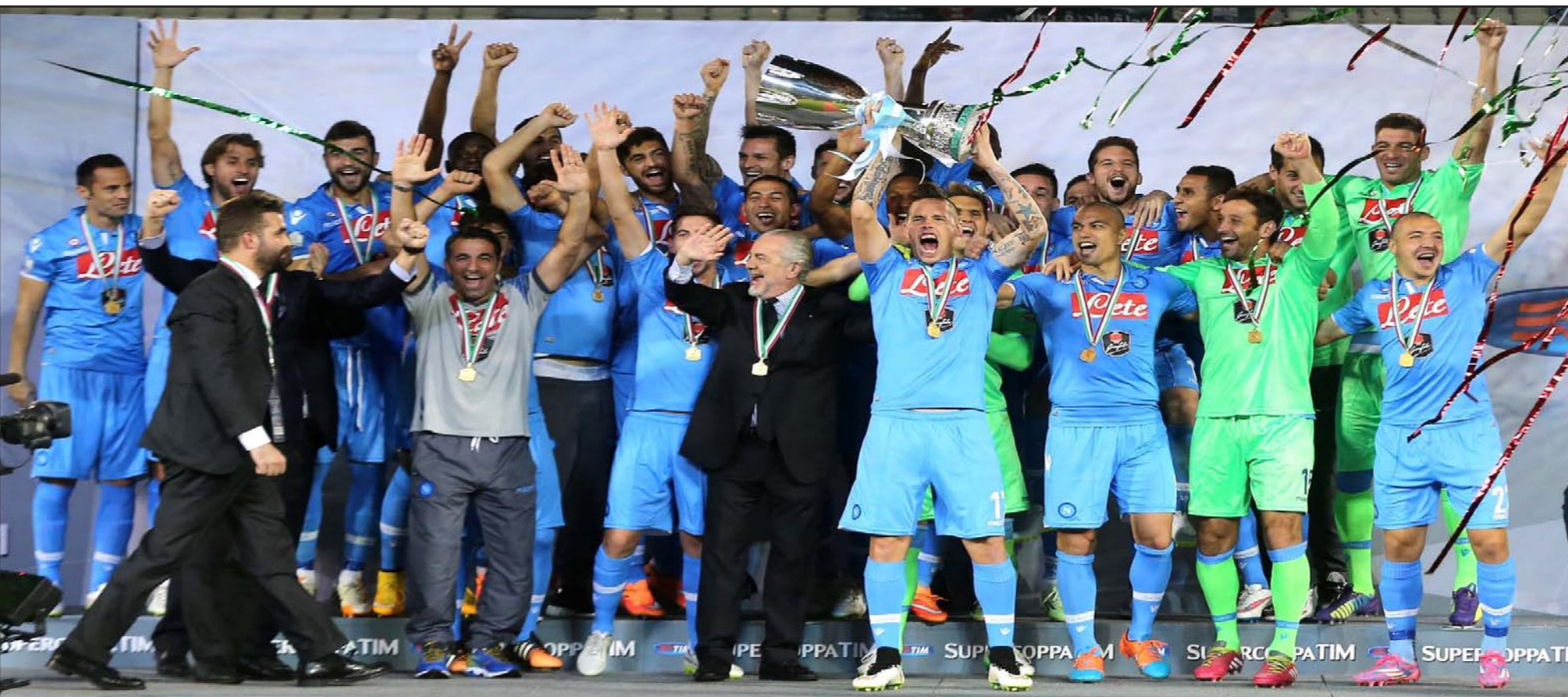
نجوم واداريو نابولي يحتفلون بلقب الكأس السوبر الإيطالية

الدوحة - د ب أ: توج نابولي بلقب الكأس السوبر الإيطالية للمرة الثانية في تاريخه بعد فوزه على يوفنتوس 5/6 بركلات الترجيح بعد انتهاء الوقتين الأصلي والإضافي بتعادل الفريقين 2/2 في المباراة المرادوية التي جمعت الفريقين على استاد جاسم بن حمد بنادي السد في العاصمة القطرية الدوحة.