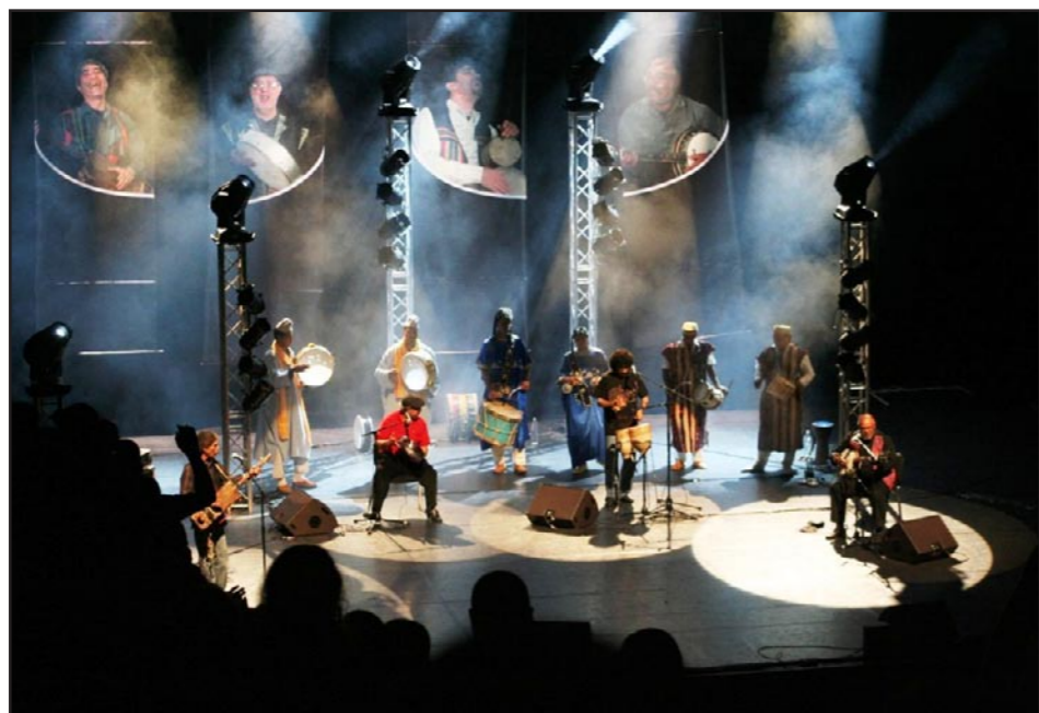
فرقة ناس الغيوان

ونكر الكاتب أن مجموعة «ناس الغيوان»، كانت شكلت ظاهرة من خلال مزجها بين الموسيقى والسياسة، مشيراً إلى أن هذه المجموعة ولدت مفهوماً غيوانياً يجمع بين العبارة الشعرية واللحن الغنائي في سياق الأغنية الاحتجاجية العالية.