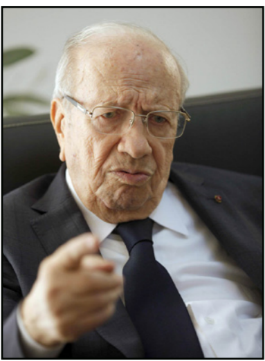
الباجي قائد السبسي

واندلعت مواجهات في منطقة الكرم في العاصمة تونس ليلة الاثنين بين شباب عبروا عن رفضهم لنتائج