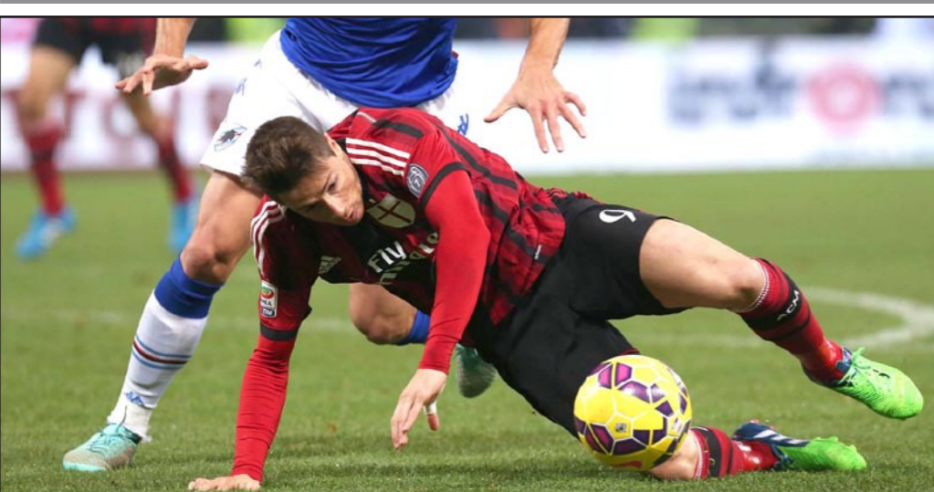
فيرناندو تورييس خاض فترة مخيبة مع ميلان الإيطالي وقد يعود إلى بيته الأول

مويز: سوسيداد سيواجه فترة حاسمة مطلع عام 2015