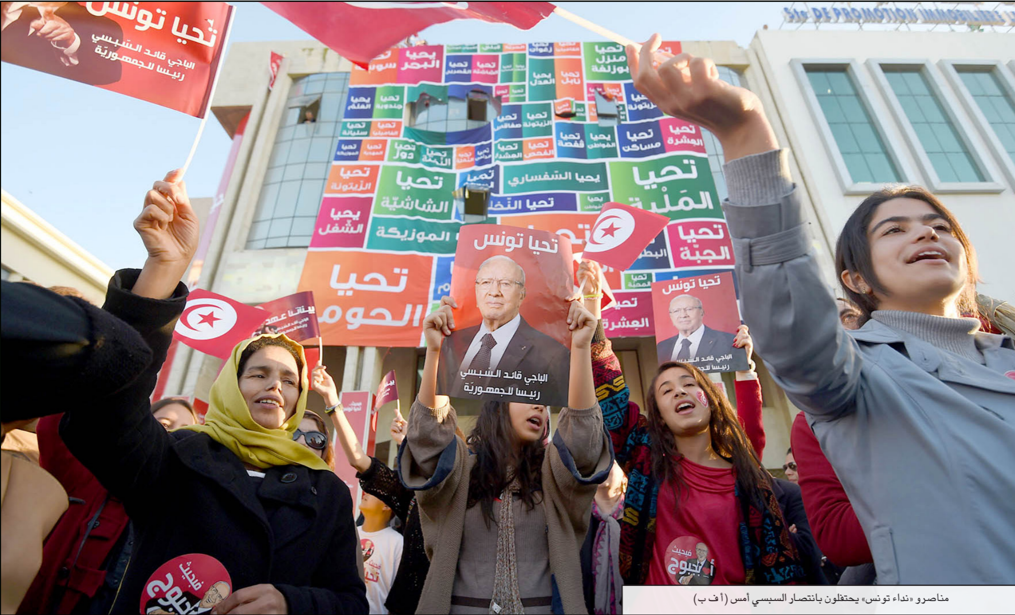
مناصرو «نداء تونس» يحتفلون بانتصار السبسي أمس