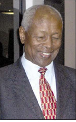
أحمد إبراهيم دريج

عاد إلى الخرطوم فجر أمس السياسي السوداني البارز أحمد إبراهيم دريج رئيس حزب التحالف الفيدرالي الديمقراطي المعارض وحاكم إقليم دارفور الأسبق بعد غياب عن البلاد 30 عاما قضاها في منفاه الاختياري. واستقبل دريج فور عودته في مطار الخرطوم وزير الإعلام د. أحمد بلال عثمان، وقال دريج في تصريحات مقتضبة «إنني سعيد جدا بالعودة للوطن بعد غيبة امتدت لأكثر من ثلاثين عاما»، وأضاف «عدت سعيدا أنتي بين أهلي وبني وطني».