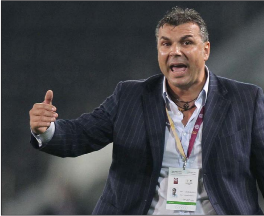
الروماني كوزمين أولاريو تجاوز خلافاته مع الاتحاد السعودي وسيقود المنتخب في النهائيات الآسيوية