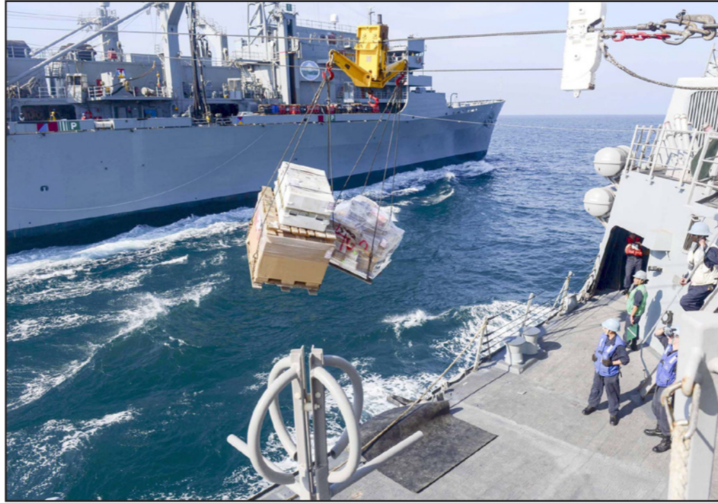
صورة نشرتها البحرية الأمريكية لإحدى سفنها التي تحمل إمدادات الدعم العمليات العسكرية ضد تنظيم «داعش» في العراق وسوريا

أعلن نائب رئيس الجمهورية ابياد علاوي عن تقدمه بمشروع خارطة تحقيق المصالحة والوحدة الوطنية إلى الرئاسات الثلاثة (الجمهورية ومجلس الوزراء ومجلس النواب) بالإضافة إلى سلطة القضاء، وذلك بعد تكليفه رسمياً بهذا الملف مؤخراً وبالترام من مع مبادرة رئيس مجلس النواب سليم الجبوري للحوار مع المعارضة في الخارج. وقال علاوي في بيان وزع أمس «نحن نرى أن المصالحة الوطنية هي اهم الضروريات لتحقيق الاستقرار وبناء دولة المواطنة الحققة، ورفع الغبن ومنع الخوف والعوز عن المواطنين، لذلك يتحقق عندما ننقل بالمصالحة إلى مرحلة العمل الجاد، ضمن جدول زمني واضحة لتحديد الخطوات المسؤولة والملموسة والجرئية والقادرة على النجاح والاستمرار».