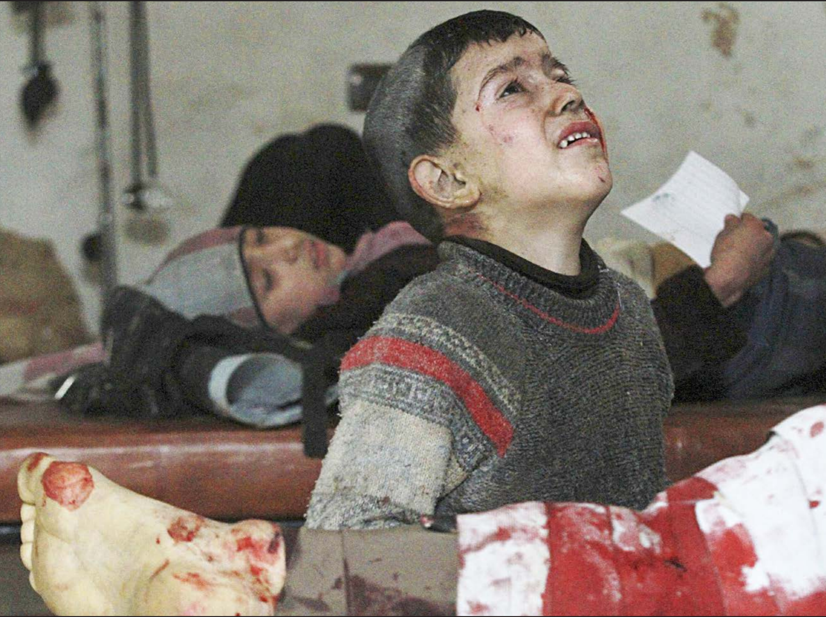
اطفال سوريون يتلقون العلاج في مستشفى ميداني في منطقة دوما قرب دمشق عقب غارات جوية للنظام السوري