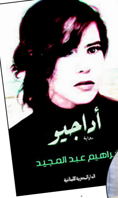
إبراهيم عبد المجيد

بجابتها، ثم تروح، مثلما عودتنا نصوص عبد المجيد الأخرى، فهذا العالم، أناسه قلة، وهم أشبه بأولئك الذين افتتحوا البشرية، أو بأولئك الذين سيخفتونها، والذين يحمل كل منهم و سماء العادي بل المرئول، الذي يتعلّق بوضع أصحابها، لكنّ بنتيجة واحدة، إنهما الخراب، تماما مثل الأثر الوقائعي لوتنا في سبيل قضبة ريفية، أو موتنا متعثرين بجذء قديم، وذلك إذا ما حذفتنا الفردات الرئانة، والجزئات التي هي مجرد عمليات تجمية للصوص، ومثل إيراكتا لهوية كل من الكوميدي والتراجيدي، الذين يمتلكان هدفاً واحداً، وهو ملامسة الحقيقة، بيد أن التراجيدي مبدل، والكوميدي مزدول. تتضاضر عناصر الرومانسية، التي افتقدناها طويلا في الرواية العربية، لتصنع فضاء النص، يشكها المكان القصصي الموحش، والرطب، والصاصم، وكذلك المرض القاتل، والحب العميق، والوحدة، والموت، والحزن، والحرمان الجسدي، والهدأ هدم، والكتابة، لقد حافظ النصّ على وتيرة الخراب ذاتها من أوّله إلى آخره: الرطوبة والمفونة والطلب مقابل تراجع حالة «ريم» الغائبة عن الوعي، ونحوها المرعب، وديورتها الشهيرة للثقافة، تتقابل تلك الحلول المؤقتة والتلطيفية، التي لن تلغ في ترميم الجسد، مع اجراءات النصّح المؤقتة، ووضع بقايا ضافية من السراميك، التي لا يمكن لها أن ترمم خراب المكان، ليهاجر البناء أخيراً مع انهيار الجسد، وموت «ريم»، تتأني فرادة هذا المعامل الروضي من التناقض بين الجليل الذي هو موت تراجيدي لفنانة استثنائية، شابة، وحبيبة، وأمّ، وبين