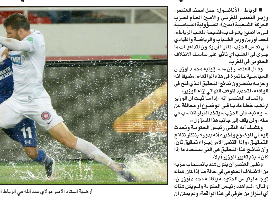
أرضية استاد الأمير مولاي عبد الله في الرباط السبتية قادت الى اقالة الوزير

والعارضة حول واقعة ملعب الأمير مولاي عبد الله بالرباط في بطولة كأس العالم للأندية التي أقيمت هذا الشهر، لكن هذه التكتلات سحبنت أسئلتها حتى لا يكون هناك أي تأثير على عمل اللجنة التي تتباشر التحقيق في الموضوع، حسب هذه الفرق. وكانت اختلالات طبعات إحدى المباريات ربع نهاية كأس العالم للأندية لكرة القدم على أرضية استاد الأمير مولاي عبد الله، بالعاصمة الرباط. وعانى لاعبو فرقيي كروز أزلو وويسترن سيدني