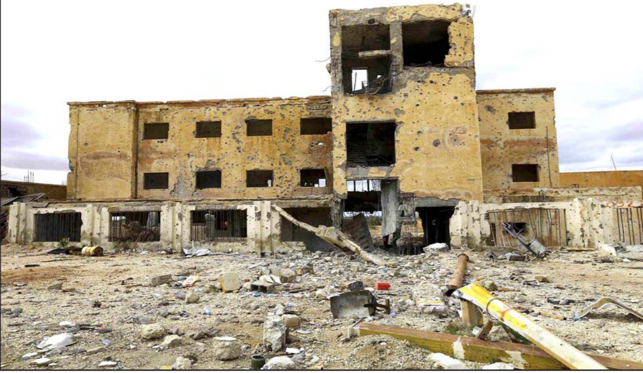
بنايات مدمرة جراء القصف على مدينة بنغازي

جنيف - أف ب : أعلنت الأمم المتحدة أمس الثلاثاء أن القتال الذي اندلع خلال الأشهر الأخيرة بين الجماعات المسلحة والقوات الحكومية في غرب وشرق وجنوب ليبيا قد أدى إلى مقتل مئات المدنيين ونزوح جماعي، وإلى تسجيل انتهاكات يمكن اعتبارها «جرائم حرب». وأكدت المتحدث باسم المفوضية العليا لحقوق الإنسان رافينا شمسداني «منذ منتصف أيار/مايو، زادت المعارك وتواصلت الانتهاكات دون حسيب أو رقيب بعض هذه الجرائم يمكن اعتبارها جرائم حرب». وقالت الأمم المتحدة في تقرير لبعثتها في ليبيا أعدته مع مفوضية حقوق الإنسان إنها رصدت حالات القصف العشوائي للمناطق المدنية واختطاف المدنيين وحالات الإعدام والتدمير التعمد للمباني وغيرها من التجاوزات والانتهاكات الخطيرة للقانون الدولي في مناطق مختلفة من البلاد. وأوضحت أنه في «منطقة ورشانة الواقعة غرب ليبيا، والقريبة من طرابلس، أدى القتال الذي اندلع بين الجماعات المسلحة التجارية إلى مقتل نحو 100 شخص وإصابة 500 آخرين خلال الفترة الممتدة من أواخر آب/ أغسطس وأوائل تشرين الأول/أكتوبر». وأشارت إلى أن القتال «تسبب بأزمة إنسانية حيث يقدر عدد النازحين بما لا يقل عن