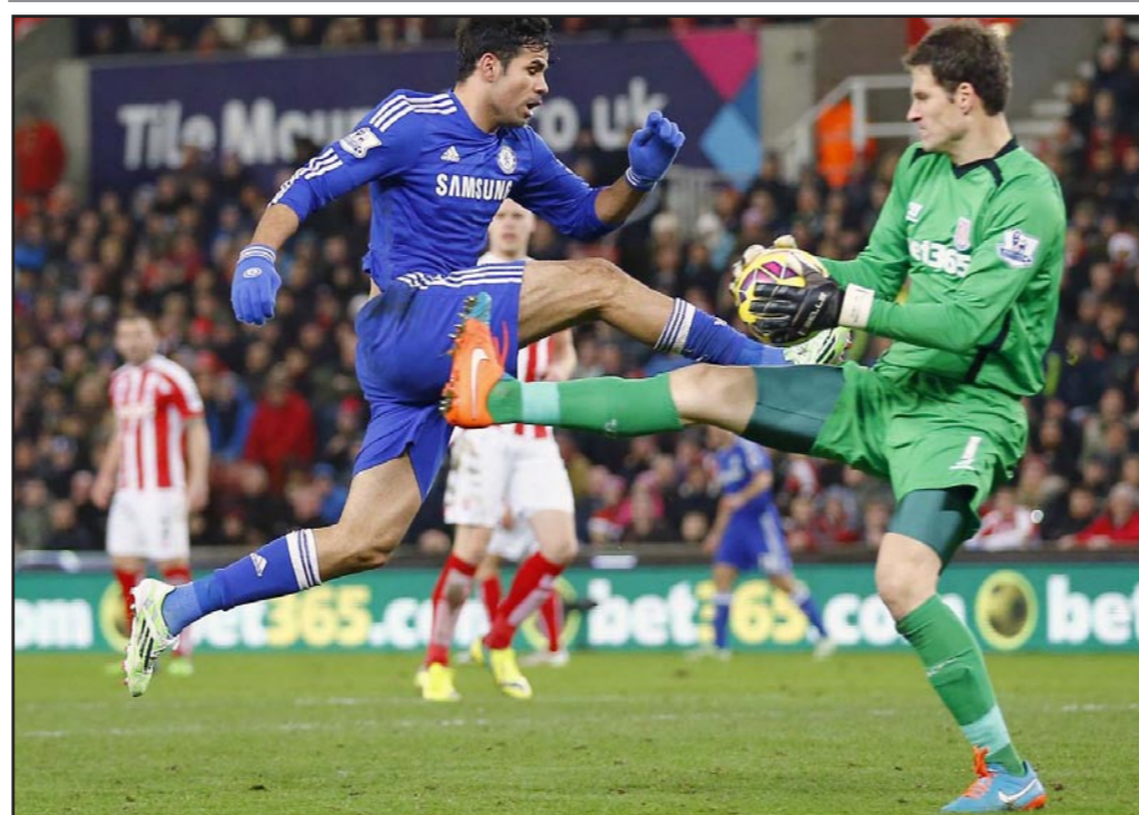
صراع حار على الكرة بين حارس ستوك بيغوفيتش (يمين) ومهاجم تشلسي كوستا

لندن - رويترز: سجل جون تيري هدفا بضربة رأس وأضاف سيسك فابريغاس آخر بتسديدة في الشوط الثاني ليفوز تشلسي 2-صفر على ضيفه ستوك وينفرد بصدارة الدوري الانكليزي، متقدما بثلاث نقاط على أقرب منافسيه.