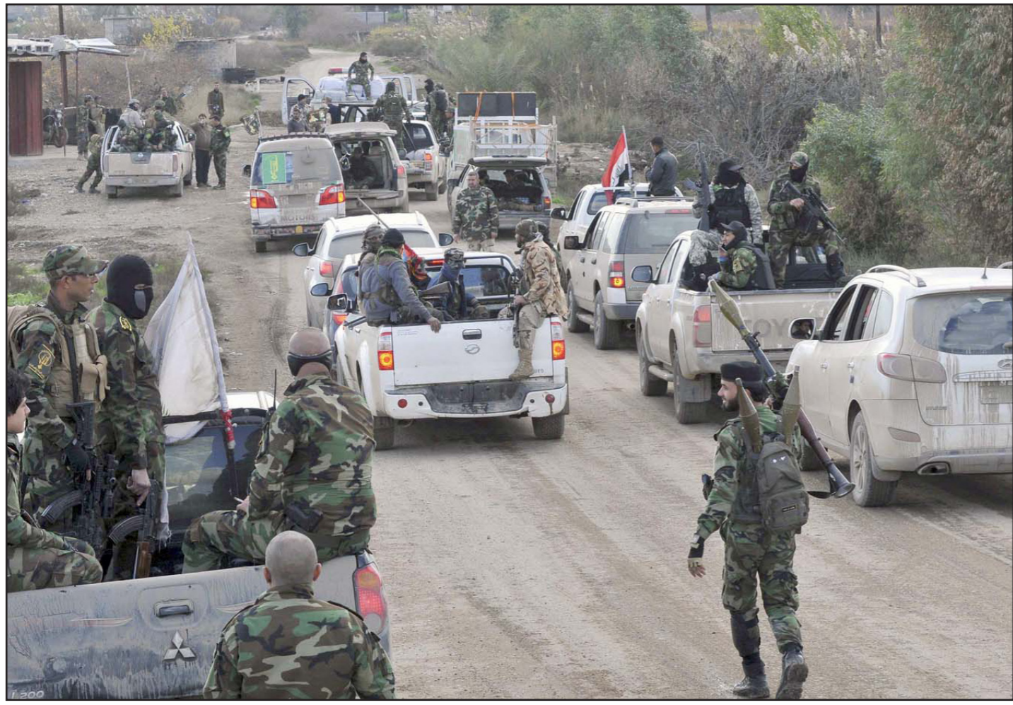
شهدت بغداد أمس إجراءات أمنية مشددة على خلفية تسريبات نبئية «داعش» مهاجمة السجون في بغداد

من غير المحتمل أن تكون الذكرى الأخيرة، ووفقاً لما توقعه مسؤول في الإدارة العراقية فإن العراق سيكون أفضل قليلاً مما هو عليه الآن ولكن نظام الأسد سيبقى مسيطراً على زمام الأمور في سوريا وسيبقى تنظيم «داعش» حقيقة على أرض الواقع في كلا البلدين.