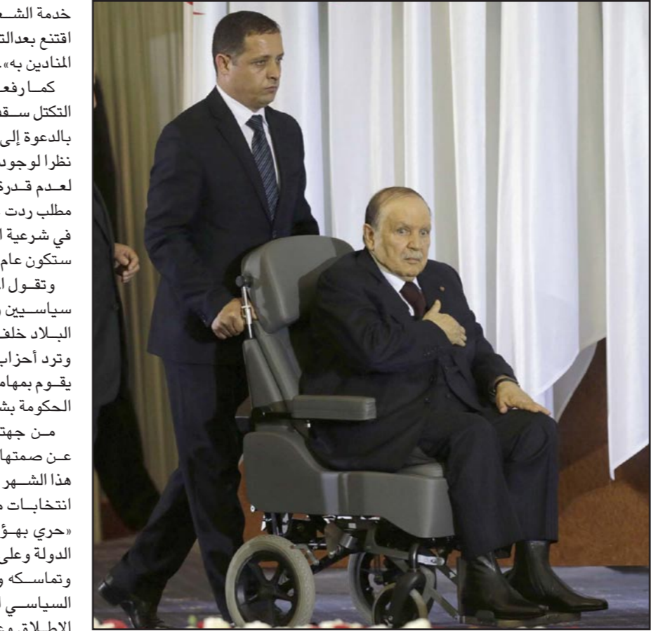
الرئيس عبد العزيز بوتفليقة

خدمة الشعب من أجله، معنى وبعد إلا إذا اقتنع بعدلته وصدق نيات النساء والرجال المتادين به». كما رفعت المعارضة المنضوية تحت هذا التكتل سقف مطالبها شهر تشرين الثاني بالدعوة إلى «تنظيم انتخابات رئاسية مبكرة نظرا لوجود شغور في رئاسة الجمهورية لعدم قدرة الرئيس على أداء مهامه»، وهو لعلم ردت عليه أحزاب الموالة بأنه «طعن في شرعية الصندوق وأن انتخابات الرئاسة ستكون عام 2019 بعد انتهاء ولاية الرئيس». وتقول المعارضة إن «محيط الرئيس من سياسيين وكذا رجال أعمال هو من يسير البلاد خلف الستار في ظل مرض الأخير» وترد أحزاب الموالة أن «رئيس الجمهورية يقوم بمهامه ويتابع كل الملفات ونشاط الحكومة بشكل مستمر». من جهتها خرجت مؤسسة الجيش عن صمتها في مقال نشرته مجلة الجيش هذا الشهر بشأن مطلب المعارضة بتنظيم انتخابات مبكرة وحياد الجيش بالتنظيم «حري بهؤلاء الالتزام واحترام مؤسسات الدولة وعلى رأسها الجيش الوطني الشعبي وتماسكه ووحدته وعدم الزج به في الشأن السياسي الذي هو ليس من مهامه على الإطلاق وعدم استغلال تسككه بمهامه الدستورية للطعن في شرعية مؤسسات الدولة»، في إشارة إلى الطعن في شرعية الرئيس عبدالعزيز بوتفليقة. ووسط هذا الاستقطاب الثنائي بين المعارضة والموالة، اقترح حزب جبهة القوى الاشتراكية الذي يوصف بأنه أقدم حزب معارض في البلاد تاريخ 23 و24 شباط/