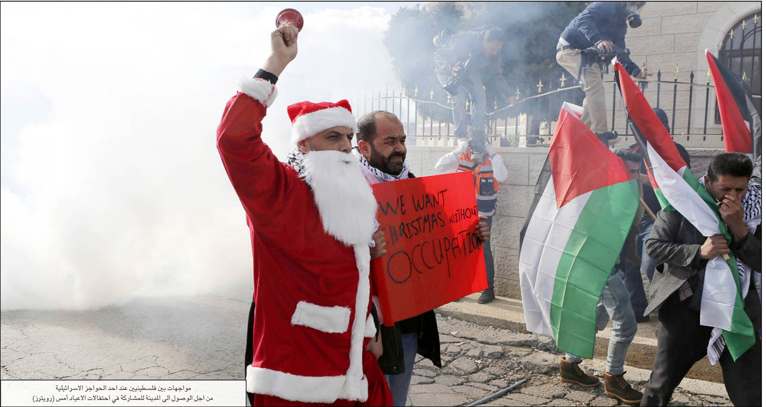
مواجهات بين فلسطينيين عند أحد الحواجز الاسرائيلية من اجل الوصول الى المدينة للمشاركة في احتفالات الاعياد أمس

الحالية، وبدأت عادة مشاركة الرئيس الفلسطيني في احتفالات عيد الميلاد، وقداس منتصف الليل، منذ وصول السلطة الفلسطينية إلى الأراضي الفلسطينية، حيث دأب الرئيس الراحل ياسر عرفات على المشاركة في قداس منتصف الليل لدى الطوائف اللاتينية. ويكرر المشهد في السابع من كانون الثاني/يناير للطوائف الشرقية، ولم تنقطع مشاركة عرفات بالقداس، إلا وقت الحصار الإسرائيلي عليه، إذ ترك مقعده خالياً ملفوفاً بالكوفية الفلسطينية التي اشتهر بها الرئيس الراحل، وذلك في العام الذي رحل فيه.