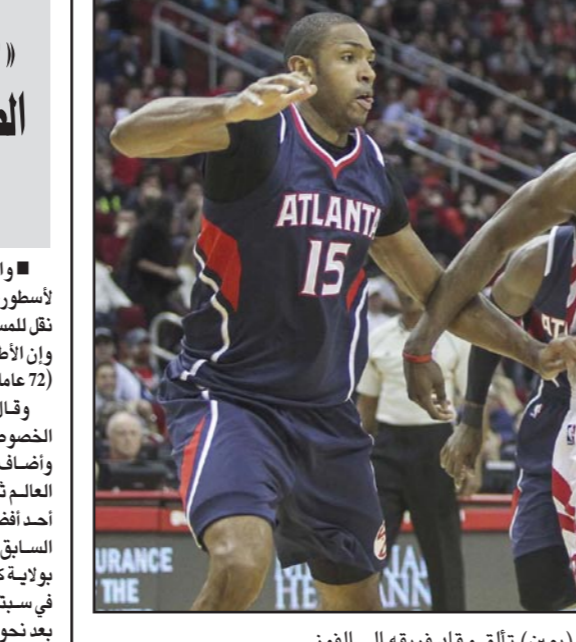
هاردين نجم روكتس (يمين) تالت وقاد فريقه الى الفوز

■ لوس أنجلوس - د ب أ: تالت جيمس هاردين صاحب أعلى معدل تسجيل النقاط في مسابقة دوري كرة السلة الأمريكي المحترفين هذا الموسم ليقود فريقه هيوستن روكتس للفوز على بورتلاند تريل بليزرز 110-95. وسجل هاردين 44 نقطة لروكتس ليتجاوز حاجز الأربعين نقطة للمرة الثالثة هذا الموسم ويتسبب في إيقاف سلسلة انتصارات بليزرز المتتالية عند خمس مباريات، وسجل نوبت هاوارد 16 نقطة متابعه لروكتس أمس وأضاف كوري بروبير 12 نقطة أخرى في أولى مبارياته مع الفريق بعد انضمامه إليه يوم الجمعة الماضي من مينيسوتا تمبولفنز. واستغل روكتس غياب نجوم بورتلاند لاماركوس