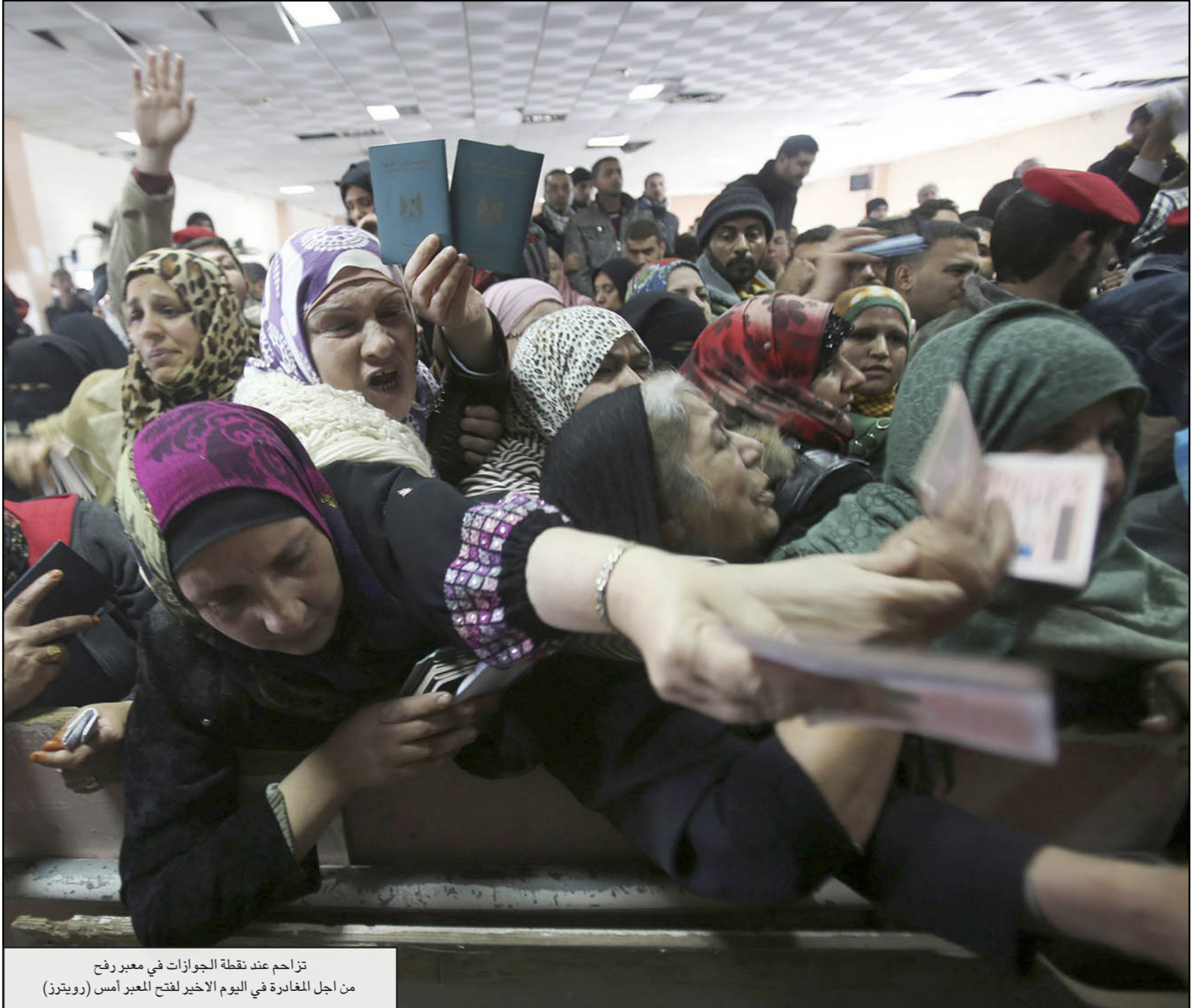
تزامن عند نقطة الجوازات في معبر رفح من أجل المغادرة في اليوم الأخير لفتح المعبر أمس