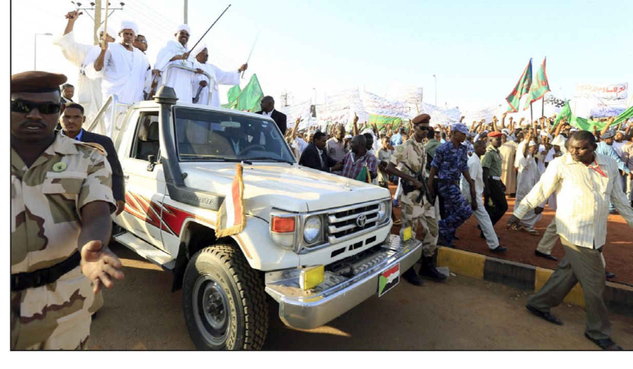
الرئيس السوداني عمر البشير خلال احتفال جمعه رجال الطرق الصوفية في منطقة الحاج يوسف

الخرطوم - «القدس العربي»: أطلقت لجنة التعديلات الدستورية برئاسة بديرية سليمان أحزاب حكومة الوحدة الوطنية بالتعديلات الدستورية المتعلقة بتعيين الولاة والأراضي الاستثمارية وتصحيح قرارات الرئيس السوداني عمر البشير والتعديلات الأخرى المرتبطة بالحكم الفيدرالي وتعزيز دور المؤسسات المختصة بالولاة كوكالة من مشروع الإصلاح الوطني الذي أقرته الدولة لخدمة المواطن. وقال الأمين العام لمجلس أحزاب الوحدة الوطنية عبود جابر إن قادة الأحزاب واجلس وقفا على مشروعات التعديلات الدستورية التي وضعت أمام الهيئة التشريعية بهدف دراستها وإجازتها. وأضاف أن الأحزاب المشاركة في التتوير امتنت على التعديلات وباركتها باعتبارها تصب في مصلحة الحكم الفيدرالي والأجهزة والمؤسسات بالولاة حيث انضج حاجة الحكم الفيدرالي للمزيد من الدعم وتعزيز دوره لمعالجة قضايا المواطنين. وعن تعيين الولاة نوه إلى أن الأحزاب المشاركة في اللقاء وقتت على مشروع التعديل في الدستور الذي سيضفي إلى تعيين الولاة بدلا من انتخابهم مشيرا إلى أن عملية انتخاب الولاة أظهرت سلبيات واضحة أصرت بصورة مباشرة بمصالح المواطنين. وحول الاتهامات الموجهة للجنة التعديلات الدستورية بشأن تجاوز صلاحيتها أوضح جابر أن المادة 20 من لائحة أعمال الهيئة التشريعية القومية تمكن اللجنة المختصة من الإضافة في التعديلات الطروحة.