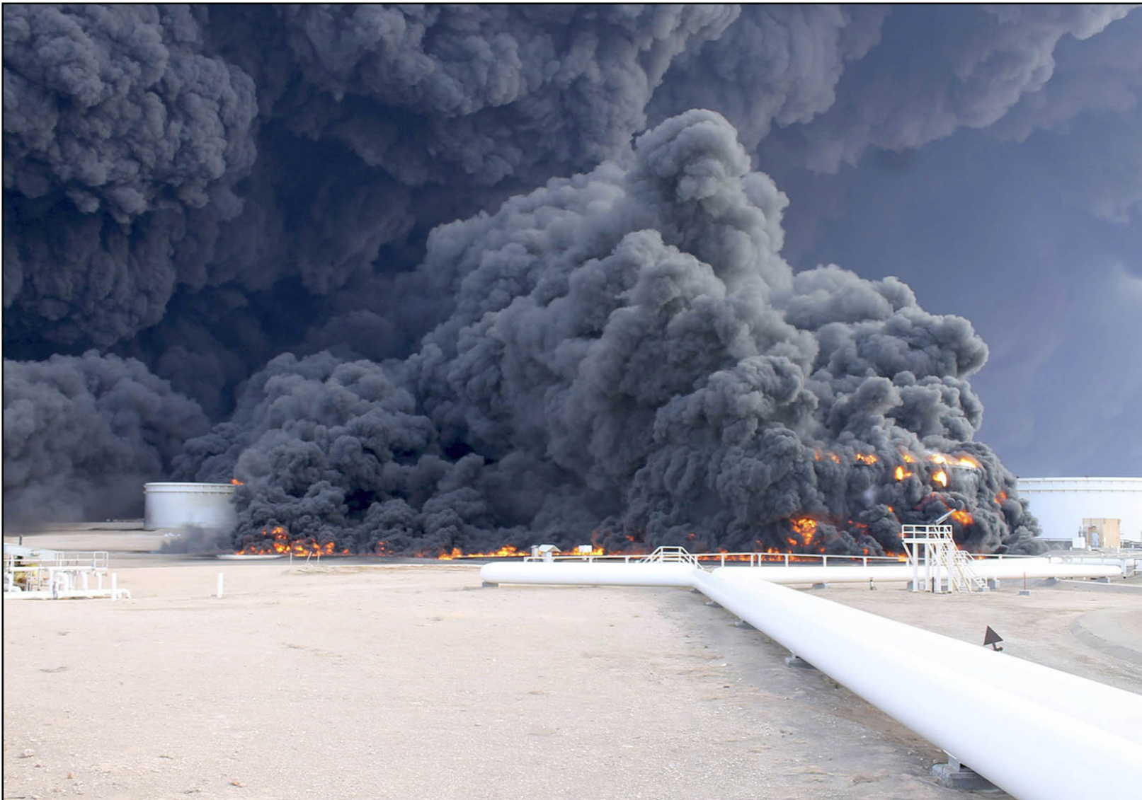
حريق خزانات مرفأ السدرة