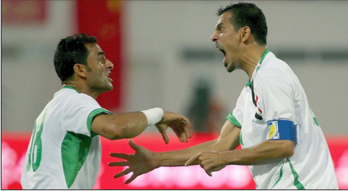
المخضرم يونس محمود (يمين) يقود الهجوم العراقي في النهائيات الآسيوية