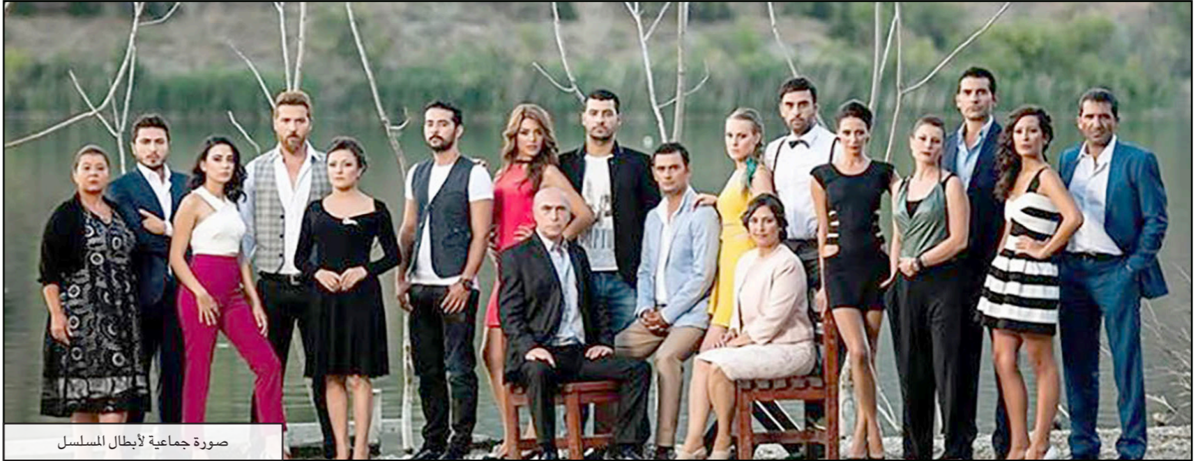
صورة جماعية لأبطال المسلسل