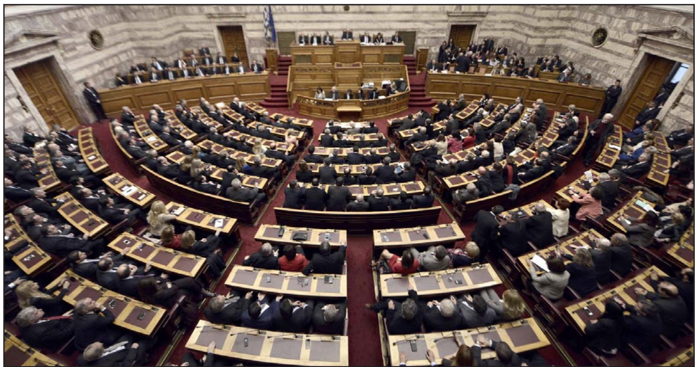
البرلمان اليوناني في جلسة اضطلرت الحكومة في نهايتها الى الدعوة الى انتخابات برلمانية جديدة

■ أثينا – وكالات الأنباء: أعلن صندوق النقد الدولي أمس الإثنين أنه سيستأنف المفاوضات مع اليونان بشأن مراجعة برنامج الإصلاح الاقتصادي بمجرد تشكيل حكومة جديدة، في أعقاب إعلان رئيس الوزراء اليوناني أنطونيس ساماراس إجراء انتخابات برلمانية مبكرة يوم 25 كانون ثاني/يناير المقبل بعد فشل البرلمان اليوناني أمس في انتخاب رئيس جديد للبلاد. وقال جيريمي رايس المتحدث باسم الصندوق «اليونان لا تواجه احتياجات مالية ملحة» في الوقت نفسه يتوقع خبراء البنوك تضرر الأسواق المالية في أوروبا من الاضطرابات السياسية التي تشهدها اليونان بعد الدعوة إلى إجراء انتخابات برلمانية مبكرة في أواخر الشهر المقبل. وكتب فرانسوا كابو وأنطونيو غارسيا باسكوال، الحلان في بنك «باركليز» البريطاني في مذكرة «تتوقع زيادة تقلبات أسواق المال في ضوء حالة الغموض المتزايدة التي تحيط بنتائج الانتخابات (المنتظرة) خاصة أن حزب سيريزا لم يشارك في أي حكومة (وهو المنتقم في السياق الانتخابي)». في الوقت نفسه قال الحلان أنه إذا لم يحصل اليكسيس تسبيراس، زعيم الحزب اليساري المتطرف على عدد كاف من مقاعد البرلمان لتشكيل