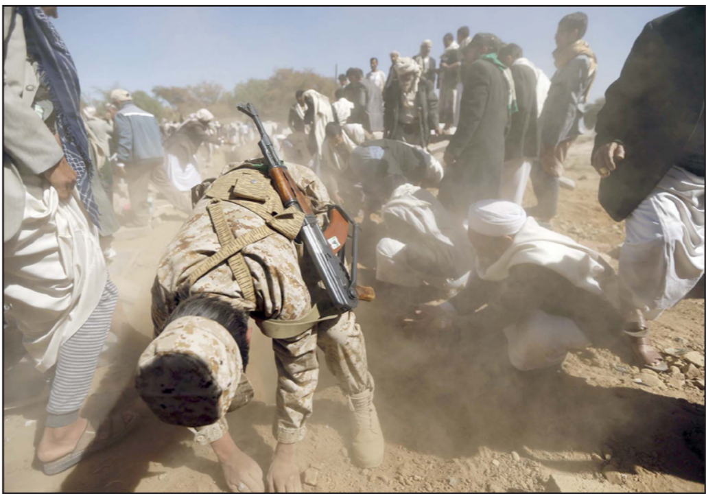
جانب من دفن قتلى الحوثيين سقطوا على يد تنظيم القاعدة

ونسبت صحيفة (اليمن اليوم) أمس الاثنين إلى مصدر أمثني قوله «أن الأجهزة الاستخباراتية رصدت السيت، تحرك 5