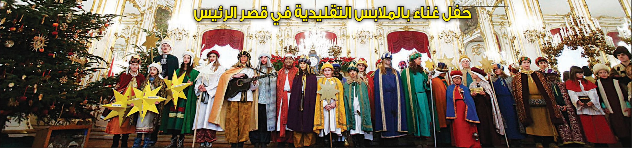
احتفالا بأعياد الميلاد ورأس السنة الجديدة قام هذا الكورال المنمسي المكون من حشد من الفتيات والفتيان في ملابسهم التقليدية بتقديم عروضه داخل قصر «هوفبرغ» الرئاسي في العاصمة فيينا