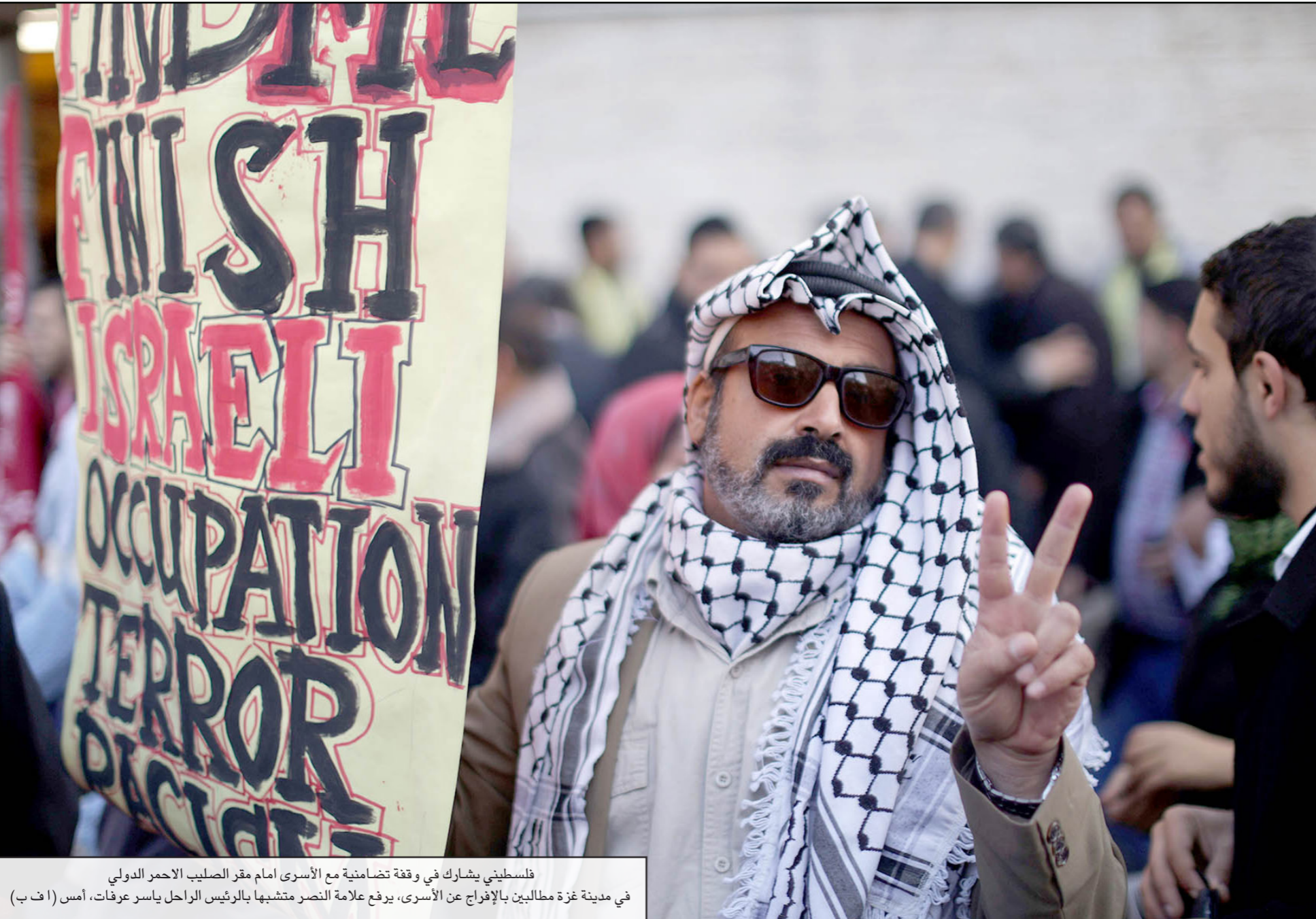
فلسطيني يشارك في وقفة تضامنية مع الأسرى أمام مقر الصليب الاحمر الدولي في مدينة غزة مطالبين بالإفراج عن الأسرى، يرفق علامة النصر متمشيا بالرئيس الراحل ياسر عرفات، أمس (1 أ ب)

وكانت حكومة التوافق قد وصلت بأعضائها كافة إلى قطاع غزة بعد انتهاء الحرب الإسرائيلية الأخيرة على غزة وتفقدوا مواقع الدمار، وعقدت برئاسة الحمد لله اجتماعاً لها في منزل الرئيس عباس الذي تحول إلى مقر للحكومة في غزة، قبل أن تجتمع مع مسؤولي حماس في منزل إسماعيل هنية نائب رئيس المكتب السياسي، الذي شهد توقيع اتفاق الصلحة الأخير بين فتح وحماس في نينسان / ابريل الماضي، وكان من المقرر أن يصل طاقم الحكومة التي لا يوجد منها سوى أربعة في قطاع غزة إلى القطاع مجدداً في تشرين الثاني / نوفمبر الماضي، غير أن أحداث التفجيرات التي طالت منازل قادة فتح، وما تلاها من خلاف حاد بين فتح وحماس، جعلها تلغي الزيارة، ويشككي موظف غزة من عدم حصولهم على رواتب من حكومة التوافق منذ تشكيلها في حزيران / يونيو الماضي، ولم تنته اللجنة الإدارية والقانونية التي شكلها الحمد لله قبل عدة أشهر عملها لدمج هؤلاء الموظفين في مؤسسات السلطة، ومن المقرر أن ينفذ الموظفون اليوم اعطصاما احتجاجياً أمام مقر مجلس الوزراء في مدينة غزة، للتنديد بعدم صرف رواتبهم، وسيشارك في الاعتصام معلوم وطلاب، وسيركز على أزمة الموظفين.