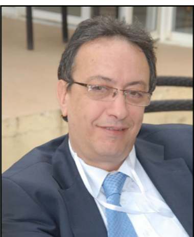
حافظ قائد السبسي

■ هناك شبه إجماع داخل النداء على أن يشرف محمد الناصر رئيس مجلس النواب ونائب رئيس حركة نداء تونس على تسيير الحزب إلى حين إجراء المؤتمر، حيث سيتم انتخاب رئيس جديد للحزب.