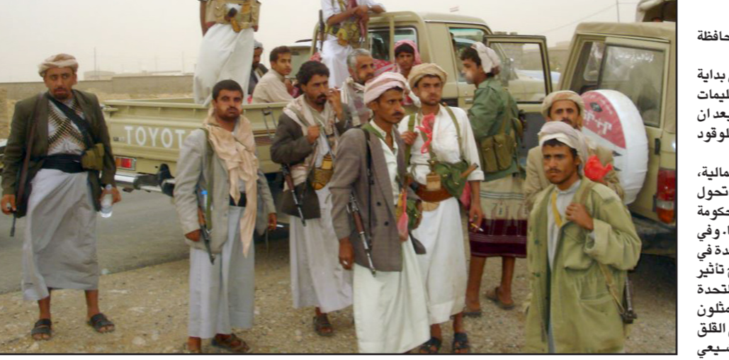
عناصر من الحوثيين في شوارع صنعاء

مخلصون لقبيلة الحوثي التي تتركز في منطقة صنعاء شمال اليمن على الحدود السعودية. وعلى الرغم من أنه بداخل «العائلة» الحوئية نشبت مواجهات عنيفة، ولكن يبدو انه سيسيطر عليهم حالما من قبل قيادة، عبد الملك الحوثي في ابن 35 عاما، الذي يقود المعركة الاخيرة ضد السلطة اليمنية، في هذه المعركة يتدمج مع الحوثيين، الذين يقبكون حركتهم «انصار الله»، منظمة القاعدة السنية وحزب المؤتمر الشعبي، والذي هو الحزب الذي سيطر على الدولة والتي عالجتها بنفسها الخلف الشخصيين بين الرئيس المقال، على عبد الله صالح وبين الرئيس الحالي، عبد ربه منصور هادي.