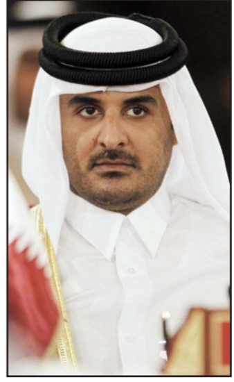
أمير قطر الشيخ تميم بن حمد آل ثاني

■ السعودية هي التي تقف خلف خطوة الصلحة والتقارب بين قطر وحكم الجزارات في مصر مؤخرا، ففي القيادة السياسية وفي جهاز الأمن في إسرائيل يعززون للتطورات الاخيرة بين الدول العربية والسنية المعتدلة أهمية كبيرة ويقدرون بأنه اذا ما نجحت محاولات الصلحة السعودية فسكون ممكنا الاستعانة بها في الجهود لاستقرار الوضع في قطاع غزة، في ضوء العلاقات الوثيقة بين قطر وحماس. في 20 كانون الاول نشر بالنوازي في مصر وقطر بيانان عن الصلحة بينهما، بعد موجهة بذات عقد الجزارات الى الحكم في القاهرة في تموز من العام الماضي، مصر، مثل دول الخليج العربي، اتهمت قطر بالتدخل في شؤونها الداخلية. وغضب الجزارات المصريون من الحلف بين قطر وحركة الإخوان المسلمين في مصر ومن المساعدات المالية التي منحتها قطر لحماس وأغظيهم الاستعراض السلبلي الذي قدمته قناة الجزيرة، التي تعمل برعاية وتمويل قطريين، الرئيس المصري الجنرال عبد الفتاح السيسي. وفي اسرائيل يرون امكانية كاملة ايجابية في التقارب بين الدولتين ويقدرون أنه يعكس محاولة من السعودية وغيرها من دول الخليج – الجبريين، الكويت واتحاد الامارات – لاعادة قطر الى الكتلة السنية المعتدلة ولدق اسفين بينها وبين الإخوان المسلمين والنقطة السنية الجهادية العاملة في الشرق الاوسط. وتسعى مصر إى أن تضمن بان توقيع الصلحة على اسم قطر واستمرت سنتين على