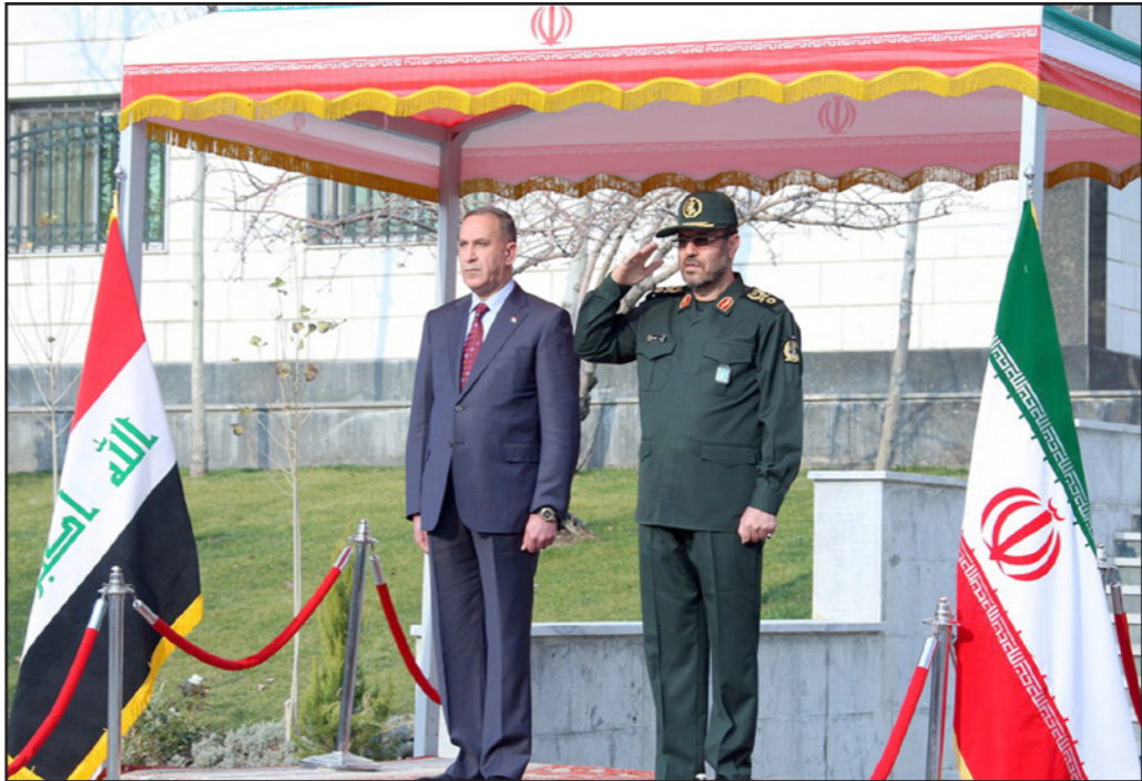
وزير الدفاع الإيراني العميد حسين دهبان خلال استقباله نظيره العراقي خالد العبيدي في مطار طهران أمس (آ ف ب)

ضحى بدمه في سامراء لتفادي إراقة دماننا في طهران