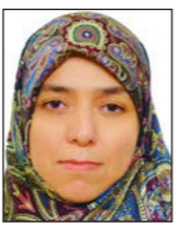
* باحث سياسي عراقي

ان المستقبل بالنسبة للشباب هو كل شيء، فقي انتخابات الجامعات الفلسطينية كان البعض يستعمل نظرية الخوف من المستقبل ليقنع بعض الطلاب بالامتناع عن الإلام بأصواتهم لقوائم معينة، وهذا هو دور السياسيين، أو رجال المخابرات الذين يصنعون للجيل طرماً ضيقة السير فيها يحقق لهم المستقبل المنشود، بحسب رأيهم، والسير خارجها يعني فقدان ذلك الحلم، ليبي الخوف من المستقبل الجهول المشاركة السياسية ويجعل منها علامة تجارية مسجلة تحتكرها طبقة اجتماعية ويمارسها من خلال التخوف، حتى تجذب عقول الناس ويتم حرمانهم من تداول حرّياتهم المدنية، ولو على مستوى سياسي أو اداري متواضع،