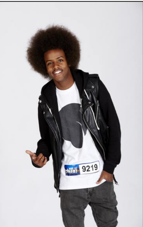
التسابق الصومالي الذي أدهش لجنة التحكيم

بعد ذلك، دخلت المشتركة المصرية «ياسمين» التي أعربت عن رهيبتها من الوقوف أمام أعضاء لجنة التحكيم، معلنة عن خوفها من التجربة، لكنها استطاعت التأكيد على تميز موهبتها، فاستحقت 4 نغم من أعضاء لجنة التحكيم، ثم طلبت منها نجوى أن تغني مقطعا إضافيا لتقنع العميد أكثر بموهبتها، وعندما بدأت الغناء ضغخت على «الجزء الذهبي» لتستخدم حلقها في نقل مشترك واحد إلى مرحلة نصف النهائي، بعدما سبقها أحمد حلمي إلى هذه الخطوة الأسبوع الماضي، عندما نقل «فريق تيسوتو» إلى مرحلة نصف النهائي، وحان موعد وقوف «كراكيب باند» من مصر على المسرح، فاستحق عرضها التأهل إلى المرحلة التالية، مع «3 نعم».. تبع ذلك، عرض موسيقي مميز لسحرمة وتر، من مصر المؤلفة من 3 شبان، قدموا وصلة موسيقية متميزة من تأليفهم، وتاهل الفريق إلى المرحلة التالية بجدارة.