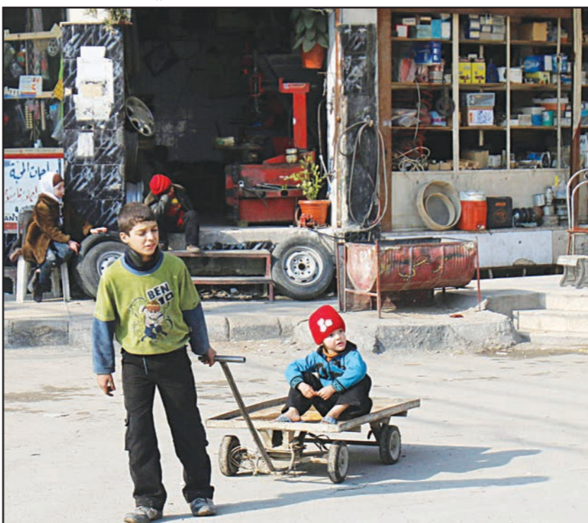
اطفال سوريون يلعبون في شوارع حلب

الطريق أبرز معبر لتهريب الأسلحة إلى التتوين وبعض السلاح. وقال المصدر «صدر قرار بمنع النقل بين بلدة عرسال وجرودها الإبتريض من مخابرات الجيش، واضاف ان الهدف من القرار ضبط حركة الإرهابيين الذين يستغلون الطريق للنقل بين البلدة وجرودها والحصول بذلك على مؤن لهم واغراض أخرى». وقال مدير المرصد السوري لحقوق الإنسان رامي عبد الرحمن ردا على سؤال لوكالة فرانس برس إن مسلحي المعارضة في المناطق الجبلية في القلمون «سيصبحون محاصرين تماما في حال تنفيذ القرار، من جهة يقطع عليهم الجيش اللبناني الطريق، ومن جهة الأخرى، هناك الجيش السوري».