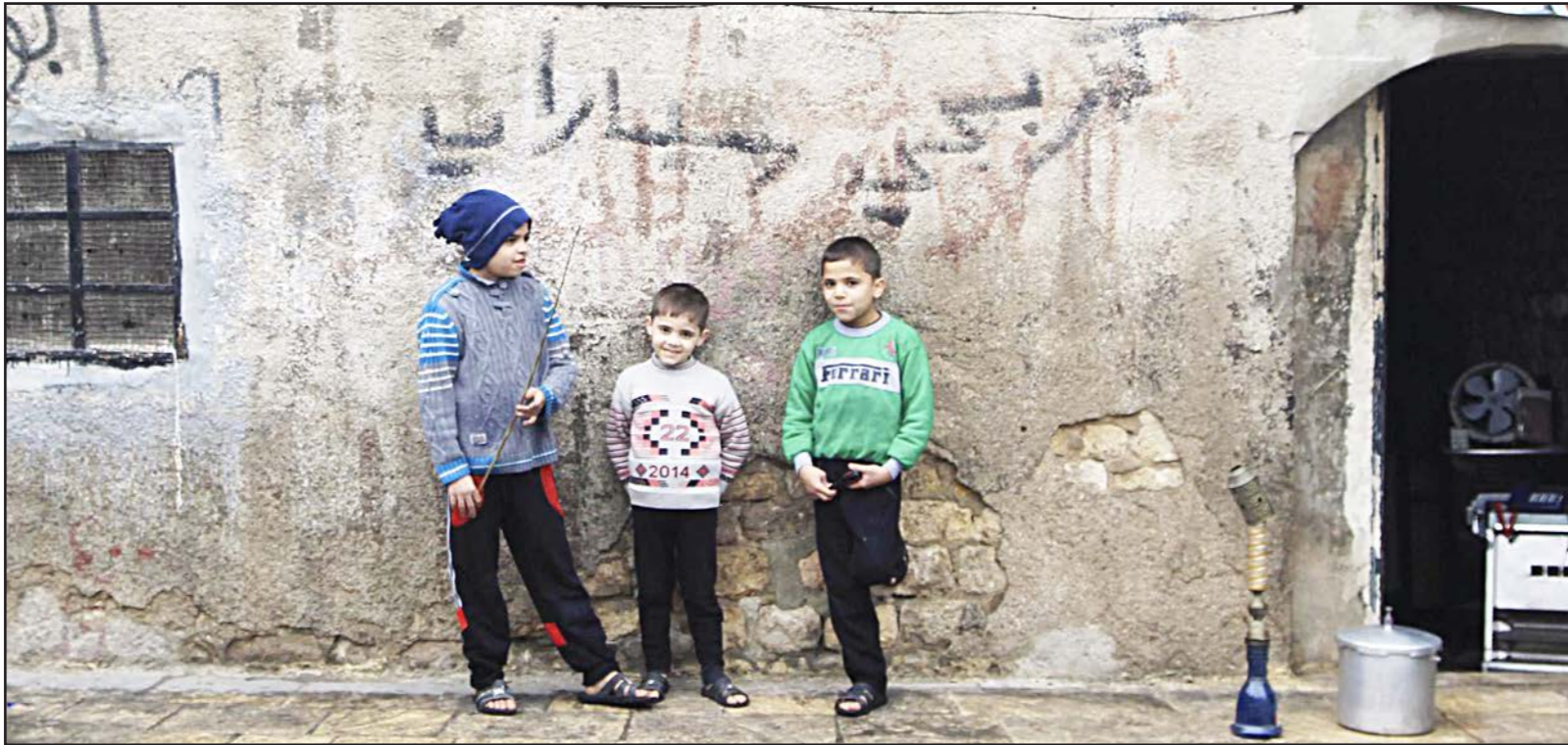
اطفال سوريون يقفون أمام حائط في مدينة حلب