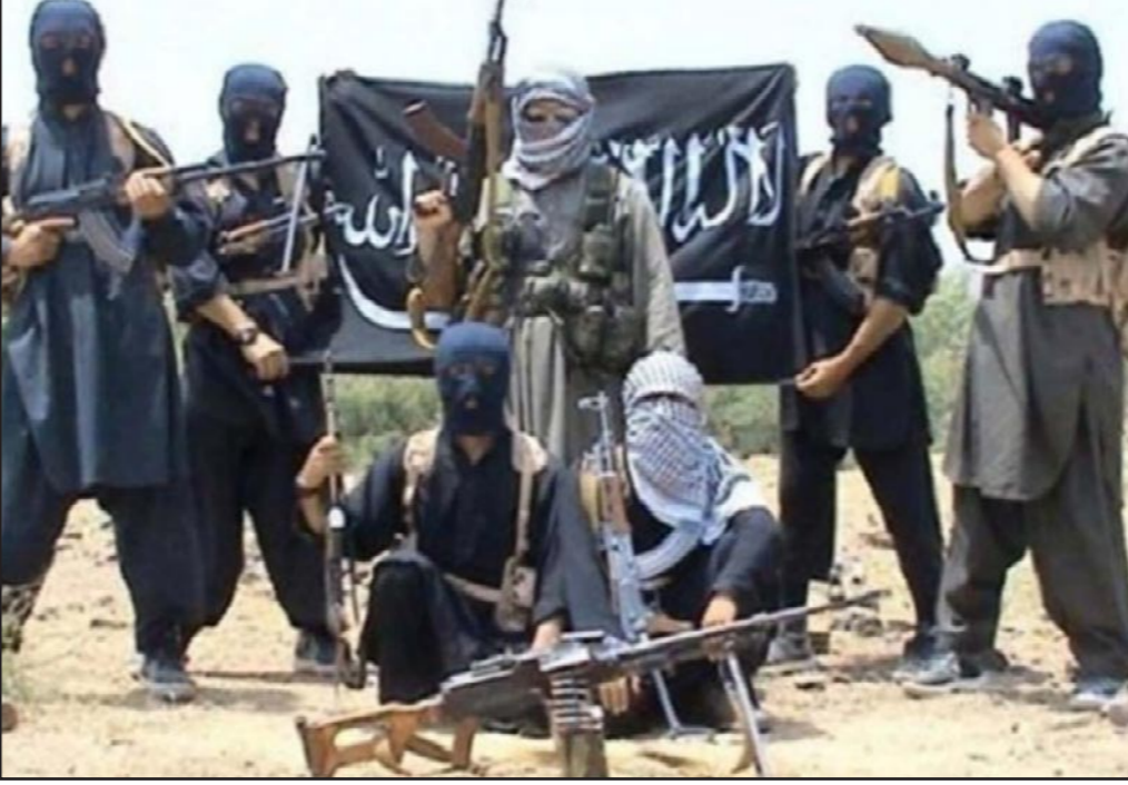
1200 مغربي التحقوا بتنظيم «داعش»

وربطت المصادر توقيف العديد من العناصر السلفية في فاس والناظور بولائها للخلية التي تم تفكيكها قبل عدة أسابيع بتنسيق مغربي إسباني، وتمكنت الشرطة القضائية المغربية والمديرية العامة لمراقبة التراب الوطني (المخابرات الداخلية) بتنسيق مع السلطات الإسبانية بآمن مدينة مليلية من إيقاف أعضاء شبكة تتكون من تسعة أشخاص تنشط بمدني الناظور ومليلية، يتبنى عضواؤها توجهات متطرفة، يقومون بتنفيذ المشتبه ضد المواطنين ويستهدفون الشباب لإقناعهم وتأمين وصولهم لبؤر التوتو في العراق وسوريا.