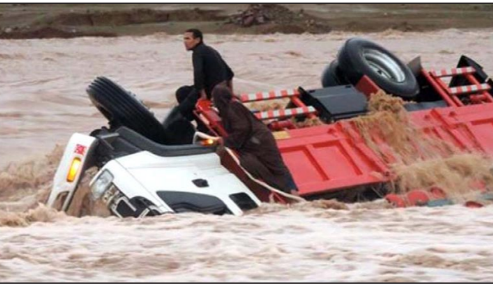
صورة أرشيفية للفيضانات والسيول جنوب المغرب