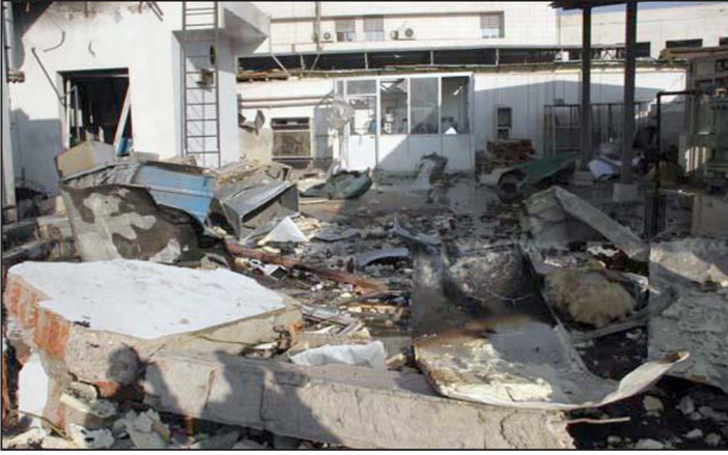
أثار الانفجار في مبنى المصل واللقاح في الدقي

أثار انفجار مبنى «المصل والملقح» في منطقة الدقي أمس الأول، الكثير من التساؤلات حول التأثير على حجم إنتاج الأدوية ولجوء مصر للاستيراد من الخارج وفتح المجال أمام احتكار ورفع أسعار الأدوية. وكشفت مصادر في إدارة الحماية المدنية أن انفجار مبنى المصل والملقح، ناتج عن انفجار خط أنابيب غاز داخل مصنع إيكاب للأدوية في المني، مما أشعل النيران في طوابق المبنى الثلاث، ووقوع عدد من الإصابات بين العاملين في المصنع. وأشارت وزارة الصحة عبر بيان رسمي صادر عنها، أمس، إلى إصابة 5 حالات تم نقل أربع مصابين إلى مستشفى العجوزة وحالتهم مستقرة، ومصاب تم تحويله من مستشفى 6 أكتوبر للأمين الصحي إلى مستشفى الحليمة العسكري، حيث يعاني من حروق شديدة وكسر في عظمة الفخذ مما أدى إلى وفاته. ومن جانبها أشارت هيئة المصل واللقاح، إلى استمرار العمل في مركز التطعيمات الرئيسي ومركز خدمات نقل الدم والعيادات وصيدلية المصل واللقاح والمركز الطبية الخدمية الأخرى بالمقر الرئيسي بالمصل واللقاح بالعجوزة ولا تأخير للحداد على سير العمل. أزمة كبيرة وقال الدكتور أحمد شوشة، عضو اللجنة العليا لثقافة الأطباء، لـ «القدس العربي»: