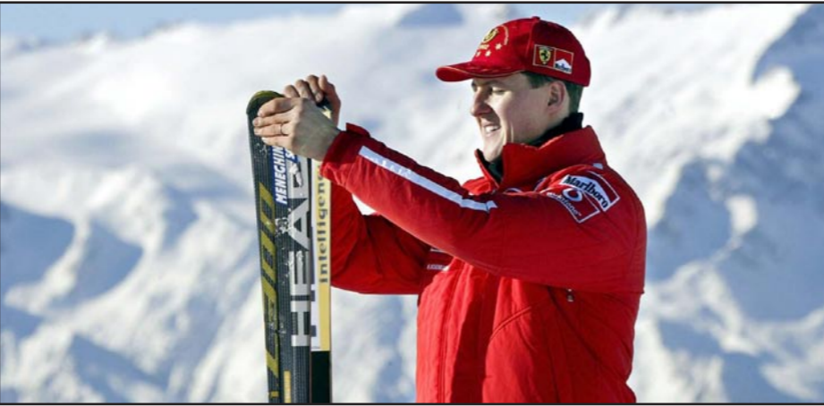
البطل السائق مايكل شوماخر متزلجاً على الجليدي في صورة قبل الحادثة

باريس - رويترز: قالت مديرة أعمال بطل فورمولا 1 السائق مايكل شوماخر الفائز باللقب العالمي سبع مرات، انه يواجه مرحلة «كفاح طويلاً» للتعافي من الحول الذكرى الأولى لحادث إصابته في مضمار تزلج على الجليد. وألقت كلمات المسؤولية سابينه كيم بظلال من الشك بعدما قال تقرير صحفي إن شوماخر يحقق تقدماً ويعرف على ما حوله، وقالت كيم: «نحتاج لوقت طويل، سيكون وقتاً طويلاً وكفاحاً شاقاً». انه يحقق تقدماً يائث خطورة الحالة»، وتعرض شوماخر لإصابات خطيرة في الراس في حادث تزلج بجبال الألب الفرنسية في 29 ديسمبر/ كانون الأول 2013. واتفق البطل السابق من غيبوبة في يونيو/ حزيران وغادر المستشفى في سبتمبر/ أيلول. وقال فليب شتريف وهو سائق فورمولا 1 سابق، إن