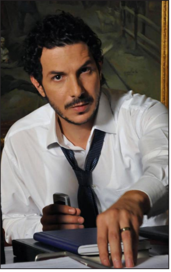
الممثل السوري باسل خياط

وتتعلق أحداث المرحلة الثانية بعد 15 عاماً، حين يكبر الأولاد ويتضح كيف انعكست حياتهم الماضية على حالتهم النفسية بعدما كبروا، وتبدوا مشاكلهم تشغل مجدداً حياة والدتهم «غادة»، وتبرز الأحداث قصة كل من «ناديم» الشاب المرتبط عاطفياً بفتاة، لكنه اضطر لمغادرة البلاد من أجل استكمال اختصاصه، و«نانا» التي تشعر بحب «الدكتور أحمد» (طوني عيسى) لها، لكنها تميل إلى «نبيل» (محمد عامر) فتتزوج منه، قبل أن تتكشف خيانتها مع أقرب صديقاتها، بالإضافة إلى «سارة» (سارة أبي كنعان) التي تعمل في دول نائية، وتعود إلى أرض الوطن حينما تتكشف إصابتها بمرض عضال، ثم «جود» الفتاة الجامعية التي تعيش قصص حب مضطربة، قبل أن تقع في غرام «وسام»، الشاب المصري الطموح (هيثم سعيد). يشهد العمل تطورات عديدة، ويطرح أسئلة كثيرة عن صير الأبطال وأقدارهم، منها ما يتعلق بجياة «نبيلة» (غادة)، قبل أن تعترف أخيراً بحبها لـ«عادل»، وهل تقنع «جيهان» أن الحب لا يعترف بالطبعية؟ وكيف ستجد «أمل» نتيجة ضحيحتها لزوجها وحب حياتها؟ وكيف سيكون انعكاس ماضي الجيل الجديد على حاضره ومستقبله؟