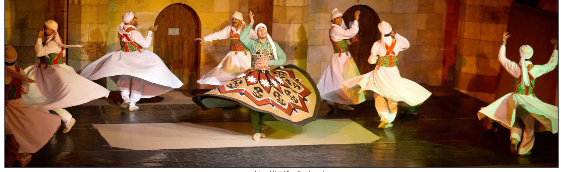
استعراض لأحد الفرق الشعبية في مصر