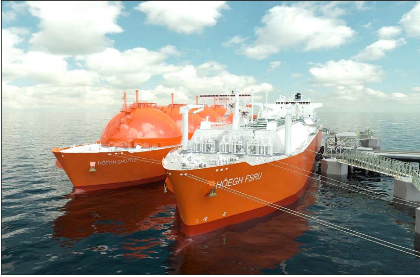
سفينتان تابعتان لشركة «هوغ» احدهما (يسار) ناقلة الى الغاز المسال والأخرى لاعادته الى غاز سائل

القاهرة - وكالات الأنباء: توجه وزير البترول المصري، شريف إسماعيل، إلى الجزائر أمس الاثنين في زيارة تستغرق يومين لتوقيع اتفاق تستورد مصر بموجب ست شحنات من الغاز المسال الجزائري خلال عام 2015. وقال مصدر في الوزارة، طلب عدم الكشف عن اسمه، إن الوزير سيتفاوض أيضا على استيراد شحنات جديدة تصل على مدى عامين بعد 2015. وفي وقت سابق من هذا الشهر أعلنت وزارة البترول أنها اتفقت على استيراد ست شحنات من الغاز المسال الجزائري، حجم كل منها 145 ألف متر مكعب، خلال الفترة من أبريل/نيسان وحتى سبتمبر/أيلول 2015 بعمولة شركة شوبريا. وقال مسؤول في الوفد المرافق للوزير إن الزيارة تهدف للتفاوض على أسعار توريد الغاز التي ستخفض عن ذي قبل بعد انخفاض أسعار النفط في العالم، بنحو 50 في المئة منذ يونيو/حزيران. وبإمكان مصر تصدير الغاز الطبيعي المسال، ولكن لا يمكنها استيراده دون تشغيل محطة إعادة تغويز (أي إعادة الغاز المسال إلى حالته الغازية). وفي نوفمبر/تشرين الثاني قالت شركة «هوغ» النرويجية إنها وقعت عقدا مدته خمس سنوات مع الشركة القابضة للغازات الطبيعية (إيغاس) لتزويدها بأول محطة عائمة لاستقبال شحنات الغاز المسال وتحويله إلى غاز طبيعي وذلك في نهاية الربع الأول من 2015. كما تعد مصر حاليا مناقصة لاستئجار محطة عائمة ثانية لإعادة لتغويز من أجل تسهيل استيراد الغاز الطبيعي المسال.