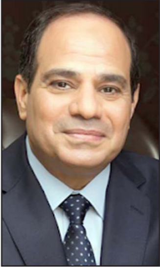
الرئيس المصري عبد الفتاح السيسي

خلفية الحرب في سوريا (هناك نقلت حماس تاييدها من نظام الاسد إلى المعارضة السنية، بسبب تماثلها مع بزال اليس هناك لهذا التقرير تأكيد من مصادر تعتبر علمية، ويحتمل أيضا أن يكون المصريون والقطريون قد توصلوا إلى تسوية أخرى، بموجبها يُنقل المال القطري والوقود التي تسعى قطر إلى توريده بالجمان لحماس في قطاع غزة بالاتفاق مع مصر. لاخوة التي يادرت اليها السعودية على ما يبدو هدف آخر، يتجاوز تعزيز الكتلة السنية المعتدلة في العالم العربي بقيادة سعودية ومصرية، ففي الشهرين الاخيرين طرأ تقرب هام بين حماس وإيران، بعد سحب استمرار سنتين على