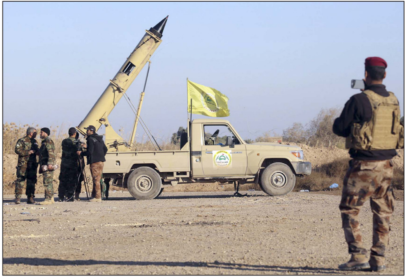
جنود عراقيون يصوبون صاروخا تجاه مقاتلي «تنظيم الدولة»