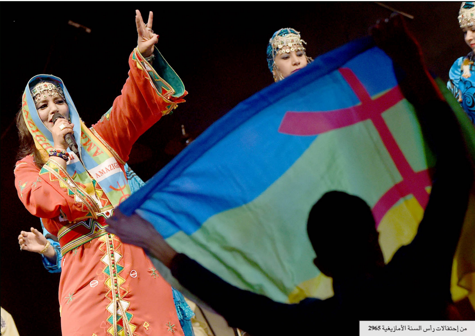
من احتفالات رأس السنة الأمازيغية 2965

■ الجزائر- عبدالرزاق بين عبدالله: أحيا الجزائريون هذا العام احتفالات رأس السنة الأمازيغية 2965، الذي يصادف الـ12 كانون الثاني/يناير من كل عام، في الجزائر، وسط جدل حول صمت الحكومة بشأن طلب قدمته جبهة القوى الاشتراكية، وهي أقدم حزب معارض في البلاد، لترسيم المناسبة كعيد وطني وعطلة في مؤسسات الدولة.