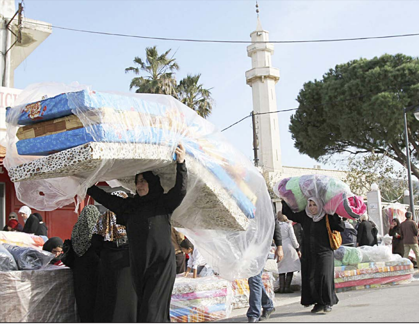
لاجئون سوريون يتلقون مساعدات من وكالة غوث للاجئين في منطقة البترون شمال لبنان