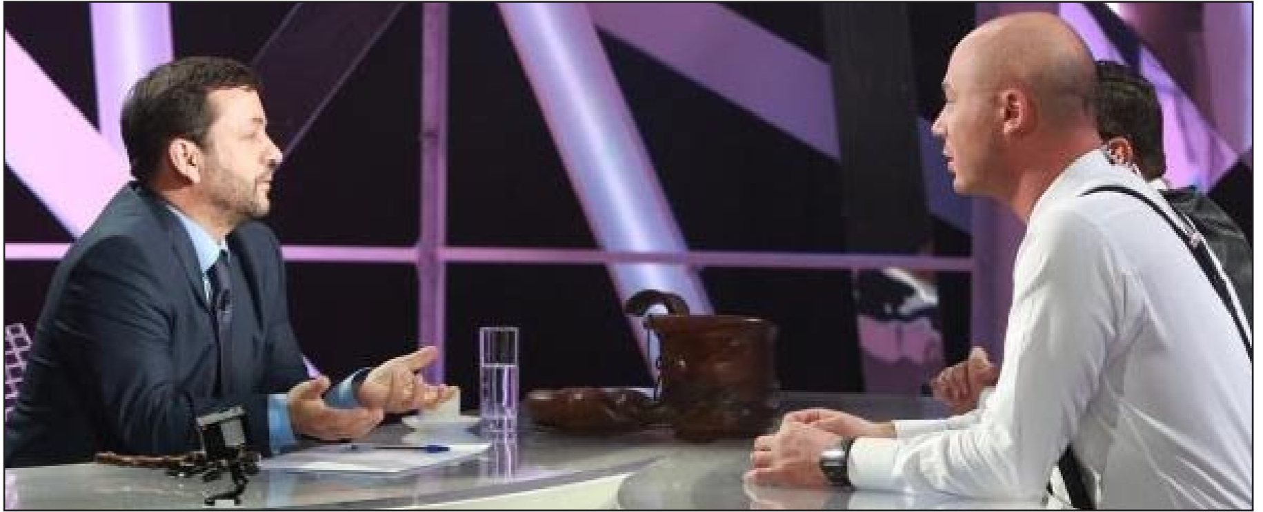
بيروت - القدس العربي