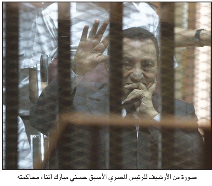
صورة من الأرشيف للرئيس المصري الأسبق حسني مبارك أثناء محاكمته

كلامه إلى الشيخ يونس مخيون رئيس حزب «النور»، «ممكن تتضمم للحزب بتاعنا وتبقى نائب لرئيس الحزب»، فرد عليه مخيون قائلا: «بل عليك انت ان تربي ذلك وتضمم لحزب النور»، وحسب مصادر حذرت الاجتماع، فإن السياسي ما يعلق على طلبات من بعض الأحزاب بلح حزب النور على أساس أنه «حزب ديني»، كما أنه لم يعلق عندما رد مخيون عليهم بأن حزب النور «حزب سياسي ذو مرجعية دينية، ومفتوح لكل المصريين» واعتبر مراقبون أن مشاركة «النور» في الانتخابات تعني قبول الدولة بمبدأ وجود أحزاب ذات مرجعية دينية، ما يفتح الباب أمام مشاركة أحزاب إسلامية متحالفة أو متعاطفة مع جماعة الإخوان مثل أحزاب الواسط والوطن والاستقلال وغيرها. (تواصل ص3)