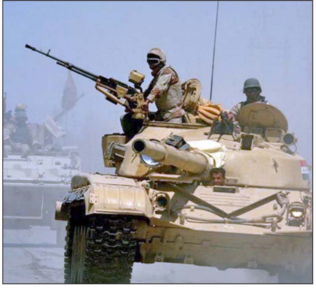
قوات عراقية تشارك في معارك في الأنبار

المكون الذي ينتمي إليه، لذا اتفق الطرفان على منع أية عمليات انتقامية عشائرية يمكن أن تحدث أثناء عمليات تحرير المدن من تنظيم «الدولة» أو بعدها. وفي ناحية جرف الصخر شمال بابل عبر الأهالي عن مخاوفهم من تعرض مناطقهم إلى تغيير سكاني عقب تحريرها من سيطرة تنظيم الدولة مؤخرا. وجاء ذلك خلال اجتماع عقده وفد لممثلين عن أهالي المنطقة برفقة مدير الناحية مع نائب رئيس الجمهورية أسامة النجيفي، والذين حضروا معاينة أهالي جرف الصخر والظروف النفسية والاجتماعية والمعيشية التي يعانيها بسبب النزوح الإجباري الذي طال مواطني الناحية، مشددين على أن أهالي الناحية ضد تنظيم «الدولة». وأوضح الوفد أن «السياسات الطائفية ومحاولات التغيير السكاني كانت السبب في إخلاء أجزاء كبيرة من منطقة جرف الصخر، مما سهل على قوى الإرهاب دخول الناحية». وأكد الوفد أن أهالي جرف الصخر دفعوا ثمنا باهظا تضمنت تشريدهم وهم منازلهم وتدمير مزارعهم ومطاردة أبنائهم حتى تم القضاء على «داعش»، ولكن الشكيلة لم تنته، فلا يزال مواطنو الناحية لا يستطيعون العودة إليها لأسباب تتعلق الكثير من الشكوك حول