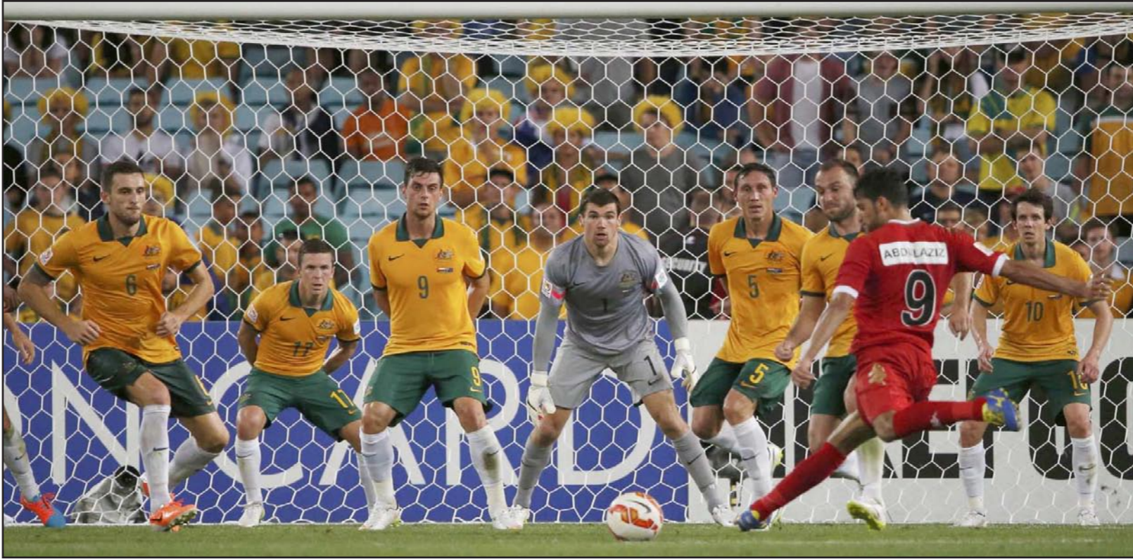
العماني المقيبالي يسدد كرة من ركلة حرة مباشرة في مواجهة حائط بشري استرالي

بالتساوي مع كوريا الجنوبية التي فازت على المنتخبين العربيين نفسهما، لكن أصحاب الأرض لديهم فارق أهداف كبير مقارنة بالمنتخب الكوري ما يضمن لهم الصدارة حالياً، فيما يقع المنتخبان الكويتي والعماني في المركزين الثالث والرابع على الترتيب بالمجموعة الأولى بلا رصيد من النقاط، وكانت عمان خسرت مباراتها الافتتاحية بهدف نظيف أمام كوريا الجنوبية بينما افتتحت أستراليا منافسات البطولة بالفوز 1/4 على كوريا. وودع المنتخب الكويتي منافسات البطولة بتعرضه لهزيمة الثانية على التوالي بالمجموعة