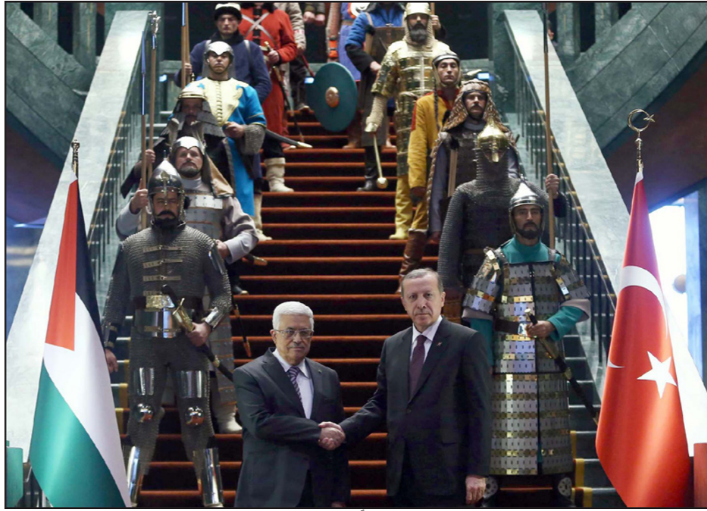
رئيس الوزراء التركي رجب طيب أردوغان مستقبلاً الرئيس الفلسطيني محمود عباس في أنقرة الإثنين

وبينما نشر جبهاد أردوغان الصورة على حسابه في تويتر، وذلك على «لولاك لما كنا»، في إشارة إلى اعتزازه