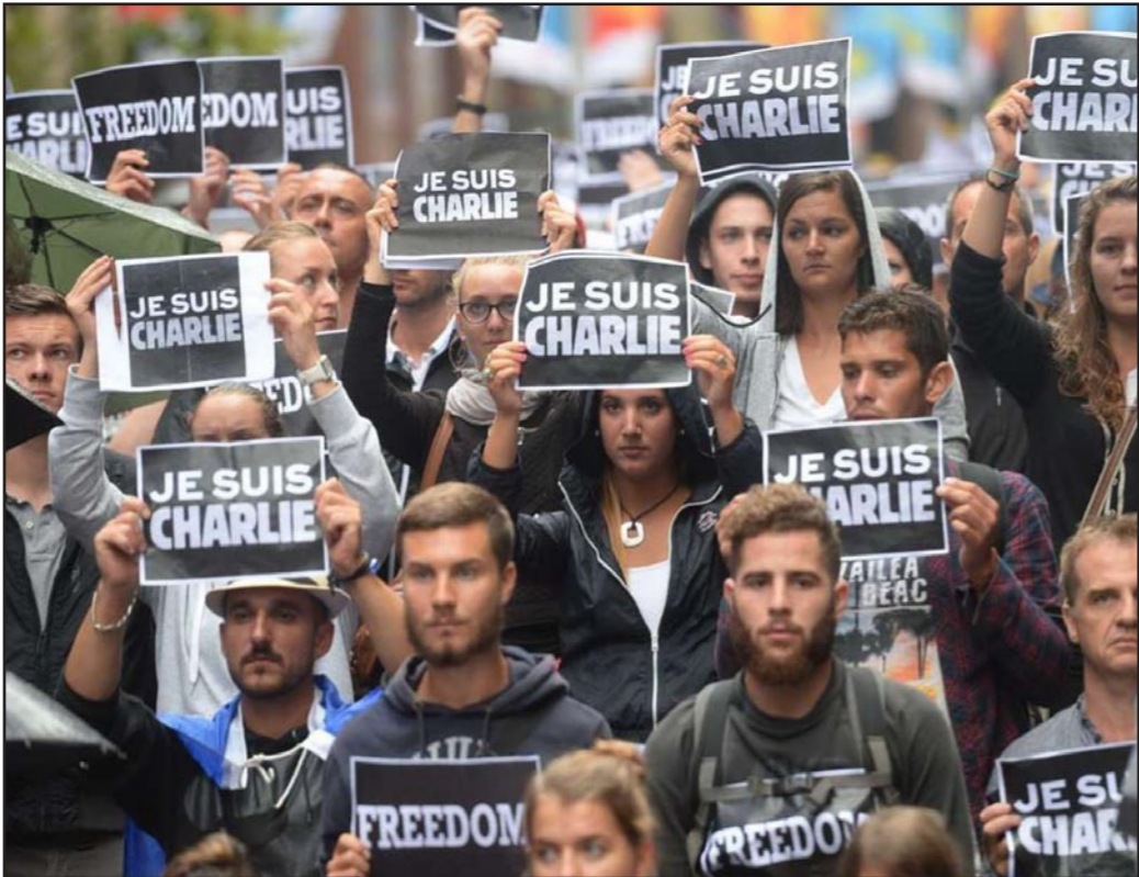
مظاهرات فرنسيون يرفعون لافتات تضامناً مع ضحايا صحيفة شارلي ابدو

ويرتبط بمشكلات الجهادية في أوروبا كيفية منع الشبان من السفر إلى محاور الحرب في العالم الإسلامي. فحياة بومدين استطاعت حسب بعض التقارير الوصول إلى سوريا. ورغم الجهود التي بذلتها الدول الأوروبية وغيرها لمنع أبنائها من السفر إلى سوريا عبر تصميم بناء برنامج عمل الكيبوتر للاحققة من يسافر إلا أن الوجهة مستمرة.