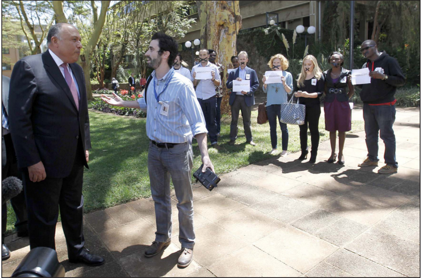
صحافيون أثناء وقفة احتجاجية أمام وزير الخارجية المصري سامح شكري في نيروبي أمس للمطالبة بالإفراج عن صحافيي «الجزيرة» في مصر

وأكدت الرسالة «أنه في الجانب العقائدي التزم الإخوان بما جاء في القرآن الكريم والسنة من أن أهل الكتاب أرسل الله لهم سيدنا عيسى - عليه السلام- نبيا وأرسلا وأنزل معه الإنجيل، وهم أقرب للمسلمين من الذين أشد الناس لتجنّب أشد الناس عداوة للذين آمنوا اليهود والذين أشركوا ولتجنّب أقربهم مودة للذين آمنوا الذين قالوا إنا نصارى لك ذلك بأنهم قسيسين وربّحاناً وأنهم لا يشكركون» (المائدة: 82)، وهذا هو مفهوم العام والذي تربي عليه الإخوان وهو