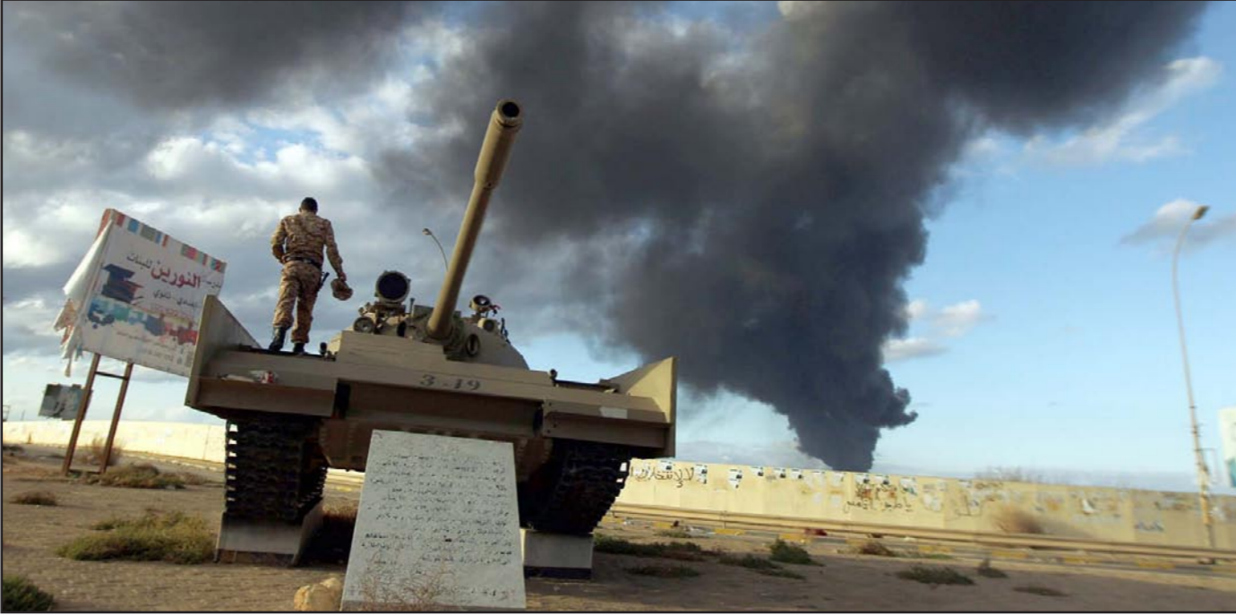
الدخان يتصاعد من أحد البنايات جراء الاشتباكات في بنغازي

هنة، وادريس عبد الله، التقوا في تونس (العاصمة) قبل مغادرتهم إلى جنيف، لجنة من الأمم المتحدة مكلفة بمتابعة أعمال رئيس البعثة الأممية في ليبيا برناردينو ليون، دون أن يذكر تفاصيل عن ما دار في اللقاء. وردا على ما تردد عن اعتراض عدد من نواب المجلس على سفر الوفد إلى باريس، قال الجراي: «الوفد مكلف من رئاسة مجلس النواب بشكل رسمي والتصريحات التي صدرت عن بعض النواب تمثل آراءهم الشخصية فقط ولا تمثل مجلس النواب بكامله». وتابع: «المجلس سيصدر بيانا اليوم لإيضاح الملبسات حول سفر الوفد إلى جنيف التي جاءت في إطار دعم جهود بعثة الأمم المتحدة في ليبيا، من أجل إنهاء الأزمة على أسس وشروط حددها المجلس مسبقا». وفي وقت سابق، قال فرج بوهاشم، المتحدث باسم مجلس النواب في لقاء تلفزيوني، مساء الاثنين: «ما كان على الوفد أن يوافق على حوار خارج ليبيا دون الرجوع للنواب الذين يحضرون غالبيتهم إن يكون الحوار داخل ليبيا كما أن الوفد غير مخلول باتخاذ أي موقف أو الموافقة على أي رأي في الجلسات دون الرجوع إلى النواب». في المقابل، تحفظ المؤتمر الوطني العام (البرلمان السابق الذي عاود عقد جلساته مؤخرا بطرابلس) على اختيار جنيف مكانا للحوار، من قبل البعثة الأممية. وقال صالح الحزوم، النائب الثاني لرئيس المؤتمر الوطني العام، في مؤتمر صحفي أمس الاثنين، إن البعثة الأممية تسرعت في الإعلان عن مكان الحوار ودعوة الأطراف له، من دون الرجوع إلى المؤتمر الوطني العام كونه طرفا، في هذه العملية. وأفاد بأن «المؤتمر أجازت بيت في الإعلان عن موقفه تجاه إعلان البعثة الأممية إلى