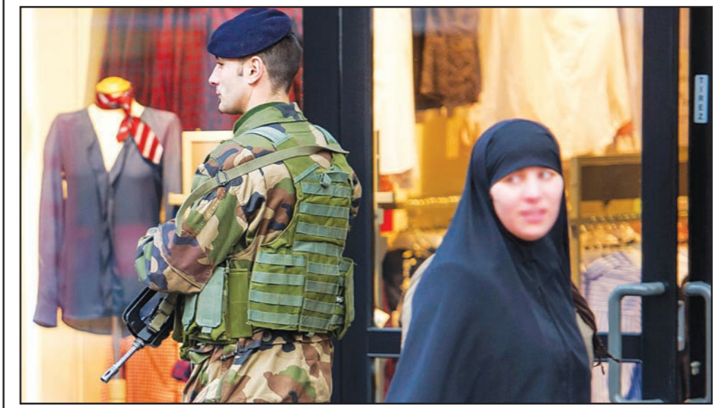
محبية تمشي قرب جندي فرنسي أمس في مدينة روبيكس حيث تتواجد جاليان كثيرين من اليهود والسلمين

باريس - أف ب: اعتبرت مؤسسات إسلامية أن مجلة «شارلي إيبدو» الفرنسية تتحدى مشاعر المسلمين بنشرها اليوم رسماً كاريكاتورياً آخر للنبي محمد (ص)، يخشى من أن يزيد من حدة الاحتقان في فرنسا وخارجها. وعلى الصفحة الأولى للمعدد الذي أعده «التاجون» من فريق تحرير «شارلي إيبدو»، ويصدر اليوم، يظهر النبي محمد (ص) بلباس أبيض يذرف دموعاً حاملاً يافطة كتب عليها: «أنا شارلي» شعار ملايين المظاهرين الذين نزلوا إلى الشوارع في فرنسا والخارج للتنديد بالهجوم على الصحيفة الذي وقع في 12 شباط في 7 كانون الثاني/يناير الجاري. وكتب على أعلى الرسم بالعبارة العريضة «كل شيء مغفور».