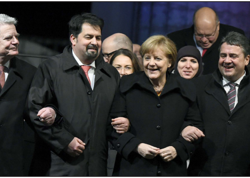
المشاركة الألمانية أنغلا ميركل تتقدم في مظاهرة في برلين امس للتنديد بظاهرة الإسلاموفوبيا

■ برلين - أ ف ب: شارك الآف الأشخاص مساء الثلاثاء في مظاهرة جرت في برلين تنديداً بالإسلاموفوبيا، والهجوم على صحيفة شارلي إيبدو الفرنسية في باريس، وذلك بدعوة من منظمات مسلمة وبحضور المستشارة الألمانية أنغلا ميركل.