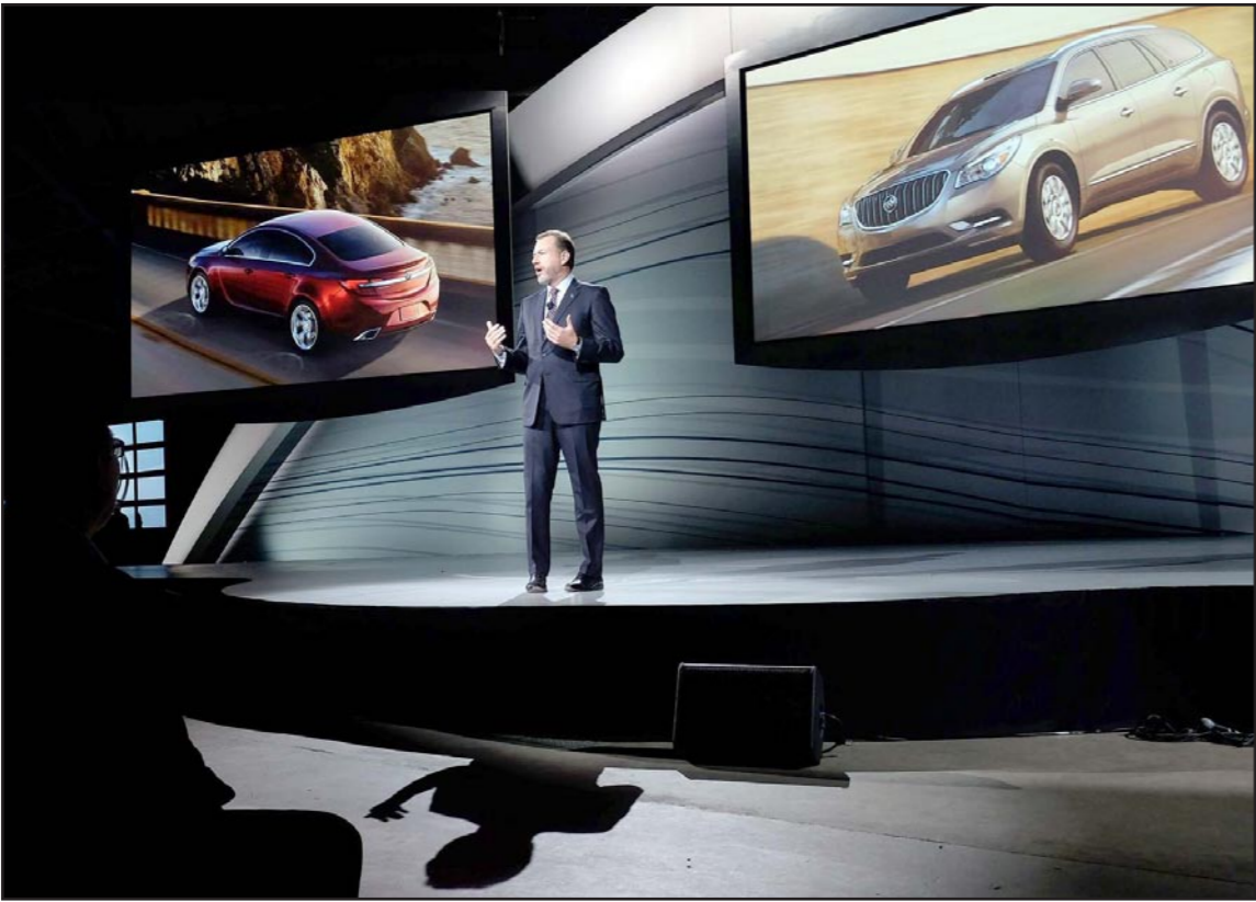
دان أمان، رئيس شركة «جنرال موتورز» يقدم في المعرض سيارة «بويك» الجديدة

السيارات الأمريكية على 7.5 مليون سيارة، والسيارات الآسيوية على رقم مماثل في حين كان نصيب السيارات الأوروبية حوالي 1.5 مليون سيارة فقط. وكشفت مجموعة «جنرال موتورز» الأمريكية العملاقة عن نموذج اختياري جديد لسيارة كهربائية، مؤكدة أنها ستكون منخفضة الثمن وبعبءة المدى. وحمل النموذج الجديد اسم «بولت2016». وحسب الشركة المنتجة فإن السيارة الجديدة ستكون قادرة على قطع 322 كيلومترا قبل الحاجة إلى إعادة شحن بطاريتها، وسيكون سعرها 30 ألف دولار، وهو ما وصفته ماري بارا الرئيسة التنفيذية للمجموعة الأمريكية بأنه «تغيير حقيقي للعبة» في إشارة إلى أسعار ومدى السيارات الكهربائية حالياً. وقالت بارا أمام حشد يضم أكثر من 2000 صحفي ومسؤول في صناعة السيارات على هامش المعرض «هذه حقيقة سيارة كهربائية للجميع»، وأضافت أن السيارة لا تلتبي فقط معايير العوادم في ولاية كاليفورنيا وإنما أيضاً معايير أي مكان في العالم وهي ليست مجرد «تجربة معملية». وقال جون كافارو مدير قطاع سيارات الركوب في وحدة شيفورليه التابعة لمجموعة جنرال موتورز إنه تم إعادة تصميم السيارة فولت لإضفاء المزيد من الطابع الرياضي عليها. في الوقت نفسه فقدت شركة صناعة السيارات