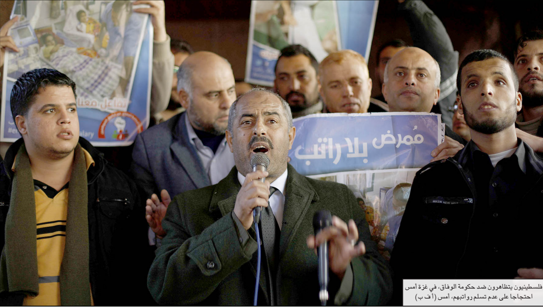
فلسطينيون يتظاهرون ضد حكومة الوفاق، في غزة أمس احتجاجاً على عدم تسلم رواتبهم، أمس