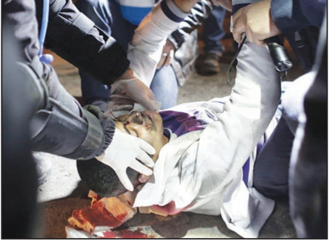
فلسطيني صدمته سيارة إسرائيلية أثناء مشاركته باحتجاجات في بلدة رهط