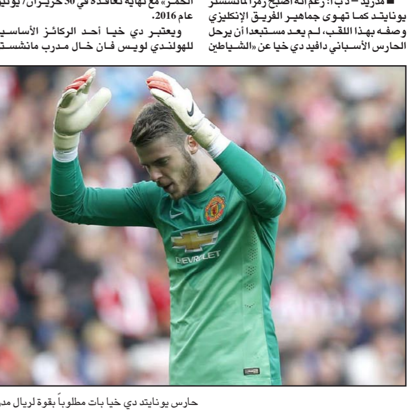
حارس يونايتد دي خيا بات مطلوباً بقوة لريال مدريد

■ مدريد - د ب أ: رغم أنه أصبح رمزاً لمانشستر يونايتد كما تهوى جماهير الفريق الإنكليزي وصفه بهذا اللقب، لم يعد مستبعداً أن يرحل الحارس الأسباني دافيد دي خيا عن «الشياطين» إلى ريال مدريد. فقد أصبح حارس أثلتيكو مدريد السابق أحد الطول السحرية بتصدياته الرائعة لترجيح كفة فريقه في كثير من المباريات التي يغيب عنه التوفيق فيها. وتكررت صحيفة «ماركا» الإسبانية حيث أن ما أشيع عن قيام مانشستر يونايتد بتقديم عرض ثمانية ملايين يورو للاعب مقابل التجديد لا يحمل صفة الجدية حتى هذه اللحظة، كما أن مقايضته بالويلزي غاريث بيل نجم الريال بالإضافة إلى حصول النادي الملكي على 65 مليون يورو أمر لم يحسم بعد أيضاً. ورغم إبداء الريال رغبة حقيقية في الحصول على خدمات الحارس الذي يعد اللاعب الوحيد في الدوري الإنكليزي الذي شارك في جميع مباريات فريقه في الموسم الجاري حتى الدقيقة الأخيرة، أكد جورج مينديز وكيل أعمال دي خيا أن الحارس الأفضل في العالم، على حد قوله، ما زال ينتظر عرضاً للتجديد من إدارة مانشستر يونايتد. ويعبدا عن حاجة الريال لحارس من العيار الثقيل مثل دي خيا، لا ينوي فلورنتينو بيريز رئيس النادي إشعال أزمة في مركز حراسة المرمى، حيث أن عودة كاسياس لمستواه الغت فكرة الاستعانة بخدمات حارس جديد في الوقت الحالي، إلا أن هذا لا يعني أن الفريق الملكي تخلى عن وضع تدعيم هذا المركز الدقيق على المدى القصير نصب عينيه، فقد بدأ أن الموسم الماضي هو آخر أيام كاسياس بالقبض المردي قبل أن يقرر الاستمرار حتى نهاية التعاقد في 2018.