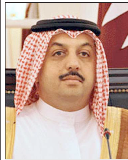
الدكتور خالد بن محمد العطية وزير الخارجية القطري

«الدوحة - «القدس العربي» من سليمان حاج إبراهيم: التقى الدكتور خالد بن محمد العطية وزير الخارجية القطري السيد مولود جاوش أوغلو وزير خارجية جمهورية تركيا والوفد المرافق الذي يزور الدوحة حالياً. وكرت وكالة الأنباء القطرية الرسمية أنه جرى خلال المقابلة استعراض سبل تعزيز وتطوير العلاقات الثنائية بين البلدين، كما تم بحث عدد من المواضيع ذات الاهتمام المشترك. ويأتي اللقاء توازياً مع أبناء عن وساطة تقوم بها قطر في ليبيا لإيجاد تسوية في البلاد على ضوء اختلاف وجهات النظر بين مختلف القوى الفاعلة. وكشفت مصادر دبلوماسية أن الدوحة بنشرت جهودها للوساطة بين الفقاء الليبيين من أجل إعادة الاستقرار في البلاد من خلال فعمل مسار حوار سياسي جاد ينظر إلى مستقبل ليبيا المستقرة من دون أية حسابات ضيقة. وقال السفير الليبي في الدوحة عبد المنصف البوري في تصريح له نقلته «العرب» القطرية أن الجهود التي تبذلها دولة قطر في لم شمل الفقاء الليبيين تسمى لإعادة الاستقرار للبلاد.