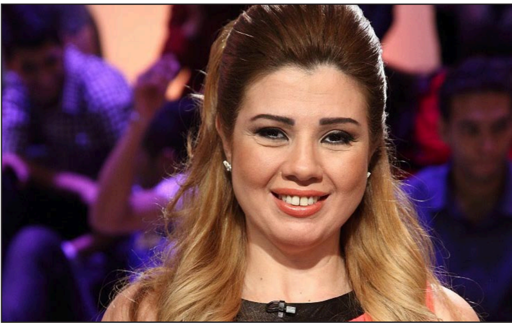
رائيا فريد شوقي