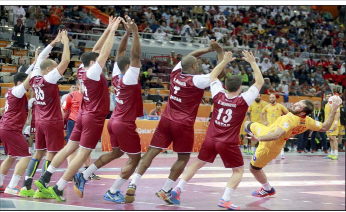
الاسباني كانابليس يحاول التسديد على المرعي القطري في مواجهة حائض صد بشري

الوثة - د ب أ: يصطدم المنتخب المصري بنظيره السويدي الفائز بلقب كأس العالم لكرة اليد أربع مرات في مواجهة شرسة اليوم ضمن الجولة الرابعة من مباريات المجموعة الثالثة لوندنيل قطر.