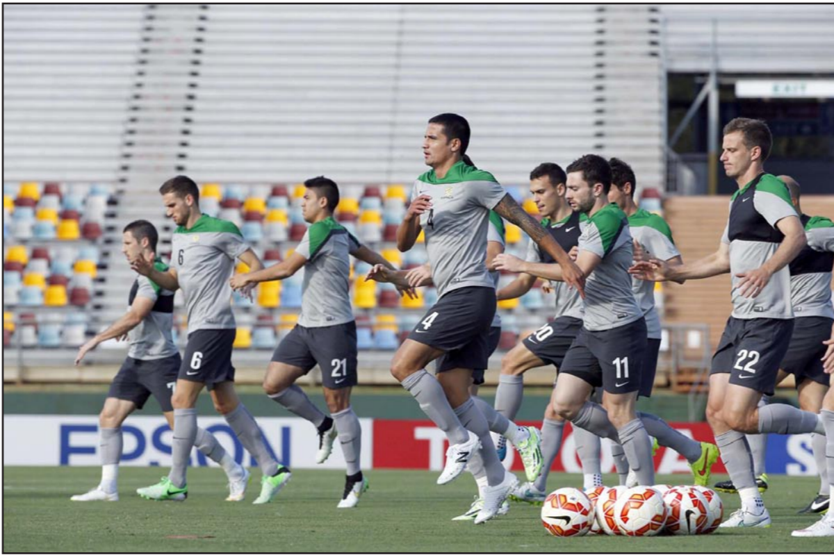
نجوم المنتخب الاسترالي يخوضون الحصة التدريبية الاخيرة قبل لقاء الصين

سيدني - د ب أ: يتوقع مشاركة قائد المنتخب الأسترالي ماييل جديناك في مباراة يومه في اليوم من برينزين أمام نظيره الصيني ضمن منافسات دور الثمانية لكأس آسيا بعد تعافيه من الإصابة. وكان جديناك أصيب بالتهاب في كاحله الأيسر خلال المباراة الافتتاحية للبطولة الآسيوية التي جمعت البلد المضيف استراليا بمنتخب الكويت، ما أبعد عن مباريات استراليا اللتين بالمجموعة الأولى، لكن لاعب كريستال بالاس الإنجليزي (30 عاما) استأنف تدريباته مع منتخب بلاده حيث يسعى للاستعداد لياقته البدنية بشكل كامل قبل مباراة اليوم.