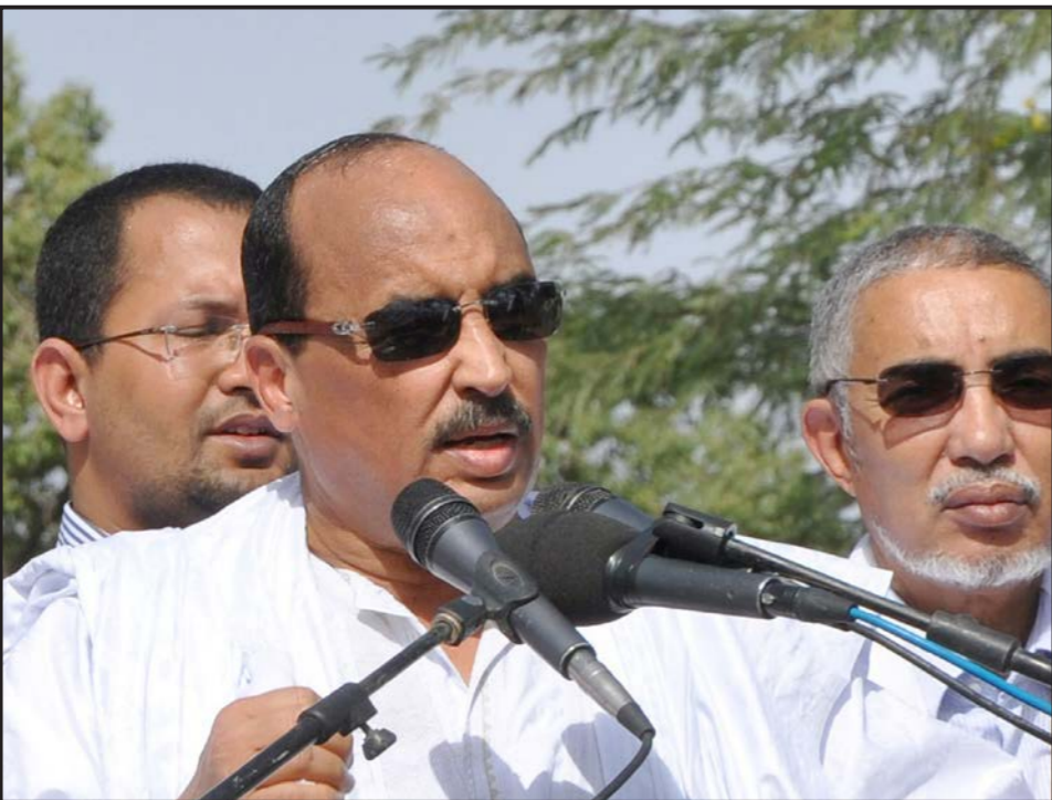
الرئيس الموريتاني محمد ولد عبدالعزيز

وتقدمت موريتانيا خلال الجولة الأخيرة من المفاوضات بشروط جديدة لتشريكها الأوروبي منها التماس زيادة المداخل المالية، والاستمرار في منع صيد سمك الأخطبوط على سفن السوق الأوروبي، فيما تقدم الجانب الأوروبي بطلبات تخص توسيع مساحة الصيد، والحصول على فرص تقضيلية تتعلق بصيد عبتان من الأسماك بينها الأخطبوط. وكان الرئيس الموريتاني محمد ولد عبدالعزيز قد أعلن في تصريحات أخيرة له «أن حكومته عززت المكاسب التي يحصل عليها الطرف الموريتاني من الطرف الأوروبي، كما رسخت ضوابط المحافظة على الثروة السمكية لموريتانيا، حيث تمنع الاتفاقية ولأول مرة الأساطيل الأوروبية من صيد الأخطبوط، كما تبعد الأساطيل الصناعية عن المناطق الحساسة التي تتكاثر فيها الأسماك وعن المحميات الطبيعية القريبة من السواحل الموريتانية». وتلزم الاتفاقية الحسنة لصالح موريتانيا الطرف الأوروبي بتخصيص نسبة 60% من أطقم السفن العاملة في مجال الصيد للعمال الموريتانية، وبالتنازل عن 2 من الكميات المصطادة للطرف الموريتاني ليعيها بأسعار مخفضة في الأحياء الشعبية وفي المناطق الداخلية بالبلاد. ونصت الاتفاقية أيضا على الزامية تفرغ سفن صيد القاع في موانئ مدينة نواذيبو شمال موريتانيا، لتتمكن الرقابة الحقيقية والفاعلة على النوعيات والكميات المصطادة داخل الموانئ الموريتانية. ويعتبر الاتحاد الأوروبي أهم شريك موريتانيا في مجال الصيد، حيث تربطه مع موريتانيا اتفاقية صيد منذ العام 1987.