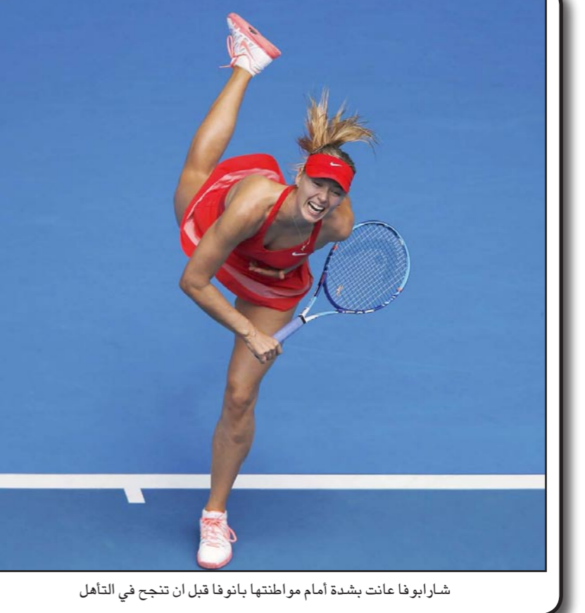
شارابوفا عانت بشدة أمام مواطنها بانوفا قبل أن تنجح في التأهل

سبيرينا ووليامز بناء على نتائج اللاعبين خلال أسبوعي ميلبورن بارك، تجد نفسها خارج منافسات البطولة الأسترالية قبل أن تستعيد توازنهما متأخرا أمام منافستها المصنفة 150 على العالم.