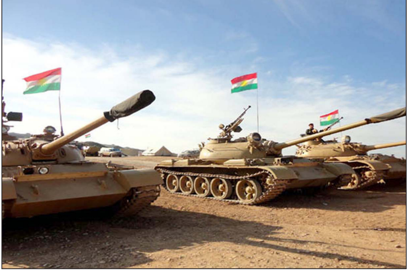
قوات من البيشمركة تستعد لشن هجوم على مواقع تنظيم الدولة بالقرب من الموصل

وخسائر اقتصادية تقدر بنحو تريليون دولار. وتسود علاقات وثيقة بين البلدين منذ إسقاط نظام الرئيس العراقي السابق صدام حسين في 2003 على يد قوات دولية بقيادة أمريكا، وتقود العراق حالياً، حكومة ذات غالبية شيعية مقربة من طهران. وقال مصدر في وزارة حقوق الإنسان العراقية إن عمليات استخراج الرفات تتواصل من خلال فريق عمل مشترك بين الجانبين العراقي والإيراني وفق اتفاق مبرم بين الطرفين. وأشار إلى أن الجانب العراقي يواصل البحث على المقابر التي تضم رفات ضحايا الحرب في محافظات جنوب البلاد، لأنها كانت مسرحاً للمعارك العنيفة على مدى سنوات. وأفاد المصدر بأن الجانب الإيراني يتولى بدوره التقصي عن رفات الجنود العراقيين في أراضيهم. وأضاف المصدر أن العراق يبحث عن نحو 5 ألف مفقود عراقي في الحرب، بينما يقول الجانب الإيراني إن 30 ألف من رعاياها مفقودين في الحرب.