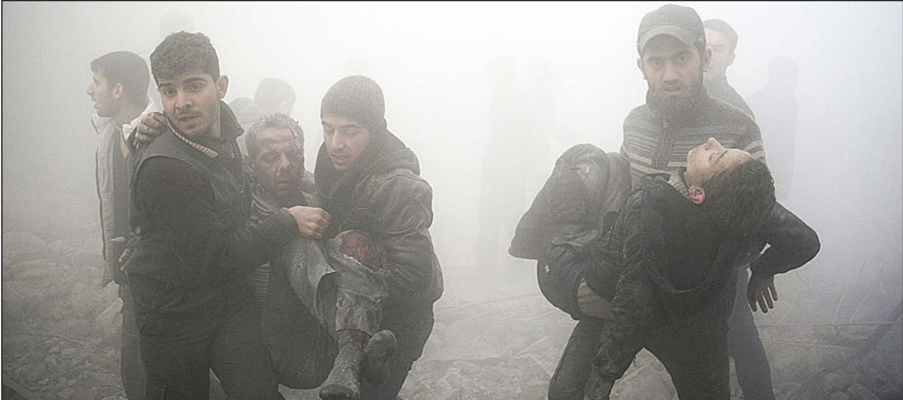
مسعفون سوريون يقومون بإجلاء مصابين جراء قصف قوات النظام في منطقة دوما قرب دمشق

■ عواصم – وكالات: أفاد المرصد السوري لحقوق الإنسان بمقتل سبعة مواطنين وإصابة ما لا يقل عن 25 آخرين بجروح جراء انفجار سيارة مفخخة في منطقة عكرمة التي يقطنها غالبية من المواطنين من الطائفة العلوية في محافظة حمص .