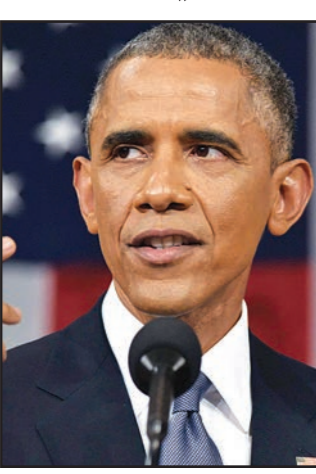
الرئيس الأمريكي باراك أوباما

واشنطن - «القدس العربي» من رائد صالحه: ناض الرئيس الأمريكي باراك أوباما نفسه في خطاب الاتحاد، حينما طالب بالاعتراف بالحرب الأمريكية الجديدة في سوريا والعراق، في الوقت نفسه تفاخر «بقلب صفحة» الحروب الطويلة والمكلفة التي شنتها الولايات المتحدة في أفغانستان والعراق. وأشار إلى نهاية المهمة القتالية الأمريكية في أفغانستان وتقلص القوات الأمريكية إلى حد كبير في العراق وأفغانستان من 180 ألفا إلى 15 ألفا، ولكنه طالب الكونغرس بتفويض جديد لاستخدام القوة الأمريكية ضد تنظيم «الدولة الإسلامية» في العراق وسوريا. وأضاف أن القيادة الأمريكية السياسية والعسكرية قد تمكنت من وقف تقدم «الدولة الإسلامية»، ولكنه حذر من أن الحرب الجديدة مع التنظيم لا تكون سهلة. وأكد أوباما خلال خطاب «حالة الاتحاد» الذي ألقاه أمام جلسة مشتركة