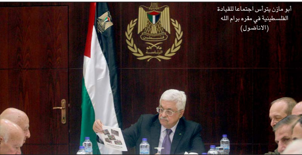
أبو مازن يتزاس اجتماعاً للقيادة الفلسطينية في مقره برام الله

الدولية ومبادرة السلام العربية، وتحت إطار دولي فاعل يشرف على تنفيذ القرار ووقف الاستيطان بشكل كامل»، وذلك بالتنسيق مع الدول العربية. ودعت اللجنة إلى عقد اجتماع للمجلس المركزي الفلسطيني خلال الشهر المقبل «لبحث جميع التطورات والتحديات الراهنة وسبل مواجهة السياسة الإسرائيلية والنزوح السياسي المقبل والتقدم في تفعيل دور المحكمة الدولية».