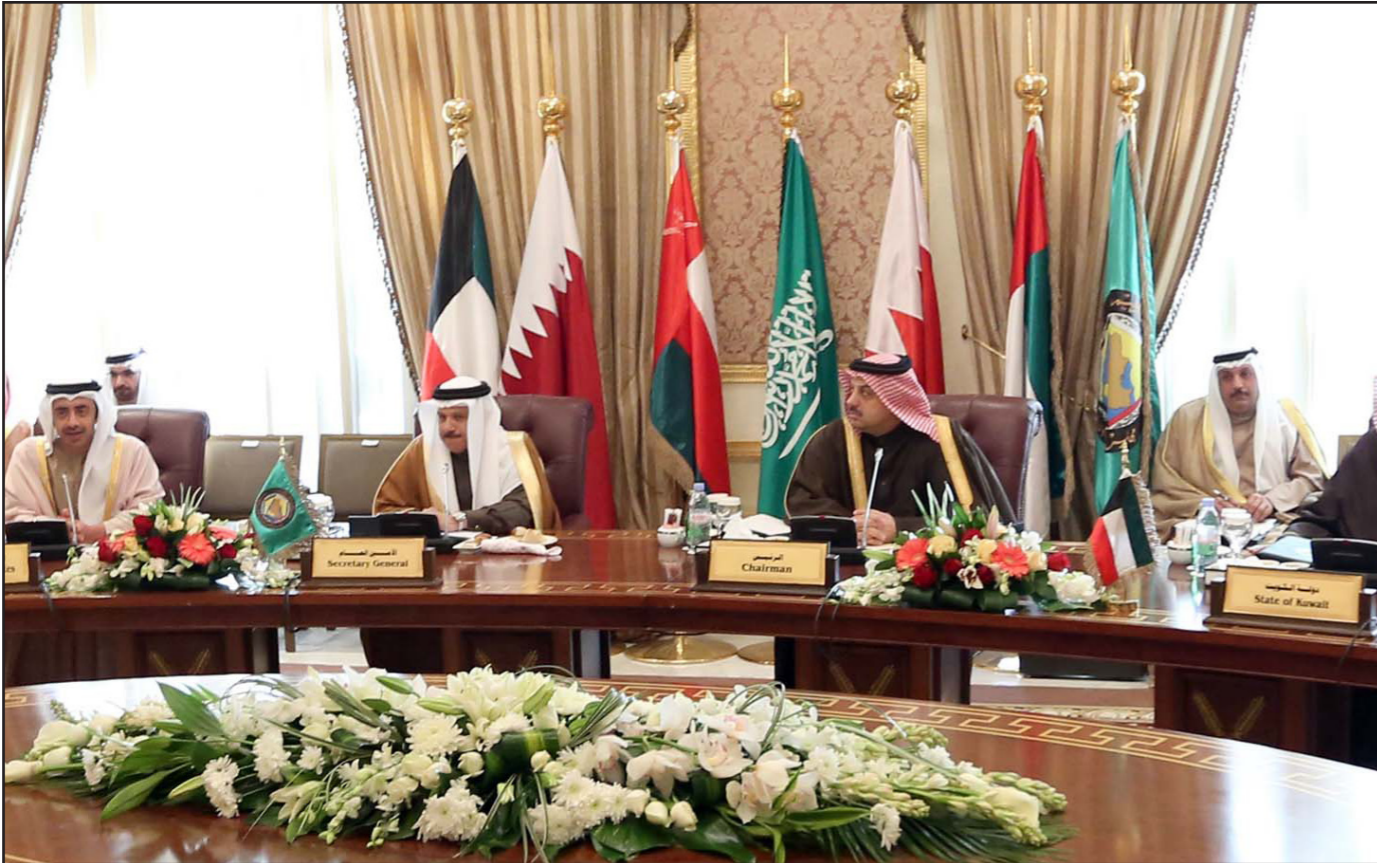
وزراء خارجية دول الخليج العربي خلال اجتماع طارئ لبحث الأزمة في اليمن

احتمال انحسار اليمن إلى حافة الحرب الأهلية، وقالوا أن العوامل الدافعة لذلك «انتهيار موقمات الدولة ومؤسساتها الأمنية والعسكرية وتوزعت القوى بين مختلف الأطراف على أساس المذهبية والمناطقية والتي يخشى أن تخلق أزمة جديدة في اليمن، محورها الصراع الطائفي».