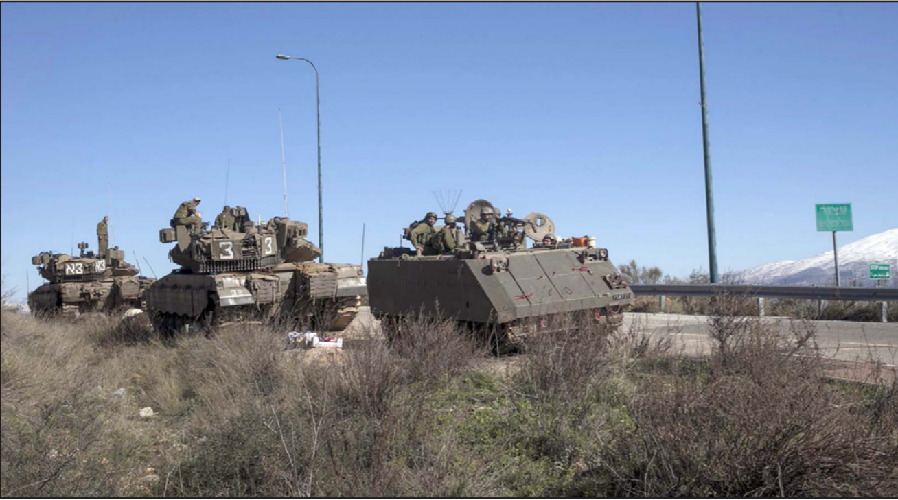
دبابات اسرائيلية على الحدود اللبنانية