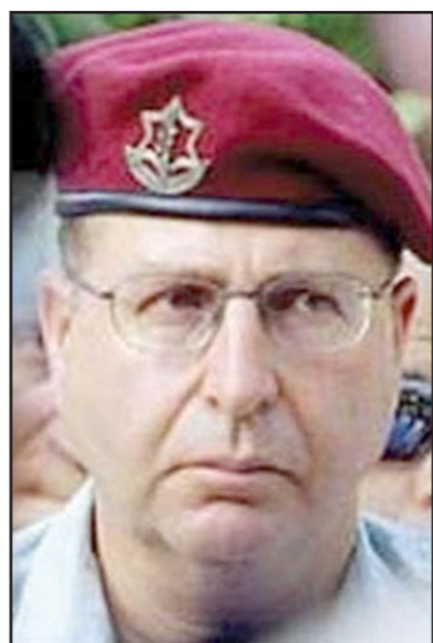
وزير الدفاع موشيه بعلون

الجزال الإيراني الذي سافر معه في القافلة؟ هل الاستخبارات العسكرية عرفت أن الجنرال كان هناك صرح رئيس الاستخبارات السابق ومرشح «العسكر الصهيوني» لعضب وزير الدفاع، عاموس يادلين، لصوت اسرائيل إنه «السؤال هو ما إذا كانت هناك طريقة أخرى لمنع هذه العملية المتدرجة عندما علمنا عن وجود الإيراني في القافلة». هل الربح المتوقع من اغتيال مغنية الشاب، الذي يحكم والعائلي معد ليكون شخصية قوية في حزب الله، يزيد على الضرر المحتمل في حالة تدهور الوضع هذا السؤال يتكرر بعد كل عملية اغتيال، وفي حالة مغنية الأب الذي تمت تصفيته في 2008 كان الرد على هذا السؤال بالاجاب، بسبب الضرر الذي لحق بالقدرة التنفيذية لحزب الله، وهكذا أيضا عندما تم اغتيال فتحي الشقاقي، رئيس منظمة الجهاد الإسلامي الذي اغتيل في ماطلة في 1995، والنموذج المعاكس الآخر عندما تم اغتيال سكرتير عام حزب الله السابق عباس موسوي في 1992، حيث رد حزب الله وارتد بتفجير السفارة الإسرائيلية في الأرجنتين بعد شهر، ودفعت هذه العملية إلى قمة القيادة وعيم أكثر تشددا وهو حسن نصر الله. وحسب بعض التقارير في وسائل الإعلام الإيجابية، قتل في الهجوم 12 شخصا، نصفهم من الإيرانيين. فهل كانت النية المسبقة هي تصفية هذا العدد الكبير من الأشخاص؟ من المعلوم أن مغنية قتل في السنة الماضية