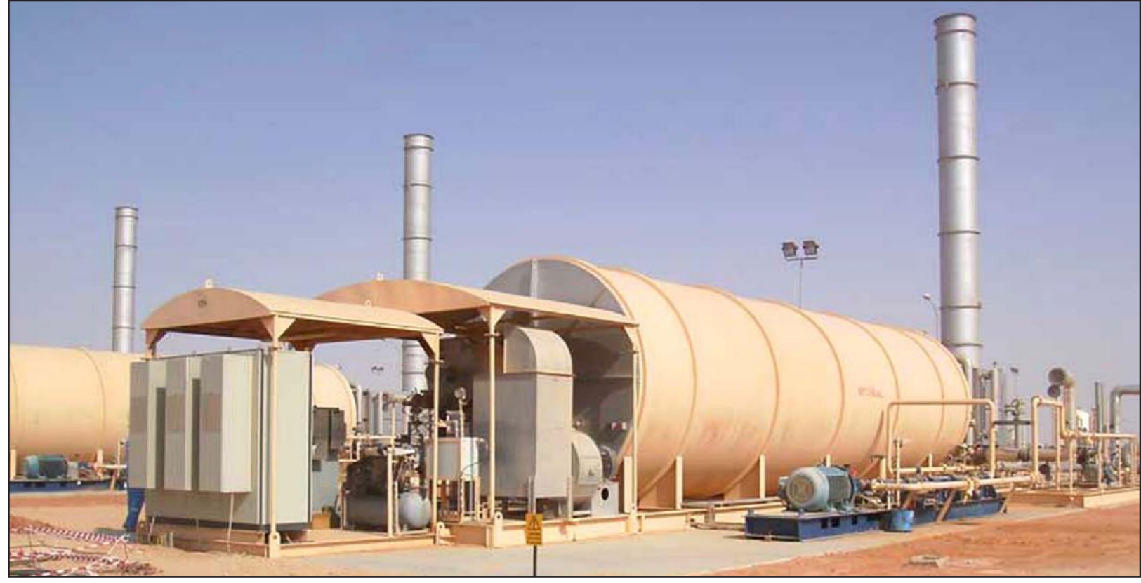
جانب من منشأة لحقن نفاط أعباء عمانية بالبخار

وقت سابق من الشهر ميزانية 2015 متضمة عجزا حادا قدره 2.5 مليار ريال (6.5 مليار دولار). وقال الرمحي «الوضع الحالي سيء لنا في عمان، إنه وقت عصيب بالفعل، هذه سياسة سيئة».