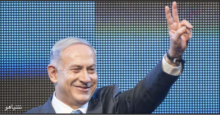
مواجهة أسباب الإرهاب

كما استنكرت رئيسة حزب «ميرتس» زهافا غالون العملية المرعبة، ضد المدنيين، داعية لاتخاذ كافة التدابير لمنع العملية التخريبية القادمة، لكنها دعت أيضا الأوساط السياسية في إسرائيل للتحرك عن التحريض وتسخير الأجواء لغايات دعائية ساخرة، وبخلاف بقية زملائها في العتبة السياسية اقتربت غالون من توصيف دقيق للحالة بقولها إن الطريق الوحيد لمعالجة «الإرهاب» يكمن بمواجهة الأسباب، وعلى خلفية هذا الاستغلال الساخر من قبل السياسيين الإسرائيلييين لعملية في تل أبيب دعاهم العلق البارزون بن يشاي للوقوف مع الرقص على دماء الضحايا، لافتا إلى أن العملية جاءت على خلفية الأجواء في الشارع الفلسطيني علاوة على الحالة الشخصية لمنفذها فقتل معاملة المتسلسلين للبلاد دون تصريح، وتابع بن يشاي «رود رئيس الحكومة وبقية السياسيين هي كليهما تارة تارة لا تخدم محاولات إحباط العمليات القادمة».