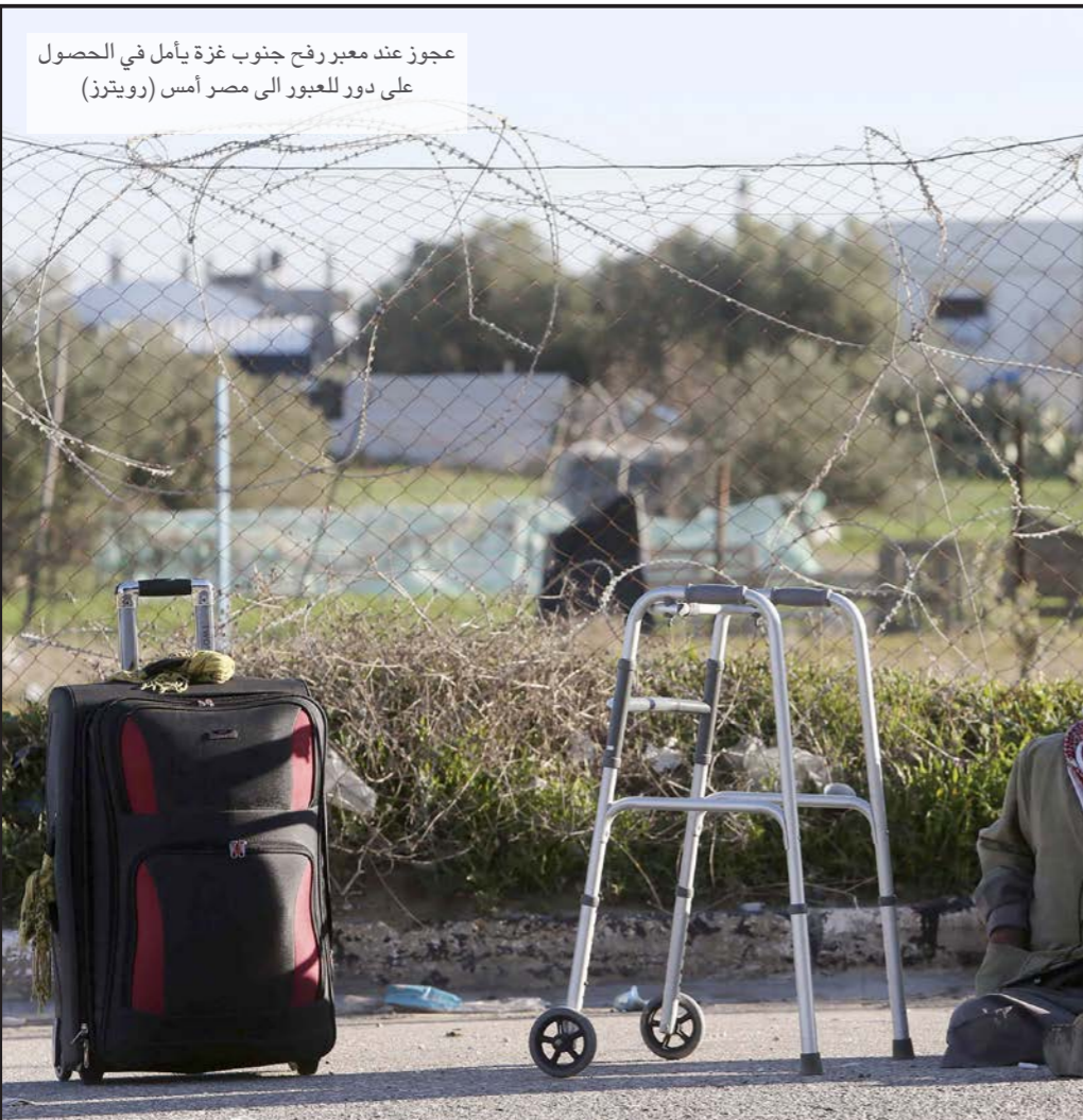
عجوز عند معبر رفح جنوب غزة يأمل في الحصول على دور للعبور إلى مصر أمس

جزئياً خلال الحرب، وقدر عددها بنحو 100 ألف منزل. كذلك سمحت إسرائيل بإدخال كميات قليلة من مواد البناء، وزعت على أصحاب المنازل المدمرة جزئياً، لاستخدامها في أعمال الترميم. وتواجه خطة الإعمار الدولية التي وافقت عليها السلطة الفلسطينية وإسرائيل، وتشرف عليها الأمم المتحدة، وسميت بـ«خطة سيري» نسبة للمبعوث الأممي وروبرت سيري، بانتقادات شعبية وفضائية واسعة، إذ ترى الفصائل الفلسطينية أنها «تضرع حصار إسرائيل». وطلبت حركة حماس في مرات سابقة إجراء تعديلات على هذه الخطة، وقيل أسابيع عقد سيري اجتماعاً يعقده في غزة مع الدكتور موسى أبو مرزوق نائب رئيس المكتب السياسي لحماس، ناقشا خلاله عملية الإعمار، كما توجه للسلطة انتقادات بسبب عدم بدء عملية إعمار غزة، في ظل تشتت آلاف الأسر التي هدمت منازلها، إذ توجد حتى اللحظة آلاف منها في «مراكز إيواء» أقامتها «الأونروا» في مدارسها، وهي غير مخصصة للسكن، في حين لجأ عدد من أصحاب المنازل المدمرة إلى إقامة خيم بلاستيكية على أنقاض هذه المنازل. وتشترط الدول المانحة بأن يكون هناك وجود وإدارة حقيقية لحكومة لا توافق على معابر غزة قبل أن تبدأ بضح أموالها لإعادة الإعمار، وهو أمر لم يتم حتى اللحظة، إذ ما زال هناك خلاف بين حكومة التوافق وحماس حول الأمر، ففي الوقت الذي تطلب فيه الحكومة تسلم المعابر دون تدخل، وشكلت لهذا الأمر لجنة خاصة، ترفض حماس إقصاء موظفي العاملين على تلك المعابر منذ ثماني سنوات.