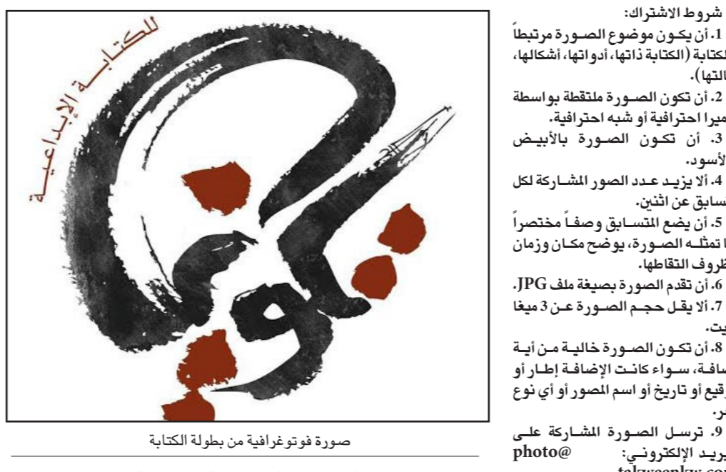
صورة فوتوغرافية من بطولة الكتابة

وتعتزم إدارة المشروع إقامة معرض لأفضل اللقطات المشاركة في المسابقة في مكان عام، ونشرها في حسابات مواقع التواصل الاجتماعي لمشروع تكوين، والتي يتابعها عشرات الآلاف من المتابعين من جميع بلدان الوطن العربي، وتشترط المسابقة أن تكون الصور المقدمة بالأبيض الأسود، وهو ما يرمز إلى ثنائية «الورق والحبر» التي يعتمدها المشروع في إبراز قيمة الكتابة. وقد أفتاد ممثلو المشروع بأن الهدف من إقامة مسابقة من هذا النوع، هو الفوز عبر شرائح الختم بفترة الكتابة الإبداعية، من خلال الصورة الفوتوغرافية، وهي فرصة مثالية لكي تتحول الصورة الفوتوغرافية إلى رافد كتابي، وأن تتحول الكتابة الإبداعية إلى رافد للإبداع البصري، بما يحقق تكامل الفنون وتداخلها وتضاهي أدواتها في خدمة بعضها البعض.