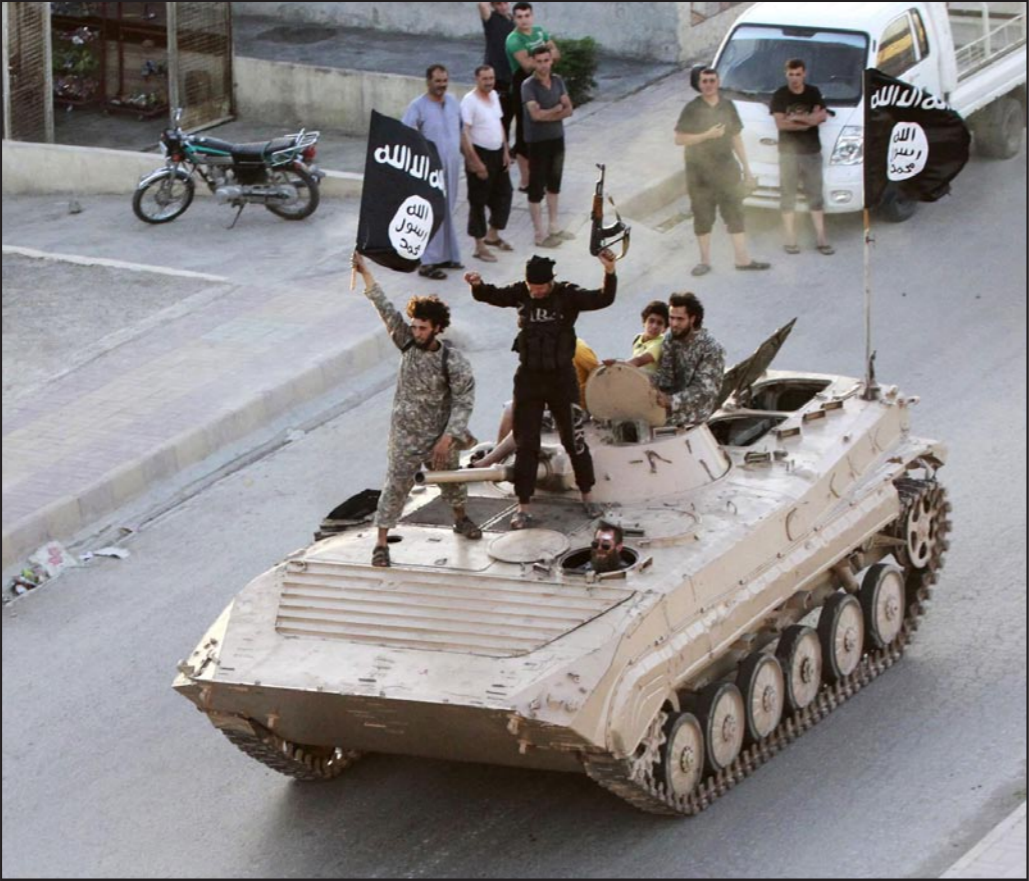
مسلحون من تنظيم الدولة الاسلاميةيتجولون في شوارع مدينة الرقة

الذين طالبوا سابقا برحيل فوري للأسد يقولون الآن إن عليه أن يسيطر على المؤسسات المهمة في الدولة ولأمد لا نهاية له، لكن يجب النظر في إمكانية حدوث انتقال تدريجي للسلطة في سوريا. ويقول دبلوماسي غربي في الأمم المتحدة إنه عندما تحل «مرحلة ما بعد الأسد»، فسيتم التعامل معها طامًا لم تنقل تدريجياً للسلطة في سوريا. ويقول دبلوماسي غربي في الأمم المتحدة إنه عندما تحل «مرحلة ما بعد الأسد»، فسيتم التعامل معها طامًا لم تنقل تدريجياً للسلطة في سوريا. ويقول دبلوماسي غربي في الأمم المتحدة إنه عندما تحل «مرحلة ما بعد الأسد»، فسيتم التعامل معها طامًا لم تنقل تدريجياً للسلطة في سوريا.