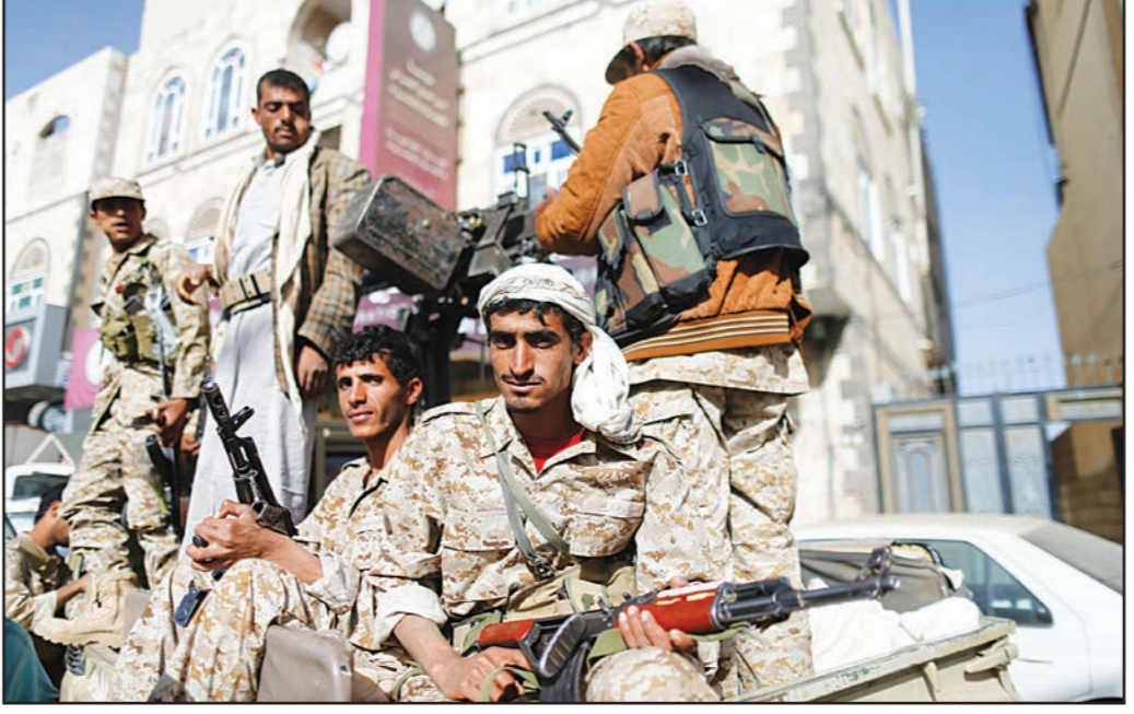
قوات تابعة لجماعة الحوثي تجوب شوارع صنعاء

صنعاء - الرياض «القدس العربي» تواصلت أمس التطورات العسكرية والأمنية في العاصمة اليمنية صنعاء، إثر إحكام الحوثيين سيطرتهم على أهم الأبنية العسكرية في البلاد، وهي أبنية الصواريخ السعيدية والتي تحوي صواريخ سكود بعيدة المدى. وقد غاب الرئيس اليمني عن المشهد السياسي تماما، ولم يعد تصدر عنه إلا بيانات عن مستشاريه، في تطور فسره مراقبون على أنه فرض لما بات يعرف بالإقامة الجبرية وضمها الحوثيون على الرئيس عبره منصور هادي. وفي وقت لاحق من مساء أمس الأربعاء أعلنت وكالة سبا توصل الرئيس اليمني عبره منصور هادي إلى اتفاق مع المسلحين الحوثيين لإنهاء الأزمة في اليمن.