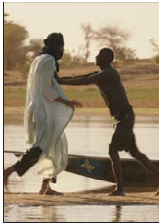
لقطة من فيلم تمبكتو

متحمساً ومفعماً بسعادة بالغة من نجاح فيلم «وجع العصفير»، أو «شجن العصفير»، كما يحلو لبعض النقاد تسميته. نجاح كان لا بد وأن يستثمره للتخصير لشاريع أخرى