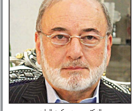
الدكتور محمد حكمت الوليد