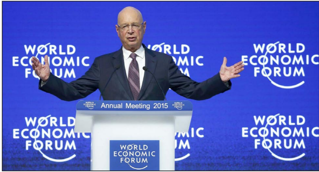
بروفسور كلاوس شواب رئيس منتدى دافوس يفتتح جلسته الأولى أمس

دافوس - دب أ: تخلى أغلب كبار مسؤولي الشركات الأوروبية عن الأمل في التعافي الاقتصادي خلال العام الحالي، بحسب المسح الذي أجرته مؤسسة «برايس ووتر هاوس كوبرز» (بي.دي.بي.سي) الاستشارية نشرت نتائجه أمس الأول. أظهر المسح، الذي نشرت نتائجه قبل انطلاق أعمال المنتدى الاقتصادي العالمي في منتج دافوس السويسري، أن 16% فقط من كبار المديرين في أوروبا توقعوا ظهور مؤشرات على تعافي الاقتصاد خلال 2015.