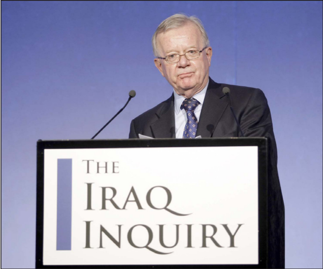
رئيس لجنة التحقيق جون شيلكوت

وكتب شيلكوت رسالة إلى رئيس الوزراء ديفيد كاميرون يقول فيها إن هذه العملية «ستستغرق عدة أشهر أخرى». ومن غير المرجح أن يؤثر التقرير على