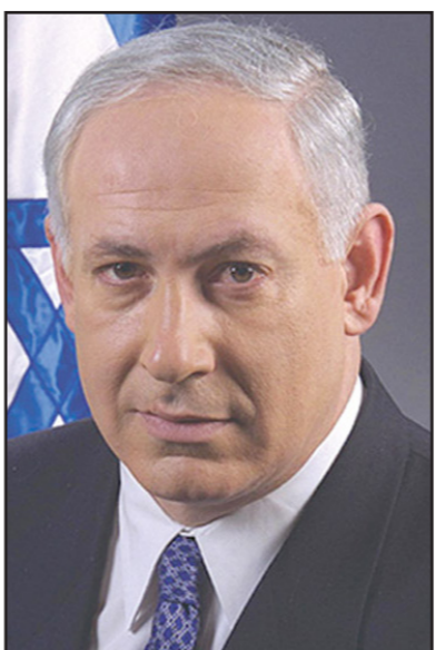
رئيس الوزراء الاسرائيلي بنيامين نتنياهو

فرصة وجود دورية قادة بالقرب من الحدود؛ حافظت اسرائيل حتى اليوم على تدخل بسيط جدا في الحرب الأهلية السورية، وقيدت نشاطاتها (حسب مصادر اجنبية) في الحالات التي تم فيها اجتياحها في هذا الهجوم، أو أنه تم استغلال