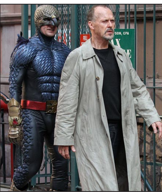
لقطة من فيلم «بيردمان»

■ لوس أنجليس - رويترز: قفز فيلم «بيردمان» إلى مقدمة السباق على جائزة أوسكار أفضل فيلم بفوزه بكبرى جائزة يمنحها منتجو هوليوود.