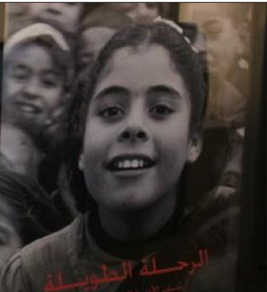
ملصق الرحلة الطويلة

وحرض الوكالة على عرض مجموعة كبيرة من الصور التي تشير إلى الخدمات الصحية والتعليمية التي قدمتها الوكالة إلى اللاجئين الفلسطينيين في الاماكن والمخيمات التي لجأوا إليها في لبنان