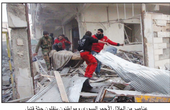
عناصر من الهلال الأحمر السوري ومواطنون ينقلون جثة قتيل بعد قصف طائرات النظام السوري لبني في مدينة دوما بضواحي دمشق أمس

إلى ذلك سيطرت كل من جبهة النصرة وكتائب أحرار الشام، أمس الأحد، في عملية مشتركة على اللواء 82 التابع لجيش نظام الأسد في بلدة «شيخ مسكين» في محافظة درعا جنوب سوريا. وأوضح المسؤول الإعلامي في هيئة