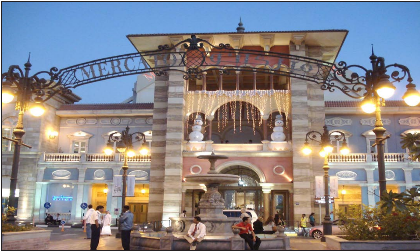
أحد مداخل «دبي مول»

■ دبي - رويترز: أدى تراجع قيمة الروبل الروسي إلى عزوف المتسوقين الروس عن التسوق إلى دبي لحضور مهرجان التسوق السنوي، غير أن البوادر تشير إلى أن الزائرين من دول أخرى سيعوضون هذا الغياب. وفي يناير/كانون الثاني من كل عام تستعد دبي للمهرجان بالأنوار واللافتات والزينات على جانبي الطرق. وتعرض متاجر فاخرة، وتوظف عمالاً يتحدثون الروسية والصينية، خصومات سخية، وتعلن عن مسابقات للفوز بهدايا من بينها سيارات. ويعتمد اقتصاد دبي اعتماداً كبيراً على أنشطة التجزئة والسياحة والتجارة الدولية، نظراً لصغر احتياطياتها من النفط مقارنة بالعاصمة أبوظبي. ويقام مهرجان دبي للتسوق العام الجاري من الأول من يناير إلى الأول من فبراير/شباط. وتسهم مبيعات التجزئة بأكثر من مليار دولار في اقتصاد الإمارة. وكان المتسوقون الروس عادة من أكبر العملاء، إلى جانب مواطني السعودية والولايات المتحدة. إلا أن كثيراً من الروس فضلوا البقاء في بلادهم هذا العام خلال عملة عيد الميلاد حسب التقويم الأثوودوكسي، التي تزامنت مع الأسبوع الأول من