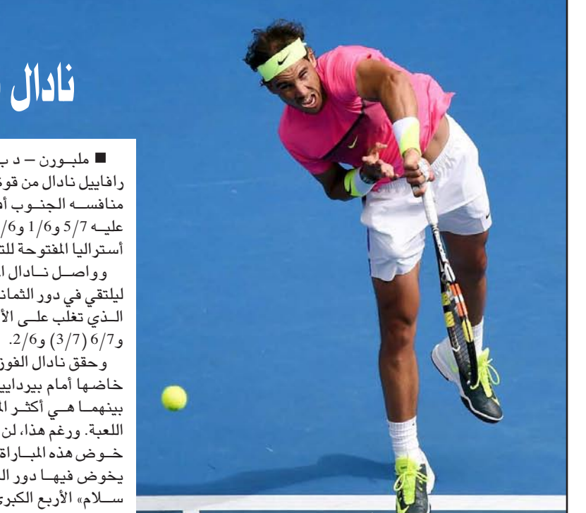
النجم الإسباني نادال استعاد تألقه واصل تقدمه في البطولة

واحتل المنتخب القطري المركز الثاني في المجموعة الأولى برصيد ثمانية نقاط وجاءت تونس في المركز الرابع بالمجموع الثانية ومصر في المركز الرابع بالمجموع الثالثة برصيد خمس نقاط لكل منهما، فيما تذيلت الجزائر والسعودية المجموعتين الثالثة والرابعة على الترتيب بلا رصيد من النقاط. وتفوق منتخب العنابي على نظرائه من المنتخبات العربية على مستوى النتائج والإحصائيات بعد أن حقق الفوز في أربع من أصل خمس مباريات في دور المجموعات، بينما جاءت هزيمته الوحيدة على يد منتخب أسبانيا حامل اللقب، واستهل العنابي مشواره في البطولة بالفوز على البرازيل بفارق خمسة أهداف ثم هزم تشيلي بفارق سبعة أهداف وسلمو فينيا بفارق هدفين لكنه سقط أمام أسبانيا بفارق ثلاثة أهداف قبل أن يستعيد تكيه الانتصارات ويهزم بيلاروسيا بفارق أربعة أهداف في الجولة الأخيرة. أما منتخب تونس فقد تأهل بصعوبة شديدة إلى