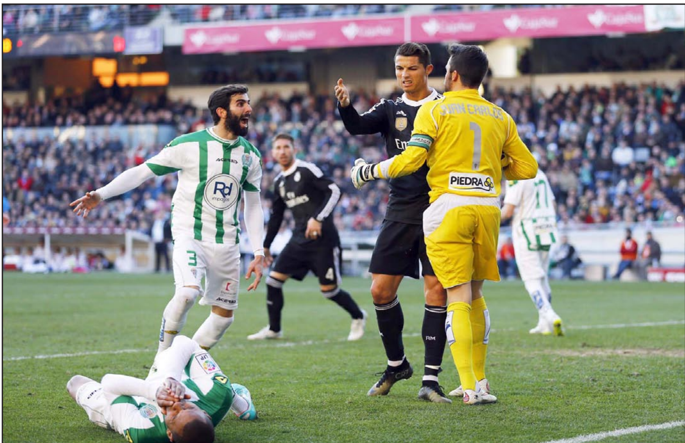
لحظة اعتداء رونالدو على لاعب قرطبة وقيل طرده من المباراة