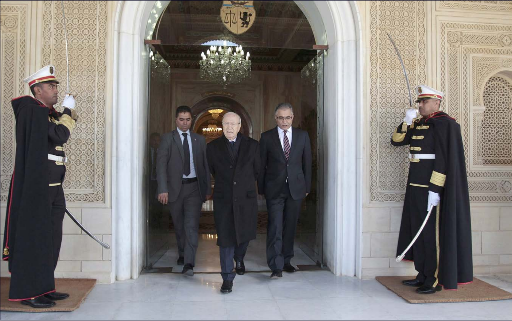
الرئيس التونسي بعد التقائه بحكومة الصيد

هذه الاتهامات، مشيراً إلى أن ساهم دوماً بالدفاع عن حقوق زملائه من القضاة، وترابطه بهم علاقة جيدة، كما نفى أي علاقة له بحركة النهضة، مشيراً إلى أنه لم يتم خلال قسرة رئاسته للمحكمة الابتدائية بالقصرين وتعيينه لاحقاً واليا على مدينة المهدية (شرق) لأي حزب سياسي.