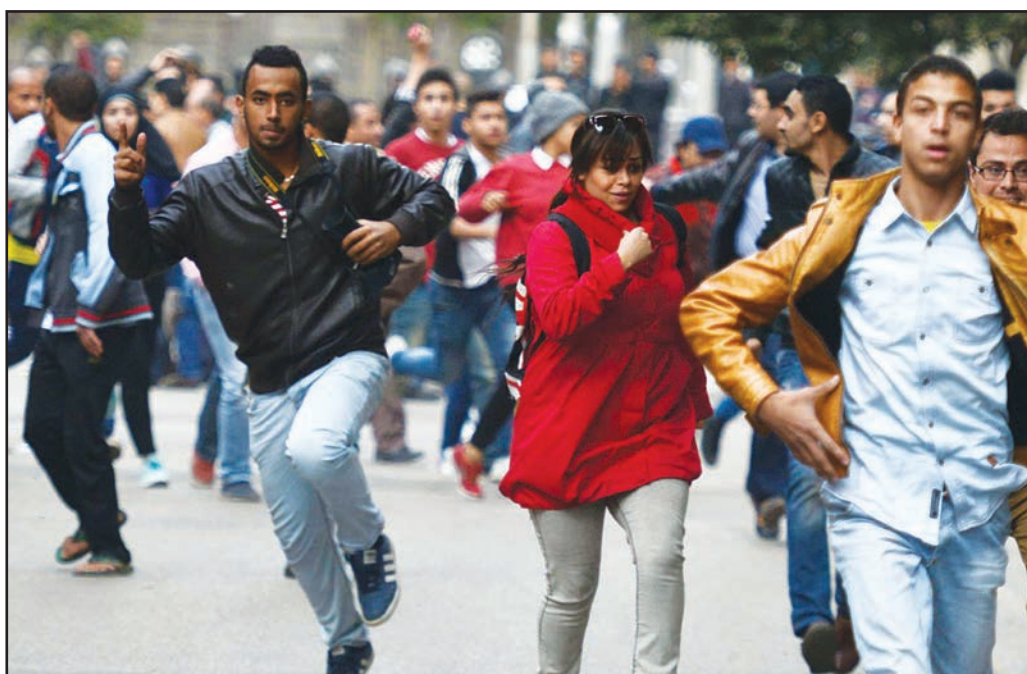
متظاهرون مصريون يقفون من قوات الأمن بعد محاولة منهم للوصول إلى ساحة التحرير وسط القاهرة أمس