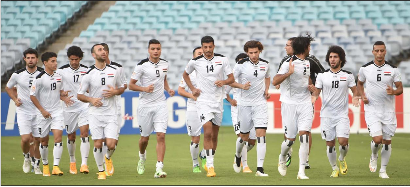
نجوم المنتخب العراقي في الحصة التدريبية الأخيرة قبل مواجهة كوريا الجنوبية

■ سيدني - د ب أ: يتطلع كل من كوريا الجنوبية والعراق إلى تقديم أداء قوي بليق بتاريخه عندما يلتقيان اليوم في أولى مبارياتي الدور قبل النهائي لكأس آسيا المقامة حاليا في أستراليا. ورغم تأمله للمربع الذهبي، سيكون المنتخب العراقي الأقل ترشيحا للفوز في هذه المباراة مثلما كان في مباراة أمام إيران بالدور الثاني (دور الثمانية). لكن أسود الراfidين يمكنه الاعتماد على فوزه التاريخي باللقب في نسخة 2007 كحافز وعلم للفريق. وفي المقابل، يواصل المنتخب الكوري الجنوبي محاولات البحث عن لقبه الثالث في تاريخ البطولة والأول له منذ 1960، ويطمح إلى عبور العقبة العراقية لبلوغ النهائي للمرة الأولى منذ 27 عاما.