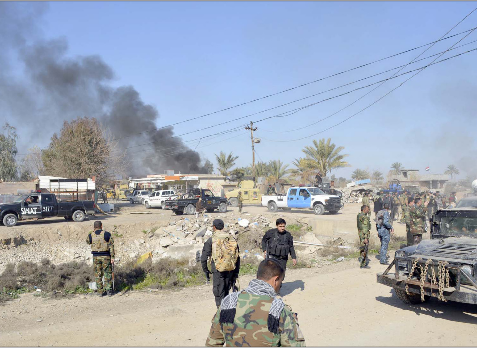
قوات عراقية تتأهب لخوض عمليات في ديالى