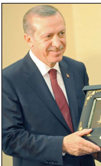
الرئيس الصومالي حسن شيخ محمود يهدي نظيره التركي رجب طيب اردوغان اعلى وسام في الصومال

مقديشيو - الأناضول: تعهد الرئيس التركي رجب طيب اردوغان، مساء أمس، ببناء 10 آلاف وحدة سكنية جديدة في مقديشيو، إضافة إلى إعادة ترميم وتوسيع ميناء مقديشيو الدولي.