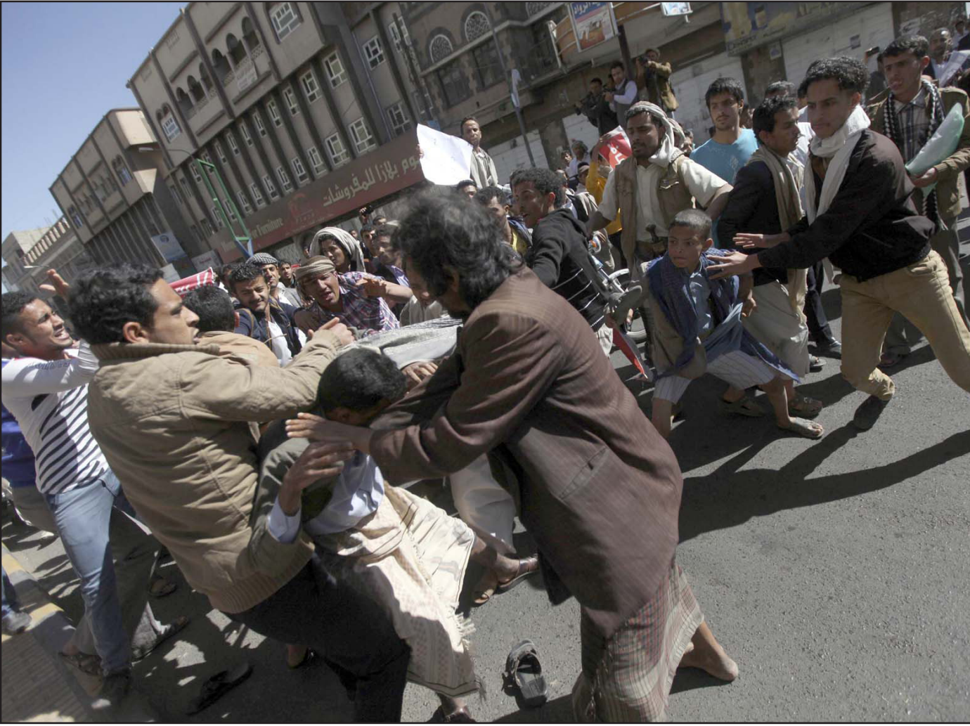
مشاجرات بين مؤيدي ومعارضين للحوثيين وسط العاصمة صنعاء

من 110 ضربة جوية في اليمن، والقسم الأكبر منها بواسطة طائرات من دون طيار، وإن قامت بإسقاط الحوثيين بمساعدهات، فإنها لن ترقى إلى مستوى الدعم الذي تقدمه الدول الأخرى وخاصة السعودية.. ولفت إلى أن «المملكة العربية السعودية ليس لديها، حتى الآن على الأقل، خطة عمل واضحة تجاه ما يحدث في اليمن، كما أن غياب حلفاء المملكة يضعف الدور السعودي في اليمن».