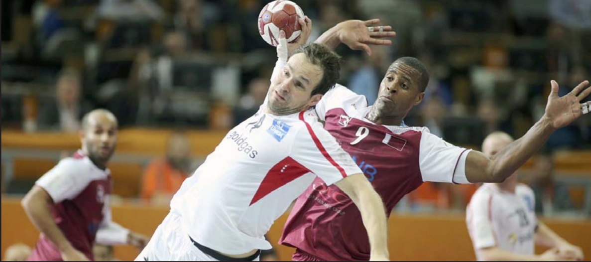
القطري كابوت (9) يحاول منع النمساوي جيليجاي من التسديد على مرماه

وفي دور الستة عشر تنفطر مصر وتونس، وهما المنتخبين الوحيدان اللذان تأهلا إلى الدور قبل النهائي لوندبال اليد من خارج أوروبا في 2001 و2005 على الترتيب، مهمة صعبة للغاية حيث يلتقي الفراعة مع ألمانيا وتصلطم تونس بأسبانيا حاملة اللقب. أما منتخب قطر فستكون مهمته أسهل كثيرا