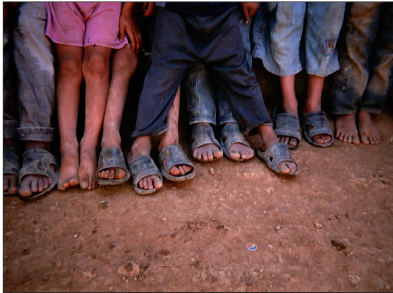
صورة من المعرض

في الصور عامة مشهد لا يرغب، إنها الخيام المشددة بجيوب ذاتية، موادها الأولية من جدران وأسقف من كل ما طالته اليد، قماش مهمل، أوراق اعلانات ضخمة، المحظوظون منهم عشروا على قطع من ألواح الزنك، عجلات السيارات المرمية تقترش سطوح الخيام، تحميها من الاقتلاع حين تهب الطبيعة، المشهد الآخر الجامع بين حال البشر من صغار وكبار الاقتار إلى الأحذية الملائمة لتلك البيئة القاسية، نادرين من فازوا بحذاء كامل الأهلية، كثيرون ينتقلون مشايها أو حفايات آيلة للسطو، وكثيرون تألفت اقربهم مع الوحل والتراب والثلج، وصارت جزءاً من الطبيعة، ثمة صورتان في المعرض عبرتا بشغافية وصدق عن حال الأقدام، كاميرا طفل ولحبت عالم الأقدام المتعثر في تلك المخيمات القاسية، التقط طفل صورة لجمع أطفال تظهرهم من الركنة حتى القدم، أقدام تروي بعريها عمراً من القهر، ومن حظي منهم بحفاية، كان الدهر قد اكل عليها وشرب. الصورة الثانية تعيدنا إلى مدرسة ما قبل بناء الحجر والإسمنت، هي مدرسة «تحت السندانية» التي طالعنا عنها في الكتب، لبنان عجز عن استيعاب كافة تلامذة النزوح السوري، والعالم العربي يماله المكس في بنوك الغرب يتفرج على تلامذة سوريين دون مدارس، أطفال اخترعوا المدرسة، فكان الجلوس على قماش كبير أرضاً،