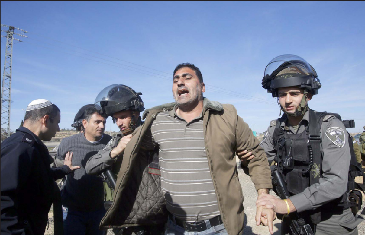
الشرطة الاسرائيلية تلقي القبض على فلسطيني يظهر ضد بناء المستوطنات بالقرب من بيت لحم

الله، ولا أكثر. إنني أفهم الحاجة النفسية إلى شيء ملموس، «أن تكون يهوديا»، فهذا شيء مجرد جدا، خصوصا لأولئك الذين ليست لديهم تلك الممارسات اليومية كقريضة، أنهم يهود بسبب تاريخهم البعيد والقريب. ويسبب انه ليس لهم طريق خاصة بهم للتعبير عن هذا الانتماء. والنتيجة هي ان الحاجة كحارسه للهوية، الدولة هي الكنيسة الجديدة بالنسبة لهم. بالنسبة للكاهن الكريهين، التديينين وغير التديينين، اسرائيل الحالية هي نموذج يهودي غير عادي، نموذج سلطوي هو ليس مملكة داود الاسطورية وليست مملكة المسحين المستقبلة، الخوف من الحركة والحروب شكلت هذا التجمع الذي ادعى انه مثال يحتذى به للوجود اليهودي القديم، تحول إلى دولة اللجوء، التي تهرب كل شيء من أجل انقاذ جسد كل يهودي. وبذلك فانه من الواضح لماذا في هذا الوضع النفسي لا يملك أحد الصير للفصح البقيق في السؤال «ما هي اليهودية؟»، وكل واحد بطريقته يصيغ التعريف الذي يريده إلى ما لا نهاية. والنتيجة هي ان الشعب اليهودي لم يتبسط في تاريخه فترة تحققت بها الاسس المكونة لليهودية الاسرائيلية، والسيادة والارض واللغة، والوقه سيادتيا، او ان السيادة كانت يهودية ولكن بدون قوة أو دين أو قدسية أو مسيح. ولماذا اعراض اننا التعريفات المتجزئة في الروح الاسرائيلية؟ لان كل دولة يجب ان تكون علمانية مدنية، دولة قانون ومسواة، لجميع مواطنيها وتجمعاتها يحدد طابعها من الاصل إلى الأعلى من قبل الافراد والتجمعات التي تعيش فيها، وليس بالاملاء والفرض من الأعلى. انا مع