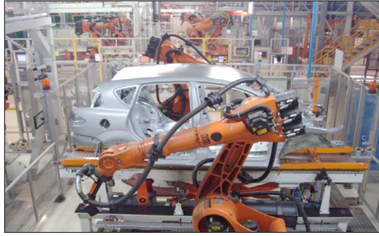
روبوتات تقوم بالعمل في مقطع من خط انتاج في مصنع سيارات ياباني

■ طوكيو - دب أ: أعدت الحكومة اليابانية خطة عمل تدعو إلى التوسع في استخدام تكنولوجيا الروبوت (الإنسان الآلي) لتخفيف النقص في العمالة الناتج عن تراجع عدد سكان البلاد. وتتضمن خطة العمل التي أعدها اجتماع للخبراء ترأسه تاموتسو نوموكوتشي، وهو مستشار في «ميتسوبيشي اليكتريك كوربوريشن»، استثمار ما لا يقل عن 100 مليار ين من جانب القطاع العام والخاص مع حلول عام 2010 لتطوير الجيل المقبل من الروبوت، حسبما ذكرت وكالة (جي.جي.برس) اليابانية. وتتوقع الحكومة أن يؤدي استخدام الروبوت إلى زيادة الإنتاجية لمساعدة الشركات على زيادة العائدات والأجور. ولتطوير الجيل المقبل من الروبوت، تقترح الخطة إقامة قاعدة في مقاطعة فوكوشيما شمال شرق اليابان لأجراء الاختبارات وجمع البيانات. وتؤكد الخطة على أهمية التوسع في تطبيق تكنولوجيا الروبوت من قطاع التصنيع إلى قطاع الخدمات ومواقع الكوارث التي لا يمكن أن يدخلها الإنسان. وتقترح الخطة أيضا تسريع وتيرة التصريح باستخدام الأجهزة الطبية التي تستخدم تكنولوجيا الروبوت وأن تشمل الخططية التأمينية للتدريب أجهزة الروبوت.