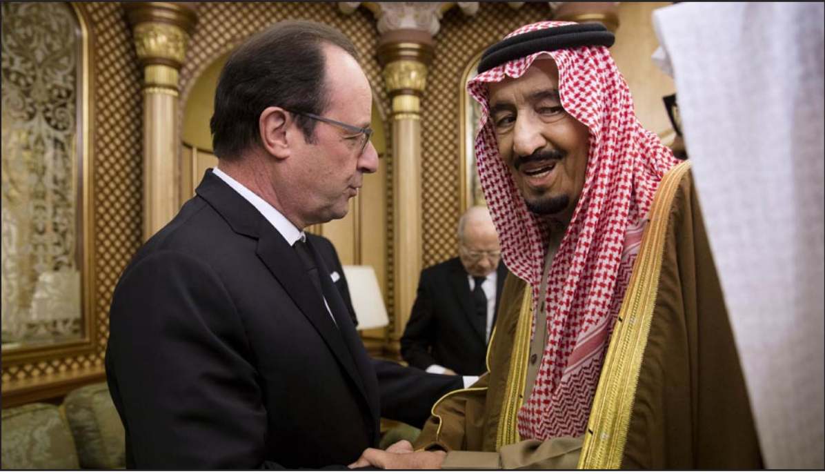
العاهل السعودي الملك سلمان بن عبد العزيز خلال استقبال الرئيس الفرنسي في مراسم عزاء الملك عبد الله

بأبحاث للحكومة الأمريكية أن سقوط نظام الأسد، غير محتمل الآن، سيكون «أسوأ نتيجة ممكنة»، للمصالح الأمريكية، وسيحرم سوريا ما تبقى لديها من مؤسسات حكم ويفتح المجال أمام تنظيم الدولة الإسلامية وغيره من التطرفين. وهو سيناريو لم يتوقعه أحد عندما بدأت الثورة السورية بشكل سلمي، ولكن الديكتاتور الذي طالبته الولايات المتحدة والغرب بالرحيل رد بقوة السلاح مدعوما من روسيا وإيران. وهو ما أدى لآلاف القتلى والبلايا في حرب أهلية قتل فيها أكثر من 200.000 سوري. وترى الصحيفة أن الوضع في سوريا يفرض على الإدارة الأمريكية أسئلة صعبة.