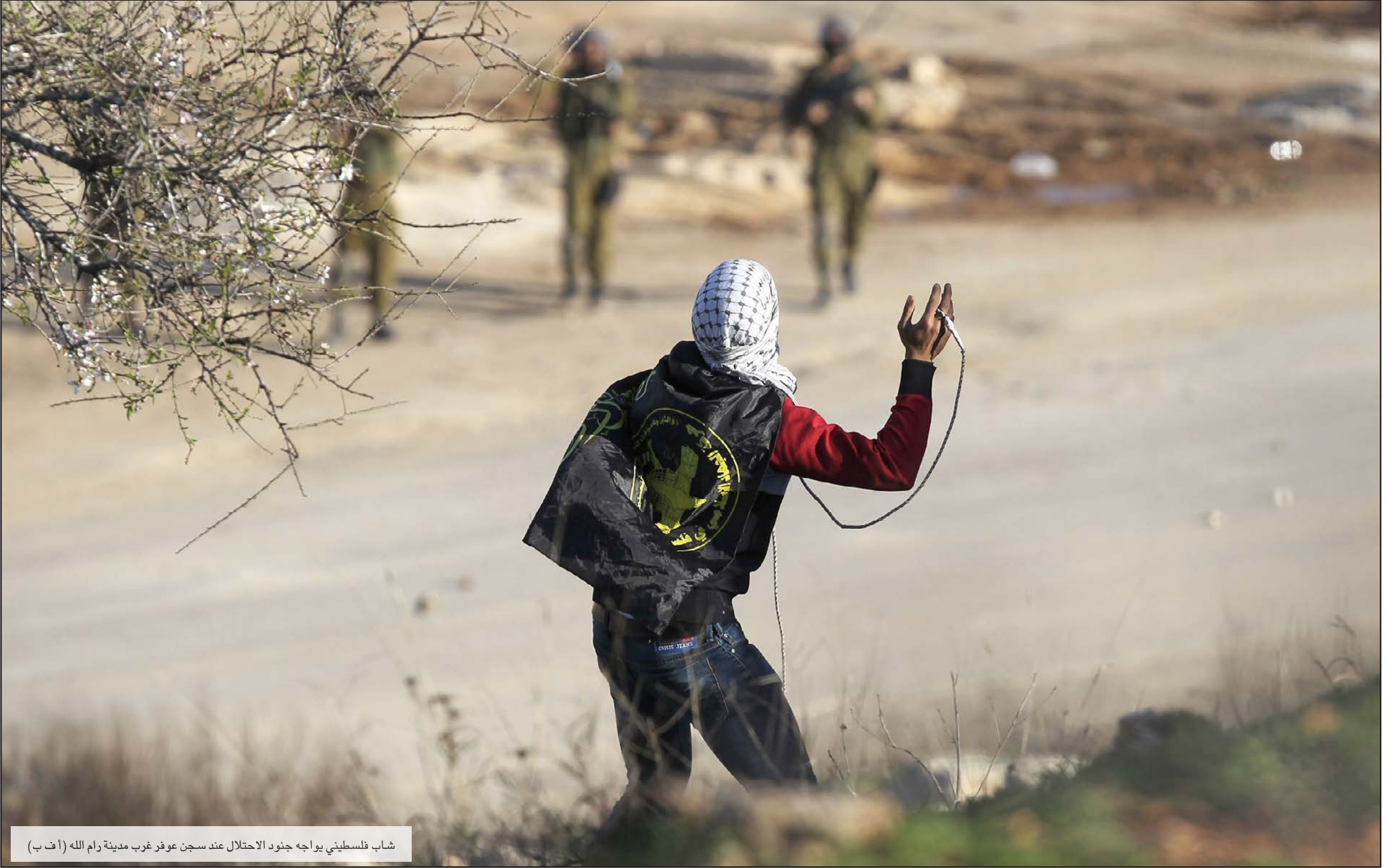
شاب فلسطيني يواجه جنود الاحتلال عند سجن عوفر غرب مدينة رام الله

الحال في ما يتعلق بإغلاق بعض مفترقات الطرق الرئيسية التي يستخدمها المستوطنون. لكن إسرائيل انتفضت بشكل كبير، ضد عمليات المقاومة الشعبية الفريدي، وتحديدًا التي نفذت في القدس المحتلة، منذ حزيران/يونيو الماضي، حين خرجت المدينة الفلسطينية عن سيطرة الاحتلال الإسرائيلي، وكذلك من الضفة الغربية، وأخرها عملية الطعن في قل أيبس الذي نفذها شباب فلسطيني من مخيم طولكرم شمال الضفة الغربية. لا ينحني لأي فصيل فلسطيني. من جهتها أكدت حركة «فتح» أنها مضية في تصعيد المقاومة الشعبية ومقاطعة المنتجات الإسرائيلية، ودعت للمشاركة الواسعة في فعاليات اليوم الإثني للجمع في مراكز المدن الساعة الثانية عشرة ظهرًا. وقال عضو اللجنة المركزية لحركة فتح محمود العالول، في بيان صحفي، إن هذه الدعوة تأتي في إطار الرد على إجراءات الاحتلال العقابية وفرصة أموال الشعب الفلسطيني، مشدداً على ضرورة أن لا تمر هذه الإجراءات العدوانية من قبل حكومة الاحتلال، وبالتأكيد على ضرورة وجود ضغط شعبي مقاوم على الأمن لضخ حكومة الاحتلال عن عدوانها على الشعب الفلسطيني.