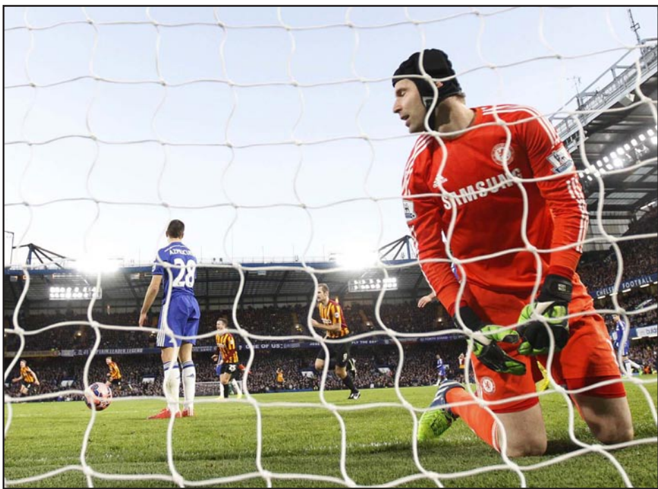
حارس تشلسي تشيك يتحسر على هدف آخر من المغمور برادفورد

مذبحة فرق الدرجة الممتازة وتأهل دور الستة عشر، بالتغلب على ضيفه برمنغام 1/2 كما فاز دينغ على ضيفه كارديف بالنجاة ذاتها. ولحق دربي بقاظة التاهلين آخر فوزه 2/صفر على تشيسترفيلد، فيما انتهت ثلاث مباريات بالتعادل، حيث تعادل ليفربول مع بولتون وستندرلاند مع فولهام سلباً وبريستون مع شيفيلد يونايتد 1/1. وانقذ البديل ديفارا ساخو فريق وستهام من كمين ضيفه بريستول سيتي وقاده للتغلب عليه 1/صفر.