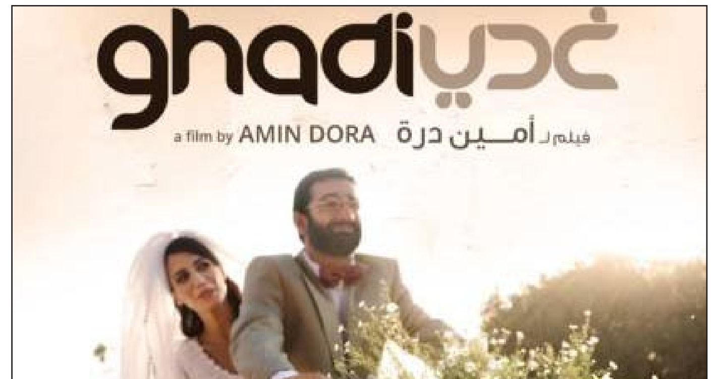
ملصق فيلم «غدي»