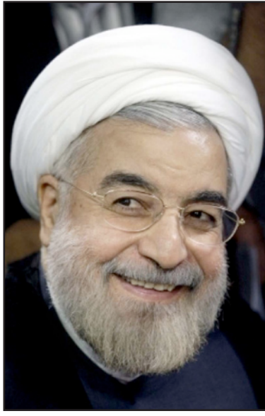
الرئيس الإيراني حسن روحاني

■ إضافة إلى الهجوم الاعلامي والسياسي المتزايد ضد الخطاب المتوقف لرئيس الحكومة بنيامين نتنياهو في الكونغرس، يضاف في هذا الوقت انهيار دعم الديمقراطيين للعقوبات الجديدة ضد إيران، وفي الفترة القريبة ربما يؤدي ذلك إلى تأجيل المسيرة كلها على الأقل حتى وصول القادم، تعرض بنيامين نتنياهو وجون باينر، رئيس مجلس النواب الامريكى، في الايام الاخيرة إلى انتقاد جماهيري واعياني غير مسبوق، ليس فقط من قبل الصحافيين والتحليل الليبراليين الذين يعتبرون متعاطفين مع الكونغرس، بل ايضا من مصادر محافظة مثل شبكة «فوكس»، الذين يعتبرون بشكل عام كحصول للرئيس وعاصقاء لنتنياهو، المحلل كريس فالس قال أمس إن الاجراء الذي قام به نتنياهو «جرم» المتعلق بجهال الرئيس اوباما و«مخجل»، كما وصف ذلك شيرد سميث، «ماذا يعتقدون؟» أننا أنغياء؟».