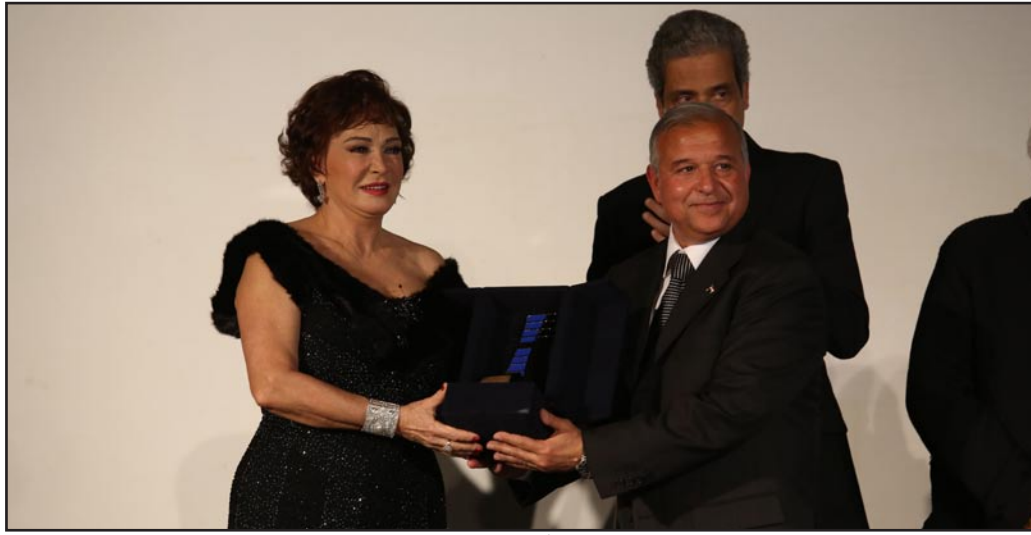
لبلة أثناء تكريمها

بينما تغيب عن التكريم المخرج الفرنسي الكبير إيف بوسايه، رئيس لجنة التحكيم، بسبب تأخر وصول طائرته، كما اختتم حفل الافتتاح بعرض فيلم «زوجة فرعون»، وهو نسخة مجمعة من المادة التي قام بتصويرها المخرج الألماني ارنتست لوبيتتش، والذي توفي قبل أن يكملها، حيث فقدت أجزاء من الفيلم لاكثر من ثمانين عاماً، والفيلم إنتاج عام 1922،