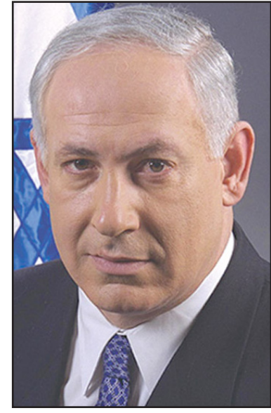
رئيس الوزراء الاسرائيلي بنيامين نتنياهو