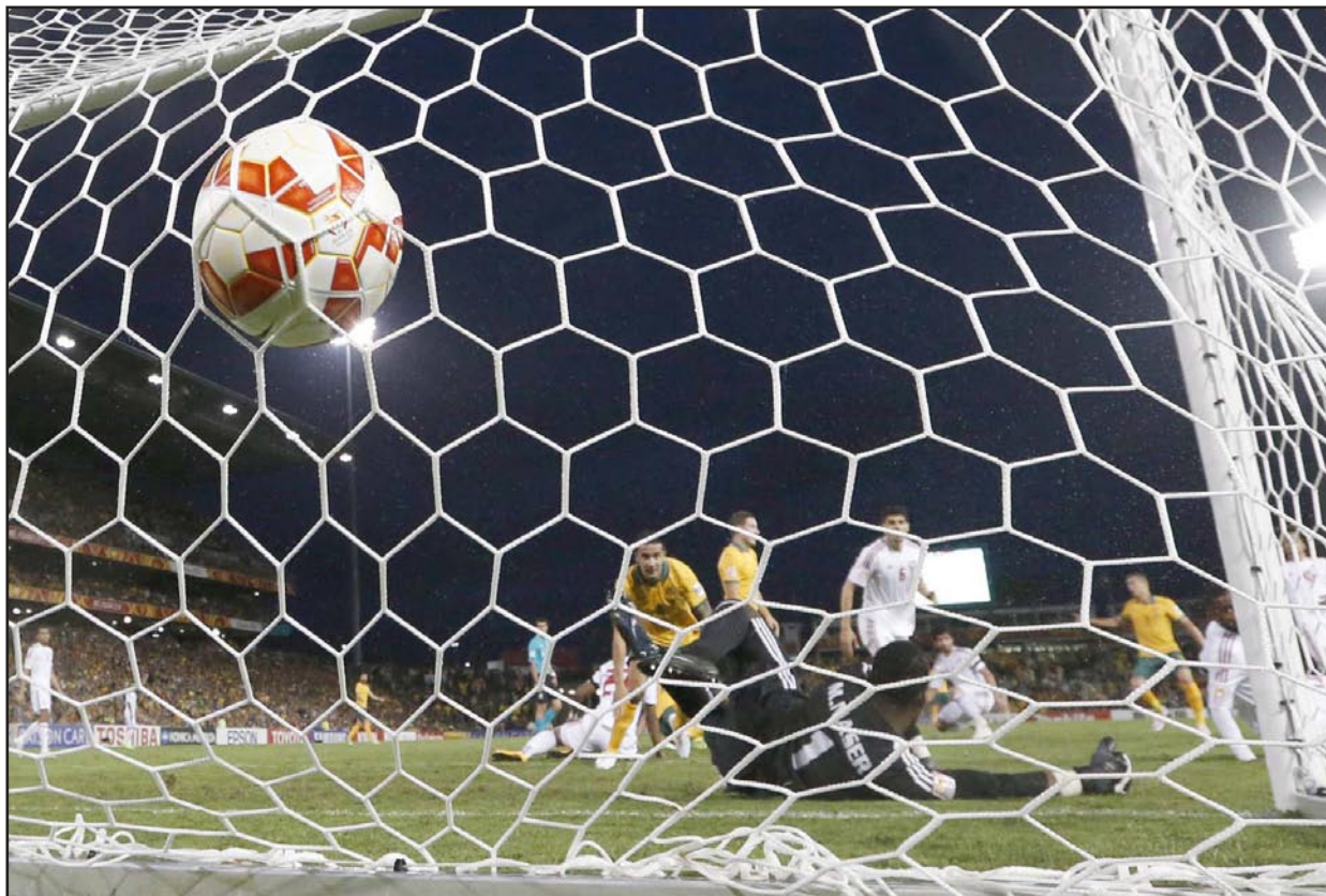
لحظة تسجيل الاسترالي دافيدسون الهدف الثاني في مرمى الامارات