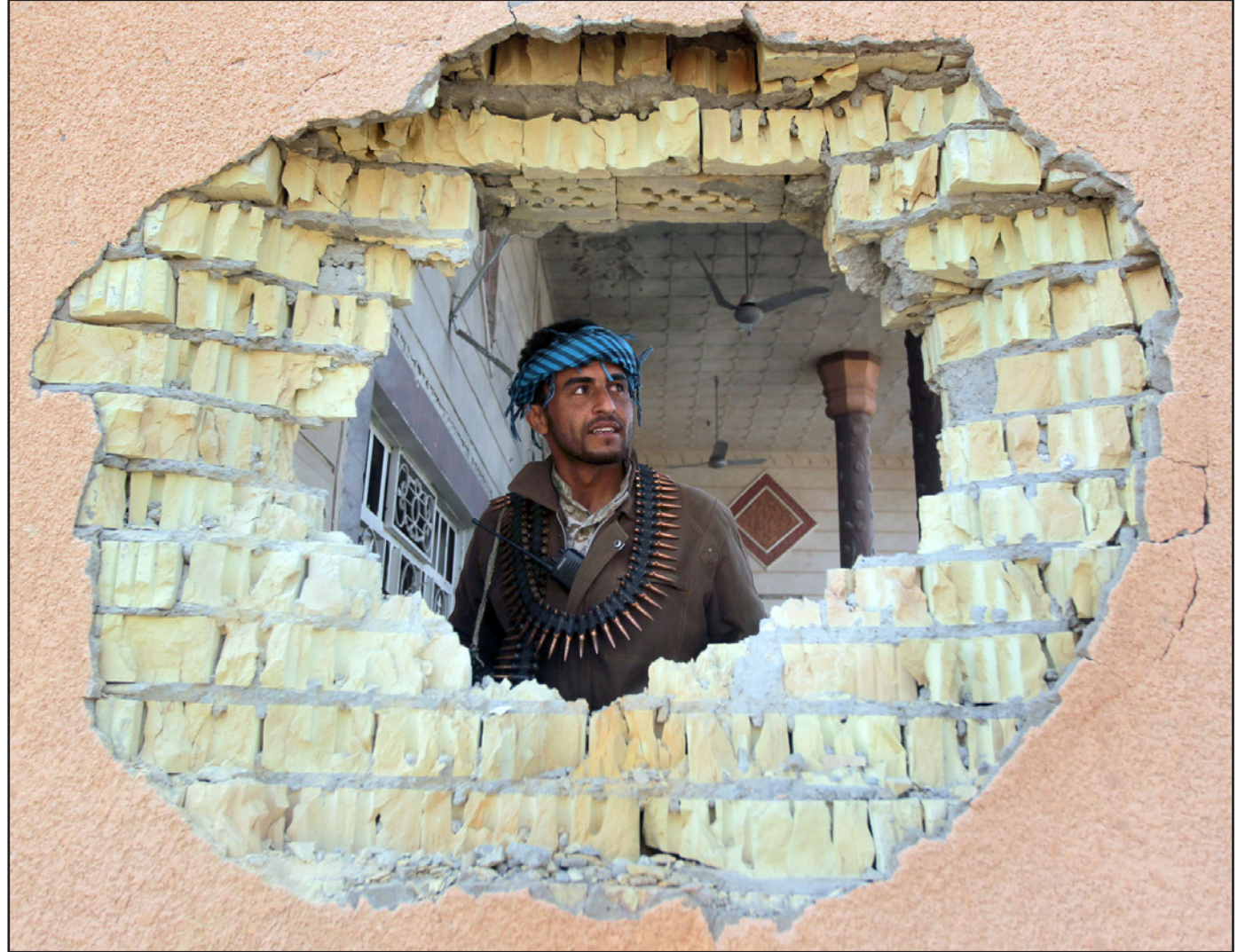
مقاتل عراقي «سني» خلال معاينته للأضرار التي لحقت بأحد المباني خلال القتال الدائر في مدينة شروين

أعلن برنامج الأغذية العالمي التابع للأمم المتحدة، أمس، أن الوضع الإنساني للعراقيين الذين نزحوا مؤخرا المحافظات النجف وكربلاء وبابل وصل مستوى حرج. 50,000 أسرة تقوم البرنامج حاليا بتقديم المساعدة لحوالي 50,000 أسرة نازحة في البصرة وذي قار والقادسية وميسان وواسط والمثنى والنجف وكربلاء وبابل.