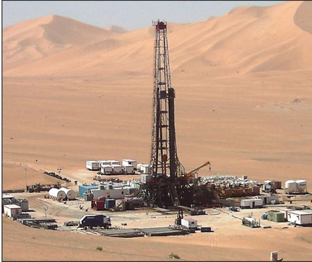
حفر نفط في حقل جزائري

■ الجزائر - رويترز: على مدى شهرين ظل المسؤولون الجزائريون يكررون مقلتهم أن احتياجات النقد الأجنبي الضخمة ستحمي البلاد من انهيار أسعار النفط، غير أن رئيس الوزراء عبد المالك سلال ظهر على التلفزيون الجزائري الأسبوع الماضي ليعلن ما تعرفه غالبية وهو أن الأزمة على الأبواب. فمع انخفاض أسعار النفط أكثر من النصف منذ يونيو/حزيران الماضي أصبح على الجزائر أن ترسم لنفسها مسارا محققا بالمخاطر، يتمثل في تقليد الإنفاق العام المرتفع، دون التأثير على موازنة الرعاية الاجتماعية السخية التي ساعدت في الحيلولة دون تفجر اضطرابات شعبية واسعة النطاق. ويفرض انخفاض الأسعار ضغوطا على نظام اقتصادي يعتمد على إيرادات صادرات الطاقة والدعم الحكومي للاسكان، من الإسكان الشعبي إلى القروض الرخيصة، وهو الدعم الذي ساعد الجزائر في تفادي انتقال انتفاضات الربيع العربي التي شهدتها الدول المجاورة إليها.