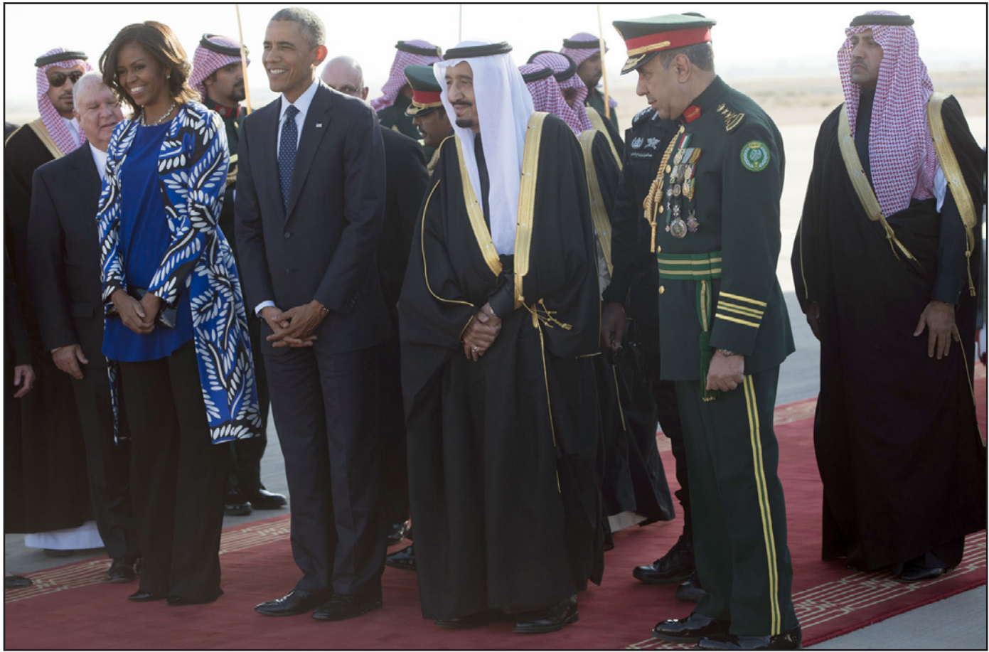
العامل السعودي الملك سلمان بن عبد العزيز خلال استقباله الرئيس الأمريكي باراك أوباما وعيقلته ميشيل في الرياض أمس