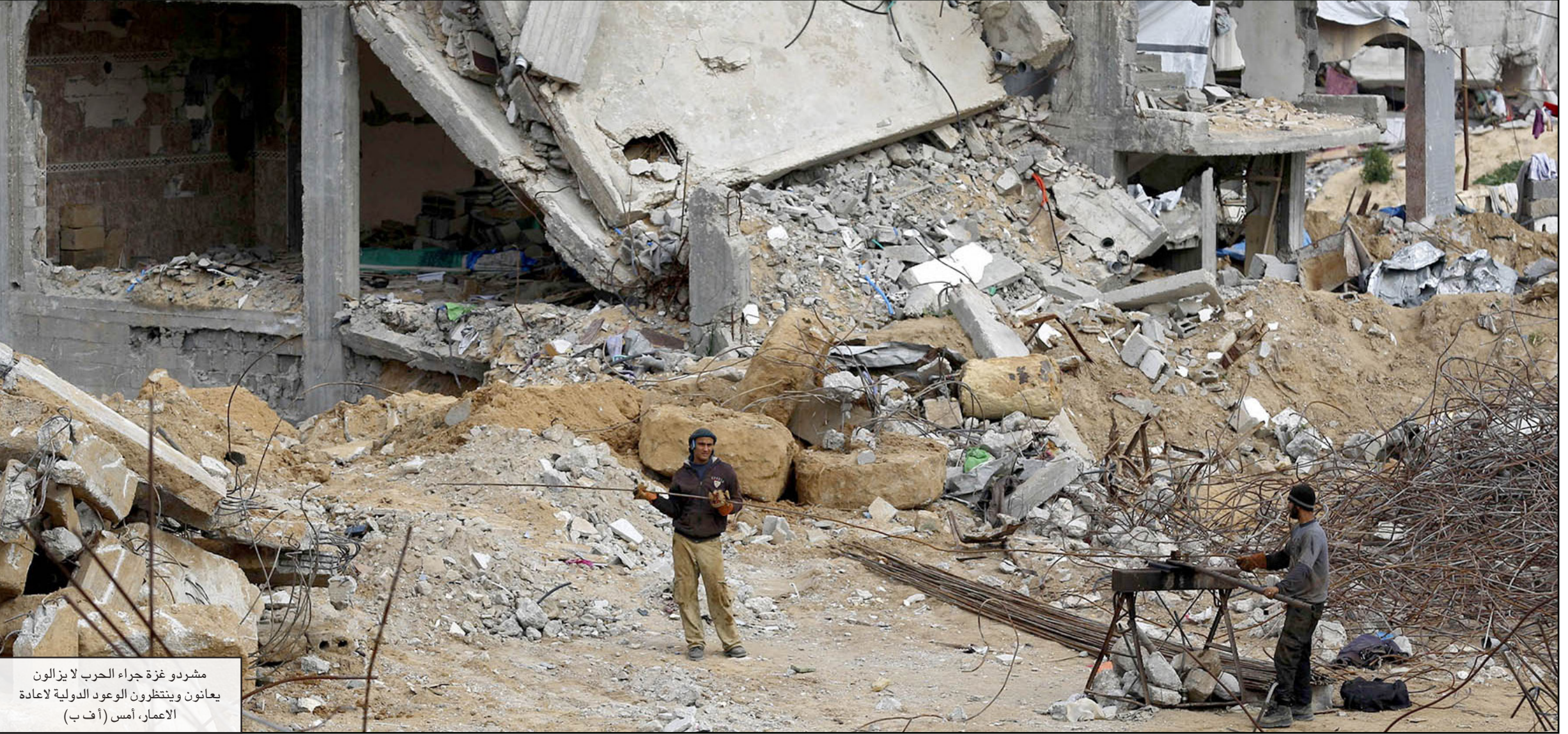
مشردو غزة جراء الحرب لا يزالون يعانون وينتظرون الوعد الدولية لإعادة الاعمار، أمس