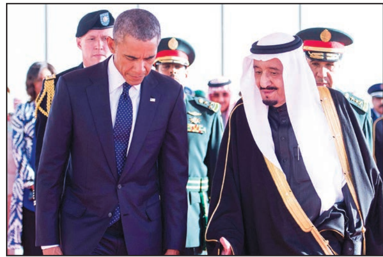
العاهل السعودي سلمان بن عبد العزيز خلال استقباله الرئيس الأمريكي باراك أوباما