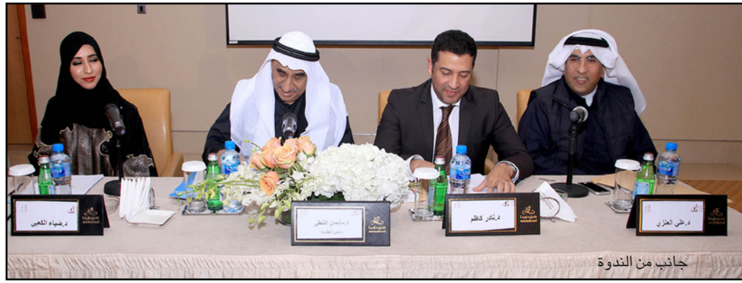
جانب من الندوة

الخليجي، امرأة الرويلا، في الخطاب الروائي النسوي الخليجي لكتابت من الجيل الجديد، ولا شك في أن أصوات السرد على ازدواجيات المجتمعات الخليجية والرغبة في التمرد تعكس بصورة أو بأخرى تلك الذات الأنثوية الباردة، التي قد تقارب موضوعاً أحياناً بصورة صادمة وجريئة.