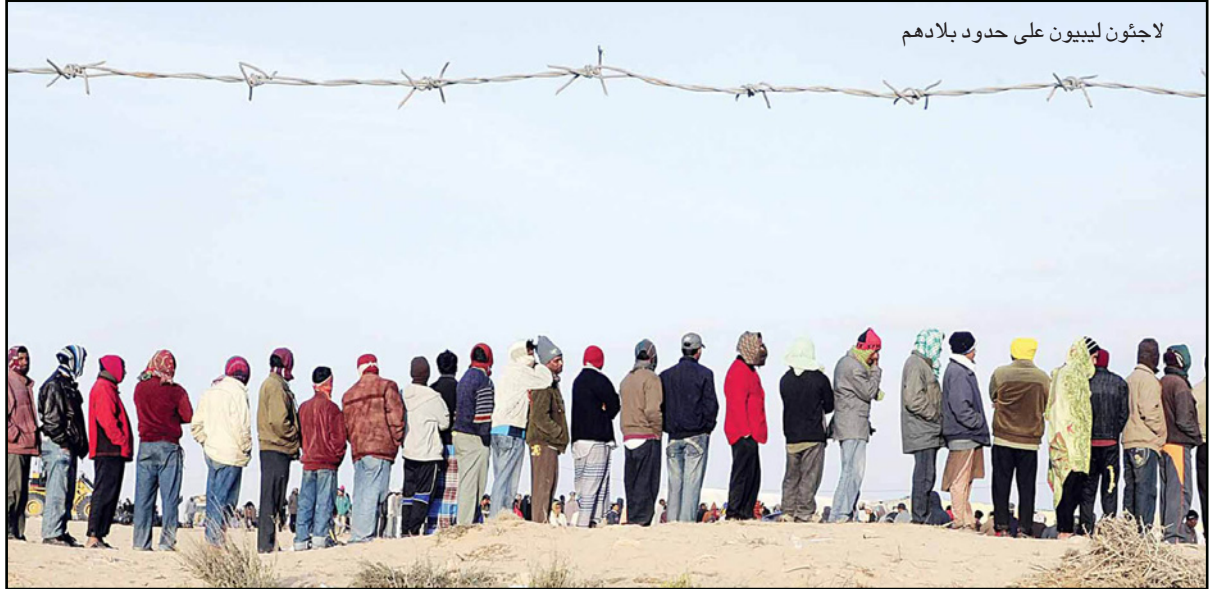
لاجئون ليبيون على حدود بلادهم

الإسلامية - ولاية طرابلس» حادث تفجير الفندق المطلقة عليها اسم «غزوة أبو أنس الليبي».