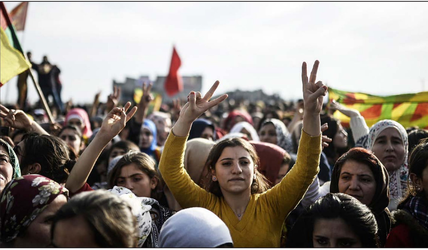
أكراد يحتفلون على الحدود التركية السورية بتحرير مدينة عين العرب - كوباني من تنظيم الدولة الإسلامية

كما كان للغارات الجوية التي نفذها التحالف الجوي على مواقع تنظيم الدولة الإسلامية الدور الأكبر في دعم المقاتلين الأكراد على الأرض. وقتل في معارك كوباني 1737 شخصاً، بينهم 1196 مقاتلاً من تنظيم الدولة الإسلامية. بعد خسارته عين العرب، لا زال تنظيم الدولة الإسلامية يسيطر على مساحات واسعة من شمال وشرق سوريا. وتنامى نفوذ التنظيمات الجهادية في سوريا خلال السنة الماضية، ما أدى إلى تعقيدات إضافية في النزاع السوري الذي بدأ منذ أربع سنوات بين النظام ومعارضيه. وقد تسبب بمقتل أكثر من مئتي ألف شخص.