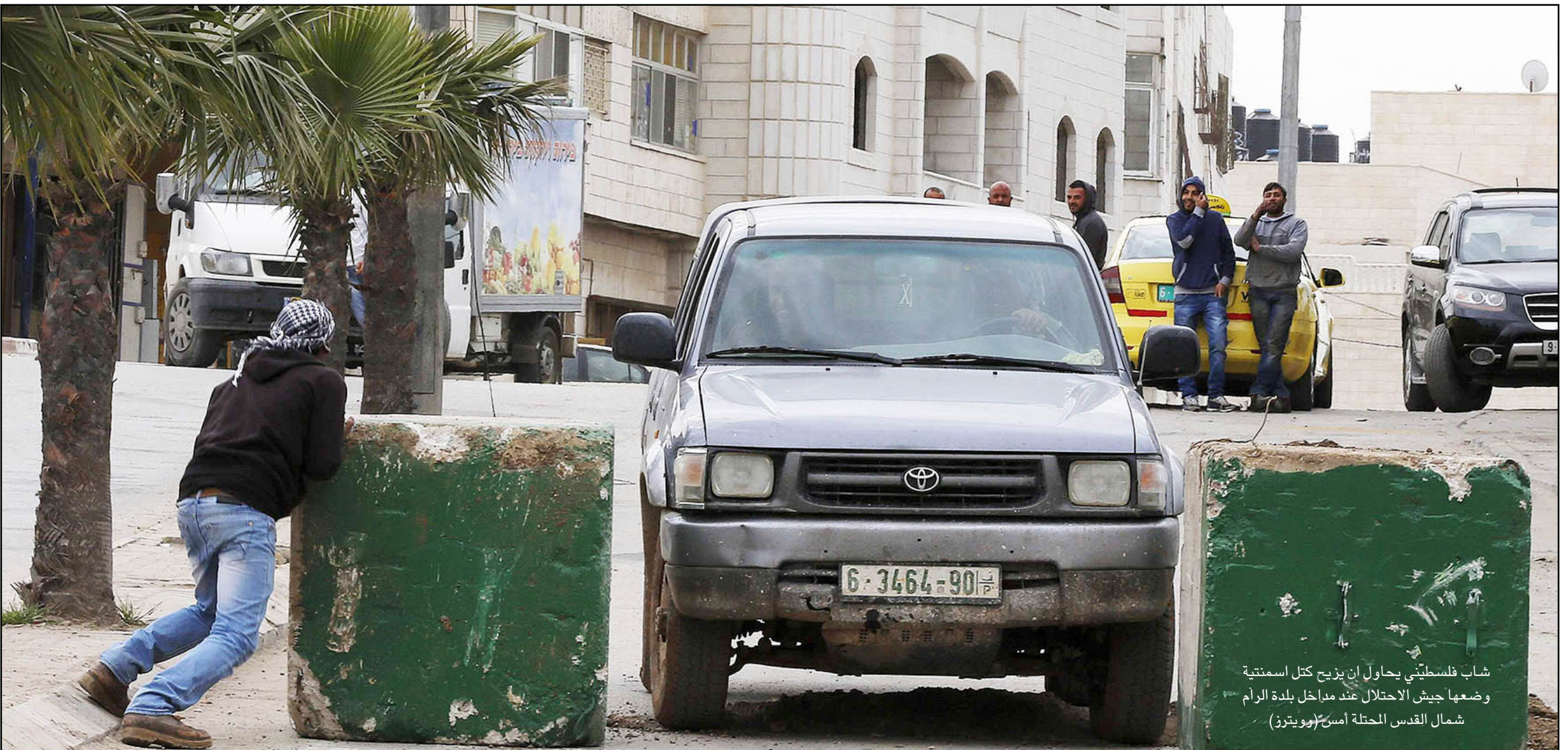
شاب فلسطيني يحاول إن يزيح كتل اسمنتية وضعتها جيش الاحتلال عند مداخل بلدة الرام شمال القدس المحتلة أمس

وتعاني قرى شرق يطا من هجمة مستمرة من قوات الاحتلال، ومجموعات المستوطنين، فتارة بمصادر الأراضي لأسباب عسكرية، وتارة أخرى باخطارات الهدم ومن ثم تنفيذ، رغم أن هذه القرى تعاش على الزراعة وتربية المواشي، وأوضاعهم الاقتصادية بالغة الصعبة. واعتقلت قوات الاحتلال عددا من الفلسطينيين في محافظة بيت لحم، وفي قلقيلية، وداهمت عدة قرى في محافظة جنين شمالا، بحجة البحث عن تسسيم مطلوبين لقوات الاحتلال الإسرائيلي للتحقيق، مشاركتهم في عمليات المقاومة ضد الاحتلال.