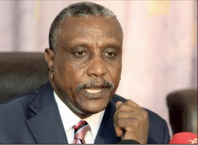
الأمين العام للحركة الشعبية لتحرير السودان (شمال) ياسر عمران

النظام ونحن ندعو شعبنا لتطور عملا مشتركا لنزع الانتخابات وأن تكون الانتخابات أرضية للعمل المشترك لاستقاط النظام. الأمر الآخر أنا أقول للإسلاميين السودانيين العزلانيين الذين يرغبون في التغيير والذين يرغبون في أجندة جديدة للمستقبل أن هذا النظام نظام شمولي، فاشي، فاسد، سلطوي استخدم الحركة الإسلامية نفسها ودمرها ووضعها في تعارض مع شعبيها وقام بتقسيم السودان وقام بالإبادة الجماعية وعلى الإسلاميين الراغبين في التغيير أن يعبروا إلى مربع جديد مع القوى السياسية السودانية كافة لرسم صورة جديدة للسودان وليأمنه أجندة وطنية جديدة ولبناء مشروع وطني جديد قائم على المواطنة والقبول بالأحر والديمقراطية وهذا ما سيستخدم الإسلام وما سيستخدم السودان وأن المجموعة الأمنية العسكرية التي تتحكم في السودان وتتحكم في الحركة الإسلامية هي أصبحت عدوا لكل السودانيين بما في ذلك الإسلاميين الراغبين في بناء حركة إسلامية تلتزم بقواعد الديمقراطية وتقف ضد الاغصاء ونحن في ذلك على استعداد أن نمد أيدينا وأن نعمل عملا مشتركا ولكن مطالبنا واضحة ولن نتخلى عنها ويجب أن نحقق مطالبنا بالنقاط أو بالضربة القاضية، ولن نقبل في أي مفاوضات حالية أو مقبلة دون أن يتوفر حق شعبنا في السلام والطعام والديمقراطية والعدالة والعدل دون ذلك هو اسقاط النظام.