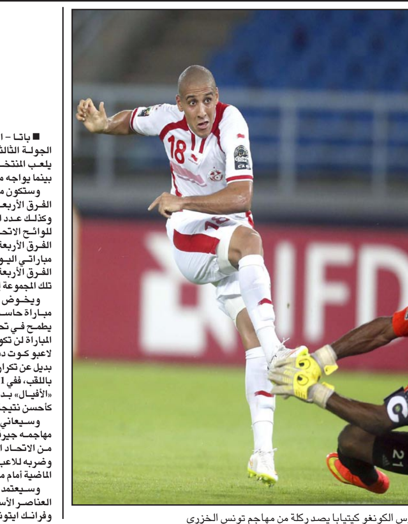
حراس الكونغو كيتييا يصد ركلة من مهاجم تونس الخزري