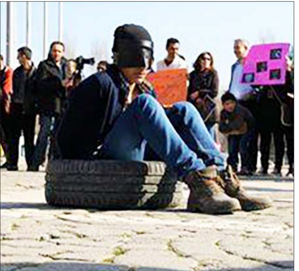
جانب من مظاهرة تطالب بالكشف عن مصير المعتقلين في سجون النظام

أن ذكر قصص الشهداء الذين قضوا تحت التعذيب يوضح صورة الثورة أو بعضاً منها، لذا قام الناس بثورة ضد هذا النظام؟ مما يترك أثراً كبيراً وقصية وجدانية لدى الناس لا يمكن إلا أن يتعاطفوا معها. كما بين أبو الخير أن هذه الحملة ستستمر حتى شباط/فبراير وستتضمن أيضاً وقات أمام السفارات للمطالبة بالمعتقلين. «أنا المعتقل المعتقل... هذه قصتي في سجون النظام»، عنوان صفحة على موقع «فيسبوك»، لنشر قصص المعتقلين والتحذير من أساليب ابتزاز أهاليهم، سواء عن طريق التقرب من أهالي المعتقلين والتضامن معهم، أو عن طريق النشر في صفحاتهم أخبار المعتقلين ليوحوا للمتابعين أنهم أصحاب قضية وفي بعض الأوقات يكون مجرد شريحة أو ميترينو، أو يلبغون لكسب ثقة الأهالي والمعارف وأخذ المعلومات عن المعتقل والإدلاء بها للأفرض الأمنية، وأحياناً يتم الابتزاز عن طريق الاتصال بهم بالهاتف ودفع مبالغ نقدية تتراوح قيمتها بين 500 ألف ليرة سورية إلى 5 ملايين ليرة سورية. وتمثلت الصفحة بعشرات القصص لمعتقلين يتحدث عنها أصحابها وهم عن أب بائت ورويته لأولاده حلاً، وعن طالب جامعي ترك مقعد فارغاً بسبب زملائه، وعن آخرين سلمت الأجهزة الأمنية هوياتهم على أنهم استشهدوا تحت التعذيب وهم لا زالوا أحياء وكل ذلك بغية ابتزاز هؤلاء الأهالي. «لا أنكر التاريخ الذي اعتقلت به، لا أنكر السنة، ولا اليوم، ولا الشهر، نسيت حتى باي فرح كنت، تحولت لرقم، أنت الآن رقم نازح، وهو رقم معتقل، وذلك رقم لاجئ، وأخر رقم شهيد، وحتى لا تحول جميعاً إلى أرقام دعونا نطلب بهم، كتبوا وأشعروا وطالبوا بكتبتهم لتتمسك الأرقام يوماً، هكذا تختمت شام مذكرات اعتقالها على صفحاتها، فتمت تنتهي لعبة الأرقام في سوريا».