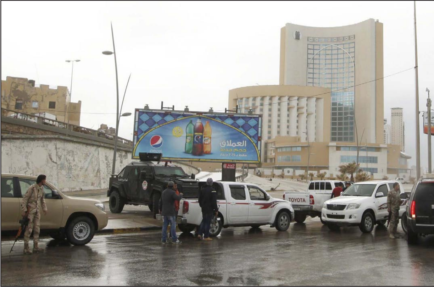
رجال أمن ليبون يتفقدون مكان انفجار السيارة المفخخة في الباحة الخارجية لفندق كورنثيا وسط العاصمة الليبية طرابلس