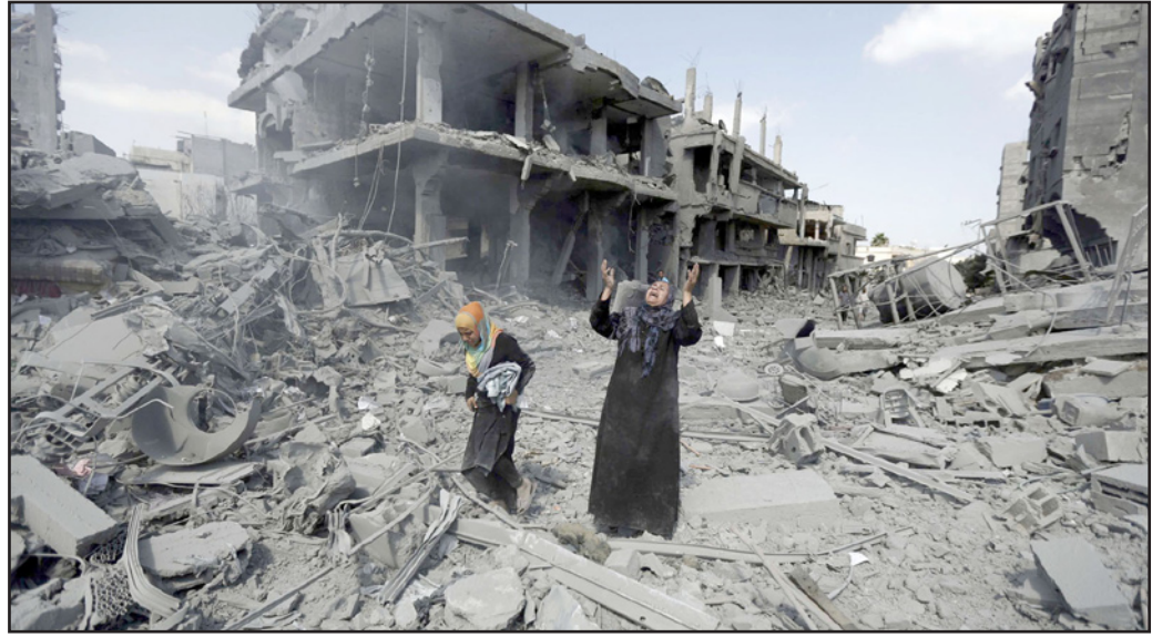
سيدة فلسطينية وابنتها فوق حطام منزل بعدما بعد القصف الاسرائيلي على غزة عام 2012