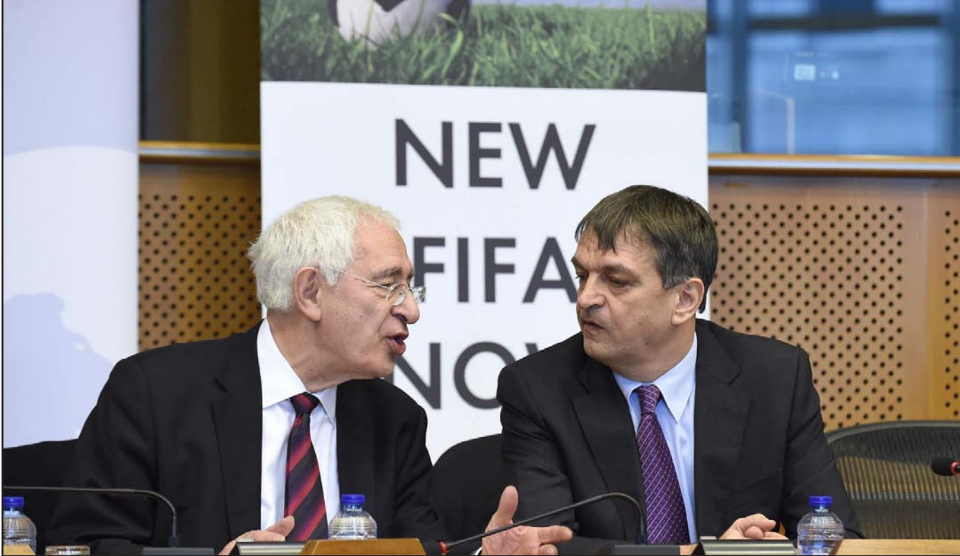
شامبين (يمين) أحد المرشحين لمنافسة بلاثر إلى جانب الإنكليزي ترايسمان

ماين نيكولاس الرئيس السابق لاتحاد تشيلي عن ترشيحه هو أيضا خلال الساعات المقبلة، يذكر أن باب الترشيح سيغلق في 29 كانون الثاني/يناير الجاري.