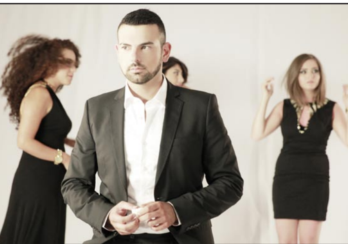
لقطة من الفيديو كليب