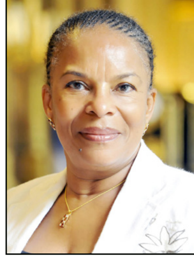
كريستيان تاو بيرا

برنامجاً مطولاً لمهاجمة المغرب بطريقة عنيفة، عندما اعتبرته «أكبر مزور رئيسي لأوروبا بالخشيش والقنب الهندي»، كما اعتبرته «جثة لم تجرد من الدولين في المنوعات والبشر».