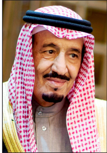
العاهل السعودي الملك سلمان بن عبد العزيز

ولربما تكون هذه هي الورثة التي نقلها الملك عبد الله إلى ورثته سلمان ابن الـ 79 سنة، والذي توج