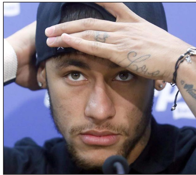
نيمار نجم برشلونة خلال المؤتمر الصحفي قبل لقاء أتلتيكو الليلة

مدريد - د ب أ: أكد ريال مدريد أنه غير قلق جراء التحقيق المحتمل معه من الاتحاد الدولي لكرة القدم بشأن تعاقد مع لاعبين قصر، كما أعرب عن استعداده للتعاون مع المؤسسة الكروية الدولية. وقال إميليو بوتراغينو مدير العلاقات العامة بالنادي الملكي: «نحن متفقون تماما مع الفيفا في هذا الموضوع... لقد تعاوننا سابقا مع الفيفا وسنتسلح بالتعاون معه... نشعر بهدوء كبير في ما يخص سلامة الإجراءات التي اتخذها الريال»، وكانت صحيفة «أس» الأسبانية أكدت أن الفيفا فتح تحقيقا مع الريال لاستبيان حقيقة قيام النادي بارتكاب مخالفات قانونية في التعاقد مع لاعبين قصر. وقالت: «الفيفا يحقق مع الريال للوقوف على حقيقة التزام النادي بضمون المادة 19 من اللائحة الخاصة بالتعاقد وانتقال اللاعبين والتي تحظر