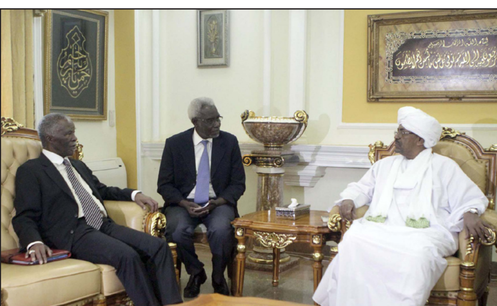
الوسيط الافريقي ثامير امبيكي خلال لقائه الرئيس السوداني عمر البشير في الخرطوم أمس

البشير يعهد لإمبيكي بتوفير ضمانات للمتمردين للمشاركة في الحوار البشير يعهد لإمبيكي بتوفير ضمانات للمتمردين للمشاركة في الحوار البشير يعهد لإمبيكي بتوفير ضمانات للمتمردين للمشاركة في الحوار