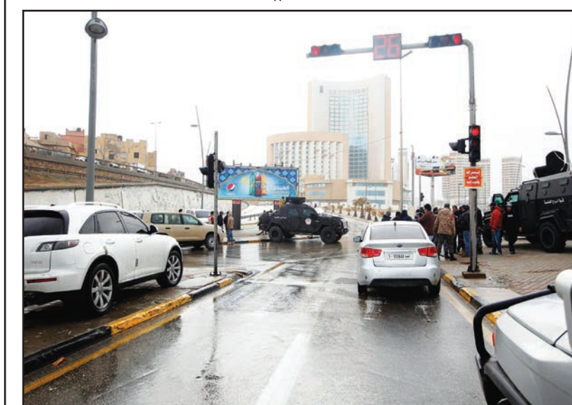
قوات أمن ليبية قرب فندق كورنثيا في طرابلس بعد الهجوم عليه