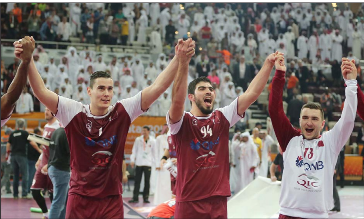
نجوم المنتخب القطري يحتفلون بفوزهم على ألمانيا والتأهل الى نصف النهائي

الذهبي للنسخة الماضية من كأس أوروبا لكرة اليد، وستنجم المباراة بين كويبة من أفضل نجوم كرة اليد في العالم، حيث سيكون فاليريو ريجيفيرا وجوان كانياس وكريستيان أوجالدو وراؤول بيرتيريروس في مواجهة أمثال أليغور