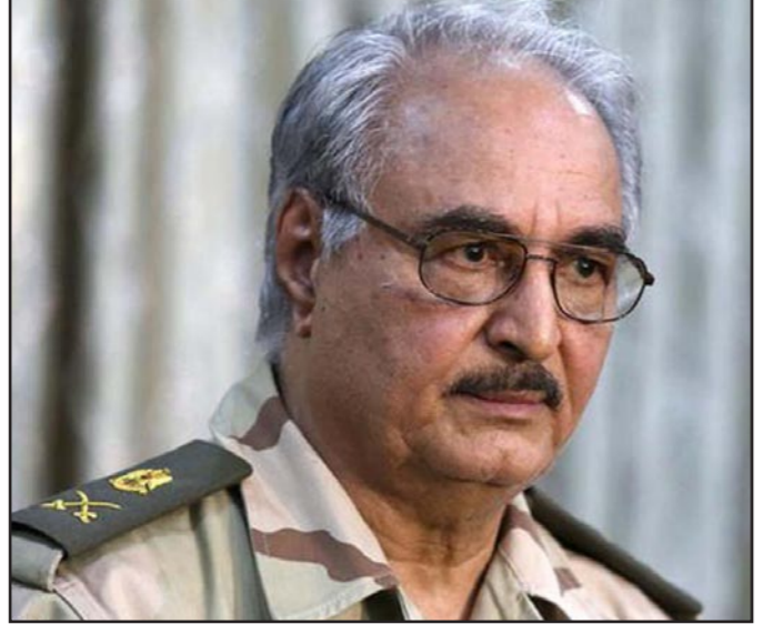
اللواء خليفة حفتر

بنغازي - مع معزز الجبري: أعرب اللواء الليبي، خليفة حفتر، الذي يقود عملية عسكرية ضد كتائب الثوار في ليبيا وتنظيم أنصار الشريعة، الأربعاء، أنه ستعد للدخول في تسوية مشروطة تؤدي إلى استئجاب الأمن في ليبيا. جاء ذلك خلال حوار تلفزيوني أجرته فضائية «سي بي سي» الليبية مساء الثلاثاء، مع حفتر قال فيه «أنا مستعد للدخول في تسوية إذا ما كانت ستؤدي إلى استئجاب الأمن في ليبيا وأي شيء يسعد الشعب الليبي سايصم عليه بالعبث». وأشطر حفتر للدخول في تسوية تسليح الجيش الليبي، وما وصفه ب«رجوع خصومه» إلى قولهم «وأن يعرفوا أن الحقيقة هي أن يعيش الشعب الليبي في أمن وحياء طبيعي»، وقال حفتر: «نحن نطلب ما نستطيع أن ندافع به عن أنفسنا وهذه المجموعات المسلحة التي تأتي من أسيا ومناطق أخرى ينبغي مواجهتها ولا نسعى بالمساعدات العربية الخروج من نطاق ليبيا». وعن مجريات المعارك قال حفتر إن «قوات