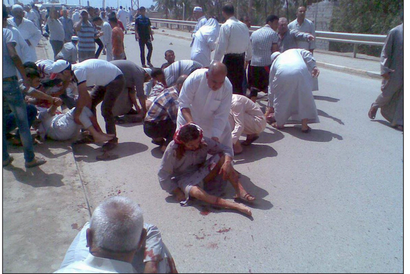
عراقيون يساعدون ضحايا مذبحه ديالى