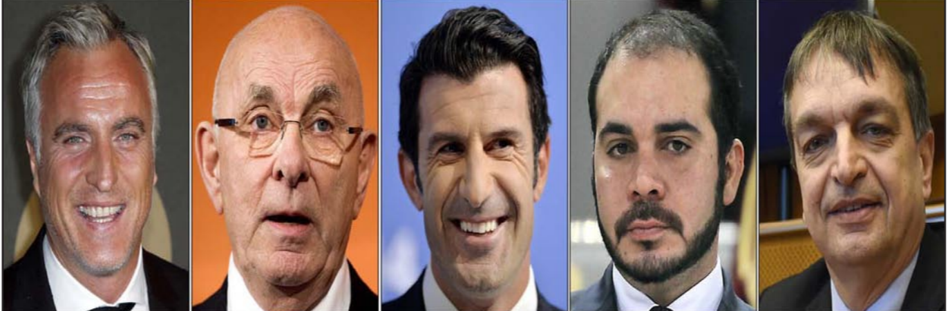
منافسو بلازر على زعامة الفيفا من اليمين: الفرنسي شامبين والأمير الأردني علي والنجم البرتغالي فيغو والهولندي فان براغ والنجم الفرنسي جينولا

■ برلين - د ب أ: تقدم السويسري جوزيف بلازر رئيس الاتحاد الدولي لكرة القدم رسمياً بطلب ترشحه لفرقة خاصة على رئاسة الفيفا. وأوضح بلازر، في تغريدته على «تويتر»: «اليوم تاريخ بارز في الروانمة الانتخابية. قدمت طلبتي، والآن، تتابع اللجنة الانتخابية عملها». وأغلق في وقت متأخر أسس باب التقدم والطلبات أمام المرشحين الراغبين في التنافس على رئاسة الفيفا. وتخضع أوراق المتقدمين لعملية فحص من لجنة القيم بالفيفا قبل أن تعلن لجنة الانتخابات في الأيام المقبلة هوية المرشحين المتنافسين الذين يمتلكون أهلية التنافس على هذا المنصب. وأعلن خمسة أشخاص عن اعتزامهم الترشح أمام بلازر الذي يتزعم الفيفا منذ 1998 وهذه هي أول محاولة للترشح أمامه على هذا المنصب منذ فوزه على الكاميروني عيسى حياتو رئيس الاتحاد الأفريقي للعبة (كاف) في 2002 فيما فاز بلازر في 2011 و2017 دون ترشح أي شخص أمامه. والشخصان الخمسة الذين أعلنوا رغبتهم في الترشح أمام بلازر هم النجم البرتغالي لويس فيغو والهولندي مايكل فان براغ والأمير الأردني علي بن الحسين والنجم الفرنسي السابق ديفيد جينولا ومواطنه جيروم شامبين المسؤول التقني السابق بالفيفا، فيما أعلن هارولد ماين نيكولاس الرئيس السابق للاتحاد تشيلي أنه لن يترشح بسبب وجود بعض المرشحين الآخرين الأكثر ملاءمة للمنصب، على حد تعبيره.