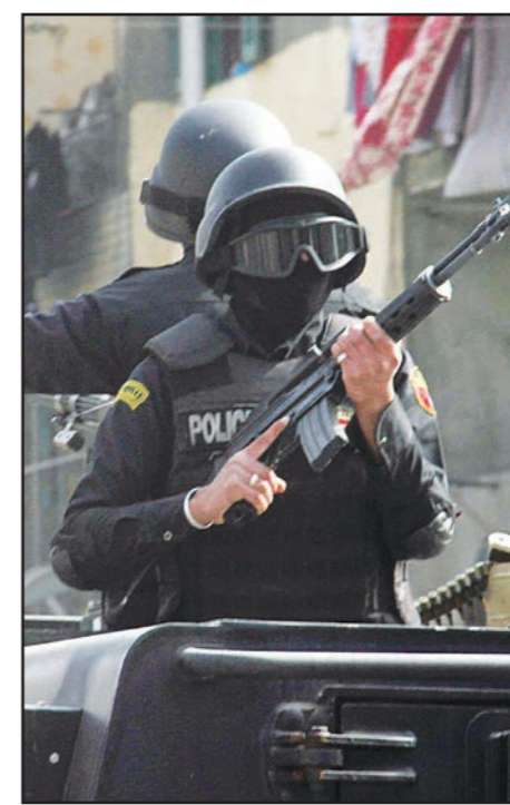
عناصر أمنية مصرية في حالة استعداد العريش.

وقبل ذلك أيضاً مهد بيان صدر عن مجلسي النواب والأعيان (مجلس الأمة) لكشف المشدد المتوقع، حيث أكد على صعوبة الثقة بتنظيم «الدولة الإسلامية»، أو جدية عرضه للتفاوض السيفري. وأشار البيان المشترك لمجلس الأمة بعد انتهاء اجتماعه مع الحكومة واستماعه إلى شرح تضمن