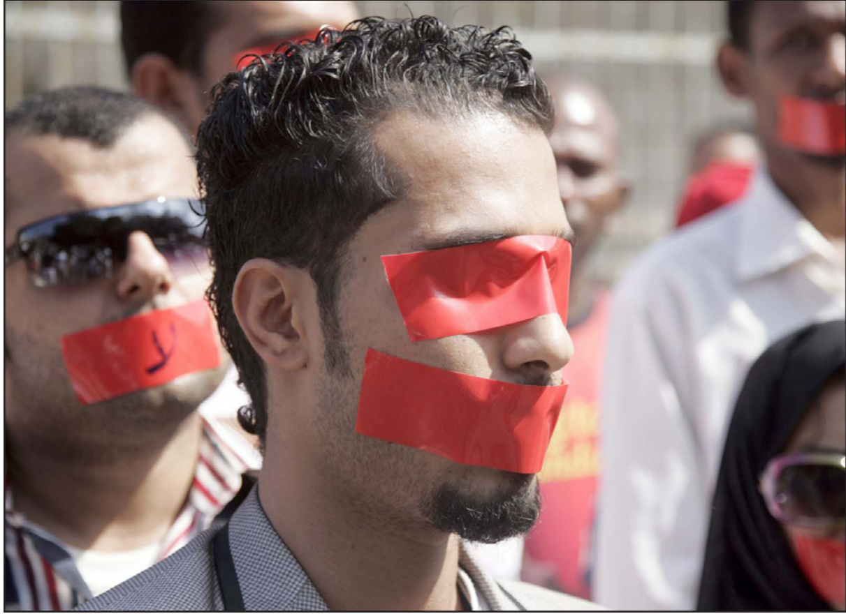
موظفون في تلفزيون عدن الرسمي يقفون خارج مكاتبهم مع لوائق على عيونهم وأفواههم تعبيراً عن الاحتجاج ضد إيقاف حركة الحوثيين لبث التلفزيون

استيانتنا من العملية الانقلابية التي قادتها حركة أنصار الله (الحوثيون) يوم 19 يناير/ كانون الثاني 2015م وذلك من خلال استيلائها على أهم موقع سيادي للدولة بطريقة عسكرية وهو دار الرئاسة والذي أسفر عن سقوط عدد من القتلى والجرحى بعد مهاجمة منزل الرئيس عبدربه منصور هادي والتسبب في مقتل وجرح عدد كبير من حراساته الشخصية».