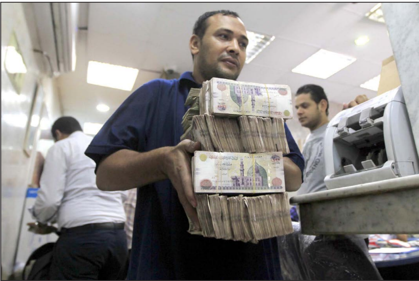
محل صرافة في القاهرة في وقت سابق قبل اجراءات البنك المركزي الاخيرة

القاهرة - رويترز: بعد أسبوعين من بدء الحرب على السوق السوداء استخدم البنك المركزي المصري أسس الخميس سلاحا جديدا، إذ سمح للبنوك بتوسيع هامش بيع وشراء الدولار إلى عشرة قروش، بينما واصل دفع الجنيه للهبوط إلى مستويات جديدة في عطاءات الدولار. وادى التحرك المفاجئ إلى هبوط الجنيه المصري أمام الدولار في البنوك إلى 7.59 جنيه، مسجلا أدنى سعر رسمي على الإطلاق. وأبلغ مصرفيون رويترز أن المركزي سمح للبنوك بتوسيع هامش بيع وشراء الدولار ليصل إلى عشرة قروش، مقارنة مع الهامش السابق وهو ثلاثة قروش.