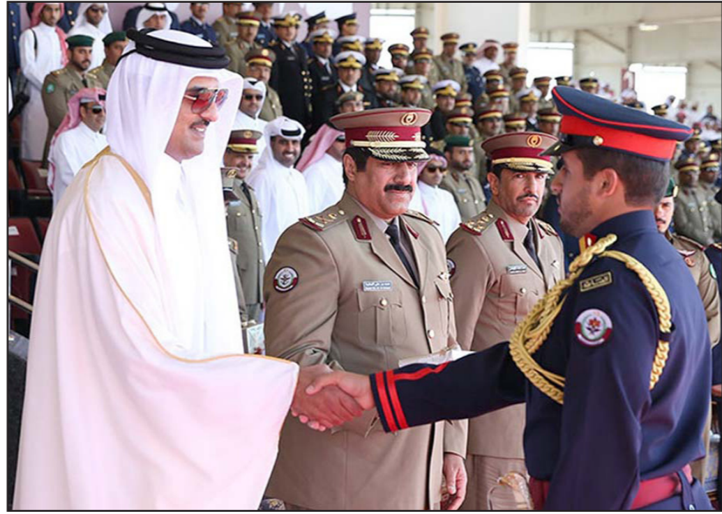
أمير قطر الشيخ تميم بن حمد آل ثاني يصاحف أحد المتخرفين في حفل تخريج ضباط الكليتين العسكرية والجوية في الدوحة

واعتبر القائد أن هذا الرقي كان له أكبر الأثر في إنجاز مسيرة الكلية والوصول إلى المستوى الذي تتمتع إليه وهو أن تكون في مصاف الكليات الجوية العربية بالمنطقة. وأضاف العميد النائب في تصريحه الصحافي «إن الضباط الذين تخرجوا اليوم يحملون بكالوريوس العلوم الجوية والدبلوم العسكري وقد تم تدريبهم على أحدث الطائرات في