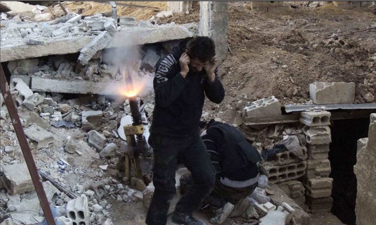
مقاتلان من المعارضة السورية المسلحة يطلقان قذيفة هاون تجاه قوات النظام في حي جوبر قرب دمشق

مسؤوليتها عن الهجوم على فندق «كورنيثا» في العاصمة طرابلس والذي قتل فيه ١٠ اشخاص منهم متعهد أمريكي. ففي آخر إعلان لأبو محمد العذائني، المتحدث الرسمي باسم تنظيم الدولة الإسلامية قال إن خراسان وهي منطقة واقعة بين أفغانستان وإيران وبأسمها أعلنت تعاون بين التنظيم وتنظيم القاعدة في اليمن. وترى المصادر الأمنية الأمريكية أن للتنظيم حضورا في ليبيا، وانضم تنظيم «انصار بيت المقدس» إلى «الدولة»، وصار اسمها «ولاية سينا».