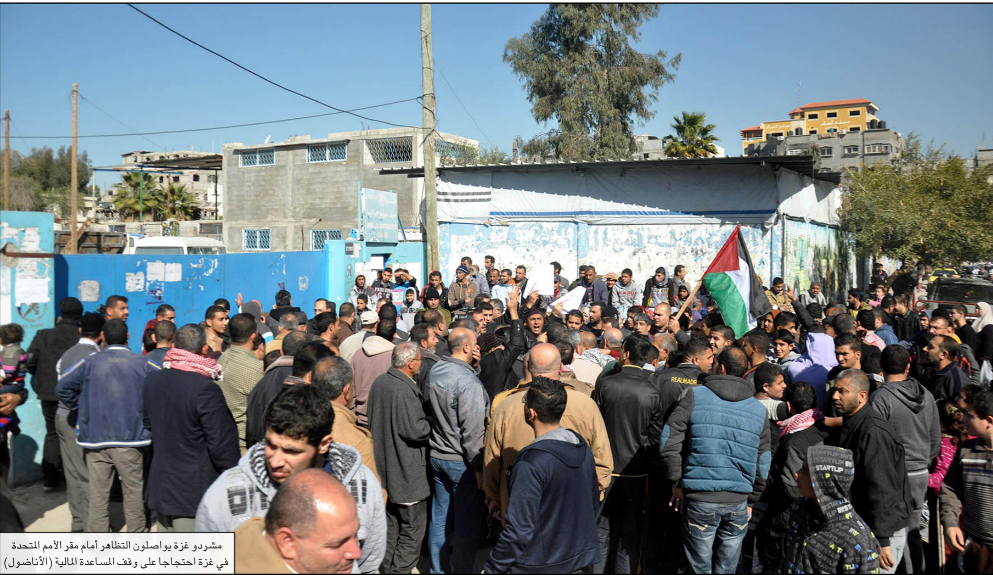
مشردو غزة يواصلون التظاهر أمام مقر الأمم المتحدة في غزة احتجاجاً على وقف المساعدة المالية (الأناضول)

وأشار هذا المسؤول إلى أن العاملين في مكتب سيري، طالبوا قبل العودة مجدداً للعمل، أن تقدم لهم حركة حماس بصفتها مسؤولة عن الأمن في القطاع «ضمانات أمنية تشمل عدم تعرضهم لهجوم آخر»، مشيراً إلى أن الأمم المتحدة تخشى أن يؤسس ذلك الهجوم لاعتداءات مستقبلية على الموظفين. وأوضح المسؤول أن الهجوم الذي تعرض له مكتب منسق الأمين العام في المناطق الفلسطينية «الأونسكو» أسفر عن سقوط حجارة على المقر، وتحتطم بعض المحتويات، وسرقة شبكة الاتصالات اللاسلكية. وبحسب المسؤول فإن توقف الموظفين في مكتب «الأونسكو» عن العمل من شأنه أن يؤثر على عمليات إدخال مواد البناء في هذه الأوقات، لصالح مشاريع ترميم المنازل التي مددت جزئياً في الحرب الإسرائيلية الأخيرة، خاصة وأن مكتب سيري هو المشرف على تنفيذ خطة الأعمال. وقال إن لتوقيع سيري بمراجعة الخدمات الطارئة، يشير إلى ذلك، لكن ذلك لا ينسحب على الخدمات التي تقدمها وكالة غوث وتشغيل اللاجئين «الأونروا»، بل سيقتصر على موظفي خدمات «الأونسكو». وكان مندوبو الحرب قد هاجموا أول من أمس مقر الأمم المتحدة في مدينة غزة، ورشقوه بالحجارة، وأشعلوا أمامه إطارات السيارات، وحاولوا اقتحامه، بعد أن أعلنت وكالة غوث وتشغيل اللاجئين الفلسطينيين «الأونروا»، وقف مساعداتها لشردى هذه الحرب، ممن هدمت منازلهم وابتاتوا بلا مأوى. ورد المشاركون أثناء الهجوم عبارات تندد بالأمم المتحدة، وبخطة الإعمار التي وضعتها لبناء المنازل المدمرة