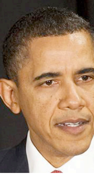
الرئيس الأمريكي باراك أوباما

وكان موقع «الحدث نيوز» أكد مؤخرًا مقتل السعودي سلطان السفري الملقب بـ«أبو نضار الحربي» الذي يعتبر من أهم المهندسين العسكريين للتنظيم، في غارة شنها طيران التحالف الدولي على موقع لتعاصر التنظيم في مدينة عين العرب بريف حلب.