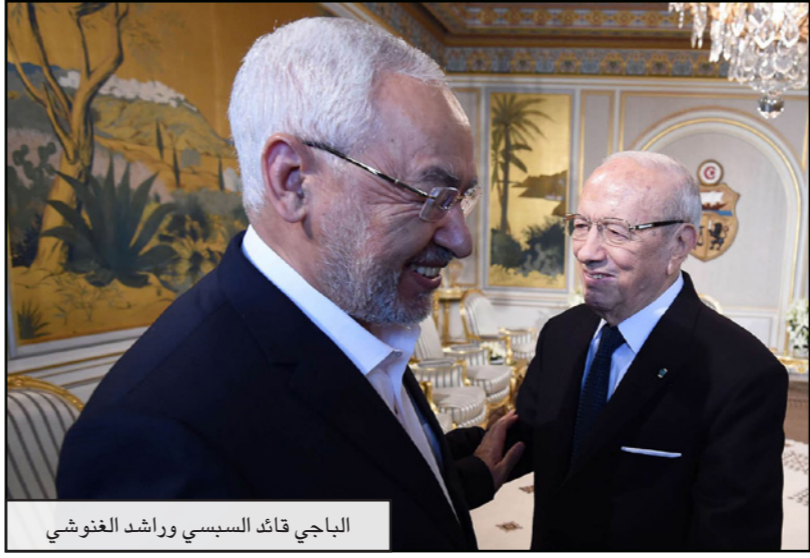
الباجي قائد السبسي وراشد الغنوشي

نفرغ نتائجه من أي معنى وتأسيساً عليه نرسم توجهنا، فالشعب التونسي صوت لأغلبية وصوت معارضة، والتجربة ما زالت في بدايتها». وكان رئيس حركة النهضة الشيخ راشد الغنوشي أكد الأربعاء عقب لقائه رئيس الحكومة الملك الحبيب الصيد أن مشاركة النهضة في الحكومة الجديدة «متوقعة جداً»، مشيراً إلى أن «المشاورات إيجابية وجادة وتفتح آفاقاً للمشاركة إذا تم التوصل إلى اتفاق»، كما أكد أن تشكيلة