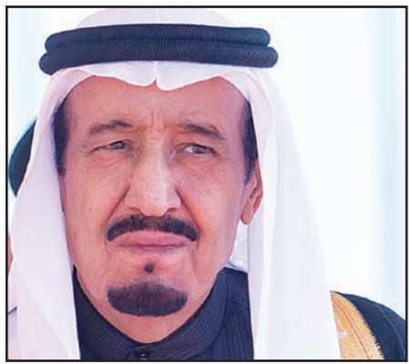
العاهل السعودي سلمان بن عبد العزيز

دمجت القرارات الملكية وزارة التربية مع وزارة التعليم العالي وعين وزير جديدا لها بعد إغفاء الأمير خالد الفيصل من تولي وزارة التربية وإعادة منصبه السابق أميراً لمنطقة مكة المكرمة ومستشاراً للملك. وطعم الملك الجديد حكومته بدماء جديدة وشابة من الوزراء مثل وزير الثقافة والإعلام عادل الطريفي الذي عين قبل شهور قليلة مديراً لقناة «العربية»، ووزير الشؤون الاجتماعية ماجد القصبي وأحمد الخطيب ووزير الصحة وخالد العرج ووزير الخدمة المدنية. وشملت القرارات الملكية تغييراً في التركيبة الأمنية السعودية حيث أعفى الأمير خالد بن بندر بن عبد العزيز من منصبه كرئيس للاستخبارات وعيّن مستشاراً برتبة وزير. وعين الفريق خالد الحميدان رئيساً لهذا الجهاز الأمني المهم، والقي مجلس الأمن الوطني الذي كان أمينه العام الأمير بندر بن سلطان الذي أعفي من منصبه. وهذا ما يشير إلى أن الأمن وأجهزته الداخلية والخارجية ستكون تحت سلطة وأشرف مباشرة من الأمير محمد بن نايف وزير الداخلية الذي أصبح ولياً لولي العهد.