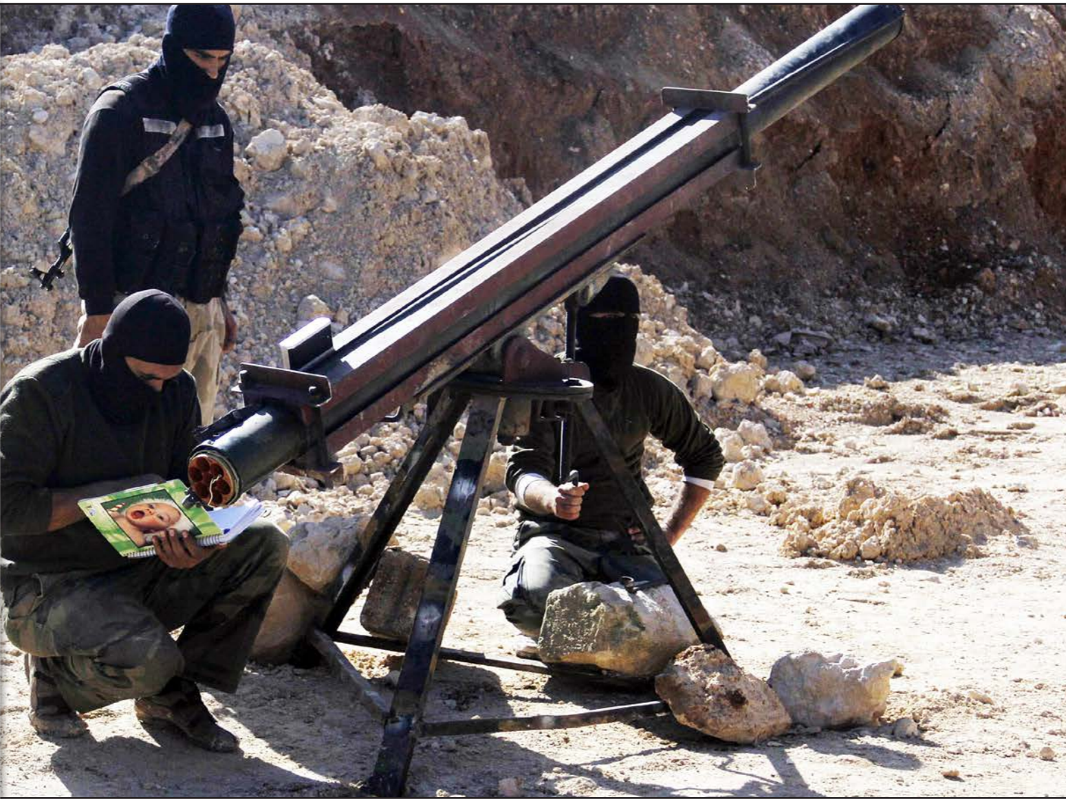
مقاتلون من المعارضة السورية المسلحة يعدون صاروخاً لإطلاقه باتجاه قوات النظام في الصلالية بريف حماة