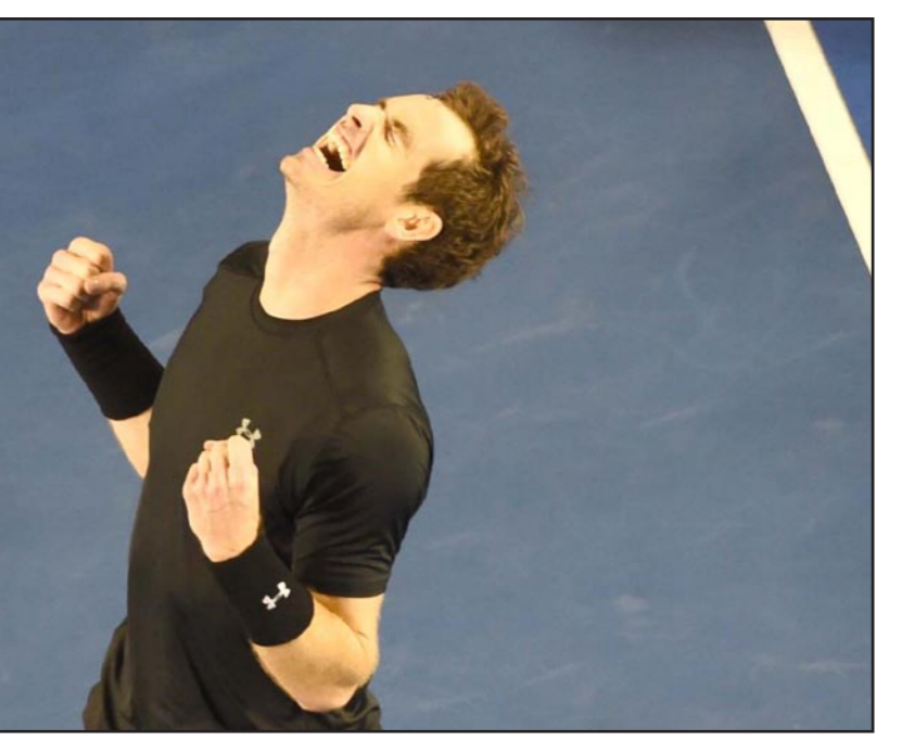
البريطاني مري يحتفل ببلوغه المباراة النهائية بعد فوزه على بيرديتش