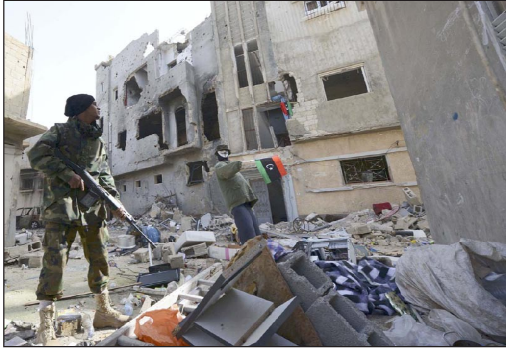
عنصر من الجيش الليبي النظامي يراقب مبنى دمر جراء الاشتباكات بين الفصائل في بنغازي