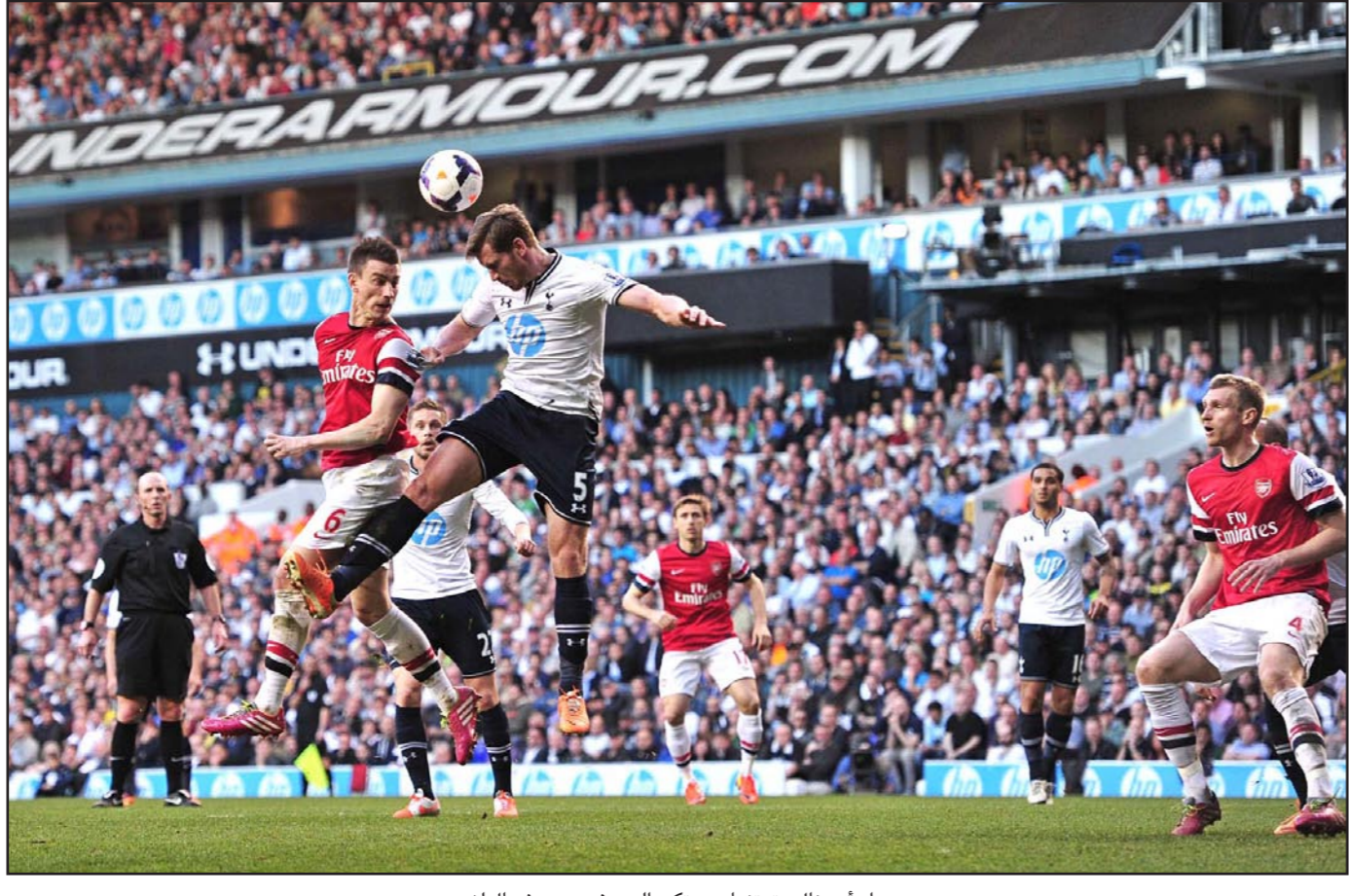
صراع أرسنال وتوتنهام سيترك اليوم في دربي شمال لندن

■ مدريد - الأناضول: رفضت لجنة المسابقات في الاتحاد الإسباني الطعن الذي تقدم به ريال مدريد في البطاقة الصفراء التي حصل عليها البرازيلي مارسيلو خلال مواجهة أشبيلية في المباراة المؤجلة من الجولة 16 للدوري. وحسب موقع الاتحاد المحلي للعبة، فإنه تم رفض الطعن، وتم تثبيت البطاقة الصفراء التي حصل عليها مارسيلو. وتقدم الريال ليقطع مصور أمام اللجنة يقول