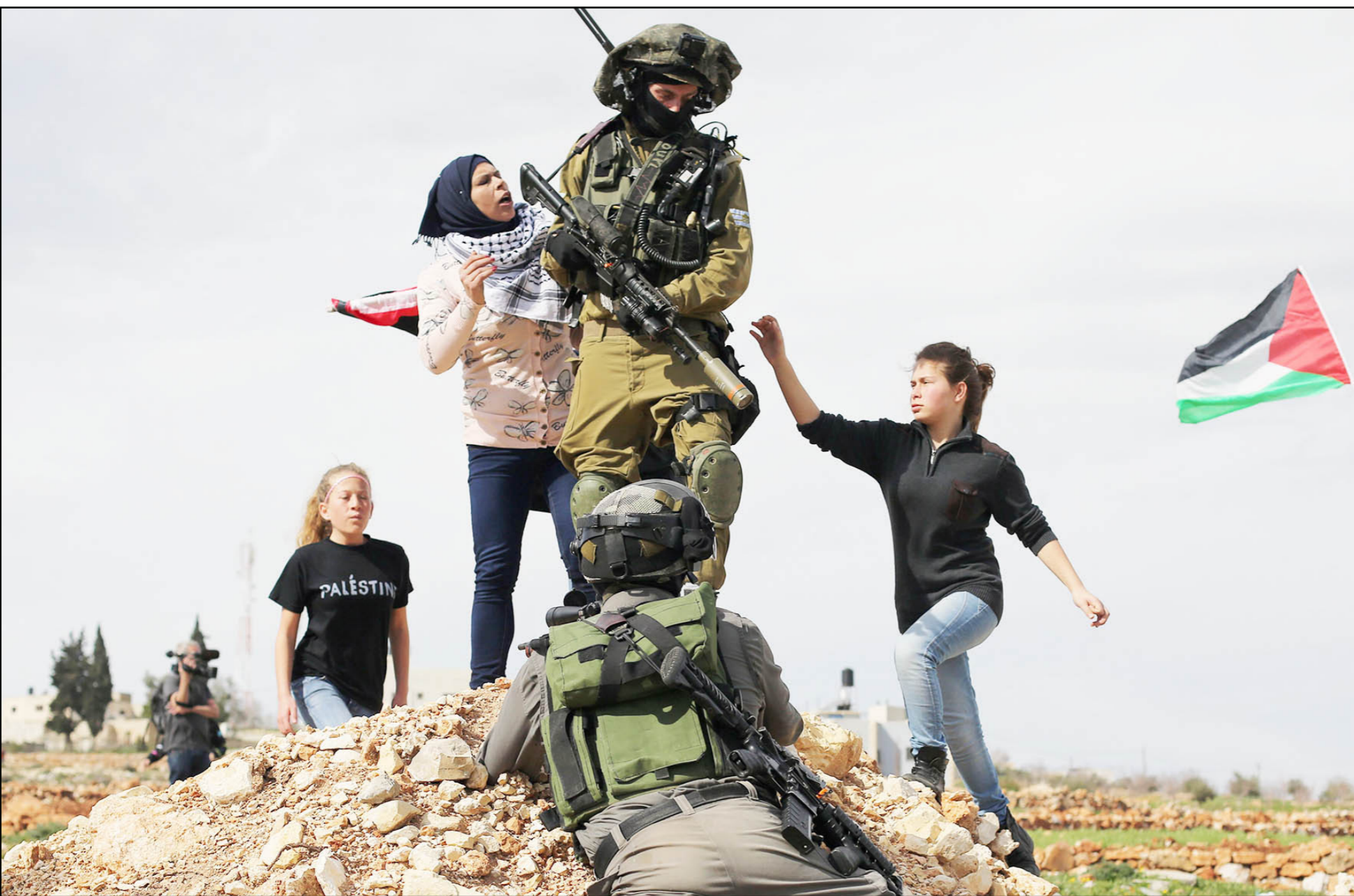
فلسطينيون وأجانب يحتجون ضد مصادرة الأراضي في قرية النبي صالح قرب رام الله (أس أف ب)

عملية السلام ومبدأ وقد حل الدولتين. والجدير بالذكر أن هذا الوفد الإسلامي هو جزء من فريق اتصال وزاري كلف من مجلس وزراء خارجية دول منظمة التعاون الإسلامي بتنفيذ خطة تحرك إسلامي لدعم القضية الفلسطينية وحماية مدينة القدس والمقدسات الإسلامية والمسيحية.