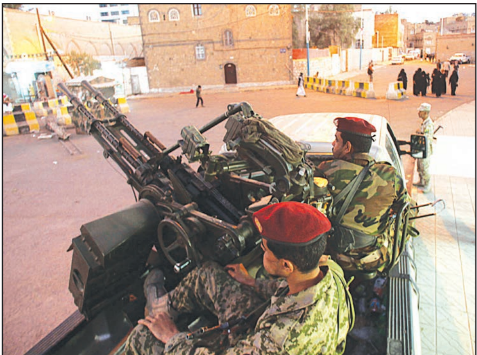
مقاتلون حوثيون بملابس عسكرية خارج القصر الرئاسي في صنعاء أمس