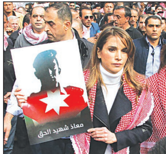
الملكة الأردنية رانيا تحمل صورة للطيار معاذ الكساسبة خلال مظاهرة للتنديد بإعدامه على يد تنظيم «الدولة الإسلامية»

عمان - «القدس العربي» من بسام البدارين: حدثان لا يمكن إسقاطهما من أي تحليل عميق برزا صباح الجمعة في الأردن على صعيد «المواجهة التي أصبحت مفتوحة، مع تنظيم «الدولة الإسلامية»، بعد الإعلان عن إعدام الطيار معاذ الكساسبة. الملكة رانيا العبد الله شخصياً، وفي الحدث الأول تقود تظاهرة شعبية حاشدة تخلق وسط العاصمة عمان، في إطار الاحتجاج وتتوعد تنظيم «الدولة الإسلامية»، في الوقت الذي تنطلق فيه آلاف الحناجر بهتاف موحد يقول «يا داعش صيرك... عمان ستحرق قيرك». وفي الحدث الثاني يظهر المنظر الأبرز في المنطقة للثيار السلفي الجهادي الخارج للتلو من سجنه الأردني الشيخ أبو محمد المقدسي بلزمة بجملة «بقدي شرسة»، وحسدة ثققت تماماً على «تنظيم الدولة»، وتثيراً شرعياً من