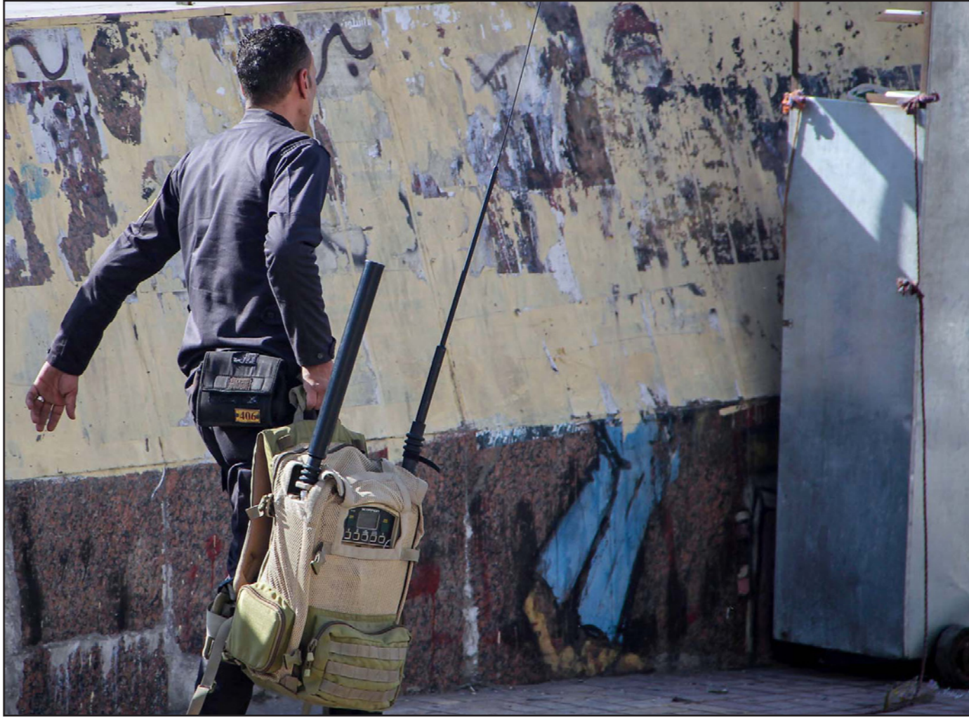
خبير مفرقات في موقع أحد القنابل بالإسكندرية الجمعة

المساعدة في إعادة إعمار غزة بان عليهم «الوفاء بالتزاماتهم في هذا الصدد»، وقال وزير الخارجية النرويجي بورج برينده في مؤتمر صحافي لم يبلغنا أحد بأنه غير ملتزم بما تعهد به لكن أيضا نتيجة أسعار النفط ومسائل أخرى في الخليج كان هناك بعض البلبه». ولم يخص الوزير عقب اجتماع لمنظمة التعاون الإسلامي في أوغلو دولا بعينها بالانتقاد أو يحددان كم من مبلغ 5.4 مليار دولار تعهد بها المانحون وصل إلى الفلبينيين.