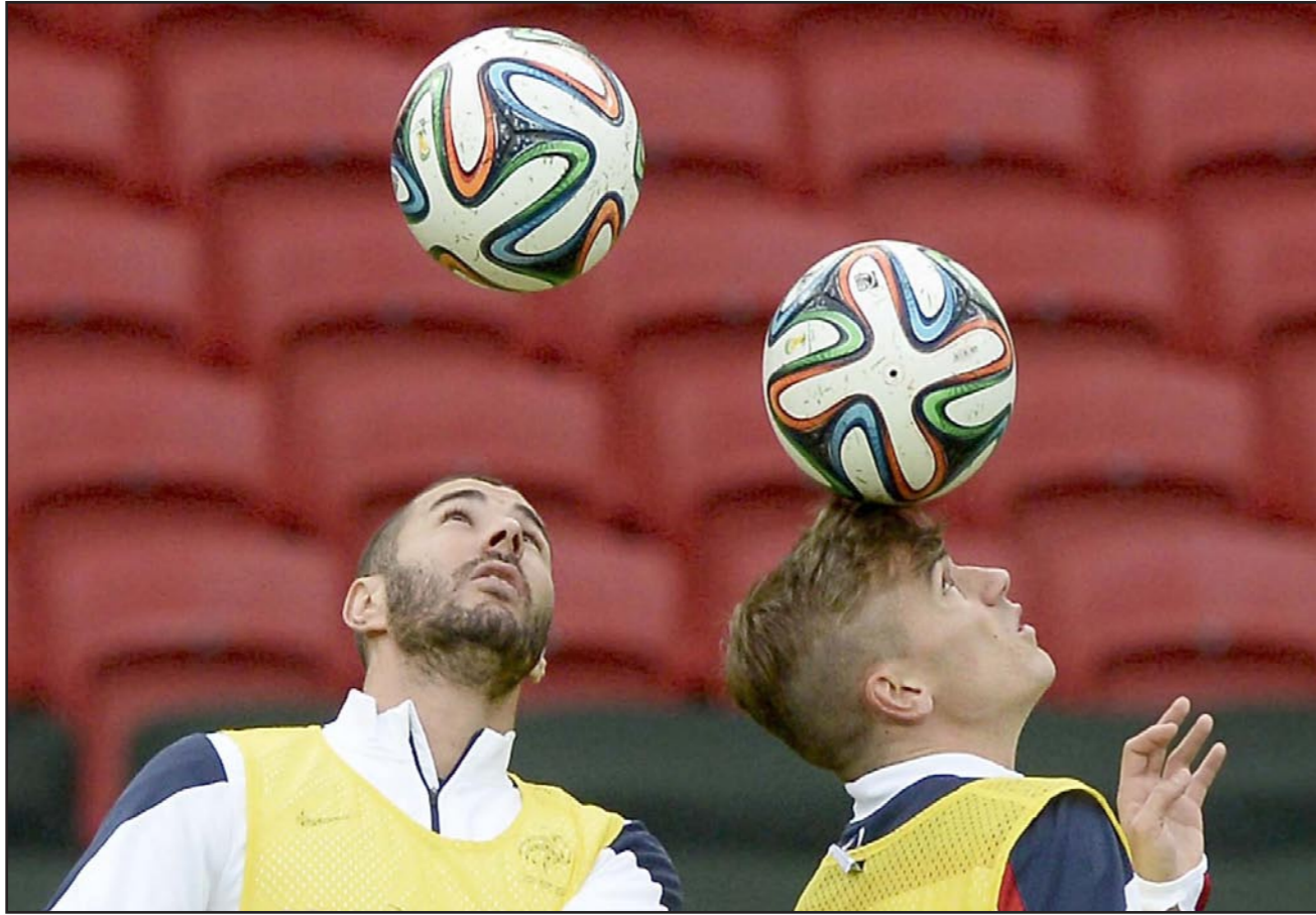
النجمان الفرنسيان غريزمان (يمين) وبنزيما سيصطدمان معاً عندما يتواجه أنتليكو ضد الريال

■ مدريد - د ب أ: ستكون هذه المباراة بمثابة الفرصة الأخيرة لحامل اللقب أنتليكو مدريد عندما يستضيف جاره ريال مدريد، متصدراً الدوري الإسباني، على ملعبه اليوم ضمن منافسات الجولة 22، فيما ينتظر أن يكون لقاء دربي مشتعلاً بالعاصمة الإسبانية. فلو كان أنتليكو مدريد يريد حقاً البقاء في الصراع على اللقب فسيكون عليه الفوز على الريال في تلك المباراة حيث يتصدر النادي الملكي حالياً بفارق سبع نقاط أمام أنتليكو (الثالث) وأربع نقاط أمام برشلونة الثاني. وعلقت محطة «راديو ماركا» الإذاعية بعد فوز الريال على أشبيلية 1/2 مساء الأربعاء قائلة: «لم يعد الوقت يحتمل أي تراخ من جانب أنتليكو». وأضافت: «في حال حقق أنتليكو أي نتيجة أخرى بخلاف الفوز يوم السبت، لن يكون أمامه أي فرصة للاحتفاظ باللقب الذي فاز به الموسم الماضي». لكن بيغو غودين مدافع أنتليكو رفض الاعتراف بهذه الفرضية وقال: «لا أتفق مع من يقولون إن الازمة ستعيدنا عن السباق على اللقب، لكننا من دون شك سنزيد من صعوبة الأمور علينا». وأضاف: «إننا نخطط لإلغاء نقاط