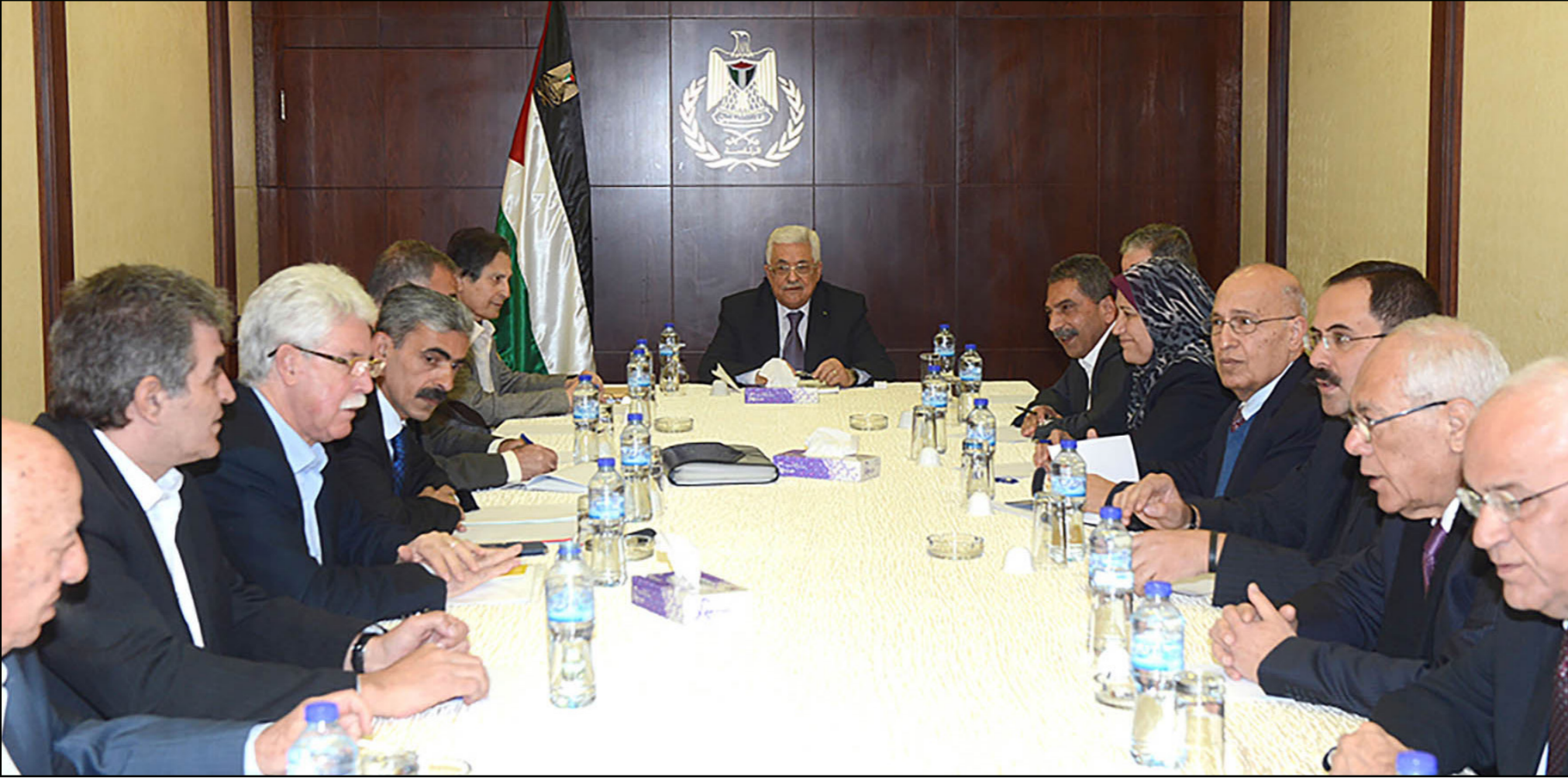
اجتماع القيادة الفلسطينية برئاسة عباس (وفا)

كما تعتبر اللجنة أن عقد المؤتمر استحقاقاً نظامياً وقانونياً، وهو أيضاً ضرورة حركية ووطنية وسياسية، ما يتطلب التحضير السليم لانعقاد المؤتمر، لضمان تحقيق أفضل النتائج والأهداف المطلوبة منه. وأشار الزعاري إلى أن اجتماع اللجنة انتهى إلى أن الموعد الدقيق للمؤتمر فقد ترك حتى الانتهاء من العضوية والقضايا اللوجستية على نحو خاص، إضافة للبرامج السياسية والوطنية.