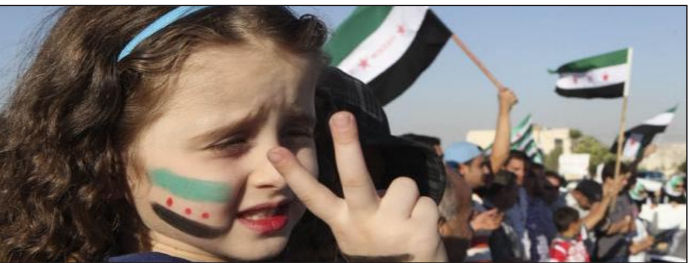
طفلة سورية لاجئة في لبنان

«سكاكين»... مسرحية قدمها مجموعة من الشباب اللبناني والسوري من إنتاج برنامج الامم المتحدة الإنمائي في منطقة مرجعيون جنوبي لبنان يعتبر الأول من نوعه من ناحية المشاركة اللبنانية السورية. وتحكي المسرحية التي كان أول عرض لها مساء أمس بمسرح في قاعة البلدية بمرجعون الأوضاع والعلاقات اللبنانية السورية بين اللبنانيين والنازحين السوريين إلى لبنان. وأوضح المخرج والكاتب عبود لـ«الاناضول» أن «هذا العمل الفني