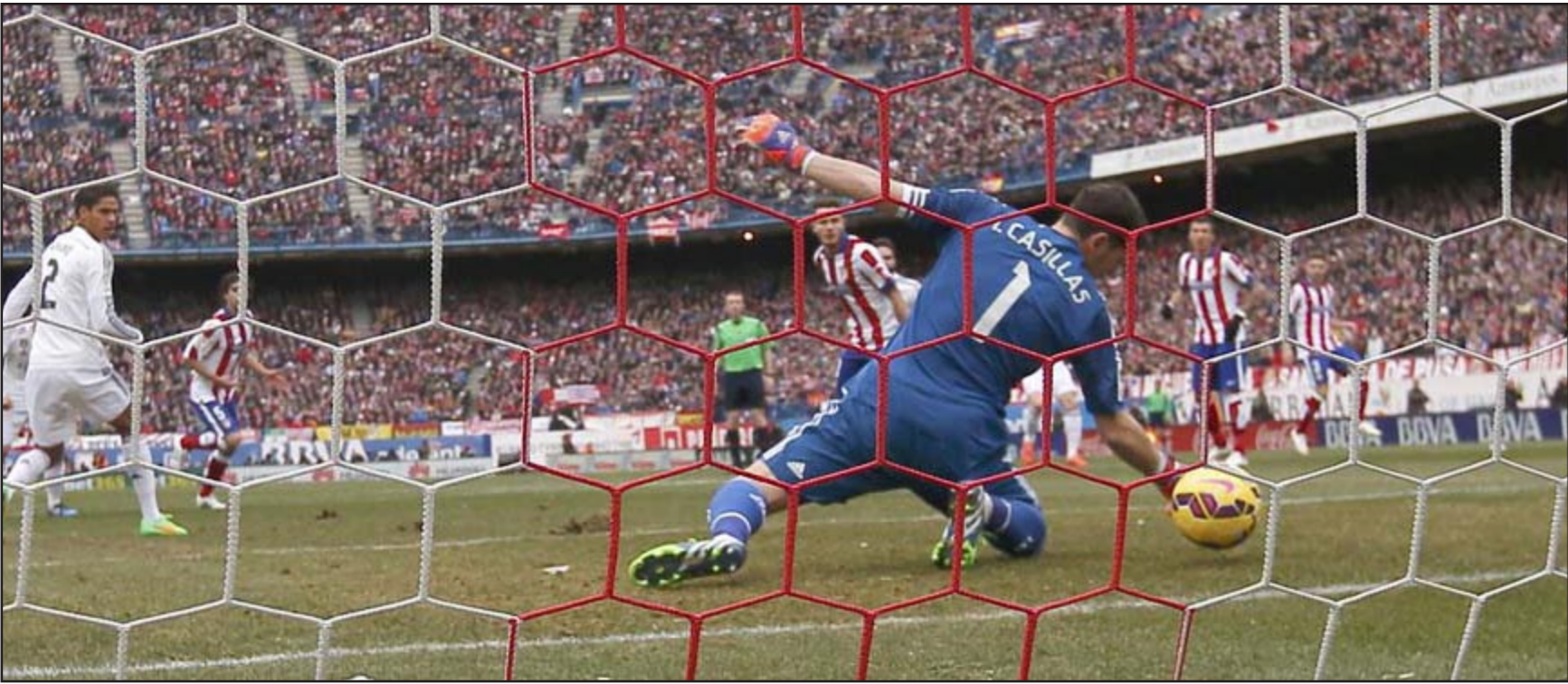
حارس الريال كاسياس يفشل في صد كرة تياغو التي جاء منها الهدف الأول

استطاع مانشستر يونايتد أن يحقق فوزاً هاماً على ريال مدريد في مباراة الـ 10 من الدوري الإسباني، وذلك بنتيجة 2-1. وكان الهدف الأول لمانشستر يونايتد في الدقيقة 14، وسجله ديفيد هارفي. ثم سجل ريال مدريد هدفه الوحيد في الدقيقة 32، وسجله كريستيانو رونالدو. وفي الدقيقة 83، سجل كريستيانو رونالدو الهدف الثاني لريال مدريد، مما جعل النتيجة النهائية 2-1 لمانشستر يونايتد.