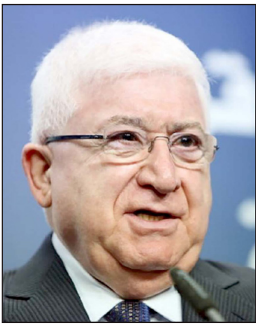
الرئيس العراقي فؤاد معصوم

والإيزيديين هم مجموعة دينية يعيش أغلب أفرادها قرب الموصل ومنطقة جبال سنجار في العراق، ويقدر عددهم بنحو 600 ألف نسمة، وتعيش مجموعات أصغر في تركيا، وسوريا، وإيران، وجورجيا، وأرمينيا.