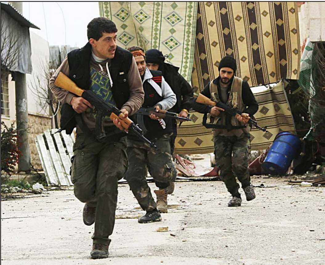
مقاتلون من الجبهة الشامية يحاولون تجنب قنص في معسكر حندرات قرب حلب أمس

وأعلنت وكالة الأنباء النظام السوري (سانا) أن ما وصفته بـ«اعتداءات الكذائف الصاروخية التي أطلقتها إرهابيون تكفيرون