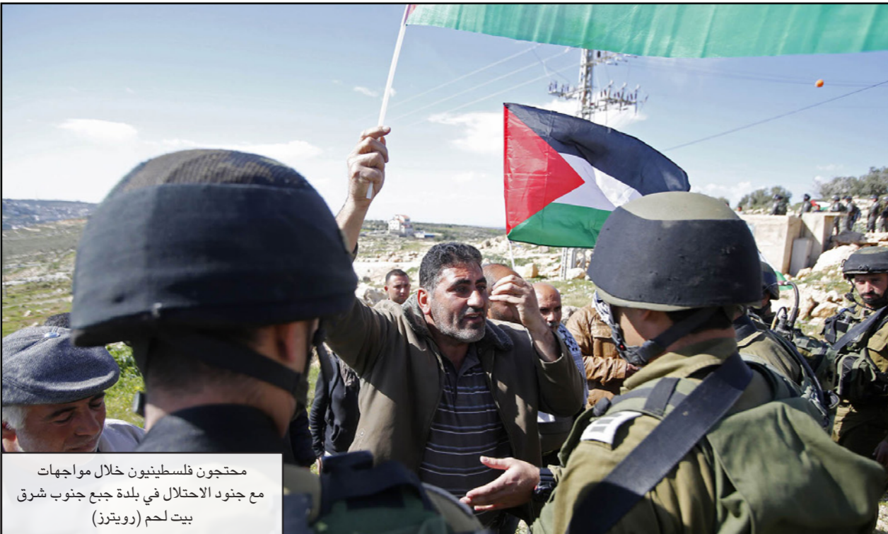
محتجون فلسطينيون خلال مواجهات مع جنود الاحتلال في بلدة جبع جنوب شرق بيت لحم