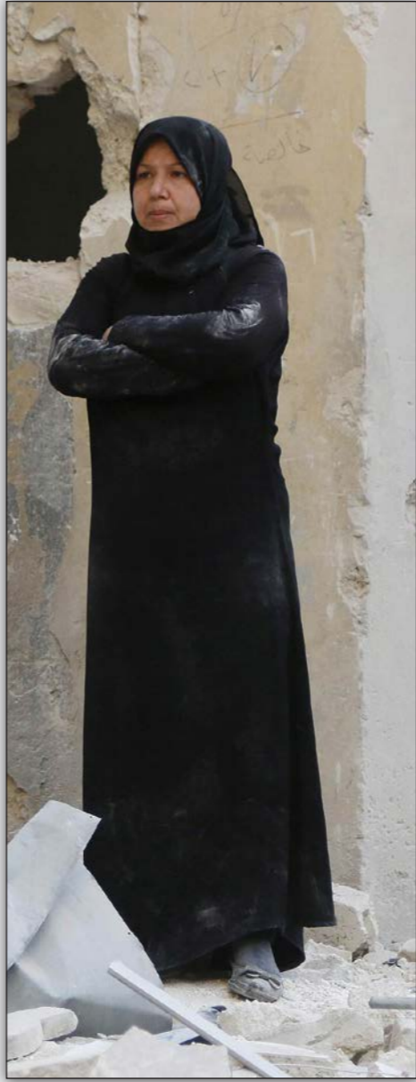
سورية تفت قرب بيتها المهدم بعد صفه

عادت «بمّني» إلى سوريا، ولم تمتع بالهدوء لفترة طويلة، فبعد أشهر من عودتها وصلت رياح الربيع العربي إلى البلاد، وتساعد القمع الأمني