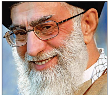
آية الله علي خامنئي

دبي-رويترز: في لهجة تشير إلى لب في الموقف الإيراني إزاء الأحداث النووية مع الغرب، قال المرشد الأعلى الإيراني آية الله علي خامنئي أمس الأحد، إنه سيقبل أي اتفاق نووي مع القوى الست الكبرى لا يحصل فيه أي من الجانبين على كل ما يريد، ليغرز بذلك موقف المفاوضين الإيرانيين الذين يتعرضون لانتقادات من المحافظين المعارضين للتعاقب مع الغرب. وقال خامنئي في بيان أصدره مكتبه ونقلته وكالة الطلبة للأنباء «سأقبل أي اتفاق يمكن التوصل إليه، بالتأكيد ليست مع اتفاق سيئ». عدم التوصل لاتفاق أفضل من اتفاق لا يكون في مصلحة أمنا». لكن في رسالة، يبدو أنها تدعم الرئيس الإيراني حسن روحاني الذي أحيا المسار الدبلوماسي مع القوى الغربية بعد فوزه في انتخابات الرئاسة عام 2013، قال خامنئي «مما قال الرئيس فإن المفاوضات تعني الوصول إلى نقطة مشتركة... هذا يعني أن أي طرف لن ينتهي به الحال بالحصول على كل ما يريد». ويعد نحو عام من المحادثات فشلت المفاوضات للمرة الثانية في تشرين الثاني/نوفمبر في التوصل لاتفاق بحلول المهلة التي اتفق عليها الجانبان، وأضاف خامنئي أنه يدعم «بجزم» مواصلة المفاوضات ودعا إلى إبرام اتفاق «مفصل» ينتقل على مرحلة واحدة في إشارة إلى مطالبة إيران