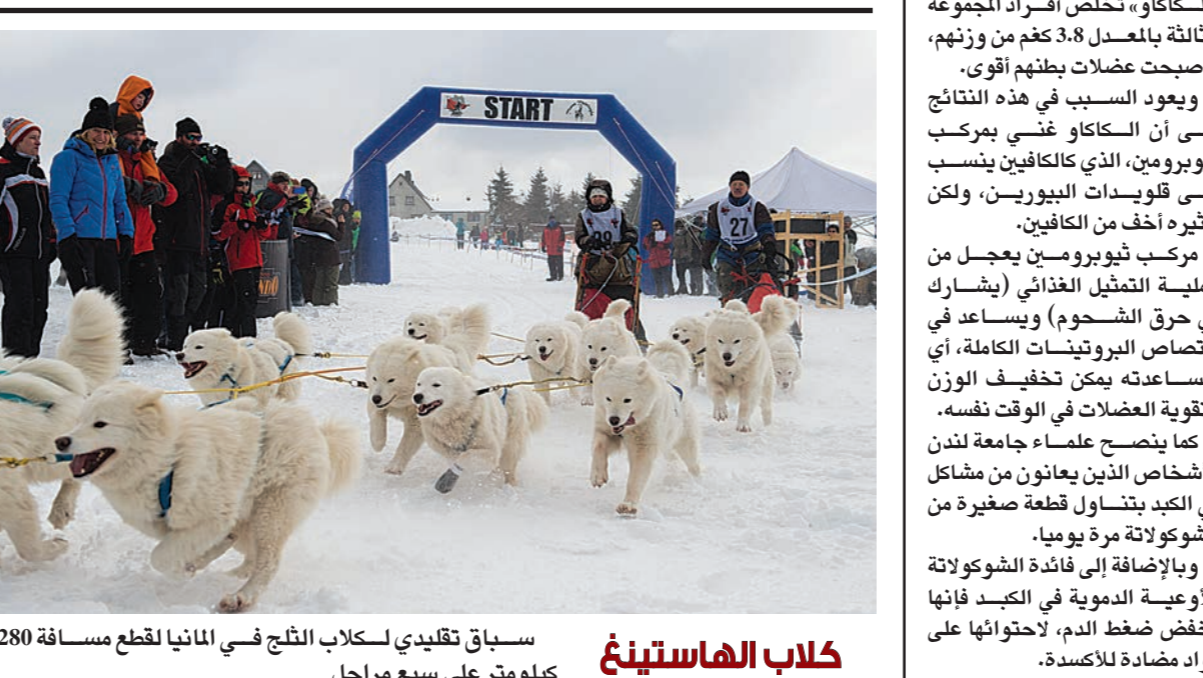
سباق تقليدي لكلاب الثلج في ألمانيا لقطع مسافة 280 كيلومتر على سبع مراحل

نيويورك - من محمد السيد أوضحت دراسة أميركية حديثة، أن ممارسة رياضة التأمل، تقلل من شيخوخة الدماغ، التي تصيب البشر مع التقدم في العمر، ما يؤثر على وظائف الجهاز العصبي المسؤول عن معالجة المعلومات. وبين الباحثون بكلية «ديفيد جيفن» للطب في جامعة «كاليفورنيا»، في دراساتهم التي نشرت في تفصيلها الأحد، في دورية «حدود علم النفس»، وهي «التأمل يحافظ على السادة الرمادية في الدماغ، وهي النسجة التي تحتوي على الخلايا العصبية المسؤولة عن معالجة المعلومات، وتتساكن تلك المادة كلما تقدمنا في العمر». وتكشف العلاقة بين التأمل وشيخوخة الدماغ، راقب الباحثون 100 شخص، تراوح أعمارهم بين 24 و 77 عاماً، وكان نصفهم قد مارسوا رياضة التأمل لمدة