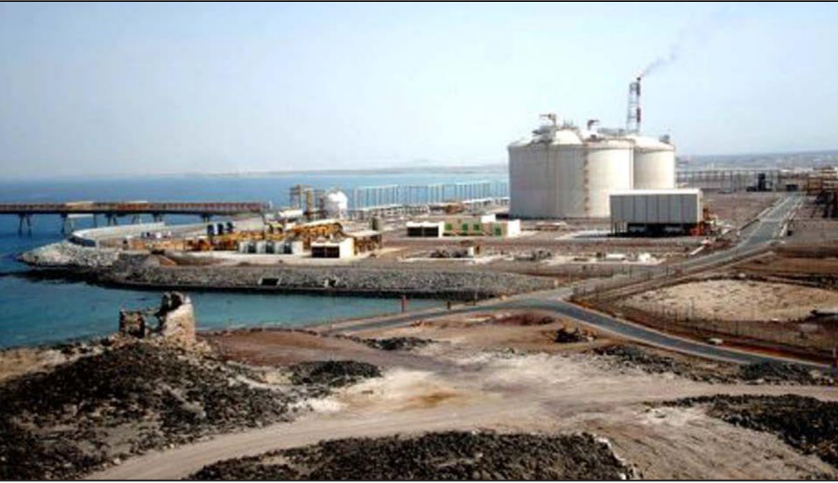
ميناء الحريقة النفطي الليبي

ليبيا - وكالات: اعتبرت الحكومة الليبية المؤقتة «الهلال النفطي» شمال شرق البلاد منطقة «منكوبة» بسبب ترددي الأوضاع الإنسانية ونزوح الآلاف المواطنين إثر الهجمات التي تشنها بانتظام ميليشيات «فجر ليبيا»، فيما اغلق ميناء الحريقة النفطي بسبب إضراب حراس الأمن. وأعلنت الحكومة التي تعترف بها الأسرة الدولية الأحد في بيان أنها «قررت اعتبار منطقة خليج السدره (أو ما يعرف بالهلال النفطي) منطقة منكوبة». وأضافت أن هذا القرار صدر بعد أن ناقش مجلس الوزراء السبت مذكرة قدمها رئيس المجلس المحلي لمنطقة خليج السدره بشأن الأوضاع الإنسانية الصعبة في المنطقة الممتدة من رأس لانوف شرقاً إلى الوادي الأحمر غرباً مروراً بمناطق بن جواد والنولفية وأم القديل وبوسعد. وأوضحت أن المنطقة شهدت «نزوح أعداد كبيرة من سكانها وإقبال معظم الدواشر الحكومية والخدمية ونقص الخدمات الأساسية مثل السلع والمواد التموينية والأدوية وغيرها