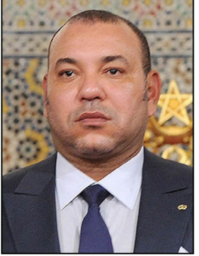
الملك محمد السادس

المفاوضات، بينما تتمثل مهام نيورسو، حسب القرار الأممي المنشئ لها، في السهر على احترام اتفاق وقف إطلاق النار بين المغرب وبوليساريو الموقع منذ 1991. ومن مهامها أيضاً تهئية استفتاء تقرير المصير عبر عملية استفتاء ظلت مجمدة حتى الآن، دون اغفال الإشراف على عملية إزالة الألغام وتنظيم تبادل الزيارات بين أفراد عائلات الصحراويين بين الصحراء الغربية ومخيمات تندوف. وتأسست بعثة الأمم المتحدة إلى إقليم الصحراء المعروفة باسم «النيورسو»، بقرار مجلس الأمن الدولي رقم 690 في نيسان/ابريل