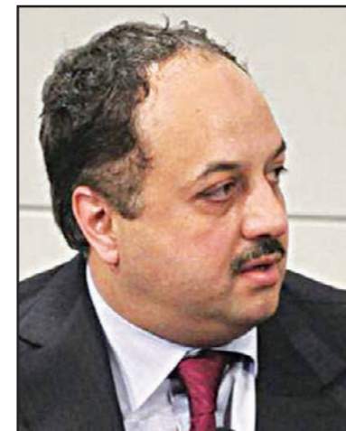
الدكتور خالد بن محمد الغلية

برفع العقوبات بشكل فوري لا تدريجي كما تقترح الدول الكبرى. وتزامنت تصريحات خامنئي مع سلسلة من الاجتماعات التي يجريها وزير الخارجية محمد جواد ظريف مع كبار الدبلوماسيين من الولايات المتحدة وألمانيا وفرنسا وبريطانيا وروسيا والصين في مؤتمر ميونخ السنوي للامن. ووصف ظريف هذه الاجتماعات بأنها «نقاش جدي للغاية».