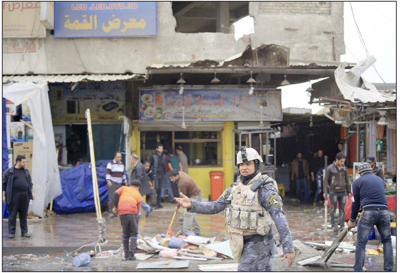
عراقيون في موقع انفجار في بغداد أمس

بغداد- الأناضول: قال قائد عمليات بغداد، خلال تنظيمه حفلًا، بعد منتصف ليلة أمس الأول السبت - الأحد، برفع حظر التجوال بعد فرضه لسنوات، إن كل الطرق باتت الآن مفتوحة في بغداد مؤكداً أن ليالي بغداد ستعود إلى سابق عهدها، وكان القائد العام للقوات المسلحة، رئيس الوزراء العراقي حيدر العبادي، أمر خلال زيارته مقر قيادة عمليات بغداد، الأربعاء الماضي، برفع حظر التجوال الليلي عن مدينة بغداد بشكل كامل ابتداءً من ليلة السبت - الأحد، كما وجه بفتح شوارع أخرى مهمة في بغداد لتسهيل حركة المواطنين، واعتبار مناطق الكاظمية والأغلبية والمنصور والسيدية مناطق «منزوعة السلاح».