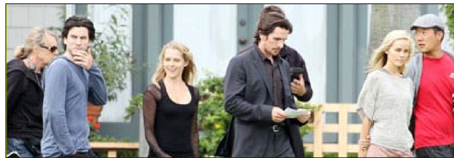
لقطة من الفيلم