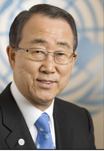
بان كي مون

وتحدثت الأوساط الرسمية المغربية ان الرباط تطالب الأمم المتحدة بتقديم توصيات حول نوعية وسياطة المبعوث الأممي إلى الصحراء، واستثناء مراقبة أوضاع حقوق الإنسان في إقليم الصحراء من مهام بعثة «النيورسو»، وعدم معالجة ملف النزاع في الصحراء طبقاً للفصل السابع، والاعتراف على فرض حل على أطراف النزاع، والاستمرار بمعالجته طبقاً للفصل السادس الذي ينص على تراضي أطراف النزاع بشأن حل متوافق عليه. وبلغت نسبة طلبات النساء ممن شملتهن عملية تسوية حوالي 63.27%، وهو ما يعادل 9202، في حين بلغت نسبة الرجال 39% بـ6232، والبقية سمت الأطفال بنسبة 4 بالمائة من 746 طلباً.