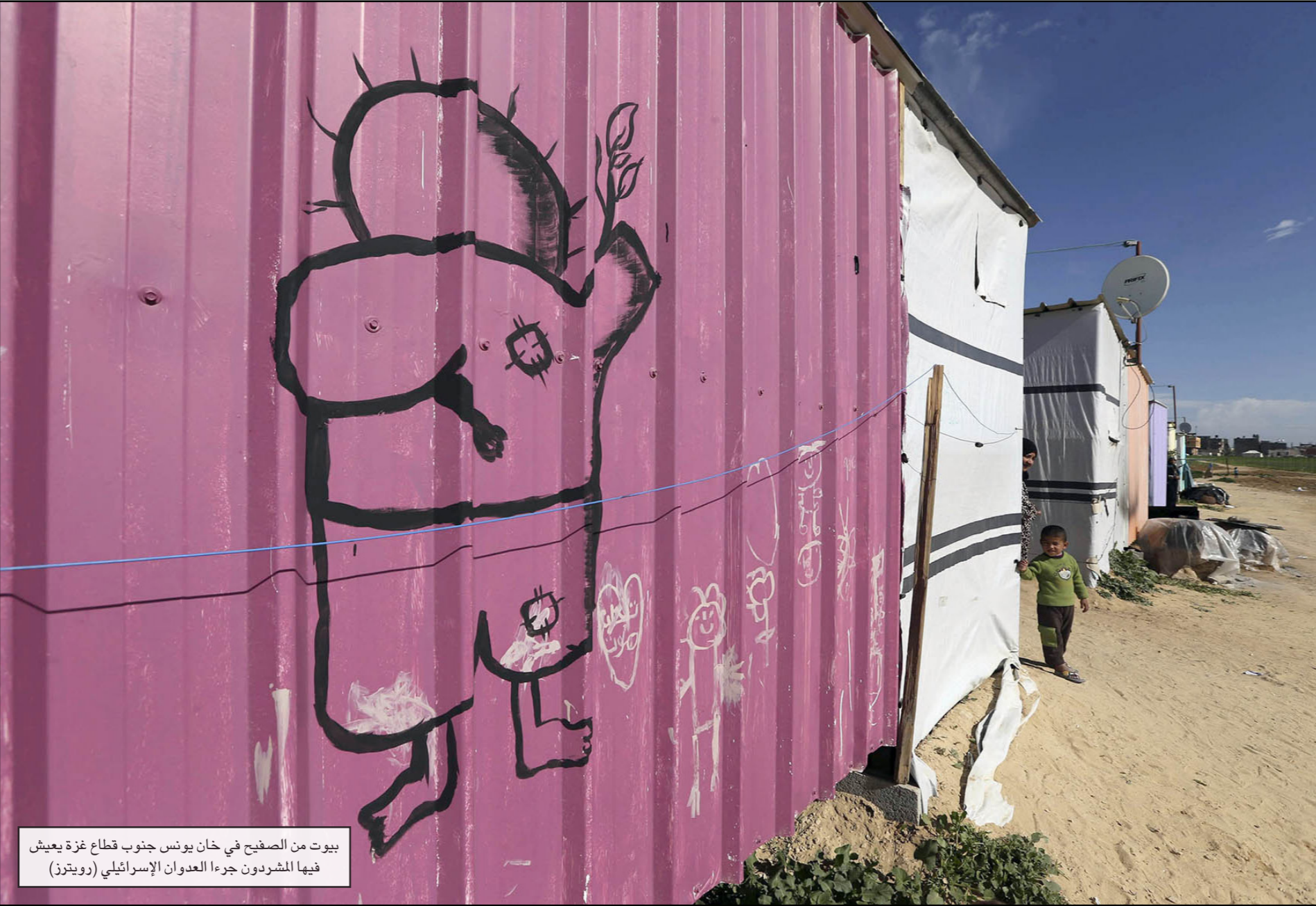
بيوت من الصفيح في خان يونس جنوب قطاع غزة يعيش فيها المشردون جراء العدوان الإسرائيلي

ووضعت على إحدى زوايا ميناء الصيادين في غزة لافتات كتب عليها مكان الوصول والمغادرة وأماكن