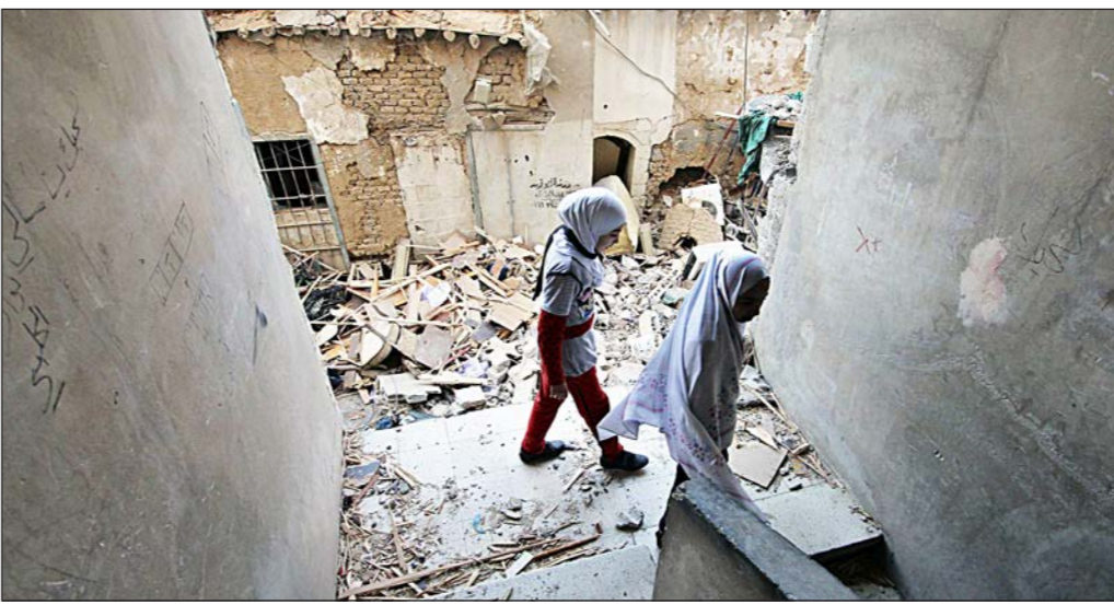
فتاتان قرب مبنى مدمر بعد غارات لقوات النظام على دوما أمس

من تنظيم الدولة الإسلامية، و22 قرية محصرة في الجهة الجنوبية لدمشق عين العرب «كوباني» من بينها كوت، جفور، ابيق، تخت، رمو.