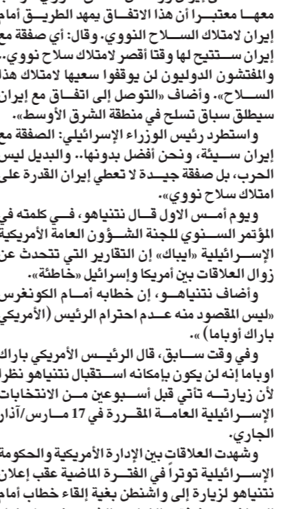
نتنياهو في خطابه أمام الكونغرس