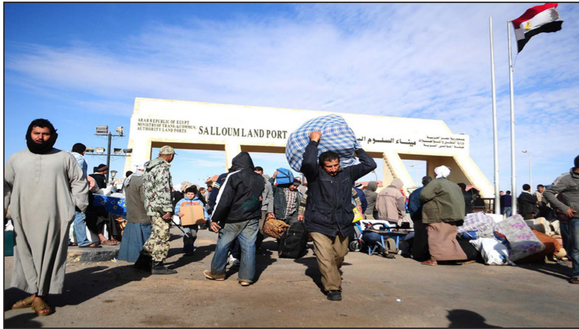
مصريون على الحدود الليبية المصرية

القاهرة - من هاجر الدسوقي ومحمود الحسيني، وصل العاصمة المصرية حتى صباح أمس الثلاثاء، 34 ألفا و420 مواطنا عائدتين من ليبيا، عبر معبر السلام الحدودي (غرب البلاد) ومطار القاهرة الدولي (شرق العاصمة)، منذ توجيه مصر ضربة جوية «مركزة» ضد أهداف لتنظيم الدولة في درنة ليبيا في 16 شباط / فبراير الماضي، وحتى صباح أمس، بحسب بيان صادر عن وزارة الطيران المدني. وقال اللواء العناني حمودة، مساعد وزير الداخلية مدير أمن مطروح (غرب البلاد)، أمس الثلاثاء، إنه وصل 964 مصريا عائدتين من ليبيا عبر معبر السلام البري (شمال غرب) على الحدود المصرية الليبية الاثنين. وفي تصريح خاص عبر الهاتف، أضاف المسؤول الأمني: الحد الإجمالي للعائدتين عبر منفذ السلمو البري منذ يوم 16 شباط / فبراير الماضي، حتى مساء الاثنين، 26 ألفا و570 مصريا. وفي سياق متصل، وصلت أمس رحلتان