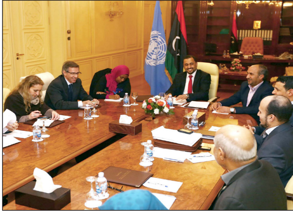
المبعوث الأممي برنادينو ليون خلال اجتماعه مع ممثلي الفضائل الليبية

الإرهابي الذي وقع في مدينة القبة (شرق) في 20 شباط / فبراير 2015 وغضبها إزاء الخسائر التي لا مبرر لها في الأرواح البربرية.. وأضافت: «وعلى هذا الصعيد، شددت الأطراف على ضرورة قيام جبهة ليبية موحدة ودولة ليبية قادرة لمواجهة تهديد الإرهاب المتزايد في ليبيا، وأكدوا أن وحدة ليبيا لا تزال الأداة الأكثر فعالية لمواجهة الخطر الذي تشكله الجماعات الإرهابية..» وحددت البعثة مقترحها بشأن جدول الأعمال، التي قالت إن الأطراف وافقت عليه، وهو «تشكيل حكومة وحدة وطنية، وبما في ذلك التباحث بشأن رئيس الوزراء ونواب رئيس الوزراء ورئيس الوزراء المستقبليين، والترتيبات الأمنية المتعلقة الطريق أمام وقف إطلاق نار شامل، والانسحاب التدريجي لجميع المجموعات المسلحة من البلدات والمدن، والمشاركة في الحوار، واليات ملائمة للرصد والتنفيذ، واستكمال عملية صياغة الدستور ضمن جدول زمني واضحة..» كما جددت التزامها بضمان عملية حوار سياسي شفافة بقيادة ليبية وملكية ليبية، مشيرة إلى أنها «بلغت الأطراف باتساق إلى يوم اتخاذ القرارات النهائية المتعلقة بتبني عملية الحوار إلا بعد أن يتمكن كل مشارك في الحوار من إجراء المشاورات اللازمة..» ولفتت إلى أنه لن يكون مقدر الأمم المتحدة والجمعية الدولية أو أي طرف خارجي آخر أن يملأ بياي شكل من الأشكال المتواجدة والقرارات المتعلقة بعملية الحوار.. وكان من المقرر عقد جولة جديدة للحوار الليبي في المغرب الخميس الماضي قبل أن تنصر مسؤولية أممية الثلاثاء الماضي، بتأجيل هذه الجولة إلى أجل غير مسمى، موضحة أن التأجيل جاء بعد قرار مجلس النواب المنعقد في مدينة طبرق