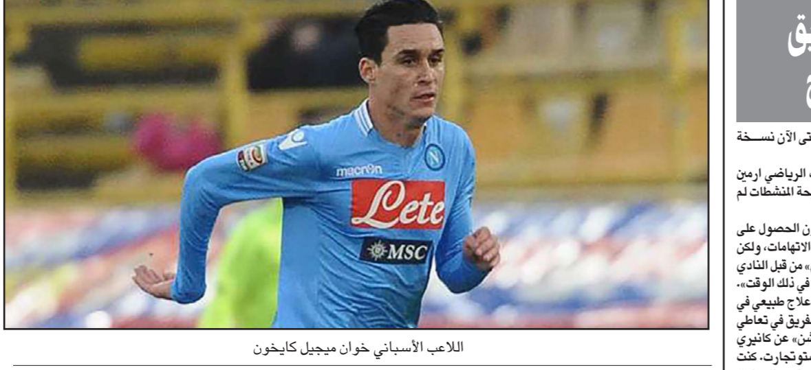
اللاعب الإسباني خوان ميغيل كايخون

العربية الوطنية العربية: «حتى الآن لم يتم التأكيد على استضافة مصر للحدث الرياضي العربي، لكن في حال صدور الموافقة بشكل رسمي فإن الموعد المقترح لإقامة البطولة سيكون في نهاية العام الحالي 2015، أو بداية العام المقبل 2016. وكان اجتماع اتحاد اللجان الأولمبية العربية الذي عقد في العاصمة العمانية مسقط أواخر