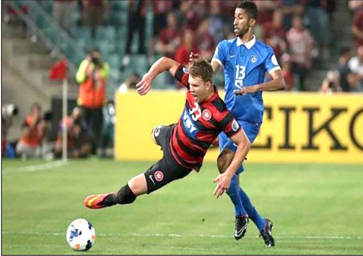
صراع على الكرة بين لاعب ويسترن سيدني الأسترالي ولاعب الهلال السعودي في مباراة سابقة

عواصم - د ب أ: استكمل اليوم الأربعاء مباريات الجولة الثانية من بطولة دوري أبطال آسيا لكرة القدم بثمان مباريات في غاية القوة والإثارة. ويلتقي ويسترن سيدني الأسترالي، حامل اللقب، مع ضيفه فوجانتشو إيفرغراندا الصيني بحثاً عن صدارة المجموعة الثامنة ولأسيما أن كلاهما يمتلك ثلاث نقاط بعد أن حقق كل فريق منهما الفوز في الجولة الأولى. وكان ويسترن سيدني فاز على ضيفه كاشيوا انتلرز الياباني 1/3 بينما فاز فوجانتشو إيفرغراندا على ضيفه اف سسي سول الكوري الجنوبي بهدف دون رد. وفي نفس المجموعة يستضيف اف سي سول الكوري الجنوبي نظيره الهلال السعودي مساءً وفي قصة عربية جديدة بالمجموعة الثالثة يستضيف السد القطري نظيره الهلال السعودي في مباراة خارج التوقعات. ورغم معاناة الهلال في الفقرة الأخيرة بعد إقالة مدربه واستقالة رئيس النادي لكنه استطاع في الأسبوع الأخير أن يستعيد مستواه بتحقيقه فوزاً مهماً بالدوري السعودي على حساب ضيفه