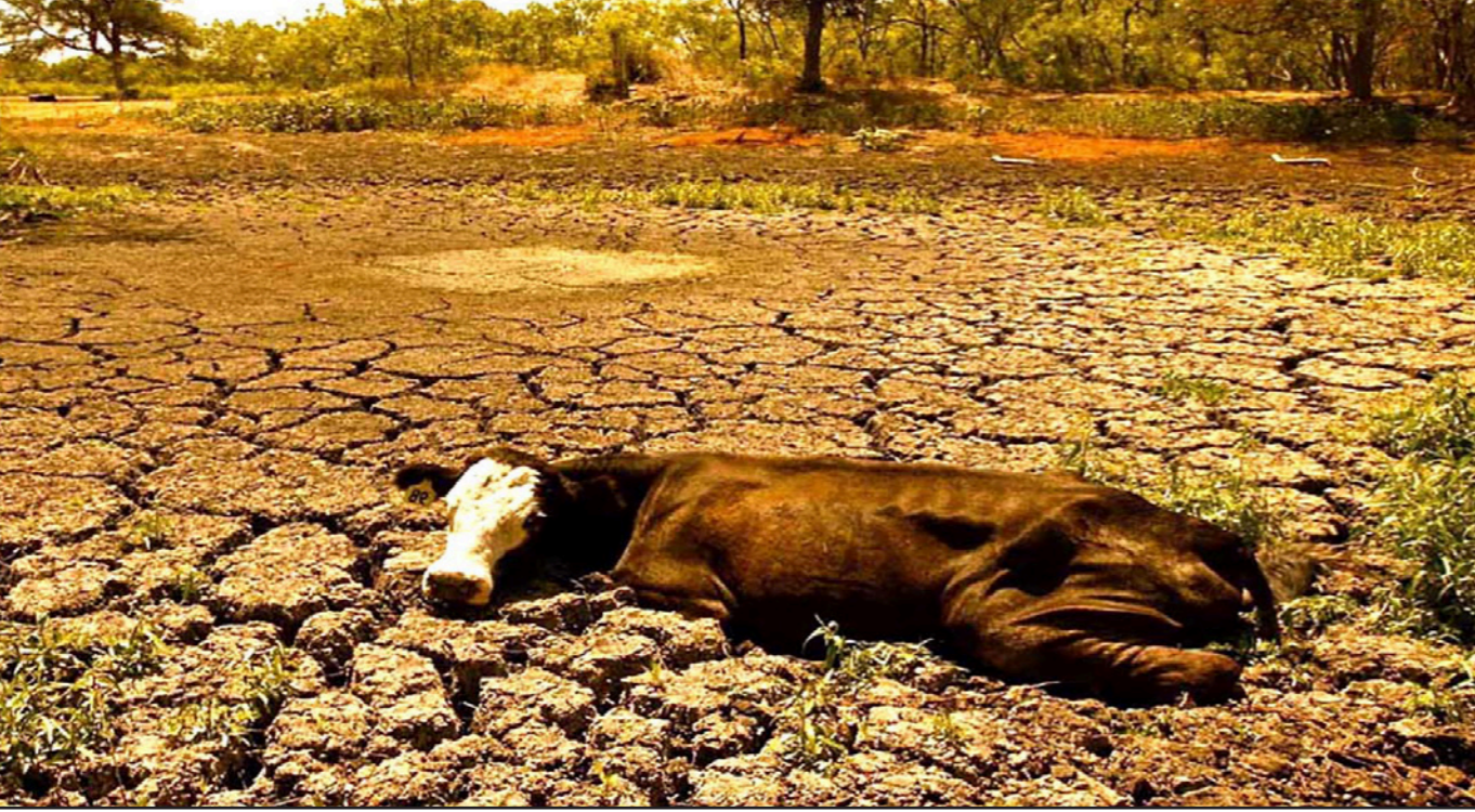
بقرة هزيلة فوق أرض من شمال شرق سوريا شققها الجفاف

واشنطن - أ ف ب: اعتبر باحثون امريكويون أمس الأول ان الجفاف القياسي المرتبط ربما بالتغير المناخي الذي ضرب القطاع الزراعي في سوريا بين 2007 و2010 قد يكون أسهم في اندلاع النزاع في هذا البلد في 2011. وقال ريتشارد سيفر، عالم المناخ في جامعة كولومبيا في ولاية نيويورك والمشارك في الدراسة «لا نقول ان الجفاف هو سبب الحرب، بل انه يضاف إلى كل العوامل الأخرى التي أسهمت كذلك في النزاع» الذي اوقع ما لا يقل عن مئتي ألف قتيل ونزوح الملايين. وأضاف «ان الاحتباس الحراري الحالي الناتج عن نشاطات بشرية أسهم على الأرجح في تفاقم موجة