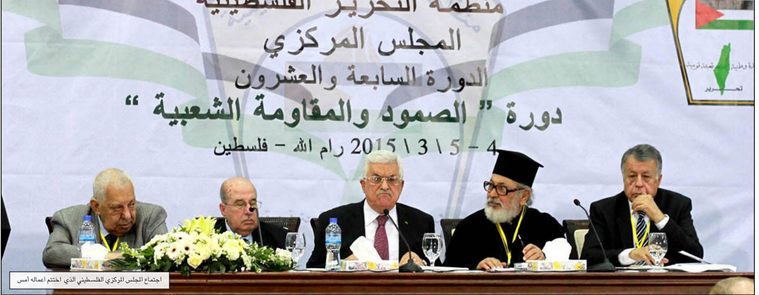
اجتماع المجلس المركزي الفلسطيني الذي اختتم أعماله أمس

ممارسة مهامها وقيامها بمسؤولياتها في غزة»، ورفض القيادي البارز في حماس الاتهامات التي تشير إلى مساهمته باتفاقية البعث الأممي روبرت سري لإعمار غزة، وقال إن أي اتهام بذلك «ليس له من الحقيقة نصيب، لأن حماس ليست جزءا من الاتفاقية أو الآلية». وأضاف «مذ البداية وافقنا أن تكون السلطة التنفيذية والإعمار التي وضعها سيري لا تلاقي استحسانا أو قبولا من السكان المتضررين وقادة الفصائل، وبين حين وآخر تنظم احتجاجات شعبية ضدها، في ظل تأخر عملية الإعمار