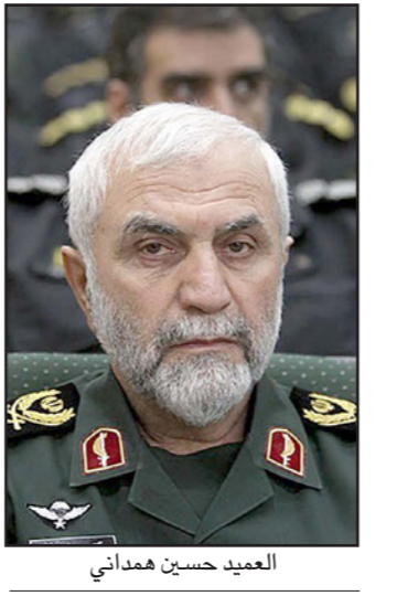
العميد حسين همداني

أشاد بتصدير «ثقافة الدفاع عن النفس» مسؤول عسكري إيراني يكشف تجنيد المراهقين للقتال في سوريا الذي يعتبر أحد أبرز مرشحي منصب قيادة فيلق القدس بدلا لقاسم سليماني، «نحن لم نحاول هندسة سلوكيات ومبادئ الشيعي أو استخدام أساليب التصميم لهذا الغرض، ولكن اتخذنا الإجراءات اللازمة لتثقيف سلوك الشعب على أساس الوحدة والكرامة والعزة». وأشار إلى نشاط الحرس الثوري من أجل زيادة المنوعية والوحدة والتماسك في سوريا، وقال، «تم تشكيل مجموعات باسم كتشاب للمراهقين حتى ننمك من نقل نوابيانا لهم بشكل أكثر وضوحا. ولحسن الحظ ويعمل دؤوب وصلنا اليوم إلى النقطة حيث أصبح المعتم الشباب الإيراني محورا للنشاط الثقافي والمعاشرة في حلب». واعتبر مستشار القائد العام للحرس الثوري تصدير ما سماها «ثقافة الدفاع القدس» (وهي إشارة إلى الحرب الإيرانية والعراقية) وإنشاء الباسيج من