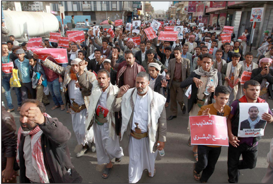
جانب من تظاهرات يومية تشهدها صنعاء ضد الانقلاب الحوثي

وتقل المصدر عن السقاف تأكيد أن مراسم التسليم والاستلام ستتم في مقر قيادة القوات الخاصة في عدن (الأمن المركزي سابقاً)، دون الكشف عن تفاصيل أخرى.