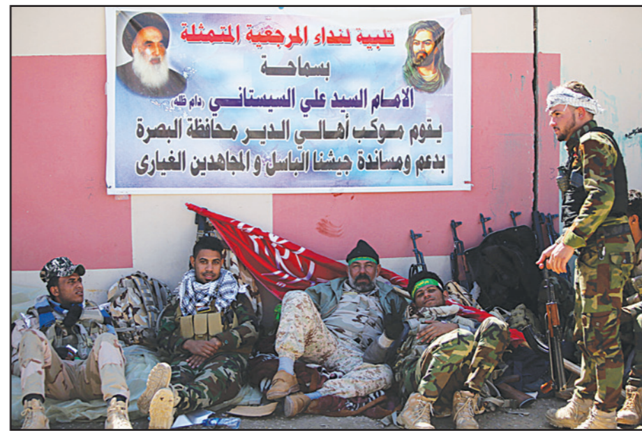
قوات عراقية وميليشيات شيعية يستريحون استعدادا للمشاركة في الهجوم على تكريت

العراقية التي كانت تخوض معاركا مع مقاتلي تنظيم الدولة الإسلامية في الأول من كانون الثاني/يناير 2015. ويبدو أن ضوءاً أخضر أميركياً لإيران منها من انبعاث هذه القوات لأول مرة لوسط العراق تحت غطاء محاربة تنظيم الدولة الإسلامية، ولعل أبرز التصريحات في هذا الشأن كانت لرئيس أركان الجيوش الأمريكية الجنرال مارتن ديميسي بقوله «إن دور إيران والميليشيات الكردية الشيعية في الهجوم الذي تشهده القوات العراقية لاستعادة مدينة تكريت من تنظيم الدولة الإسلامية».