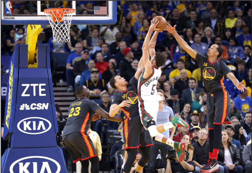
ويليامز لاعب باكس يحاول التسديد على سلة أريزونا في ظل مضايقات لاعبي الخصم

لوس أنجلس - د ب أ: عاد راسيل ويستبروك لصفوف أوكلاهوما سيتي ثأندر ليستأنف نشاطه من حيث توقيف ويقود الفريق للفوز 123-118 في مباراة امتدت للوقت الإضافي أمام ضيفه فيلادلفيا سفنتي سيكسرز بمسابقة دوري كرة السلة الأمريكي للمحترفين.