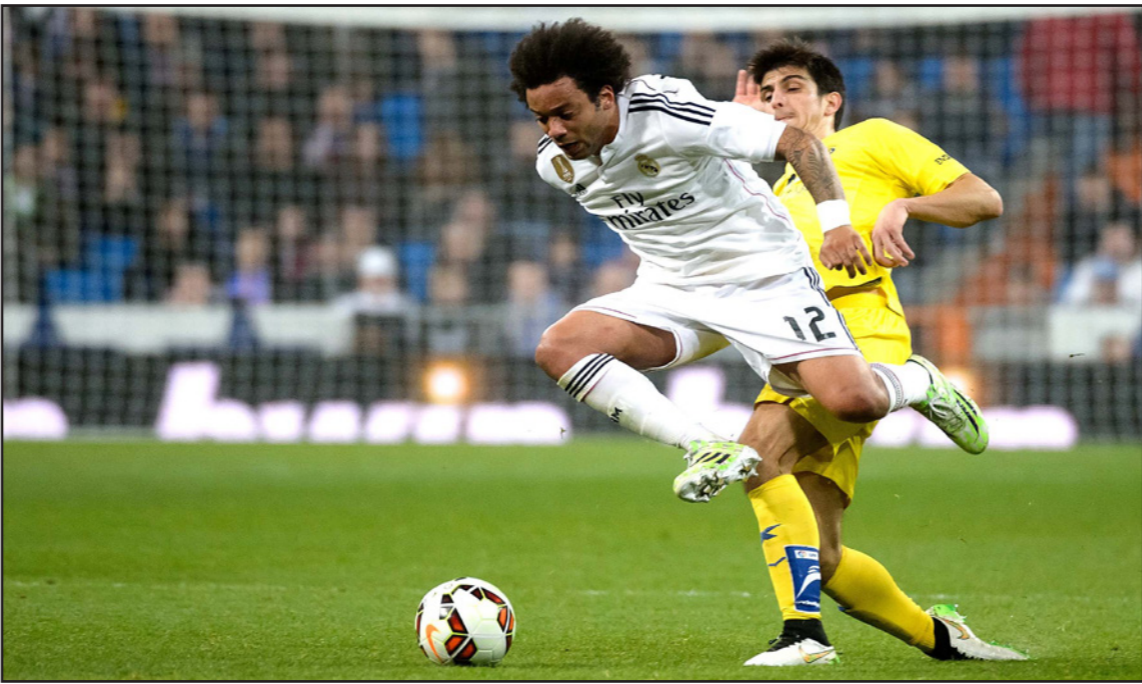
مارسيلو نجم ريال مدريد يعود إلى تشكيلة السامبا

ريو دي جانيرو - د ب أ: عاد مارسيلو مدافع ريال مدريد الأسباني روبينيو مهاجم سانتوس إلى قائمة المنتخب البرازيلي بعد فترة من الغياب.