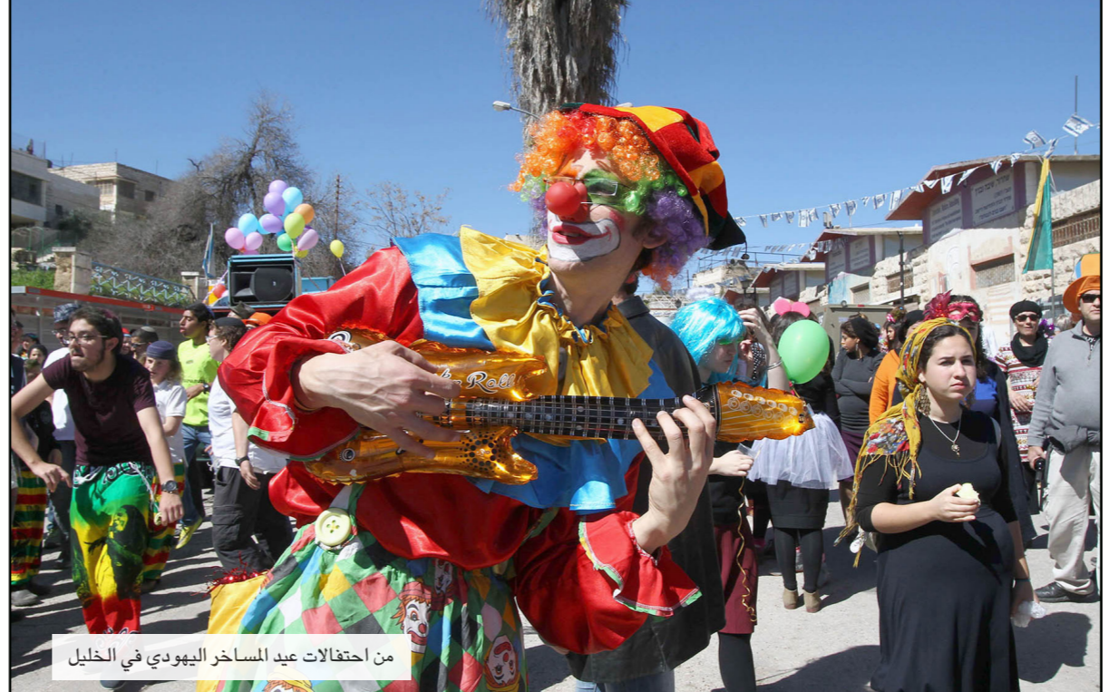
من احتفالات عيد المساخر اليهودي في الخليل