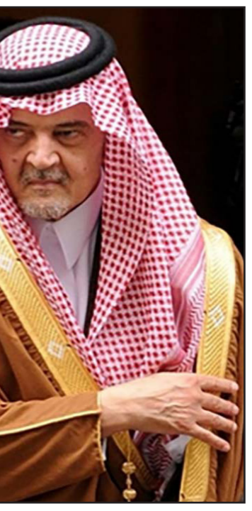
وزير الخارجية السعودي الامير سعود الفيصل

وقال مسؤولون في صنعاء أنه سيتم تسليم القوات الخاصة في عدن في مقر قيادة القوات الخاصة في عدن في وقت متأخر الأربعاء.