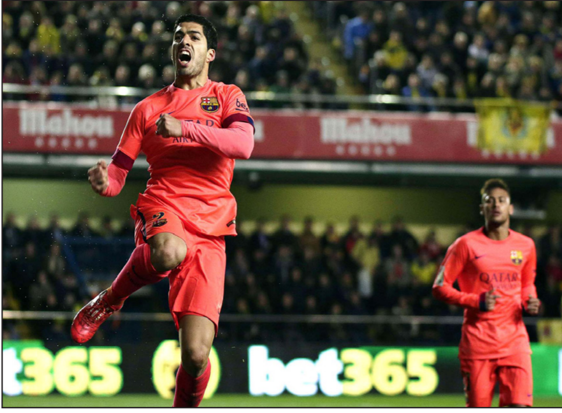
سواريز يحتفل بهدفه وحلقه نيمار صاحب الهدفين