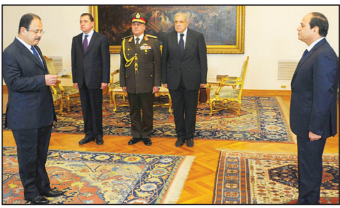
مجددي عبد الغفار يؤدي اليمين الدستورية أمام الرئيس السيسي

يكون له تأثير على المؤتمر الاقتصادي المقرر عقده في وقت لاحق من الشهر الجاري. وقال يسرى العزباوي، الخبير السياسي بمركز الأهرام للدراسات السياسية والاستراتيجية، إن التعديلات طبيعية تستهدف في المقام الأول احتواء حالة الغضب التي تعيشها البلاد في ظل إخفاق بعض الوزارات في أداء مهامها، ورأي مختار غباشي، نائب رئيس المركز العربي للدراسات السياسية والاستراتيجية (مركز دراسات مصري غير حكومي)، أن «التعديل يهدف إلى احتواء الغضب الشعبي»، لكنه اعتبر أنه تعديل «لم يأت بجديد».