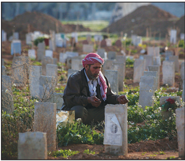
رجل سوري يصلي على ابنه الذي قتل في قصف على مدينة دوما