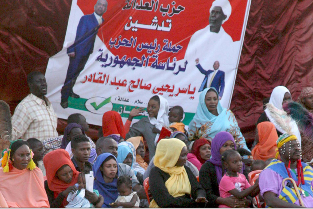
مؤيدون للمرشح الرئاسي ياسر يحيى صالح خلال حملته الانتخابية في الخرطوم

المواطنون أعلنوا عدم اهتمامهم بها الصمت يخيم على المدن والأحياء السودانية قبيل أسبوع من الإنتخابات