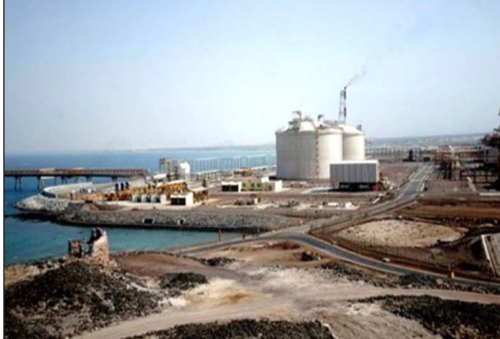
خزانات نفط في ميناء السدرة الليبي

ومعالجة العقبات والعراقيل... وإلى جانب التفاوض مع هذه الشركات، طلبت الحكومة المعترف بها من مؤسسة النفطية فتح حساب مصرفي في دولة الإمارات لتحصيل الأموال النفطية بنفسها في حال انتقلت العقود