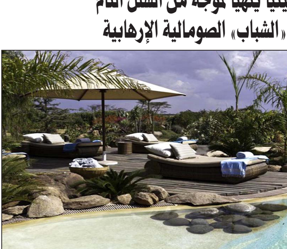
منتجع سياحي في كينيا