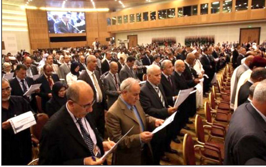
نواب خلال اجتماع لبرلمان طبرق

شديد اللهجة للثني أخبره فيه بتمسكه بمنصبه كوزير للداخلية قائلا «أنا مستمر في تحمل الأمانة والدفاع عنها وعن التضحيات من أجلها، ولن نذلل من منحنى الثقة ولن نخون مبادئنا ولن نعطي الفرصة لأيًا كان بأن يقف عائقا واتهم السنكي في الخطاب رئيس