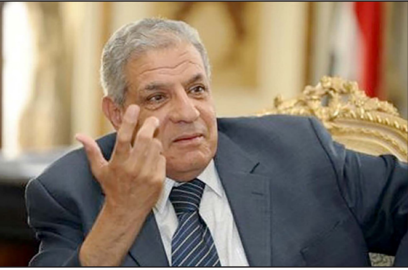
رئيس الوزراء المصري إبراهيم محلب

تتجه لإجراء المرحلة الأولى من الانتخابات البرلمانية قبل قدوم شهر رمضان العظم تأتي في إطار توجهات الرئيس السيسي بسرعة الإنتهاء من الإستحقاق الثالث من خريطة الطريق». وأكد «أن الأحزاب عليها أن تستغل هذه الفترة بشكل جيد من أجل الإستعداد بقوة وإعادة ترتيب أوراقها من جديد لحسم موقفها من التحالفات الإنتخابية إذا إرادت أن يكون لها تواجد حقيقي في مجلس النواب المقبل».