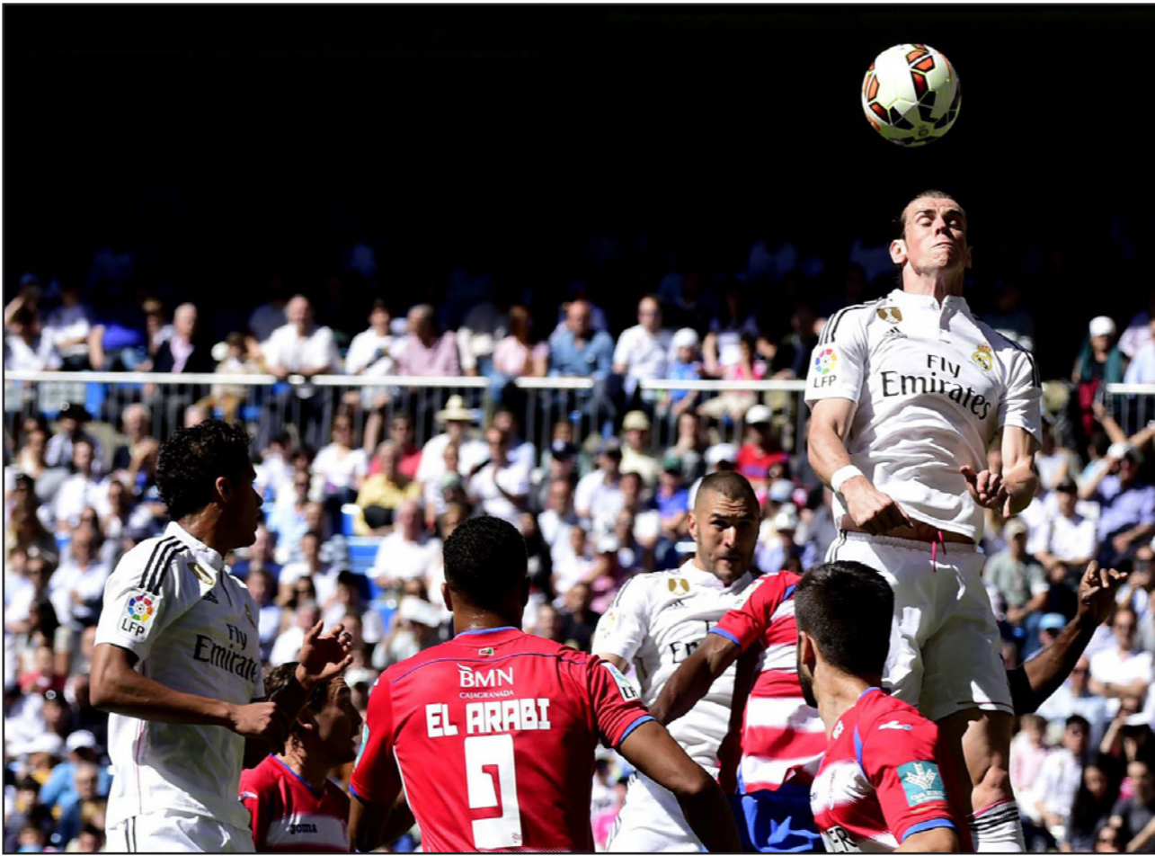
غاريت بيل يرتقي أعلى من الجميع في المباراة السابقة مرجح للغياب عن مباراة اليوم

■ مدريد - د ب أ: يعاني كارلو أنشيلوتي مدرب ريال مدريد من حيرة كبيرة في الاختيار بين غاريت بيل وإيسكو للدفع بأحدهما في مباراة فريقه المرتقبة اليوم أمام رايو فالكانو في الدوري الإسباني، حيث أن اللاعب البولندي يعاني من كدمة بالقدم قد تعطل عائقاً أمام مشاركته في اللقاء. وتسببت عودة النجم الكولومبي خيميس رودريغز الأحد الماضي إلى صفوف الريال في وقوع الإدارة الفنية في حيرة حول اختيار التشكيلة الأساسية للمباراة، إلا أن الإصابة الجديدة لبيل قد تيسر الأمر قليلاً لأنشيلوتي. وقال المدرب الإيطالي: «نعاني من مشكلة مع بيل... لقد تعرض لكدمة في القدم اليسرى...». وتشدد أنشيلوتي على أن المنافسة موجودة بين جميع لاعبي الفريق ولا تقتصر على أسماء بعينها: «ليست منافسة بين إسكو وخيميس... إنها منافسة بين جميع اللاعبين داخل فريق جيد... جميع اللاعبين يتمتعون بحالة مثالية... خيميس يؤدي بشكل جيد في عاصمه الأول وكذلك إيسكو، إنه لاعب كبير وادى بشكل رائع في المباريات الماضية... من حسن الطالع أن أحظى بهذين اللاعبين... إنها مشكلة ممتعة». وكان أنشيلوتي قد صرح قبل أسابيع بأن إسكو لاعب لا يمكن أن يكون محل نقاش لكن الآن تراجع بعض الخطوات إلى الخلف ووصفه باللاعب الكبير، وأضاف: «أتق بأن لدي الفريق الأفضل في العالم وأثق بأن كل شيء سيسير على ما يرام منذ الآن وحتى نهاية الموسم».