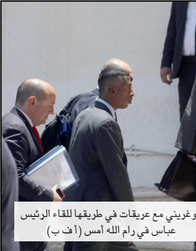
موغريني مع عريقات في طريقها للقاء الرئيس عباس في رام الله أمس

وكانت موغريني قد التقى الرئيس الفلسطيني محمود عباس، في مقر الرئاسة، ووصف عريقات المحادثات بالمعقدة، وقال إنها تناولت آخر مستجدات العملية السلمية، وأثنى على الإجراءات التي اتخذها الاتحاد الأوروبي، خاصة إدانة الاستيطان، ورفض التعامل مع منتجاته.