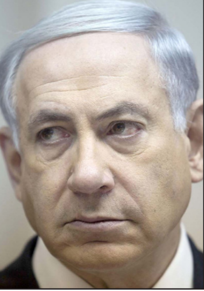
رئيس الوزراء الاسرائيلي بنيامين نتنياهو

للوصول إلى الذروة، الامر يتعلق بعمل غير اخلاقي، لقد أوضح كلون مرارا لرجاله أنه يفضل حكومة مصالحة وطنية مع هرتسوغ، وأنه سيحافظ على محكمة العمل العليا والاتصالات، ونظرا لأن ناخبيه هم من الوسط المعتدل فانه لن يذهب إلى حكومة يمين متطرفة، وبالتالي ليس إلى حكومة ال-61، اذا ماذا يفعل هذا؟ إن أمل كلون بان تقوم شليبي بديموفيتش بانقاوه هو وهم، إن عرض جيموفيتش للتعاون من اجل الال يستمر حكم نتنياهو - لا أساس له من الصحة وضار وغير اخلاقي.