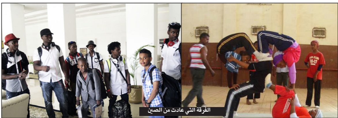
الفرقة التي عادت من الصين

الدورية لمستويات المدربين والمتابعة الشديدة لقرتهم على التعلم والعزف، بالإضافة إلى مواصلة تعليمهم الأكاديمي العادي وفق منهجهم التعليمي الوطني، إضافة إلى البرامج الترفيهية والرحلات التي ينظمها القائمون على مركز التدريب والذي يحتوي على العديد من المرافق الصحية والترفيهية وأماكن التدريب.