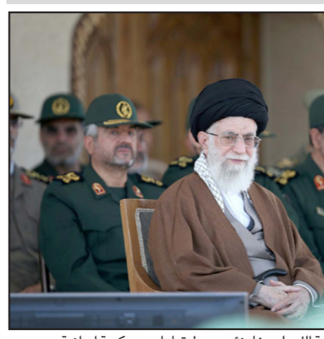
المارش الإيراني آية الله علي خامنئي وسط قيادات عسكرية إيرانية

من طهران لعدد من عدد قليل من الدول المستعدة للحملة معها رغم العقوبات الاقتصادية الغربية. ويجوب اتفاق اطاري مؤقت توصلت إليه القوى الست الكبرى مع طهران في ابريل نيسان وافقت إيران على منح نشاطها النووي في مقابل تخفيف العقوبات، ويمكن التوصل ويبدو ان ذلك عزز الموقف الإيراني جسما ذكرت المصادر الدولية على سير مفاوضات التجارة مع الهند وهو ما ظهر في امورها طريقة تعاملها مع صفقة كبيرة لاستيراد قضبان السكك الحديدية. وجرى توقيع الاتفاق بين طهران ونيويورك 233 مليون دولار في أكتوبر/ تشرين الأول الماضي ويوجبهما تسهيل مؤسسة التجارة الوطنية الهندية تصدير قضبان السكك الحديدية من شركتي سيل وجيندال ستيل اند باور لصالح السكك الحديدية الإيرانية، لكن المصادر ترى ان إيران أبلغت المفاوضين الهندون ان لديها عرضا من دول أخرى من بينها تركيا لتوريد معدات بتكلفة أقل. وقال أحد المصادر إنه في الشهر الماضي أرسلت نيودلهي وزير التجارة راجيف خير لافتتاح طهران بالمتن إلى الشروط الأصلية لكنه عاد محالي «للفاض». وقال المصدر بلجيسوا الإيرانيين أنفسهم الذين جاءوا إلى البناية العام الماضي لتوقيع