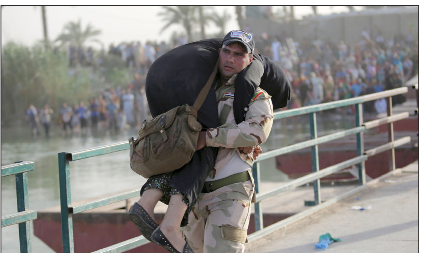
جندي عراقي يحمل سيدة من النازحين

بغداد - أ ف ب: أعلنت الولايات المتحدة رغبتها في تسريع دعم العتائر السنية في الأنبار في غرب العراق بعد سقوط مركزها الرمادي بيد تنظيم الدولة الإسلامية، مؤكدة عدم تغيير الإستراتيجية التي يعتمد عليها منذ أشهر في مواجهة الجهاديين. ودفع سقوط المدينة الأحد، حكومة رئيس الوزراء حيدر العبادي إلى طلب مساندة قوات كوكبية تدعمها فصائل شيعية في قاعدة عسكرية قرب الرمادي لنشن هجوم مضاد لاستعادة المدينة العراقية خلال فراها. وقالت الشرطة والقوات المؤيدة للحكومة إن مقاتلي التنظيم هاجموا القوات الحكومية أثناء الليل في حصيبة