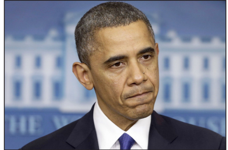
الرئيس الامريكي باراك اوباما

■ التصريح الأخير لرئيس الولايات المتحدة باراك اوباما، الذي قال فيه إن اتفاقا شاملا بين اسرائيل والسلطة الفلسطينية غير ممكن في السنة القادمة، يعبر عن المستقبل القريب للسياسة الخارجية الامريكية بشأن النزاع. يدعي اوباما في الواقع بأنه لا يتوي أن يكسر لهذه القضية وقتا وجهدا كبيرين - رغم ادعائه أنه سيواصل «الدفع بالاتجاه الذي نؤمن به».