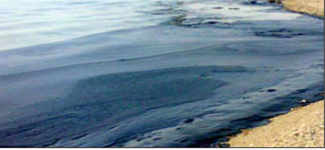
انتشار لبقع الزيت على طول الساحل الموريتاني المتسرب من الباحرة

وأعلن قبل غرق الباحرة عن تعرضها لحريق حيث قامت الحكومة الإسبانية بجرحها نحو أعالي البحار لإبعاد خطرهما عن الشواطئ السياحية لجزر الكناري. ووجه هذا القرار بانقادات واسعة. وكانت السفينة الروسية أولغ نايدونوف قد غرقت في الخامس عشر أبريل/نيسان المنصرم دون حدوث ضحايا.