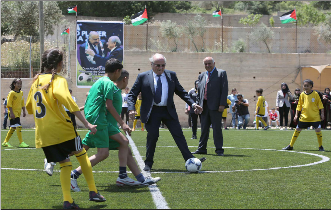
بلاير يركل الكرة مع فتية فلسطينيين في دورة القرع في رام الله ويشاهده الرجوب

رام الله - وكالات: أكد رئيس الاتحاد الفلسطيني لكرة القدم جبريل الرجوب، أن الاتحاد «سيخضع قديماً» في طلبه تعليق عضوية إسرائيل في الاتحاد الدولي لكرة القدم، فيما أعلنت جامعة الدول العربية دعمها هذا الطلب.