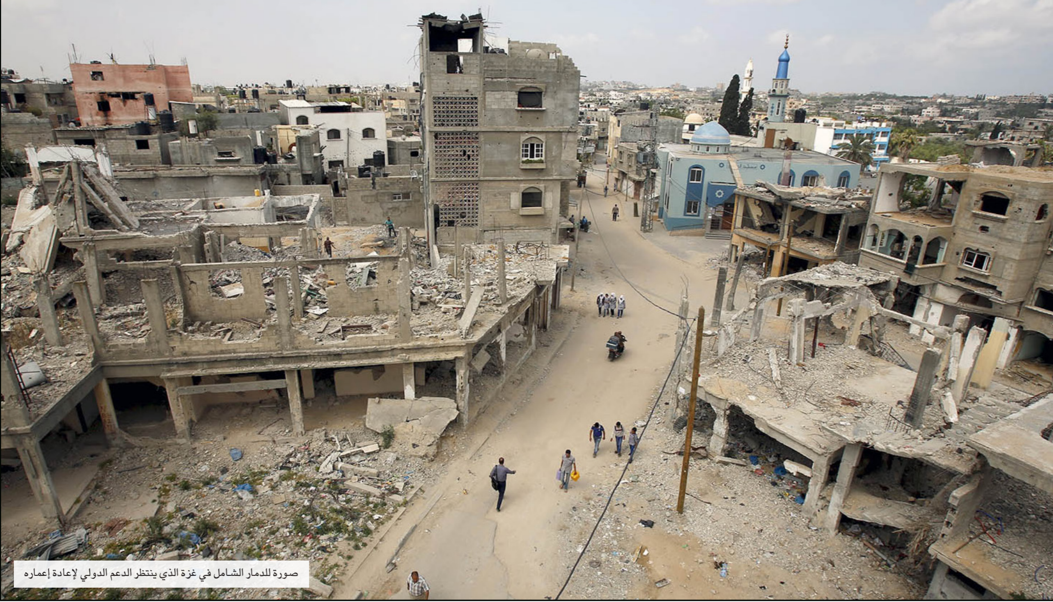
غزة - «القدس العربي» من أشرف الهور:

قدم تقرير حقوقي يرصد الحالة الاقتصادية والإنسانية في قطاع غزة المحاصر أرقاما صادمة أظهرت نسب الفقر والبطالة والحالة الصعبة التي يعيشها أهل غزة. وأكد أن الأوضاع شهدت تراجعا كبيرا بعد الحرب الإسرائيلية الأخيرة الصيف الماضي. وكشفت أن ما نحي إعمار غزة قدما فقط 17% من مجموع تعديلاتهم في مؤتمر إعادة إعمار غزة في القاهرة في تشرين الأول / أكتوبر الماضي التي بلغت 5.4 مليار دولار.