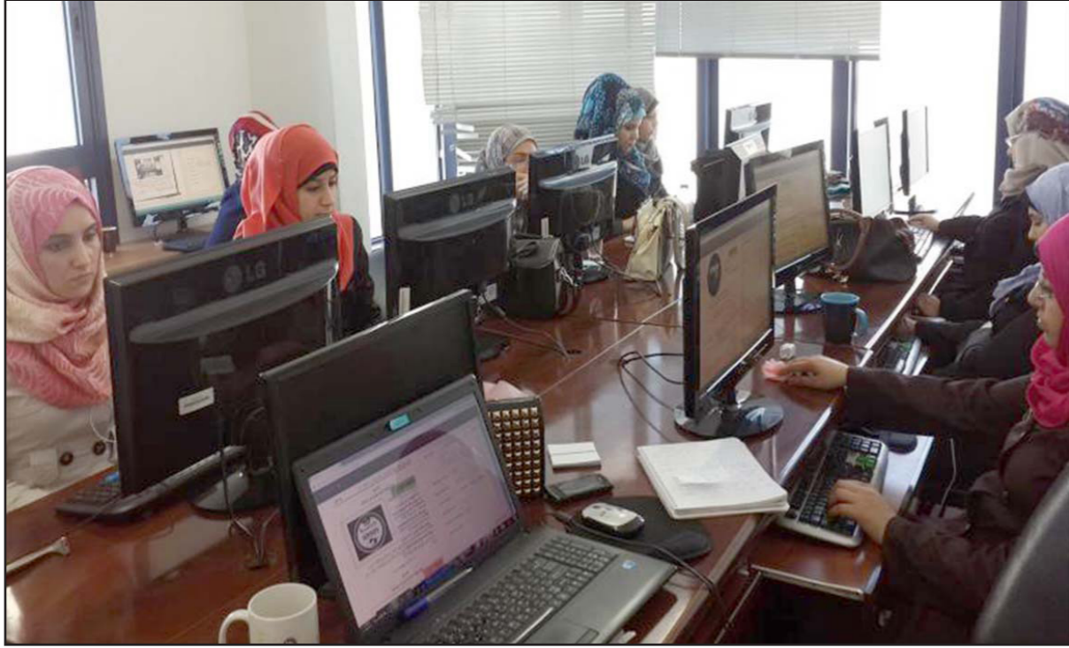
مهندسات معلوماتية عاملات في شركة «يونيت وان» في غزة

على شركة «يونيت وان» إلى شراء مولدات كهربائية وبطاريات لتسليم الطلبات في وقتها للحد. ويوضح لهندس العمل في أيام معيبة، ويلجأ الشاب في العادة إلى طماننة الزبائن «الترددتين» في بعض الأحيان في توقيع العقود مع شركة في منطقة حرب»، من خلال عقد اجتماعات عبر السكايب.