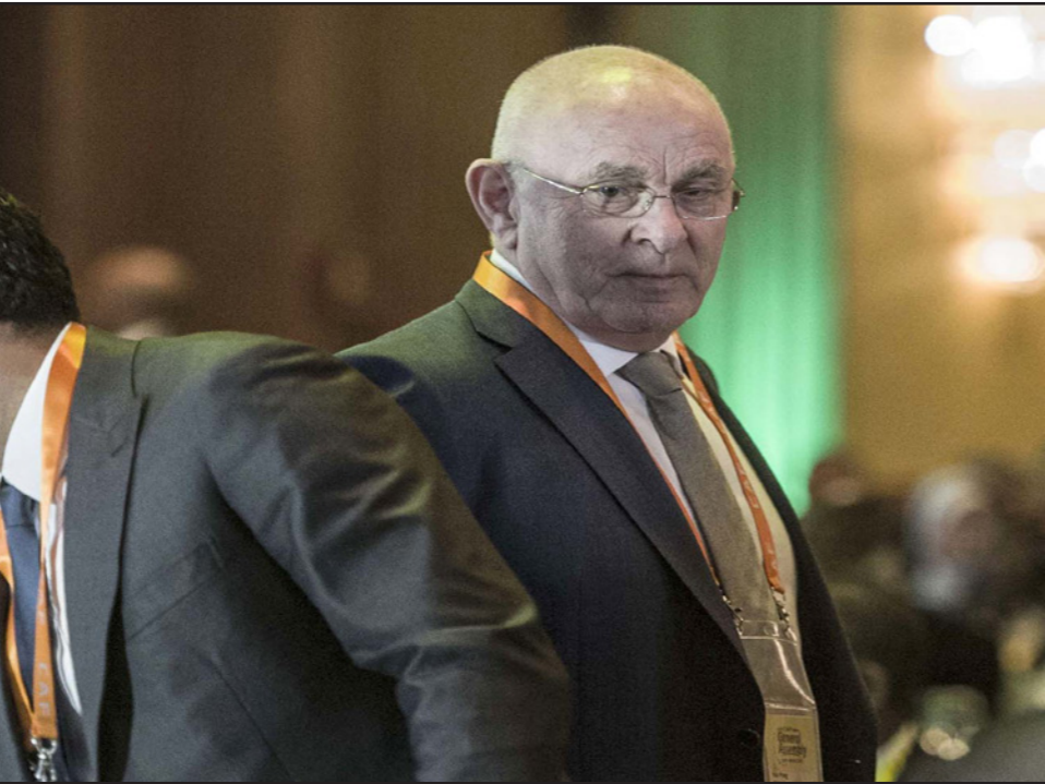
فيغو (يسار) إلى جانب فان براغ خلال اجتماع في أفريقيا الشهر الماضي

لإحياء مفاوضات السلام، لا تتوقع الحكومة الرابعة لنتنياهو أي نهان. وتشكل مجلس الوزراء القومي الديني، وهو أكثر مجلس يميني في إسرائيل منذ التسعينيات، قبل أيام فقط، وقد وجد نفسه مضطراً لمواجهة هجمات دبلوماسية على عدة جبهات. فقبل يوم واحد من حفل المجلس الجديد لليمين، اعترف الفاتيكان بإقامة دولة فلسطين من خلال وثيقة معاهدة ثنائية من المقرر توقيعها قريباً لتنظم