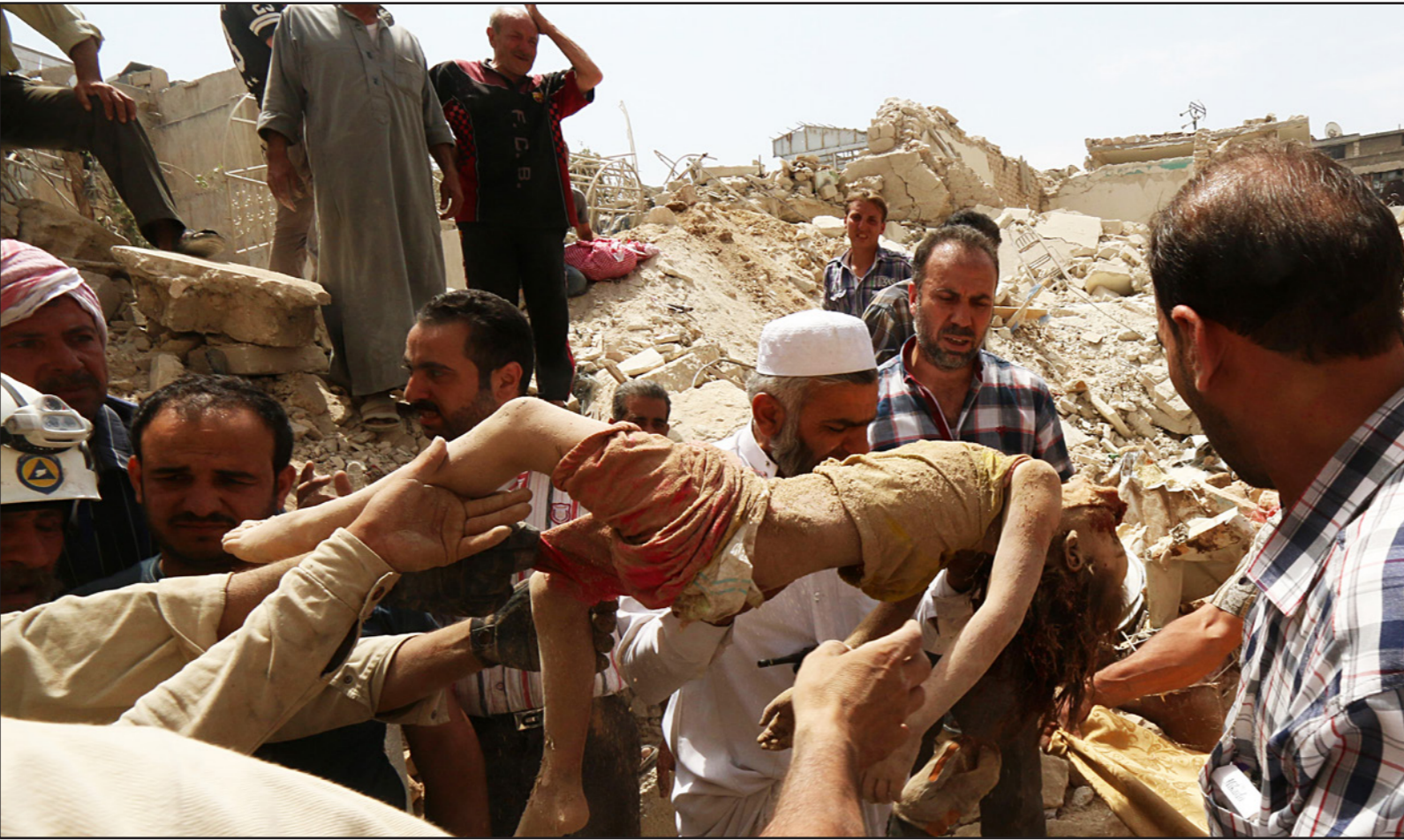
سوريون يحملون جثمان طفلة قتلت عقب قصف قوات النظام لمنطقة قاضي عسكر في مدينة حلب بالبراميل المتفجرة