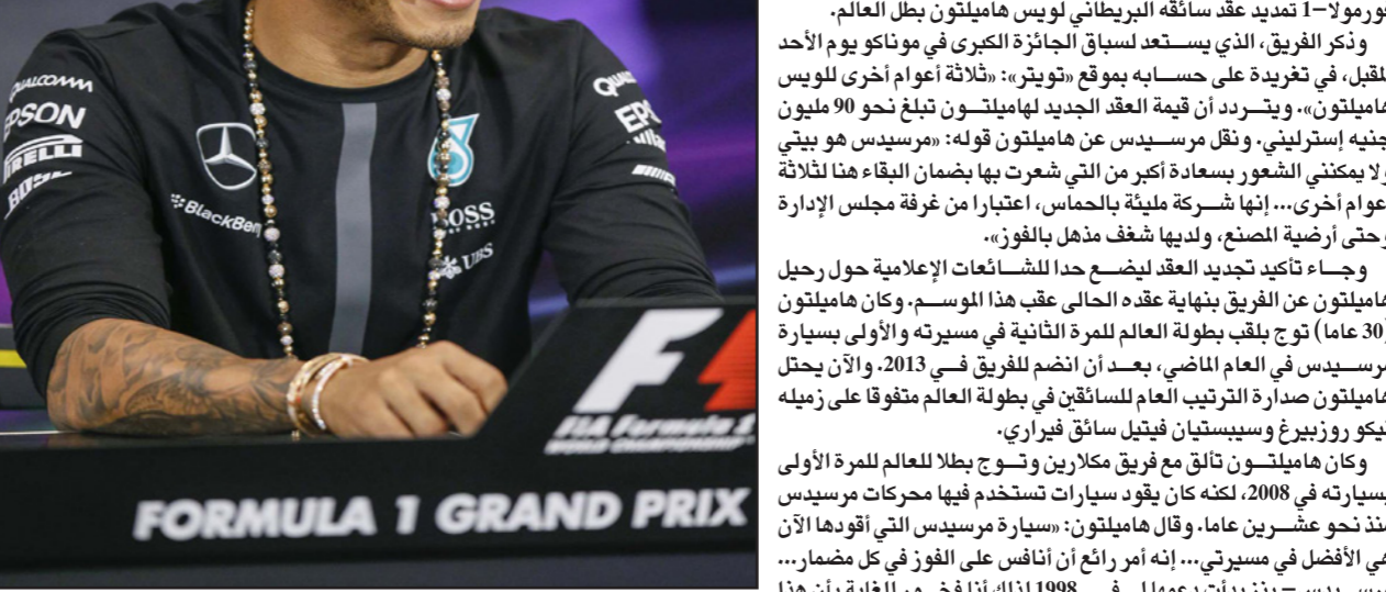
هاميلتون بعد تمديد عقده مع فريقه الحالي مرسيدس

لوس أنجلوس - د ب أ: أكد ستيفن كيوري تفوقه على جيمس هاردين مجدداً وقاد غولدن ستيت وايرورز إلى الفوز على هيوستن روكتس 110-106 في افتتاح نهائي القسم الغربي بدوري كرة السلة الأمريكي المحترفين. وسجل كيوري، الفائز هذا الشهر بلقب أفضل لاعب في دوري السلة الأمريكي متفوقاً على هاردين، 34 نقطة لفريقه الذي انتهت المباراة بفوز وايرورز على روكتس 110-106 في افتتاح نهائي القسم الغربي بدوري كرة السلة الأمريكي المحترفين. وسجل كيوري، الفائز هذا الشهر بلقب أفضل لاعب في دوري السلة الأمريكي متفوقاً على هاردين، 34 نقطة لفريقه الذي انتهت المباراة بفوز وايرورز على روكتس 110-106 في افتتاح نهائي القسم الغربي بدوري كرة السلة الأمريكي المحترفين. وسجل كيوري، الفائز هذا الشهر بلقب أفضل لاعب في دوري السلة الأمريكي متفوقاً على هاردين، 34 نقطة لفريقه الذي انتهت المباراة بفوز وايرورز على روكتس 110-106 في افتتاح نهائي القسم الغربي بدوري كرة السلة الأمريكي المحترفين.