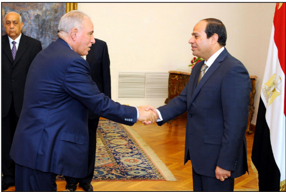
الرئيس المصري عبد الفتاح السيسى يصافح وزير العدل الجديد المستشار احمد الزند

اختيار الحكومة لتولّي الزند حقيبة العدل، إلى معادته لثورة يناير بشكل فج، وكونه وحيد لتوفّر لديه كافة المواصفات والشروط لتنفيذ أوامر السلطة، ولتعزيز القوانين والأحكام القضائية التي تريدها، واخضاع القضاء لما تريده. وقال محمد نبيل، القيادي بحركة شباب 6 ابريل إن اختيار المستشار احمد الزند منصب وزير العدل يعد رسالة لتساور 25 من يناير / كانون الثاني بشأن النظام معاد للثورة وشبابا مستقبليها بأن جميع تصريحاته تصب في خندق معسكر اصداء مبارك وأنه اتسم بإطلاق البيانات التي تعضب الجماهير ومن بينها مقولة الشهيرة «القضاة أسياود والشعب عبيد»، يحدث موجه جديدة من الحكام