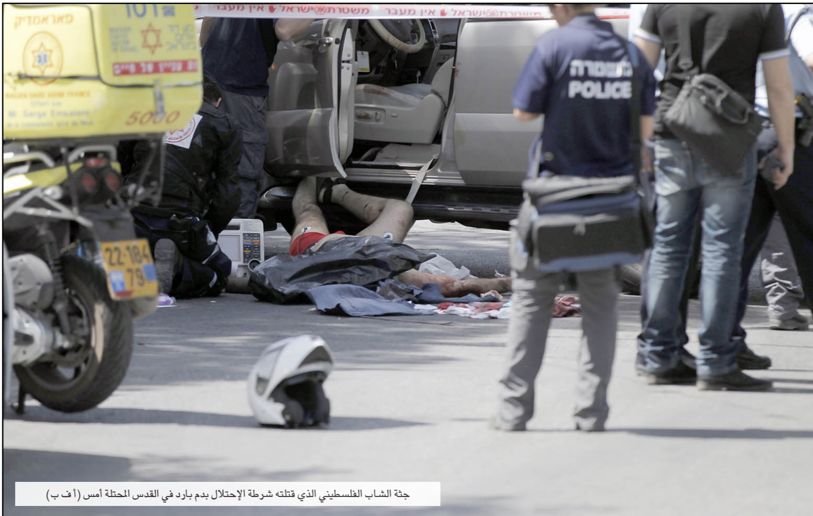
جثة الشاب الفلسطيني الذي قتله شرطة الإحتلال بدم بارد في القدس المحتلة أمس

وحسب المعلومات، فإن إسرائيل بنت منذ عام 1967 عشرين احياء يهودية جديدة في الجانب الشرقي من القدس وراء الخط الأخضر، ولم تخطط أو تشيد أي بناء للفلسطينيين في القدس. بل إن خطة البناء في عرب السواحرة، أيضا، ستقوم على أراض خاصة، ولذلك فإن الدولة لن تزودها بالبنية التحتية، كما تفعل في الجانب اليهودي.