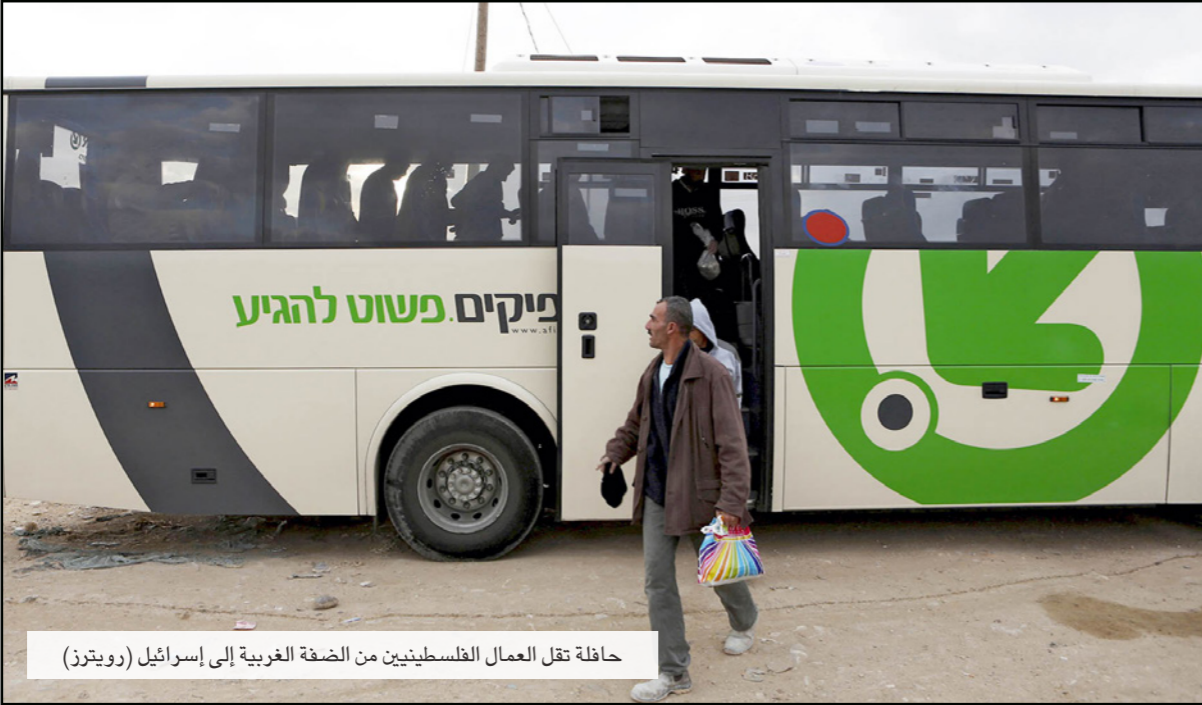
حافلة نقل العمال الفلسطينيين من الضفة الغربية إلى إسرائيل

للجبهة الديمقراطية في مدونة له أمس على موقعي فيسبوك وتويتر على قرار الفصل: «إن يعلن لمن لا يعرفه جيدا سياسيا وعسكري فاشي يامتياز من قادة حزب الليكود وهو صاحب النظرية الغربية المعروفة بـ«كي الوعي» نظرية نظريتها وجاها بها خلال سنوات انتفاضة الأقصى تحت تهديد القمع الوحشي إلى فقد ذاكرته... شيء من هذا عرفته الشعوب في عهد الراجخ الثالث الهتلري النازي».