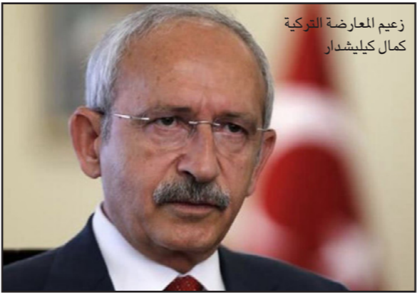
زعيم المعارضة الحركية كمال كيليشدار

ويأتي هذا الإعلان بعد سيطرة تنظيم «الدولة الإسلامية» الجهادي على مدينة الرمادي الاستراتيجية التي تبعد أقل من مئة كلم عن العاصمة بغداد. وتستعد القوات العراقية بمساعدة ميليشيات شيعية الأربعاء لشن هجوم بهدف استعادة المدينة قبل أن يعزز الجهاديون مواقعهم فيها.