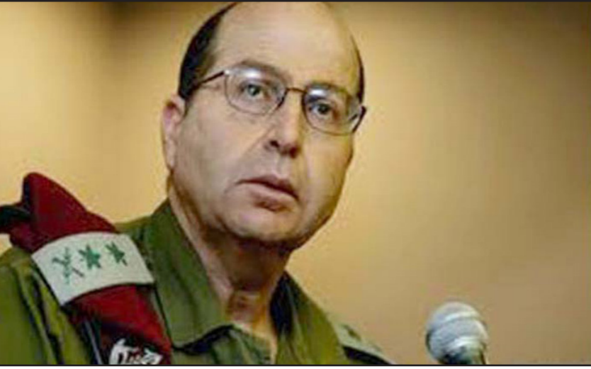
وزير الدفاع الاسرائيلي بوغي يعلون