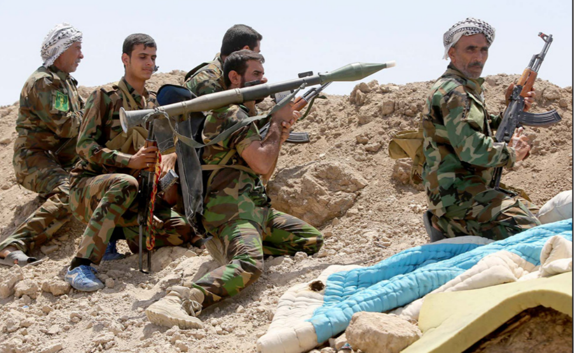
مليشيات عراقية في مواجهة تنظيم «الدولة»