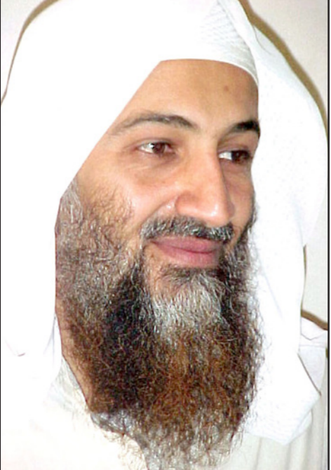
الشيخ أسامة بن لادن