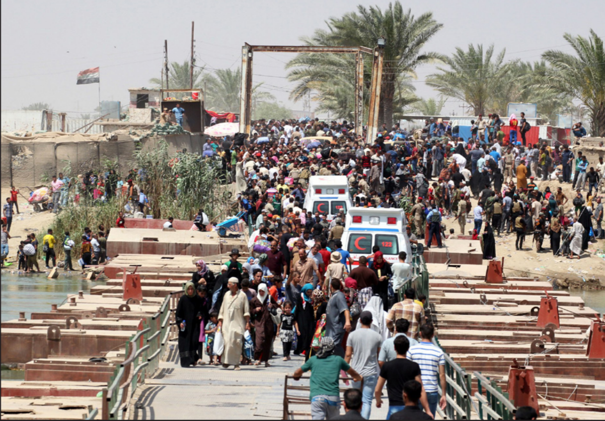
عائلات عراقية نزحت من مدينة الرمادي تتجمع قرب مدينة بغداد

ويرى نايتس أن سقوط الرمادي وإن أثر على فرص استعادة الموصل إلا أنه يعني عودة التركيز على «الأنبار» ولا وهو تطور إيجابي طالما شنت الحكومة هجوما مضادا قبل أن يتمكن تنظيم «الدولة» من تعزيز