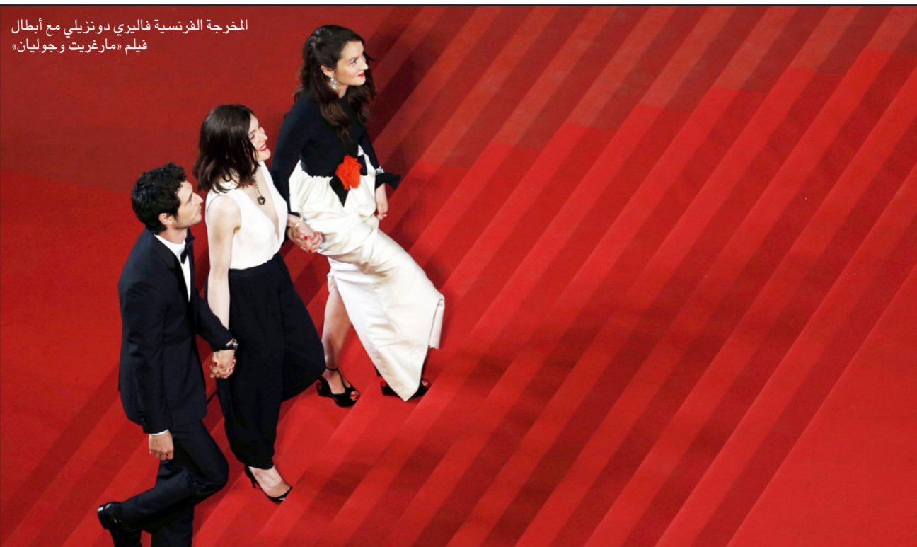
الخرجة الفرنسية فاليري دونزيلي مع أبطال فيلم «مارغريت وجوليان»

■ كان - من أسامة صافرا: تشهد سادس أيام مهرجان كان السينمائي، عرض فيلمين أمريكي وفرنسي في إطار المنافسة على السعفة الذهبية الثامنة والستين في تاريخ المهرجان، إلا أن الفيلم الفرنسي هو ما أثار جدلا واسعا. الخرجة الفرنسية فاليري دونزيلي شاعت أن تثير غضبا وجدلا لا ينتهي يتناول موضوع زنى المحارم عبر فيلم «مارغريت وجوليان»، الذي تدور أحداثه حول قصة حب بين شقيقين، فاليري دونزيلي شاركت في العام 2011 بمسابقة أسبوع النقاد في مهرجان كان، وتأتي اليوم لتشارك في المسابقة الرسمية بفيلم يتناول زنى المحارم بالكثير من التعاطف ويكاد يمنحه صك الإعتراف باعتباره نوعا من الحب وهو ما أثار إمتعاض وانتقاد نسبة كبيرة من النقاد، ورغم أن المهرجان، وخاصة في مسابقته الرسمية، لم يترك أزمة عائلية إلا ورضها، لكن دونزيلي تطرق في فيلمها إلى الموضوع الأكثر إثارة للجدل على المستويات كافة، سواء كانت دينية أو إجتماعية أو قانونية، ويدور الفيلم المتخون عن قصة حقيقية أعدم طرفاها في عام 1603 ميلادية حول مارغريت وأخيها جوليان دو رافلات، اللذين يحبان بعضهما منذ ولادتهما دون أن يخفيا هذا الشعور، انفصلا عن والديهما منذ ولادتهما، وتزوجت مارغريت من رجل يكبرها بحوالي ثلاثين سنة، ولم تستمع لترك أخيها، وتحول حينها لأختها إلى قصة حب وغرام مرمرة، تحدث علاقتهما فضيحة في المجتمع، الذي يطارد مارغريت وجوليان، اقتبس فاليري دونزيلي قصة الفيلم من سيناريو جان غرووت، الذي ألّفه في سنة 1970 للمخرج الفرنسي الكبير فرانسوا تروفو. والعروف أن زنى المحارم» شكل مادة خصبة للعديد من الأفلام واعتبرت من كلاسيكات السينما، رغم مضمونه الصادم، ومنها