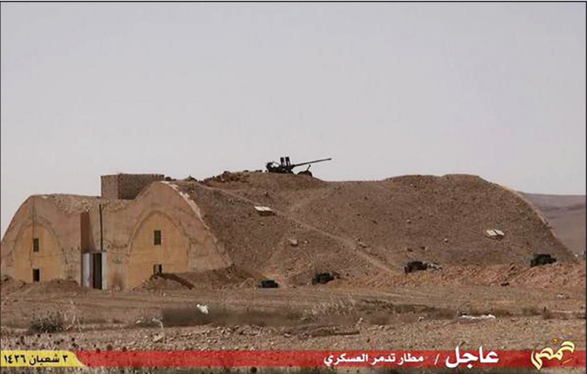
صورة من فيديو نشره تنظيم «الدولة الإسلامية» عقب سيطرته على مدينة تدمر ومطارها

العراق العبادي على تسليح العشائر السنية ولكن بدون أثر، وتسرى المجلة أنه من الصعب تكرار تجربة الصحوات 2008–2007 نظرا لضعف القبائل الـ13 الرئيسية وخلافاتها. وتأتى التطورات في الأنبار وتدمر في وقت يرغب كل طرف من الأطراف الخارجية تحميل الآخر عبء المواجهة، فالأردن يساعد في تدريب أعداد من أبناء العشائر لكنه يريد من العراقيين دفع الكلفة، أما السعودية فهي مشغولة بحربها في اليمن، ويقوم الأمريكيون بتدريب أبناء العشائر في عين الأسد لتكثيف رحبوا بالمتطوعين الشيعة على أمل نجاح هذه الوحدات حيث فشلت الجيش العراقي.