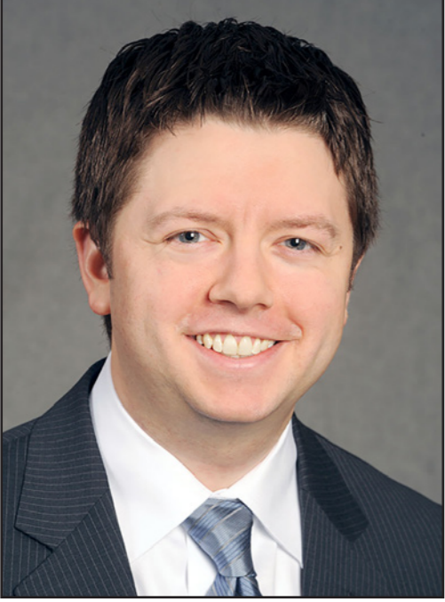
الباحث الأمريكي اريك تراجر

معارضه وتهديد شخصيات اعلامية في مصر أثناء فترة حكم مرسي. ويرى أن «تبني الإخوان أعمال العنف صراحة والتحالف مع الحركات المتشددة سيساهم في ابتعاد نطاق واسع من الشعب المصري عنهم وتعزيز التأييد الشعبي لحكم الرئيس عبد الفتاح السيسي، ويعني ذلك أن شباب الإخوان يصعدون من معركة ليس من المرجح أنهم سيفوزون بها».