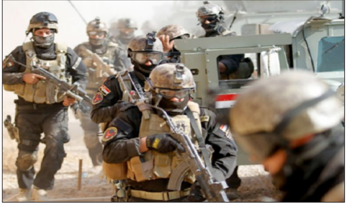
القوات الأمنية العراقية تدخل مصفى بيجي

وقال المتحدث باسم البنتاغون الكولونيل ستيفن وارن إن «القوات العراقية اعتقدت أنها بسبب العاصفة الرملية لن تتمكن من الحصول على دعم جوي..» وأضاف «نحن نعتقد الآن إن هذا كان أحد العوامل التي ساهمت في قرارها، الانسحاب من هذه المدينة. وأكد المتحدث أن تخوف القوات العراقية لم يكن في محله لأن «الطقس لم يكن له أي تأثير على قدرتنا على شن