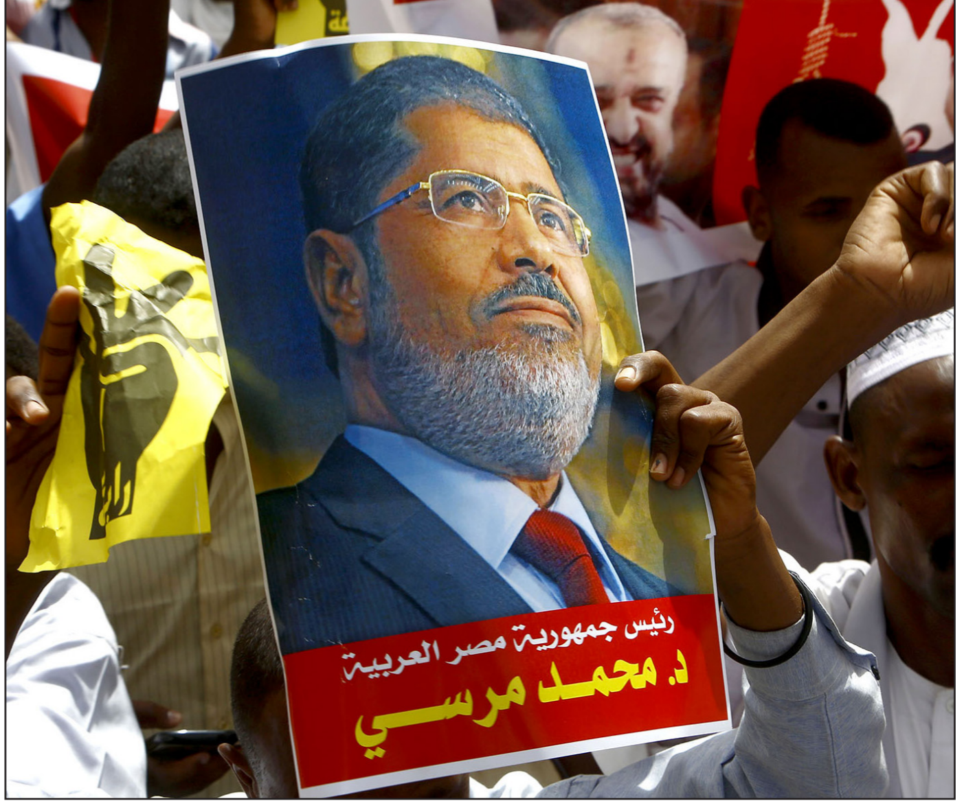
إسلاميون سودانيون يتظاهرون أمام مكتب الأمم المتحدة في الخرطوم

وقال إن لجوء قيادات الإخوان الشابة للعنف «لن يساعد الجماعة في تحقيق هدفها الرامي للعودة إلى السلطة في مصر»، موضحًا أن الكثير من المصريين «أصبحوا يؤمنون بأن الإخوان تنظم إرهابي بسبب ارتكاب أعمال العنف ضد