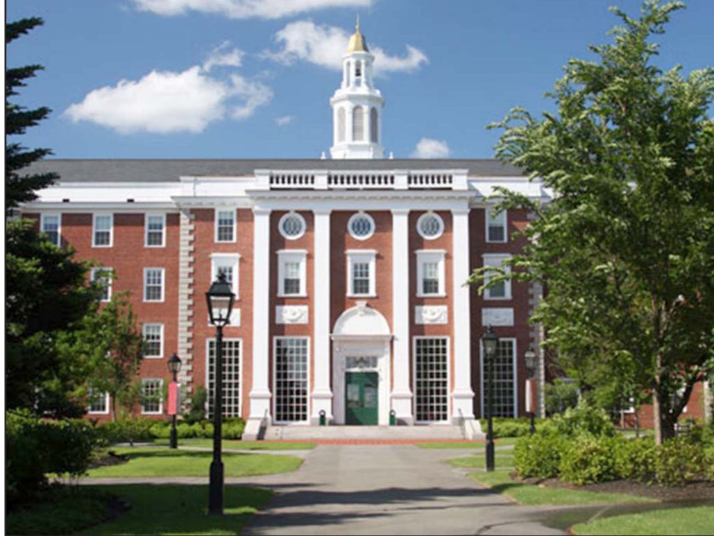
الواجهة الامامية لجامعة هارفارد