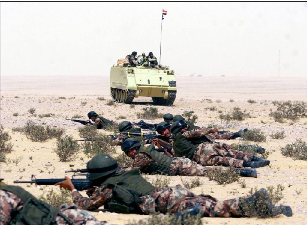
قوات من الجيش المصري خلال حملة مدهامات في شبه جزيرة سيناء

وقال بوث إن نحو مئة ألف شخص فروا من المنطقة إلى الأحرار إذ لم يعد بإمكانهم الحصول على طعام ومياه صالحة للشرب.