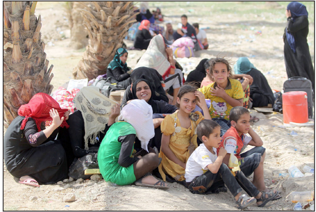
عائلات عراقية بعد نزوحها من الرمادي