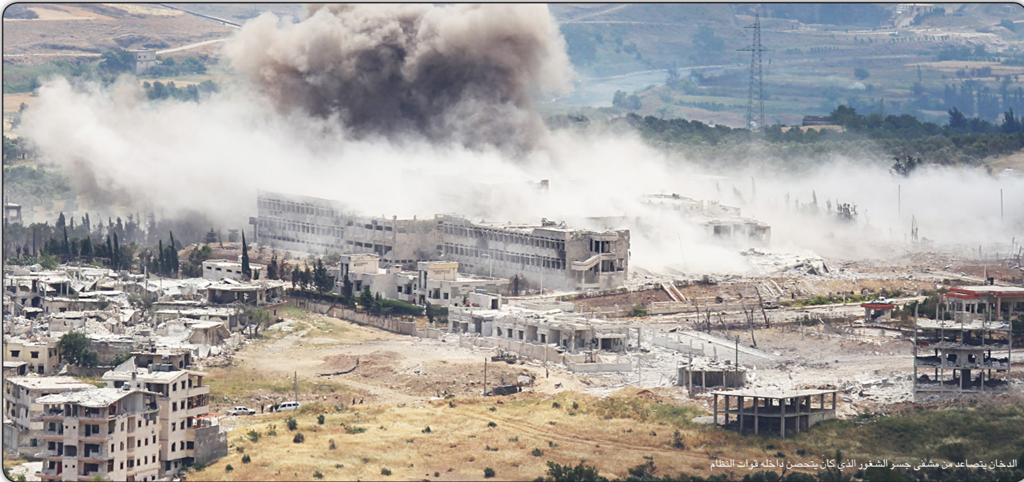
الدخان يتصاعد من مشفى جسر الشغور الذي كان يتحصن داخله قوات النظام