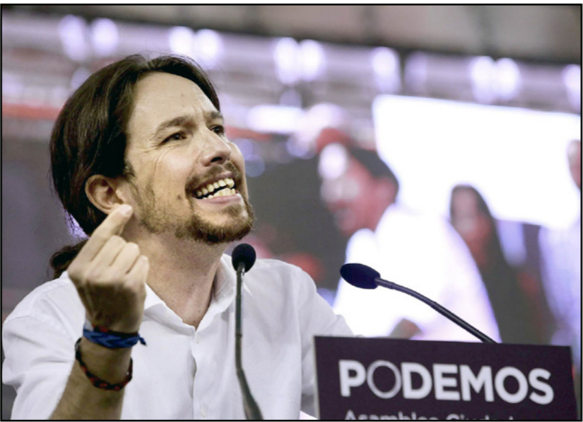
بابلو إغلسياس رئيس حزب بوديموس اليساري

ورغم التهميش الإعلامي الذي تعرض له الحزبان بسبب سيطرة الاشتراكي والشعبي على وسائل الاعلام الرسمية وشركات الاعلام الموالية لهما، إلا