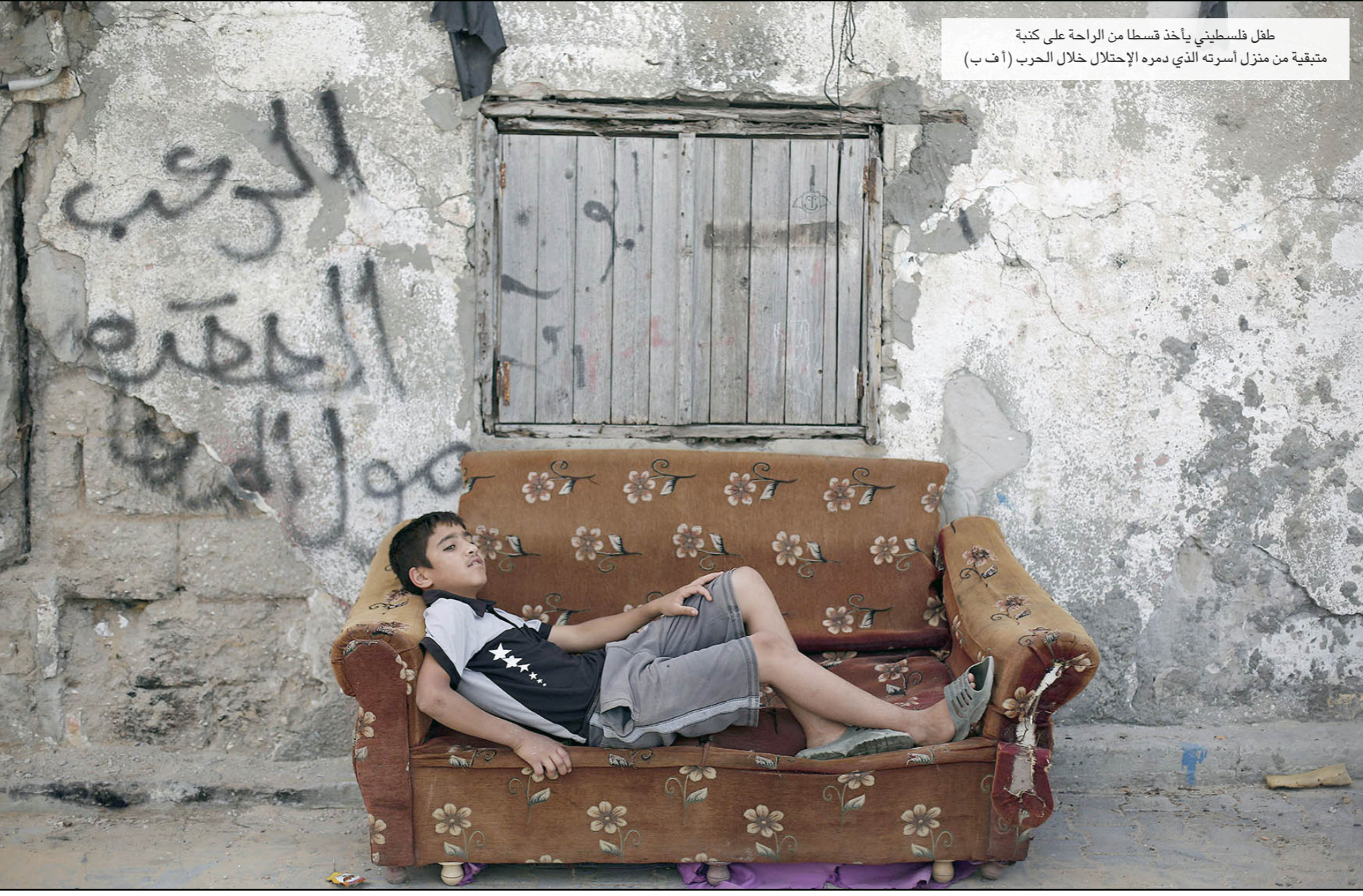
طل فلسطيني يأخذ قسطا من الراحة على كنية متبقية من منزل أسرته الذي دمره الإحتلال خلال الحرب

اطلق قتال دخانية، ما هد حياة السكان القاطنين على مقربة من الحدود. وأسفر سقوط القنابل الدخانية إلى إحراق مساحات من الأراضي المزروعة. ويص انشاق التهدة الذي تم التوصل إليه الصيف الماضي إلى وقف الهجمات المتبادلة بين الطرفين، وهو امر لم تقتدي به قوات الإحتلال مطلقا.