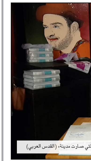
حفل توقيع كتاب «حيفا... الكلمة التي صارت مدينة»

التي لا ينسونها لحظة ويتشبهون بهويتهم وهذا يعني أن العالم فوت فرصة ولم يفهم عام 1948 حيوية إتاحة العودة للاجئين الفلسطينيين بالسنوات الأولى بعد النكبة، داعياً لبناء متحف للذاكرة الفلسطينية على الدخيل ومناهضة العنصرية مشدداً على كونها ذات الأيديولوجية التي دفعت دافيد بن غوريون لهدم عشرات القرى في قضاء حيفا وتدفق بنيامين نتانياهو لهدم قرية العراقيب بقوة الكلمة والتاريخ، داعياً لترجمة الكتاب للإنجليزية منوهاً أنه لا يقوى التحدث هذه الأيام بالعبرية بسبب جرائم إسرائيل. كما لفت إلى أن الأجيال الجديدة من أبناء