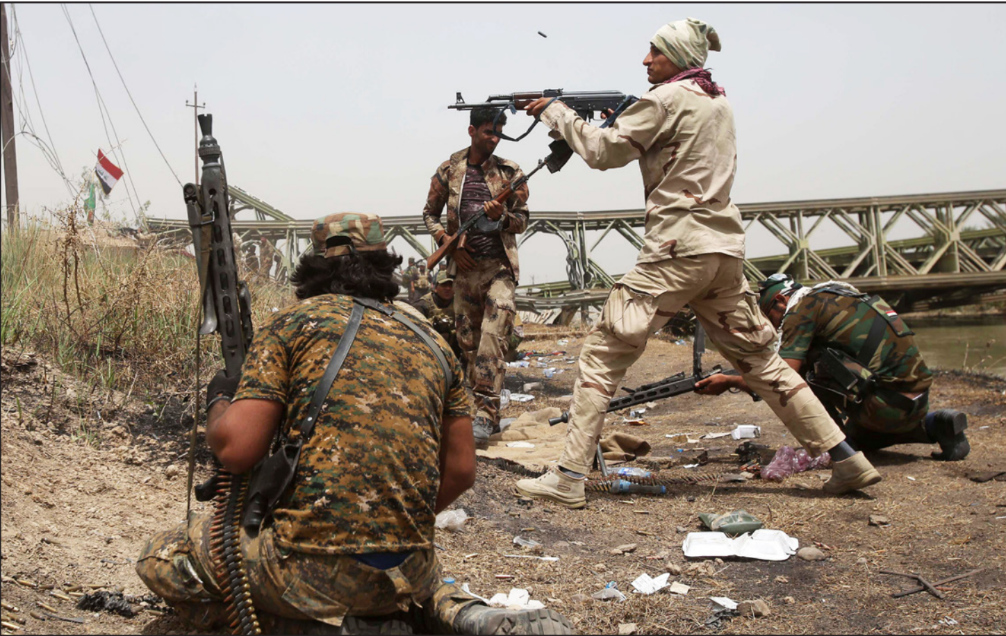
مقاتلون من قوات الحشد الشعبي خلال معارك مع عناصر الدولة الإسلامية على مشارف بغداد

وتقول الصحيفة في افتتاحيتها أن إدارة الرئيس باراك أوباما ردت على سقوط الأنبار بسلسلة من الإجراءات العلاجية مثل تسريع شحن صواريخ مضادة للدبابات