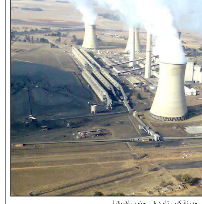
محطة كندال لتوليد الطاقة الكهربائية قرب مدينة كيب تاون في جنوب أفريقيا

تطوير التصدير. وتعد نيجيريا مثلا بارزا، فالبلد الواقع في غرب أفريقيا هو صاحب أكبر اقتصاد في القارة وسادس منتج للنفط في العالم، لكن لا يبقى في البلاد إلا عدد قليل من براميل النفط الذي تنتج نيجيريا منه 2.5 مليون برميل في اليوم. ونتيجة لهذا يعيش نحو ثلثي سكان البلاد الذين يقدر عددهم بنحو 178 مليون نسمة دون شبكة كهرباء. وتسببت عقود من قلة الاستثمار في قطاع الطاقة مصحوبا بالفساد في انهيار قطاع التصنيع في نيجيريا وفي الفشل في تقليص الفقر رغم كل الثروات. ويقول البنك الدولي ان نصف سكان نيجيريا