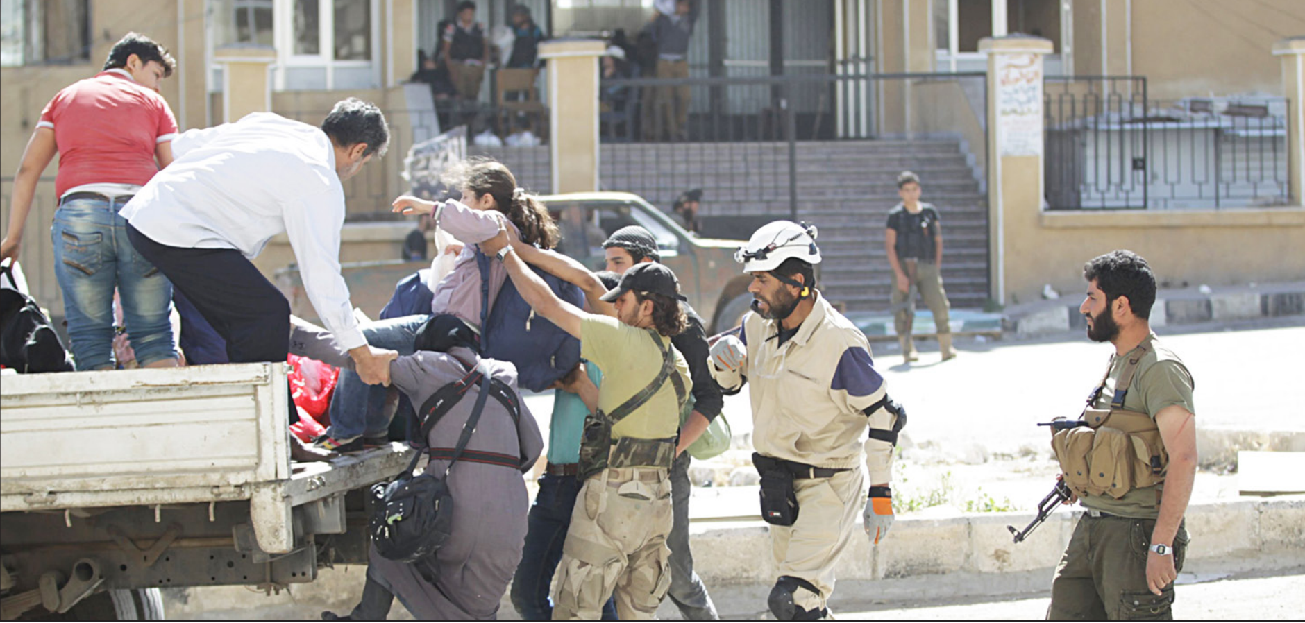
عناصر من «جيش الفتح» والدفاع المدني يساعدون راحلين عن مدينة أريحا بعد استيلاء المعارضة السورية عليها

■ عواصم - وكالات: سيطرت «جبهة النصر» وحلفاؤها مساء الخميس على أريحا آخر المدن في محافظة إدلب، وشهدت عشرات الآليات التابعة لقوات النظام السوري تنسحب من المدينة، حسب ما ذكر المرصد السوري لحقوق الإنسان.