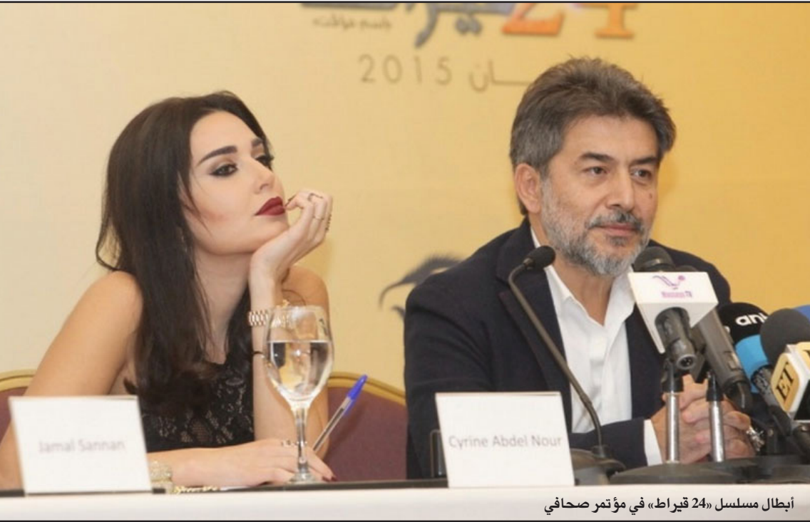
أبطال مسلسل «24 قيراط» في مؤتمر صحفي

تجمع بين شاب مسلم وفتاة مسيحية في السينمات صورة واقعية لا تزال موجودة في المجتمع اللبناني من ناحية رفض «الزواج المختلط»، كما يعكس في الوقت نفسه الإنفتاح الكبير من قبل البعض، وخصوصاً الشباب، تجاه هذه الخطوة التي لا يعتبرونها مشكلة تقف أمام حب يريد طرفاه تكليله بزواج ينتج عنه تأسيس أسرة متماسكة. ومن الأعمال الدرامية التي تستشارك في السباق الرمضاني مسلسل «بنيت الشهيد»، الذي سيرعرض على شاشة «المستقبل» وهو من إنتاج مفيد الرفاعي وإخراج سيف الدين السبيعي، وتمثيل: سلافه معمار وقصي الخولي وسعيدة بارودي وطلوني عيسى وسارة أبي كنعان ونخبة من ألمع النجوم اللبنانيين والعرب. وعلى شاشة «المنار» سيتم عرض دراما «درب الياسين» أو «يا سمين الجنوب» من بطولة النجم اللبناني باسم مغنية والفاتة إين لحود. وسيعرض في شهر رمضان المبارك مسلسل «تشيللو»، وهو من تأليف نجيب نصير وإخراج سامر البرقاوي، وإنتاج صادق الصباح ويقاسم البطولة كل من النجم السوري تيم حسن والنجم اللبناني يوسف الخال والمثلة نادين نسيف نجيم. أمّا المفاجأة الكبرى وغير المنتظرة في مسلسل «العرب» والتي أعلنتها شركة «سمسا الفن الدولية للإنتاج الفني»، والمنتج أحمد حمشو فهي مشاركة فارس الغضائف عاصي العلاني الذي سيكون أحد أبطال المسلسل في أول إطالة درامية عربية له، وسيكون مع عاصي نخبة