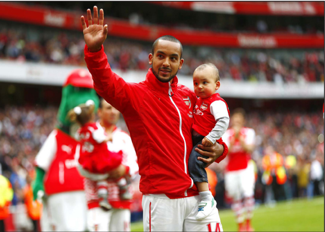
والكوت نجم هجوم أرسنال يحيي الجماهير حاملاً طفله

■ لندن - د ب أ: يتطلع أرسنال إلى استكمال رحلة الدساع عن لقبه في كأس إنكلترا بنجاحا عندما يلتقي أستون فيلا اليوم في المباراة النهائية للبطولة على استاد «ويمبلي» بالعاصمة البريطانية لندن. وقد يسعى أرسنال للفوز باللقب للمرة الثانية عشرة (رقم قياسي) في تاريخه، يتطلع أستون فيلا للفوز باللقب الأول له في البطولة منذ عام 1957. ووجه مدربه الفرنسي أرسين فينغر رسالة بسيطة إلى فريقه قبل المباراة مطالبا اللاعبين بإنهاء ما بدأه.