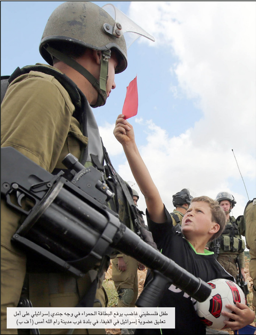
طفل فلسطيني غاضب يرفع البطاقة الحمراء في وجه جندي إسرائيلي على أمل تعليق عضوية إسرائيل في فيفا، في بلدة غرب مدينة رام الله أمس