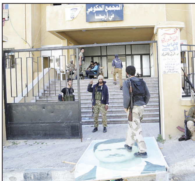
مقاتلون من «لواء الحق» المعارض قرب مباني حكومية في مدينة أريحا أمس