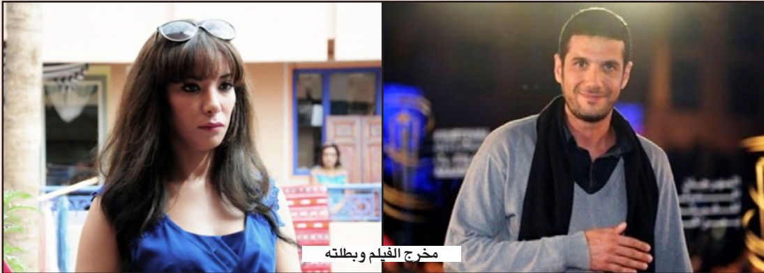
مخرج الفيلم وبطلة

وفي السياق، نعلن شجبنا للقرار اللا قانوني، المسبق والمتحيز، الصادر عن وزير الاتصال المغربي والقاضي بمنع الفيلم من التداول حتى قبل إقدام صاحبه على طلب الترخيص بعرضه. ونستجيب للإستعمال المتهافت لهذا الموضوع من لدن بعض الفاعلين السياسيين. يذكر أن تغاللات الفيلم التي أثار ضجة لا مثيل لها لم تهدأ بعد، حيث انقسمت الآراء بين من يدعو لحرية التعبير والإبداع والحق في الكشف عن سموات المجتمع عن طريق الفن والإبداع دون قيود أو امتثال لقواعد أي كانت، وبين من اعتبر الماطع التي تسربت من الفيلم إساءة للأخلاق العامة وللمغرب والمغربيات وتتعارض مع قيم البلاد ومرجعيتها الإسلامية.