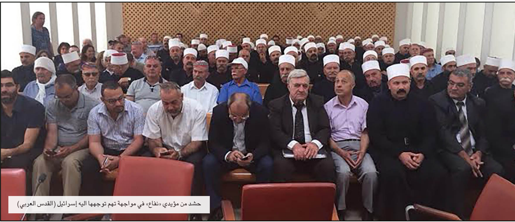
حشد من مؤيدي «نفاع» في مواجهة تهم توجيهها إليه إسرائيل

ويشكل أساسي فإن شاكيد تهدف من وراء مشروع القانون إلى إضافة مخالفة جديدة إلى القانون تمنع بموجها إلقاء الحجارة أو أي عمل آخر حتى لو يكن الهدف التسبب بأذى فقط بل مضايقة أفراد الشرطة أثناء ممارسة عملهم.