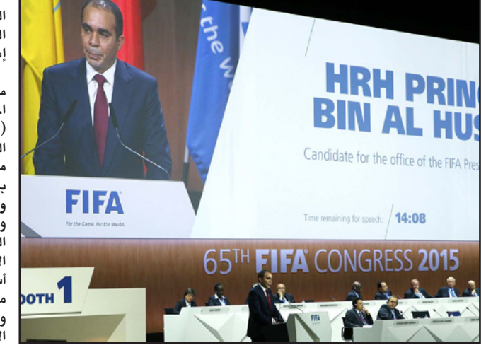
الامير علي أثناء اللقاء كلمته في اجتماعات الكونغرس

زيورخ - د ب أ: قال الأمير الأردني علي بن الحسين إن الاتحاد الدولي لكرة القدم في مفترق طرق وأنه سيدعو الطريق نحو مستقبل أكثر إشراقاً لعالم كرة القدم إذا انتخب رئيساً للفيفا.