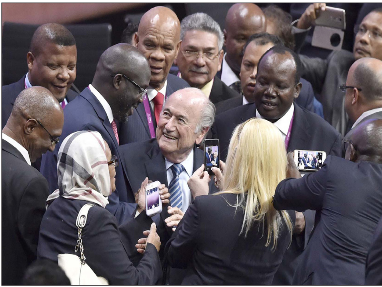
بلاتر ينقل التهاني من رؤساء الاتحادات وأعضاء الفيفا عقب فوزه بالانتخابات

زوريخ - د ب أ: فاز السويسري جوزيف بلاتر بفترة ولاية خامسة على رئاسة الاتحاد الدولي لكرة القدم (الفيفا) بعد انسحاب منافسه الوحيد الأردني الأمير علي بن الحسين قبل الجولة الثانية من التصويت بالانتخابات التي جرت أمس في مدينة زيورخ السويسرية.