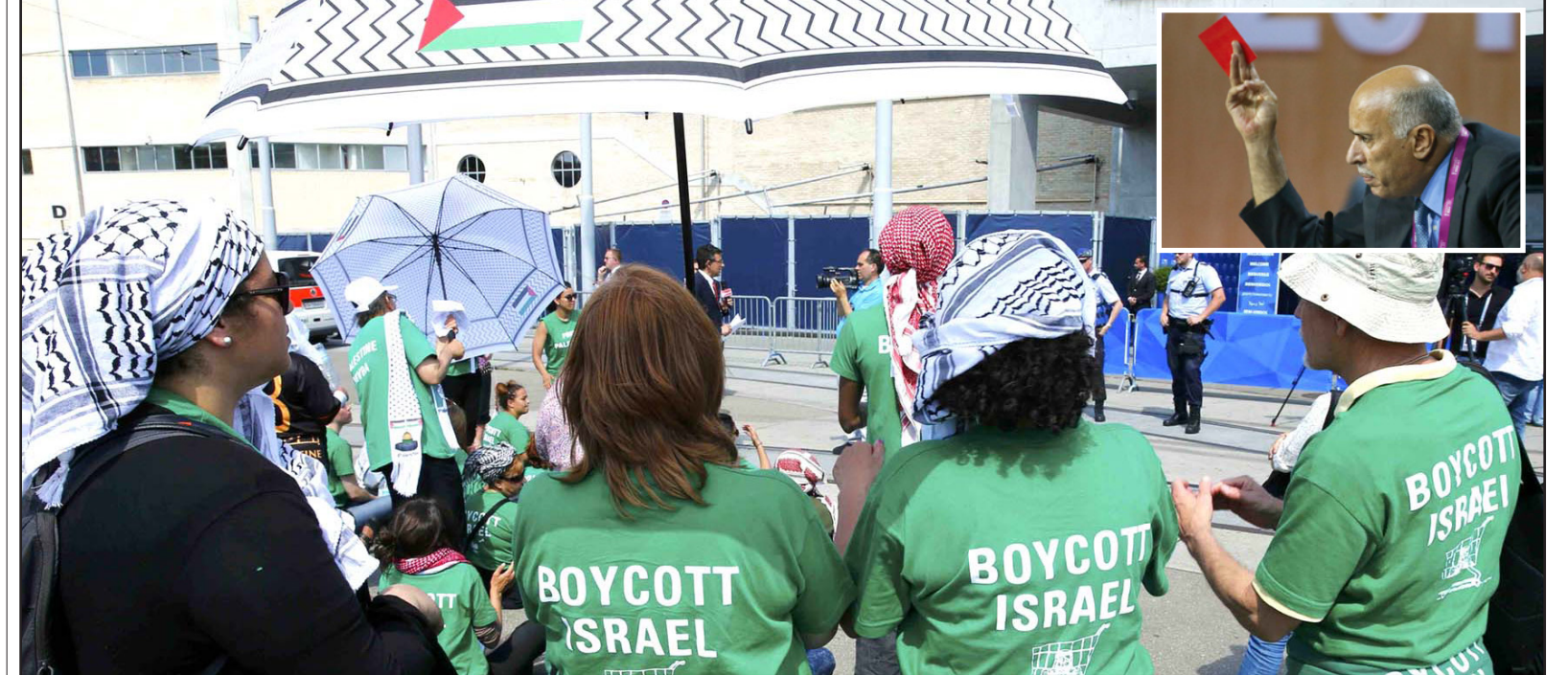
مظاهرون خارج مقر اجتماعات الفيفا طالبوا بسحب عضوية إسرائيل... وفي الأطار الرجوب يرفع البطاقة الحمراء

القدس، فلسطين - قال الرجوب وهو سياسي فلسطيني سابق: «أنا مستعد للقيام بالصفحة المصفاة لكن دعونا نصوت ونواصل المساعي بكل ما في وسعنا». وأضاف: «أنا أعتقد أن الناس الذين تصادفهم في النهاية بمجرد أن تمت صياغة الاقتراح من جوزيف بلاتر رئيس الاتحاد الدولي.