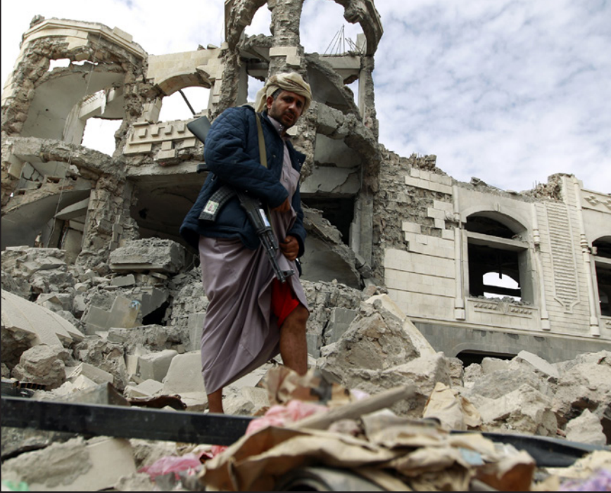
مقاتل حوثي يقف على ركام منزل لأحد قياديي الجماعة في صنعاء أمس

وكانت أزمة مهاجري دول جنوب آسيا قد ظهرت عندما اكتشفت السلطات التايلاندية في الأول من