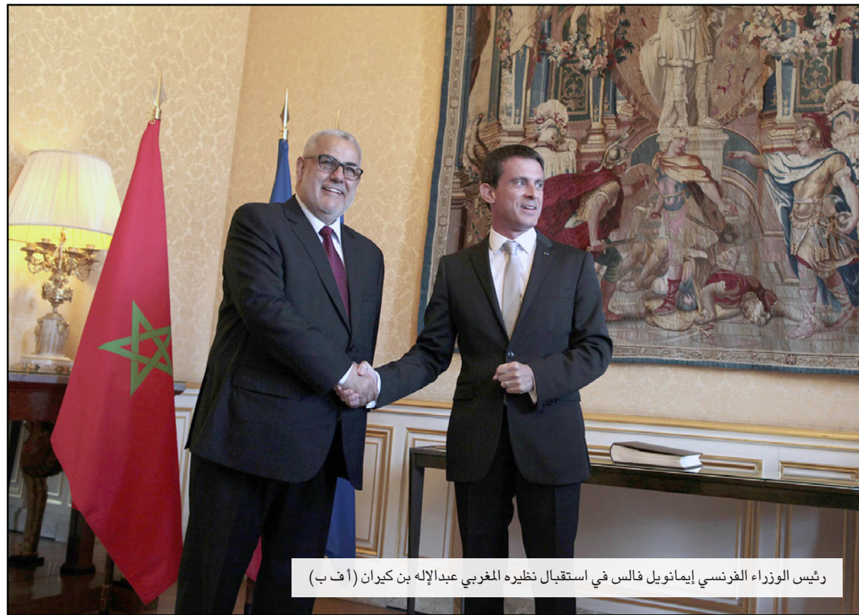
رئيس الوزراء الفرنسي إيمانويل فالس في استقبال نظيره المغربي عبد الإله بن كيران

باريس - أ ف ب: أعلن رئيس الوزراء المغربي عبد الإله بن كيران الجمعة إثر لقاء مع الرئيس الفرنسي فرانسوا أولاند أن العلاقات بين فرنسا والمغرب تستأنف «وكان شيئا لم يكن» وذلك «بعد سنة صعبة قليلا». وصرح إثر لقاء استمر نصف ساعة مع أولاند «لقد مضت سنة صعبة قليلا لكننا تجاوزناها، والآن الأمور تعود إلى ما كانت عليه». وكان رئيس الوزراء الفرنسي إيمانويل فالس استقبل نظيره بن كيران في لقاء الخميس تم خلاله توقيع اتفاقات عدة «في جو ودي تماما» بحسب بن كيران. وقال «نريد المغرب وفرنسا أن يواصلنا من خلال التركيز على المستقبل، علاقاتهما التي كانت دائما خاصة وإيجابية». وبدأ الخلاف بين البلدين عندما علّق المغرب التعاون القضائي الثنائي بعد أن طلب قاض فرنسي في شباط/فبراير من مؤل عبد الطيف حموشي مسؤول جهاز مكافحة التجسس المغربي إثر رفع دعوى ضده في باريس بتهمة «التعذيب».