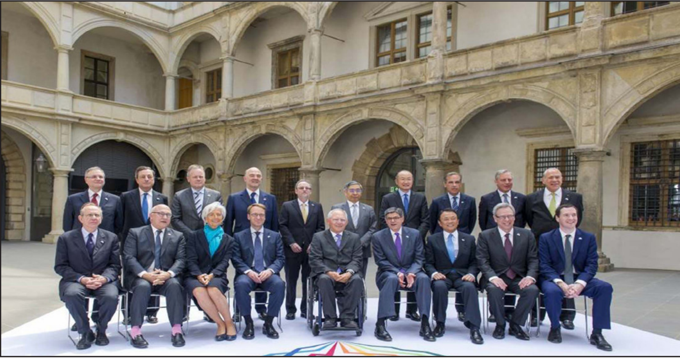
وزراء مالية وحكام البنوك المركزية في مجموعة الدول السبع الكبرى

ليس الموضوع، قال المفوض الأوروبي ليز وساشنطن، إلى جانب مسألة العملة الصينية التي تريد تكثيف ادراجها في لسولة العملات لحقوك السحب الخاص لصندوق النقد الدولي. لا اتفاق بعد مع أئينا من جهتها دعت الولايات المتحدة كافة الاطراف المنخرطة في الملف اليوناني إلى «التحرك» لتفادي «أزمة»، وقال وزير المالية الأمريكي جاك لو اثر لاجتماع الاجتماع «على كافة الاطراف المعنية ان تتحرك». واعبر لو انه «يتعين ان تكون هناك مرونة من جانب المؤسسات» اي المفوضية الأوروبية والبنك المركزي الأوروبي وصندوق النقد الدولي التي تنتظر من ائينا التزامات بالإصلاح في مقابل الحصول على تمويلات جديدة. لكن في الوقت نفسه هناك «قرارات صعبة جدا» يجب ان يتخذها اليونانيون، بحسب الوزير الأمريكي الذي دعا إلى المبادرة سريعا إلى «حل الامر قبل الوصول إلى أزمة» وذلك ما فيه مصلحة الجميع والاقتصاد العالمي. لكن مصيف الاجتماع وزير المالية الألماني فولغانغ شوبيله بدأ بالأمل في التوصل إلى اتفاق سريع حيث اعتبر ان «الاعلان الإيجابية» للحكومة اليونانية «لا تعكس تماما» مستوى تقدم المباحثات. وقال المفوض الاقتصادي للإتحاد الأوروبي بيير موسكوفيتشي أمس الخميس إنه من الممكن التوصل إلى اتفاق بين اليونان ودانيتها الدوليين لكن يجب قطع شوط طويل قبل بلوغ هذه الغاية وجمع مواصلة السعي إلى نهار لأن اليونان توشك أن تواجه نفاذ الوقت والمال.