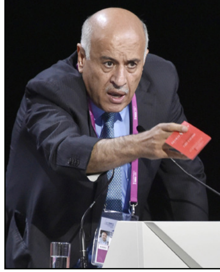
اللواء جبريل الرجوب

طروف الرياضة الفلسطينية ورضوخ إسرائيل لبعض المطالب الفلسطينية أمر إيجابي جداً ويجب البناء عليه، إلا أن هناك قسماً آخر يجد أن ما جرى هو رضح مقترح رئيس الوزراء الإسرائيلي الذي كان صاحب هذا الاقتراح «تشكيل اللجنة» خلال زيارة بلاتر الأخيرة إلى الأراضي الفلسطينية. وتبقى القضية بالنسبة للفلسطينيين أنهم يعيشون حلماً في كل مرة لكنهم يستيقظون منه بكابوس وضربة موجعة أخرى بالتراجع في اللحظات الأخيرة، وهو ما جرى مع الاتحاد الفلسطيني لكرة القدم وقيل أنه جاء بضغط عربي ودولي كبير جداً.