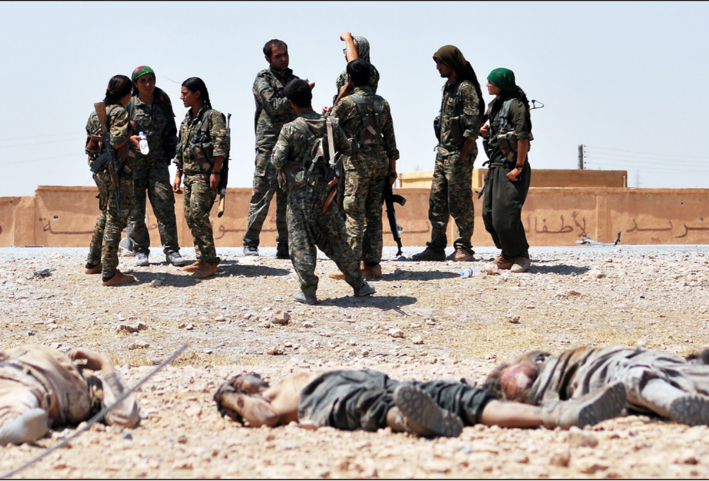
مقاتلون اكراد عند بلدة عين عيسى قرب مدينة الرقة يقفون امام جثث لخماسر تنظيم «الدولة»