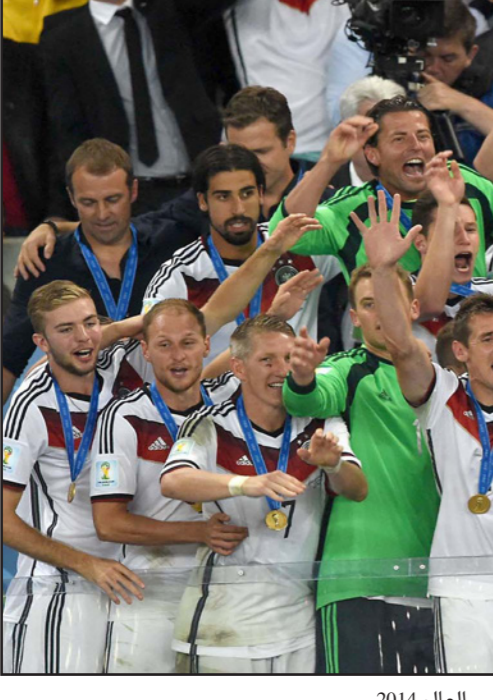
نجوم المنتخب الألماني يحتفلون بكأس العالم 2014