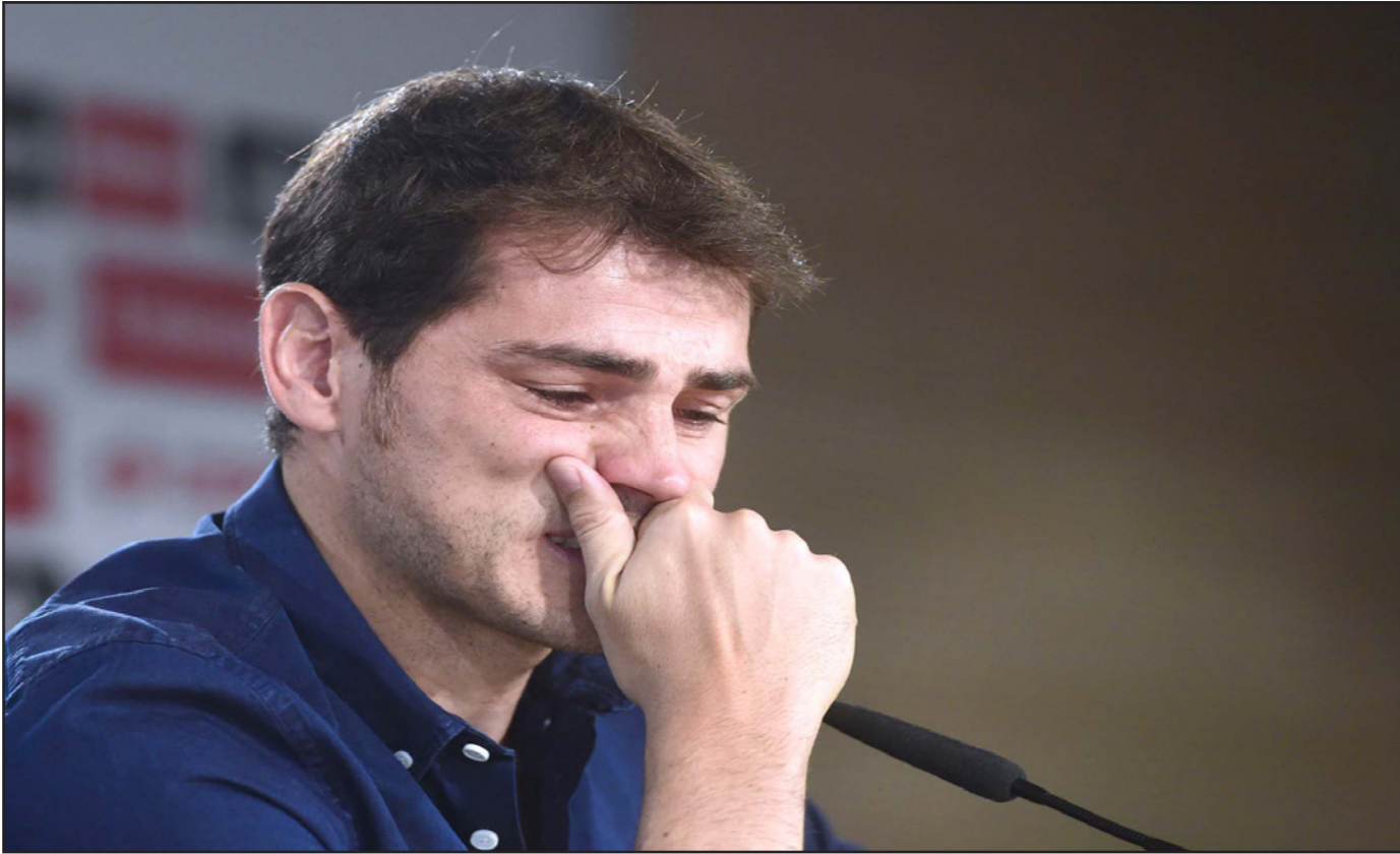
كاسياس يقاوم الدموع خلال المؤتمر الصحفي الذي أعلن خلاله رحيله عن ريال مدريد

«لما يظهر بيريز دائما مستعدا للتفرغ ريال مدريد من أشهر وأهم نجومه». وذكرت قراءة ها بالطريقة المهنية التي طرد بها مانولو سانتشيز وفيرناندو ريديوندو في عام 2000 وفيرناندو هيبيرو في 2003 ورأول في 2010. وأشارت إلى أن بيريز دخل حاليا في خلاف شديد مع المدافع سيرخيو راموس، الذي يسعى للرحيل ربما إلى مانشستر يونايتد، بعد رفض طلب زيادة راتبه في النادي الملكي. وأكدت «أس»: «بيريز يجد من الصعب عليه التعامل مع اللاعبين الكبار، خاصة الأسباب منهم». واستهجت بعض جماهير ريال مدريد أداء كاسياس في عدة مباريات الموسم الماضي. وانضم كاسياس إلى قطاعات الناشئين بريال مدريد في سن التاسعة وتدرج سريعا في صفوف شباب النادي. وسجل كاسياس ظهوره الأول مع الفريق الأول للريال في 1999 في سن الـ18 وأصبح أصغر حارس مرمى يشارك في نهائي دوري أبطال أوروبا في عام 2000 حينما تغلب ريال على بلنسية 3/صفر بعد أربعة أيام فقط من عيد ميلاد كاسياس التاسع عشر. وشارك كاسياس في 510 مباراة مع الريال و162 مباراة مع المنتخب الإسباني ليصبح صاحب أكبر عدد من المشاركات الدولية في تاريخ منتخب الماتادور.