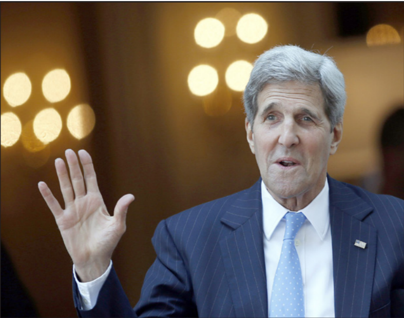
جون كيري ملوفاً للصحافيين لدى خروجه من مقر إقامته متجهاً إلى مقر المفاوضات أمس

حسن روحاني قال إنه المفاوض قد تنجح وقد تفشل بينما قال الزعيم الأعلى الإيراني آية الله علي خامنئي إن طهران ستستواصل معركتها ضد «الخطرة العالمية» في إشارة للولايات المتحدة. وفقاً لموقعه على الإنترنت فإن طالباً سأل خامنئي عما قد يحدث «للمعركة ضد الخطرة العالمية» بعد انتهاء المفاوضات النووية فرد الزعيم الأعلى بالقول إن المعركة يجب أن تستمر. ونقل عن خامنئي قوله «المعركة ضد الخطرة العالمية هي جوهر ثورتنا ولا يمكننا إبقاها. استعداداً لمواصلة قتالكم ضد الخطرة العالمية. الولايات المتحدة هي التجسيد الحقيقي للخطرة العالمية». لكن خامنئي لم يضع «خطوطاً حمراء» جديدة لفريق التفاوض الإيراني كما فعل في خطاب سابق قبل أسبوعين. من جانبه، شكك زعيم الأغلبية الجمهورية في مجلس الشيوخ الأمريكي أمس الأحد في قدرة الرئيس الأمريكي باراك أوباما على الفوز بموافقة الكونجرس على أي اتفاق نووي يجري التفاوض عليه حالياً مع إيران. وقال السناتور ميتش مكنيل في مقابلة مع برنامج (فوكس نيوز صنداي) «أعتقد أنها ستكون -إذا ما تمت - عملية صعبة للغاية في الكونجرس». وأضاف «نعراف بالفعل انه (الاتفاق) سيترك إيران دولة على اعقاب إيتلاك قدرة نووية». إلى ذلك، شدد المرشد الأعلى الإيراني، آية الله علي خامنئي على ضرورة تجنب «النظرة السطحية للإسلام والبحث بحمق في المفاهيم الإسلامية»، وقال إن «الإسلام الرحمانى (دين الرحمة) من اللبيرالية». وأفاد الموقع الرسمي لكاتب خامنئي أن المرشد الأعلى الإيراني استقبل حشداً من طلبة الجامعات الإيرانية مساء السبت خلال مائدة إفطار، وطالب بضرورة اجتناب النظر السطحية للإسلام وتعقب في المفاهيم الإسلامية بشكله الصحيح، وصرح أن «الإسلام الرحمانى من اللبيرالية، ولا صلة له بالإسلام ولا