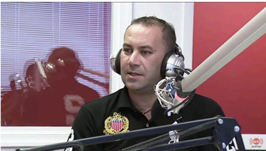
الرباط - «القدس العربي»