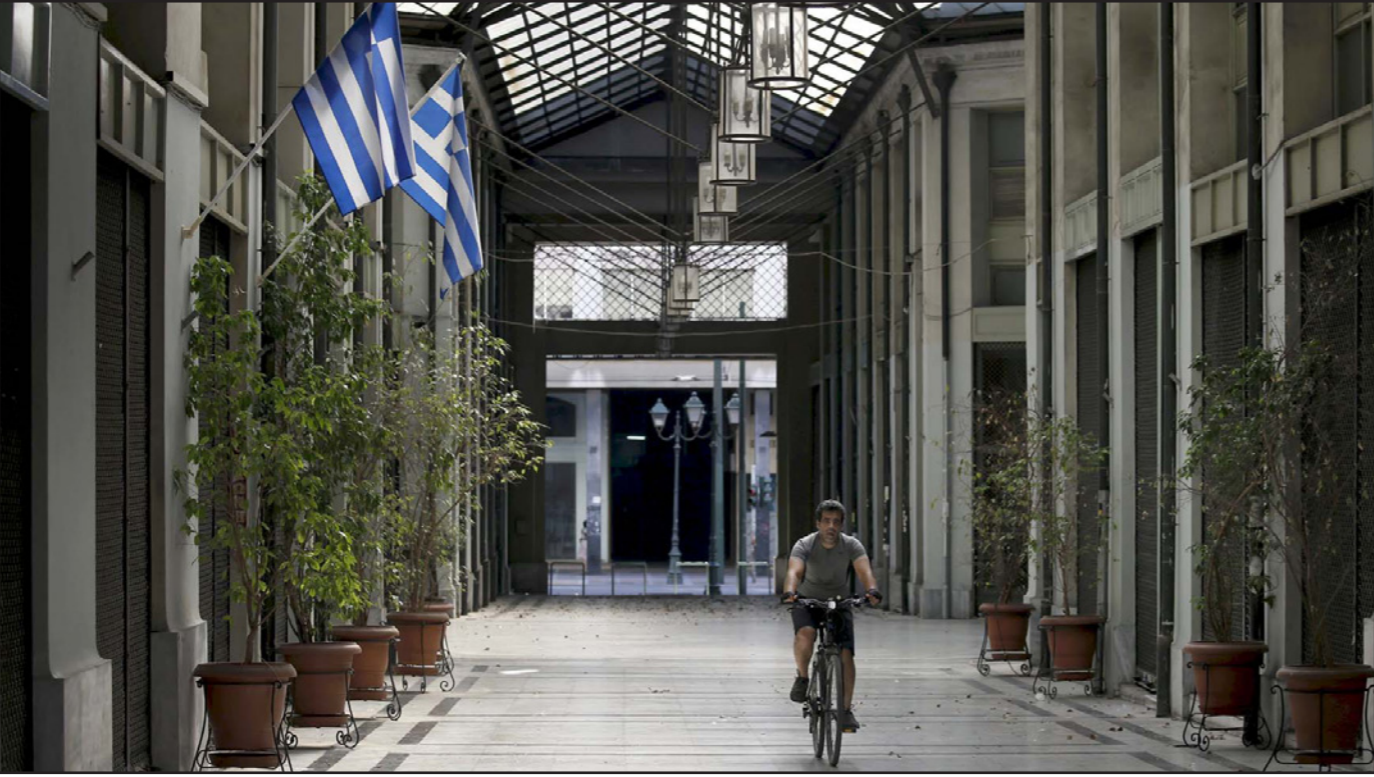
متاجر في الحي القديم في أثينا أضرب مالكوها إلى إغلاقها بسبب الضائقة الاقتصادية التي تعيشها بلادهم

من قامة الوضع، أمثال الليتواني ريمنتاس ساداشيوس الذي عبر أمس عن اعتقاده بالهزيمة ساحقة.