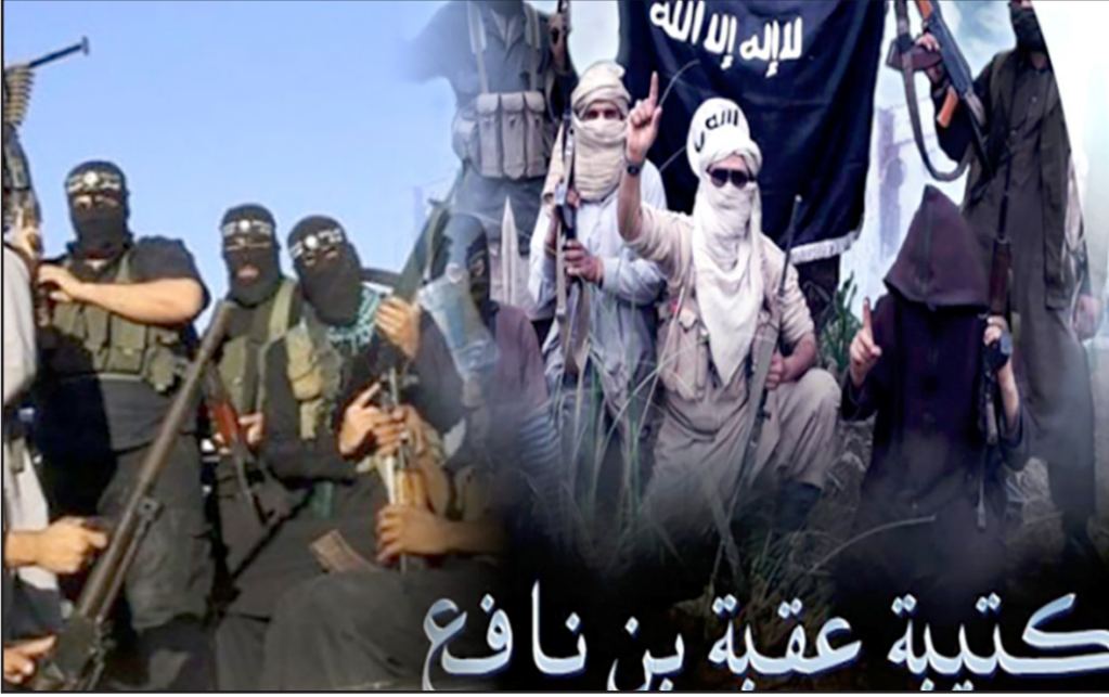
كتيبة عقبة بن نافع

الحكومة تعلن الحرب على المساجد حتى المعتدلة منها فتخلق التطرف وليس العكس