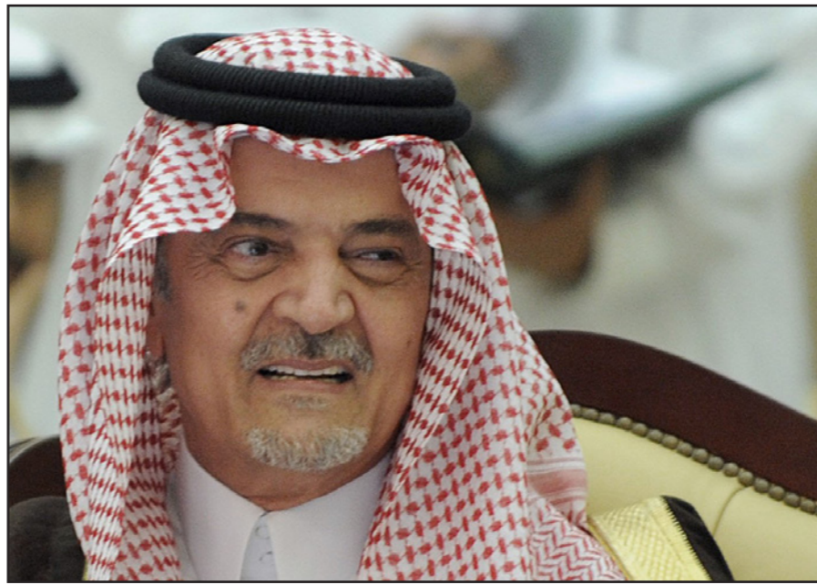
وزير خارجية المملكة العربية السعودية الراحل الأمير سعود الفيصل

من ناحية أخرى نشرت صحيفة «الراس» تصريحا لوزير الدفاع الأمريكي أشتون كارتر بيدي تشاركاً من برحيل