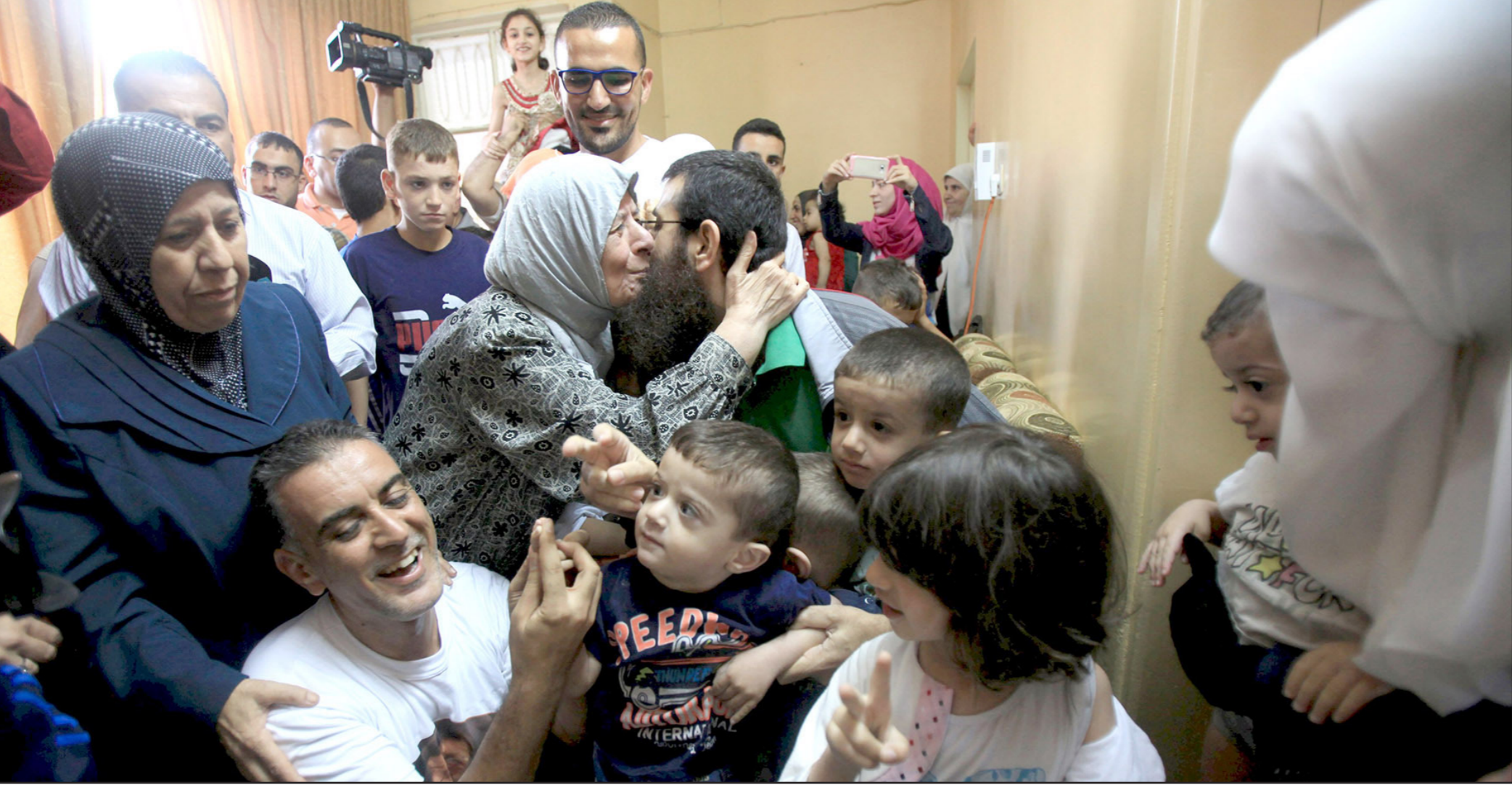
رام الله - «القدس العربي»