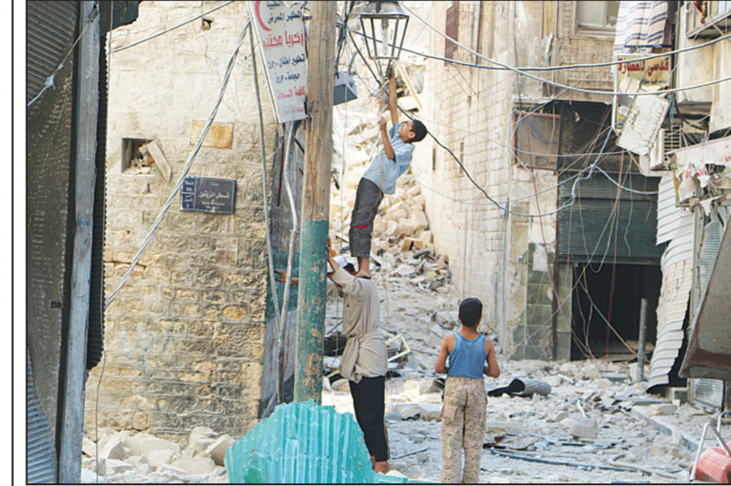
مطل سوري يقف على كتفي والده لإصلاح عطل في الشبكة الكهربائية بعد تصفب البراميل المتفجرة قام بتعطيلها في مدينة حلب أمس

عواصم - وكالات: أعلنت وكالة دوغان التركية للأخبار الاحد ان قوات الأمن التركية اعتقلت خلال ثلاثة ايام في مدينة غازي عنتاب جنوب شرق البلاد 45 أجنبيا كانوا يبنون الانتقال إلى سوريا للقتال الى جانب تنظيم الدولة الاسلامية. وعني تكثيف الإجراءات التي تتخذها السلطات التركية ضد تنظيم الدولة الاسلامية، بعد اعلان اعتقال 21 شخصا الجمعة في اربع مدن تركية بينها اسطنبول يشبهه باتمامهم إلى هذا التنظيم المتطرف، وتعتبر مدينة غازي عنتاب نقطة عبور للمجندين الراغبين بالانتقال سوريا للقتال إلى جانب تنظيم الدولة الاسلامية، وهم يصلون بالافلات الى هذه المدينة قبل ان ينتقلوا عبر معابر غير شرعية إلى سوريا. وأوضحت وكالة دوغان أن 25 شخصا اعتقلوا الأحد وحده في محطة حافلات غازي عنتاب غالبيتهم من طاجيكستان وهي جمهورية سوفياتية سابقة، وتعتبر تركيا نقطة العبور الأساسية للمجندين الاوروبين ولاسيما الراغبين بالانتقال إلى سوريا. وفجرت القوات النظامية السورية، أمس الأحد، نفقا حفرت قوات المعارضة تحت سور قلعة حلب الأثرية شمالي البلاد، ما أدى لانهايار جزء من سور القلعة الشهيرة، وقال المرصد السوري لحقوق الإنسان، في بيان أمس، «بتين أن دوي الانفجار الذي سمع في حلب القديمة ناجم عن تفجير قوات النظام لنفق كانت قد حفرتها الفصائل المقاتلة والاسلامية أسفل قلعة حلب»، وأضاف البيان أن التفجير أسفر عن انهيار جزء من سور القلعة، دون معلومات عن خسائر بشرية»، وتعتبر قلعة حلب أحد معالم الحضارة التراثية الإنسانية المسجلة لدى «اليونيسكو».