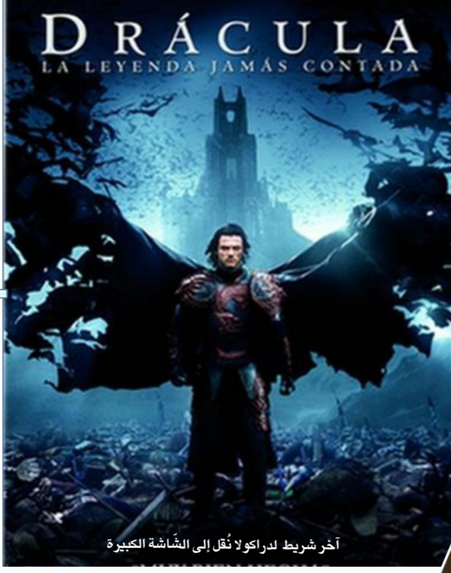
آخر شريط دراكولا نُقل إلى الشاشة الكبيرة

كانت تتواءم مع مزاجه السوداوي وطبعه الغرائبي . قال الكاتب والشاعر الإيرلندي أوسكار وايلد: «إن رواية دراكولا تعتبر أحسن عمل أدبي كتبت حول الرعب والإثارة في جميع الأزمان»، ويرى «رودريغو فريسان» أنّ أعمالاً من هذا القبيل تقضي إلى خلق شخصيات مثل التي رأيناها في «فرانكشتاين» والدكتور جاينكل وميستر هايد «الخ. إن «دراكولا» كتاب يتميّز بالشفافية لأنه كان إرهاصاً وإعلاناً بمجيء التحليل النفسي، ذلك أنّ لاوعي الكاتب والمبدعين آنذاك كان يظفوا مُحتدماً ما هي سطح أعمالهم، وانتاجتهم الإبداعية، والأمثلة كثيرة ووفرة على ذلك، فلتنال هذه الرواية بالذات أثره لا كخبر نموذج لهذه الموجة، وبعدها «بيتر بان» و«شارلوك هولمز» وسواها.