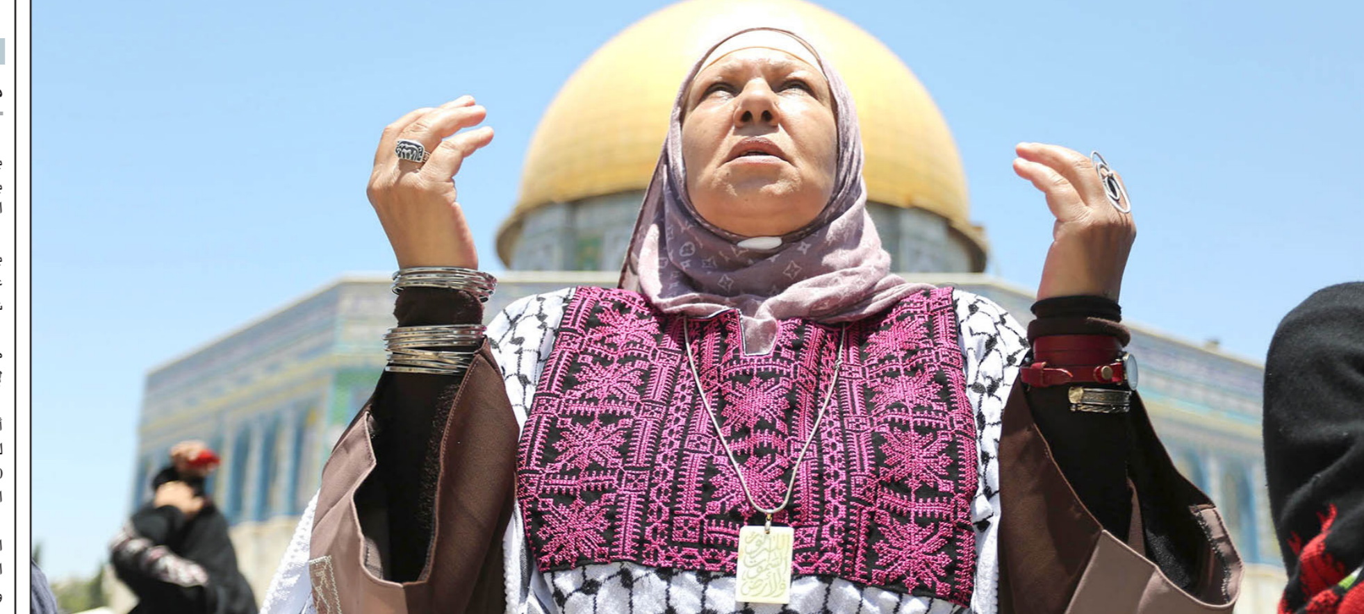
سيدة تتوجه بدعاء أمام قبة الصخرة المشرفة في القدس يوم الجمعة الماضي

اللائحة لـ 800 مواطن من قطاع غزة. ولم تكن إسرائيل التي تفرض منذ ثمانين سنوات حصارا مشددا على قطاع غزة تسمح لخروج الفلسطينيين من غزة إلى القدس لل صلاة الأعياد الماضية، ولم تكن تسمح لهم بالوصول للقدس للإقامة ليلة القدر. لكنها أدخلت تسهيلات على الحصار بعد الحرب، تمثلت بالسماح لـ 200 مواطن من قطاع غزة بالسفر أسبوعيا من عبر بيت حانون «إيرز» لأداء صلاة الجمعة في المسجد الأقصى.