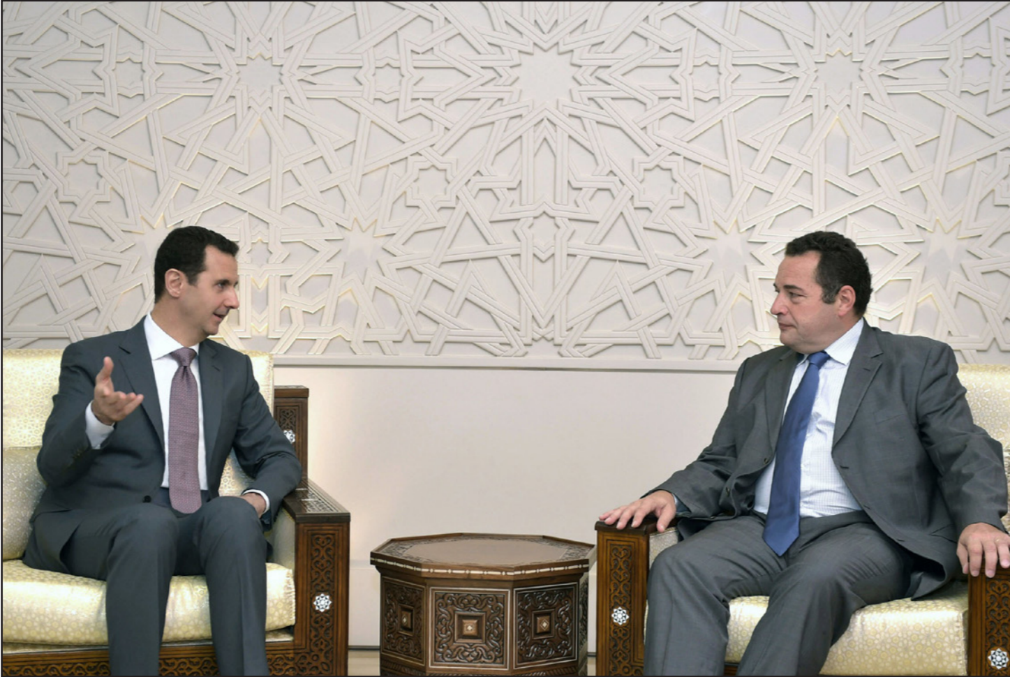
الرئيس السوري بشار الأسد خلال لقائه النائب الفرنسي اليميني جان فريدريك في دمشق أمس

■ عواصم-وكالات: دعا النائب الفرنسي اليميني جان فريدريك بواسون الأحد خلال لقائه الرئيس بشار الأسد إلى ضرورة «الحوار» مع دمشق لحل النزاع الذي تشهده سوريا منذ أكثر من أربعة أعوام، وفق ما أوردت وكالة الأنباء السورية الرسمية «سانا».