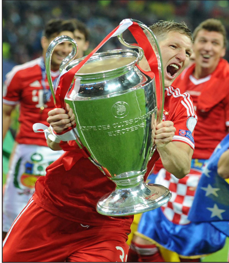
شفاينشتايفر يحمل كأس دوري أبطال أوروبا مع البايرون

لا يوجد من هو أفضل في تحقيق الانتصارات أكثر من شفاينشتايفر، وفي الوقت الذي أثار فيه البعض الشكوك حول جدوى الصفقة بسبب عمره، فإن صحيفة «دي دابلي تلغراف» وصفته بأنه «تعريف التميز الوظيفي». وقالت: «إنه ليس لاعبا واعدًا، أو مستثمرا للمستقبل، إنه لاعب عمل على جمع الميداليات على مدار 13 عاما، إنه لاعب تعقيد مانشستر يونايتد، بسبب الوعود التي قطعها الفريق على نفسه بتعزيز صفوف لويس فان خال بشكل كبير». وأضافت: «مانشستر يونايتد تعاقد مع لاعب، يشعر بقدرته على مساعدة الفريق على الفوز بالألقاب وليس الاكتفاء بالتأهل إلى دوري الأبطال».