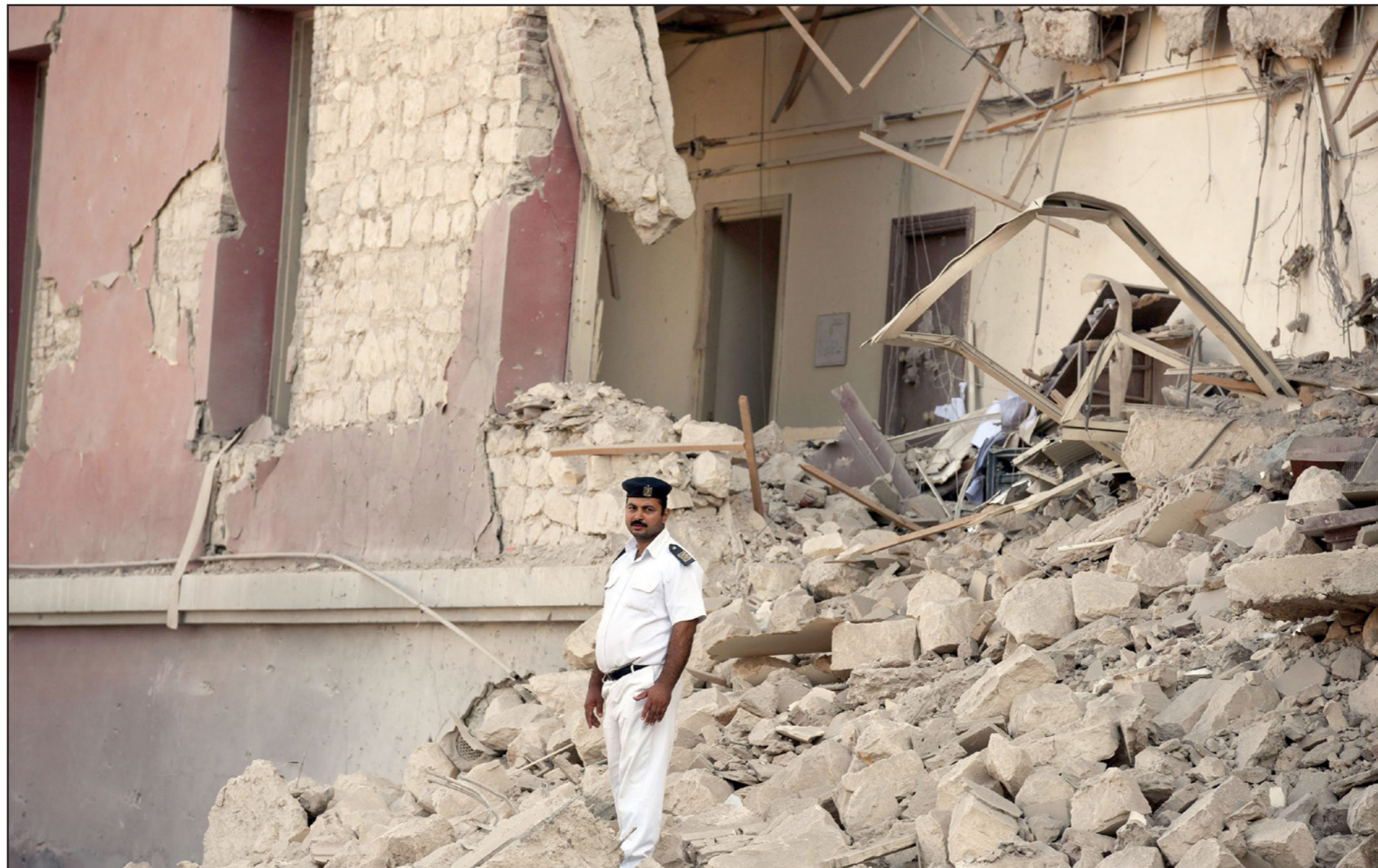
رجل أمن مصري أمام انقاض القنصلية الإيطالية إثر الانفجار الذي وقع السبت الماضي