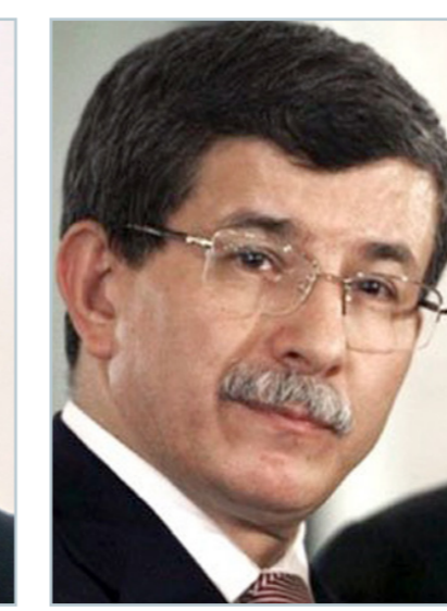
رئيس الوزراء التركي داود أوغلو

الجيمهورية التركية بقاء جمعهم بالقصر الرئاسي بالعاصمة أنقرة، لتبدأ فعلياً المهلة القانونية للموحد لرئيس الحزب الحاصل على أعلى نسبة من الأصوات في الانتخابات البرلمانية التي جرت في السابع من يونيو/حزيران الماضي، والتي تستمر لكه يوماً. وبحسب النتائج الرسمية للانتخابات العامة التي شهدتها البلاد، في 7 حزيران/ يونيو الماضي، فإن حزب العدالة والتنمية بـ258 مقعداً، من أصل 550 المقعد في البرلمان، فيما حصل حزب الشعب الجمهوري 132 مقعداً، وحزب الحركة القومية 80 مقعداً، وحزب الشعوب الديمقراطي 80 مقعداً، وهي النتائج التي فرضت على «العدالة والتنمية» تشكيل حكومة ائتلافية لعدم حصوله على عدد المقاعد الذي يمكنه من تشكيل حكومة بمفرده كما فعل طوال السنوات الماضية. حكومة ائتلافية أو انتخابات مبكرة داود أوغلو أوضح ان المشاورات في أوساط حزب العدالة والتنمية الذي يترأسه، أظهرت إمكانية تشكيل حكومة ائتلافية مع حزب «الشعب الجمهوري» أو «الحركة القومية»، معياراً أن ما زال يحافظ على إيمانه بإمكانية تشكيل حكومة ائتلافية مبنية جيداً، «في حال الابتعاد عن ردود الفعل العاطفية، والموافق الانتقالية». وقال في مؤتمر صحافي: «أجريت مشاورتنا في حيات الحزب ومؤسستنا، والقاعدة الشعبية، وبرزت فتاعة حول إمكانية تشكيل حكومة ائتلافية مع حزب الشعب الجمهوري أو حزب الحركة القومية، وسنلتقي الأحزاب الثلاثة -الجزبان المذكوران