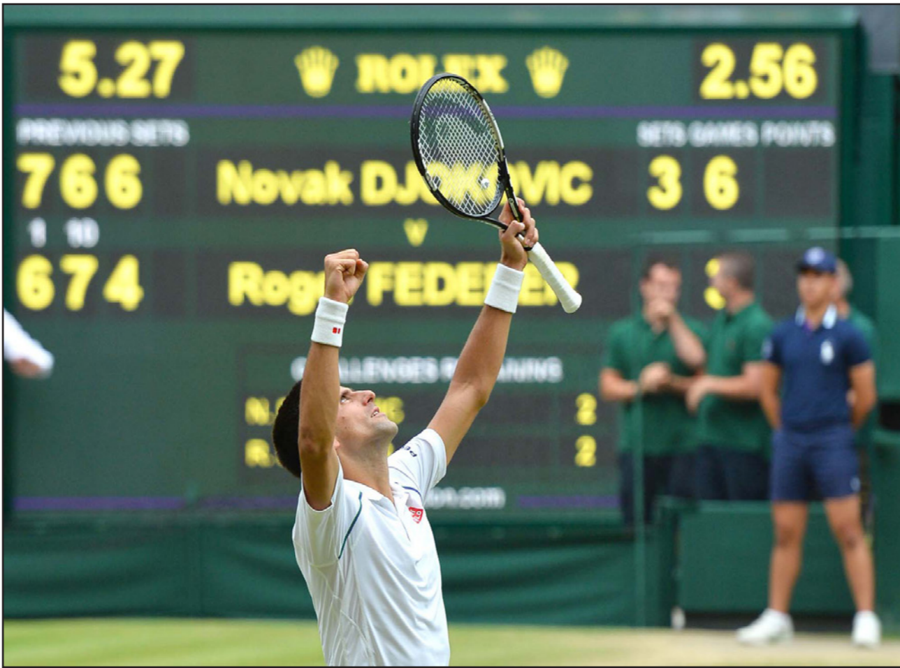
ديوكوفيتش يحتفل بانجازه عقب انتصاره على فيدرر في المباراة النهائية