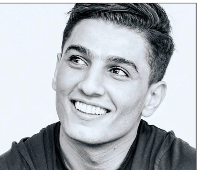
بيروت - «القدس العربي»:

لأن النجاح حليفه الدائم منذ انطلاقته مسيرته الفنية وحتى اليوم حصد الفنان الفلسطيني محبوب العرب ونجم «أ راب آيدول» محمد عساف جائزة «أفضل فنان جديد في الشرق الأوسط» ضمن المسابقة العالمية BAMA 2015 Golden Edition. وحصد اليوم الثاني من شهر أيلول/سبتمبر المفضل موعدا لاستلام عساف جائزته من ألمانيا التي من المقرر أن يتوجه إليها لاستلام هذه الجائزة التي ستضاف إلى جوائز أخرى حصل عليها منذ لعم نعمة في الوسط الفني العربي والعالمي. وأرفق على صفحته الخاصة على موقع «فايسبوك» عن إمكانية التصويت الذي لا يزال مفتوحا في المسابقة عن فئة أخرى ألا وهي : Most Popular Male Artist عبر الرابط: www.bigapplemusicawards.org/#/vote/cio الى ذلك، قدّم متتبعو النجم التهنئة له وعبروا عن فرحتهم بنيله الجائزة تلو الاخرى ومما جاء في بعض التعليقات التي صدتها «القدس العربي»: