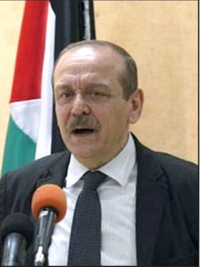
ياسر عبد ربه

المشروع الوطني بما يقرب يوم زوال الاحتلال عن أرضنا وعودة لأجئنا، ومشاركة كل مكونات الحركة الوطنية في برنامج الصمود والمقاومة وعدم الفرار كل منها في خطته الخاصة في التعامل مع إسرائيل خاصة وأن المشروع الإسرائيلي للفصل بين غزة والضفة والتعامل معهما ككيانين منفصلين أصبح خطراً داهماً. وغازل عبد ربه حركتي حماس والجهاد الإسلامي عندما قال إنه لا يمكن لخطوة التحرير الفلسطينية أن تستعيد مكانتها دون مشاركة واسعة تشمل الجميع بمن فيهم حركة حماس والجهاد وتأسيس مركز قيادي موحد لعموم الشعب يحظى بتأييده والثقة ويستجيب لتطلعاته الوطنية.