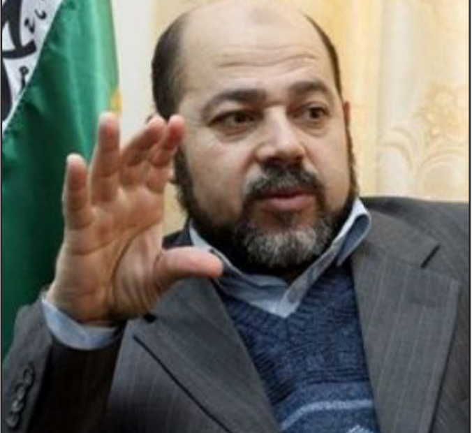
موسى أبو مرزوق

هناك مشكلة حول هذا الموضوع. وخلال تصريحاته قال أبو مرزوق إن الكثير من مسؤولي السلطة والحكومة يرجعون سبب عدم دمج موظفي غزة للرئيس محمود عباس، واستنجدوا أن حماس كلما تحدثت مع بعض أعضاء الحكومة ورئيسها كان الجواب في معظم الأحيان، «كلموا الرئيس فهذا قرار سياسي».. وأعاد التذكير بأن الرئيس عباس كان منذ اليوم الأول لتشكيل الحكومة قد قال أنه على حماس أن تدفع رواتب الموظفين، وأن موقفه هذا لم يتغير.