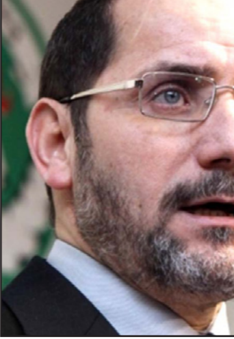
عبد الرزاق مقري

خلال سنة من الولاية الرابعة، على اعتبار أنها شرعت مباشرة بعد اسدال الستار عنها في مشاورات مع الأحزاب السياسية والجمعيات والمنظمات والشخصيات بخصوص تعديل الدستور، ولكن أحزاب المعارضة، وفي مقدمتها حركة مجتمع السلم رفضت المشاركة في هذه المشاورات، وقاطعتها بدعوى أن السلطة الحالية غير شرعية، وأن تعديل الدستور هو مناورة لربح الوقت، رغم أن الرئيس بوتفليقة كان يدعو في كل مرة هذه المعارضة للمساهمة في مشروع تعديل الدستور. هذه اللقاءات بين السلطة والمعارضة تأتي غداة الرسالة التي بعث بها الرئيس بوتفليقة بمناسبة ذكرى الاستقلال في الخامس من يوليو/تموز، والتي أثنى فيها على الدور الذي تلعبه المعارضة، خلافا لما جاء في رسالته بمناسبة عيد النصر في مارس/آذار الماضي، والتي أتهم فيها المعارضة بالعمل على ضرب الاستقرار، وتوعدا فيها أيضا. التساؤلات تلف موقف الطرفين، من