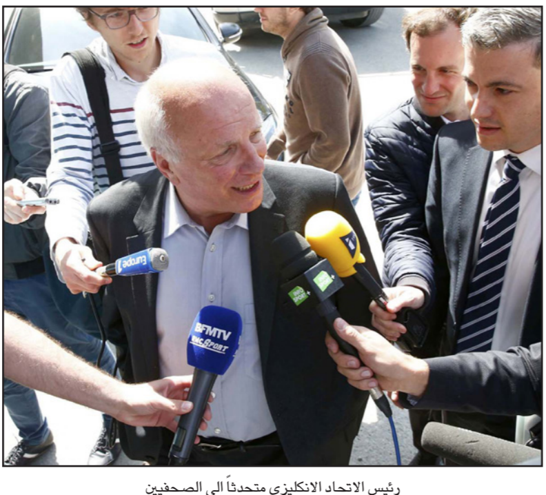
رئيس الاتحاد الإنكليزي متحدثا إلى الصحفيين