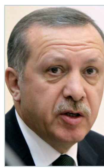
الرئيس التركي رجب طيب اردوغان

رئيس حزب الشعب الجمهوري «كمال كليتشدار أوغلو»، أعلن في وقت سابق من حزمة شروط موعدة لمدة 14 عاماً، سماها المبادئ التي لا يمكن التفاوض عليها أثناء المفاوضات التي ستعقد من أجل تشكيل الحكومة الجديدة. وأبرزها التخلص من القوانين والتنظيم الحقوقية الناجمة عن دستور عام 1982، وإصدار قوانين ضابطة للأخلاق السياسية، ومنع تكافؤ للعاملين في الدولة بقيمة راتين خلال الأعياد الماضية كل عام، ورفع الحد الأدنى لأجور العمال إلى 1500 ليرة تركية، مشدداً على أنه «نن يساهم في هذه المبادئ ولن يتخلى عنها مهما كانت الاسباب». ومن المتوقع أن يطالب كليتشدار أوغلو أثناء لقائه بـداود أوغلو، بالتحزام رئيس الجمهورية بحدوده الدستورية وإعادة فتح ملف الوزراء الأربعة السابقين في حكومة حزب العدالة والتنمية والذين تم اتهامهم حيث تمت تبرئتهم من قبل البرلمان التركي خلال الدورة الماضية، كما يرغب الحزب في توصلي عدد من الحقايب الوزارية السياسية ومنها الداخلية والخارجية وهو الامر الذي لن يقل به «العدالة والتنمية». وفي الوقت الذي تبدو فيه الشروط الاولى قابلة للتفاوض والدراسة، تبدو الشروط المتعلقة بمحاكمة الوزراء السابقين وتحديد صلاحيات الرئيس أردوغان مرفوضة تماما من قِبل «العدالة والتنمية» الذي ما زال أردوغان يعتبر بمثابة زعيمه الروحي على الرغم من استقالته منه عقب توليه منصب الرئاسة في آب/أغسطس الماضي. في المقابل، من المتوقع أن يشترط «دولت بهتليشلي» زعيم حزب الحركة القومية إنهاء عملية المصالحة الوطنية الجارية بين الأتراك والأكراد من أجل البدء بالمحادثات لعقد تحالف مع حزب العدالة والتنمية