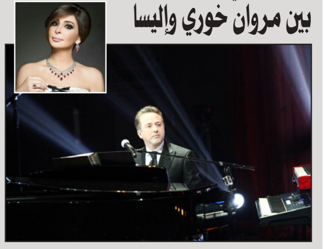
بيروت - «القدس العربي»