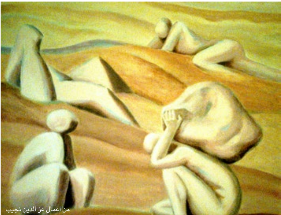
من أعمال عز الدين نجيب