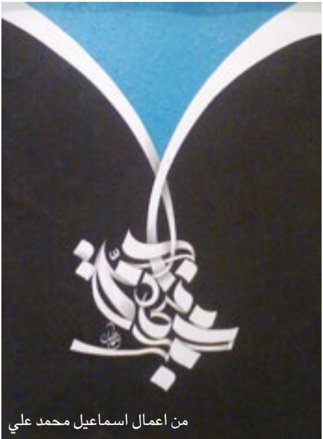
من أعمال اسماعيل محمد علي

كانت كالنغمة التشان، كلوحات كبيرة الحجم فيها العديد من الأعلام المصرية، لتمجيد حدث سياسي أو اجتماعي ما، والأمر في النهاية يدعو للثناء أكثر من السخرية.