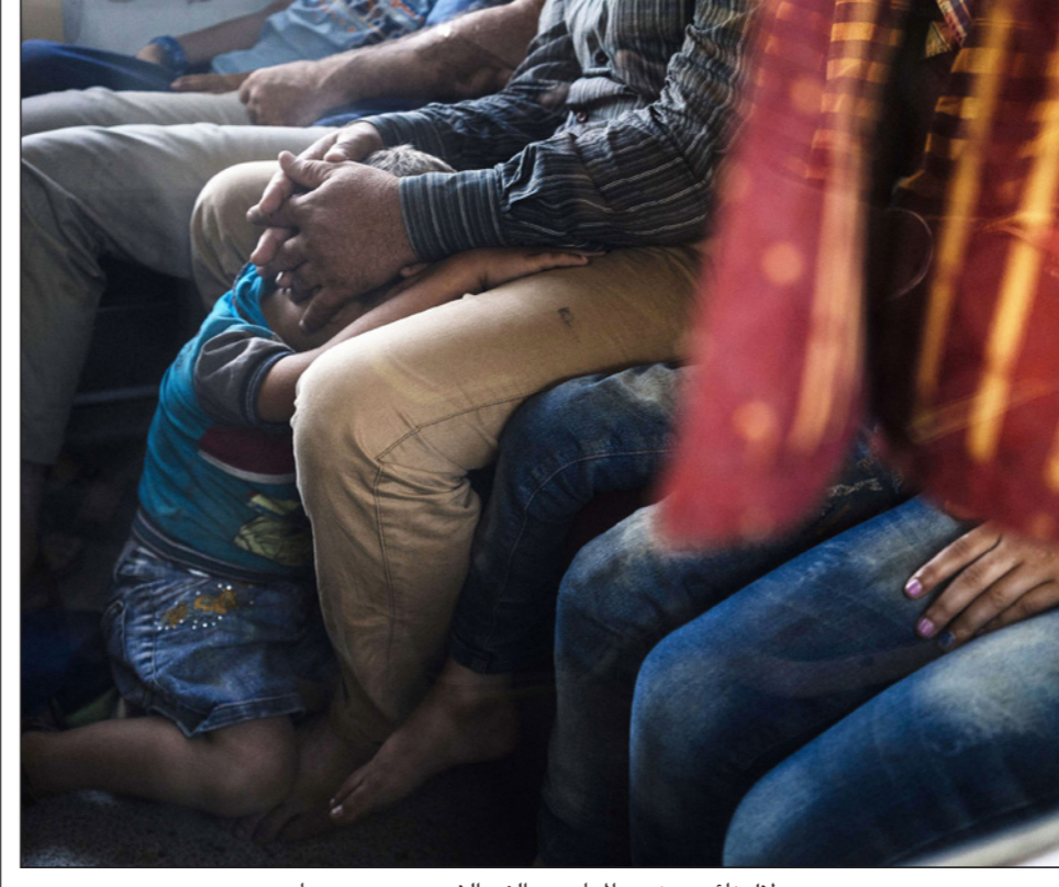
طفل نائم من ضمن المهاجرين الغير الشرعيين عبر صربيا

ولطلب أكثر من 37 ألف شخص اللجوء في صربيا منذ بداية السنة، كما أكدت وزارة الداخلية. وبحسب أرقام الأمم المتحدة فإن أربعة ملايين شخص هربوا من سوريا منذ بدء النزاع. وقد توجه رئيس الوزراء الكسندر فوسيتش إلى بريسيغو حيث عبر عن قلقه من العاملة التي يتلقاها المهاجرون إثر تقرير أخير لمنظمة العفو الذي يتهم بلغراد بسوء التصرف حيالهم. وسألهم «هل الناس لطفاً معكم؟ هل لديكم طعام؟» وعلق عامل إنساني يعمل في منظمة دولية طلباً عدم كشف هويته «إنها ليست بداية الأزمة. انظروا الخريف، ان انطباعي هو أن بلدانا لن نستطيع مواجهة هذا الوضع لوحدها وبدون مساعدة دولية أساسية». وقد وعدت المستشارة الألمانية انغيلا ميركل بمساعدة