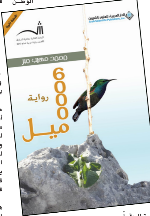
مطابقاً تماماً من حيث الإطار النقائلي، فحين تبدو المعرفة حاجة ملحة لإدراك الأنا، فالوطن الذي يبعد «6000 ميل»، وفي الجانب الآخر من الكرة الأرضية، مارتينيك إن يقرباً تحولات المكان، لا كما شاهد، كونه لم يكن هنا، وإنما كما شُيِّد ذهنياً عبر تصورات، ومعلومات استجلبت من هنا، وهناك. وفي مدينة تل أبيب تظهر ملامح لا تنسج على خياله، ويحمل اسماً غير الاسم الذي يجرد أوري، فخرية تبعاً لمن تشوه من وهم الطابع والكتب. تبدأ رحلة مارتينيك للبحث عن ذاته، وفي مساعده، هذا يمارس فعل المشاهدة، وهذا يتضح عبر ذلك التركز السردي، ووجهة النظر التي يعاين القارئ من خلالها السكان، وانطباعات القاطن حين يمتلك قضاء المسروق، ولكنه يزاوية المحاييد غير القادر على التداخل والتفاعل، ويختلف المكان والخفايا التي أحاطت بهذا الكاتب والغريب وزوجته حين أنه كتاب ينبض بالعواطف ويحفل بالحنين، والحنان الكثير حول باولز وكل هؤلاء المحيطين به الذين جلبوا كثيراً من المتابع الخاطرة، ووجع الدماغ لشكري، ولقد بلغ الأمر بوضع هذا الكتاب في الإصحاح عن شعوره بنوع من المرارة والمضض من نشر هذا المؤلف، حيث قال عنه: بكتابي هذا حول بول باولز قتلّت والدي الثاني».

مارتينيك من مشاعر الحنين، والذكرى في بداية ارتحاله إلى أو طان المهجر. بيت مارتينيك التي توفي والده ميكراً. أترك هنا ذلك فلسطين بفعل عملية الأبخار الذي اضطلعت به والدته، وهذا يذهب إلى أن إدراك الوطن للفلسطيني الذي ولد في المنفى، يبدأ من رحم هذه العملية، ومن هذه النقطة بالتحديد، تبدأ كرامة الشَّج حين يواجه الإنسان ذاته، يذكر حنونه، وحننهما، وهو في هذا يشابه الإنسان الذي يسرد آناه الفردية، أو ما يسمى الحالة المراهية، ولكنها هنا تنسحب على السذات الجمعية، وإن كانت الممارسة على السذات الفردية، فيعيد رحيل والد بيت مارتينيك تمارس الأم دور الذاكرة، ولكنها ذاكرة مشهتة، غير مكتملة، فكل ما تدركه بعض الحكايات والذكريات التي تحدث بها زوجها عن شاطئ يافا (13ص)، ويرحيل الأم يفقد مارتينيك هذه العلاقة مع المكان الغائب لتتعالى إشكالية الأنا التي تستشعر بعدم الانتماء... أو بالقلق تبعاً لغياب مرجعية ما، وفي محاولة منه لإيجاد وطنه على الخريطة يوجه ذلك الإحلال العلاماتي، والنقائي للفلسطين، حيث يصطبغ بكلمة إسرائيل، وهو يعود إلى فلسطين على الخريطة (ص13)، وبذلك تتحول فلسطين إلى مكان عجيب غرابي، وغامض، ومن هذا المنطلق بالتحديد، يبدأ فعل التشييد لمفهوم الوطن، ومحاولة جمع شتاته عبر ما يتغير منه في الذاكرة أو على الخريطة، أو في الحكايات، ويهدف التخلص من هذا الإحساس، وبالتضارف مع وعي جمعي قوامه العائلة، فيقر مارتينيك الارتحال إلى وطنه، وجذوره للبحث عن شيء ما يفوقه إلى عقلته، ولكنه لا يملك أدوات تمكنه من تحقيق هذا الهدف، ومع ذلك يقرر أن يذهب لفلسطين وتعدداً على طريقة للحظوظ الفرنسية تحط في مطار يحمل اسم بن هوريون سنة 2008.