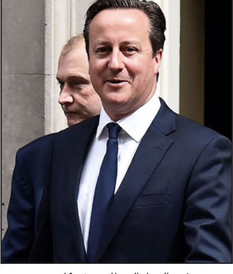
رئيس الوزراء البريطاني ديفيد كاميرون

ديفيد كاميرون: على بريطانيا بذل المزيد في قتال الدولة الإسلامية في سوريا ■ لندن - رويترز: قال رئيس الوزراء البريطاني ديفيد كاميرون في مقابلة أذيعت أمس الأحد إنه يريد أن تبذل بريطانيا المزيد لمساعدة الولايات المتحدة في القضاء على تنظيم الدولة الإسلامية في سوريا. وشن بريطانيا ضربات ضد متشدد تنظيم الدولة الإسلامية في العراق، ولكن حتى الآن اقتصرت مشاركتها في سوريا على تنظيم رحلات استطلاع جوية لجمع معلومات. وشغل كاميرون في الحصول على موافقة البرلمان للقيام بإجراء عسكري ضد قوات الرئيس السوري بشار الأسد في عام 2013 لكنه طلب من أعضاء البرلمان دراسة ما إذا كان يجب أن تضم بريطانيا الآن للضربات التي تقودها الولايات المتحدة ضد الدولة الإسلامية في سوريا. وقال كاميرون لشبكة (إن.بي.سي) الأمريكية «أود أن تبذل بريطانيا المزيد. علي دائماً أن أجعل البرلمان في صفي. نبحث ونناقش في الوقت الحالي بما في ذلك أحزاب المعارضة في بريطانيا ما يجب أن نقدمه. ولكن دون شك نحن ملتزمون بالعمل معكم من أجل تدمير الخلافة في البلدين» في إشارة إلى سوريا والعراق. وتقول مصادر حكومية إنه من المتوقع أن ينتظر كاميرون حتى بعد انتخاب حزب العمال المعارض رئيساً جديداً في سبتمبر/أيلول قبل أن يسعى لإجراء تصويت جديد في البرلمان بشأن قصف سوريا. وقالت وزارة الدفاع يوم الجمعة إن طيارين بريطانيين ملحقين بقوات أمريكية وكندية شاركوا في ضربات جوية في سوريا مما أفضى بعض النواب الذين يقولون إن الحكومة ضللت البرلمان. وفي كلمة اليوم الاثنين سيقول كاميرون إن بريطانيا بحاجة أيضاً إلى بذل المزيد لمواجهة فكر التطرف بالترويج للمعايير البريطانية مثل الديمقراطية والحرية وحكم القانون وتحدي نظريات التآمّر،