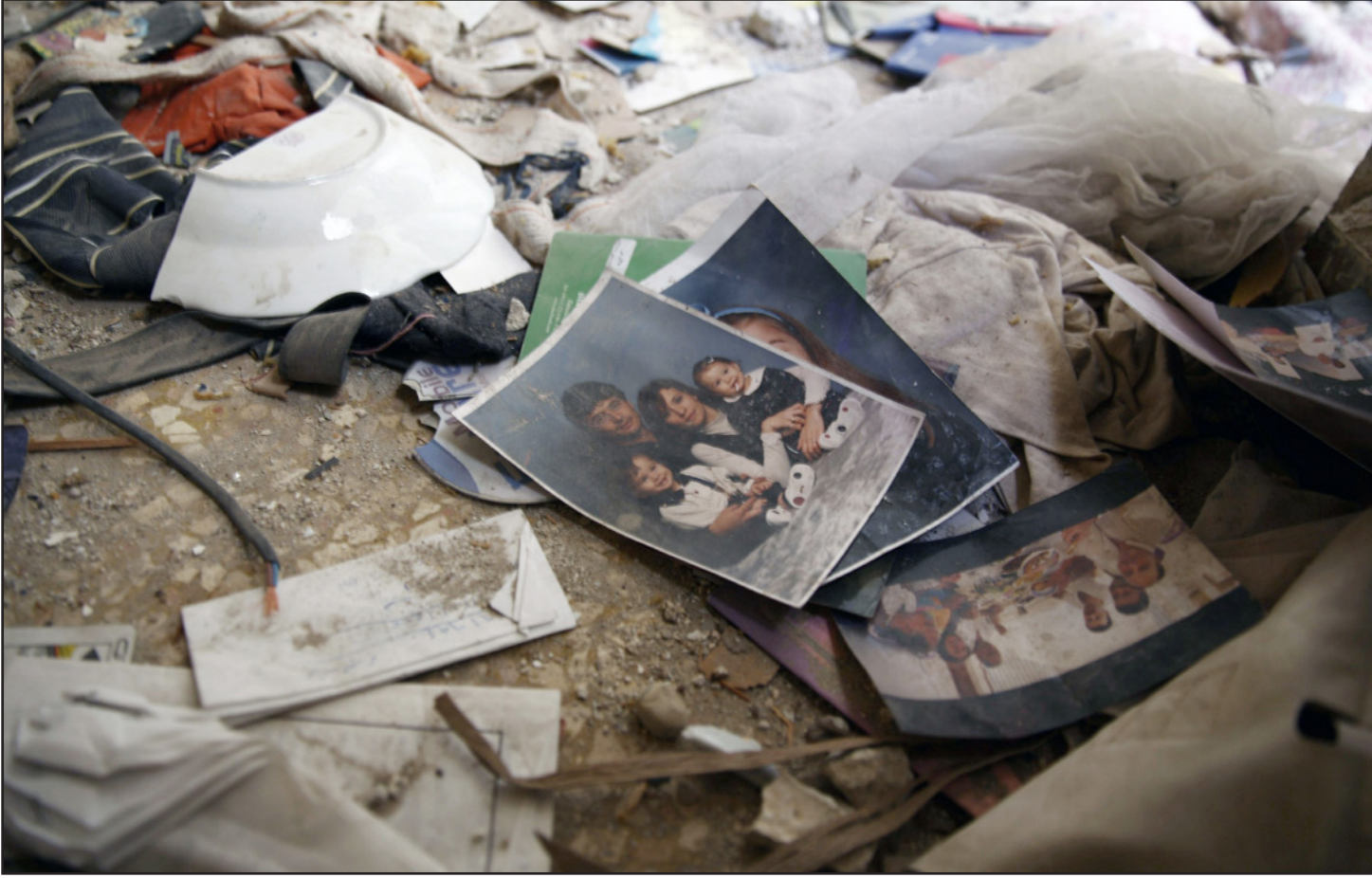
صور عائلية وبسط الأثاث على الأرض في أحد المنازل التي تم تدميرها خلال غارات النظام السوري على أحد أحياء منطقة جوبر في شرق دمشق

■ عواصم وكالات: على الجبهة الجنوبية لدمشق الحسكة السورية، يستريح جنود وسقط طقس حار قبل استئناف القتال ضد تنظيم الدولة الإسلامية، فيما يتخذ مقاتلون أكراد في حي قريب من مدرسة انطلاقاً لعملياتهم ضد العدو نفسه: التنسيق بين الطرفين واضح، ولو غير ملغى. وشن تنظيم الدولة الإسلامية هجوماً في 25 حزيران/يونيو على جنوب المدينة، وتمكن من السيطرة على بضعة أحياء، ومنذ ذلك الوقت تدور معارك ضارية بينه وبين القوات النظامية على جبهة، بينما تتصدى له وحدات حماية الشعب الكردية على جبهة أخرى منفصلة، وتمكن الأكراد خلال الأيام الماضية من تضيق الطوق على الجهاديين، بدعم من الغارات الجوية التي ينفذها الائتلاف الدولي بقيادة أمريكية.