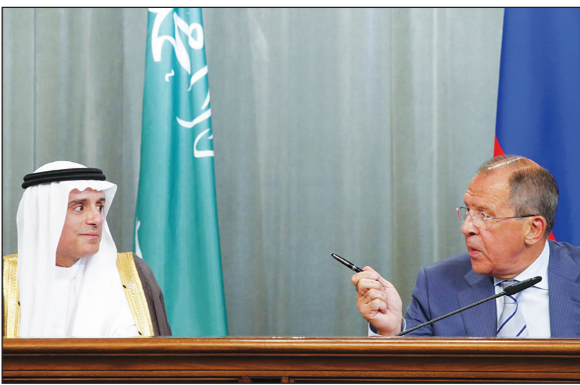
وزير الخارجية الروسي سيرغي لافروف والسعودي طارق الجبير خلال مؤتمرها الصحافي أمس

طبعه، بل «بتنسيق تحركات الذين يحاربون الإرهابيين اصلا»، أي الجيشين السوري والعراقي والأكرد «ليدرخوا مهمتهم الأولى وهي مكافحة التهديد الإرهابي (...) ووضعا جانبا تصفية حساباتهم». لكن الجبير عاد وأكد رفض التعاون مع الرئيس السوري، وقال «نحن نعتقد أن بشار الأسد جزء من المشكلة وليس جزء من الحل، ونعتقد أن أحد الأسباب الرئيسية في نمو داعش في سوريا هو بشار الأسد لأنه في السنوات الأولى لم يوجه سلاحه ضد داعش بل ضد شعبه والمعارضة السورية المعتدلة ما جعل داعش تسيطر على أجزاء كبيرة من سوريا». واعتبر مراقبون أن زيارة الجبير جاءت لحسم الموقف السعودي من قضية مصير الأسد، بعد الغفوض الذي خلقته زيارة رئيس مكتب الأمن الوطني اللواء علي ملوك لجدّة في السابع من شهر تموز/يوليو الماضي، وما أضح بعدها عن موافقة سعودية على ربط بقاء الأسد بالدولة التي يضرِب في السعودية والكويت إلى جانب العراق وسوريا «لا يهدد بشار الأسد أي بلد مجاور»، داعيا «الجميع إلى المقارنة بين حجم هذه التهديدات». كما شهد المؤتمر خلافا علنيا بشأن مبادرة الرئيس الروسي فلاديمير بوتين بإنشاء تحالف رياضي يضم السعودية وتركيا والأردن والنظام السوري لمكافحة الإرهاب، إذ أعلن الجبير أنها «لحم تبحث»، مشددا على رفض الرياض أي تعاون مع دمشق، وشدد على أن أي توقعات أو تصريحات أو تعليقات في وسائل الإعلام أو من قبل مصادر مجهولة عن تغير في موقف الملكة تجاه سوريا لا أساس لها وغير صحيحة». وأصر لافروف على أن التحالف الذي تقيده الولايات المتحدة قد فشل في تحقيق أي نجاح ضد تنظيم «الدولة»، بسبب اعتماده على القصف الجوي فقط، مؤكداً تمسك روسيا باقتراحها، وقال «الأمر لا يتعلق بتشكيل تحالف تقليدي يقاود أعلى وقاتل مسلحة