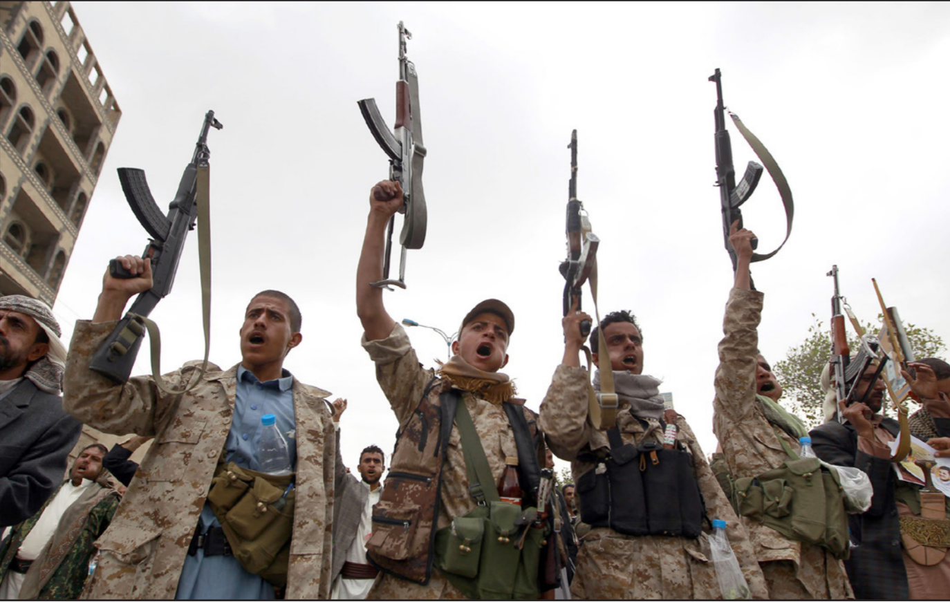
مقاتلون مؤيدون للحوثيين في زي عسكري في صنعاء أمس

ممسك الأمن العام في المحافظة، مشيرة إلى «عمليات تسلل واسعة تجري لوالين لجماعة الحوثي داخل المدينة».