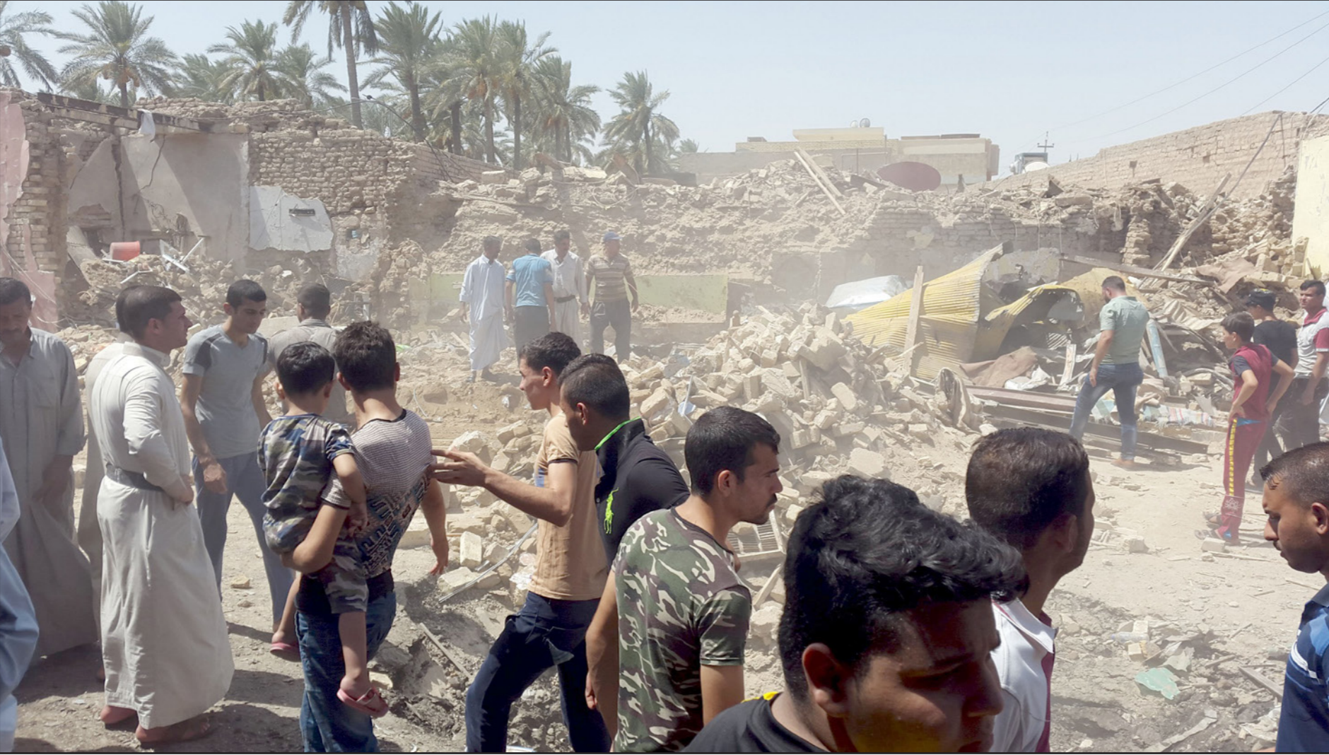
أثار التفجير الذي وقع في محافظة ديالى شرقي العراق

ورغم إعلان القوات العراقية استعادتها السيطرة على محافظة ديالى بالكامل، من تنظيم «الدولة» أو آخر يناير/كانون الثاني الماضي، إلا أن التنظيم لا يزال يشن هجمات في المحافظة.