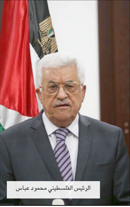
الرئيس الفلسطيني محمود عباس

وحمل الوفد الذي يرأسه أحمد مجدلاي رسالة من الرئيس عباس إلى نظيره الإيراني حول الأوضاع في الأراضي الفلسطينية في ظل الانتهاكات الإسرائيلية المتواصلة خصوصا الاقتحامات المتواصلة للمسجد الأقصى، وشرحا عن جهود لتحقيق المصالحة الفلسطينية وإجراء انتخابات تشريعية ورئاسية وعرقلة حماس لهذه الجهود. وقالت مصادر لبنانية مقربة من حزب الله إن زيارة الوفد الفلسطيني تأتي ردا على تدهور العلاقات الإيرانية مع حماس إذ يسعى الرئيس الفلسطيني لاستغلال تحسين العلاقات الأمريكية الإيرانية لصالح القضية الفلسطينية على أمل إدراج القضية الفلسطينية على ملف المناقشات الإيرانية الأمريكية. ورأت مصادر عبرية أن إيران تريد أن تحقق شيئا للفلسطينيين من خلال العلاقات الجديدة مع الولايات المتحدة، بعد انتقاد كثير من المتشددين السنة انتقدا العلاقة الأمريكية الإيرانية الجديدة واتهموا إيران بالخيانة. وبالتالي فهي تسعى لإظهار دعمها المتواصل للشعب الفلسطيني من خلال العمل السياسي خاصة بعد ابتعاد حماس عن إيران وسيرها باتجاه الدائرة القطرية والسعودية. وزعمت الصحف العبرية على لسان مصادر إيرانية أن