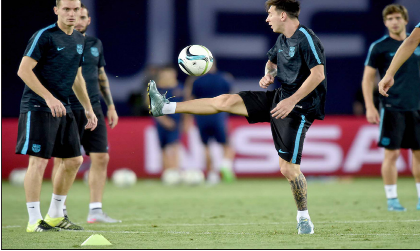
ميسي يتوسط تدريبات برشلونة قبل المباراة

مدير - د ب أ: عاد كريستيانو رونالدو وسيرخيو راموس وفايغو كوينتراو لتدريبات ريال مدريد بعد تعافيه من إصابته التي لحقت بهم مؤخرا. وعانى رونالدو الأسبوع الماضي من مشكلات عضلية حرمته من المشاركة في المباريات الثلاث الودية الأخيرة لفريقه خلال فترة الإعداد للموسم الجديد. وشارك كوينتراو بالنادي في فترة الإعداد للنادي الملكي بسبب معاناته من الإصابة أيضا، فيما غاب راموس عن مباراة الفريق التجريبية أمام فاليريغا الفرويبي بسبب إصابته بكدمة. وغاب عن تدريبات ريال مدريد أمس كل من بيبي وكريم بنزيمة ورافاييل فاراني بسبب الإصابة. ويلعب النادي الملكي يوم الثلاثاء المقبل آخر مبارياته الودية في فترة الإعداد أمام غالاتة سسراي التركي في كاس سانتياغو بيرنابيو، على أن يستهل مشواره في الموسم الجديد للدوري الإسباني في 23 آب/ أغسطس الجاري أمام سيورتنغ خيخون.