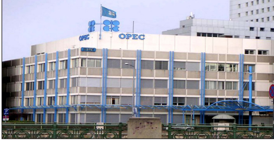
المقر الرئيسي لأوبك

الإمدادات من الدول الأعضاء في «أوبك»، ونقل التقرير عن مصادر ثانوية أن إنتاج المنظمة بلغ 31.5 مليون برميل يوميا في يوليو، بزيادة 1.5 مليون برميل عن السقف المحدد عند 30 مليون برميل يوميا. وأبقت «أوبك» على توقعاتها لمتوسط الطلب العالمي على نفطها عند 29.23 مليون برميل يوميا في 2015 دون تغيير عن الشهر الماضي، في حين أشار التقرير لتكوين فائض في السوق قدره 2.28 مليون برميل، إذا استمرت في الضخ بنفس المعدل المسجل في يوليو. ولكن السعودية، التي كانت القوة الدافعة وراء رفض «أوبك» خفض إنتاج الخام، أبلغت المنظمة أن إنتاجها نزل 200 ألف برميل يوميا إلى 10.36 مليون برميل في يوليو، منخفضا من مستوى القياسي في يونيو/حزيران. ولا زالت «أوبك» تتوقع تباطؤا كبيرا لنمو الإمدادات من خارج المنظمة العام المقبل. وتمسكت بوجهة نظرها بأن نمو الطلب سوف يبدد الفائض في السوق. ونكرت المنظمة «ينبغي أن يستمر التحسن في الطلب على النفط الخام في الأشهر المقبلة، ومن ثم ينخفض تدريجيا الخلل في موازين العرض والطلب في سوق النفط».