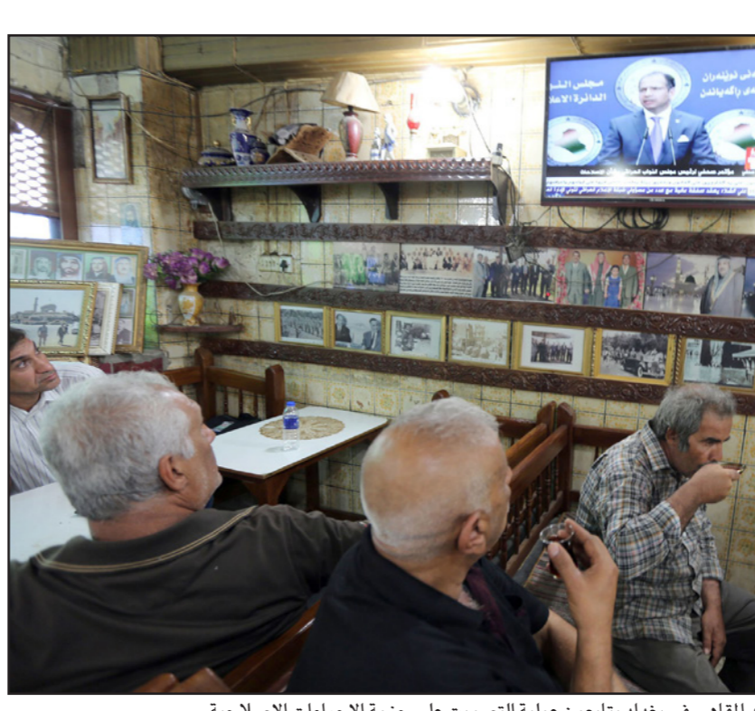
عراقيون في احد المقاهي في بغداد يتابعون عملية التصويت على حزمة الإجراءات الإصلاحية

كما أقرت إصلاحات البرلمان حالة قضايا الفساد الخاصة بالمسؤولين المستوفية للشروط، إلى القضاء ومطالبتهم بإعادة الأموال التي أخذوها إلى الدولة، وإلزام النواب الذين يتهمون المسؤولية بتقديم ما لديهم من وثائق إلى الجهات المعنية. وقد صوتت المجلس الوطني بالإجماع على الحزمة الأولى من الإصلاحات الحكومية والنيابية، التي أكد رئيس مجلس النواب الجبوري على أن حزمة أخرى من الإصلاحات ستأتي لاحقا. كما حدد تاريخ الـ 25 من آب/أغسطس الحالي موعد لاستجواب وزير الكهرباء قاسم الفهداوي، وذكرت مصادر قريبة من مجلس النواب لـ«القدس العربي» أن رئيس المجلس سليم الجبوري سيقب جلسة المجلس، بعد اجتماع مع رؤساء الكتل السياسية في البرلمان مناقشة الموقف تجاه القرارات الإصلاحية وضرورة دعمها لتلبية مطالب المتظاهرين والرجعية الدينية بالتحرك للقضاء على الفساد ومحاسبة الفاسدين وتحسين أداء الحكومة في مجال تقديم الخدمات الأساسية للمواطنين. وتوقع المصادر السياسية أن تشمل القرارات المتوقعة، إصدار تعليمات وقرارات من شأنها القضاء على المحاصصة، وتنفيذ الإصلاح الإداري والمالي والسياسي. ومن جهة أخرى، أبدت بعض القوى اعتراضات على فقرات في إصلاحات العبادي، فقد تحدثت النائبية الكردية آلاء الطالباني عن اعتراضها على فقرة إلغاء مناصب نواب رئيس الجمهورية، حيث أشارت في لقاء متلفز إلى أن الرئيس فؤاد معصوم أرسل رسالة إلى مجلس النواب طالبا إرسال ما يثبت علاقة نوابه بعلاقات الفساد التي خرج الناس من أجلها، وتأكيد على أن أحدا لم يطلب رأيه في هذا الموضوع. وذكرت الطالباني أن مطالب المتظاهرين ذات صفة اقتصادية وتتركز على محاسبة الفاسدين، وعلاقة نواب الرئيس بهذا الملف، كما ذكرت