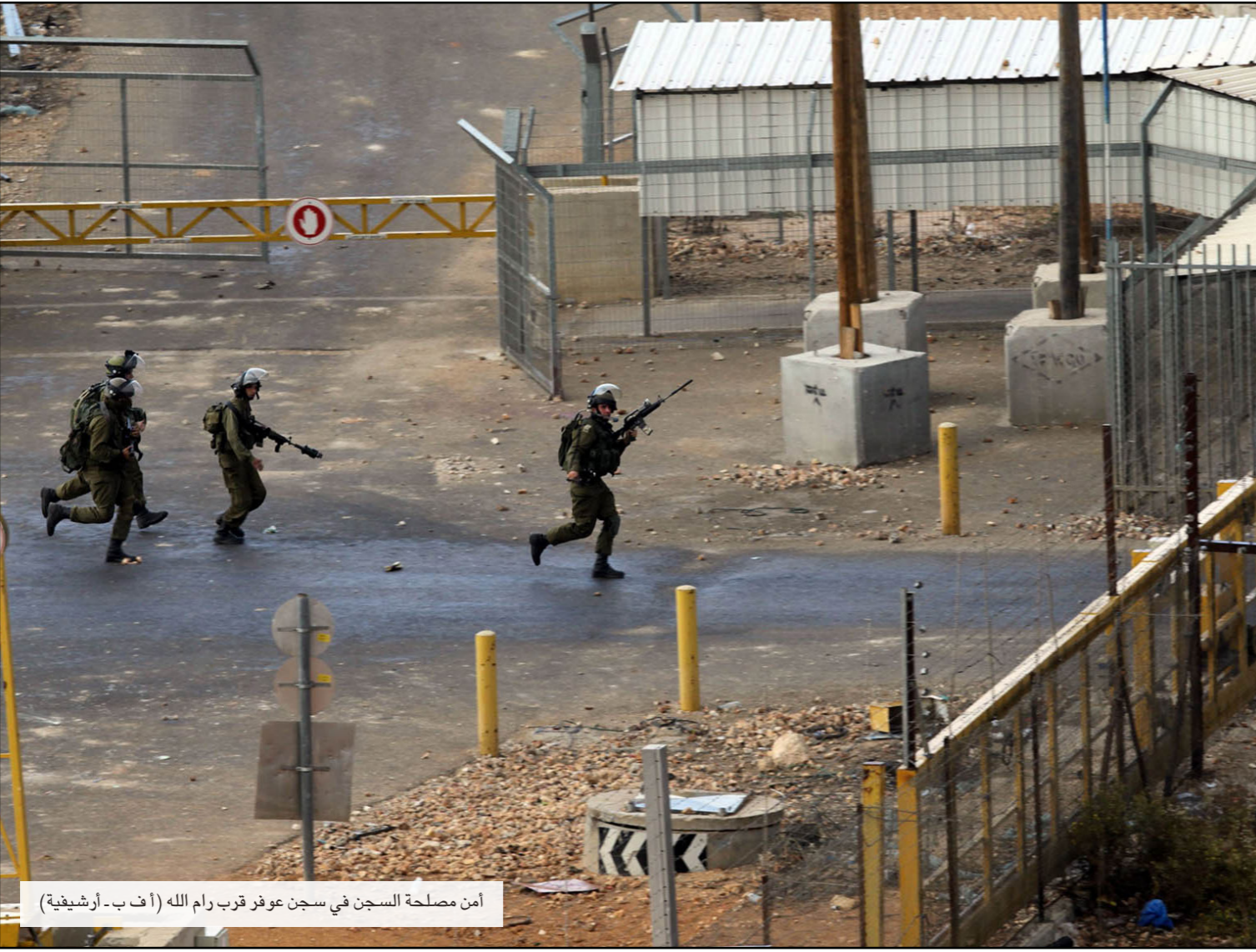
أمن مصالحة السجن في سجن عوفر قرب رام الله (أ ف ب - أرشيفية)