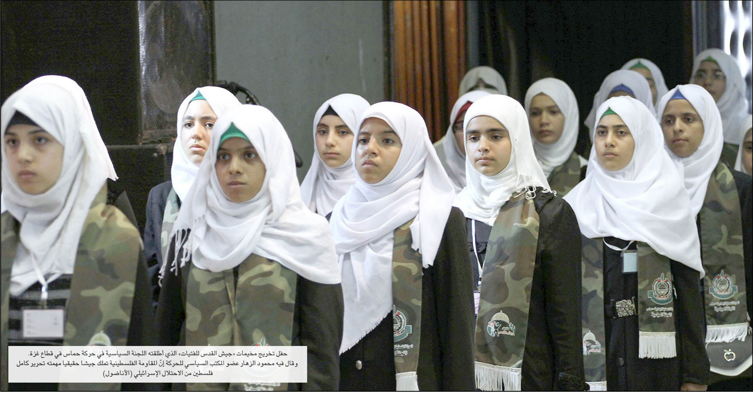
حفلة تخريج مخيمات «جيش القدس للفتيات» الذي أطلته اللجنة السياسية في حركة حماس في قطاع غزة. وقال فيه محمود الزهار عضو المكتب السياسي للحركة إن المقاومة الفلسطينية تملك جيشاً حقيقياً مهمته تحرير كامل فلسطين من الاحتلال الإسرائيلي (الأناضول)

رضعا، وأول من أسس وأصدرت وكالة غوث وتشغيل اللاجئين «الأونروا» بينما أكدت فيه ارتفاع نسبة الوفيات بين أطفال القطاع، للمرة الأولى منذ خمسين عاماً، وأرجعت السبب للحصار الإسرائيلي المفروض منذ ثماني سنوات. ودقت الأمم المتحدة ومنظمات غير حكومية «ناقوس الخطر» بشأن وضع الأطفال في قطاع غزة، الذي يشكل عدداً من 14 عاماً فوق 45 في المئة من سكانه.