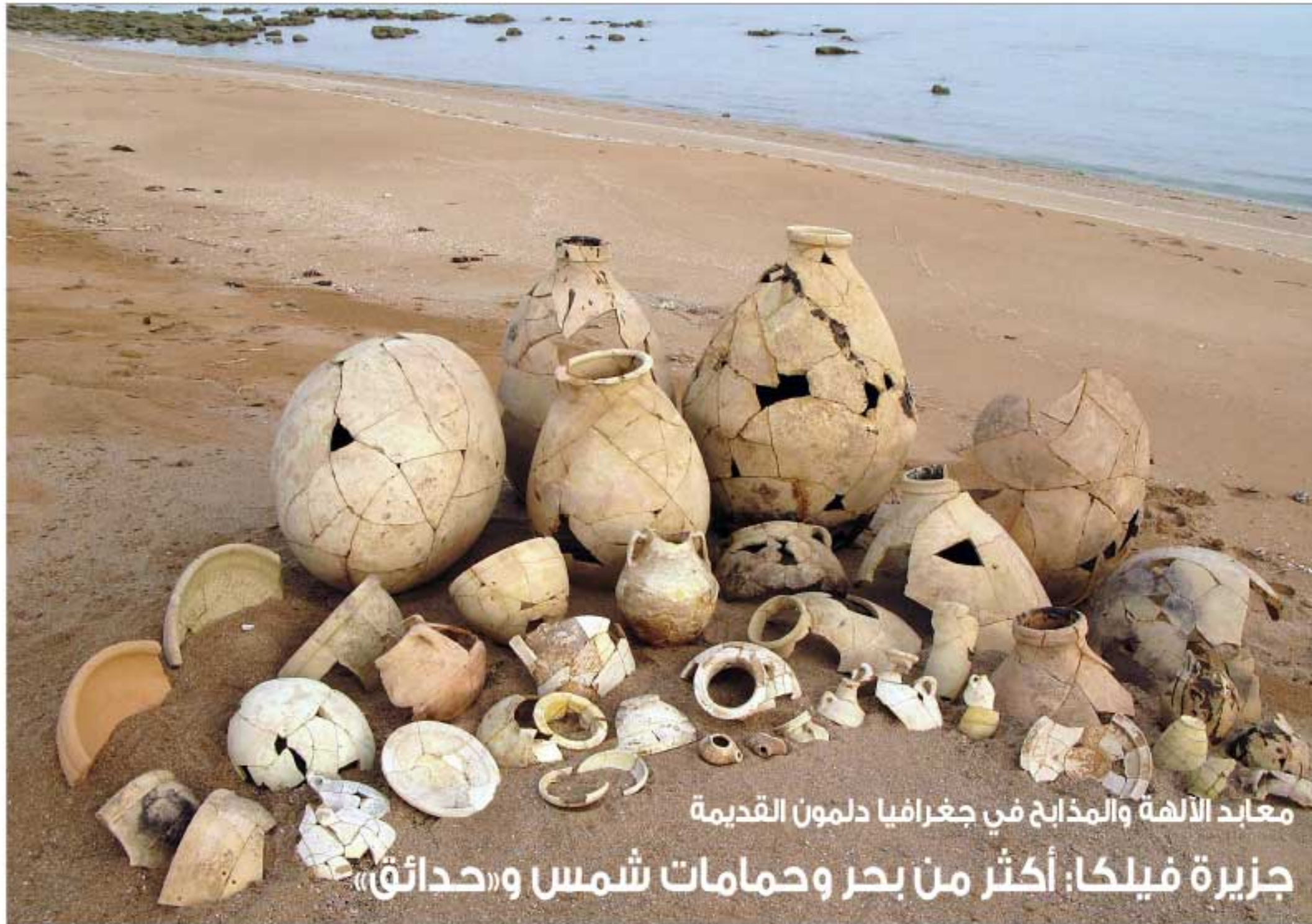
معابد الآلهة والمذابح في جغرافيا دلمون القديمة جزيرة فيليكا: أكثر من بحر وحمامات شمس و«حدائق»